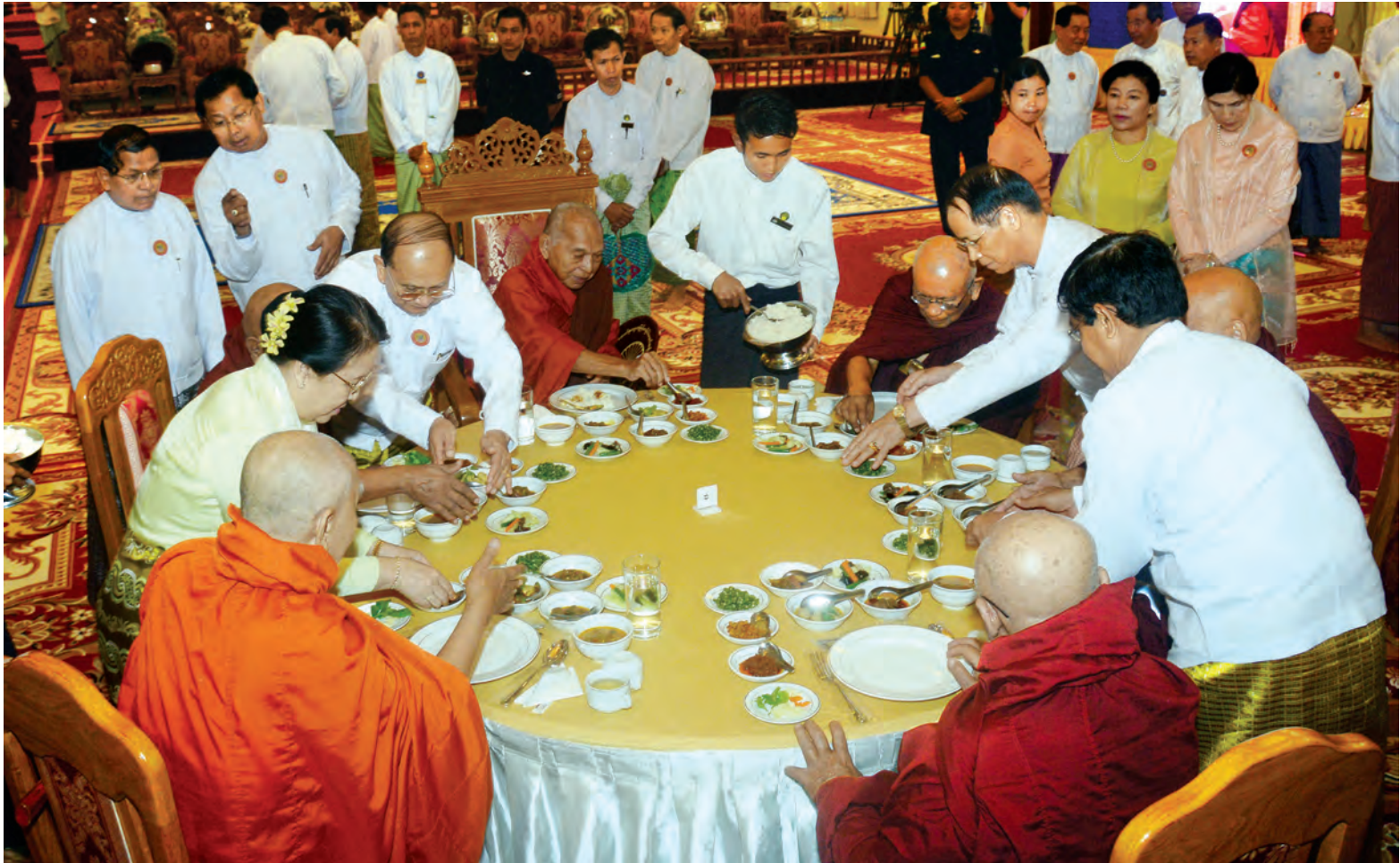
နိုင်ငံတော်သမ္မတ ဦးသိန်းစိန်နှင့် ဇနီး ဒေါ်ခင်ခင်ဝင်းနှင့် ဒုတိယသမ္မတ ဒေါက်တာစိုင်းမောက်ခမ်းနှင့် ဦးညွှန်ထွန်းတို့ ဆရာတော်၊ သံဃာတော်များအား နေ့ဆွမ်းဆက်ကပ်စဉ်။

ထို့နောက် ဒုတိယသမ္မတ ဒေါက်တာစိုင်းမောက်ခမ်းနှင့် ဇနီး ဒေါ်နန်းရွှေမူန့်၊ ဦးညွှန်ထွန်းနှင့် ဇနီး ဒေါ်ခင်အေးမြင့်၊ အမျိုးသား