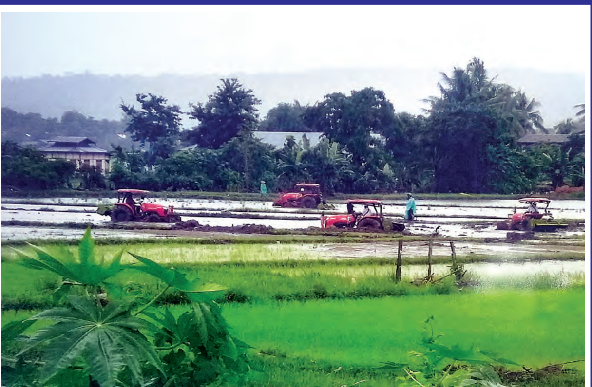
စစ်ကိုင်းတိုင်းဒေသကြီး ကောလင်းမြို့နယ်၌ မိုးသည်းထန်မှုကြောင့် တောင်သူ ၇၈၀၉ ဦး၏ စိုက်ပျိုးပြီး စပါးစိုက်ခင်း ၃၄၆၁၇ ဧက ရေနစ်မြုပ် ခဲ့ရာ ရေကြီးနစ်မြုပ်သောတောင်သူများအား နိုင်ငံတော်အစိုးရက လယ်ထွန်စက်များနှင့် အခမဲ့ထွန်ယက်ပေးနေမှုကို ဇူလိုင် ၂၆ ရက်က တွေ့ရစဉ်။ (သတင်း၊ စာမျက်နှာ-၁၀) (ဓာတ်ပုံ-မြို့နယ် ပြန်/ဆက်)

အလားတူ မော်လူး-နန့်စီးအောင်ဘူတာကြားရှိ တံတားအမှတ် (၅၀၄) ရေတိုက်စားမှု ဖြစ်ပွားရာနေရာသို့ မြန်မာ့မီးရထားတိုင်းအမှတ်(၁) မှ အင်ဂျင်နီယာမှူး (မြို့ပြ)ဦးစီးပြီး လုပ်သား ၃၂ ဦးဖြင့် ဇူလိုင် ၂၅ ရက် နံနက် ၇ နာရီခွဲမှစ၍ တိမ်းစောင်းနေသော ဂါဒါပေါင်များတည့်မတ်ခြင်း၊ ရေကျော်နေရာများပြုပြင်ခြင်း၊ မိုင်တိုင်အမှတ် (၆၁၁/ ၁၅-၁၆) ရေကျော် နေရာများသို့ ပင်ဘော၌ရှိသော (၆x၉) လက်မရှိသော ကျောက်ကြီးများ၊ (၁x၂)လက်မရှိ လမ်းခင်းကျောက်များ၊ စာမျက်နှာ ၆ ကော်လံ ၆ □