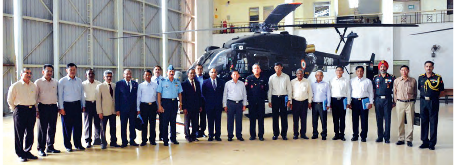
တပ်မတော်ကာကွယ်ရေးဦးစီးချုပ် ပိုလ်ချုပ်မှူးကြီးမင်းအောင်လှိုင် ဦးဆောင်သော ချစ်ကြည်ရေးကိုယ်စားလှယ်အဖွဲ့နှင့် အိန္ဒိယတပ်မတော်(လေ)မှ တာဝန်ရှိသူများ HAWK Final Assembly ၌ စုပေါင်းမှတ်တမ်းတင်ဓာတ်ပုံရိုက်စဉ်။ (မြဝတီ)

ညပိုင်းတွင် တပ်မတော်ကာကွယ် ရေး ဦးစီးချုပ် ဦးဆောင်သော မြန်မာ့ တပ်မတော်ချစ်ကြည်ရေး ကိုယ်စား လှယ်အဖွဲ့သည် Goa Naval Area ရှိ Venue Officer Mess တွင် ကျင်းပသည့် Fieet Officer, Goa Commanding Area Rear Admiral Ravneet Sirgh တည်းခင်းဧည့်ခံသည့် ဂုဏ်ပြုညစာ စားပွဲသို့တက်ရောက်ကြသည်။ ဝိအာမြို့သည် အိန္ဒိယနိုင်ငံ အနောက်ဘက်ကမ်းခြေ၌ တည်ရှိ ပြီး လူဦးရေ တစ်သန်းခန့်နေထိုင် သည်။ သီရိလင်္ကာ၊ သီဟိုဠ်စေ့နှင့် ဟင်းခတ် အမွှေးအကြိုင်များ အဓိက ထွက်ရှိပြီး ဝိအာမြို့ရှိကမ်းခြေများ၊ ဘုရားဝတ်ပြုဆောင်ထားသည့် နေရာ များသို့ နိုင်ငံတကာနှင့် ပြည်တွင်းခရီး သွားဧည့်သည် အများအပြားလာ ရောက် လည်ပတ်လေ့ရှိကြောင်း သိရှိရသည်။ (မြဝတီ)