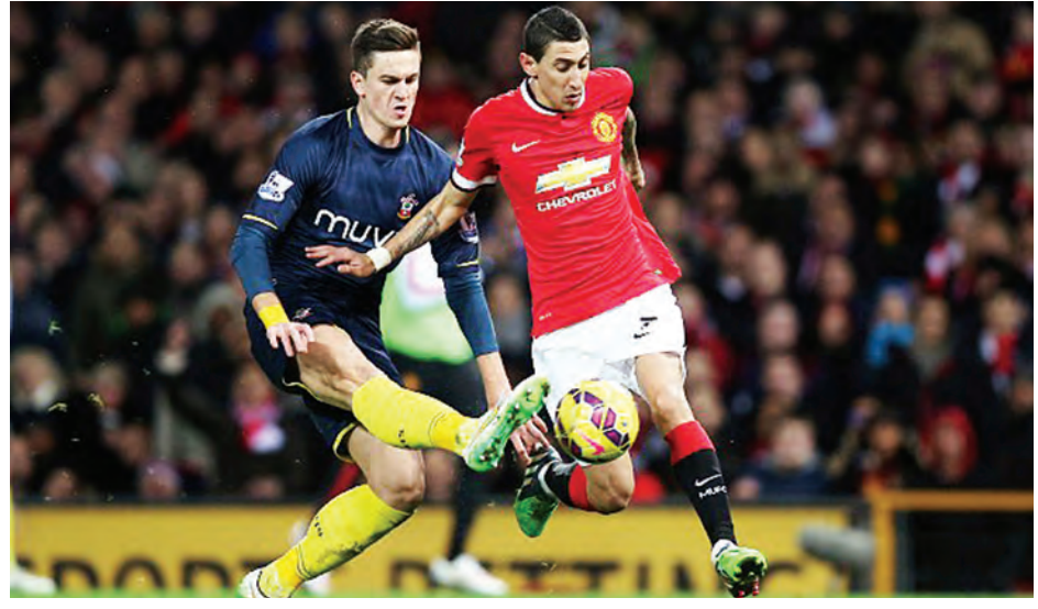
ပြီးခဲ့တဲ့ရာသီက ခြေစွမ်းမပြနိုင် ထုတ်တော့မှာဖြစ်ပါတယ်။ ပြင်သစ် အိန်ဂျယ်ဒီမာရီယာကို ပေါင် ၄၆ ခွဲတဲ့ဒီမာရီယာကို မန်ယူက ရောင်း ထိပ်တန်းကလပ် ပီအက်စ်ဂျီက ဒသမ ၅ သန်းနဲ့ ဝယ်ယူဖို့ သေချာ

သွားပြီလို့ မန်ယူနည်းပြဗန်ဟားလ်က အတည်ပြု ပြောကြားလိုက်ပါတယ်။ မန်ယူက ဒီမာရီယာကို ပြီးခဲ့တဲ့ နှစ်က ပေါင် ၅၉ ဒသမ ၇ သန်းနဲ့ ဝယ်ယူခဲ့တာပါ။ ယခုသီတင်းပတ် အတွင်းမှာ အပြီးသတ်စာချုပ်ချုပ်ဆို နိုင်ဖို့ မျှော်လင့်ထားတယ်လို့ဆိုပါ တယ်။ ပြင်သစ်ချန်ပီယံပီအက်စ်ဂျီ ကတော့ ပေါင် ၄၆ ဒသမ ၅ သန်းနဲ့ပဲ ကမ်းလှမ်းခဲ့ပါတယ်။ သို့ပေမယ့် ညှိနှိုင်းမှုတွေ ပြုလုပ်နေဆဲပါ။ ပီအက်စ်ဂျီကိုပြောင်းဖို့တော့ သေချာ နေပါပြီ။ ဒီမာရီယာကိုယ်တိုင်က ပီအက်စ်ဂျီနဲ့ လောရင့်ဘလန်တို့နဲ့ အတူ အလုပ်လုပ်ချင်တယ်လို့ ထုတ်ဖော်ပြောကြားထားတာလည်း ရှိပါတယ်။ ဒီမာရီယာဟာ မန်ယူနဲ့ ဘာစီလိုနာတို့ရဲ့ ချစ်ကြည်ရေးပွဲမှာ လည်း ပါဝင်ကစားခဲ့ခြင်း မရှိပါဘူး။ ဒီမာရီယာကို ယခုသီတင်းပတ်အတွင်း မှာ အပြီးသတ်စာချုပ်ချုပ်ဆိုနိုင် လိမ့်မယ်လို့ ချီကာဂိုမြို့ရောက် ပီအက်စ်ဂျီနည်းပြ လောရင့်ဘလန်က ဆိုပါတယ်။