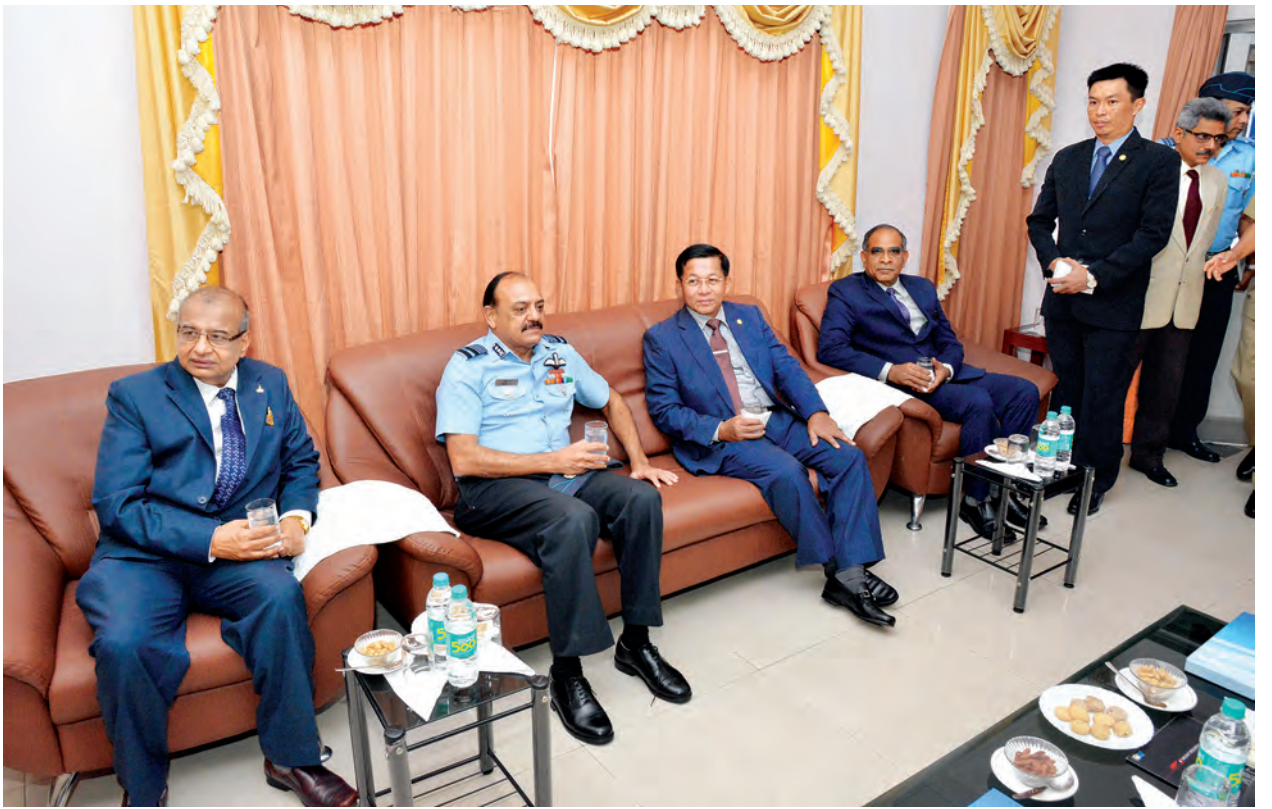
တပ်မတော်ကာကွယ်ရေးဦးစီးချုပ် ပိုလ်ချုပ်မှူးကြီးမင်းအောင်လှိုင် အိန္ဒိယနိုင်ငံ ဝိအာမြို့သို့ ရောက်ရှိရာ ကြိုဆိုကြသူများနှင့်အတူ တွေ့ရစဉ်။ (မြဝတီ)