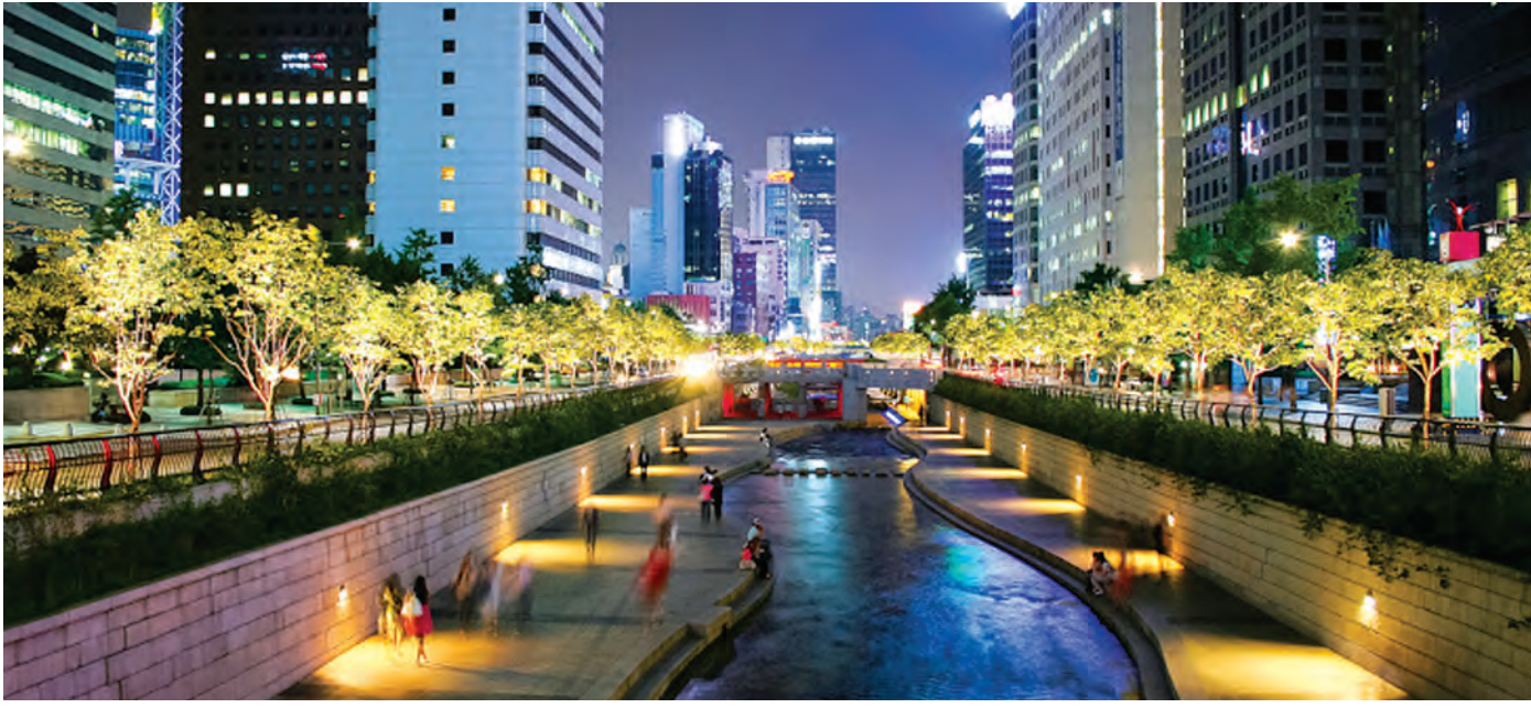
အံ့ဩဖွယ်ရာ တိုးတက်မှုများနှင့် ယနေ့ခေတ်ဆိုးလ်မြို့လယ်တစ်နေရာ။

ကျွန်တော်ဟာ တစ်လောက တောင်ကိုရီးယားနိုင်ငံဆိုးလ်မြို့ကို ရောက်ခဲ့ပါတယ်။ နိုင်ငံတော်က စေလွှတ်တာမို့ ပထမအကြိမ် အစိမ်းရောင်နိုင်ငံကူးလက်မှတ်ကို ပြန်လည်ကိုင်ခွင့်ရခဲ့ပါတယ်။ တစ်ချိန်ကတော့ နိုင်ငံတာဝန်ယူနေတာမို့ ခရီးထွက်တဲ့အခါ အစိမ်းရောင် ကိုင်ခွင့်ရခဲ့ပါတယ်။ နောက်တော့ အနီရောင်ကိုပဲ ကိုင်ဆောင်ပြီးသွားခဲ့ပါတယ်။