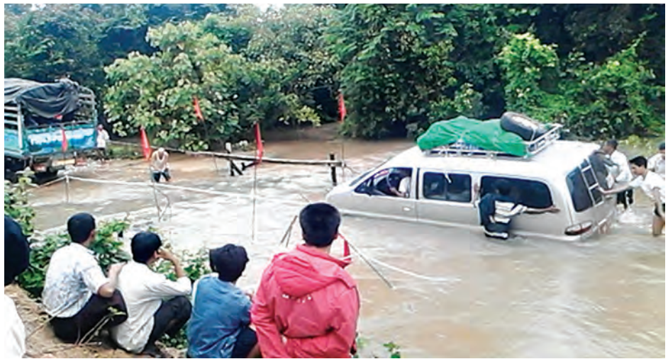
ကချင်ပြည်နယ် မိုးညှင်းမြို့နယ်တွင် ၁၀ ရက်ကျော် မိုးရွာသွန်းမှုအားကောင်းခြင်းကြောင့် ဇူလိုင် ၂၅ ရက်က မိုးညှင်းမြို့တောင်ဘက်ကားလမ်း ဆယ်မိုင်ရွာသစ်ကျေးရွာနှင့် မော်ဟန်ကျေးရွာအကြား နန်းပူးချောင်းရေကြီးရေလျှံခြင်းမလျော့သေးသဖြင့် မန္တလေး-မြစ်ကြီးနား ကားယာဉ်တန်းများတစ်ဖက်စီ ရပ်နားစောင့်ဆိုင်းနေရပြီး တစ်စီးချင်း ခက်ခက်ခဲခဲဆွဲယူဖြတ်သန်းစဉ်။ (ဝေဇာ)