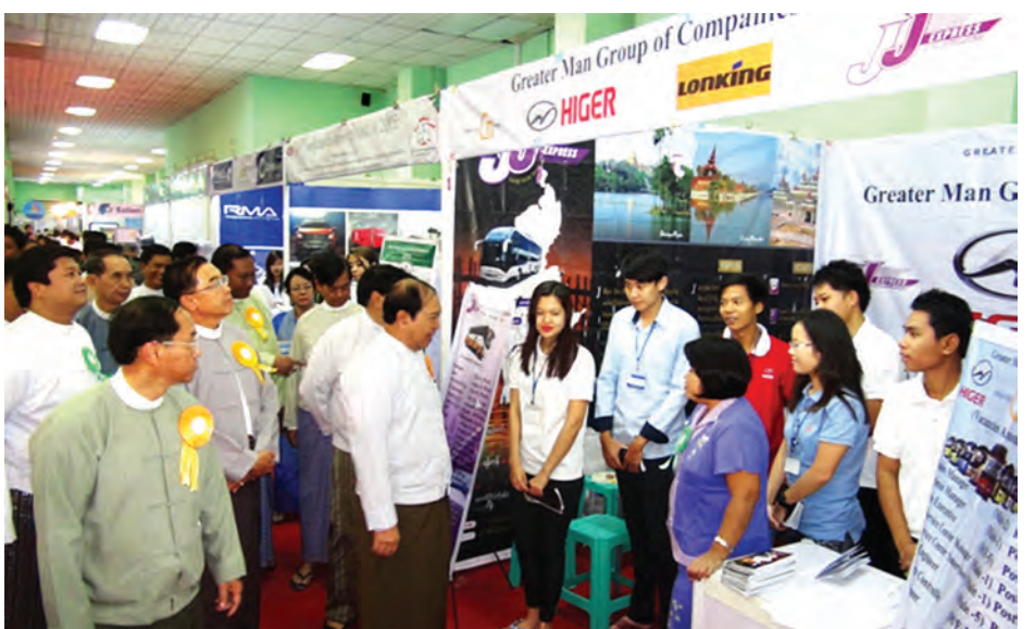
အလုပ်သမား၊ အလုပ်အကိုင်နှင့် လူမှုဖူလုံရေးဝန်ကြီးဌာန ပြည်ထောင်စုဝန်ကြီး ဦးအေးမြင့် ရန်ကုန်မြို့ တပ်မတော်ခန်းမ၌ကျင်းပသည့် သတ္တမအကြိမ်မြောက် မြန်မာ့အလုပ်အကိုင်ပြပွဲ၌ ခင်းကျင်းပြသထားသော ပြခန်းများအား ကြည့်ရှုစဉ်။ (သတင်းစဉ်)

လုပ်ငန်းခွင်များတွင် နေရာချထား ပေးနိုင်ရေး စည်းကမ်းကောင်းမွန်ပြီး စွမ်းဆောင်ရည် ထက်မြက်သည့် ကျွမ်းကျင်လုပ်သားများ စဉ်ဆက် မပြတ် ပေါ်ထွန်းနိုင်ရေးနှင့် ခေတ်မီ နိုင်ငံတော်တည်ဆောက်ရေးအတွက် အခြေခံလိုအပ်ချက်ဖြစ်သည့် အရည် အချင်းရှိသည့် လူ့စွမ်းအားအရင်း အမြစ်များ ဖွံ့ဖြိုးတိုးတက်ခိုင်မာ ရေးတို့သည် နိုင်ငံအတွက်အဓိကထား ဆောင်ရွက်ရမည့် ကိစ္စရပ်များဖြစ်ပါ ကြောင်း ပြောကြားသည်။ အဆိုပါ အလုပ်အကိုင်အခွင့် အလမ်းပြပွဲကို ဇူလိုင် ၂၄ ရက်မှ ၂၆ ရက်အထိ ကျင်းပခဲ့ပြီး ပြည်တွင်း ပြည်ပကမ္ဘာ့ ၆၂ ခုမှ ပြခန်းပေါင်း ၁၀၀ ပြထားပြီး အလုပ် လာရောက် လျှောက်ထားသူ ၁၀၀၀ ခန့်ရှိ ကြောင်း သတင်းရရှိသည်။ (သတင်းစဉ်)