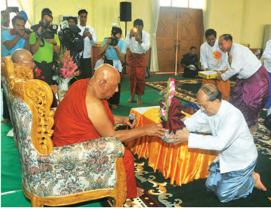
နိုင်ငံတော်သမ္မတ ဦးသိန်းစိန် သီတဂူဆရာတော် ဒေါက်တာ အရှင်ဉာဏိဿရအား ဝါဆိုသင်္ကန်းဆက်ကပ် လှူဒါန်းစဉ်။

ယင်းနောက် တိုင်းဒေသကြီး ဝန်ကြီးချုပ်က စစ်ကိုင်းမြို့တည် နန်းတည် နှစ်(၇၀၀)ပြည့် အထိမ်း အမှတ်ပွဲတော်ကြီး ကျင်းပပြုလုပ် ရခြင်းနှင့်စပ်လျဉ်း၍ ရှင်းလင်း ပြောကြားသည်။ ထို့နောက် ဇေယျပူရဝင်း အခင်းအကျင်းဖြင့် ဝင်းခင်းကြသည်။ ဆက်လက်၍ နိုင်ငံတော်သမ္မတ နှင့် အဖွဲ့အား ကျောင်းသား ကျောင်းသူများက ဘင်ခရာစွမ်းရည် အတိုးအမှတ်များဖြင့် လည်းကောင်း၊ မြန်မာနိုင်ငံ ခြင်းလုံးအဖွဲ့ချုပ်မှ အားကစားသမားများက ခြင်းလုံး စွမ်းရည်ပြကွက်များဖြင့် လည်း ကောင်း၊ အားကစားသိပ္ပံမှ ကျောင်း သား ကျောင်းသူများက အားကစား နည်းများဖြင့် လည်းကောင်း ဖျော်ဖြေ ကြရာ နိုင်ငံတော်သမ္မတက ဂုဏ်ပြု ချီးမြှင့်ငွေများကို ပေးအပ်သည်။ ဇေယျဘူမိဟူသည့် စစ်ကိုင်း မြို့တော်ကြီးကို ပင်းယတစ်စီးရှင်၏ သားတော် အသင်္ခယာစောယွမ်းက