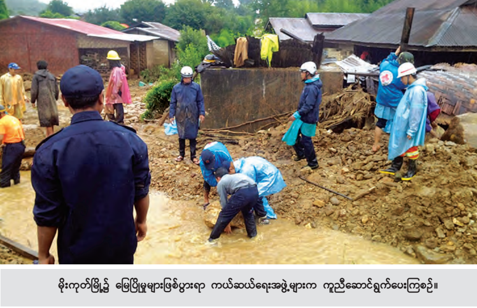
မိုးကုတ်မြို့ မြေပြိုမှုဖြစ်ပွားရာ ကယ်ဆယ်ရေးအဖွဲ့များက ကူညီဆောင်ရွက်ပေးကြစဉ်။

ပိန်းပြစ်(၅)မိုင်နှင့် (၆)မိုင်ကျေးရွာ ကြားတွင် တောင်ပြိုကျပြီး မိုးကုတ်- မန္တလေး ကားလမ်းပိတ်ဆို့မှုဖြစ်ပွား ခဲ့ကာ ချောင်းကြီး-ကြက်နှစ်ဖ ကျေးရွာချင်းဆက်လမ်းပေါ်ရှိ တံတား သုံးခု ရေတိုက်စားမှုကြောင့် မျောပါ ပျက်စီးခဲ့သည်။ အဆိုပါ ပျက်စီးဆုံးရှုံးမှုဖြစ်ပွား သည့်နေရာများသို့ သက်ဆိုင်ရာ တာဝန်ရှိသူများနှင့် ကယ်ဆယ်ရေး ပူးပေါင်းအဖွဲ့က ကွင်းဆင်းစစ်ဆေး ကြည့်ရှုပြီး လိုအပ်သည့် ကယ်ဆယ် ရေးလုပ်ငန်းများ စီစဉ်ဆောင်ရွက် ပေးလျက်ရှိကြောင်း သိရသည်။ ကိုရဲ