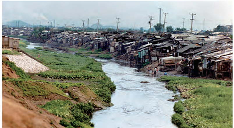
၁၉၇၀ ပြည့်လွန်နှစ်များအတွင်းက ဆိုးလ်မြို့၏ကျူးကျော်ရပ်ကွက်တစ်ခု။

တောင်ကိုရီးယားနိုင်ငံဟာ ဖွံ့ဖြိုးမှု စီးပွားရေးပညာ ရှုထောင့်က သုံးသပ်ရင် အလွန်ထူးခြားတဲ့ နိုင်ငံတစ်နိုင်ငံ ဖြစ်ပါတယ်။ အမှန်စင်စစ် တစ်ကမ္ဘာလုံးမှာ သူတို့တစ်နိုင်ငံတည်း ရှိတယ်လို့ပြောလို့ရပါတယ်။