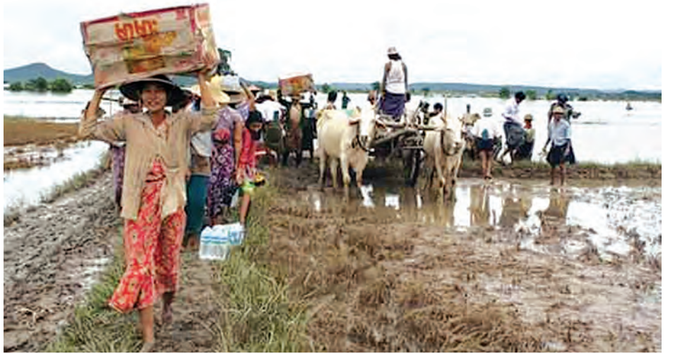
ကောလင်းမြို့ ရေဘေးသင့်ပြည်သူများအတွက် ထောက်ပံ့ပစ္စည်းများ သယ်ယူပို့ဆောင်ပေးနေစဉ်။