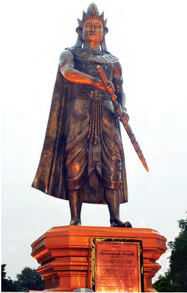
နိုင်ငံတော်သမ္မတ ဦးသိန်းစိန် အသင်္ခယာစောယွမ်းမင်း ကြေးသွန်းရုပ်တုကို စက်ခလုတ်နှိပ်ဖွင့်လှစ်ပေးစဉ်။

တော်မူသည်။ ထို့နောက် သီတဂူဆရာတော်၊ နိုင်ငံတော်သမ္မတ၊ ပြည်ထောင်စု ဝန်ကြီးများ၊ တိုင်းဒေသကြီး ဝန်ကြီး ချုပ်နှင့် တာဝန်ရှိသူများက အသင်္ခယာ