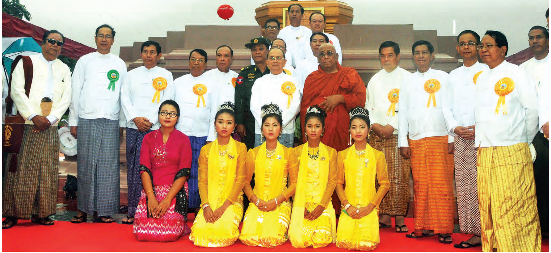
သီတဂူဆရာတော်၊ နိုင်ငံတော်သမ္မတ ဦးသိန်းစိန်၊ ပြည်ထောင်စုဝန်ကြီးများ၊ တိုင်းဒေသကြီးဝန်ကြီးချုပ်များနှင့်တာဝန်ရှိသူများ အသင်္ခယာစောယွမ်းမင်း ကြေးသွန်းရုပ်တုရှေ့ မှတ်တမ်းတင်ဓာတ်ပုံရိုက်စဉ်။ (ပြန်/ဆက်)

စစ်ကိုင်းမြို့သည် ရှေးဟောင်း ယဉ်ကျေးမှုအမွေအနှစ်များ တည်ရှိရာ ဘာသာ၊ သာသနာထွန်းကားစည်ပင် သည့် မြို့ကြီးအဖြစ် မြန်မာတွင် သာမက ကမ္ဘာကပင် သိရှိထင်ရှား သည့် မြို့တစ်မြို့ဖြစ်