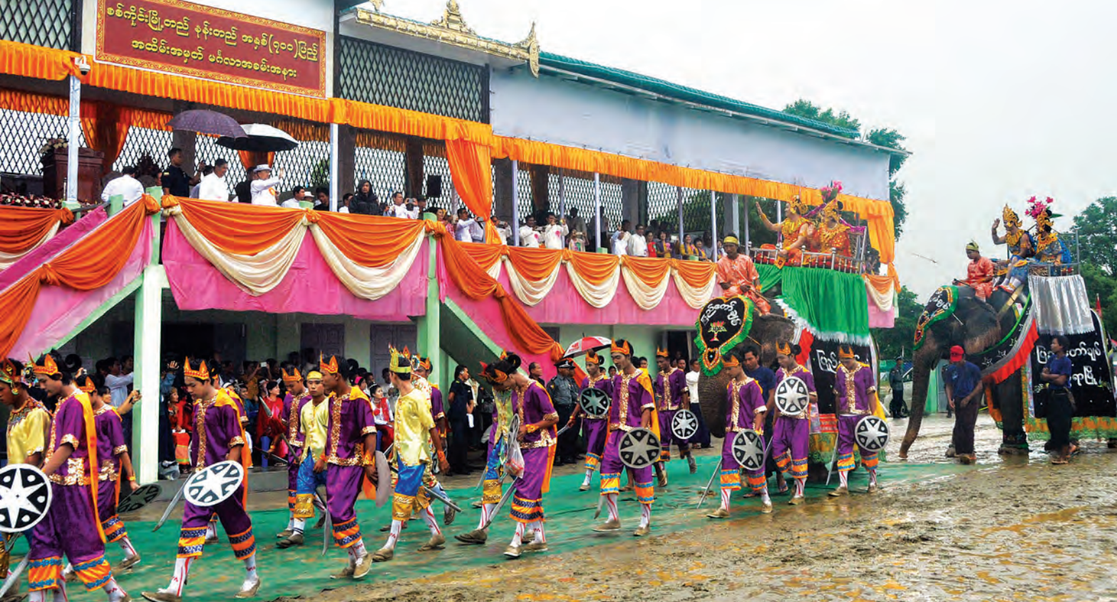
နိုင်ငံတော်သမ္မတ ဦးသိန်းစိန် စစ်ကိုင်းမြို့တည်နန်းတည် နှစ်(၇၀၀)ပြည့် အထိမ်းအမှတ်ပွဲတော်တွင် ဇေယျာပူရ ဝင်းအခင်းအကျင်းဖြင့် ဝင်းခင်းပြသနေမှုကို ကြည့်ရှုအားပေးစဉ်။ (ဓာတ်ပုံ-ပြန်/ဆက်)

ထုတ်ဆောင်ရွက်သည်ကို တွေ့ရသည့် အတွက် အလွန်နှစ်ထောင်းအားရ ဖြစ်မိပါကြောင်း၊ မိမိတို့သွားနေသည့် ပြည်သူဗဟိုပြု ဖွံ့ဖြိုးမှုဆိုသည့် အနှစ်သာရကို အားလုံးမျက်ဝါး ထင်ထင်တွေ့ရှိရသကဲ့သို့ သမိုင်း