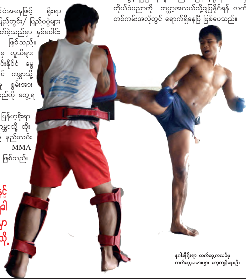
နဂါးနီရိုးရာ လက်တွေ့ကလပ်မှ လက်တွေ့သမားများ လေ့ကျင့်နေစဉ်။