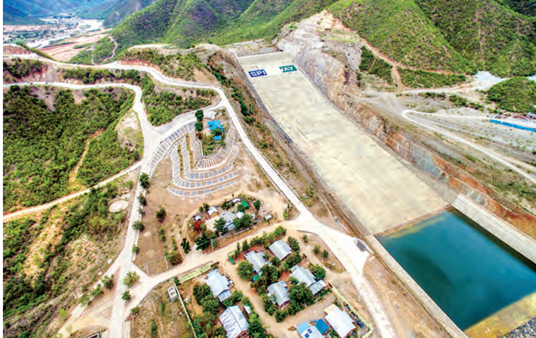
မြို့ကြီးရေလျှောင့်တစ် ဘက်စုံစီမံကိန်း၏ ရေပိုလွှဲတည်ဆောက်ခြင်းလုပ်ငန်း ဆောင်ရွက်ထားရှိမှုကို တွေ့ရစဉ်။ (သတင်း- စာ ၈)