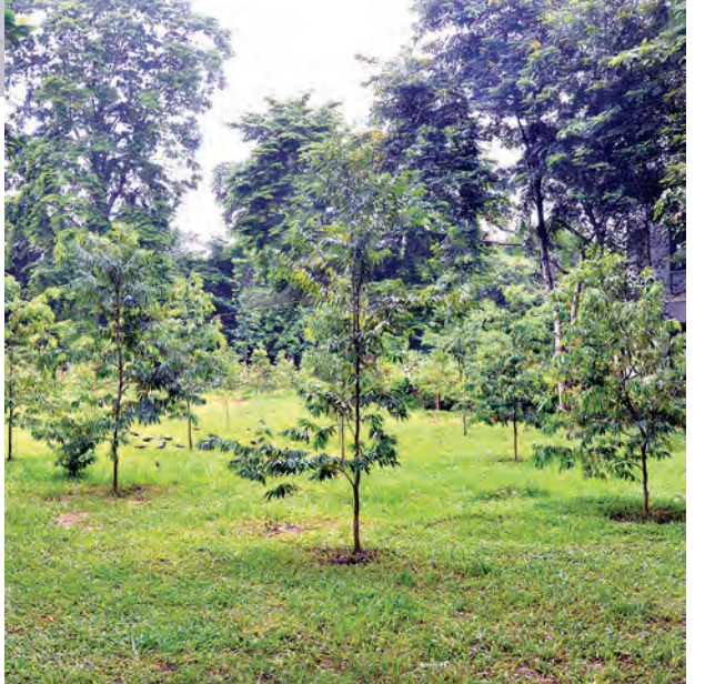
ပြန်လည်စိမ်းစိုလာဦးမည့် ကိုကော်တောကို ပင်ပျိုးများဖြင့် ပျိုးထောင်လျက် ရှိသည်။

ရဖို့က ကျောင်းသားကျောင်းသူတွေ အားလုံးရဲ့ အိပ်မက်တစ်ခုပဲလေ။ ဘာသာရပ်အလိုက် ထူးချွန်သူတွေကိုသာ လက်ခံသင်ကြားပေးနေတာမို့ ကြိုးစားဖို့ အခွင့်အရေးလည်းရှိသလို သမီးတို့အတွက် အဆောင်နေခွင့် ရတာဟာလည်း အဖိုးမဖြတ်နိုင်တဲ့ ဆုလာဘ်တစ်ခုပါ။ သမီးတို့အခု စုပေါင်းပြီး ငါတို့သူငယ်ချင်းဆိုတဲ့ အစီအစဉ်လေးတစ်ခု လုပ်နေပါတယ်။ နှစ်ပတ်တစ်ခါ ပြိုင်ပွဲလုပ်မယ်။ တစ်သောင်းတန် ဧပြေညီကတ်နဲ့ My Friend Campaign တီရှပ်ပေးသွားမယ်။ ဖေ့စ်ဘွတ်စ်မှာ Like အများဆုံးရတဲ့သူက အနိုင်ရမယ်။ သမီးတို့ရဲ့ ရည်ရွယ်ချက်လေးကတော့ မတူကွဲပြားခြားနားသူတွေကြားမှာ မေတ္တာတရားနဲ့ ခင်မင်မှုတွေကို ဂုဏ်ပြုပေးတာ၊ မတူညီခြင်းတွေကနေ ခွန်အား တွေ့ရလာဖို့ ရည်ရွယ်ပြီး လုပ်ဆောင်နေတယ်။ ရန်ကုန်တက္ကသိုလ်မှာ သမီး တို့လို အဖွဲ့လေးတွေ၊ လှုပ်ရှားမှုတွေ၊ အနုပညာအလုပ်တွေ၊ အားကစား သင်တန်းတွေ ပြန်အားပေးလာတာကို အလွန်ကျေနပ်ဂုဏ်ယူမိတယ်” ဟု တတိယနှစ် ဓာတုကုန်ထုတ် ကျောင်းသူလေး မသီရိသူသူက ပြောကြား သည်။