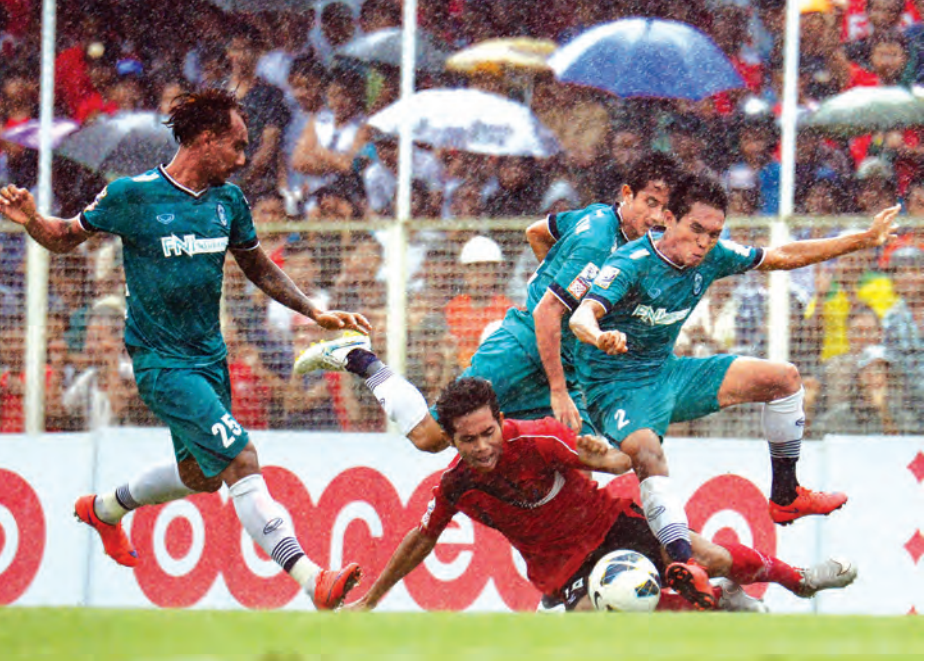
ရော့တီအသင်းနှင့် ရန်ကုန်အသင်းတို့ မိုးထဲလေထဲတွင် အကြိတ်အနယ်ယှဉ်ပြိုင်ကစားစဉ်။

၂၀၁၅ ခုနှစ် MNL အမှတ်ပေးပြိုင်ပွဲ ဒုတိယအကျော့ပွဲစဉ်(၁၃) ပထမနေ့ ပွဲစဉ်များကို ယနေ့ ညနေပိုင်းက ကျောက်တိုင်ကွင်း၌ ယှဉ်ပြိုင်ကစားကြရာ ရော့တီနှင့်ရန်ကုန်တို့ နှစ်ဂိုးစီ သရေကျခဲ့သည်။