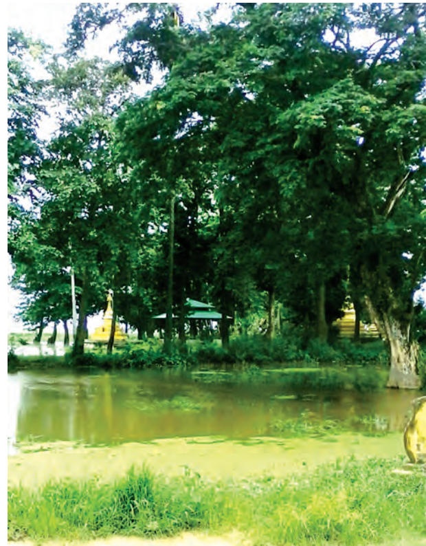
မွမ်းမံထားသဖြင့် သပ္ပာယ်ကြည့်နူးစွာ ဖူးမြော်လေ့လာခွင့်ရရှိနိုင်သည်။

နောက်ထပ်လေ့လာစရာတစ်ခုကား ပန်းခိုင်ရွာအရှေ့ဘက် တစ်မိုင်ခွဲခန့် အကွာတွင် ကုန်းမြင့်ပေါ်၌တည်ထားသော ညောင်ပင်ကျိုးစေတီဖြစ်သည်။ လှေဖြင့်သွားရပြီး ရှေးနှစ်ပေါင်း ၂၀၀ ကျော်က တည်ထားကိုးကွယ်ခဲ့သော ရှေးဟောင်းစေတီတစ်ဆူဖြစ်ရာ ယခင်က ချုံနွယ်ကိုင်းပင်များ ဖုံးလွှမ်းနေခဲ့ သော်လည်း ယခုအခါ ဇရပ်၊ တန်ဆောင်းနှင့် စေတီတော်ကိုပါ မွမ်းမံတည် ဆောက်ခဲ့သဖြင့် သပ္ပာယ်စွာတည်ရှိနေသည်။ ညောင်ပင်ကျိုးစေတီရင်ပြင်မှ ပန်းခိုင်ရွာဝန်းကျင် မြင်ကွင်းကို အပေါ်စီးမှ လေ့လာခွင့်ရရှိစေမည်ဖြစ်သည်။ နေဝင်ချိန်အကျတိုခံစားခွင့် ရရှိပေသည်။ ပန်းခိုင်ရွာ၏အနောက်ဘက် တစ်မိုင်ခွဲခန့်အကွာတွင် ပုညကမာအမည်ရှိ ရှေးဟောင်းစေတီတစ်ဆူတည် ရှိရာ ရှေးနှစ်ပေါင်းများစွာကပင် တည်ထားကိုးကွယ်ခဲ့ပြီးနောက် လူတို့ပြုပြင်