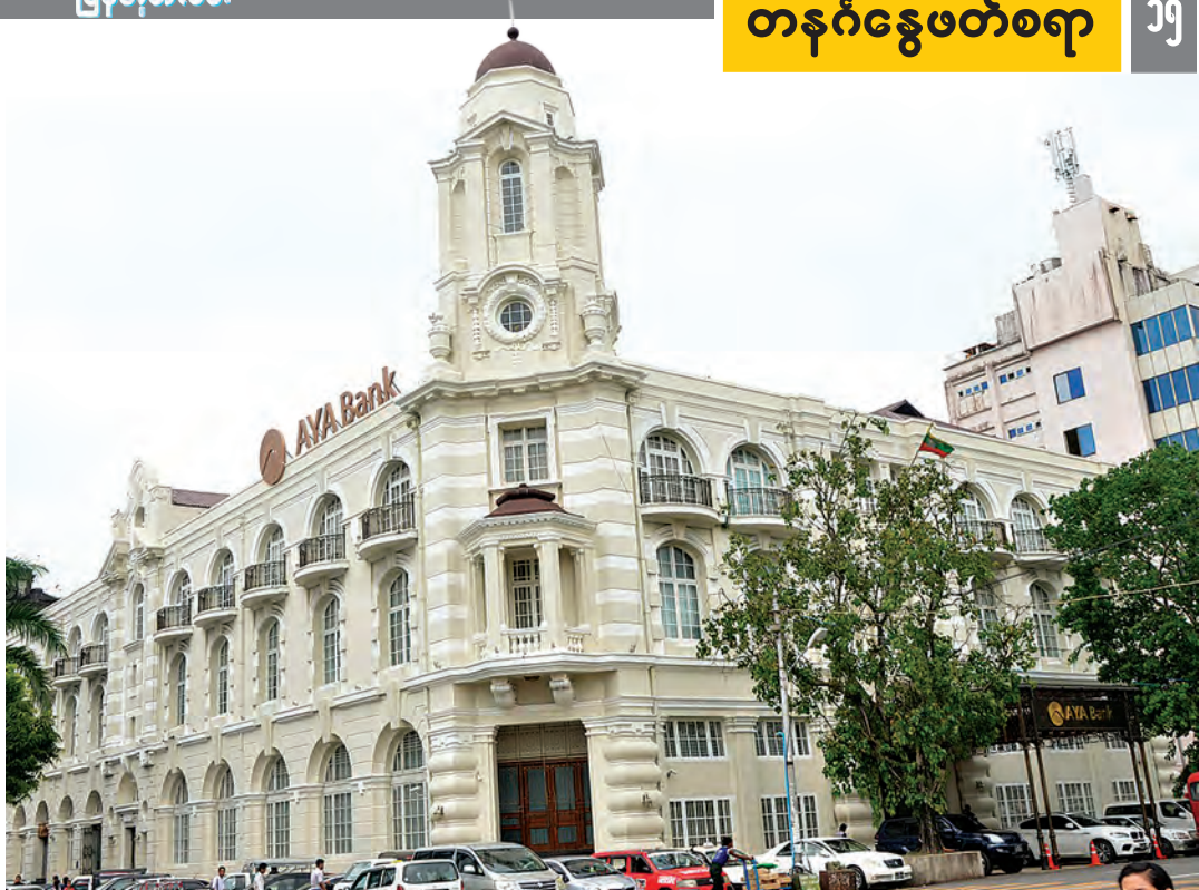
တစ်ခေတ်တစ်ခါက အထင်ကရ ရိုးကုန်တိုက်ကြီးကို ရှေးမူပျက်ပြုပြင်ထိန်းသိမ်းထားသည်။

အဆောက်အအုံကြီး၏ ဒီဇိုင်းကို မွမ်းတိုင်းမြို့မှ နာမည်ကျော် ဗိသုကာပညာရှင်များ စုစည်းထားသော Messrs. Charles S. Steven ကုမ္ပဏီလီမိတက်က ရေးဆွဲခဲ့ပြီး ခုံညွှန်ထုတ်ဝေခြင်း၊ ခေတ်မီလုပ်ခြင်းနှင့် ခိုင်ခံ့သေသပ်ခြင်းတို့ကို အခြေပြုကာ တည်ဆောက်ခဲ့ခြင်းဖြစ်ကြောင်း သိရသည်။