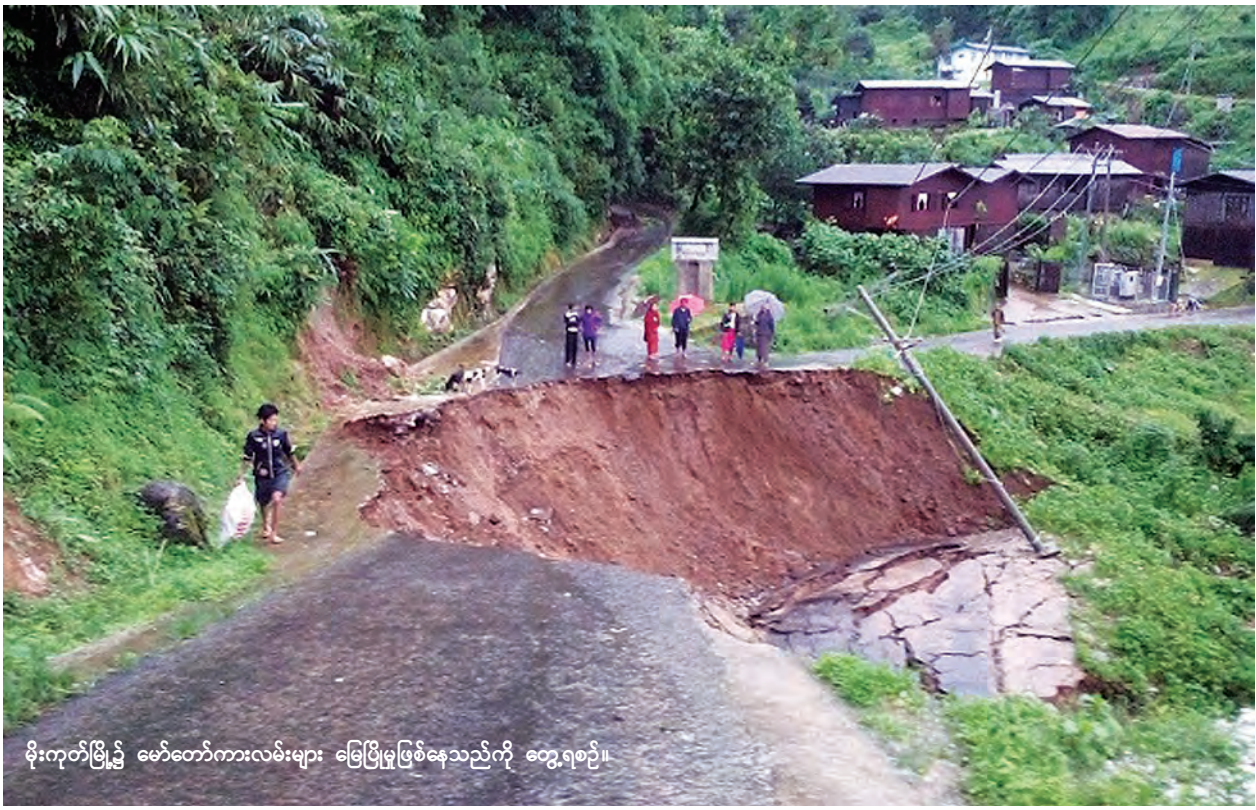
မိုးကုတ်မြို့၌ မော်တော်ကားလမ်းများ မြေပြိုမှုဖြစ်နေသည်ကို တွေ့ရစဉ်။

သပိတ်ကျင်းမြို့တွင်လည်း ဇူလိုင် ၂၄ ရက် ညက မိုးသည်းထန်စွာ ရွာသွန်းခဲ့ရာ တောင်ကျရေကြောင့် နေအိမ်အချို့ပြိုကျပျက်စီးခဲ့ပြီး လူခြောက်ဦး သေဆုံးခဲ့သည်။ မိုးသည်းထန်စွာရွာသွန်းမှုကြောင့် တွင်းငယ်ကျေးရွာတွင် နေအိမ်တစ်လုံး၊ ဒေါင်းဖုန်းကျေးရွာတွင် နေအိမ်သုံးလုံး မြေအိမ်၍ ပြိုကျခဲ့ပြီး တောင်လယ်ကျေးရွာတွင် တောင်ကျရေကြောင့် နေအိမ် ခုနစ်လုံး မျောပါသွားခဲ့ရာ လူခြောက်ဦး သေဆုံးကြောင်း သိရသည်။ (ခရိုင် ပြန်/ဆက်)