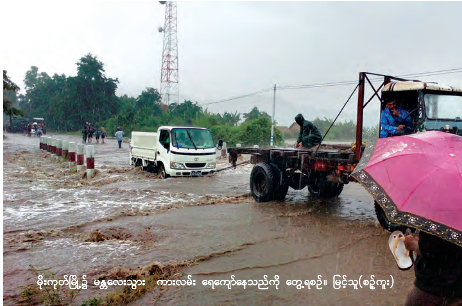
မိုးကုတ်မြို့၌ မန္တလေးသွား ကားလမ်း ရေကျော်နေသည်ကို တွေ့ရစဉ်။ မြင့်သူ(စဉ့်ကူး)