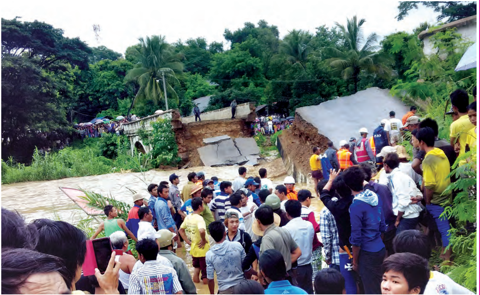
မြစ်ရေကြောင့် ပျက်စီးသွားသည့် သီပေါမြို့နယ်ရှိ နမ့်ပေါ့ချောင်းတံတားကြီးကို ဇူလိုင် ၂၄ ရက်က အဆက်မပြတ် ရွာသွန်းသောမိုးနှင့် တောင်ကျရေများကြောင့် ဒုဋ္ဌတီမြစ်နှင့် နမ့်ပေါ့ချောင်းတို့ ရေလျှံကာ သီပေါနှင့် နမ့်ဆန်၊ နမ့်တူ၊ မန်တုံ မြို့နယ်များသို့ ဆက်သွယ်ပေးသည့် နမ့်ပေါ့ချောင်းတံတားကြီး ကျိုးကျ ပျက်စီးသွားရာ လူသုံးဦး သေဆုံးပြီး သုံးဦးမှာ ရေစီးနှင့်အတူ မျောပါသွားကာ ပြည်သူ့ဆေးရုံတွင် သုံးဦး အတွင်းလူနာအဖြစ် ဆေးကုသနေရကြောင်း သိရသည်။