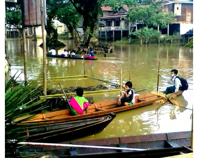
သည့်ရွာ၊ ယခုအခါ အိမ်ခြေတည်ထောင်မှု တိုးပွားလာသော်လည်း ပုံစံညီစနစ်တကျမဟုတ်တော့။ အမရကျေးရွာကား ရေတစ်ဝက်၊ ကုန်းမြေတစ်ဝက် စာမျက်နှာ ၁၇ သို့ ▶

◆ ဇွန်လမှ ဩဂုတ်လအထိ ရေလမ်းခရီးစဉ်အဖြစ် ရေပေါ်ရွာ၏ သဘာဝအလှများ၊ ရွာသူရွာသားများ၏ ရေလုပ်ငန်းဖြစ်သည့် ပိုက်ချ၊ မြူးထောင်း၊ ကွန်ပစ်စသည် နေ့စဉ်ဘဝ ရှာဖွေလုပ်ကိုင်မှုများကိုလည်း လေ့လာထိတွေ့နိုင်မည်ဖြစ်သည်။ အင်းလေးကန်အတွင်း အင်းသားတို့က လှေကို ခြေဖြင့်လှော်ခတ်သွားလာသော်လည်း ပန်းခိုင်ရွာသူ ရွာသားများက လက်ဖြင့်ပင် လှော်ကာသွားလာကြသည်။