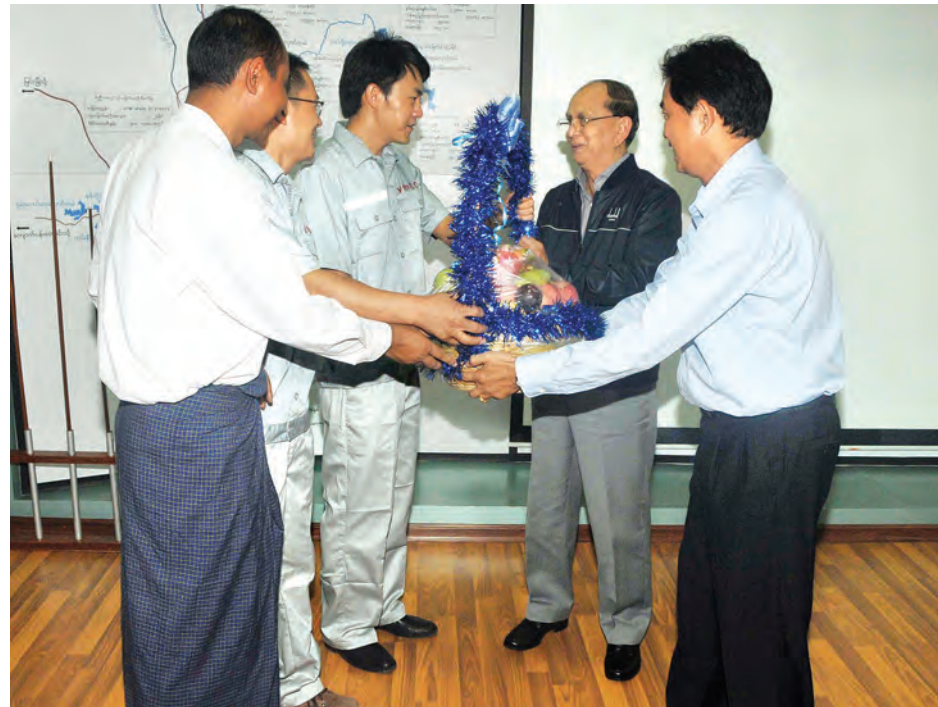
နိုင်ငံတော်သမ္မတ ဦးသိန်းစိန်အား မြို့ကြီးရေလျှောင့်တမံဘက်စုံစီမံကိန်းတည်ဆောက်ရေးလုပ်ငန်းများ ဆောင်ရွက်မှုနှင့်ပတ်သက်၍ ညွှန်ကြားရေးမှူးချုပ်ဦးကျော်မြင့်လှိုင်က ရှင်းလင်းတင်ပြစဉ်။

နိုင်ငံတော်သမ္မတ ဦးသိန်းစိန် ရေအားလျှပ်စစ်စက်ရုံနှင့် တာဘိုင်တပ်ဆင်ရေး လုပ်ငန်းများတွင် ပူးပေါင်းဆောင်ရွက်လျက်ရှိသည့် YMEC ကုမ္ပဏီမှ ပညာရှင်များအား လက်ဆောင်သစ်သီးပန်းခြင်း ပေးအပ်စဉ်။