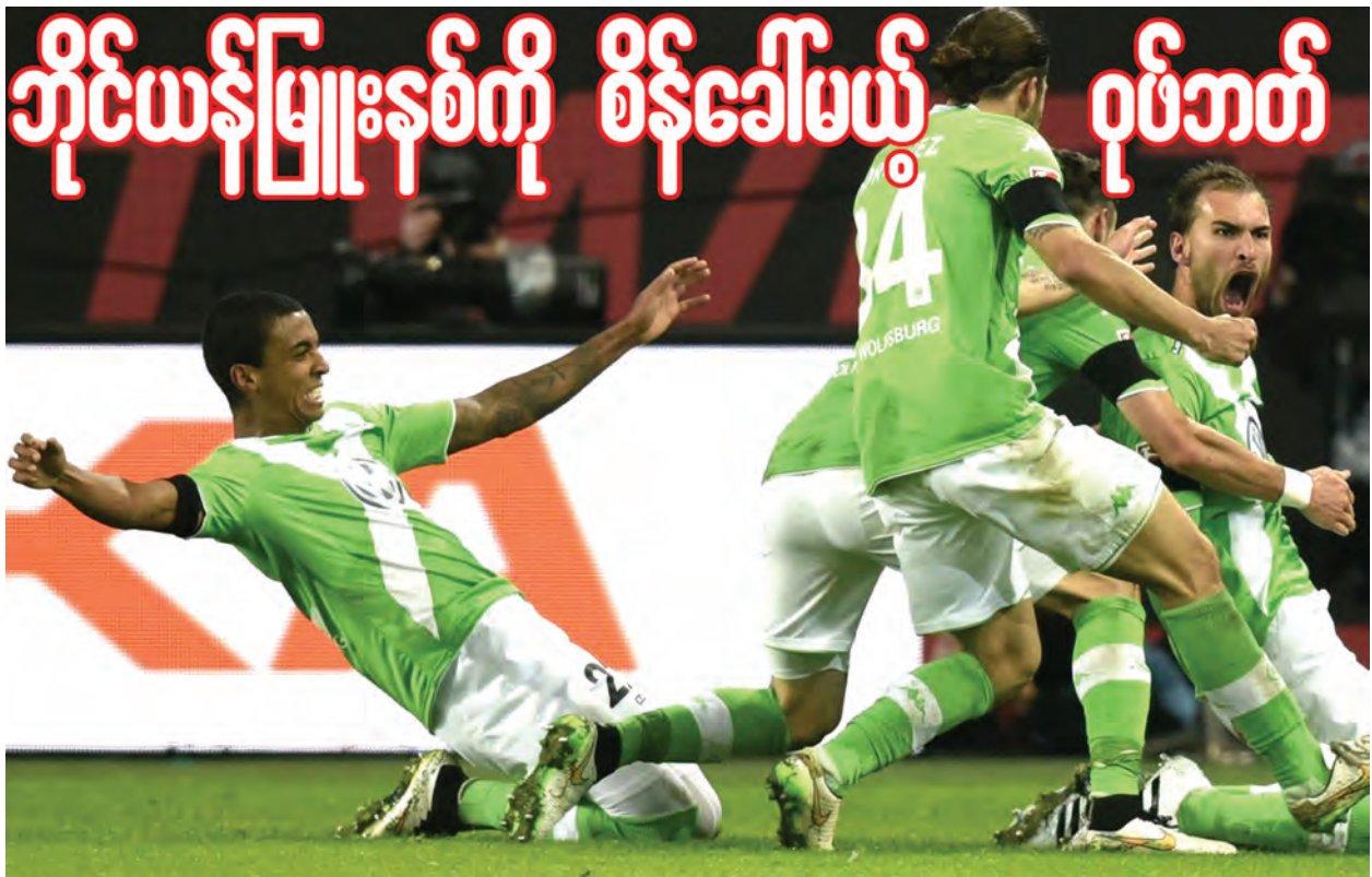
ဥရောပတစ်ခွင်မှာ ပြည်တွင်းလိဂ်ပြိုင်ပွဲတွေ လာမယ့်ဩဂုတ်လအတွင်းမှာ ပြန်လည်နီးထလာပါလိမ့်မယ်။ လောလောဆယ်မှာ ကလပ်အသင်းခြေစမ်းပွဲတွေ၊ နိုင်ငံတကာပြိုင်ပွဲတွေနဲ့ စိတ်ပေါ့ပြိုင်ပွဲတွေကို ရာသီအကြိုပြင်ဆင်မှုတွေအဖြစ် ဆင်နွှဲနေကြပါတယ်။ ကလပ်အသင်းတိုင်း ခြေစွမ်းထက်မြက်တဲ့ ဘောလုံးသမားတွေကို ငွေကြေးမြောက်များစွာပေးပြီး ခေါ်ယူနေသလို အသင်းနဲ့အဝင်ခွင့်ကျမရှိတော့တဲ့ ကစားသမားဟောင်းတွေကို ထုတ်ရောင်းနေကြပါတယ်။ အဲဒီအသင်းတွေထဲမှာ ဂျာမနီ၊ ဘွန်ဒက်လီဂါက ပြီးခဲ့တဲ့ဘောလုံးရာသီမှာ ဒုတိယရရှိတဲ့ ပုလဲဘတ်ရဲ့ အနေအထားက စိတ်ဝင်စားစရာကောင်းနေပါတယ်။