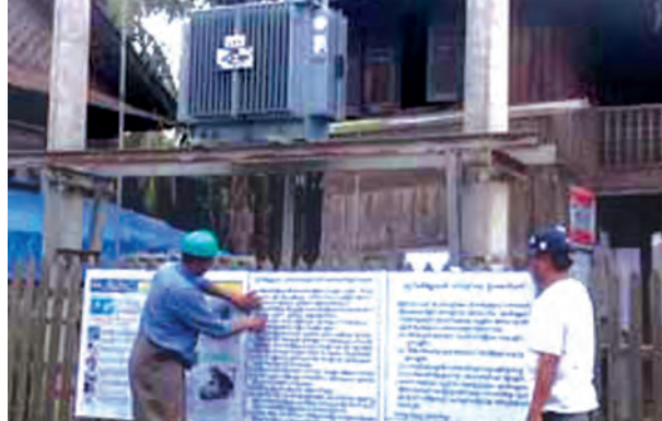
မိုးညှင်း ဇူလိုင် ၂၄ တွင် ဇူလိုင် ၂၂ ရက်က မိုးရာသီ ကချင်ပြည်နယ် မိုးညှင်းမြို့နယ် အင်းတော်ကြီးဒေသ နန်မွန်းကျေးရွာ

တွင် လျှပ်စစ်အန္တရာယ် ကင်းရှင်းရေး အတွက် ဆိုင်းဘုတ် ပို့စတာနှင့် နီတိုး