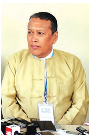
ဦးလှမောင်ရွှေ

တစ်နိုင်ငံလုံး ပစ်ခတ်တိုက်ခိုက်မှုရပ်စဲရေး သဘောတူစာချုပ်(NCA) အတွက် (၈)ကြိမ်မြောက် အစည်းအဝေး၏ တတိယနေ့ အစည်းအဝေးအဖြစ် ပြည်ထောင်စုငြိမ်းချမ်းရေး ဖော်ဆောင်ရေးလုပ်ငန်းကော်မတီ(UPWC)နှင့် တိုင်းရင်းသား လက်နက်ကိုင်အဖွဲ့အစည်းများ၏ တစ်နိုင်ငံလုံး အပစ်အခတ်ရပ်စဲရေးဆိုင်ရာ အဆင့်မြင့်ညှိနှိုင်းရေး ကိုယ်စားလှယ်အဖွဲ့ (SD) တို့သည် ဇူလိုင် ၂၄ ရက်က ရန်ကုန်မြို့ ရွှေလီလမ်းရှိ MPCတွင် ဆက်လက်ပြုလုပ်ခဲ့သည်။