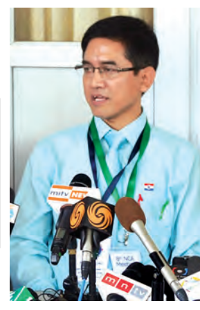
ပူးဇင်ကျုံး