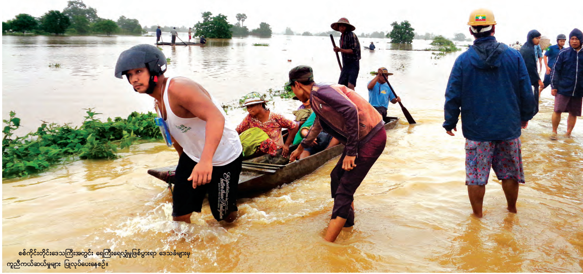
စစ်ကိုင်းတိုင်းဒေသကြီးအတွင်း ရေကြီးရေလျှံမှုဖြစ်ပွားရာ ဒေသခံများမှ ကူညီကယ်ဆယ်မှုများ ပြုလုပ်ပေးနေစဉ်။

ကမ္ဘာတစ်ဝန်း၌ တစ်စတစ်စ ရာသီဥတု ဖောက်ပြန်လာမှုများကြောင့် သဘာဝဘေးအန္တရာယ်များကို လူသားတို့ တစ်နှစ်ထက်တစ်နှစ် ပိုမိုကြုံတွေ့လာနေရသည်။ မြန်မာနိုင်ငံတွင်လည်း အလားတူ ရာသီဥတု ဖောက်ပြန်မှုကြောင့် ဘေးဒုက္ခအန္တရာယ်များနှင့် နှစ်စဉ်ပိုမိုကြုံတွေ့မှုများ ရှိလာခဲ့သည်။ ယခုနှစ်တွင် မြန်မာနိုင်ငံရှိ နေရာဒေသအများအပြား၌ မိုးရေချိန် ပိုမိုရွာသွန်းခဲ့မှုကြောင့် ရေကြီးရေလျှံမှုများ ဖြစ်ပေါ်ခဲ့ရာ ယင်းဒေသများရှိ ပြည်သူများအား ရေဘေးလွတ်ရာနေရာများသို့ ကူညီကယ်ဆယ်ရွှေ့ပြောင်းမှုများကို သက်ဆိုင်ရာတာဝန်ရှိသူများ၊ ဒေသခံများ၊ တပ်မတော်သားများ၊ မြန်မာနိုင်ငံရဲတပ်ဖွဲ့ဝင်များနှင့် လူမှုအဖွဲ့အစည်းများက ဝိုင်းဝန်းကူညီဆောင်ရွက်လျက်ရှိ သည်။