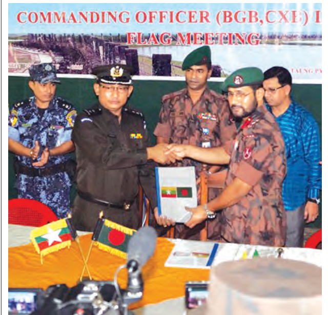
တောင်ပြု(လက်ပဲ)မြို့ အထွေထွေအုပ်ချုပ်ရေးဦးစီးဌာနရုံး၌ မြန်မာ-ဘင်္ဂလားဒေ့ရှ် နှစ်နိုင်ငံအလံတင်အစည်းအဝေးကျင်းပပြီး တပ်မတော်(ရေ) က ကယ်ဆယ်ထားသည့် လေ့စီးသွားလာသူများအနက် ဘင်္ဂလားဒေ့ရှ် နိုင်ငံသားအဖြစ် ထပ်မံအတည်ပြုပြီးသူ ၁၅၅ ဦးကို လွှဲပြောင်းပေးအပ်သည့် စာလွှာပေးအပ်စဉ်။

ဦးဆောင်သည့် အဖွဲ့ထံ လွှဲပြောင်းပေးခဲ့ခြင်းဖြစ်သည်။ တပ်မတော်(ရေ)က ကယ်ဆယ်ခဲ့သည့် ယာယီစောင့်ရှောက်ထားသူ များအနက် ကျန်ရှိသူများကို ဘင်္ဂလားဒေ့ရှ်နိုင်ငံဘက်မှ နိုင်ငံသားစိစစ်မှုများ ဆက်လက်ပြုလုပ်လျက်ရှိကြောင်းနှင့် စိစစ်အတည်ပြုမှုများ ဆောင်ရွက် ပြီးစီးပါက မူလနေရင်းနိုင်ငံသို့ အမြန်ဆုံး ပြန်လည်ပို့ဆောင်နိုင်ရေး ဆက်လက် ဆောင်ရွက်သွားမည်ဖြစ်ကြောင်း နိုင်ငံခြားရေးဝန်ကြီးဌာနမှ သတင်းရရှိ သည်။ (သတင်းစဉ်)