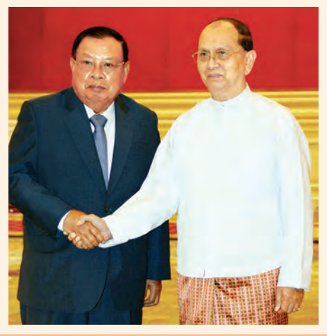
သတင်း၊ စာမျက်နှာ ၃

နိုင်ငံတော်သမ္မတ ဦးသိန်းစိန် လာအိုပြည်သူ့ဒီမိုကရက်တစ်သမ္မတနိုင်ငံ ဒုတိယသမ္မတ ဦးဆောင်သည့် ကိုယ်စားလှယ်အဖွဲ့အား လက်ခံတွေ့ဆုံ ရော့တီ-ကျောက်ပယား-မဲခေါင်စီးပွားရေးပူးပေါင်းဆောင်ရွက်မှု မဟာဗျူဟာ (အက်မက်စ်)အဖွဲ့ဝင်နိုင်ငံများ ဖြစ်ကြသော ကမ္ဘောဒီးယား၊ လာအို၊ မြန်မာ၊ ထိုင်းနှင့် ပီယက်နမ်နိုင်ငံများ၏ ပူးပေါင်းဆောင်ရွက်မှု မြှင့်တင်ရေးဆွေးနွေး