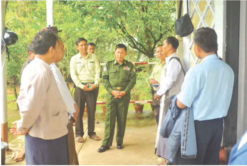
ဝန်ထမ်းများအား လုံခြုံရေးနှင့်နယ်စပ်ရေးရာဝန်ကြီးက တွေ့ဆုံမှာကြားစဉ်။

သထုံမြို့နယ်အတွင်းမှ ပြည်သူများ၏ ရုံးဌာနနှင့် ဆိုင်သော ကိစ္စများကို ဆောင်ရွက်ရာတွင် အဆင်ပြေစွာဖြင့် ဝန်ဆောင်မှုများ ဆောင်ရွက်ပေးနိုင်