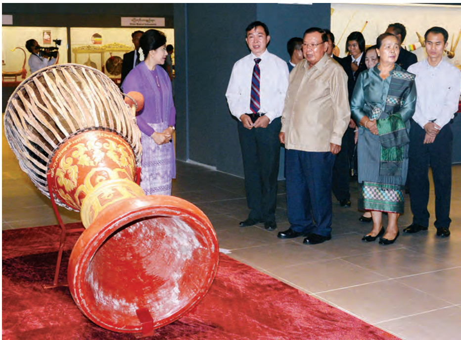
ရင်းလင်းပြသကြသည်။(အပေါ်ပုံ) ယင်းနောက် နေပြည်တော် ဒုတိယသမ္မတနှင့်အဖွဲ့သည် ဥပ္ပိတသန္တီစေတီတော်သို့ ရောက်ရှိကြပြီး စေတီတော်နှင့် လိုက်တော်အတွင်းရှိ ဗုဒ္ဓရုပ်ပွားတော်များအား လှည့်လည် ဖူးမြော်ကြည့်ရှုကြပြီး ပန်း၊ ရေချမ်း၊ ရတနာ ဆင်ဖြူတော်ဆောင်ရှိ ဆီမီးများ ကပ်လျှူဇော်ကြကာ အလှူငွေများ ပေးအပ်လှူဒါန်းကြသည်။ ထို့နောက် နေပြည်တော် ဒုတိယသမ္မတနှင့်အဖွဲ့သည် ဥပ္ပိတသန္တီစေတီတော် အရှေ့ဘက်မုခ် (သတင်းစဉ်)

နေပြည်တော် ဇူလိုင် ၂၂ မြန်မာနိုင်ငံသို့ အလုပ်သဘောခရီးစဉ်ဖြင့် ရောက်ရှိနေသော လာအို ပြည်သူ့ဒီမိုကရက်တစ် သမ္မတနိုင်ငံ ဒုတိယသမ္မတ မစ္စတာ ဘွန်နိုဝ်ရာ ချစ်နှင့်ဇနီး ဦးဆောင်သော ကိုယ်စားလှယ်အဖွဲ့သည် ယနေ့နံနက်ပိုင်းတွင် ဥက္ကဋ္ဌရသီရိမြို့၊ ဥဒယရံသီကုန်းပေါ်၌ တည်ထားသော မဟာဗောဓိစေတီတော်ကြီးနှင့် သံဝေဇနိယလေးဌာနသို့ သွားရောက်ဖူးမြော်ကြည့်ရှု၍ အလှူငွေများ ပေးအပ်လှူဒါန်းကြသည်။ မွန်းလွဲပိုင်းတွင် နေပြည်တော် ဒုတိယသမ္မတနှင့် အဖွဲ့သည် အမျိုးသားပြတိုက် (နေပြည်တော်) သို့ရောက်ရှိကြပြီး ပြတိုက်အတွင်း ခင်းကျင်းပြသထားသည့် ပရိုင်းမိတ်နှင့် ကျောက်ဖြစ်ရုပ်ကြွင်းပြခန်း၊ သမိုင်းမတင်မီခေတ် ပြခန်း၊ မြန်မာ့ပန်းချီပြခန်း၊ မြန်မာ့အနုပညာပြခန်း၊ သမိုင်းတင် ခေတ်ဦးပြခန်း၊ သမိုင်းတင်ခေတ် (အေဒီ ၁၁ မှ ၁၄ ရာစု) ပြခန်းများကို လှည့်လည်ကြည့်ရှုလေ့လာကြရာ ပြည်ထောင်စုဝန်ကြီး ဦးအေးမြင့်ကြူ၊ ဒုတိယဝန်ကြီးနှင့် ပြတိုက်တာဝန်ခံများက လိုက်လံ