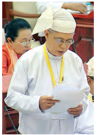
ဒုတိယဝန်ကြီး ဦးဟိန် ဖြေကြားစဉ်။

ပထမအကြိမ် ပြည်သူ့လွှတ်တော် (၁၂) ကြိမ်မြောက် ပုံမှန်အစည်းအဝေး ၇၄ ရက်မြောက်နေ့ကို ယနေ့နံနက် ၁၀ နာရီတွင် ကျင်းပရာ ဆည်မြောင်းကဏ္ဍ၊ လမ်းပန်းဆက်သွယ်ရေးကဏ္ဍနှင့် မြစ်ကြောင်းထိန်းသိမ်းရေးကဏ္ဍဆိုင်ရာ မေးခွန်းများ မေးမြန်းဖြေကြားခြင်း၊ ဥပဒေကြမ်းသုံးခုဆွေးနွေးခြင်းတို့ကို ဆောင်ရွက်ခဲ့သည်။ အစည်းအဝေး၌ စဉ်ကိုင်မဲဆန္ဒနယ်မှ ဦးကြည်ပြုံး၏ စဉ်ကိုင်မြို့နယ် အတွင်းရှိ ဇော်ဂျီမြစ်ဆိုင်ရာဆည်ရေသောက်စနစ်တွင် ပါဝင်သော စွန့်ရိတ်နှင့် မင်းလှကန်တို့အား အပြီးသတ်တူးဖော်ပေးရန်နှင့် ရေကန်များ၏ စရိယာ သတ်မှတ်၍ နယ်နိမိတ်အတွင်း ကျူးကျော်မှုများကို တားဆီးပေးရန် မေးခွန်းနှင့် စပ်လျဉ်း၍ လယ်ယာစိုက်ပျိုးရေးနှင့် ဆည်မြောင်းဝန်ကြီးဌာန ဒုတိယဝန်ကြီး ဦးခင်ဇော်က ကန်များ၏ ရေလျှော့ပမာဏကို သိရှိနိုင်ရန်အတွက် ခေတ်မီ တိုင်းတာရေးကိရိယာများဖြင့် ပြန်လည်တိုင်းတာရေးကို စီစဉ်ဆောင်ရွက်ပေးသွားမည်ဖြစ်ပါကြောင်း၊ ကန်နယ်နိမိတ်တိုင်းတာခြင်းကို သက်ဆိုင်ရာ မြို့နယ်အုပ်ချုပ်ရေးမှူး၊ မြို့နယ်လယ်ယာမြေစီမံခန့်ခွဲရေးနှင့် စာရင်းအင်းဦးစီးဌာန တို့နှင့် ညှိနှိုင်းပြီး ပူးပေါင်းဆောင်ရွက်သွားမည် ဖြစ်ပါကြောင်း၊ စွန့်ရိတ်နှင့် မင်းလှကန်များ ဆက်လက်တူးဖော်နိုင်ရန်အတွက် ၂၀၁၅-၂၀၁၆ ဘဏ္ဍာရေးနှစ် မူလရန်ပုံငွေတွင် တင်ပြတောင်းခံခဲ့သော်လည်း ဦးစားပေးအလိုက် ရန်ပုံငွေ စိစစ်လျော့ချသဖြင့် ၂၀၁၆-၂၀၁၇ ဘဏ္ဍာနှစ်တွင် ထပ်မံတင်ပြတောင်းခံပြီး ရန်ပုံငွေခွင့်ပြုချက်ရရှိပါက ဆောင်ရွက်ပေးသွားမည်ဖြစ်ပါကြောင်း ဖြေကြားသည်။ ခန္တီးမဲဆန္ဒနယ်မှ ဦးလှထွန်း၏ စစ်ကိုင်းတိုင်းဒေသကြီးအတွင်းရှိ ချင်းတွင်း မြစ်ကြောင်းသည် တစ်နှစ်ထက်တစ်နှစ် မြစ်ကြောင်းကောက်လာပြီး ကုန်တင်