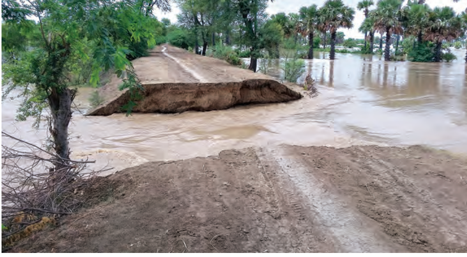
မြင်းမူမြို့နယ် ပျောရွာ-မကျီးကန်-ညောင်မြစ်လမ်း တာပေါင်ကျိုးပေါက်ပြီး မူးမြစ်ရေများ ဝင်ရောက်နေစဉ်။

တို့တွင် ရွာလုံးကျွတ် ရေဝင်ရောက် မှုများရှိခဲ့သော်လည်း မြို့နယ်စီမံ ခန့်ခွဲမှုကော်မတီဥက္ကဋ္ဌနှင့် အဖွဲ့ဝင် များ၊ တာဝန်ရှိသူများ ဦးဆောင်ကာ လိုအပ်သည်များ စီစဉ်ဆောင်ရွက် ပေးမှုကြောင့် လူနှင့် တိရစ္ဆာန်များ တစ်စုံတစ်ရာ ပျက်စီးဆုံးရှုံးမှုမရှိ ကြောင်း သိရသည်။ (စစ်ကိုင်းခရိုင် ပြန်/ဆက်)