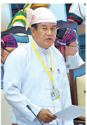
ဒုတိယဝန်ကြီး ဦးသောင်းထိုက် ဖြေကြားစဉ်။

ပေးခဲ့သော ယစ်မျိုးလိုင်စင်များအနေဖြင့် ပြဋ္ဌာန်းထားသော ဥပဒေများကို ဖောက်ဖျက်ကျူးလွန်ခြင်း၊ တရားမဝင် ရောင်းချခြင်းများအား အရေးယူဆောင်ရွက်လျက်ရှိပါကြောင်း ဖြေကြားသည်။