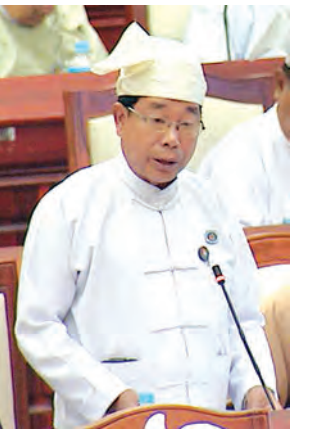
ခန္တီးမဲဆန္ဒနယ်မှ ဦးလှထွန်း မေးမြန်းစဉ်။

မော်တော်ယာဉ်များသွားလာရာ၌ အခက်အခဲကြုံတွေ့နေရပါသဖြင့် ချင်းတွင်း မြစ်ကြောင်းထိန်းသိမ်းရေးနှင့် ပတ်သက်၍ မည်သို့စီမံဆောင်ရွက်နေသည်ကို သိလိုခြင်းမေးခွန်းနှင့်စပ်လျဉ်း၍ ပို့ဆောင်ရေးဝန်ကြီးဌာန ဒုတိယဝန်ကြီး ဦးဟိန်က ချင်းတွင်းမြစ်ကြောင်းတစ်လျှောက် ရေကြောင်းကျပ်တည်းမှု ဖြစ်ပေါ်လေ့ရှိသော ခန္တီးရေလမ်း၊ ဟုမ္မလင်းရေလမ်း၊ နတ်စက်ရေလမ်း၊ ရှားပင်ရေလမ်းနှင့် မဲဒင်ရေလမ်းများတွင် ရေလမ်းကြောင်းကောင်းမွန်ရေးအစီအမံများ ဆောင်ရွက်နိုင်ရေးအတွက် နှစ်အလိုက် ရန်ပုံငွေတင်ပြတောင်းခံ