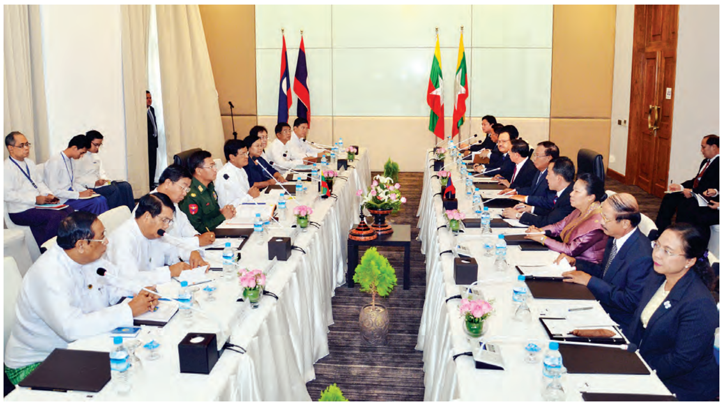
ပြေးဆွဲဆွေးနွေးပွဲတွင် မြန်မာနိုင်ငံနှင့် လာအိုနိုင်ငံတို့ အကြား နှစ်(၆၀) ပြည့်မြောက်ခဲ့ပြီဖြစ်သည့် သံတမန်ဆက်သွယ်မှု အစဉ်အလာကောင်းပြု နှစ်နိုင်ငံချစ်ကြည်ရင်းနှီးမှုကို ဆက်လက်ဆောင်ကြဉ်းရေး၊ အာဆီယံ၊ အက်မက်စ်နှင့် ဂျီအမ်အက်စ်ကဲ့သို့သော ဒေသတွင်း အစီအစဉ်များတွင် နှစ်နိုင်ငံ နားလည်မှုရှိစွာဖြင့် တက်ကြွစွာ ပါဝင်ရေး၊ နှစ်နိုင်ငံအတွက် အလားအလာရှိသော နယ်ပယ်များဖြစ်သည့် စိုက်ပျိုးရေး၊ ခရီးသွားလာရေး၊ ပညာရေး၊ လျှပ်စစ်ဓာတ်အားထုတ်လုပ်ရေး၊ ကုန်သွယ်ရေး၊ အားကစား၊ ယဉ်ကျေးမှုကဏ္ဍများတွင် ပူးပေါင်းဆောင်ရွက်မှုမြှင့်တင်ရေး၊ နှစ်နိုင်ငံအတွင်းရှိ ယူနက်စကို အသိအမှတ်ပြု ကမ္ဘာ့အမွေအနှစ်စာရင်းဝင် အထင်ကရဒေသများသို့ ပူးတွဲခရီးသွားလာရေးအစီအစဉ်များ ရေးဆွဲအကောင်အထည်ဖော်ရေး၊ ရန်ကုန်-ဗီယက်ကျန်း (သို့မဟုတ်) ပုဂံ-လွမ်ပရာဘန် တိုက်ရိုက်လေယာဉ်ခရီးစဉ် ဆွေးနွေးပြောကြားခဲ့သည်။ ဒုတိယသမ္မတ ဦးညွှန်ထွန်းသည် ညပိုင်းတွင် နေပြည်တော် လာအို ပြည်သူ့ဒီမိုကရက်တစ်သမ္မတနိုင်ငံ ဒုတိယသမ္မတနှင့်ဇနီး ဦးဆောင်သော ကိုယ်စားလှယ်အဖွဲ့အား Lake Garden ဟိုတယ်၌ ညစာစားပွဲဖြင့် တည်ခင်း ညည်းခဲ့သည်။ (သတင်းစဉ်)

ပြည်ထောင်စုသမ္မတမြန်မာနိုင်ငံတော် ဒုတိယသမ္မတ ဦးညွှန်ထွန်းသည် လာအိုပြည်သူ့ဒီမိုကရက်တစ်သမ္မတနိုင်ငံ ဒုတိယသမ္မတ မစ္စတာဘွန်ညို ဗိုလ်ချုပ် ဦးဆောင်သည့် ကိုယ်စားလှယ်အဖွဲ့အား ယနေ့နံနက် ၉ နာရီ ၄၅ မိနစ်တွင် နေပြည်တော်ရှိ Lake Garden ဟိုတယ် ဟံသာဝတီဆောင် မေခအစည်းအဝေးခန်းမ၌ တွေ့ဆုံကာ နှစ်နိုင်ငံဆွေးနွေးပွဲတစ်ရပ် ကျင်းပသည်။ (ယာပုံ)