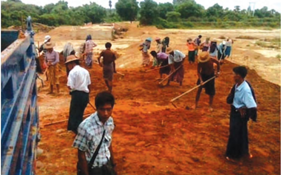
ဆောင်ရွက်ပေးမှုကြောင့် ပြည်သူများအဆင်ပြေချောမွေ့စွာ သွားလာလျက်ရှိကြောင်းသိရသည်။

ယင်းနောက် ကနီ-မင်းကင်းလမ်းပေါ်ရှိ မိုင်တိုင်အမှတ် (၆/၂)နှင့် (၆/၃) အကြားတွင် မြေသားလမ်း ပြတ်သွားပြီး (၆/၆)နှင့် (၆/၇)အကြား တောင်ဖြူချောင်းပေါ်ရှိ တံတားအမှတ် (၁/၇)တံတားကိုလည်း အချိန်နှင့် တစ်ပြေးညီ