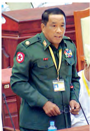
ဒုတိယဝန်ကြီး ဗိုလ်မှူးချုပ် ကျော်ကျော်ထွန်း ဖြေကြားစဉ်။

ကိုင်တွယ် ကျင့်သုံးလျက်ရှိသော တည်ဆဲဥပဒေအရပ်တွင် နိုင်ငံရေးအကျဉ်းသားဟူသော စကားရပ်ကို အဓိပ္ပာယ်ဖွင့်ဆို ပြဋ္ဌာန်းထားခြင်း မရှိသည်ကို တွေ့ရှိရပါကြောင်း။ တည်ဆဲဥပဒေများကို ဖောက်