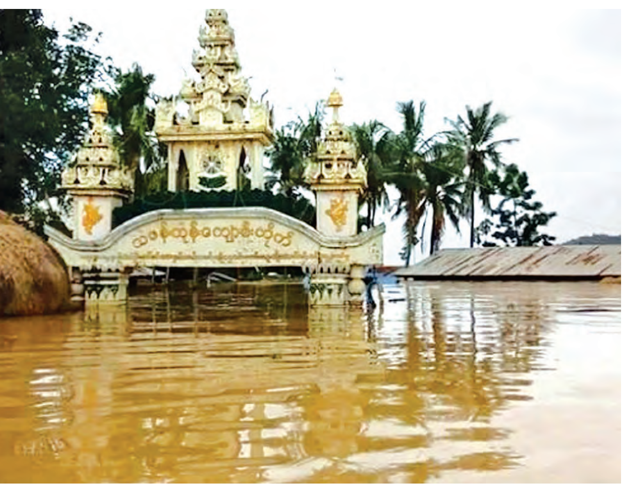
ငွေအိုး(ကသာ)

ကျေးရွာသားများအတွက် ကျန်းမာရေးဆေးခန်း ဆောင်ရွက်ထားလျက်ရှိပြီး ရေဘေးကယ်ဆယ်ရေးလုပ်ငန်းအတွက် အလှူငွေများ ထည့်ဝင်လှူဒါန်းလိုပါကလည်း လှူဒါန်းနိုင်ရန် ကယ်ဆယ်ရေးစခန်းများ ဖွင့်လှစ်ထားရှိကြောင်း သိရသည်။ မြန်မာနိုင်ငံအထက်ပိုင်း ကားလမ်းများသွားလာနိုင်မှု ရပ်တန့်ခဲ့ရသည့်အတွက် ကုန်စည်များဒေသများစွာကိုရိုက်ခတ်ခဲ့ရာ ကြက်သွန်ဖြူတစ်ပိဿာလျှင် ငွေကျပ် ၁၀၀၀ ဈေးအနည်းဆုံးဖြစ်လာသည်။ ထို့ပြင် ကသာခရိုင် ကောလင်းမြို့နယ်၌ အရှေ့ဘက် ထီးချိုင့်၊ အနောက်ဘက်ပင်လည်ဘူး၊ တောင်ဘက်ကျွန်းလှ၊ မြောက်ဘက်ဝန်းသိုရီရာ ပင်လယ်ရေမျက်နှာပြင်အထက် ၈၀၀ ပေ အနောက်ဘက် မိုင် ၂၀ ကျော်ခန့် မင်းဝဲတောင်တန်းမှ စီးဆင်းလာသော ရေအားကြောင့် ရေရုတ်မြောင်းများနှင့် တံတားတည်ဆောက် ထားရှိမှုများသည် အနိမ့်အမြင့်ပေါ် မူတည်၍ မိုးရွာမှုအားကောင်းလာရာ ရေစီးရေလာမကောင်းခြင်းကြောင့် တည်ဆောက်ထားရှိသော ဆည်တာတမံ ထိန်းသိမ်းနိုင်မှုမရှိကြောင်း သိရသည်။