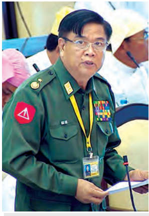
ဒုတိယဝန်ကြီး ဗိုလ်ချုပ် ကျော်ညွန့် ဖြေကြားစဉ်။

စွန့်လွှတ်ပေးသွားမည်ဖြစ်ပါကြောင်း ဖြင့် ဖြေကြားသည်။ ယနေ့အစည်းအဝေးတွင် အကျဉ်းထောင်များ ဥပဒေကြမ်းနှင့်စပ်လျဉ်း၍ ချဉ်းပြည်နယ် မဲဆန္ဒနယ်အမှတ်(၉)မှ ဦးပေါ်လှလွင်က အကျဉ်းသားများအတွက် ဥပဒေအကာအကွယ် ရရှိစေရန် တိကျသောဥပဒေများ ပြဋ္ဌာန်းပေးရန် လိုအပ်ပါကြောင်း၊ အကျဉ်းသားများအတွက် စိတ်ပိုင်းဆိုင်ရာ ပြုပြင်ပြောင်းလဲရေးစီစဉ် ဆောင်ရွက်ရာတွင် အခြေခံဥပဒေက ခွင့်ပြုသည့် ဘာသာများ၏ ဝတ်ပြုနည်းများကို အကန့်အသတ်စည်းမျဉ်း စည်းကမ်းများဖြင့် ဝတ်ပြုကုံးကွယ်ခွင့် ပေးသင့်ပါကြောင်း။ ထို့ပြင် အကျဉ်းသားများ