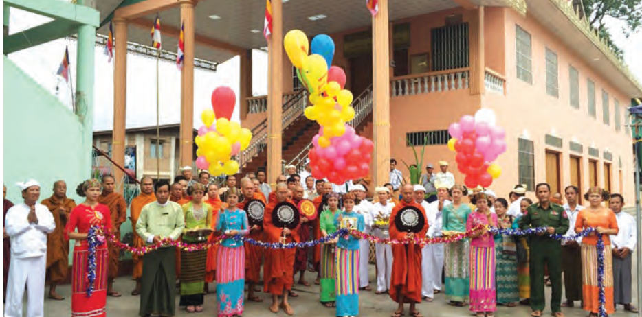
မဲကြီးဖြတ်ဖွင့်လှစ်ပေးခဲ့ကြသည်။ အဆိုပါ နှစ်ထပ်ဓမ္မာရုံကို နမ့်ခမ်းမြို့ မြို့လယ်ဘုရားကျောင်း (ပင်မငွေ)မှ မတည်လှူဒါန်းငွေကျပ်သိန်း ၅၀၀ ကျော်၊ နမ့်ခမ်းမြို့ ၄၀၀ ခန့်နှင့်အတူ စုစုပေါင်း ငွေကျပ်သိန်း ၁၄၀၀ ကျော်အတူ အကျခံသိန်း ၅၀၀ ကျော် အများပြည်သူအလှူရှင် စုပေါင်းလှူဒါန်းငွေကျပ်သိန်း