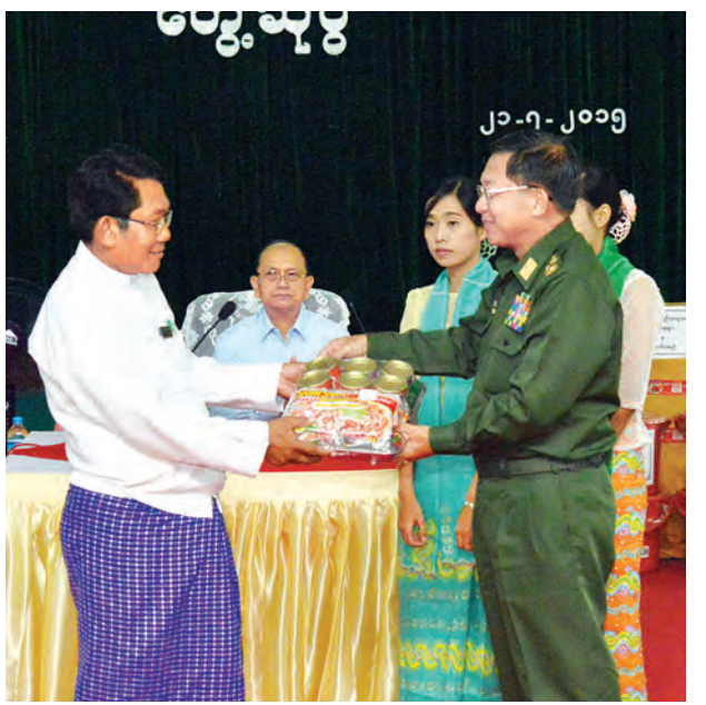
တပ်မတော်ကာကွယ်ရေးဦးစီးချုပ် ဗိုလ်ချုပ်မှူးကြီး မင်းအောင်လှိုင် ကန်ဘလူမြို့ ရေဘေးသင့်ပြည်သူများအတွက် ထောက်ပံ့ပစ္စည်းများ ပေးအပ်လှူဒါန်းစဉ်။

ဆက်လက်၍ နိုင်ငံတော်သမ္မတ၊ တပ်မတော်ကာကွယ်ရေးဦးစီးချုပ်၊ ပြည်ထောင်စုဝန်ကြီးများ၊ ဝန်ကြီးချုပ်၊ ဒုတိယဝန်ကြီးများနှင့် အလှူရှင်များ