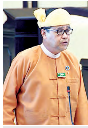
ရှမ်းပြည်နယ် မဲဆန္ဒနယ် အမှတ်(၃) စိုင်းစံမင်း မေးမြန်းစဉ်။

အိပ်ရာဝင်၊ အိပ်ရာထသည့် အချိန်များတွင် ဘုရားရှိခိုးသည့်အခါ မိမိကိုးကွယ်သည့် ဘာသာ၊ ထုံးတမ်းစဉ်လာအတိုင်း ဆုတောင်းဝတ်ပြု