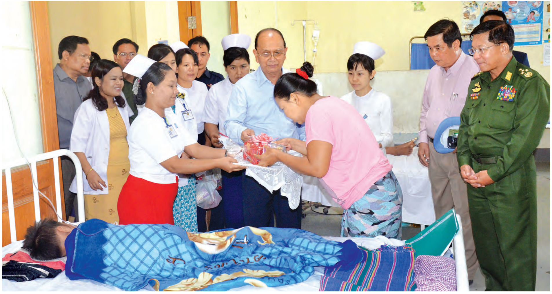
နိုင်ငံတော်သမ္မတ ဦးသိန်းစိန် ကန်ဘလူမြို့ရှိ ပြည်သူ့ဆေးရုံကလေးကုသဆောင်၌ ဆေးဝါးကုသမှုခံယူနေသည့် ကလေးငယ်များအားကြည့်ရှုပြီး အာဟာရဖြည့်စွက်စာများနှင့် ထောက်ပံ့ငွေများကို ပေးအပ်စဉ်။

နေပြည်တော် ဇူလိုင် ၂၁ ကန်ဘလူမြို့၌ ရောက်ရှိနေသော ပြည်ထောင်စုသမ္မတမြန်မာနိုင်ငံတော် နိုင်ငံတော်သမ္မတ ဦးသိန်းစိန်သည် ယနေ့နံနက်ပိုင်းတွင် ကန်ဘလူမြို့ အထွေထွေအုပ်ချုပ်ရေးရုံး အစည်းအဝေးခန်းမ၌ ကျင်းပသည့် ကန်ဘလူမြို့နယ်မှ လွှတ်တော်ကိုယ်စားလှယ်များ၊ မြို့မိမြို့ဖများ၊ မြို့နယ်စီမံခန့်ခွဲမှု ကော်မတီဝင်များ၊ ဖွံ့ဖြိုးတိုးတက်ရေးအထောက်အကူပြုကော်မတီဝင်များ၊ မြို့နယ်စည်ပင်သာယာရေးကော်မတီဝင်များ၊ ဌာနဆိုင်ရာများ၊ လူမှုရေးအသင်းအဖွဲ့များ၊ ဒေသခံပြည်သူများနှင့် တွေ့ဆုံပွဲအခမ်းအနားသို့ တက်ရောက်သည်။ စာမျက်နှာ ၈ ကော်လံ ၁ *