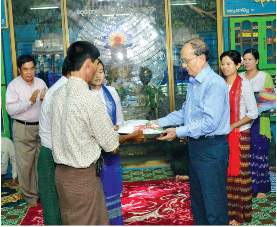
နိုင်ငံတော်သမ္မတ ဦးသိန်းစိန် ကောလင်းမြို့နယ်အတွင်းရှိ ရေဘေးသင့်ပြည်သူများအတွက် ထောက်ပံ့ပစ္စည်းများ ပေးအပ်လှူဒါန်းစဉ်။

ထို့နောက် နိုင်ငံတော်သမ္မတနှင့် အဖွဲ့ဝင်များသည် မုံရွာမြို့မှ အထူးလေယာဉ်ဖြင့် ထွက်ခွာခဲ့ကြရာ ညနေပိုင်းတွင် နေပြည်တော်သို့ ပြန်လည်ရောက်ရှိကြသည်။ (သတင်းစဉ်)