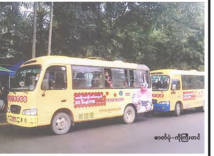
ခေတ်ပုံ-ကိုကြီးတင်

နဲ့ အရေးယူဆောင်ရွက်သွားပါမယ်” ဟု မိမိယာ ရှင်းလင်းပွဲတစ်ခု၌ပြောခဲ့ဖူးသည်။ ရန်ကုန်မြို့တွင် လူဦးရေထူထပ်များပြားလာသည့်နှင့်အမျှ ခရီးသည်ပို့ဆောင်ရေးတွင်လည်း ယာဉ်လိုအပ်ချက်များ ဖြစ်ပေါ်လျက်ရှိရာ ယခင်ပြေးဆွဲနေသော ဟိုင်းလက်စ်ကားငယ်များနှင့် ဟီးနီးကားကြီးများ နေရာတွင် မိနီဘတ်စ်ကားသစ်များကို ခေတ်နှင့်အညီ ပြောင်းလဲပြေးဆွဲပေးခြင်းဖြင့် ခရီးသည်များသွားလာရေးပိုမိုအဆင်ပြေသည့်အပြင် မြို့တော်အဆင်ပြေ လှပရေးကိုလည်း အထောက်အကူပြုလျက်ရှိသည်။ ။