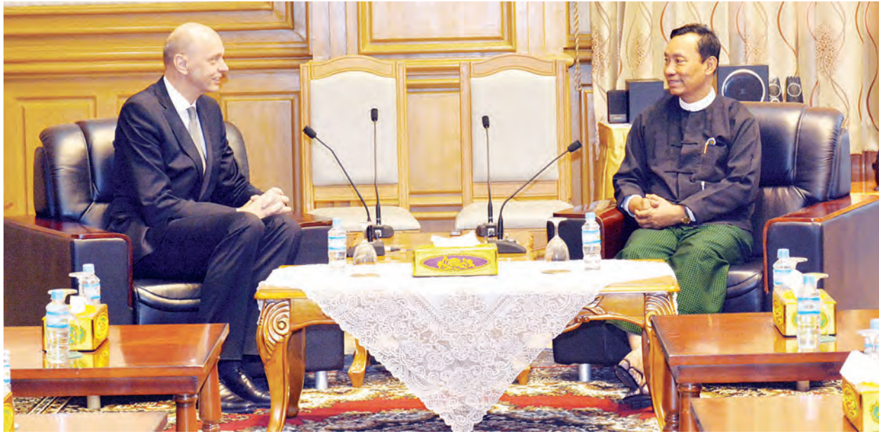
နေပြည်တော် ဇူလိုင် ၂၁

ပြည်သူ့လွှတ်တော်ဥက္ကဋ္ဌ သူရဦးရွှေမန်းသည် ချက်သမ္မတနိုင်ငံ သံအမတ်ကြီး H.E. Mr. Jaroslav Dolecek အား ယနေ့နံနက် ၁၁ နာရီ မိနစ် ၅၀ တွင် နေပြည်တော်ရှိ လွှတ်တော်အဆောက်အအုံ ပြည်သူ့လွှတ်တော်ဧည့်ခန်းမ၌ လက်ခံတွေ့ဆုံသည်။