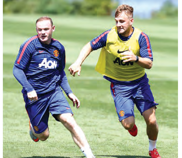
ကောင်းပြတ်သူ - စုစည်းသည့်။

လယ်ကစားသမားအဖြစ် ကစားခဲ့ရတဲ့အတွက် ဂိုးပေါင်း ၁၄ ဂိုးအထိသာ သွင်းယူပေးနိုင်ခဲ့ပါတယ်။ အသက် ၂၉ နှစ်အရွယ်ရှိပြီဖြစ်တဲ့ တိုက်စစ်မှူးရွန်းနေဟာ ရာသီအကြို ပြိုင်ပွဲများမှာတော့ အဓိကအထောင် တိုက်စစ်မှူးနေရာမှာ ဝင်ရောက်ကစားနေတာတွေ့ရပါတယ်။ ရွန်းနေဟာ အသက် ၃၃ နှစ်အထိ မန်ယူရဲ့အဓိက တိုက်စစ်မှူးအဖြစ် ဆက်ရှိနိုင်ပြီး အသင်းရဲ့ ထိပ်တန်းဂိုးသွင်းပေးနိုင်တဲ့ ကစားသမားအဖြစ် ဆက်လက်ရှိနိုင်တယ်လို့ ဆိုပါတယ်။ သို့ပေမယ့်လည်း နည်းပြ ဗန်ဟားလ်ရဲ့ နည်းဗျူဟာအရ ရွန်းနေဟာ ကွင်းလယ်ကစားသမားလည်းဖြစ်နိုင်တယ်လို့ ဆိုပါတယ်။ သို့ပေမယ့် ကွင်းလယ်ကစားသမားသစ်တွေကို ခေါ်ယူလိုက်ပြီဖြစ်တဲ့ အတွက် လာမယ့်ပရီမီယာလိဂ်မှာတော့ အဓိကတိုက်စစ်ကို ဦးဆောင်ကစားမယ့်သူလို့ ဆိုပါတယ်။