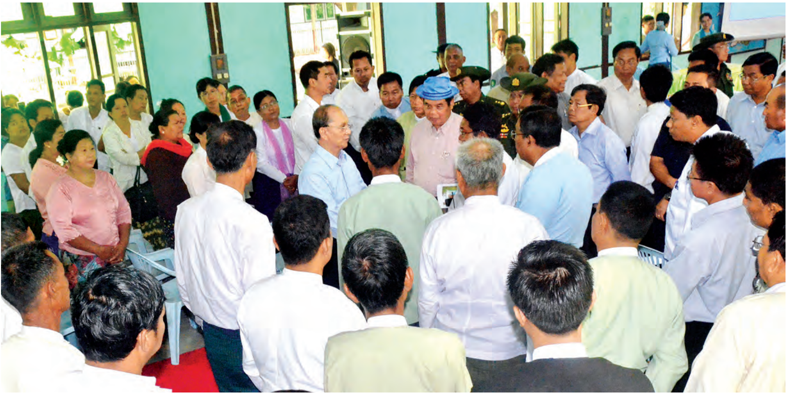
နိုင်ငံတော်သမ္မတ ဦးသိန်းစိန် ကန်ဘလူမြို့ အထွေထွေအုပ်ချုပ်ရေးရုံး အစည်းအဝေးခန်းမ၌ ကျင်းပသည့် တွေ့ဆုံပွဲအခမ်းအနားသို့ တက်ရောက်လာကြသူများအား ရင်းရင်းနှီးနှီးနှုတ်ဆက်စဉ်။

ထို့နောက် နိုင်ငံတော်သမ္မတက ယနေ့ကမ္ဘာပေါ်တွင် ရာသီဥတုပြောင်းလဲမှုများကြောင့် သဘာဝဘေးအန္တရာယ်များနှင့် ရင်ဆိုင်နေရပြီး ပျက်စီးဆုံးရှုံးမှုများ ကြုံတွေ့နေရပါကြောင်း၊ သဘာဝဘေးအန္တရာယ်များကို တားဆီး၍မရသော်လည်း ထိခိုက်ပျက်စီးဆုံးရှုံးမှု အနည်းဆုံးဖြစ်အောင် ကြိုတင်ပြင်ဆင် ဆောင်ရွက်နိုင်ပါကြောင်း၊ မိမိတို့အစိုးရတွင် သဘာဝဘေး