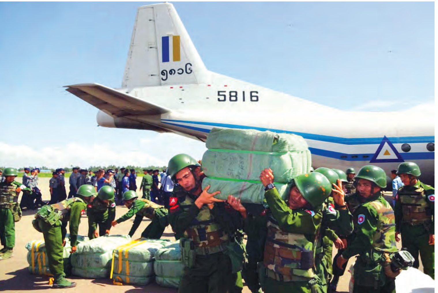
စစ်တွေလေဆိပ်သို့ တပ်မတော်လေယာဉ်ဖြင့်ရောက်ရှိလာသောရခိုင်ပြည်နယ်ရေဘေးဒဏ်ခံရသူများအတွက် ထောက်ပံ့ပစ္စည်းများကို တပ်မတော်သားများက ကူညီပို့ဆောင်ပေးစဉ်။

ဒုတိယအကြိမ်မြောက် တပ်မတော်လေယာဉ်ဖြင့် သွားရောက်ခဲ့သည့်ခရီးစဉ်မှာ ပြီးခဲ့သည့် ဇူလိုင်လ ၁၂ ရက်နေ့ကဖြစ်သည်။ ရခိုင်ပြည်နယ်အတွင်း သဘာဝရေဘေးဒဏ်တွေကြုံခဲ့ကြရသော တိုင်းရင်းသားမိသားစုဝင်များအတွက် ဆန်အိတ်များ၊ စားသုံးဆီပိပါများ၊ စောင်နှင့်ခြင်ထောင်များ ပါဝင်သည့် ထောက်ပံ့ပစ္စည်းများကို နယ်စပ်ရေးရာဝန်ကြီးဌာန ဒုတိယဝန်ကြီး ဗိုလ်ချုပ်တင်အောင်ချစ် စီစဉ်ညွှန်ကြားကာ တပ်မတော်လေယာဉ်ဖြင့် စစ်တွေမြို့သို့ ပို့ဆောင်ပေးခဲ့ခြင်း ဖြစ်ပါသည်။ ထောက်ပံ့ပစ္စည်းများနှင့်အတူ စစ်တွေလေဆိပ်သို့ရောက်ရှိသောအခါ ဒေသကွပ်ကဲမှု စစ်ဌာနချုပ် (စစ်တွေ)မှ ဗိုလ်မှူးချုပ်ကျော်ရွှေကို တွေ့ဆုံနှုတ်ဆက်ပြီး ဟိုမိန်းတွင် အတူတကွ တာဝန်ထမ်းဆောင်ခဲ့သည်များကို သတိတရ ပြန်လည်ပြောပြခဲ့ကြသည်။ ရခိုင်တိုင်းရင်းသား သွေးချင်းများအတွက် ထောက်ပံ့ပစ္စည်းများအား ပိုင်းဝန်းကူညီပို့ဆောင်ပေးသည့် တပ်မတော်(လေ)မှ အုပ်မှူးကြီး ဒုတိယဗိုလ်မှူးကြီးကျော်စိုးမိုးနှင့် အရာရှိ၊ အရာခံ၊ အကြပ်တပ်သားများ၊ စစ်တွေလေဆိပ်မှ