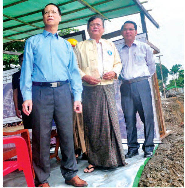
ဒုတိယသမ္မတဒေါက်တာစိုင်းမောက်ခမ်း တောင်ကုတ်မြို့ ချောင်းကောက်ရပ်ကွက် ဦးဥက္ကဋ္ဌမလမ်း ကမ်းပြိုမှုကို ကြည့်ရှုစစ်ဆေးစဉ်။

ရပ်များကို နိုင်ငံတော်မှ ညှိနှိုင်းပေါင်းစပ် ဆောင်ရွက်ပေးသွားမည်ဖြစ်ကြောင်း ပြောကြားသည်။ အခမ်းအနားအပြီးတွင် ဒုတိယသမ္မတသည် တက်ရောက်လာကြသည့် ဒေသခံပြည်သူများအား ရင်းရင်းနှီးနှီးနှုတ်ဆက်အားပေးသည်။ ထို့နောက် ဒုတိယသမ္မတနှင့်