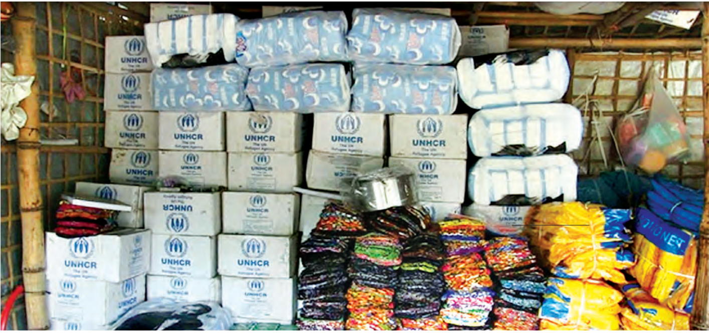
စစ်တွေ ဇူလိုင် ၁၆

ရခိုင်ပြည်နယ် စစ်တွေမြို့နယ်ရှိ ဘင်္ဂါလီ ဒုက္ခသည်စခန်းများတွင် စားဝတ်နေရေး၊ ကျန်းမာရေး၊ လူမှုရေး အခက်အခဲများရှိနေကြောင်း OIC အပါအဝင် နိုင်ငံတကာ အဖွဲ့အစည်းအချို့နှင့် နိုင်ငံတကာ မီဒီယာများက စွပ်စွဲပြောဆိုနေသော်လည်း နိုင်ငံတကာ အဖွဲ့အစည်းများ၊ ကုလသမဂ္ဂ လက်အောက်ခံ အဖွဲ့အစည်းများ၊ ရခိုင်ပြည်နယ် အစိုးရအဖွဲ့တို့မှ လစဉ်ထောက်ပံ့ပေးသည့် ဆန်၊ ဆီ၊ ပဲနှင့် မီးဖိုချောင်သုံးပစ္စည်းများ၊ အဝတ်အထည်များ၊ အမျိုးသမီးအသုံးအဆောင်ပစ္စည်းများ၊ ကလေးအသုံးအဆောင်ပစ္စည်းများ၊ မိုးကာစများမှာ ဒုက္ခသည်များ သုံးစွဲနိုင်သည်ထက် ပိုလျှံနေသည့်အတွက် စစ်တွေမြို့နယ် ဘုမေကျေးရွာအုပ်စု ဒါးပိုင် (ဘင်္ဂါလီ) ကျေးရွာအနီး ကားလမ်းဘေးတွင် ဈေးဆိုင်ခန်းများ ဖွင့်လှစ်ရောင်းချလျက်ရှိ သည်။ အဆိုပါ ဆိုင်များမှာ ၂၀၁၂ ခုနှစ် နောက်ပိုင်းတွင် ပေါ်ပေါက်လာခဲ့ခြင်းဖြစ်ပြီး ထိုဆိုင်များမှ ရောင်းချသည့်ဈေးနှုန်းမှာ အခြားဆိုင်ကြီးများတွင် ရောင်းချသည့် ဈေးနှုန်းများထက် တစ်ဝက်ခန့် သက်သာနေခြင်းကြောင့် လာရောက်ဝယ်ယူမှုများ ရှိနေသည်။ စစ်တွေမြို့နယ်အတွင်း ဘင်္ဂါလီ ဒုက္ခသည်စခန်း၏ မြေပြင်ရှိ လူဦးရေစာရင်းများအား သေချာစွာ စိစစ်ကြပ်မတ်နိုင်မှုအားနည်းခြင်း၊ စိစစ်ရန် ခက်ခဲခြင်း၊ ဒုက္ခသည်စခန်း ကော်မတီဝင် များ၏ တင်ပြသည့်လူဦးရေစာရင်းများကို အခြေခံ၍ နိုင်ငံတကာ အဖွဲ့အစည်းများမှ ထောက်ပံ့ပေး ပစ္စည်းများအားပေးအပ်ခြင်း ပြုလုပ်နေမှုကြောင့် ဒုက္ခသည်စခန်း ကော်မတီဝင်များသည် လိုအပ်သော လူဦးရေထက် ထောက်ပံ့မှုများ ပိုမိုရရှိနေသဖြင့် ပိုလျှံသော အသုံးအဆောင် ပစ္စည်းများကို ပြင်ပသို့ ရောင်းချနေကြောင်း သတင်းများ ပေါ်ထွက်လျက်ရှိသည်။ (သတင်းစဉ်)