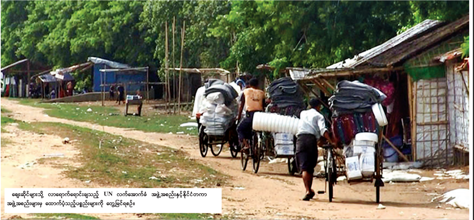
ဈေးဆိုင်များသို့ လာရောက်ရောင်းချသည့် UN လက်အောက်ခံ အဖွဲ့အစည်းနှင့်နိုင်ငံတကာ အဖွဲ့အစည်းများမှ ထောက်ပံ့သည့်ပစ္စည်းများကို တွေ့မြင်ရစဉ်။