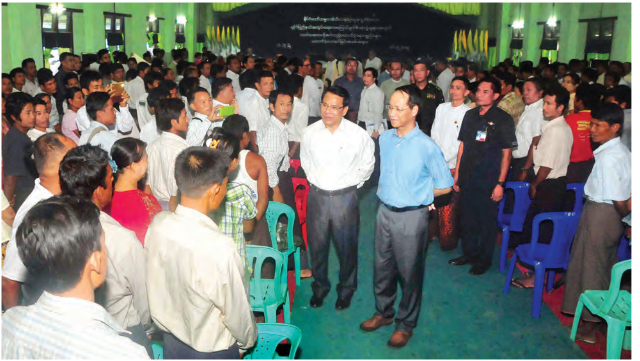
ဒုတိယသမ္မတဒေါက်တာစိုင်းမောက်ခမ်း သံတွဲမြို့မှဒေသခံပြည်သူများအား ရင်းရင်းနှီးနှီးနှုတ်ဆက်စဉ်။

ယင်းနောက် ရခိုင်ပြည်နယ်ဝန်ကြီးချုပ် ဦးမောင်မောင်အုန်းက ရခိုင်ပြည်နယ်အတွင်း ရေဘေးကြောင့် ပျက်စီးဆုံးရှုံးမှုများအပေါ် ဆောင်ရွက်ပေးခဲ့မှုများနှင့် ဆက်လက်ဆောင်ရွက်မည့် အစီအစဉ်များကို