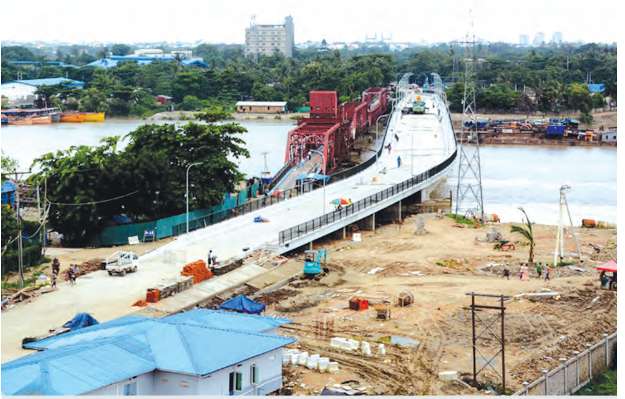
ယခုလကုန်ပိုင်းတွင်ဖြတ်သန်းသွားလာခွင့်ပြုတော့မည့် ငမိုးရိပ်တံတား(မင်္ဂလာတောင်ညွန့်)

“ငမိုးရိပ်တံတား(မင်္ဂလာတောင်ညွန့်) ပြီးတော့မယ်ဆိုတော့ ဦးတော့ဝမ်းသာတယ်။ ခုဆိုရင် ဦးတို့မှာ မင်္ဂလာတောင်ညွန့်တို့၊ တာမွေတို့ဘက်ကို သွားမယ်ဆိုရင် ဟိုသုဝဏ္ဏတံတားဘက်က လှည့်သွားနေရတော့ အချိန်မကြာ သင့်ဘဲ ကြာနေတယ်။ ကားတွေကလည်းကျပ်တော့ ပိုဆိုးတာပေါ့။ ဒီတံတား