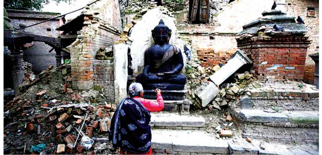
များက ပြောသည်။ အစိုးရသည် ယခုနှစ်အတွင်း ငလျင်ကြောင့် ပျက်စီးသွားသော လူနေအိမ်များ၊ အထိမ်းအမှတ် အဆောက်အအုံများ၊ လူထုနှင့်ဆိုင်သော အဆောက်အအုံများနှင့် အခြေခံအဆောက်အအုံများ ပြန်လည်တည်ဆောက်ရေးအတွက် ဒေါ်လာ သန်း ၉၀၀ အသုံးပြုမည် ဖြစ်သည်။ အပါအဝင် လူသားချင်းစာနာထောက်ထားမှုများ လိုအပ်လျက်ရှိသည်ဟု ကုလသမဂ္ဂက ပြောခဲ့သည်။ (ရိုက်တာ)

ရေပိုက်ပြင်သမား၊ လျှပ်စစ်ကျွမ်းကျင်သူ၊ ပန်းရန်ဆရာအစရှိသဖြင့် လေ့ကျင့်ပေးမည်ဖြစ်သည်။ ဤကဲ့သို့ပြုလုပ်ခြင်းဖြင့် နီပေါနိုင်ငံ၏ အလုပ်သမားလိုအပ်ချက်ကို ဖြည့်ဆည်းပေးနိုင်မည်ဖြစ်သည်။ နီပေါနိုင်ငံတွင် လူငယ်သန်းပေါင်းများစွာတို့မှာ အရှေ့အလယ်ပိုင်းနှင့် အခြားသော အာရှနိုင်ငံများသို့ သွားရောက် အလုပ်လုပ်ကိုင်သည့်အတွက် နိုင်ငံအတွင်း အလုပ်သမားရှားပါးမှုနှင့် ရင်ဆိုင်နေရသည်။ ယခုဘဏ္ဍာနှစ်အတွင်း နိုင်ငံ၏ စီးပွားရေးမှာ သုံးရာခိုင်နှုန်းဖွံ့ဖြိုးတိုးတက်လာပြီး ယင်းမှာ ၂၀၀၇ ခုနှစ်ကတည်းက အနိမ့်ဆုံးတိုးတက်မှုနှုန်းဖြစ်သည်ဟု ဘဏ္ဍာရေးဝန်ကြီးက ပြောသည်။ ပြန်လည်တည်ဆောက်ရေးလုပ်ငန်းများသည် နိုင်ငံ၏စီးပွားရေးကို လာမည့်နှစ်တွင် ခြောက်ရာခိုင်နှုန်းထိ တိုးမြှင့်လာအောင် ဆောင်ရွက်ပေးနိုင်မည်ဟု ဘဏ္ဍာရေးဝန်ကြီးဌာနမှ အရာရှိ