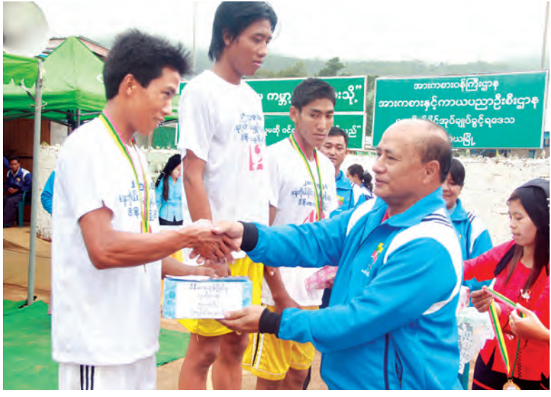
ဒုတိယဝန်ကြီး ဦးဇော်ဝင်း အမျိုးသားမာရသွန်ဆုရရှိသူများအား ဆုချီးမြှင့်စဉ်။

နေပြည်တော် ဇူလိုင် ၁၅ ၂၀၁၅ ခုနှစ် ဓနကိုယ်ပိုင်အုပ်ချုပ်ခွင့်ရဒေသ ဦးစီးဥက္ကဋ္ဌဖလား အမျိုးသား အမျိုးသမီး မိနီမာရသွန်ပြိုင်ပွဲဖွင့်ပွဲကို ဇူလိုင် ၁၄ ရက်က ရှမ်းပြည်နယ် ဓနကိုယ်ပိုင်အုပ်ချုပ်ခွင့်ရဒေသ ပင်းတယမြို့နယ်နှင့် ရွာငံမြို့နယ်၌ကျင်းပရာ မြန်မာနိုင်ငံ အိုလံပစ်ကော်မတီဒုတိယဥက္ကဋ္ဌ အားကစားဝန်ကြီးဌာန ဒုတိယဝန်ကြီး ဦးဇော်ဝင်း တက်ရောက်အမှာစကားပြောကြားသည်။ ရှေးဦးစွာ ဒုတိယဝန်ကြီးသည် နံနက် ၆ နာရီက ပင်းတယမြို့နယ် အားကစားကွင်း ရှေ့၌ကျင်းပသော ဓနကိုယ်ပိုင်အုပ်ချုပ်ခွင့်ရဒေသ ဦးစီးဥက္ကဋ္ဌ ဖလား၊ အမျိုးသား အမျိုးသမီး မိနီမာရသွန်ပြိုင်ပွဲဖွင့်ပွဲအခမ်းအနားသို့ တက်ရောက်၍ ဓနကိုယ်ပိုင်အုပ်ချုပ်ခွင့်ရဒေသ ဦးစီး ဥက္ကဋ္ဌ ဦးထူးကိုနှင့်အတူ မိနီမာရသွန်ပြိုင်ပွဲကို သေနတ်ပစ်ဖောက်၍ ဖွင့်လှစ်ပေးသည်။ ပြိုင်ပွဲများအပြီးတွင် ဆုပေးပွဲအခမ်းအနား ဆက်လက်ကျင်းပရာ ဒုတိယဝန်ကြီးနှင့် ဦးစီး ဥက္ကဋ္ဌတို့သည် ဆုရရှိသူများကို ဆုများချီးမြှင့်ပေးခဲ့ကြောင်း သိရသည်။