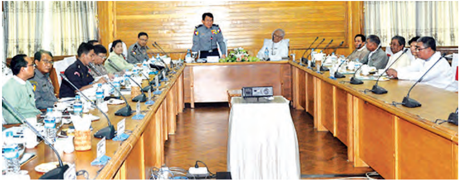
(သတင်းစဉ်)

နေပြည်တော် ဇူလိုင် ၁၅ ပြည်ထဲရေးဝန်ကြီးဌာနနှင့် မြန်မာနိုင်ငံရဲတပ်ဖွဲ့တို့မှ Media Team အဖွဲ့ဝင်များနှင့် မြန်မာနိုင်ငံစာနယ်ဇင်းကောင်စီ(ယာယီ)အဖွဲ့တို့ တွေ့ဆုံဆွေးနွေးပွဲကို ယနေ့နံနက် ၁၀ နာရီက မြန်မာနိုင်ငံရဲတပ်ဖွဲ့ဌာနချုပ် အစည်းအဝေးခန်းမ၌ ကျင်းပရာ မြန်မာနိုင်ငံရဲတပ်ဖွဲ့ရဲချုပ် ရဲချုပ်ဝေဇော်နှင့် မြန်မာနိုင်ငံစာနယ်ဇင်းကောင်စီ(ယာယီ)မှ ဒုတိယဥက္ကဋ္ဌ ဦးခင်မောင်လေး(ဖိုးသောကြာ)တို့ဦးစီး၍ တက်ရောက်ဆွေးနွေးကြသည်။ (ယာပုံ) ဆွေးနွေးပွဲတွင် ပြည်ထဲရေးဝန်ကြီးဌာနနှင့် မြန်မာနိုင်ငံရဲတပ်ဖွဲ့တို့မှ Media Team အဖွဲ့ဝင်များနှင့် မြန်မာနိုင်ငံစာနယ်ဇင်းကောင်စီ(ယာယီ)မှ တာဝန်ရှိသူများက သတင်းမီဒီယာဆိုင်ရာကိစ္စများနှင့်ပတ်သက်၍ ပူးပေါင်းမှုများ မြှင့်တင်ရေး၊ သင်တန်းပို့ချမှုများတွင် အပြန်အလှန်အကူအညီပေးရေး၊ အလုပ်ရုံဆွေးနွေးပွဲများ ကျင်းပရေးဆိုင်ရာများ ဆွေးနွေးခဲ့ကြောင်း သတင်းရရှိသည်။