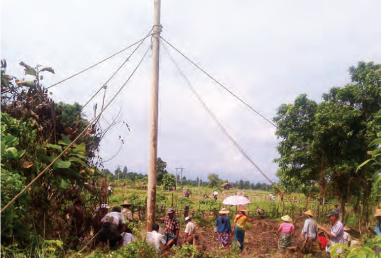
ကာလများက မီးလင်းခြင်းမရှိခဲ့သော်လည်း ရေအတွက် အားသွန်ခွန်စိုက် လုပ်ဆောင်နေကြပြီးဖြစ်ကြောင်း သိရသည်။ ကားလမ်းအနီးရှိ မီးလင်းရေးအတွက် အားသွန်ခွန်စိုက် လုပ်ဆောင်နေကြပြီးဖြစ်ကြောင်း သိရသည်။