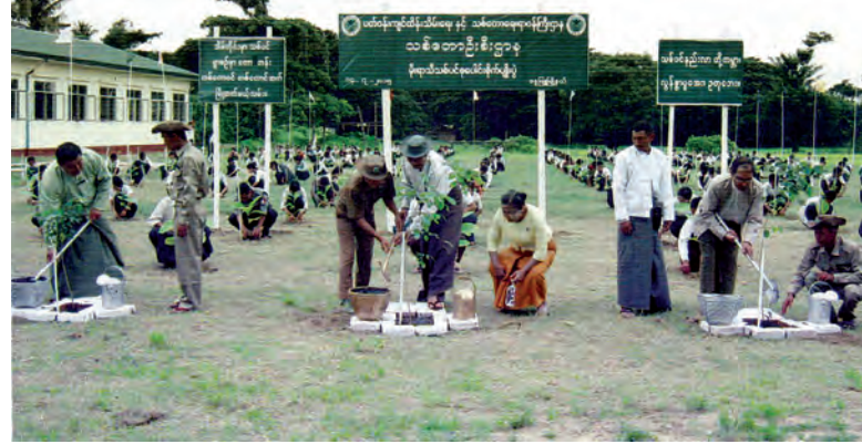
နေပြည်တော်နှင့် ကျောက်တန်းကျေးရွာအုပ်စု ကျောက်တန်းကျေးရွာရှိ အခြေခံပညာအထက်တန်းကျောင်း၌ ဇူလိုင် ၁၄ ရက်က မိုးရာသီသစ်ပင်စိုက်ပျိုးပွဲကျင်းပရာ ကျောင်းသား ကျောင်းသူများက အရိပ်ရသစ်ပင်များ စုပေါင်းစိုက်ပျိုးကြစဉ်။

မုတ်သုံလေ အားကောင်းနေ နေပြည်တော်နှင့် မန္တလေးမြို့တို့ အနီးတစ်ဝိုက်တွင် ယနေ့ နေရာကွက်ကျား မိုးထစ်ချွန်းရွာမည်။ ရန်ကုန်မြို့နှင့် အနီးတစ်ဝိုက်တွင် ယနေ့ မိုးထစ်ကြိမ်၊ နှစ်ကြိမ် ထစ်ချွန်းရွာမည်။ နောက်နှစ်ရက်အတွက်ခန့်မှန်းချက်မှာ မုတ်သုံလေ အားကောင်းနေမည်။