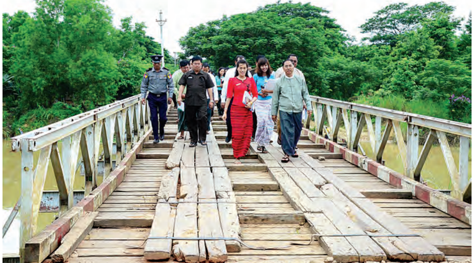
ထို့နောက် မိုင်တိုင်အမှတ်(၃/၇) နှင့် (၄/၀)အကြား အရှည်ပေ ၂၆၀၊ အကျယ် ၃၄ ပေ၊ ယာဉ်သွားလမ်းအကျယ် ၂၈ ပေ၊ ယာဉ်တစ်စီးချင်း ခံနိုင်ဝန်တန် ၆၀ ရှိ ခံနိုင်ရည်ရှိပြီး တံတား တည်ဆောက်ရေးလုပ်ငန်း ခွင့်သို့ သွားရောက်ကြည့်ရှုစစ်ဆေးခဲ့ကြောင်း သတင်းရရှိသည်။ (သတင်းစဉ်)

တိုင်းတာတွက်ချက်၍ တင်ပြရန် မှာကြားသည်။ ဆက်လက်၍ ဝန်ကြီးချုပ်နှင့် အဖွဲ့ဝင်များသည် တိုက်ကြီး-ဥတိုး-ချောင်းသုံးခွ-အဖျောက်လမ်းအတိုင်း ဆက်လက်ထွက်ခွာလာရာ မိုင်တိုင်အမှတ် (၁၁/၀) နှင့် (၁၁/၁)အကြား အရှည် ပေ ၂၂၀၊ အကျယ် ၃၄ ပေ၊ ယာဉ်သွားလမ်းအကျယ် ၂၈ ပေ၊ ယာဉ်တစ်စီးချင်း ခံနိုင်ဝန်တန် ၆၀ ရှိ အင်းလန်တံတားသို့ ရောက်ရှိပြီး တံတားတည်ဆောက်ရေး တာဝန်ခံများက ရှင်းလင်းတင်ပြမှုများအပေါ် ဝန်ကြီးချုပ်က လုပ်ငန်းများအချိန်မီ ပြီးစီးရေးနှင့် သတ်မှတ်စံချိန်စံညွှန်းနှင့်အညီ စနစ်တကျတည်ဆောက်ရန် မှာကြားသည်။