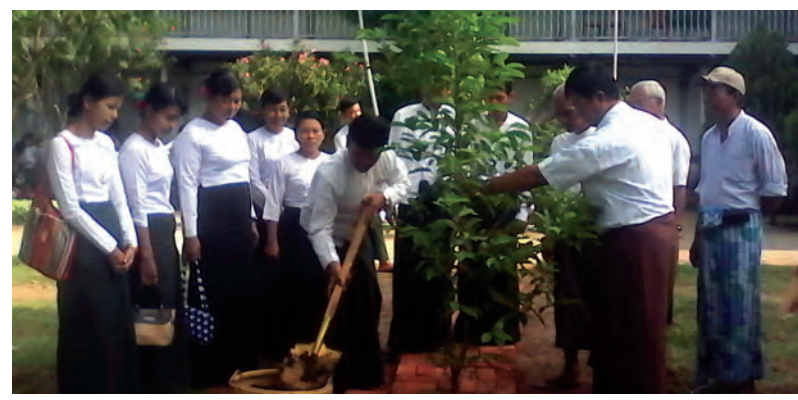
ကျောင်းနှင့်ဝန်းကျင် စိမ်းလန်းစိုပြည်ရေးနေ့ သစ်ပင်စိုက်ပျိုးပွဲကို နေပြည်တော်ကောင်စီနယ်မြေ လယ်ဝေးမြို့ အထက(၂)၌ ဇူလိုင် ၁၂ ရက်က ကျင်းပရာ ကျောင်းအုပ်ဆရာကြီးနှင့် ဆရာ ဆရာမ များ၊ ကျောင်းသား ကျောင်းသူများ စုပေါင်း၍ ကျွန်း၊ ပိတောက်၊ မဲလီ၊ ငှက်စိန်ပန်း၊ ယုကလစ်ပင်များ စိုက်ပျိုးစဉ်။ သက်ထက်

သစ်ပင်စိုက်ပါ တို့ကမ္ဘာ သာယာလှပ စိမ်းမြေ