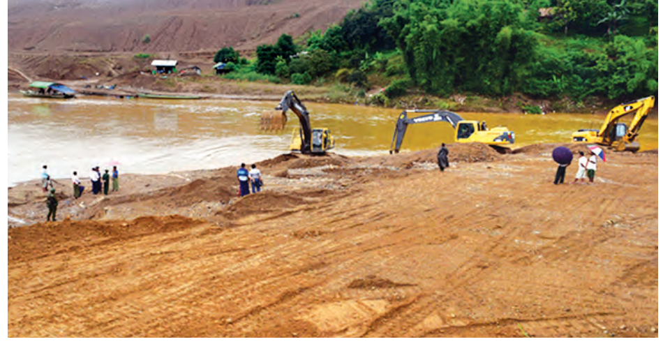
ဖားကန့်မြို့ ရေကြီးရေလွှဲမှုမဖြစ်ပေါ်စေရေးအတွက် ဥက္ကချောင်းအတွင်းရှိ မြေစာများကို စက်ယန္တရားများဖြင့် ဆယ်ယူရှင်းလင်းနေသည်ကို ဇူလိုင် ၁၂ ရက်က တွေ့ရစဉ်။

မြန်အောင် မြို့နယ် တောင်ရိုးအုပ်စု မမြဆည်ရေသောက် ဧရိယာအတွင်းရှိ လယ်မြေများ မိုးရွာသွန်းမှုနည်းပါး၍ လယ်သမားများရာသီအချိန်မီစပါးစိုက်ပျိုးနိုင်ရန် ဇူလိုင် ၈ ရက်ကစ၍ မမြဆည် လက်ဝဲ၊ လက်ယာမြောင်းများမှ ဆည်ရေများ စတင်လွှတ်ပေးလျက်ရှိကြောင်း သိရသည်။ မမြဆည်ရေလျှောက်တစ်စိတ်တစ်ပိုင်း လက်ယာမြောင်းများဖြင့် ဆည်ရေလွှတ်ပေးလျက်ရှိရာ မြင်ဝါးတောင်ကျေးရွာအုပ်စု၊ ငါးဘတ်ကျေးရွာအုပ်စုနှင့် လက်ဝဲတွင်းကျေးရွာအုပ်စုတို့ရှိ မိုးရွာသွန်းမှုနည်းပါး၍ စိုက်ပျိုးရေးလိုအပ်သော လယ်မြေများ ယခုအခါ ထွန်ယက်စိုက်ပျိုးလျက်ရှိကြောင်း သိရသည်။ မြန်အောင်မြို့နယ်ရှိ မမြဆည်သည် နွေစပါးစိုက်ပျိုးချိန်တွင် သာမက မိုးစပါးစိုက်ပျိုးချိန်နှင့် အောင်ရေလိုအပ်ပါကလည်း ဆည်ရေသောက်ဧရိယာအတွင်းရှိ လယ်သမားများ၏ ရေလိုအပ်ချက်ကို ဖြည့်ဆည်းပေးသော တောင်ရိုးဒေသမှ လယ်သမားများ အားကိုးရသည့် ဆည်ကြီးတစ်ခုဖြစ်ကြောင်း သိရသည်။ (မြို့နယ် ပြန်/ဆက်)