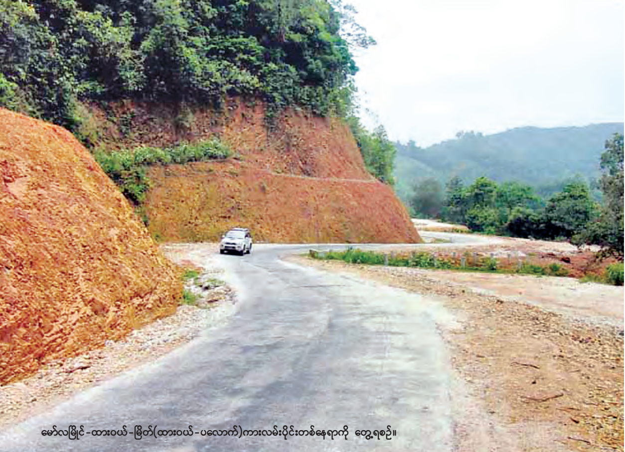
မော်လမြိုင်-ထားဝယ်-မြိတ်(ထားဝယ်-ပလောက်)ကားလမ်းပိုင်းတစ်နေရာကို တွေ့ရစဉ်။

မော်လမြိုင်-ထားဝယ်-မြိတ်အဝေးပြေးကားလမ်းမကြီးမှ (ထားဝယ်-ပလောက်) အပိုင်း ၆၇ မိုင်သည် ၁၉၅၃ ခုနှစ် လွန်ခဲ့သော နှစ်ပေါင်း ၈၀ ခန့်က စတင်ဖောက်လုပ်ထားသော လမ်းတစ်လမ်းဖြစ်သည်။