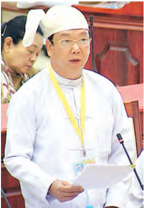
ဒုတိယဝန်ကြီး ဒေါက်တာအောင်မြတ်ဦး ဖြေကြားစဉ်။

သံတွဲမဲဆန္ဒနယ်မှ ပြည်သူ့လွှတ်တော်ကိုယ်စားလှယ် ဦးရဲထွန်း၏ “ပင်လယ် ဒီရေအတက်အကျနှင့် ပင်လယ်လှိုင်းစွမ်းအင်ကို အသုံးပြု၍ မြန်မာ့ကမ်းရိုးတန်း တစ်လျှောက်တွင် လျှပ်စစ်ဓာတ်အားထုတ်လုပ်ရန် သင့်တော်သည့်နေရာ၊ ဒေသရှိပါသလား၊ ရှိပါက မည်သည့်ကာလတွင် လျှပ်စစ်ဓာတ်အား ထုတ်လုပ်နိုင်မည်ကို သိလိုခြင်း” မေးခွန်းနှင့်စပ်လျဉ်း၍ လျှပ်စစ်စွမ်းအားဝန်ကြီးဌာန ဒုတိယဝန်ကြီး ဦးအောင်သန်းဦးက ပင်လယ်မှ လျှပ်စစ်ဓာတ်အားထုတ်ယူနိုင်သည့် နည်းစနစ်များသည် အခြားနည်းဖြင့် ထူးခြားသည့် အခြေအနေရှိမည့် ဓာတ်အားရရှိရန် အခက်အခဲရှိသော