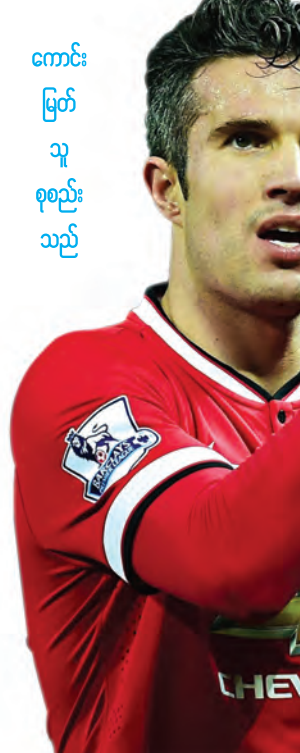
ကောင်း မြတ် သူ စုစည်း သည်

မန်ယူတိုက်စစ်မျိုး ဗန်ပီစီတစ်ယောက် အသင်းသစ်ရှာဖွေနေတာ ကြာပါပြီ။ ပြီးခဲ့တဲ့ရာသီက ဂိုးသွင်းစွမ်းရည်ကျဆင်း ခဲ့တဲ့အတွက် နန်းပြဗန်ဟားလ်က လာ မယ့်ရာသီမှာ မန်ယူမှာဆက်ထားဖို့ ဆန္ဒမရှိခဲ့ ပါဘူး။ ဒီအတွက်ကြောင့်လည်း တိုက်စစ်မျိုး ဗန်ပီစီအနေနဲ့ အသင်းသစ်ပြောင်းရွှေ့ဖို့ ကြိုးစားနေတာပါ။ အခုအခါမှာတော့ အသင်းသစ်တွေသွားပါပြီ။ တူရကီက ဖီနာ ဘာချီအသင်းကို ပြောင်းရွှေ့ဖို့ ဆွေးနွေး နေပါပြီ။ အသက် ၃၁ နှစ်အရွယ် ဗန်ပီစီ ကို တူရကီနိုင်ငံ အစ္စတန်ဘူလ်မြို့ခံ ပရိ သတ်တွေက သူရဲကောင်းသဖွယ် ကြိုဆိုခဲ့ကြပါတယ်။ ၂၀၁၂ ခုနှစ်က အာဆင်နယ်ကနေ ပေါင် ၂၄ သန်း နဲ့ မန်ယူကိုရောက်လာတဲ့ ဗန်ပီစီဟာ ပြီးခဲ့တဲ့ နှစ်က ၁၀ ဂိုးသာ သွင်းယူပေးနိုင်ခဲ့ပါ တယ်။ မန်ယူနဲ့ စာချုပ် တစ်နှစ်တာ ကျန်တော့တဲ့ ဗန်ပီစီက အသင်းမှထွက်ခွာ ဖို့ကြိုးစားခဲ့ပါတယ်။ ဖီနာဘာချီဟာ ကျွန်တော် ကစား ချင်နေတဲ့အသင်းတွေထဲက တစ်သင်းပါပဲလို့ ဗန်ပီစီက ဆိုပါတယ်။ မကြာသေးမီက မန်ယူကစားသမား နာနို ဟာလည်း ဖီနာဘာချီသို့ ပြောင်းသွားခဲ့တာပါ။ အခု ဗန်ပီစီက မန်ယူကနေ ဖီနာဘာချီကို ပြောင်းသွားတဲ့ ခုတိယမြောက်ကစားသမားဖြစ်ပါတယ်။