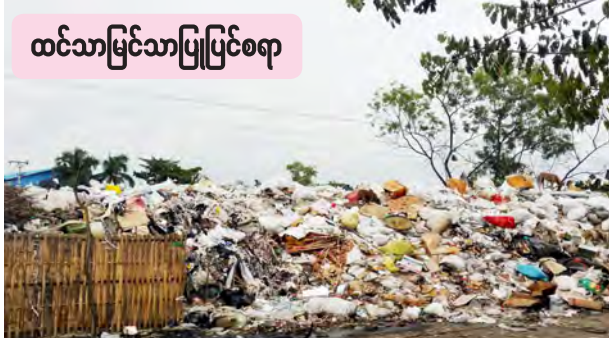
ထင်သာမြင်သာပြင်စရာ ကျဉ်းမြောင်းလာပြီး ရေဆိုးထွက် မြောင်းတွေ ရေစီးရေလာ မကောင်း မွန်တော့ဘူး။ ဒါ့အပြင် စီးပွားဖြစ် ကန်စွန်းရွက် စိုက်ပျိုးခင်းနေရာ ယူလာတာကြောင့် ရေစီးရေလာ မကောင်းဘဲ မြောင်းတွေပိတ်လာ တယ်။ မြောင်းတွေပိတ်လာတော့ ခြင်တွေပေါက်ပွားပြီး သွေးလွန် ကြားသည်။ (၁၈၅)

ရန်ကုန်တိုင်းဒေသကြီး မြောက် ဥက္ကလာပမြို့နယ် ရွှေပေါက်တို စက်မှု ဇုန် မကွာရာမင်းသားကြီးလမ်းနှင့် ကနောင် (၉)လမ်းထောင့် ယခင် စက်မှုဇုန် မီးဘေးကြိုတင်ကာကွယ် ရေး ရေကန်ကြီးအနီးတွင် စက်မှုဇုန် လုပ်ငန်းရှင်များက စွန့်ပစ်သော အမှိုက်များမှာ အမှိုက်ပုံကြီးတစ်ခု အဖြစ် ဖြစ်ပေါ်နေသည်။ ရွှေပေါက်တို စက်မှုဇုန်သည် ရန်ကုန်တိုင်းဒေသကြီး ဖွံ့ဖြိုးတိုး တက်သာယာစည်ပင်လှပလာသည် နှင့်အညီ လုပ်ငန်းပေါင်းစုံနှင့် တိုး တက်ဖွံ့ဖြိုးလာသော စက်မှုဇုန်ဖြစ် ခဲ့ပြီး လူနေမှုမှာလည်း များပြား စည်ကားလာခဲ့သည်။ ဒေသအလိုက် တိုးတက်ဖွံ့ဖြိုးပြီး သာယာလှပရေး အတွက် အဘက်ဘက်မှ ကြိုးပမ်း ဆောင်ရွက်ချိန် မြို့၏ဂုဏ်သိက္ခာ ညှိုးနွမ်းစေမည့် အမှိုက်ပုံကြီးကြောင့် လူမှုရေး၊ ကျန်းမာရေး၊ အပါအဝင် မီးရေးထင်းရေးကိစ္စအဝဝ ကြုံတွေ့ လာရမည့် အန္တရာယ်ကို ဒေသခံ ပြည်သူများက တွေးတောပြီး စိုးရိမ် လျက်ရှိသည်။ လုပ်ငန်းရှင်တစ်ဦးက “ကျွန်တော် တို့ စက်မှုဇုန်မှာနေထိုင်တာ ကြာ ပါပြီ။ အခုအချိန်မှာ လမ်းဘေးဆိုင် တွေက စည်ပင်မြောင်းကို ခွဆောက် ပြီး နေရာယူလာတဲ့အတွက် လမ်း