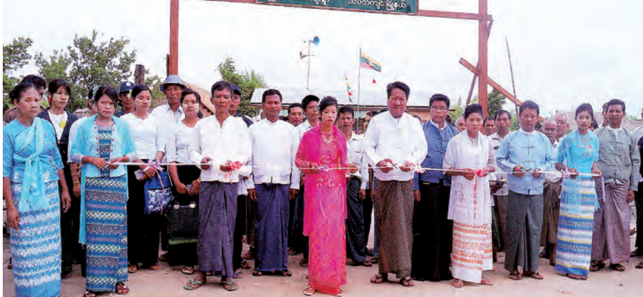
(မန္တလေးမျဉ်းဖြောင့်များ အခန်းဆက်ဆောင်းပါးကို အပတ်စဉ် ဗုဒ္ဓဟူးနေ့တိုင်း ဖော်ပြပါမည်)

သပိတ်ကျင်း ဇူလိုင် ၁၄ မန္တလေးတိုင်းဒေသကြီး သပိတ်ကျင်းမြို့နယ် မြိုင်သာယာကျေးရွာ အခြေခံပညာမူလတန်းကျောင်းဖွင့်ပွဲအခမ်းအနားကို ဇူလိုင် ၁၁ ရက်က အဆိုပါကျေးရွာရှိ အခြေခံပညာမူလတန်းကျောင်းအတွင်း၌ ကျင်းပခဲ့သည်ဟု သိရသည်။