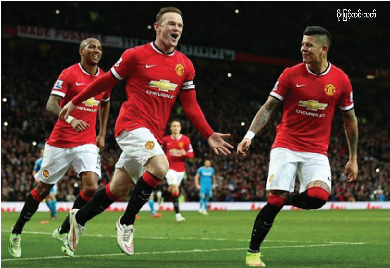
မိုးမြင့်လင်းလတ်

အေစီမီလန်နှင့် အင်တာမီလန် ရာသီအကြိုခြေစမ်းပွဲတွေအဖြစ် ဆက်တိုက်ကစားနေတဲ့ အေစီမီလန် ဟာ အယ်စီယိုနီနဲ့ လီဂါနိုအသင်း တွေကို နိုင်ပွဲရအောင်ကစားခဲ့သလို ခြေစွမ်းပိုင်းလည်း ကောင်းမွန်နေ ပါတယ်။ ကစားသမားအသစ်တွေ ခေါ်ယူထားတဲ့ အေစီမီလန်ဟာ ပြီးခဲ့တဲ့ရာသီက စီးရီးအေရလဒ်ဆိုးကို ချေဖျက်နိုင်ဖို့အတွက် အကောင်းဆုံး အခင်းအကျင်း၊ ဦးစားပေးပွဲထွက် ကစားသမားတွေနဲ့ ပွဲတိုင်း ရလဒ် ကောင်းဖို့ကြိုးစားနေပါတယ်။ အင် တာမီလန်တို့ကလည်း ရာသီအကြို ခြေစမ်းပွဲတွေမှာ ရလဒ်ကောင်းလိုက်၊ မကောင်းလိုက်ဖြစ်နေပြီး ခြေစွမ်း အထိုင်ကျဖို့ ကြိုးစားနေတဲ့အနေ အထားဖြစ်ပါတယ်။ အင်တာမီလန် တို့က တစ်ဦးချင်းစွမ်းရည်မြင့်မားတဲ့ ကစားသမားတွေရှိပေမယ့် စုစည်း မှုနဲ့ အသင်းလိုက်ကစားအားမှာ နားလည်မှု လွဲချော်နေတာတို့တို့ ရလဒ်ကောင်းတွေ ပိုင်ဆိုင်ဖို့ အား ထုတ်ရန်ကန့်သတ်နေရတဲ့ ဖြစ်ပါတယ်။ ဒီပွဲကတော့ ရာသီအကြိုပြိုင်ပွဲဖြစ် တာမို့ ဂုဏ်သိက္ခာအတွက် ကစား သမားတွေရဲ့ အားထုတ်မှု ဘယ်