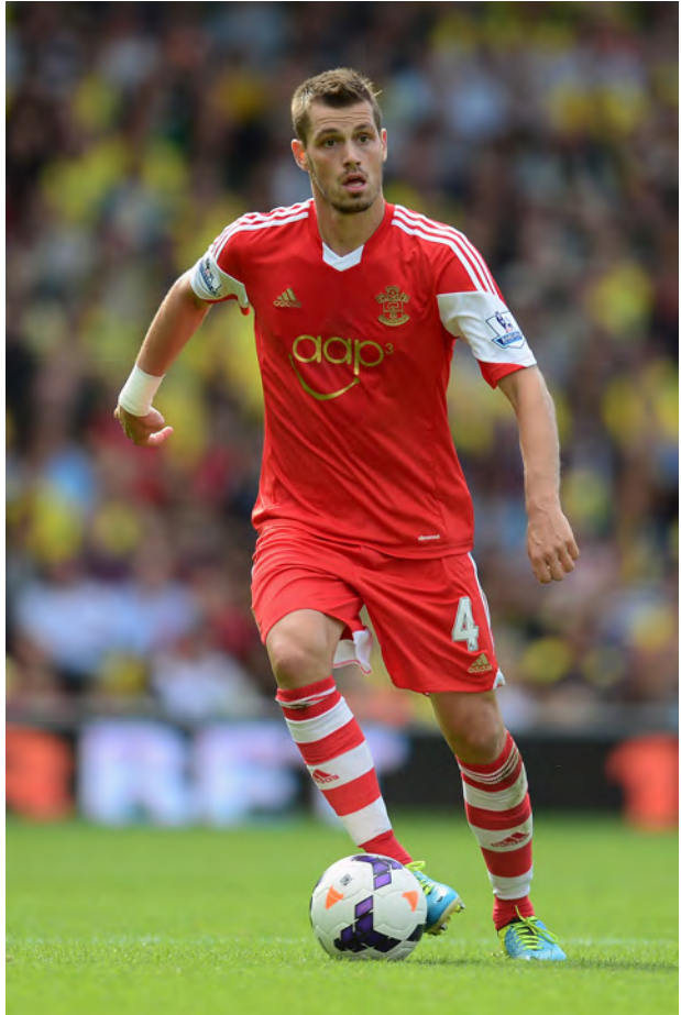
သို့ပေမယ့် ဒီဂီယာကို ရိုးရဲမက်ဒရစ် က ခေါ်ယူနိုင်တဲ့ အခြေအနေကြောင့်

မန်ယူက ကွင်းလယ်ကစားသမား ကောင်း နှစ်ဦးကို တစ်ပြိုင်တည်း ခေါ်ယူလိုက်တဲ့ သဘောပါပဲ။ မန်ယူဟာ PSV တိုက်စစ်မျိုး ဒီပေး နဲ့ တိုရီနို နောက်တန်းကစားသမား မတ်တီယို ဒါမိန်းတို့ကိုလည်း ခေါ်ယူ ခဲ့ပါတယ်။ လာမယ့်ရာသီမှာတော့ ဗန်ဟားလ်ရဲ့ မန်ယူအသင်းဟာ တောင့်တင်းခိုင်မာတဲ့ အသင်းဖြစ် လာမယ့်အနေအထားရှိနေပါတယ်။