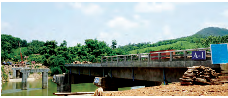
တံတားအမှတ်(၃/၄၇) ကလိန်အောင် တံတားတို့ကို ကြည့်ရှုစစ်ဆေးပြီး လိုအပ်သည်များကို တာဝန်ရှိသူများ အား မှာကြားကာ တည်ဆောက် ပြီးစီးပြီဖြစ်သည့် ထားဝယ်ခရိုင် ရေဖြူမြို့နယ် ရေဖြူတံတားကို ကြည့်ရှုစစ်ဆေးခဲ့ကြောင်း သိရသည်။ (တိုင်းဒေသကြီး မြန်/ဆက်)

ထားဝယ် ဇူလိုင် ၁၂ တနင်္လာရက်နေ့တွင် ဝန်ကြီးချုပ် ဦးမြတ်ကိုသည် ဇူလိုင် ၁၀ ရက်က တိုင်းဒေသကြီး လမ်းပန်းဆက်သွယ်ရေးဝန်ကြီး၊ တိုင်းဒေသကြီး ဥပဒေ ချုပ်နှင့်အဖွဲ့ ထားဝယ်-မလွဲတောင် လမ်းအပိုင်းရှိ လမ်းနှင့်တံတားများကို ကြည့်ရှုစစ်ဆေးခဲ့ကြောင်း သိရသည်။ ထို့နောက် ဝန်ကြီးချုပ်သည် ထားဝယ်ခရိုင် ကလိန်အောင်မြို့ ရန်ကုန်-မြိတ်လမ်းပေါ်ရှိ တိုင်းဒေသကြီးရန်ပုံငွေဖြင့် တည်ဆောက်လျက် ရှိသော မိုင်တိုင်(၄၆/၃) တံတား အမှတ် (၃/၄၇)၊ တံတားဖြူတံတား နှင့် မိုင်တိုင် (၄၆/၀ မှ ၄၆/၂ )