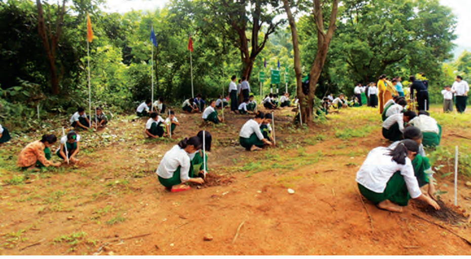
သံတောင်ကြီးမြို့နယ် သံတောင်မြို့၊ ဥသျှစ်ကုန်းကျေးရွာ အလကကျောင်း၌ ဇူလိုင် ၁၂ ရက်က ကျောင်းနှင့် ဝန်းကျင်စိမ်းလန်းစိုပြည်ရေး သစ်ပင်စိုက်ပျိုးရေးပရောဂျက်အဖြစ် ဌာနဆိုင်ရာများ၊ အမျိုးသမီးရေးရာအဖွဲ့၊ မိခင်နှင့်ကလေး စောင့်ရှောက်ရေးအသင်း၊ ဆရာ ဆရာမများနှင့် ကျောင်းသား ကျောင်းသူများက ပူးပေါင်းပူးပေါင်းစိုက်ပျိုးကြသည်။ (၁၁၅)