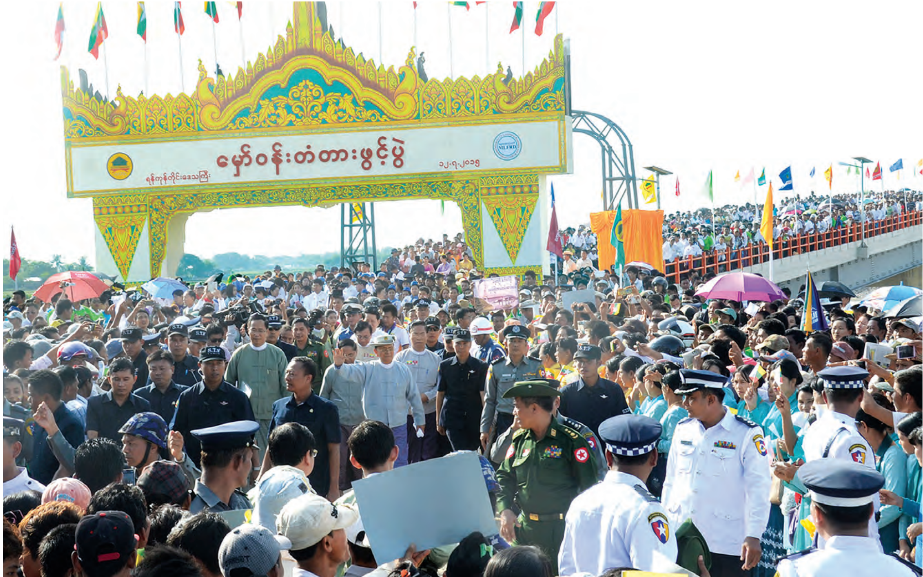
နိုင်ငံတော်သမ္မတ ဦးသိန်းစိန် မှော်ဝန်းတံတားဖွင့်ပွဲအခမ်းအနားတွင် ဒေသခံပြည်သူများအား ရင်းရင်းနှီးနှီးနှုတ်ဆက်စဉ်။ (သတင်း၊ စာမျက်နှာ-၈) (သတင်းစဉ်)

နိုင်ငံတော် ဝန်ကြီးချုပ်တိုက်ခိုက်ခံရသော်လည်း နှစ်နိုင်ငံ ချစ်ကြည်ရေးကို အထိခိုက်ခံမည်မဟုတ်ဟုဆို စာမျက်နှာ ❖ ၄ ကျေးဆုံးဖြန်း ကြက်ပျံမကျတိုးမပေါက်အောင် စည်ကားသိုက်မြိုက် ခဲ့သည့် မှော်ဝန်းတံတားဖွင့်ပွဲကြားက ဝမ်းသာပီတိ စကားသံများ စာမျက်နှာ ❖ ၇ ပြည်တွင်း မြန်မာ့အမွေအနှစ်၊ ရိုးရာယဉ်ကျေးမှုနှင့် လက်မှုအနုပညာတွေကို ကမ္ဘာကသိအောင် စွမ်းဆောင်သွားမယ် စာမျက်နှာ ❖ ၁၀