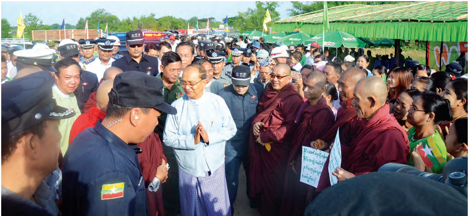
နိုင်ငံတော်သမ္မတ ဦးသိန်းစိန် မှော်ဝန်းတံတားဖွင့်ပွဲတွင် ရဟန်းသံဃာတော်များနှင့် ဒေသခံပြည်သူများအား ရင်းရင်းနှီးနှီး နှုတ်ဆက်စဉ်။

နောင်ရှာဖွေတွေ့ရှိသည့် သဘာဝဓာတ်ငွေ့များကိုလည်း ပြည်တွင်း လျှပ်စစ်ဓာတ်အား ထုတ်လုပ်ရေးအတွက် အဓိကထားအသုံးပြုသွားမည်ဖြစ်ကြောင်း၊ ကျောက်မီးသွေးအသုံးပြုရာ၌ မိမိပျက်စီးခြင်းမရှိစေရန်အတွက် လေ့လာတွေ့ရှိခဲ့သည့် သဘာဝဓာတ်ငွေ့ကို ထိခိုက်မှုမရှိအောင် ဆုံးဖြင့် လျှပ်စစ်ဓာတ်အားထုတ်လုပ်သည့် နည်းစနစ်များကို အသုံးပြုသွားမည်ဖြစ်ကြောင်း၊ ဂျပန်နိုင်ငံတွင် ကျောက်မီးသွေးစက်ရုံများ ပတ်ဝန်းကျင်၌ မြို့ရွာများ၊ စိုက်ပျိုးရေးမြို့ရေ