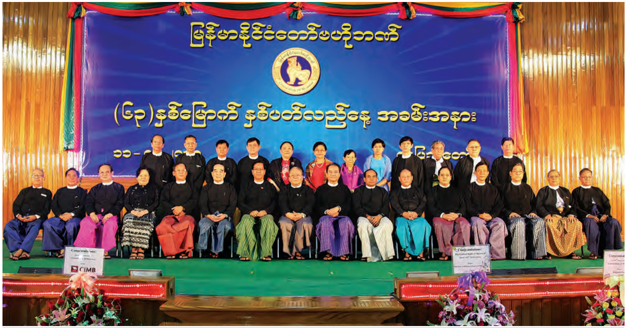
မြန်မာနိုင်ငံတော်ဗဟိုဘဏ် (၆၃) နှစ်မြောက် နှစ်ပတ်လည်နေ့ ဂုဏ်ပြုညစာစားပွဲအခမ်းအနားတွင် ပြည်ထောင်စုဝန်ကြီးနှင့်တက်ရောက်လာသူများ စုပေါင်းမှတ်တမ်းတင်ဓာတ်ပုံရိုက်စဉ်။

အခမ်းအနားသို့ သမ္မတရုံးဝန်ကြီးဌာန ပြည်ထောင်စုဝန်ကြီး ဦးလှထွန်းနှင့်ဇနီး၊ မြန်မာနိုင်ငံတော်ဗဟိုဘဏ်ဥက္ကဋ္ဌ ဦးကျော်ကျော်မောင်၊ ပြည်ထောင်စု ရွှေနေ့ချုပ် ဒေါက်တာထွန်းရှင်၊ မြန်မာနိုင်ငံတော်ဗဟိုဘဏ် ဒုတိယဥက္ကဋ္ဌ များ၊ ဘဏ္ဍာရေးဝန်ကြီးဌာန ဒုတိယဝန်ကြီး ဒေါက်တာလင်းအောင်၊ မြန်မာ နိုင်ငံတော်ဗဟိုဘဏ် ဒါရိုက်တာအဖွဲ့ဝင်များ၊ မြန်မာနိုင်ငံတော်ဗဟိုဘဏ်မှ အငြိမ်းစားဥက္ကဋ္ဌနှင့် ဒုတိယဥက္ကဋ္ဌများ၊ အရာရှိကြီးများ၊ နိုင်ငံခြားဘဏ်များ၊ ကိုယ်စားလှယ်ရုံးခွဲများမှ ဖိတ်ကြားထားသော ဧည့်သည်တော်များ၊ ၂၀၁၄-၂၀၁၅ ပညာသင်နှစ်တွင် တက္ကသိုလ်ဝင်စာမေးပွဲ၌ ဆုရရှိကြသည့် ကျောင်းသား ကျောင်းသူများ၊ မိဘများနှင့် ဖိတ်ကြားထားသူ ဧည့်သည်တော် များ တက်ရောက်ကြသည်။ (သတင်းစဉ်)