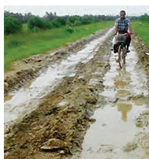
မော်လမြိုင်ကျွန်း မြို့နယ်နှင့် ဘိုကလေးမြို့နယ် လမ်းပန်းဆက်သွယ်ရေးတွင် အရေးပါသော ကျွဲခြံ

ရေကျော် မြစ်ကူး တံတား ကြီး ကို တည်ဆောက် လျက် ရှိရာ ပြီးစီးသွား ပါက မော်လမြိုင် ကျွန်း- ဘိုကလေး- ဖျာပုံ- ဒလ(ရန်ကုန်) အဝေးပြေး ဆက် သွယ်ရေး လမ်းနှင့် မော်လမြိုင်ကျွန်း-ဘို ကလေး-ကဒုံကန် (ပင်လယ်ပိုင်း) အဝေးပြေး ဆက်သွယ်ရေးလမ်း များဖြင့် ရန်ကုန်နှင့်ပင်လယ်ပိုင်း