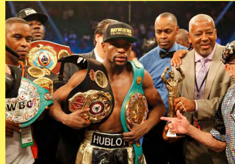
ချန်ပီယံခါးပတ်များကို ရယူထားခြင်းကြောင့် WBO မှ ချမှတ်ထားသည့် စည်းမျဉ်းနှင့် ကိုက်ညီမှု မရှိကြောင်း သတင်းများတွင် ဖော်ပြထားသည်။ မေဝဲလ်သာသည် WBA နှင့် WBC ဝယ်လ်တာ

WBO မှ ချမှတ်ထားသည့် စည်းမျဉ်းတွင် လက်ဝှေ့ သမား တစ်ဦးသည် ဝိတ်တန်းတစ်ခုတည်းတွင်သာ ချန်ပီယံခါးပတ် ရယူခွင့်ရှိသည်ဟု သတ်မှတ်ထားသည်။ သို့သော်လည်း မေဝဲလ်သာသည် WBA နှင့် WBC လိုက်မစ်ဒယ်ဝိတ်တန်း