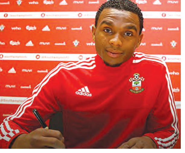
ကောင်းမြတ်သူ - စုစည်းသည်

ဒန်နီအယ်လ်ဗက်က ဆိုပါတယ်။ သို့ပေမယ့် ဘရာဇီးဘောလုံး တာဝန်ရှိသူတွေက နိုင်ငံခြားသား နည်းပြတွေကို ကြောက်ရွံ့နေတယ်လို့ အယ်လ်ဗက်က ဆိုပါတယ်။ ဂွါဒီယိုလာဟာ ဘရာဇီးအသင်း ချန်ပီယံဖြစ်ဖို့ နည်းဗျူဟာတွေရှိထားတယ်လို့ အသက် ၃၂ နှစ်အရွယ် ဘရာဇီးနောက်တန်းကစားသမား အယ်လ်ဗက်က ထပ်လောင်းပြောဆိုလိုက်ပါတယ်။ ဂွါဒီယိုလာရဲ့ လက်ထက်မှာ ဘာစီလိုနာအသင်းဟာ လေးနှစ်တာအတွင်း ဖလား ၁၄ လုံး ဆွတ်ခူးပေးနိုင်ခဲ့ပါတယ်။ ဒီအထဲမှာ ချန်ပီယံလိဂ်ဖလား နှစ်လုံးလည်း အပါအဝင် ဖြစ်ပါတယ်။ သူဟာ ၂၀၁၂ ခုနှစ် ဇွန်လက ဘိုင်ယန်မြူးနစ်ကို ပြောင်းရွှေ့သွားခဲ့ပါတယ်။ ဂျာမနီမှာလည်း နှစ်နှစ်ဆက်တိုက် ဖလားဆွတ်ခူးပေးနိုင်ခဲ့ပါတယ်။ အသက် ၄၄ နှစ်အရွယ်ရှိပြီဖြစ်တဲ့ ဂွါဒီယိုလာဟာ ကမ္ဘာမှာ အကောင်းဆုံးနည်းပြလို့ အယ်လ်ဗက်က ဆိုပါတယ်။