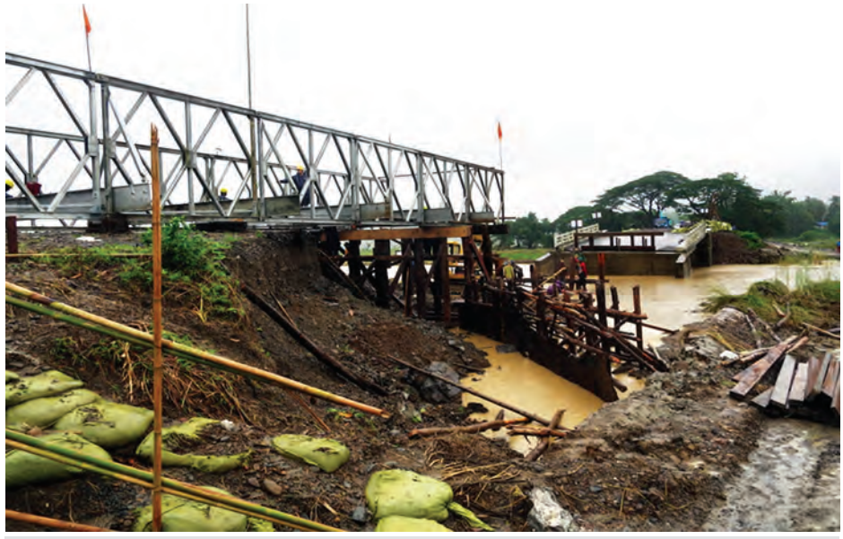
သံတွဲ-ဝှံလမ်း မိုင်တိုင် (၂၆/၆) မှ (၂၇/၁) အကြား တံတားအမှတ် (၁၀/၂၇) ပေ ၄၀ ကွန်ကရစ် တံတားပျက်စီးခဲ့သည့်အတွက် ယာယီဘေလီတံတား အစားထိုးတည်ဆောက်ရေးလုပ်ငန်းများကို တွေ့ရစဉ်။