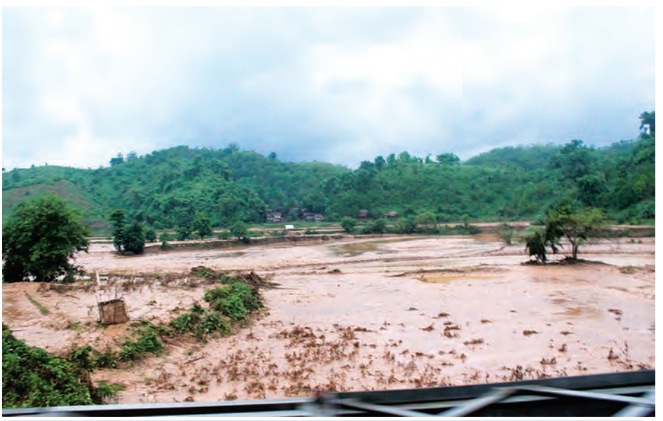
ရခိုင်ပြည်နယ်အတွင်း မိုးသည်းထန်စွာ ရွာသွန်းမှုကြောင့် လယ်ယာမြေများ ပျက်စီးမှုအခြေအနေများကို တွေ့ရစဉ်။