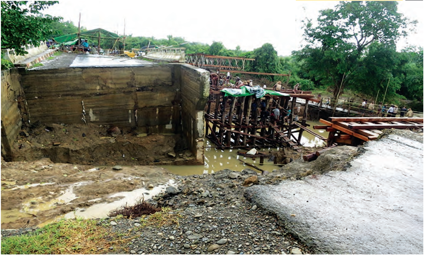
ရခိုင်ပြည်နယ်အတွင်း မိုးသည်းထန်စွာ ရွာသွန်းမှုကြောင့် တောင်ကုတ်-မအိ လမ်းပေါ်ရှိ ငှက်ပျောချောင်းတံတား၊ မအိဘက်ခြမ်းရေတိုက်စားသဖြင့် လမ်းပြတ်တောက် သွားခဲ့ပြီး ကမ်းကပ်ခိုခိုမဲ့ကျသွားသဖြင့် ယာယီဘေလီတံတားအစားထိုးတည်ဆောက်နေမှုကို တွေ့ရစဉ်။

ထိုသို့ ပျက်စီးဆုံးရှုံးမှုများကို ပြန်လည်ပြုပြင်နိုင်ရန် နိုင်ငံတော်က ရခိုင်ပြည်နယ် သဘာဝဘေးအန္တရာယ် ကယ်ဆယ်ရေး၊ ပြန်လည်ပြုပြင်တည်ဆောက်ရေး အတွက် ငွေကျပ် ၃ ဒသမ ၂၁၆ ဘီလီယံ ခွင့်ပြုပေးခဲ့ရာ လမ်းတံတားလုပ်ငန်းများတွင် ငွေကျပ် ၁၆၄၉ ဒသမ ၉၆ သန်း၊ စိုက်ပျိုးရေးဆိုင်ရာများတွင် ငွေကျပ် ၆၀ ဒသမ ၄ သန်း၊ အိမ်ရာဆောက်လုပ်ရေးလုပ်ငန်းများတွင် ငွေကျပ် ၈၉၁ ဒသမ ၁ သန်း၊ ရေကာတာလုပ်ငန်းများတွင် ငွေကျပ် ၄၅ သန်း၊ ပညာရေးဆိုင်ရာများတွင် ငွေကျပ် ၈၇ ဒသမ ၄ သန်း၊ သာသနာရေးဆိုင်ရာများတွင် ငွေကျပ်သန်း ၁၀၀၊ ကျန်းမာရေးဆိုင်ရာများတွင် ငွေကျပ်သန်း ၅၀ နှင့် မွေးမြူရေးဆိုင်ရာများတွင် ငွေကျပ် ၃၃၂ ဒသမ ၈၃ သန်းတို့ဖြင့် ကယ်ဆယ်ရေးနှင့် ပြန်လည်ပြုပြင်တည်ဆောက်ရေးလုပ်ငန်းများ ဆောင်ရွက်လျက် ရှိသည်။