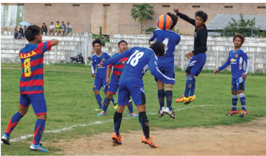
အမှာစကားပြောကြားပြီး ပြိုင်ပွဲကို လားဟူလူငယ်ဘောလုံးအသင်း ခုနစ်ဖွင့်လှစ်ပေးသည်။ သင်း ပါဝင်ယှဉ်ပြိုင်ကြပြီး အုပ်စုအဆိုပါ ဘောလုံးပြိုင်ပွဲတွင် နှစ်စုခွဲကာ ဇူလိုင် ၈ ရက်အထိ ယှဉ်ပြိုင်သွားမည်ဖြစ်ကြောင်း သိရသည်။