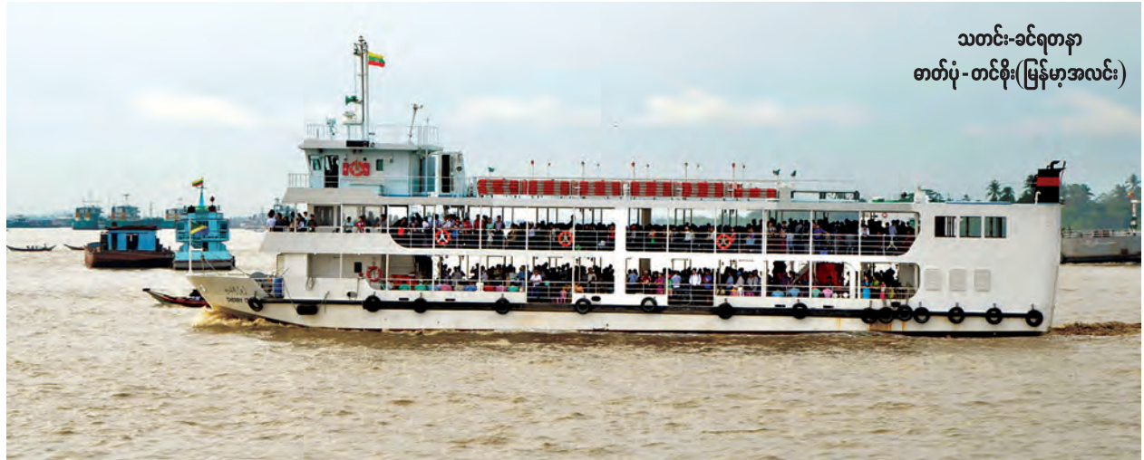
သတင်း-ခင်ရတနာ

ပေးခဲ့ရပြီး ယခု ချယ်ရီသင်္ဘောများ ကြောင့် တစ်နေ့လျှင် အခေါက်ရေ ၅၀ ခန့်စီ တိုးမြှင့်ပို့ဆောင်ပေးနိုင်ခဲ့ကြောင်း သိရသည်။ “တစ်နေ့ကို အသွား၊ အပြန် လူဦးရေ သုံးသောင်းခန့် စီးနင်းကြပါတယ်။ ယခင်ကထက် ပိုပြီး စီးနင်းလာကြတာကို တွေ့ရတယ်။ ကုန်ကျစရိတ်အားဖြင့် တစ်နေ့ကို ဆီဂါလန် ၂၀၀ လောက်ကုန်ပါတယ်။ အခြားအထွေထွေစရိတ်တွေနဲ့ ဆိုရင် တစ်စင်းကို တစ်ရက်အတွက် ငွေကျပ်ရှစ်သိန်းနီးပါး ကုန်ပါတယ်။ ချယ်ရီသင်္ဘောတွေက ဂျပန် နိုင်ငံ JICA ရဲ့ကူညီပံ့ပိုးမှုဖြစ်ပေမယ့်