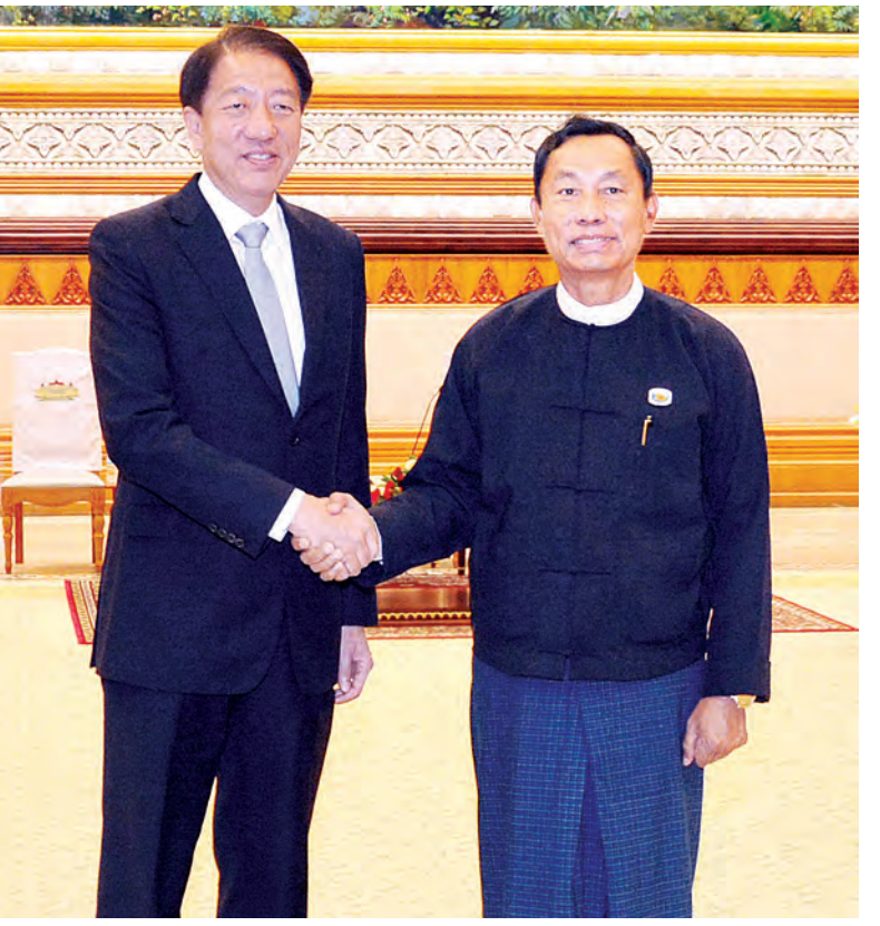
ပြည်သူ့လွှတ်တော်ဥက္ကဋ္ဌ သူရဦးရွှေမန်းနှင့် စင်ကာပူသမ္မတနိုင်ငံ ဒုတိယဝန်ကြီးချုပ် အမျိုးသားလုံခြုံရေးဆိုင်ရာ ပူးပေါင်းညှိနှိုင်းရေးနှင့် ပြည်ထဲရေးဝန်ကြီး မစ္စတာ တိုချီဟန်းတို့ ရင်းရင်းနှီးနှီး နှုတ်ဆက်စဉ်။ (သတင်းစဉ်)

စင်ကာပူသမ္မတနိုင်ငံ ဒုတိယဝန်ကြီးချုပ်နှင့်အဖွဲ့သည် ယနေ့နံနက်ပိုင်းက ပထမအကြိမ် ပြည်ထောင်စုလွှတ်တော် (၁၂)ကြိမ်မြောက် ပုံမှန်အစည်းအဝေး၏ (၆၆)ရက်မြောက်နေ့ အစည်းအဝေးကျင်းပနေမှုကို လေ့လာကြည့်ရှုကြသည်။ (သတင်းစဉ်)