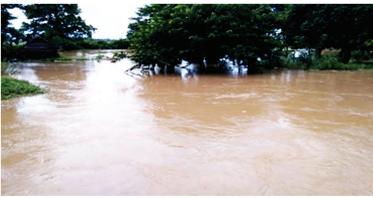
ကားတွေကြည့်လိုက်ရင်လည်း ခရီးသည်ကိုမပါတော့ဘူး။ ရွာတွေမှာဆို လမ်းတွေအတော်ပျက်ကုန်တာတွေ့ရတယ်” ဟု မြို့ခံတစ်ဦးကပြောသည်။ မိုးရွာသွန်းခြင်းကြောင့် စပါးစိုက်ပျိုးမည့် တောင်သူများအတွက် များစွာအဆင်ပြေကာ နှမ်းရိတ်သိမ်းလျက်ရှိသည့် တောင်သူများအခက်အခဲကြုံနေရသည်ကို ကိုလွင်(ဆွာ)

ရေတာရှည် ဇူလိုင် ၁ တစ်နိုင်လုံး အတိုင်းအတာဖြင့် ရက်ဆက်ရွာသွန်းခဲ့သော မိုးကြောင့် ရေကြီးရေလျှံမှုများ နေရာအနှံ့အပြား၌ ဖြစ်ပွားခဲ့သော်လည်း ပဲခူးတိုင်း ဒေသကြီး ရေတာရှည်မြို့နယ်ရှိ ကျေးရွာအချို့တွင် မြစ်ချောင်းမှ ရေများ ဝင်ရောက်မှုသာရှိခဲ့ပြီး စပါး စိုက်ခင်းများ ပျက်စီးဆုံးရှုံးမှု မရှိ ကြောင်း သိရသည်။ လေးရက်ကြာအဆက်မပြတ်ရွာ သွန်းခဲ့သော မိုးများကြောင့် ခရီး သွားလာသူ နည်းပါးကာ ခရီးသည် တင်ယာဉ်များလည်း အခက်တွေ့ရပြီး ဈေးရောင်း၊ ဈေးဝယ်သူများ အရောင်းအဝယ်သိသာစွာ ကျဆင်း ခဲ့သည်ကို တွေ့ရသည်။ “မိုးကနေ့ရော၊ ညပါရွာနေတော့ လူတွေကအပြင်မထွက်ကြတော့ဘူး။ လက်ဖက်ရည်ဆိုင်တွေ၊ အသားငါး ကုန်စုံရောင်းတဲ့သူတွေကအစ လုံးလုံး ကို အရောင်းအဝယ်ရပ်ကုန်တယ်။