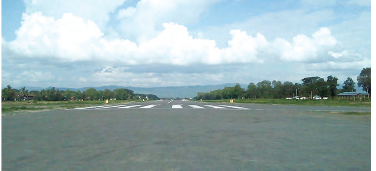
ပြေးလမ်းသည် အရှည်ပေ ၅၅၀၀၊ အကျယ်ပေ ၁၀၀ ၊ ကျောက်ကတ္တရာအထူ ၁၈ လက်မဖြင့် အဆင့်မြင့်တင်တည်ဆောက်မှုပြီးစီးကာ ခံနိုင်ဝန်အား ၇၃၀၀၀ ပေါင်ရိပ်ပြီး လေယာဉ်ပြေးလမ်းဦးတည်ရပ်မှာ ၉၀ ဒီဂရီ နှင့် ၂၇၀ ဒီဂရီ အရှေ့မှ အနောက်သို့ဦးတည်လျက်ရှိကြောင်း သိရသည်။ ဂျူနိုင်း

စစ်ကိုင်းတိုင်းဒေသကြီးအထက်ပိုင်းရှိ ကလေးမြို့လေယာဉ်ကွင်းကို ၁၉၄၅ ခုနှစ်တွင်အလျား ၂၄၀၀ ပေ၊ အကျယ် ၁၀၀ ပေ အမာခံမြေသားပြေးလမ်းအဖြစ် စတင်တည်ဆောက်ခဲ့ပြီး ၁၉၉၈ ခုနှစ် ဖေဖော်ဝါရီ ၂၅ ရက်တွင် လေယာဉ်