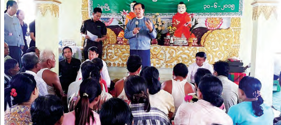
ပဲခူး ဇူလိုင် ၁ ပဲခူးမြို့၊ ဥဿာမြို့သစ်(၁) ရပ်ကွက် မြေတိုင်း(၂) နန်းဦးစေတီ ဘုရားဝင်းအတွင်းရှိ ဓမ္မာရုံ၌ ဇွန် ၃၀ ရက်က လေဘေးသင့်ပြည်သူများ အား ထောက်ပံ့ငွေနှင့်ကယ်ဆယ်ရေး ထောက်ပံ့ပစ္စည်းများ ပေးအပ်လှူဒါန်း ပွဲအခမ်းအနား ကျင်းပခဲ့သည်။

ကျော်ဦး၊ တိုင်း/ ခရိုင်/ မြို့နယ်ဌာန ဆိုင်ရာများ၊ အလှူရှင်များနှင့် လေဘေးသင့်ပြည်သူများ တက် ရောက်ကြသည်။ လေဘေးသင့်အိမ်ထောင်စုများ ထံသို့ တိုင်းဒေသကြီး ဝန်ကြီးချုပ်နှင့် ဝန်ကြီးများ၊ ဌာနဆိုင်ရာတာဝန်ရှိ သူများနှင့်အလှူရှင်များက ထောက်ပံ့ ငွေများနှင့် ကယ်ဆယ်ရေးနှင့် ထောက်ပံ့ပစ္စည်းများ ပေးအပ်လှူဒါန်း ကြကြောင်းနှင့် ဇွန် ၂၅ ရက်တွင် မိုးသည်းထန်စွာရွာသွန်းပြီး လေပြင်း တိုက်ခတ်၍ ပဲခူးမြို့အတွင်းရှိ မင်း၊ ရပ်ကွက်ကြီး(၁)၊ ရပ်ကွက်ကြီး(၃) တို့တွင် အိမ်ခြေ ၁၂၆ လုံး အိမ်ခေါင် မိုးလန်ခြင်း၊ အိမ်ပြိုခြင်း၊ သစ်သား လျှပ်စစ်တိုင်များပြိုလဲခြင်း၊ သစ်ပင် များ လဲပြိုခြင်းများဖြစ်ပေါ်ခဲ့ကြောင်း သိရသည်။ (သန့်စင်)ပဲခူး