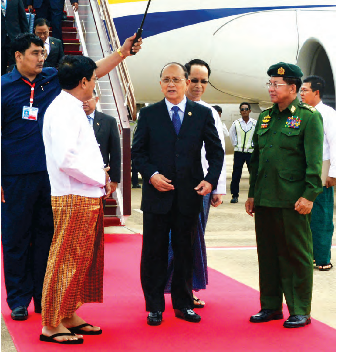
နိုင်ငံတော်သမ္မတ ဦးသိန်းစိန်အား ဒုတိယသမ္မတ ဒေါက်တာစိုင်းမောက်ခမ်းနှင့် ဦးညွှန်ထွန်း၊ တပ်မတော်ကာကွယ်ရေးဦးစီးချုပ် ဗိုလ်ချုပ်မှူးကြီး မင်းအောင်လှိုင်နှင့် တာဝန်ရှိသူများက နေပြည်တော်လေဆိပ်၌ ကြိုဆိုနှုတ်ဆက်ကြစဉ်။ (သတင်းစဉ်)

ပြည်ထောင်စု သမ္မတမြန်မာနိုင်ငံတော်နှင့် မွန်ဂိုလီးယားနိုင်ငံတို့၏ နှစ်နိုင်ငံ သံတမန်ဆက်ဆံရေးသည် လာမည့် ၂၀၁၆ ခုနှစ်တွင် နှစ်(၆၀) ပြည့်မြောက်မည်ဖြစ်သည်။ (သတင်းစဉ်)