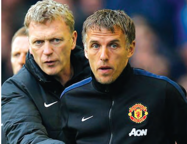
ကောင်းမြတ်သူ - စုစည်းသည်။

ဖီးနဗီးလ်ကို ဗလင်စီယာက ဆွေးနွေးနေပြီလို့ ဆိုပါတယ်။ စပိန်ကလပ်အနေနဲ့ အင်္ဂလန်နောက်တန်းကစားသမားဟောင်း ဖီးနဗီးလ်ကို အသင်းရဲ့ လက်ထောက်နည်းပြအဖြစ် ခန့်တော့မယ့်အနေအထားရှိပါတယ်။ အသက် ၃၈ နှစ်အရွယ်ရှိပြီဖြစ်တဲ့ ဖီးနဗီးလ်ကို လက်ထောက်နည်းပြခန့်မယ်လို့ ဗလင်စီယာရဲ့ဝက်ဘ်ဆိုက်မှာ ဖော်ပြထားပါတယ်။ သို့ပေမယ့် တရားဝင်စာချုပ်တာတော့မရှိသေးပါဘူး။ ဆွေးနွေးညှိနှိုင်းနေတဲ့အဆင့်မှာပဲ ရှိနေပါသေးတယ်။ ဖီးနဗီးလ်ဟာ မန်ယူနည်းပြဟောင်း ဒေးဗစ်မိုယာကန်နဲ့အတူ အလုပ်လုပ်ခဲ့သူဖြစ်ပါတယ်။ ဖီးနဗီးလ်ကို နယူးကာဆယ်ကိုပြောင်းသွားတဲ့ စကော့ကာသိုရဲ့ နေရာမှာ အစားထိုးခန့်အပ်မယ်လို့ ဆိုပါတယ်။ ဗလင်စီယာနည်းပြ နန်နီကတော့ ဖီးနဗီးလ်ရဲ့ အတွေ့အကြုံအပေါ် ချီးကျူးပြောဆိုလျက်ရှိပါတယ်။ ဖီးနဗီးလ်ဟာ မန်ယူနဲ့အတူ ဆယ်စုနှစ်နှစ်ကျော်ကြာ ကစားခဲ့တဲ့နောက်တန်းကစားသမားဖြစ်ပါတယ်။ မန်ယူမှာ အောင်မြင်မှုတွေနဲ့ အတွေ့အကြုံများခဲ့တဲ့ နောက်တန်းကစားသမားဖြစ်ပါတယ်။