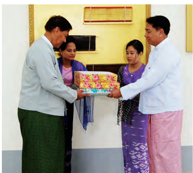
ဦးသန်းဆွေ၊ အမြဲတမ်း အတွင်းဝန် ကြီးများလည်း တက်ရောက်ခဲ့ကြောင်း ဒေါ်နန္ဒာမွန်နှင့်အဆင့်မြင့် အရာရှိ သတင်းရရှိသည်။ (သတင်းစဉ်)

ဝတ်စုံနှင့် ဒေါက်တာမောင်မောင်သည် စာရေးဆရာတစ်ဦးဖြစ်သည် နှင့်အညီ စာမူများကို ကိုယ်တိုင်ရေးသားရိုက်နှိပ်ရာတွင် အသုံးပြုခဲ့သော အင်္ဂလိပ် လက်နိပ်စက်တစ်လုံးတို့ကို ယဉ်ကျေးမှုဝန်ကြီးဌာန၏ ကွပ်ကဲမှုအောက်ရှိ အမျိုးသား ပြတိုက်တွင် မှတ်တမ်းတင်ထားရှိနိုင်ရန်အလို့ငှာ သက်ရှိထင်ရှား ကျန်ရစ်သူဇနီး ဒေါ်ခင်မြင့်၏ကိုယ်စား သားကြီးဖြစ်သူ ပြည်ထောင်စုရာထူးဝန်အဖွဲ့ ဥက္ကဋ္ဌ ဦးကျော်သူက ဇွန် ၂၃ ရက်က ပေးအပ်လှူဒါန်းရာ ပြည်ထောင်စုဝန်ကြီး ဦးအေးမြင့်ကြူက လက်ခံရယူပြီး ဂုဏ်ပြုမှတ်တမ်းလွှာ ပြန်လည် ပေးအပ်ခဲ့သည်။