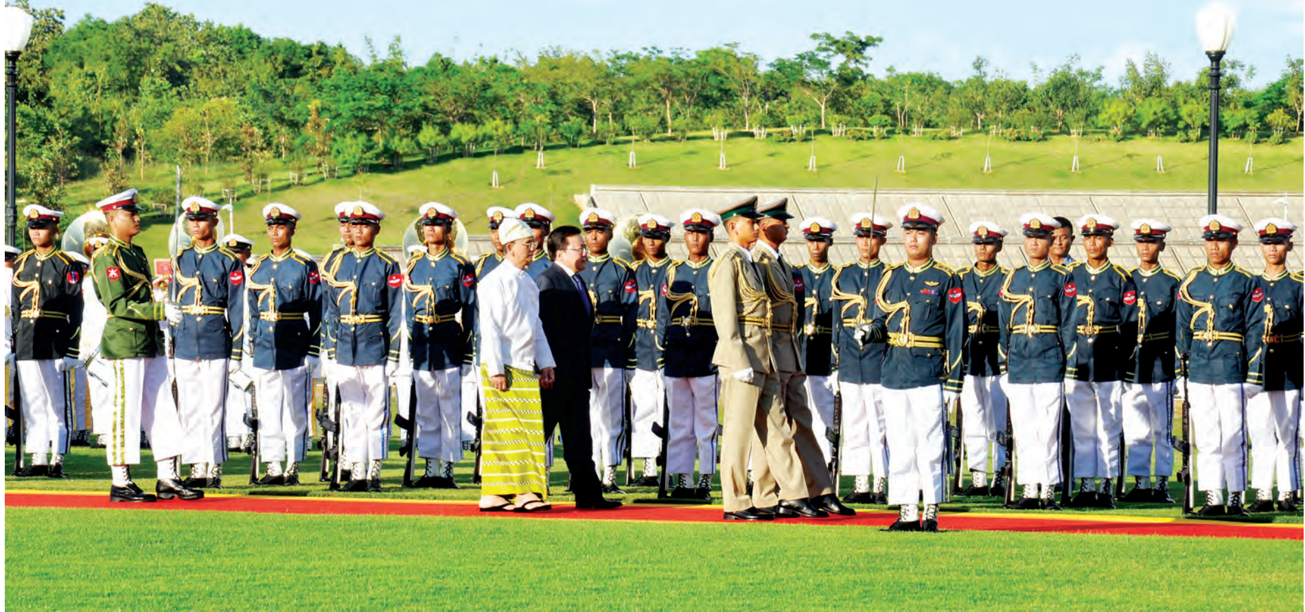
၂၀၁၃ ခုနှစ် နိုဝင်ဘာလက မွန်ဂိုလီးယားသမ္မတ၏ မြန်မာနိုင်ငံချစ်ကြည်ရေးခရီးစဉ်တွင် နိုင်ငံတော်သမ္မတ ဦးသိန်းစိန်နှင့် မွန်ဂိုလီးယားနိုင်ငံ သမ္မတ မစ္စတာ အယ်လ်ဘတ်ခ်ဒေါ့ဂျ် ဇတ်ခ်ဟီးလ်ယာဒ်တို့ ဂုဏ်ပြုတင်ပွဲကို ဤသို့ စစ်ဆေးခဲ့ကြသည်။ (သတင်းစဉ်)

* ရှေ့မှ အလားတူ ဇူလိုင် ၁ ရက်တွင် ကျရောက်သော ကနေဒါနိုင်ငံ၏ အမျိုးသားနေ့ နှစ်ပတ်လည်အခါသမယတွင် ပြည်ထောင်စုသမ္မတ မြန်မာနိုင်ငံတော် နိုင်ငံတော်သမ္မတ ဦးသိန်းစိန်ထံမှ ကနေဒါနိုင်ငံ ဝန်ကြီးချုပ် မစ္စတာ စတီဗင်ဂျိုးဇက်ဟာပါထံသို့ ဝမ်းမြောက်ကြောင်း သဝဏ်လွှာ ပေးပို့သည်။ (သတင်းစဉ်)