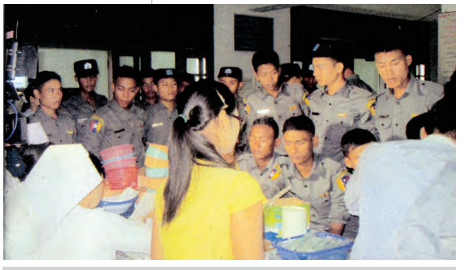
အမှတ်(၂) လုံခြုံရေးရဲကွပ်ကဲမှုအဖွဲ့မှူးရုံး၏ ကြီးကြပ်ကွပ်ကဲမှုဖြင့် အမှတ်(၁၅) လုံခြုံရေးရဲတပ်ဖွဲ့ခွဲမှ တပ်ဖွဲ့ဝင် ၅၀ သည် မော်လမြိုင်မြို့ အထွေထွေရာဂါကုဆေးရုံကြီး သွေးလျှာဘဏ်၌ ဇွန်လစာတစ်ပတ်က ပဉ္စမအကြိမ်မြောက် စုပေါင်းသွေးလျှာဒါနပေးပို့ခဲ့ကြောင်း သိရသည်။ (၁၀၇)