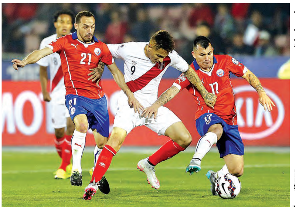
ပီရူးတိုက်စစ်မှူး ချီလီနောက်တန်းကို ထိုးဖောက်ရန် ကြိုးစားစဉ်။

ဒုတိယပိုင်းတွင် ပီရူးအသင်း ချေပဂိုးရရန် တန်ပြန်တိုက်စစ်ဆင်ခဲ့ပြီး ပွဲချိန် မိနစ် ၆၀ တွင် ပီရူးအသင်း စာမျက်နှာ ၁၄ ကော်လံ ၄