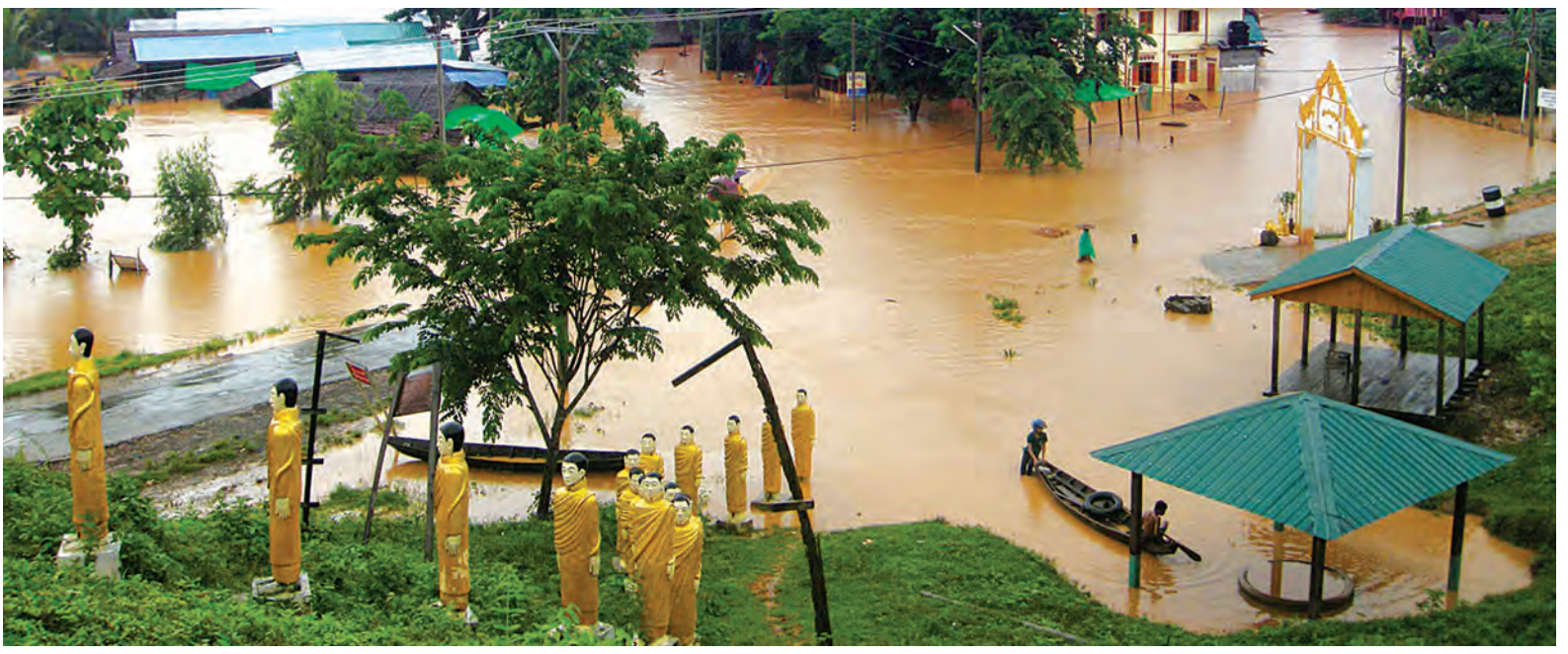
မိုးအဆက်မပြတ်ရွာသွန်းပြီး မအိချောင်းတောင်ကျရေများကျဆင်းမှုကြောင့် မအိတစ်မြို့လုံး ရေလွှမ်းနေမှုကို ဇွန် ၂၆ ရက်က တွေ့ရစဉ်။

ယနေ့ (ဇွန် ၂၈ ရက်) မိုးလေဝသ ခန့်မှန်းချက်တွင် လွန်ခဲ့သော ၂၄ နာရီအတွင်းက စစ်ကိုင်းတိုင်းဒေသကြီးအောက်ပိုင်း၊ မန္တလေးတိုင်းဒေသကြီးနှင့် မကွေးတိုင်းဒေသကြီးတို့၌ နေရာကွက်ကျား၊ တနင်္သာရီတိုင်းဒေသကြီး၊ ရှမ်းပြည်နယ်နှင့် ကယားပြည်နယ်တို့၌ နေရာစိပ်စိပ်နှင့် ကျန်တိုင်းဒေသကြီးနှင့် ပြည်နယ်တို့တွင် နေရာအနှံ့အပြား မိုးရွာခဲ့ပြီး ဧရာဝတီတိုင်းဒေသကြီးနှင့် ရခိုင်ပြည်နယ်တို့၌ ဒေသအလိုက်၊ စစ်ကိုင်းတိုင်းဒေသကြီးအထက်ပိုင်းနှင့် မွန်ပြည်နယ်တို့တွင် နေရာကွက်၍ မိုးကြီးခဲ့သည်။