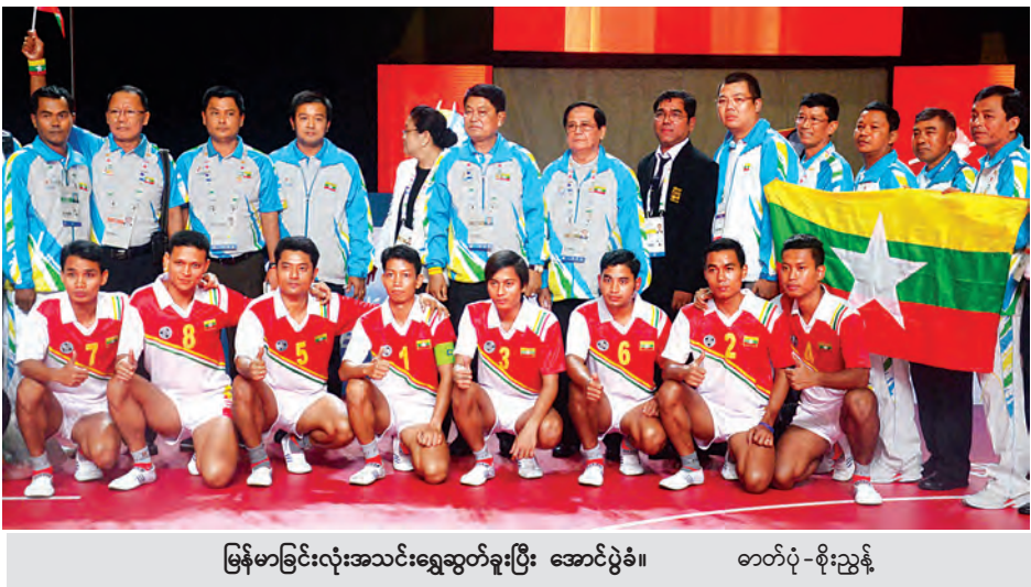
မြန်မာခြင်းလုံးအသင်းရွှေဆုတံဆိပ်များကို အောင်ပွဲခံ။

နည်းစစ်စစ်ဖြစ်သည့် ခြင်းလုံးအားကစားနည်းမှ ရွှေနှစ်ခုစလုံး ရယူနိုင်ခဲ့သည်မှာ ဂုဏ်ယူစရာကောင်းလှသည်။ ခြင်းလုံးပြိုင်ပွဲကို ပိုက်ကျော်ခြင်းအားကစားနှင့်အတူ ကျင်းပခဲ့ခြင်းဖြစ်ပြီး ခြင်းလုံးပြိုင်ပွဲ၌ ပြိုင်ပွဲအမျိုးအစား လေးမျိုးကျင်းပသော်လည်း တစ်နိုင်ငံလျှင် နှစ်မျိုးသာ ယှဉ်ပြိုင်ခွင့်ရရှိခဲ့ခြင်းဖြစ်သည်။ မြန်မာခြင်းလုံးအသင်းမှာ ဝင်ရောက်ယှဉ်ပြိုင်ခွင့် ရရှိသည့် ပြိုင်ပွဲနှစ်မျိုးစလုံးတွင် ရွှေနှစ်ခုရအောင် စွမ်းဆောင်နိုင်ခဲ့ခြင်းဖြစ်သည်။ ရိုးရာအားကစားနည်း ဖြစ်သော်လည်း ပြိုင်ဘက်နိုင်ငံများ၏ တိုးတက်လာမှုကြောင့် မြန်မာခြင်းလုံးအသင်းမှာ အမှားအယွင်းမရှိ ခတ်ကစားနိုင်ခဲ့မှုကြောင့်သာ ယခုလို ရွှေတံဆိပ်များ ရရှိခဲ့ခြင်းလည်းဖြစ်သည်။ ၂၀၁၃ ခုနှစ် (၂၇) ကြိမ်မြောက် ဆီးဂိမ်းပြိုင်ပွဲနှင့်အတူ