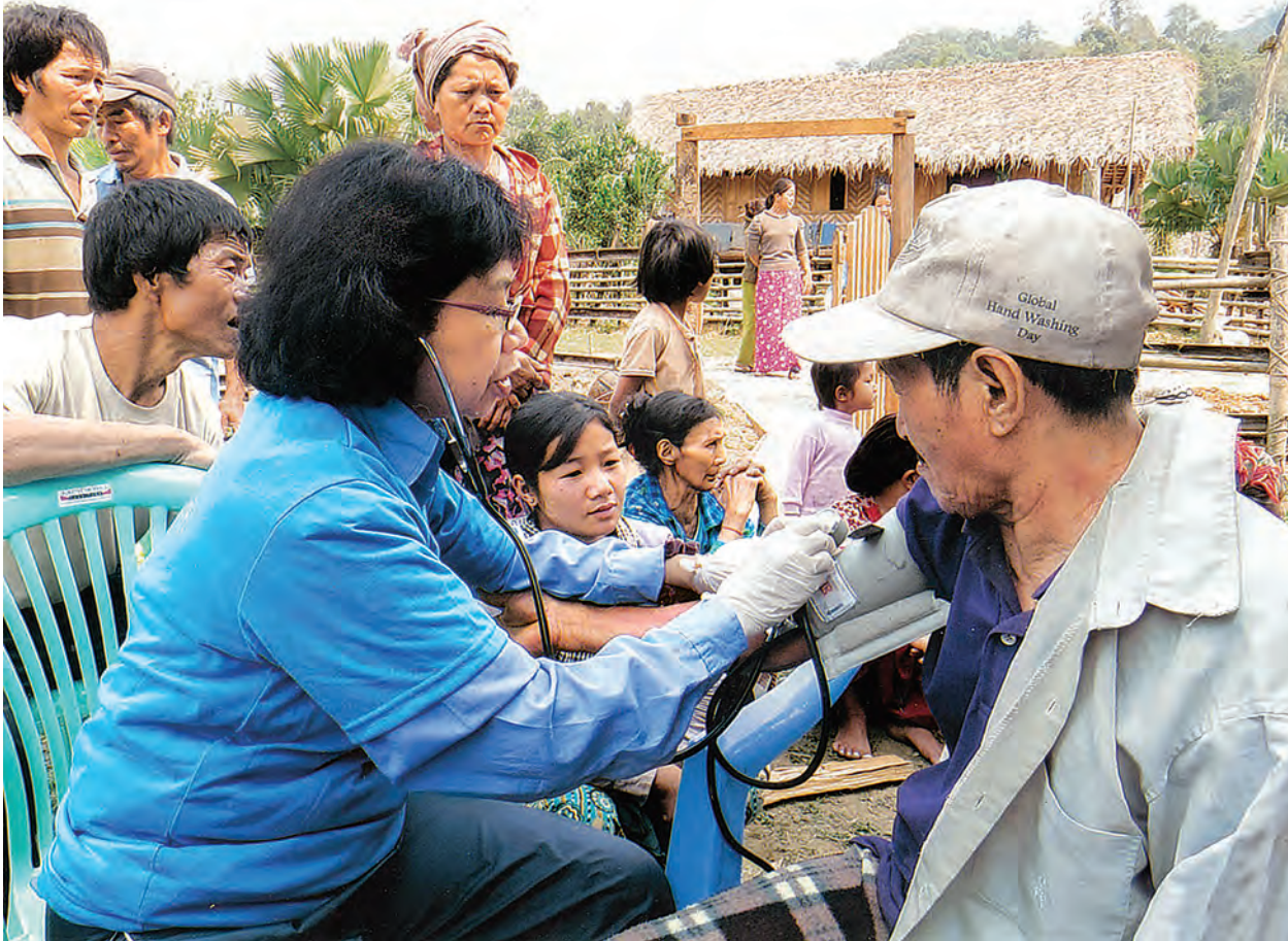
သတင်း - မောင်စိန်လွင်(မြန်မာ့အလင်း)

တက္ကသိုလ်ခြေလှိုင်နှင့် တောင်တက်အသင်း (သဘာဝခေါ်သံဖောင်ဒေးရှင်း)မှ ခါကာဘိုရာဇီဒေသ၌ ဒေသခံများအား ဆေးကုသပေးစဉ်။