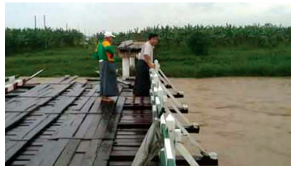
ပန်းတောင်းမြို့နယ်တွင် မိုးအဆက်မပြတ်ရွာသွန်းမှုကြောင့် ချောင်းရေတိုက်စားပြီး ပြိုကျပျက်စီးသွားသော တံတားတစ်စင်းကို တွေ့ရစဉ်။