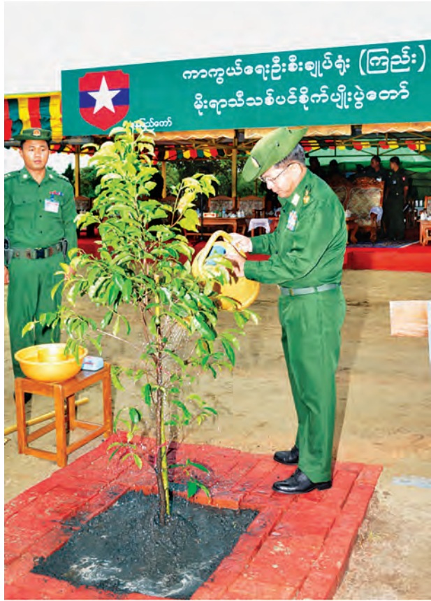
နေပြည်တော် ဇွန် ၂၈

သစ်ပင်များကို စိုက်ပျိုးခြင်း၊ ထိန်းသိမ်းခြင်းနှင့် ပြန်လည်ရှင်သန်အောင် လုပ်ဆောင်ခြင်းသည် အမျိုးသားရေးတာဝန်တစ်ရပ်အဖြစ် ရှိနေကြောင်း၊ ယခုသစ်ပင်စိုက်ပျိုးပွဲသည် ယခုနှစ် မိုးရာသီသစ်ပင်စိုက်ပျိုးရေးအတွက် တပ်လှန့်နှိုးဆော်ခြင်းပင်ဖြစ်ကြောင်း တပ်မတော်ကာကွယ်ရေးဦးစီးချုပ် ပိုလ်ချုပ်မှူးကြီး မင်းအောင်လှိုင်က ယနေ့ နံနက် ၇ နာရီတွင် နေပြည်တော် ဧယျာသီရိမြို့နယ် ရေဆင်းဆည်အနီး၌ ကျင်းပသော ကာကွယ်ရေးဦးစီးချုပ် ရုံး (ကြည်း)မိုးရာသီ သစ်ပင်စိုက်ပျိုးပွဲ အခမ်းအနား၌ ပြောကြားသည်။ အဆိုပါ သစ်ပင်စိုက်ပျိုးပွဲအခမ်းအနားသို့ တပ်မတော်ကာကွယ်ရေး ဦးစီးချုပ် ပိုလ်ချုပ်မှူးကြီးမင်းအောင်လှိုင်၊ ညွှန်ကြားရေးမှူးချုပ် (ကြည်း၊ ရေလေ) ပိုလ်ချုပ်ကြီး လှဌေးဝင်းနှင့် ကာကွယ်ရေးဦးစီးချုပ်ရုံးမှ တပ်မတော် အရာရှိကြီးများနှင့်ဇနီးများ၊ နိုင်ငံတော်ကာကွယ်ရေးတက္ကသိုလ်မှ သင်တန်းသား အရာရှိကြီးများ၊ ကာကွယ်ရေးဦးစီးချုပ်ရုံးရှိ ရုံး/ဌာနများမှ အရာရှိ၊ စစ်သည်။