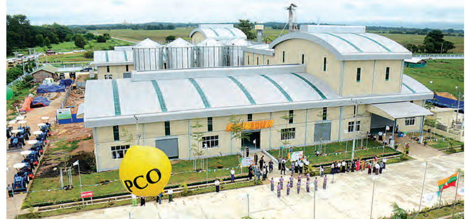
လယ်ယာကဏ္ဍ ဖွံ့ဖြိုးတိုးတက်ရေးအထောက်အကူပြု တစ်နေ့တန် ၂၂၀ ကျ ခေတ်မီဆန်စပါးကောင်းဆန်စက်အဆောက်အအုံကို တွေ့ရစဉ်။

ထောက်ခံမှုများ ပြုလုပ်ပေးရန် အသင့်ရှိပါကြောင်း၊ ဆန်စပါးအထွက်ကောင်းသည့်ဒေသများ၌ ယခုကဲ့သို့ ခေတ်မီဆန်စက်ကြီးများ အပြိုင်အဆိုင် ထွက်ပေါ်လာရန် မျှော်လင့်ပါကြောင်း။