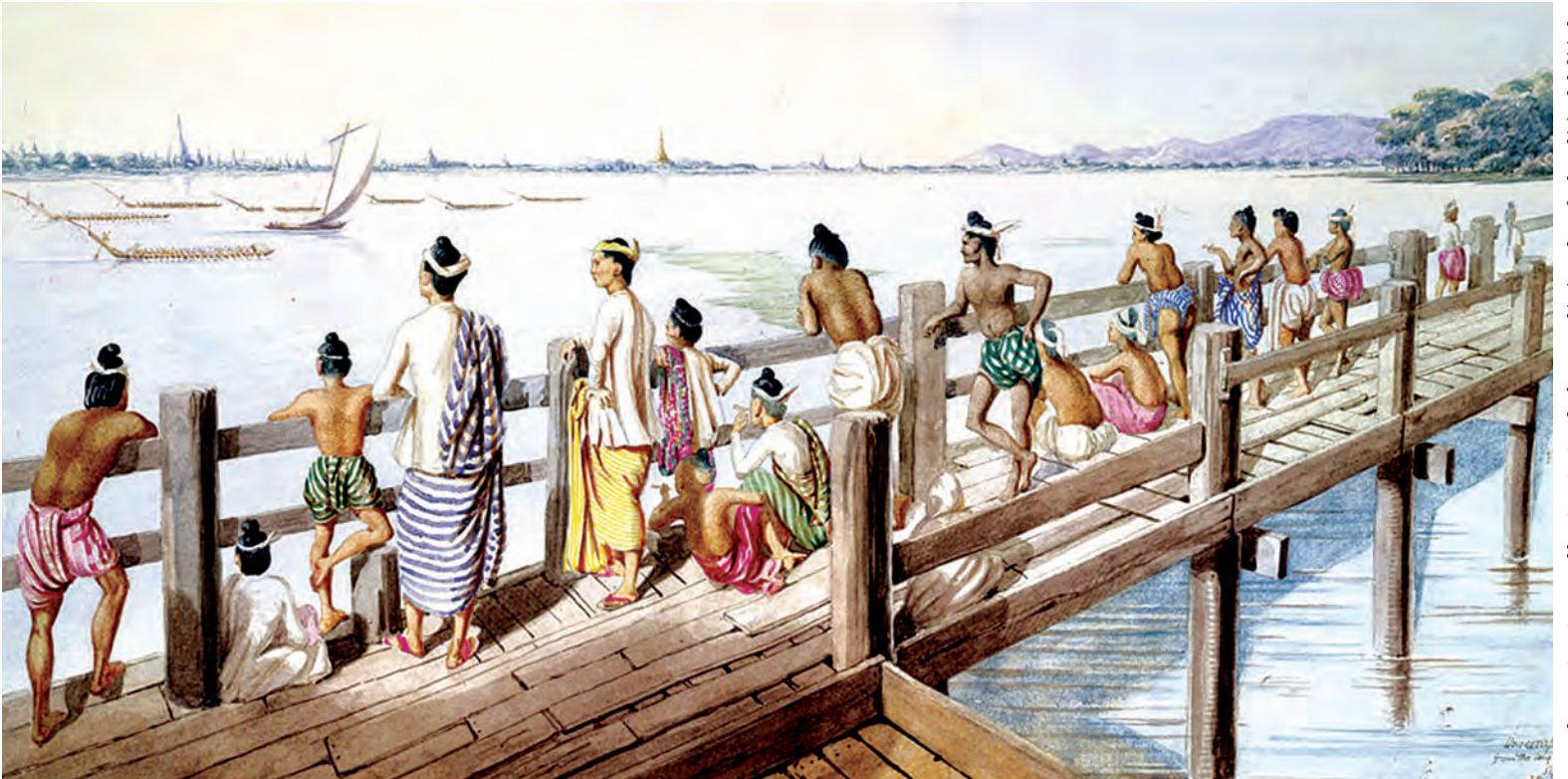
အမရပူရခေတ် မန္တလေးဦးပိန်တံတား ပန်းချီကားကို တွေ့ရစဉ်။

မန္တလေးမြို့ အမရပူရမြို့နယ် တောင်သမန်အင်းအတွင်းရှိ ကမ္ဘာကျော် ဦးပိန်တံတားကြီးအား ပြည်ထောင်စု အစိုးရဘက်က ၂၀၁၄ ခုနှစ် အကုန်အကျခံ၍ ရှေးလက်ရာအတိုင်း အမရပူရခေတ်အသွင် ပြုပြင်ထိန်းသိမ်းသွားမည်ဖြစ်ကြောင်း သိရသည်။ အဆိုပါ ဦးပိန်တံတားကြီးအား ၂၀၁၄ ခုနှစ် ဧပြီလအတွင်း ပထမဦးစားပေးအဆင့်အနေဖြင့် အခန်းပေါင်း ၂၁ ခန်းကို တိုင်းဒေသကြီးရန်ပုံငွေဖြင့် ကျပ်သိန်း ၁၄၀ ကျော် စိုက် ထုတ် အကုန်အကျခံပြုပြင်ခဲ့ပြီး ယခုအခါ တံတားကြီးရေရည်တည်တံ့ ခိုင်မြဲစေရေးအတွက် ပြုပြင်ရန် တိုင်းဒေသကြီးအစိုးရမှ ပြည်ထောင်စုအစိုးရသို့ ကုန်ကျစရိတ်တွက်ချက်တောင်းခံခဲ့ရာ ၎င်းကုန်ကျငွေကို ခွင့်ပြုခဲ့ပြီးဖြစ်ကြောင်း မန္တလေး