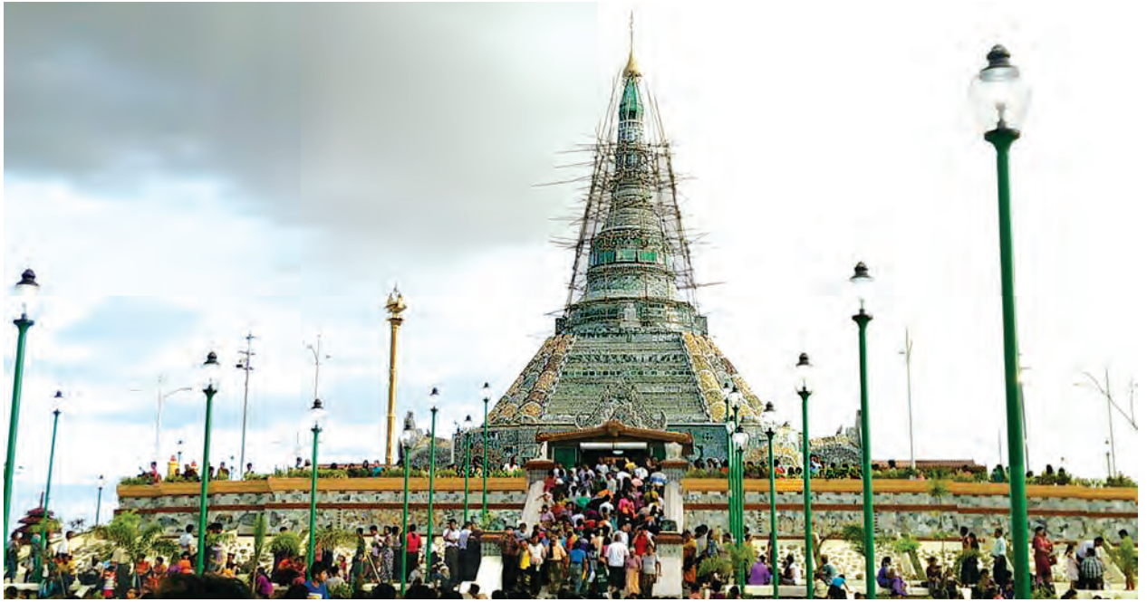
၌ ဥယျာဉ်သဖွယ် သစ်ပင်ပန်းမန်များဖြင့် အလှဆင်စိုက်ပျိုးပေးထားသည်။ အနယ်နယ်အရပ်ရပ်မှ ဘုရားဖူးလာပြည်သူများ၊ ဥပုသ်သီလဆောက်တည်ကြသူများဖြင့် အထူးစည်ကားလျက်ရှိသည့်အပြင် “ဆုတောင်းထူးခြားမှုများဖူးတွေ့ရသည်”ဟု ဘုရားဖူးလာပြည်သူများက ယုံကြည်နေကြကြောင်း သိရသည်။ သတင်း-မိုးညို(မန္တလေး)

ထို့ပြင် ဘုရားဖူးလာပြည်သူများ စိတ်အေးချမ်းစွာ ဖူးမြော်နိုင်ရန် အတွက် ဘုရားပရိဝုဏ်အတွင်း