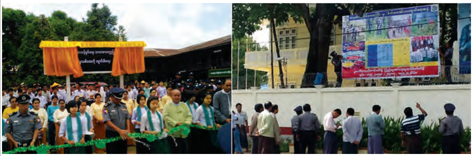
တိုင်းဒေသကြီး/ပြည်နယ် မူးယစ်ဆေးဝါးနှင့် ဝိတ်ကို ပြောင်းလဲစေသော ဆေးဝါးများအန္တရာယ် တားဆီးကာကွယ်ရေးဗဟိုအဖွဲ့