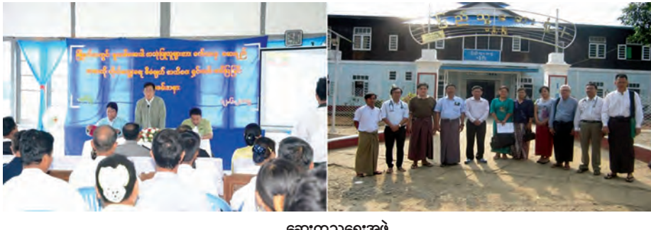
ဆေးကုသရေးအဖွဲ့