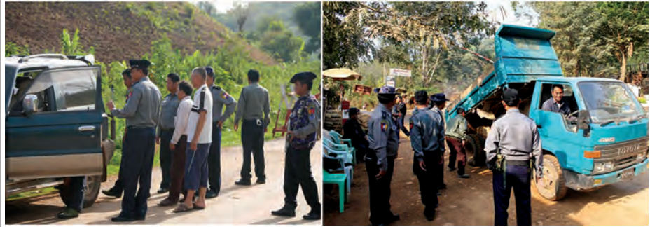
တားဆီးနှိမ်နင်းရေးနှင့် စီမံခန့်ခွဲရေးအဖွဲ့