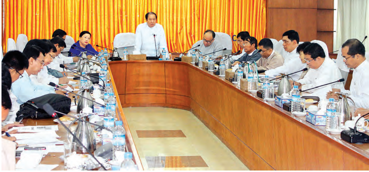
ပြည်ထောင်စု ဝန်ကြီးက အနည်းဆုံးအခကြေးငွေ သတ်မှတ်နိုင်ရေးအတွက် ကျင်းပခဲ့သည့် အလုပ်ရှင်ဆွေးနွေးပွဲမှ ရလဒ်များ အပေါ်မူတည်ပြီး အဆိုပြုအနည်းဆုံး အခကြေးငွေနှုန်းထားတစ်ခု ထုတ်ပြန်နိုင်ရေးအတွက် ယနေ့ပြုလုပ်သည့် အမျိုးသားကော်မတီအစည်းအဝေးတွင် ဆုံးဖြတ်သွားရမည်ဖြစ်ကြောင်း၊ နှစ်ရက်ကြာကျင်းပခဲ့သည့် အလုပ်ရှင်ဆွေးနွေးပွဲတွင် အလုပ်ရှင်များဘက်မှ အဆိုပြုခဲ့သည့် အနည်းဆုံး အခကြေး

(၇)ကြိမ်မြောက် အနည်းဆုံးအခကြေးငွေ သတ်မှတ်ရေးဆိုင်ရာ အမျိုးသားကော်မတီအစည်းအဝေးကို ယနေ့နံနက်ပိုင်းတွင် ရန်ကုန်မြို့ မြန်မာနိုင်ငံ ကုန်သည်များနှင့် စက်မှုလက်မှုလုပ်ငန်းရှင်များအသင်းချုပ်အစည်းအဝေးခန်းမ၌ကျင်းပရာ အလုပ်သမား၊ အလုပ်အကိုင်နှင့် လူမှုဖူလုံရေးဝန်ကြီးဌာန ပြည်ထောင်စု ဝန်ကြီး ဦးအေးမြင့်၊ ဒုတိယဝန်ကြီး ဒေါ်ဝင်းမော်ထွန်း၊ နိုင်ငံတော်သမ္မတ၏ စီးပွားရေးအကြံပေး ဒေါက်တာဇော်ဦး၊ အနည်းဆုံးအခကြေးငွေသတ်မှတ်ရေး ဆိုင်ရာ အမျိုးသားကော်မတီဝင်များ၊ အလုပ်ရှင်နှင့်အလုပ်သမားကိုယ်စားလှယ် တက်ရောက်ခဲ့ကြသည်။ (အောက်ပုံ)