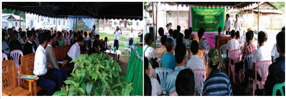
သီးနှံများအစားထိုးစိုက်ပျိုးရေးအဖွဲ့