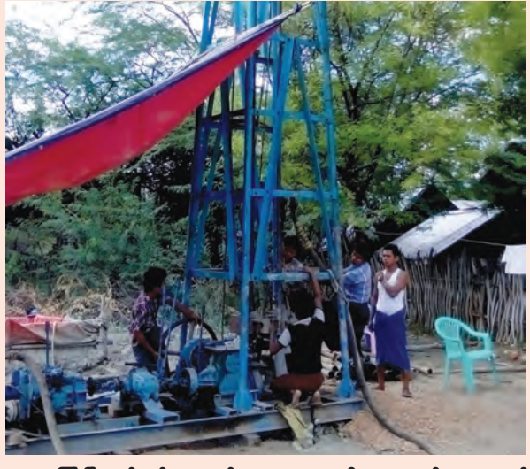
ရေစိုက်မြို့နယ်တွင် သောက်သုံးရေမလုံစွာရရှိရေးအတွက် ကျေးလက်ဒေသဖွံ့ဖြိုးရေးဦးစီးဌာနရန်ပုံငွေဖြင့် ဇွန် ၂၀ ရက်က စက်ရေတွင်းတူးဖော်ပေးနေစဉ်။(ရေစိုက်မြို့နယ်အတွင်း ကျေးရွာ ၁၂ ရွာ၌ စက်ရေတွင်း ၁၀ တွင်းနှင့် တွင်းတိမ် နှစ်တွင်းတူးဖော်သွားမည်ဟု သိရသည်။)