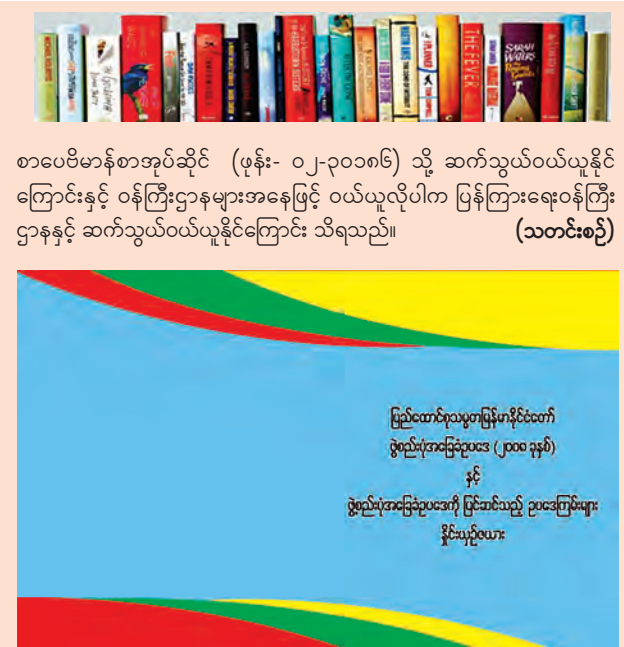
စာပေဗိမာန်စာအုပ်ဆိုင် (ဖုန်း- ၀၂-၃၀၀၈၆) သို့ ဆက်သွယ်ဝယ်ယူနိုင် ကြောင်းနှင့် ဝန်ကြီးဌာနများအနေဖြင့် ဝယ်ယူလိုပါက ပြန်ကြားရေးဝန်ကြီး ဌာနနှင့် ဆက်သွယ်ဝယ်ယူနိုင်ကြောင်း သိရသည်။ (သတင်းစဉ်)

“ပြည်ထောင်စုသမ္မတ မြန်မာနိုင်ငံတော်ဖွဲ့စည်းပုံအခြေခံဥပဒေ (၂၀၀၈ ခုနှစ်)နှင့် ဖွဲ့စည်းပုံအခြေခံ ဥပဒေကိုပြင်ဆင်သည့်ဥပဒေကြမ်း များနှိုင်းယှဉ်ယေး” စာအုပ်အား ရောင်းစေ့ဌာနက ၈၀၀ ဖြင့် ရန်ကုန်၊ နေပြည်တော်နှင့် မန္တလေးမြို့တို့ရှိ စာပေဗိမာန် စာအုပ် အရောင်းဆိုင်များတွင် ဝယ်ယူရရှိနိုင်ကြ သည်။ အဆိုပါစာအုပ်ကို အမှတ်၊ ၅၂-၅၃၁၊ ကုန်သည်လမ်း၊ ရန်ကုန်မြို့ရှိ စာပေဗိမာန် စာအုပ်ဆိုင် ဖုန်း-၀၁-၂၄၉၀၃၁၊ ၀၁-၃၈၁၄၄၈၊ အမှတ် (၀၁-၅၅)၊ သပြေကုန်းဈေး၊ နေပြည်တော်ရှိ စာပေဗိမာန်စာအုပ်ဆိုင်(ဖုန်း -၀၆၇-၄၁၄၆၈၁)၊ ၈၆လမ်း၊ ၂၁ လမ်းနှင့် ၂၂ လမ်းကြား၊ မန္တလေးမြို့ရှိ