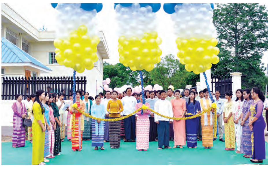
ခွဲသဖြင့် ကျောင်းသား ကျောင်းသူ ပညာသင်ကြားနိုင်ရန် ရည်ရွယ်ချက် များ၏ နေထိုင်စားသောက်မှု အဆင် ပြေချောမွေ့စေရန်နှင့် ပျော်ရွှင်စွာ ဆို RC နှစ်ထပ်အိပ်ဆောင် သုံးဆောင်ကို နိုင်ငံတော်ဘဏ္ဍာ ငွေဖြင့် ဆောက်လုပ်ပေးခဲ့ခြင်းဖြစ် ကြောင်း သိရသည်။ (သတင်းစဉ်)

နိုင်ငံတော်၏ သားငါးကဏ္ဍ ဖွံ့ဖြိုးတိုးတက်ရေးကို အထောက် အကူဖြစ်စေမည့် လူ့စွမ်းအားအရင်း အမြစ်များ ပိုမိုမွေးထုတ်ပေးနိုင်ရန် အတွက် မွေးမြူရေးဆိုင်ရာ ဆေးတက္ကသိုလ်တွင် ကျောင်းသား ကျောင်းသူဦးရေ တိုးမြှင့်ခေါ်ယူမှုနှင့် အတူ ကျောင်းသား ကျောင်းသူများ အိပ်ဆောင်များ တိုးချဲ့ ဖွင့်လှစ်ခြင်းအခမ်းအနားကို ယနေ့ နံနက် ၈ နာရီက နေပြည်တော် ရေဆင်းရုံ အဆိုပါတက္ကသိုလ်၌ ကျင်းပသည်။ (ယာပုံ) အဆိုပါအခမ်းအနားသို့ မွေးမြူ ရေး၊ ရေလုပ်ငန်းနှင့် ကျေးလက် ဒေသ ဖွံ့ဖြိုးရေးဝန်ကြီးဌာန ပြည်ထောင်စုဝန်ကြီး ဦးအုန်းမြင့်၊ ဒုတိယဝန်ကြီး ဒေါက်တာအောင်မြတ် ဦးနှင့် တာဝန်ရှိသူများ၊ ဆရာ ဆရာမ များနှင့် ကျောင်းသား ကျောင်းသူများ တက်ရောက်ကြပြီး ဆောက်လုပ်ရေး ကုမ္ပဏီများမှ အိပ်ဆောင် သုံးဆောင် လွှဲပြောင်းခြင်းနှင့် ၎င်းအိပ်ဆောင်များ အနက် “ဟန်လင်း”နှင့် “ဇီဝက” အမျိုးသားအိပ်ဆောင် နှစ်ဆောင်ကို လည်းကောင်း၊ “ဂန္ဓမာ” အမျိုးသမီး အိပ်ဆောင်ကို လည်းကောင်း စည်ကားသိုက်မြိုက်စွာဖြင့် ဖွင့်လှစ် ခဲ့ကြသည်။ မွေးမြူရေးဆိုင်ရာ ဆေး တက္ကသိုလ်သည် ၂၀၁၁-၂၀၁၂ ပညာ သင်နှစ်မှစတင်ပြီး ကျောင်းသား၊ ကျောင်းသူဦးရေ တိုးမြှင့်ခေါ်ယူခြင်း နှင့် ပညာသင်ကာလကို ငါးနှစ်မှ ခြောက်နှစ်သို့ ပြင်ဆင်သတ်မှတ်ခြင်း တို့ကြောင့် ကျောင်းသားဦးရေမှာ မူလက ၉၀၀ ခန့်ရှိခဲ့ရာမှ ယခုအခါ ၁၅၀၀ ခန့်အထိ များပြားလာ