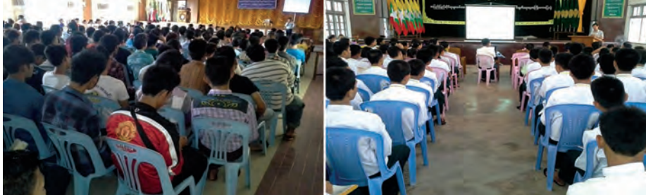
ကျောင်းသားလူငယ်များအား အသိပညာပေးရေးအဖွဲ့