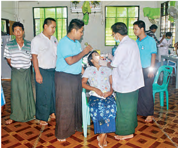
ဇွန် ၂၃ ရက်က ဝါးခယ်မြို့နယ် ကျွဲမငေးမြို့ အုန်းပင်ဘက် နဒီအောင်မြေရပ်ကွက်ရှိ ဇေတဝန်ကျောင်းတော် ကုသိုလ်ဖြစ်ဆေးခန်း၏ သုံးနှစ်ပြည့် အထိမ်းအမှတ်အဖြစ် သွားဘက်ဆိုင်ရာ ဆရာဝန် များအသင်း နယ်လှည့်ဆေးကုသရေးအဖွဲ့က သွားရောဂါဝေဒနာရှင်များအား အခမဲ့ကု သပေးစဉ်။

ဖြစ်ကြောင်း သိရသည်။ အဆိုပါဆွေးနွေးပွဲသို့ မြေယာကျွမ်းကျင်ပညာရှင်များနှင့် စိတ်ပါဝင် စားသူများ တက်ရောက်ဆွေးနွေးရန် ဖိတ်ခေါ်ထားပြီး အလုပ်ရုံဆွေးနွေးပွဲနှင့် စပ်လျဉ်း၍ အသေးစိတ်အချက်အလက်များ သိရှိလိုပါက သစ်တောဦးစီးဌာန ဖုန်း-၀၆၇-၄၀၅၄၂၈ သို့ ဆက်သွယ်မေးမြန်းနိုင်ကြောင်းသိရသည်။ (ဧရာဝတီ)