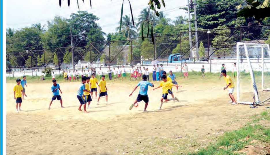
ရန်ကုန်မြို့ရှိ အားကစားကွင်းတစ်ကွင်းတွင် လူငယ်များ ပျော်ရွှင်စွာ ဘောလုံးကစားနေကြစဉ်။

များသည် အများပြည်သူနှင့် ဆက်စပ်သည့် ပန်းဥယျာဉ်နှင့် ကစားကွင်းများကို ပိုမိုတန်ဖိုးထားလာကြသည်။ ပိုမိုအသုံးပြုလာကြသည်။ ပြီးခဲ့သည့် (၂၈) ကြိမ်မြောက် အရှေ့တောင်အာရှ ဘောလုံးပြိုင်ပွဲတွင် မြန်မာယူ-၂၃ ဘောလုံးအသင်း ယှဉ်ပြိုင်သည့် ပွဲစဉ်များကို ပြည်သူ့ရင်ပြင်၊ မဟာဗန္ဓုလပန်းခြံနှင့် ကန်တော်ကြီးဥယျာဉ် အပါအဝင် တစ်နိုင်ငံလုံးရှိ ပြည်သူ့ဗဟိုပြု အထင်ကရ နေရာများတွင် LED ဖန်သားပြင်ကတစ်ဆင့် ပြည်သူများ တစ်ခဲနဲအားပေးခဲ့ကြသည်ကို တွေ့နိုင်သည်။ လူဦးရေထူထပ်မှုကြောင့် တိုက်ခန်းကျဉ်းလေးများတွင် နိစ္စဓူဝပိတ်မိနေကြသည့် ရန်ကုန်မြို့ခံ ပြည်သူအများစုအတွက် ပန်းဥယျာဉ်များသည် သူတို့၏ နိဗ္ဗာန်ဘုံများဖြစ်သကဲ့သို့ ရပ်ကွက်ကစားကွင်းများသည်လည်း နေ့စဉ်ကျောင်းနှင့် အိမ်တွင်သာ ကျင်လည်နေကြရသည့် မျိုးဆက်သစ်ကလေးငယ်များအတွက် နိဗ္ဗာန်ဘုံဖြစ်လာခဲ့သည်။ သို့ဖြစ်၍ တစ်ချိန်က တရုတ်ကွန်မြူနစ်ပါတီ ဥက္ကဋ္ဌကြီးမော်၏ “ပန်းတိုင်းပွင့်ပါစေ” ပညာရှင်များငြင်းခုံနိုင်ကြပါစေ” ဟူသည့် နာမည်ကျော် ဒဿနကဗျာကဲ့သို့နယ်လောကကို အလှဆင်ဖို့ ပန်းဥယျာဉ်များမှာ ပန်းတိုင်းပွင့်ပါစေ၊ ရပ်ကွက်ကစားကွင်းတိုင်းမှာ ကလေးငယ်တွေ လွတ်လပ်စွာငြင်းခုံ ဆော့ကစားနိုင်ကြပါစေဟု ဆိုချင်ကြောင်းပါ။