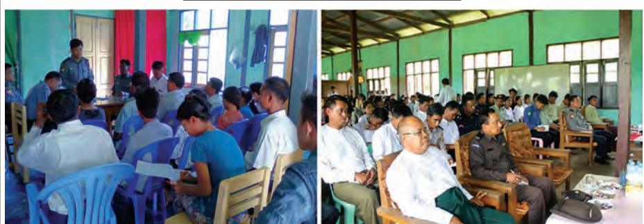
ထိန်းချုပ်စာတုပစ္စည်းများ ကြီးကြပ်ရေးအဖွဲ့

မူးယစ်ဆေးဝါးနှင့်ဝိတ်ကိုပြောင်းလဲစေသော ဆေးဝါးများအန္တရာယ် တားဆီးကာကွယ်ရေးဗဟိုအဖွဲ့ ဦးဆောင်မှုဖြင့် လူထုလှုပ်ရှားမှုအသွင်ဖြင့် မူးယစ်ဆေးဝါးတိုက်ဖျက်ရေးအထူးလုပ်ငန်းစီမံချက် (ယင်းမာ)ကို မူးယစ်ဗဟိုအဖွဲ့အစည်း အဝေး(၁/၂၀၁၅)တွင် အတည်ပြုခဲ့ပြီး လုပ်ငန်းတာဝန်များ ခွဲဝေသတ်မှတ်ပေးခဲ့ပါသည်။ အဆိုပါယင်းမာစီမံချက်ကို ၂၆-၅-၂၀၁၅ ရက်နေ့မှ ၂၆-၆-၂၀၁၅ ရက်နေ့အထိဆောင်ရွက်လျက်ရှိပြီး အထက်မြန်မာပြည်၊ အောက်မြန်မာပြည်၊ ရှမ်းပြည်နယ်ဟူ၍ ဇုန် (၃)ဇုန်ခွဲ၍ ဆောင်ရွက်လျက်ရှိခဲ့ရာ မူးယစ်ဗဟိုအဖွဲ့အောက်ရှိ လုပ်ငန်းအဖွဲ့များအလိုက် တတိယရက်သတ္တပတ်အတွင်း အောက်ပါအတိုင်း ဆောင်ရွက်ခဲ့ကြောင်း သတင်းရရှိပါသည်-