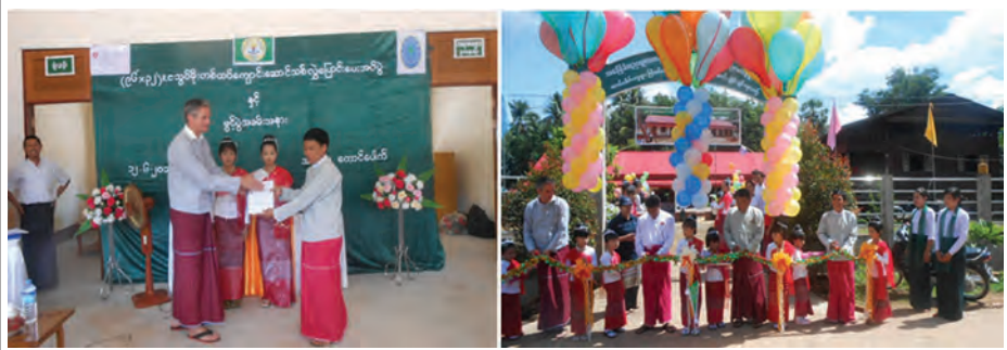
အစားထိုးဖွံ့ဖြိုးမှုအကောင်အထည်ဖော်ရေးအဖွဲ့