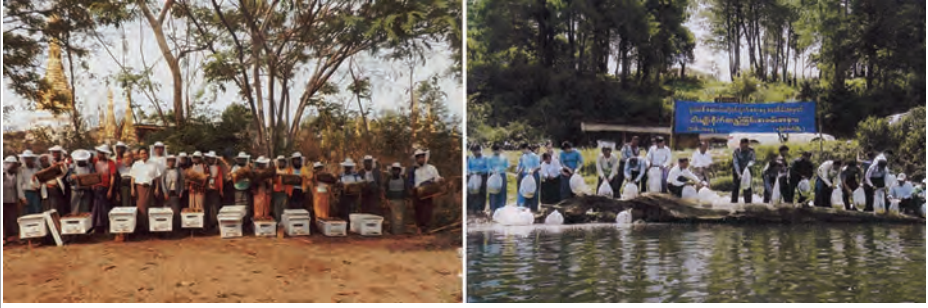
မွေးမြူရေးအဖွဲ့