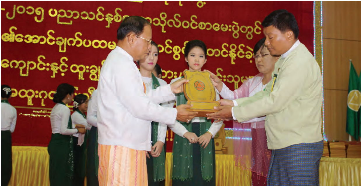
ဧရာဝတီတိုင်းဒေသကြီး ဝန်ကြီးချုပ်က အောင်ချက်မြင့်မားသည့် မြို့နယ်များထံသို့ ဂုဏ်ပြုလွှာများ ချီးမြှင့်ပေးစဉ်။

ဧရာဝတီတိုင်းဒေသကြီးအစိုးရအဖွဲ့မှ တာဝန်ယူဆောင်ရွက်ခဲ့သည့် ၂၀၁၁ မတ် ၃၁ ရက်မှစတင်ကာ ပညာရေးနှင့်ပတ်သက်၍ ၂၀၁၁- ၂၀၁၂ ပညာသင်နှစ်တွင် တက္ကသိုလ်ဝင် စာမေးပွဲအောင်ချက် အထူးမြင့်မားရေးနှစ် အဖြစ်လည်းကောင်း၊ ၂၀၁၂-၂၀၁၃ ပညာသင်နှစ်တွင် တက္ကသိုလ်ဝင်စာမေး ပွဲ အောင်ချက်ရာခိုင်နှုန်း အရှိန်အဟုန်မြှင့်တင်ရေးနှစ်အဖြစ်လည်းကောင်း