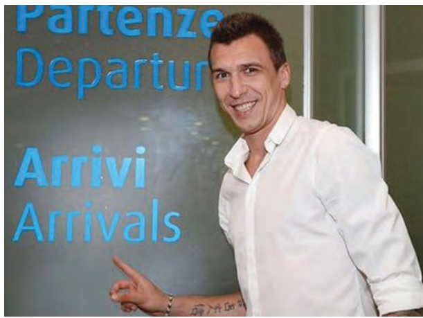
ကောင်းမြတ်သူ > စုစည်းသည်။

ယူအက်စ်အိုးပင်းဂေါက်သီးချန်ပီယံမှာ အပေဂိုကန်နိုင်ငံသား ဂျော်ဒန်စပစ်ဟာ အသက်အငယ်ဆုံးဂေါက်သီးကစားသမားတစ်ဦးအနေနဲ့ ဖလားဆွတ်ခူးနိုင်ခဲ့ပါတယ်။ အသက် ၂၁ နှစ်အရွယ်သာရှိသေးတဲ့ ဂျော်ဒန်စပစ်ဟာ သတ်မှတ်ရိုက်ချက်ထက် ငါးချက်လျော့ရိုက်ပြီး ဖလားဆွတ်ခူးနိုင်ခဲ့ခြင်း ဖြစ်ပါတယ်။ သူဟာ ၂၀၁၅ ခုနှစ်အတွင်း မာစတာပြိုင်ပွဲမှာလည်း ဖလားဆွတ်ခူးနိုင်ခဲ့တဲ့အတွက် ဒုတိယမြောက်အဓိကဖလားကို ဆွတ်ခူးနိုင်ခဲ့ခြင်းဖြစ်ပါတယ်။ စပစ်ဟာ ပြက္ခဒိန်နှစ်တစ်နှစ်တာအတွင်း အဓိကဖလားပြိုင်ပွဲလေးပွဲစလုံးမှာ ဖလားဆွတ်ခူးနိုင်တဲ့ အသက်အငယ်ဆုံးဂေါက်သီးကစားသမားဖြစ်လာဖို့ရှိနေပါသေးတယ်။ ၁၉၂၃ ခုနှစ်က ဘော်ဘီဂျိုးဆိုသူဟာ အသက်အငယ်ဆုံးနဲ့ ယူအက်စ်အိုးပင်းဖလားကို ဆွတ်ခူးနိုင်ခဲ့ပြီးနောက် နှစ်ပေါင်း ၉၀ ကျော်မှ ယခုတစ်ဖန် အသက်အငယ်ဆုံးနဲ့ ယူအက်စ်အိုးပင်းဖလားကို ဆွတ်ခူးနိုင်တဲ့ ကစားသမားပေါ်ထွက်လာခြင်းဖြစ်ပါတယ်။ သူဟာ အသက်အငယ်ဆုံးနဲ့ အဓိကဖလားနှစ်လုံးကို ဆွတ်ခူးနိုင်တဲ့ လေးဦးမြောက်ကစားသမားဖြစ်ပြီး တစ်နှစ်အတွင်း မာစတာနဲ့ ယူအက်စ်အိုးပင်းဖလားဆွတ်ခူးနိုင်တဲ့ ခြောက်ဦးမြောက် ကစားသမားဖြစ်ပါတယ်။