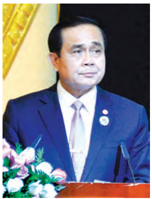
ထိုင်းဝန်ကြီးချုပ် မစ္စတာ ပရာယူဒ်ချန်ဆိုရာ