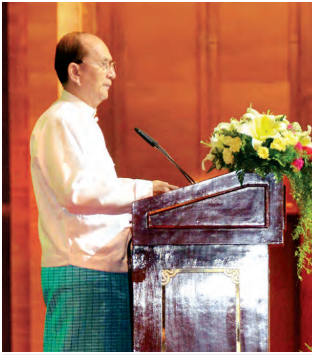
နိုင်ငံတော်သမ္မတ ဦးသိန်းစိန် (၆)ကြိမ်မြောက် ဧရာဝတီ-ကျောက်ဖယား-မဲခေါင် စီးပွားရေးပူးပေါင်းဆောင်ရွက်မှု မဟာဗျူဟာ (အက်မက်စ်)ထိပ်သီး အစည်းအဝေးဖွင့်ပွဲတွင် မိန့်ခွန်းပြောကြားစဉ်။ (သတင်းစဉ်)

အစည်းအဝေးသို့ တက်ရောက်လာ ကြသည့် အက်မက်စ်အဖွဲ့ဝင်နိုင်ငံ များမှ အစိုးရအဖွဲ့အကြီးအကဲများနှင့် အာဆီယံအတွင်းရေးမှူးချုပ်တို့အား ကွန်ဗင်းရှင်းဗဟိုဌာန အဝင်မုခ်ဦးမှ ရင်းနှီးခင်မင်စွာ ကြိုဆိုနှုတ်ဆက်ပြီး စုပေါင်းမှတ်တမ်းတင် ဓာတ်ပုံရိုက် သည်။ ဖွင့်ပွဲအခမ်းအနားတွင် နိုင်ငံ တော်သမ္မတက မိန့်ခွန်းပြောကြားရာ၌ မြန်မာနိုင်ငံ ပုဂံမြို့တွင် ကျင်းပခဲ့သည့် ပထမဆုံးအကြိမ် ထိပ်သီးအစည်း အဝေးအပြီး စတင်ပေါ်ပေါက်လာ သည့် ဧရာဝတီ-ကျောက်ဖယား- မဲခေါင် စီးပွားရေး ပူးပေါင်းဆောင် ရွက်မှု မဟာဗျူဟာ(အက်မက်စ်)၏ (၆)ကြိမ်မြောက် ထိပ်သီးအစည်း အဝေးကို အိမ်ရှင်အဖြစ် ထပ်မံ လက်ခံ ကျင်းပခွင့် ရရှိသည့်အတွက် မိမိတို့နိုင်ငံအနေဖြင့် များစွာ ဝမ်းမြောက်ဂုဏ်ယူရပါကြောင်း။ ပုဂံကြေညာချက်၏ အနှစ်သာရ ဖြစ်သည့် ဒေသတွင်း ပိုမိုပေါင်းစည်း ရေးအတွက် နိုင်ငံရေးအရ ကတိ ကဝတ်ပြုထားရှိမှုများကို ပြန်လည် အားသစ်လောင်းသွားကြရမည် ဖြစ် ပါကြောင်း၊ မိမိတို့အကြား ပူးပေါင်း ဆောင်ရွက်မှုများ မြှင့်တင်ခြင်းမှ