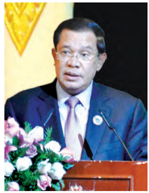
ကမ္ဘောဒီးယားဝန်ကြီးချုပ် အောင်ကျော်စွာ

ယင်းနောက် နိုင်ငံတော်သမ္မတ ဦးသိန်းစိန်က နိဂုံးချုပ်အမှာစကား ပြောကြားပြီး အက်မက်စ် ပူးတွဲစီးပွားရေးကောင်စီအဖွဲ့ဝင်များ တွေ့ဆုံပွဲကို ရုပ်သိမ်းလိုက်သည်။