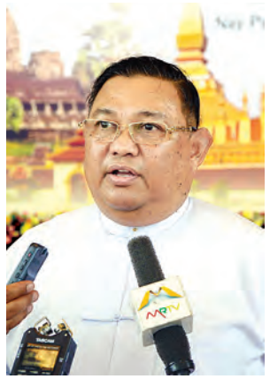
ပြည်ထောင်စု ဦးဝဏ္ဏမောင်လွင် မီဒီယာများအား မြေကြားစဉ်။

ဆိုရင်လုပ်ငန်း(၁၁)ခု၊ အက်မက်စ်မှာ လုပ်ငန်း(၈)ခုရှိပါတယ်။ မြန်မာနိုင်ငံ အနေနဲ့ ဦးဆောင်ဦးရွက်လုပ်နေတာ က လယ်ယာကဏ္ဍ၊ စွမ်းအင်နဲ့ စက်မှု ကဏ္ဍတွေပါ။ ဒီအထဲမှာမှ စီအယ်လ် အမ်ပီနယ်မြေ နိုင်ငံတွေရဲ့ဒေသတွင်း၊ အက်မက်စ်မှာဆိုရင် ထိုင်းအပါအဝင် (၅)နိုင်ငံအတွင်းမှာ မြန်မာနိုင်ငံ အနေနဲ့ ပြည်သူ့အချင်းချင်းထိတွေ့မှု ယဉ်ကျေးမှုပိုင်းဆိုင်ရာ၊ လူ့ဝင်ပိုင်း ဆိုင်ရာတွေမှာ ပိုမိုထိတွေ့နိုင်ဖို့နဲ့ နောင်အနာဂတ်မျိုးဆက်သစ်တွေမှာ လည်း ဒီလိုတူညီပညာသင်ကြားဖို့ အခွင့်အလမ်းရရှိခြင်းအားဖြင့် သူတို့ တွေကြီးပြင်းလာပြီး ဦးဆောင်ဦးရွက် ပြုလုပ်မယ့်အချိန်ကျရင် နိုင်ငံရေး ပိုင်းပဲဖြစ်ဖြစ်၊ စီးပွားရေးပိုင်းပဲဖြစ် ဖြစ်၊ လူမှုရေးပိုင်းပဲဖြစ်ဖြစ် ဒီလို ညီညွတ်ညွတ်နဲ့ တစ်ယောက် အကြောင်း တစ်ယောက်ပိုမိုထိတွေ့ ပြီးတော့ ဒေသတွင်းနိုင်ငံတွေရဲ့ အကျိုးစီးပွားကို ဖော်ဆောင်နိုင်ဖို့ အတွက် မြန်မာနိုင်ငံက ဦးဆောင်