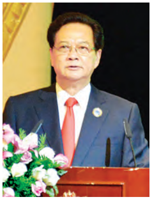
ဗီယက်နမ်ဝန်ကြီးချုပ် မစ္စတာ ငုယင်တန်ရှန်း