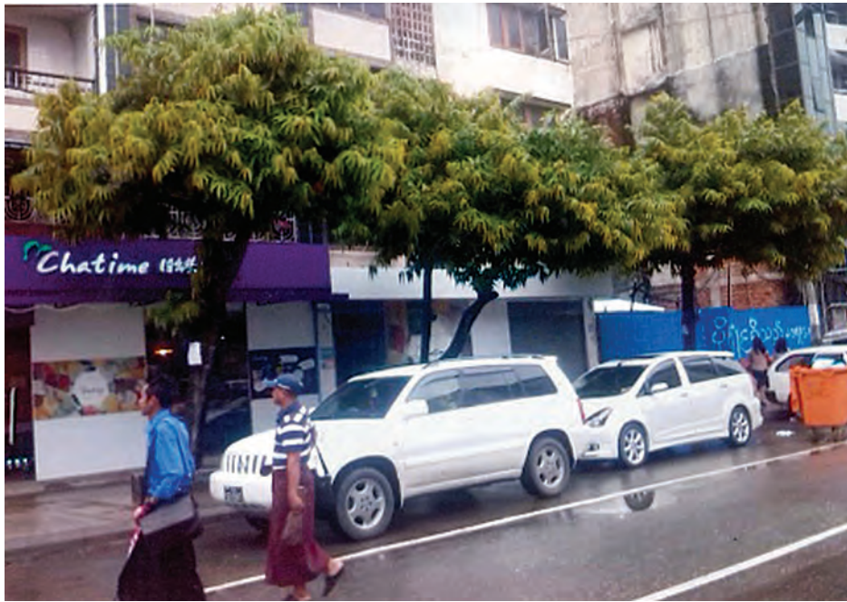
ပန်းခြံရွှေ၊ ကမ်းနားလမ်းဟောင်းနှင့် လမ်းသစ်ကြားတွင် မြင်တွေ့ရဆဲဖြစ်သည်။

မိုးရာသီအစပိုင်း မြန်မာပြည်တစ်ဝန်း သစ်ပင်စိုက်ပျိုးခြင်း ပြင်ဆင်ဆောင်ရွက်နေကြသည်။ လမ်းမတော်မြို့နယ်အတွင်း လမ်းသစ်လမ်း၊ ဘုန်းကြီးလမ်းဝဲယာတွင် အရိပ်ရသစ်ပင်တန်းများဖြင့် စိမ်းလန်းစိုပြည်နေသည်။ နေပူဒဏ်မှရှောင်လွှဲ၍ လမ်းသွားလမ်းလာများ သွားလာနိုင်သည်။ လမ်းသစ်လမ်းတွင် ဝဲယာနှစ်ဖက်သာမက လမ်းလယ်တွင်ပါ အုတ်ခုံများဖြင့် အရိပ်ရပင်များစီတန်းမြင်တွေ့နေရဆဲဖြစ်သည်။ လမ်းလယ်အုတ်ခုံအချို့ ယာဉ်တိုက်မှုကြောင့် သစ်ပင်များသေ၊ အုတ်ခုံများ ပျက်စီးမှုရှိရာ ပြန်လည်စိုက်ပျိုးခြင်း၊ အုတ်ခုံအသစ်ပြုလုပ်ထားသည်ကို မြင်တွေ့ရသည်ဟု လမ်းသစ်လမ်းတွင် နေထိုင်နေသူများက ပြောသည်။