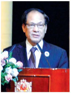
အာဆီယံအတွင်းရေးမျိုးချုပ် မစ္စတာ လီယောင်မင်

ခွဲပြီးဖြစ်ပါကြောင်း၊ ရင်းနှီးမြှုပ်နှံမှုကဏ္ဍတွင် ရင်းနှီးမြှုပ်နှံသူများအတွက် ပိုမိုရင်းနှီးကျွမ်းဝင်စေပြီး ပွင့်လင်းမြင်သာမှုရှိ၍ လုံခြုံမှုရှိစေမည့်ရင်းနှီးမြှုပ်နှံမှုဝတ်ဝန်းကျင်တစ်ခု ဖန်တီးရန် ရည်ရွယ်ပြီး နိုင်ငံခြားရင်းနှီးမြှုပ်နှံမှု ဥပဒေကို ၂၀၁၂ ခုနှစ်တွင် ပြဋ္ဌာန်းခဲ့ပါကြောင်း၊ နိုင်ငံခြားရင်းနှီးမြှုပ်နှံမှု နည်းဥပဒေကို ၂၀၁၃ ခုနှစ် ဇန်နဝါရီလတွင် ထုတ်ပြန်ခဲ့ပါကြောင်း။