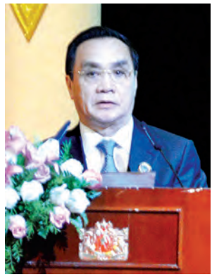
လာအိုဝန်ကြီးချုပ် မစ္စတာ သွန်ဆင်းသမာဗောင်