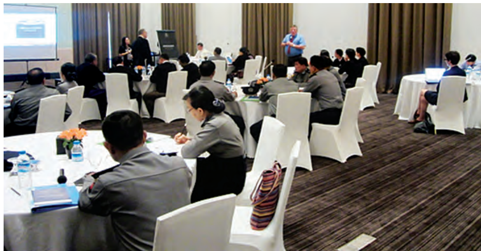
အလုပ်ရုံဆွေးနွေးပွဲတွင် ဩစတြေးလျ-အာရှ လူကုန်ကူးမှုတိုက်ဖျက်ရေးစီမံကိန်း (AAPTIP) မှ နိုင်ငံတကာအကြံပေးအရာရှိ Mr. NEALE MARCUS FURSDON ဆွေးနွေးနေစဉ်။

လူကုန်ကူးမှု တားဆီးကာ ကွယ်ရေးပဟိုအဖွဲ့၏ ဦးဆောင်မှုဖြင့် မြန်မာနိုင်ငံ ရဲတပ်ဖွဲ့နှင့် ဩစတြေးလျ-အာရှ လူကုန်ကူးမှု တိုက်ဖျက်ရေးစီမံကိန်း (AAPTIP) တို့က အကောင်အထည်ဖော်ဆောင်ရွက်မည့် လုပ်ငန်းစဉ်များအရ ဥပဒေအရာရှိများနှင့် လူကုန်ကူးမှု စုံစမ်းစစ်ဆေးသူ အမှုစစ်များအတွက် လူကုန်ကူးမှု ပူးပေါင်းဆောင်ရွက်ရေး လမ်းညွှန်ချက်များနှင့် တရားစီရင်ရေးဆိုင်ရာ အလုပ်ရုံဆွေးနွေးပွဲကို ဇွန် ၁၆ နှင့် ၁၇ ရက်တို့တွင် နေပြည်တော်ရှိ The Lake Garden Hotel မှ ကျင်းပခဲ့သည်။