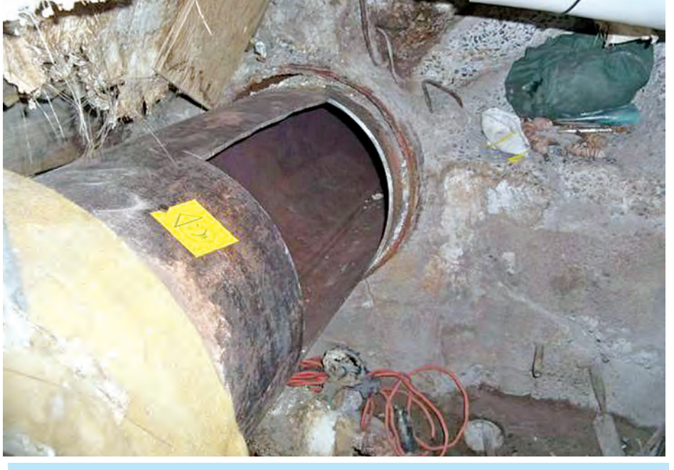
အကျဉ်းသားနှစ်ဦး အယ်နီမိုရာအကျဉ်းထောင်မှ ထွက်ပြေးရန်ဖောက်ခဲ့သော ပိုက်လိုင်းအားတွေ့မြင်ရစဉ်။