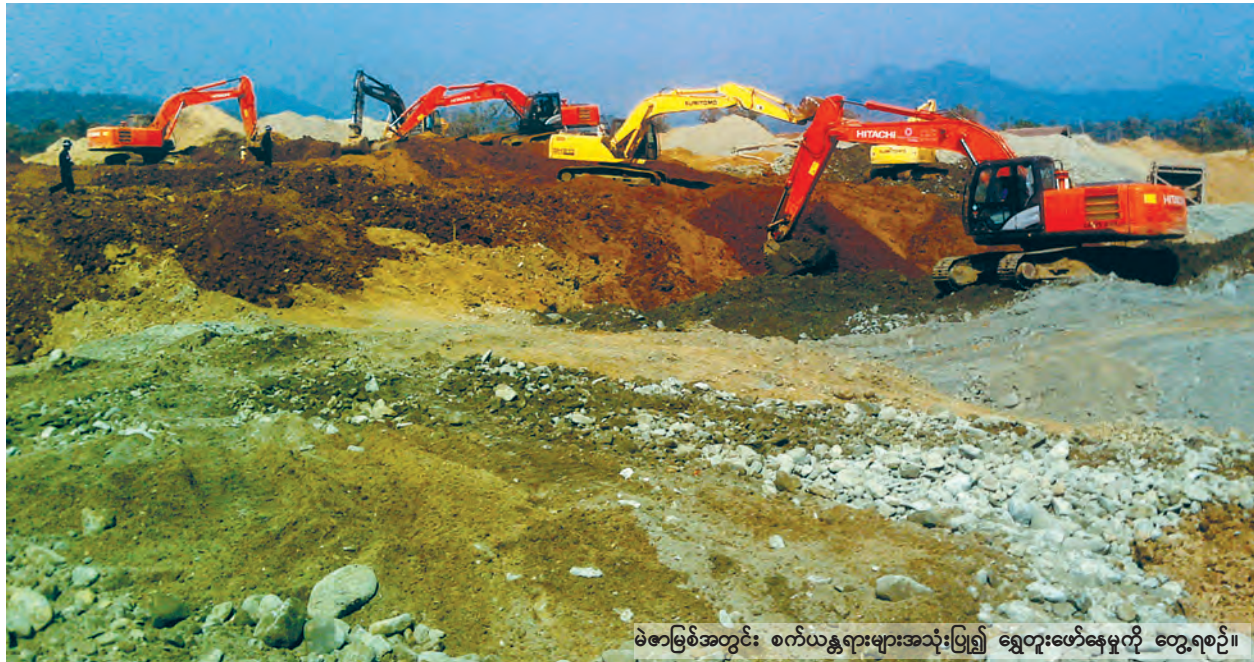
မဲဇာမြစ်အတွင်း စက်ယန္တရားများအသုံးပြု၍ ရွှေတူးဖော်နေမှုကို တွေ့ရစဉ်။