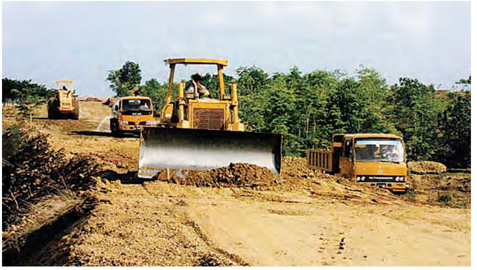
အမြန်လမ်းထိန်းသိမ်းရေးအဖွဲ့က ကျေးရွာချင်းဆက်ကုန်ထုတ်ကားလမ်း ရန်ကုန်-မန္တလေးအမြန်လမ်းမိုင်တိုင်အမှတ် ၅၄၉ တွင် ဆောင်ရွက်နေစဉ်။

ကျေးလက်ဒေသနေပြည်သူများလမ်းပန်းဆက်သွယ်မှုလွယ်ကူချောမွေ့၍ ကုန်ထုတ်လုပ်ငန်းများ ကောင်းမွန်စေရန် ရည်ရွယ်လျက် ရန်ကုန်-မန္တလေးအမြန်လမ်း နံဘေးတွင် ကျေးရွာချင်းဆက်ကုန်ထုတ်ကားလမ်း တစ်လမ်းကိုဆောက် လုပ်ရေးဝန်ကြီးဌာန ရန်ကုန်-မန္တလေးအမြန်လမ်းထိန်းသိမ်းရေးအဖွဲ့က ဖောက်လုပ်လျက်ရှိသည်။ ယင်းကျေးရွာချင်းဆက်လမ်းကို ဆောင်ရွက်ရာတွင် ပြည်ထောင်စု ငွေလုံးငွေရင်း ရန်ပုံငွေဖြင့် ဆောင်ရွက်ခြင်းဖြစ်ပြီး လမ်းအကျယ် ၁၈ပေ ကို ကျောက်ရောမြေများခင်းပေးထားသည်ဟု သိရသည်။ အမြန်လမ်းထိန်းသိမ်းရေးအဖွဲ့သည် အဆိုပါကျေးရွာချင်းဆက်လမ်းကို ၂၀၁၃-၂၀၁၄ ဘဏ္ဍာရေးနှစ်တွင် သုံးပိုင်း၊ ၂၀၁၄-၂၀၁၅ ဘဏ္ဍာရေးနှစ်တွင် မိုင်တိုင်အမှတ် ၂၅၄ မှ ၂၅၉ အထိ စုစုပေါင်း ၅ မိုင်ကို ကျောက်ရောမြေလမ်းအဖြစ် ဆောင်ရွက်သွားမည်ဟု သိရသည်။ အဆိုပါကျေးရွာချင်းဆက်လမ်းကို ပဲခူးတိုင်းဒေသကြီး လမ်းဦးစီးဌာနနှင့် နေပြည်တော်လမ်းဦးစီးဌာနတို့က လမ်းအပိုင်းလိုက်ဖောက်လုပ်နေသည်ဟု သိရသည်။