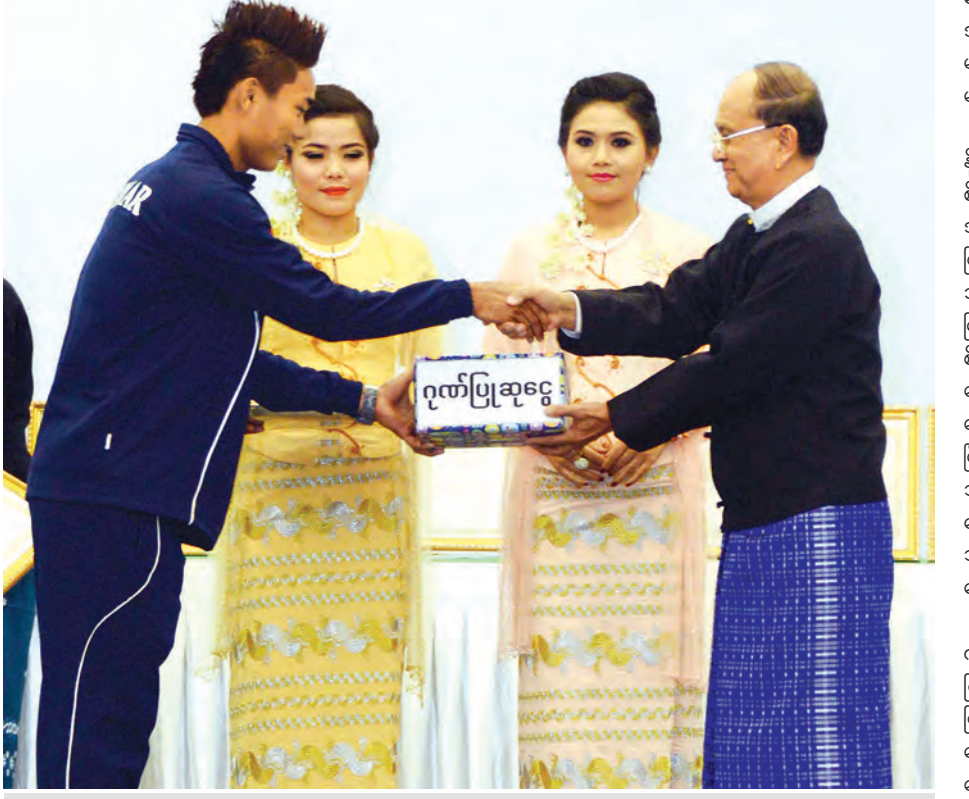
နိုင်ငံတော်သမ္မတ ဦးသိန်းစိန် မြန်မာယူ-၂၃ ဘောလုံးအသင်း၊ ဂိုးသမား၊ ကျော်စင်ဖြိုးအား ဂုဏ်ပြုဆုပေးအပ်ချီးမြှင့်စဉ်။ (သတင်းစဉ်)

ယင်းနောက် နိုင်ငံတော်သမ္မတက မြန်မာယူ-၂၀ ဘောလုံးအသင်း၊ မြန်မာယူ-၂၃ ဘောလုံးအသင်း၊ မြန်မာ့လက်ရွေးစင် အမျိုးသမီးဘောလုံးအဖွဲ့ချုပ်၊ မြန်မာနိုင်ငံဘောလုံးအဖွဲ့ချုပ်၊ မြန်မာနိုင်ငံပြေးခုန်ပစ်အဖွဲ့ချုပ်၊ မြန်မာနိုင်ငံဘီလီယက်နှင့် စနူကာအဖွဲ့ချုပ်၊ မြန်မာနိုင်ငံလက်ဝှေ့အဖွဲ့ချုပ်၊ မြန်မာနိုင်ငံ ဂျူဒိုအဖွဲ့ချုပ်၊ မြန်မာနိုင်ငံ လှေလှော်အဖွဲ့ချုပ်၊ မြန်မာနိုင်ငံ ဟော်လီအဖွဲ့ချုပ်၊ မြန်မာနိုင်ငံပိုက်ကျော်ခြင်းအဖွဲ့ချုပ်၊ မြန်မာနိုင်ငံပိုက်ကျော်ခြင်းအဖွဲ့ချုပ်၊ မြန်မာနိုင်ငံ သေနတ်ပစ်အဖွဲ့ချုပ်၊ မြန်မာနိုင်ငံ တိုက်ကွမ်ဒိုအဖွဲ့ချုပ်၊ မြန်မာနိုင်ငံဘော်လီဘောအဖွဲ့ချုပ်၊ မြန်မာနိုင်ငံဂူရူးအဖွဲ့ချုပ်