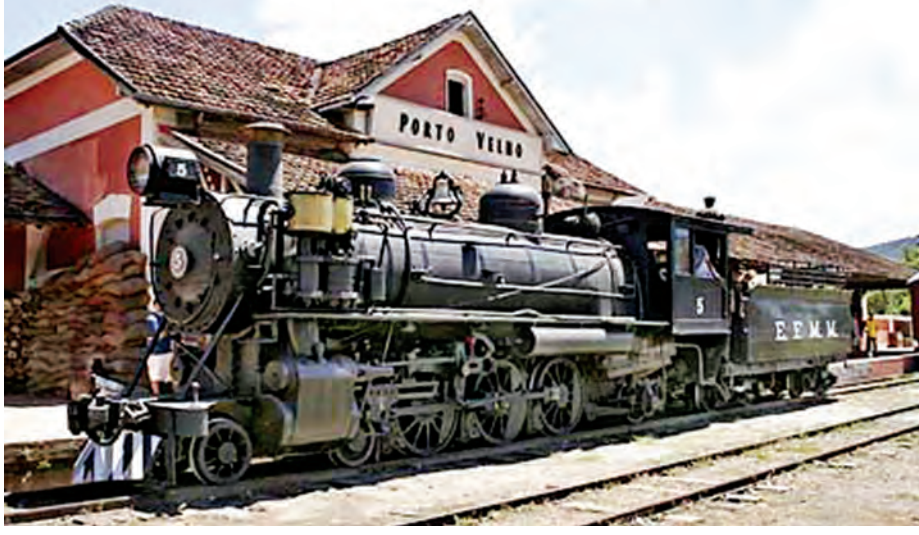
၁၉၁၂ ခုနှစ်က စတင်ဖွင့်လှစ်ခဲ့သည့် ရထားလမ်း