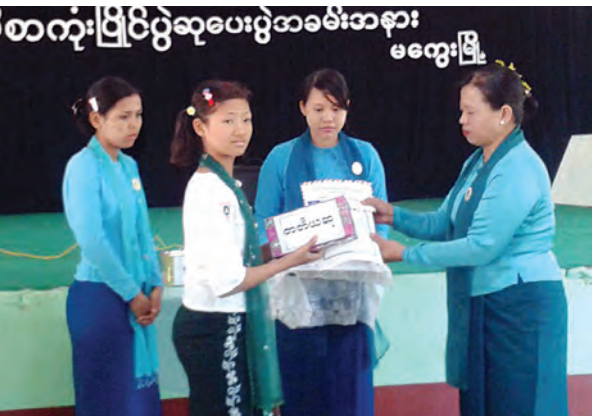
မြန်မာအမျိုးသမီးများနေ့ အထိမ်းအမှတ် အလယ်တန်းအဆင့် စာစီစာကုံးပြိုင်ပွဲကို မကွေးမြို့ အထက(၄) ကျောင်း၌ ဇွန်လတတိယပတ်က ကျင်းပရာ ဆုရရှိသူများကို လူမှုရေးအဖွဲ့အစည်းများမှ တာဝန်ရှိသူများက ဆုများချီးမြှင့်စဉ်။ မေမိုးသဲ