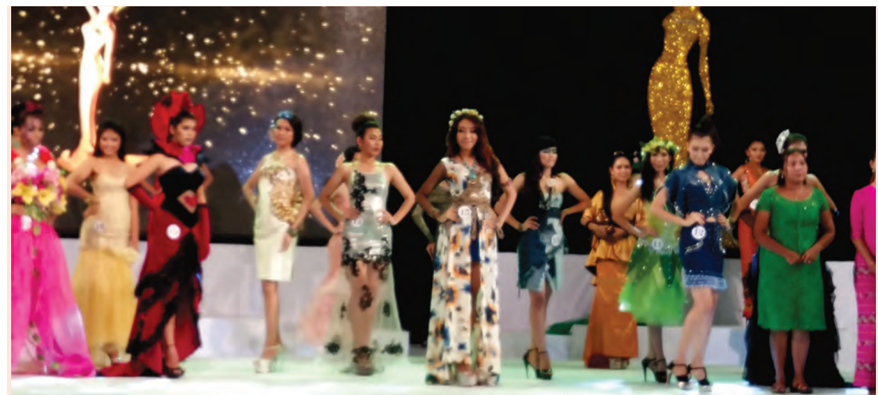
Miss Golden Land Myanmar ကမ္ဘာ့အလှဆုံးမယ်မင်းမာရီ စမ်းသုံးမင်းမာရီ Top Model ဖြစ်ပွဲကို ဇွန် ၂၀ ရက်က ရန်ကုန်မြို့ မင်းဓမ္မလမ်းရှိ MCC ဓနိုးမဉ် ကျင်းပစဉ်။

မော်တင်လူကူး ခုံးကျော်တံတား သည် ယာဉ်အသွားအလာများသော လမ်းမကြီးနှစ်ခုဖြစ်သည့် လမ်းသစ် လမ်းနှင့် ကမ်းနားလမ်းကို ဖြတ်၍ တည်ဆောက်နေခြင်း ဖြစ်သည်။ လမ်းမကြီးနှစ်ခုကိုဖြတ်လျက် စုစုပေါင်း အရှည် ၂၇၂ ပေရှိကာ ရန်ကုန်မြို့