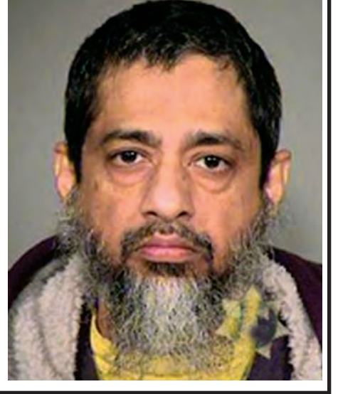
အကျဉ်းထောင်ဒဏ်ချမှတ်ခံရသူ ဖြစ်သည့် အလုပ်သမားတစ်ဦး၏ ပုံရိပ်။