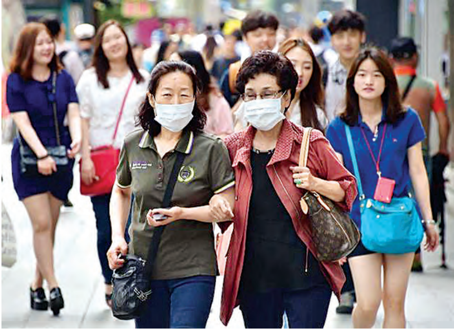
သုံးဦးနှင့် သောကြာနေ့တွင် တစ်ဦး ဖြစ်ပွားခဲ့ပြီး စနေနေ့တွင် ရောဂါ ထပ်မံဖြစ်ပွားမှုမရှိဟု ဆိုသည်။ စနေနေ့တွင် မားစ်ရောဂါကြောင့် သေဆုံးသူမရှိသော်လည်း တောင်ကိုရီးယားနိုင်ငံ၌ ယင်းရောဂါကြောင့် သေဆုံးသူ ၂၄ ဦးအထိ ရှိသွားပြီဖြစ်ကြောင်း သိရသည်။ (ဆင်ဟွာ)

လောလောဆယ်တွင် ဗုဒ္ဓဟူးနေ့က ရှစ်ဦး၊ ကြာသပတေးနေ့က