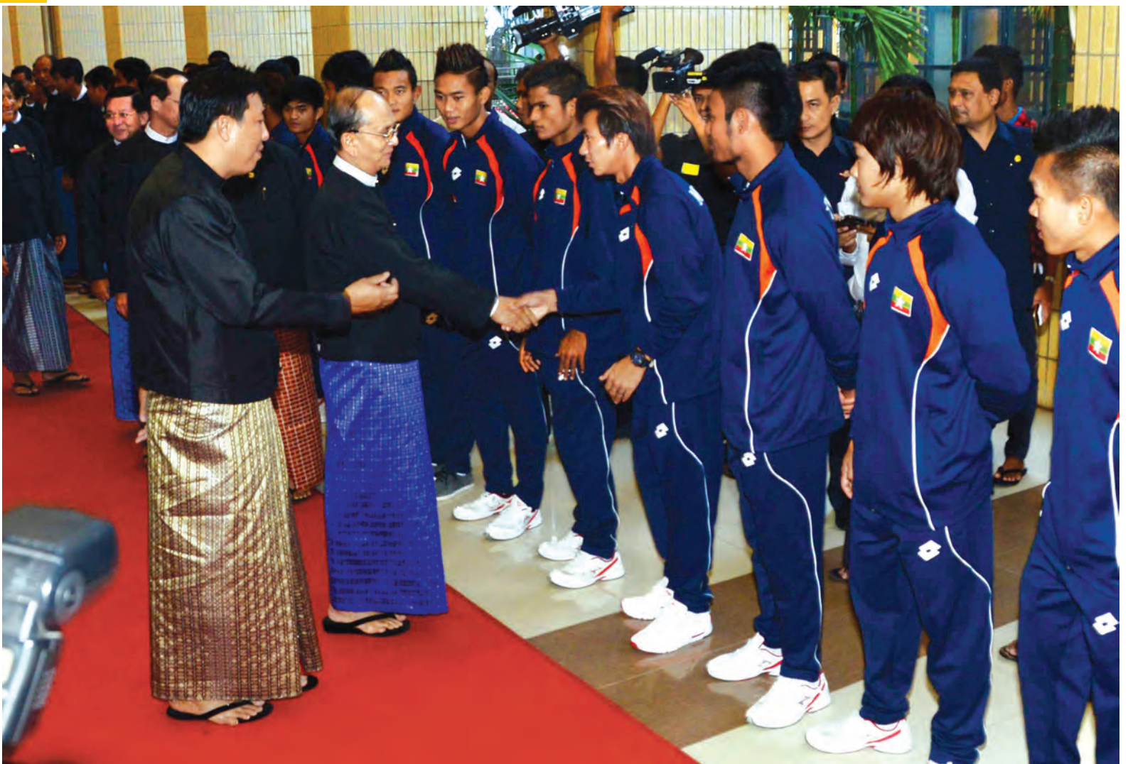
နိုင်ငံတော်သမ္မတ ဦးသိန်းစိန် နိုင်ငံ့ဂုဏ်ဆောင်အားကစားသမားများအား ဂုဏ်ထူးဆောင်လက်မှတ်ချီးမြှင့်ခြင်းနှင့် ဂုဏ်ပြုညစာစားပွဲအခမ်းအနားတွင် တက်ရောက်လာကြသူများအား (သတင်းစဉ်)

ယခုဆိုလျှင် မြို့နယ်များတွင် အားကစားကလပ်အသင်း စုစုပေါင်း ၁၀၄၇ ခု ဖွဲ့စည်းလှုပ်ရှားနေပြီဖြစ်ပြီး အားကစားနှင့် ကာယသိပ္ပံလေးခုအပြင် အားကစားနှင့် ပညာရေးပေါင်းစပ်မှု အစီအစဉ်များအဖြစ်