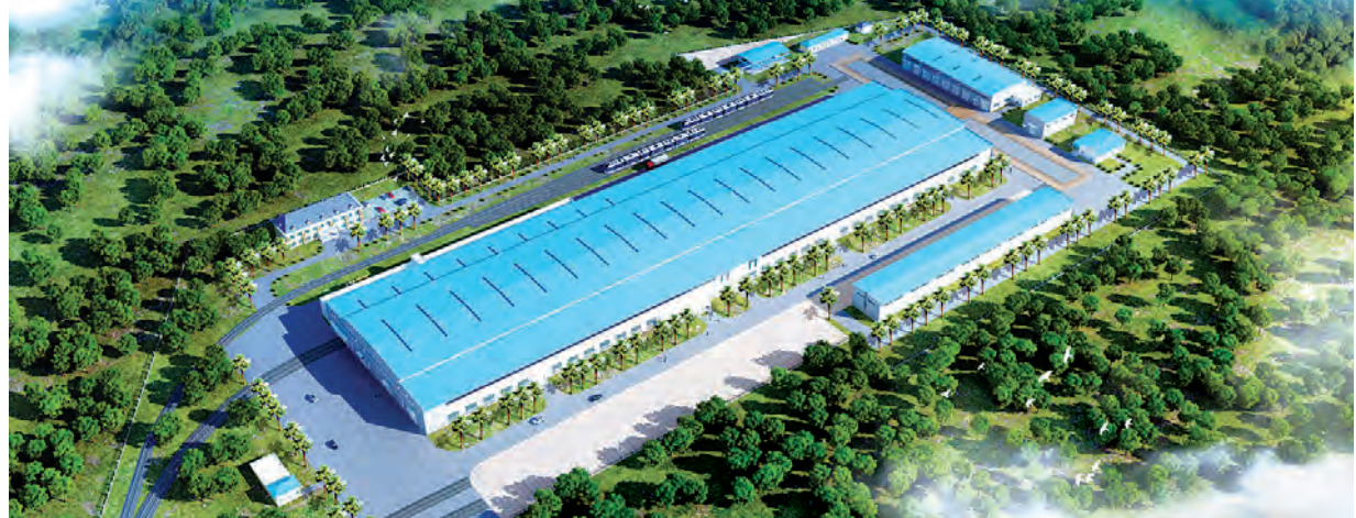
လူစီးရထားတွဲ သစ်များ ထုတ်လုပ်မည့် မြစ်ငယ်ရထား တွဲစက်ရုံ ပုံစံငယ်။

မြန်မာ့မီးရထားအနေဖြင့် ဖွံ့ဖြိုးတိုးတက်ရေးလုပ်ငန်းများကို ဆောင်ရွက်လျက်ရှိရာ ရန်ကုန်ဘူတာကြီး ဖွံ့ဖြိုးတိုးတက်ရေးစီမံကိန်း၊ ဆက်သွယ်ရေးကောင်းမွန်ရန် အတွက် ရထားလမ်းတစ်လျှောက်ရှိ Optical Fiber Cable ဆက်ကြောင်းများ သွယ်တန်းခြင်းလုပ်ငန်း၊ ကုန်းတွင်းဆိပ်(Dry Port) များ ဖွံ့ဖြိုးတိုးတက်ရေးနှင့် ကုန်သွယ်တင်စားရေး (Containerization) ပုဂ္ဂလိကဘူတာ၊ ကြည့်မြင်တိုင်ဘူတာ၊ ပုဂံဘူတာ အဆင့်မြှင့်တင်ရေးနှင့် ဖွံ့ဖြိုးတိုးတက်ရေးစီမံကိန်း