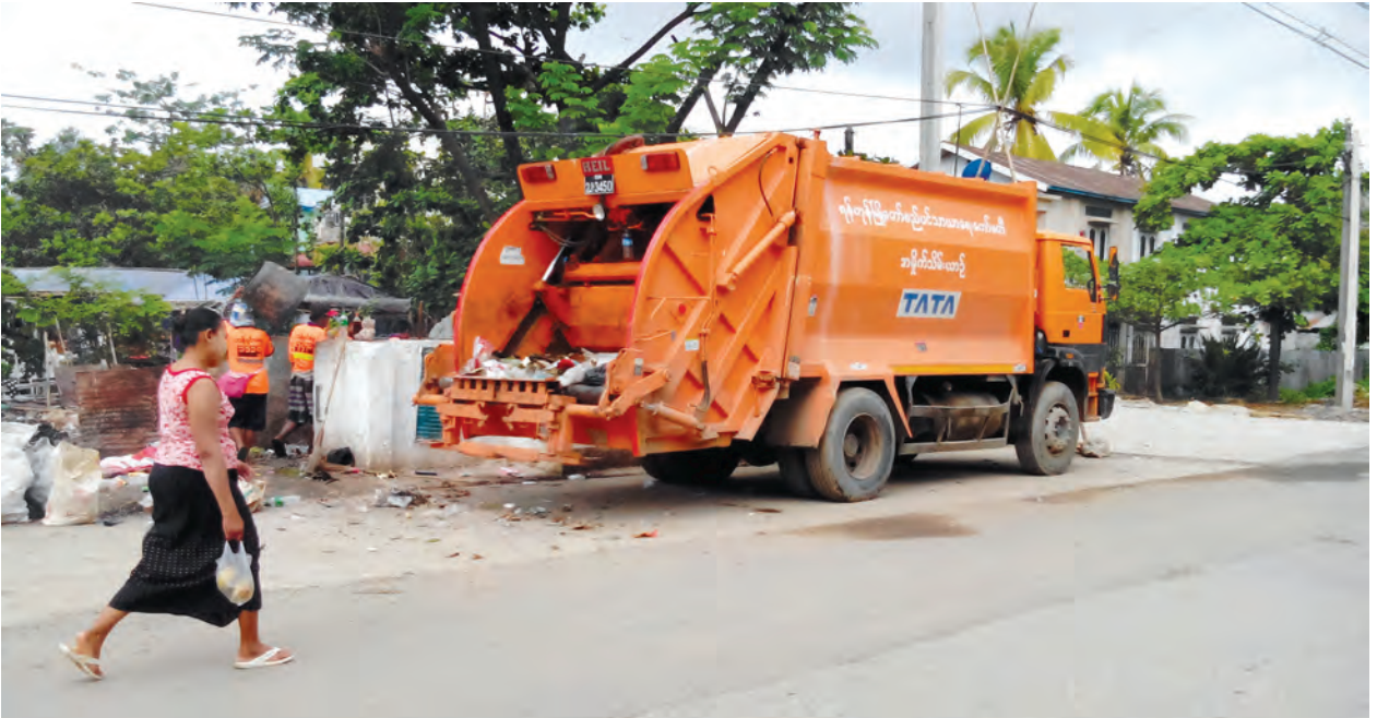
ဓာတ်အားထုတ်လုပ်သွားမည်ဖြစ်ကြောင်း သိရသည်။

ထိန်ပင်အမှိုက်ပုံမှ မိသိန်းဓာတ်ငွေ့မှတစ်ဆင့် လျှပ်စစ်ဓာတ်အားထုတ်လုပ်ခြင်းဖြစ်ပြီး ထားဝယ်ချောင်အမှိုက်ပုံမှ အမှိုက် မီးရှို့စက်အသုံးပြု၍ ဓာတ်အား ထုတ်လုပ်ခြင်းဖြစ်ရာ ယခုရွှေ့ပြည်သည့်အမှိုက်ပုံမှလည်း မီးရှို့စက်အသုံးပြု၍