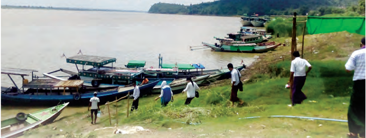
အကောက်တောင် ရေယာဉ်ဆိပ်ကို တွေ့ရစဉ်။

ဒေသကြီး မြန်မာ့ကမ်းရိုးတန်းနှင့် ပြည်တွင်းရေကြောင်း သယ်ယူပို့ ဆောင်ရေးလုပ်ငန်း ကြီးကြပ်မှု ကော်မတီသို့ ခွင့်ပြုချက်လျှောက် ထားခဲ့သည်။