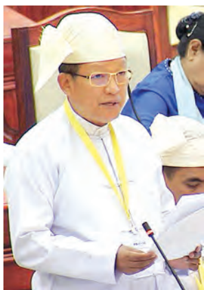
ဒုတိယဝန်ကြီး ဦးတင်ဦးလွင် ဖြေကြားစဉ်။ (သတင်းစဉ်)

ပြည်သူ့လွှတ်တော် (၁၂)ကြိမ်မြောက် ပုံမှန်အစည်းအဝေး ၆၇ ရက်မြောက်နေ့ကို ယနေ့နံနက်ပိုင်းတွင် ကျင်းပသည်။