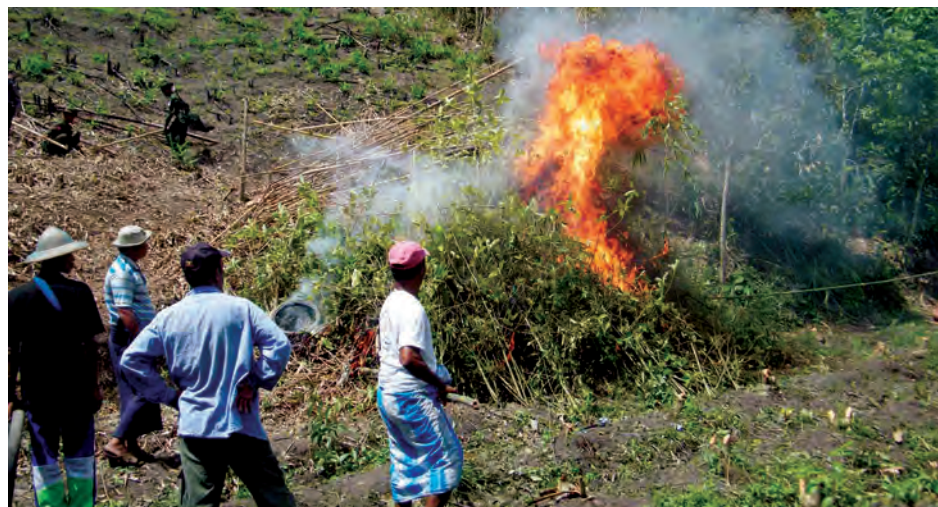
နန်းသာရီ-ထိန်ဝင်း(iprd)

ပေါက်ရောက်ရာနေရာတွင် ခရိုင်/ မြို့နယ်များမှ အဖွဲ့အစည်းများက ပူးပေါင်း၍ အမြစ်ပါမကျန်ခုတ်ထွင်၍ မီးရှို့ဖျက်ဆီးခဲ့ကြကြောင်း သိရသည်။ (အောက်ပုံ) ပူးပေါင်းအဖွဲ့ဖြင့် မီးရှို့ဖျက်ဆီးခဲ့သည့် ဘိန်းစာပင် ပေါင်း (၁၆၄၄)ပင်ဖြစ်ပြီး ဘိန်းစာရွက်များအားလုံး၏ အလေးချိန်မှာ(၁၀၄၅. ၇၉)ကီလိုဂရမ်ဖြစ်ကြောင်း သိရ သည်။