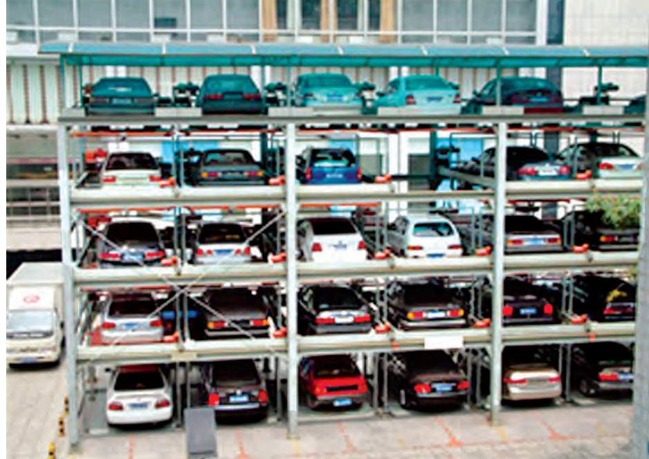
နိုင်ငံတကာတွင် ယာဉ်ကြောပိတ်ဆို့မှုများကို ဤသို့ အထပ်မြင့်ကားပါကင်များနှင့် ဖြေရှင်းလျက်ရှိသည်။

ရှိတဲ့ကားပါကင်အခက်အခဲကို ဖြေလည်သွားစေချင်ပါ တယ်”ဟု ၎င်းကဆက်လက်ပြောကြားသည်။ အဆိုပါ နည်းပညာအခြေပြု အဆင့်မြင့်ကားပါကင် စနစ်ကို အမေရိကန်နိုင်ငံက စတင်အသုံးပြုခဲ့ပြီး ယခုအခါ ဂျပန်၊ ကိုရီးယားနှင့်တရုတ်နိုင်ငံတို့ရှိ မြို့ပြများ၌ တွင်ကျယ် စွာ အသုံးပြုလျက်ရှိကြောင်းသိရသည်။ မြစ်စနီသင်းဇော်