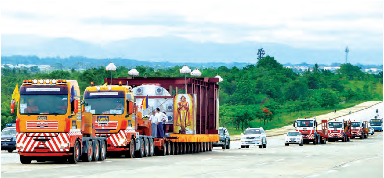
အောင်မောဠိတောင်ခြေသို့ ရောက်ရှိ ပြီဖြစ်သည်။ ရုပ်ရှင်တော်မြတ်ကြီးအား ကိန်း ဝပ်စံပယ်တော်မူမည့် တောင်တော် ညွန့်သို့ မင်္ဂလာကရိန်းယာဉ်များဖြင့် ဆက်လက်ပင့်ဆောင် ပူဇော်သွားမည် ဖြစ်ပြီး အနေကဇာတင်မင်္ဂလာ ထက်၌ ဆင်ယင်ကျင်းပသွားမည် အခမ်းအနားနှင့် ရေစက်ချမင်္ဂလာ ဖြစ်ကြောင်း သိရသည်။ အခမ်းအနားကို အဆိုပါ တောင်ညွန့် တင်ထွန်းအောင်

အတွက် ရေစက်သွန်းချအမျှပေးဝေ ကြသည်။ ယင်းနောက် ရုပ်ရှင်တော်မြတ် ကြီးအား ယာယီသီတင်းသုံးနေသည့် အေစီအီး အလုပ်ရုံအတွင်းမှ ကိန်းဝပ် စံပယ်တော်မူမည့် အောင်မောဠိ တောင်သို့ မော်တော်ယာဉ်များဖြင့် ပင့်ဆောင်ပူဇော်ကြသည်။ ထိုသို့ ပင့်ဆောင်ပူဇော်စဉ် ဝန်ကြီးဌာနများမှ ဝတ်အသင်းအဖွဲ့ များက ဝတ်ရွတ်စဉ်များဖြင့် ရွတ်ဖတ် ပူဇော်ကြရာ လမ်းဘေးဝဲယာ၌ ဒေသခံပြည်သူများကလည်း လာ ရောက်ဖူးမြော်ကြည့်ကြသည်။ အဆိုပါ ရုပ်ရှင်တော်မြတ်ကြီး အား ဆင်နှစ်ကောင်မိသားစုကုမ္ပဏီ ပိုင် အလျား ပေ ၉၀၊ ဘီးလုံး ၁၂၂ လုံးနှင့် အလိုက်သင့် ကွေ့နိုင်သော စတီယာရင် စနစ်ပါဝင်သည့် Heavy Modular Trailer ယာဉ်ကြီးဖြင့် သယ်ယူပင့်ဆောင်ခဲ့ရာ ယခုအခါ