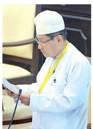
ဒုတိယဝန်ကြီး ဦးခင်ဇော် ဖြေကြားစဉ်။ (သတင်းစဉ်)

လေ့လာမှုများအရ တံတားအရှည်ပေ ၁၂၀၀ ခန့် တည်ဆောက်ရန် လိုအပ်ပါကြောင်း၊ ပလက်ဝမြို့ တစ်ဖက်ကမ်း၌ ခေတ်မီဆိပ်ကမ်း တည်ဆောက်လျက်ရှိပြီး သင်္ဘောကြီးများ ဝင်/ထွက် သွားလာနိုင်ရန်အတွက် ကုလားတန်မြစ်ကူးတံတား (ပလက်ဝ)ကို ကမ္ဘာ့ဘဏ်က အကူအညီပေးရန် ရေလမ်းကင်းလွတ်အမြင့်အတိုင်း ပေ ၅၀ အမြင့်ထား၍ ရေလမ်းကင်းလွတ် အကျယ်ပေ ၂၀၀ ရရှိအောင် ပေ ၂၄၀ အကျယ် သံပေါင်နှစ်ခန်းဖြင့် ထည့်သွင်းတည်ဆောက်သွားမည်ဖြစ်ပါကြောင်း၊ အသေးစိတ်ပုံစံ ထုတ်လုပ်ခြင်းနှင့် ခန့်မှန်းကုန်ကျစရိတ် တွက်ချက်ပြီးပါက ဒုတိယ (၅)နှစ်စီမံကိန်း၏ ပထမနှစ်ဖြစ်သော ၂၀၁၆-၂၀၁၇ ဘဏ္ဍာရေးနှစ်တွင် ပြည်ထောင်စုအစိုးရအဖွဲ့နှင့် ပြည်ထောင်စုလွှတ်တော်သို့ တင်ပြအတည်ပြုချက်ရယူ တည်ဆောက်သွားမည် ဖြစ်ပါကြောင်း