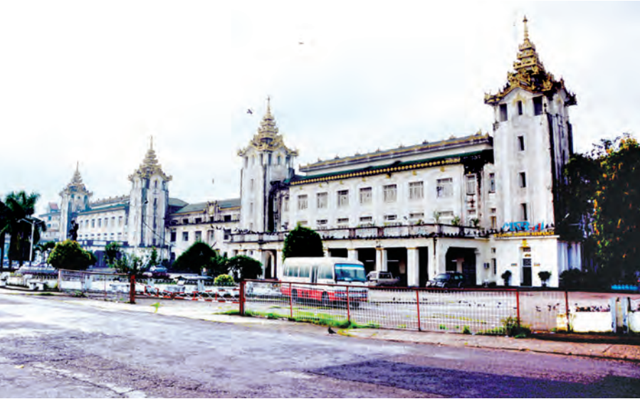
ရှေးမူမပျက် ပြင်ဆင်သွားမည့် ရန်ကုန်ဘူတာကြီးကို တွေ့ရစဉ်။