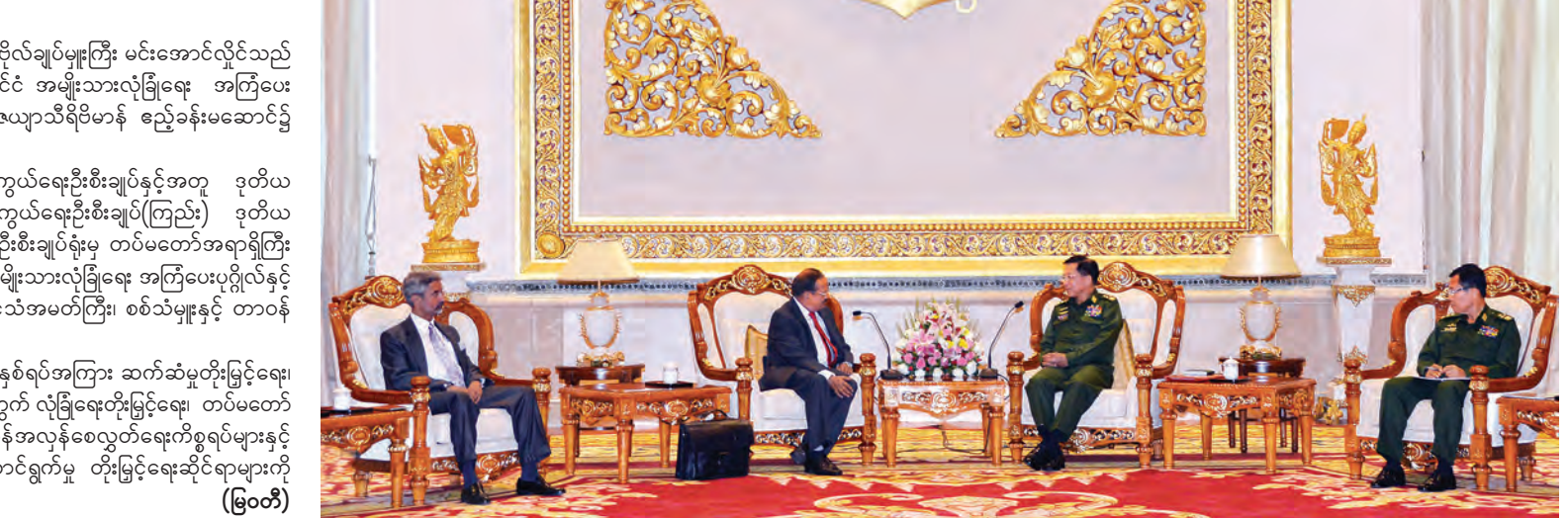
တွေ့ဆုံပွဲသို့ တပ်မတော်ကာကွယ်ရေးဦးစီးချုပ်နှင့်အတူ ဒုတိယ တပ်မတော်ကာကွယ်ရေးဦးစီးချုပ်(ကြည်း) ဒုတိယဗိုလ်ချုပ်မှူးကြီး စိုးဝင်း၊ ကာကွယ်ရေးဦးစီးချုပ်ရုံးမှ တပ်မတော်အရာရှိကြီးများ တက်ရောက်ကြပြီး အိန္ဒိယနိုင်ငံ အမျိုးသားလုံခြုံရေး အကြံပေးပုဂ္ဂိုလ်နှင့်အတူ မြန်မာနိုင်ငံဆိုင်ရာ အိန္ဒိယနိုင်ငံသံအမတ်ကြီး၊ စစ်သံမှူးနှင့် တာဝန်ရှိသူများ တက်ရောက်ကြသည်။

တပ်မတော်ကာကွယ်ရေးဦးစီးချုပ် ဗိုလ်ချုပ်မှူးကြီး မင်းအောင်လှိုင်သည် ယနေ့ မွန်းလွဲ ၂ နာရီခွဲတွင် အိန္ဒိယနိုင်ငံ အမျိုးသားလုံခြုံရေး အကြံပေးပုဂ္ဂိုလ် မစ္စတာ အဂျစ် ဒိုဗယ်အား ဇေယျာသီရိဗိမာန် ဧည့်ခန်းမဆောင်၌ လက်ခံတွေ့ဆုံသည်။ (ယာဝုံ)