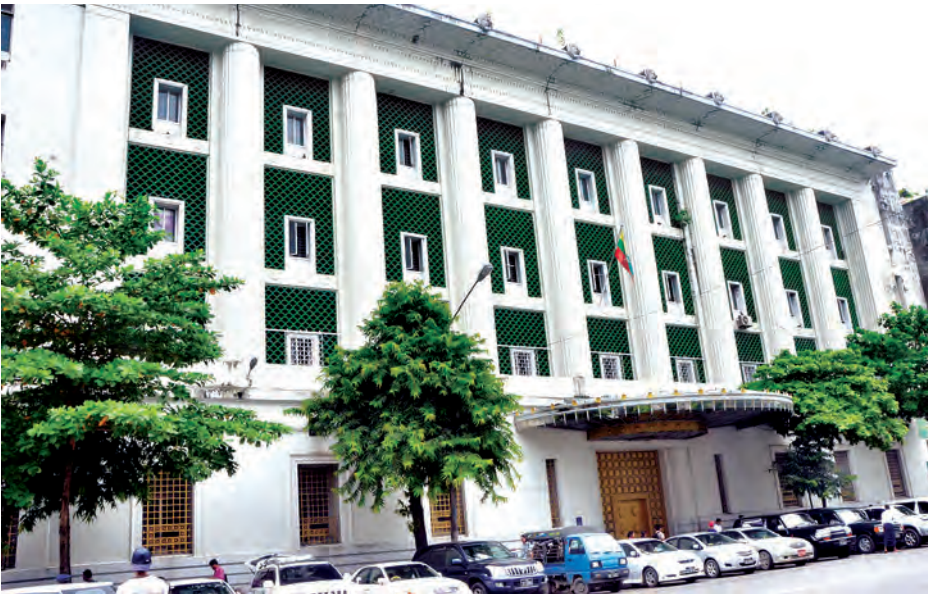
ရန်ကုန်မြို့ပြအမွေအနှစ်အထိမ်းအမှတ်အပြာရောင် ဆွဲမြောက် ကမ္ဘာ့ဦးဆုံးမြန်မာ့လယ်ယာဖွံ့ဖြိုးရေးဘဏ်။

ရန်ကုန်မြို့ ကျောက်တံတားမြို့နယ် ပန်းဆိုးတန်းလမ်းတွင် ၁၉၃၀ ပြည့်နှစ်က တည်ဆောက်ထားခဲ့သော ယနေ့ မြန်မာ့လယ်ယာဖွံ့ဖြိုးရေးဘဏ်အဖြစ် အသုံးပြုနေသည့် အဆောက်အအုံ၏ မျက်နှာစာအမြင်တွင် မြင်တွေ့နိုင်သည်။ ကိုလိုနီခေတ်လက်ရာ ရှေးဟောင်းအမွေအနှစ်တစ်ခုဖြစ်သော အဆိုပါအဆောက်အအုံကို ရန်ကုန်မြို့ပြအမွေအနှစ် ထိန်းသိမ်းစောင့်ရှောက်ရေးအဖွဲ့ကြီးမှူးက ရန်ကုန်မြို့ပြအမွေအနှစ်အဖြစ် အပြာရောင်ကမ္ဘာ့တပ်ဆင်ခြင်းကို ယနေ့နံနက်က အဆိုပါအဆောက်အအုံရှေ့၌ ပြုလုပ်ခဲ့သည်။