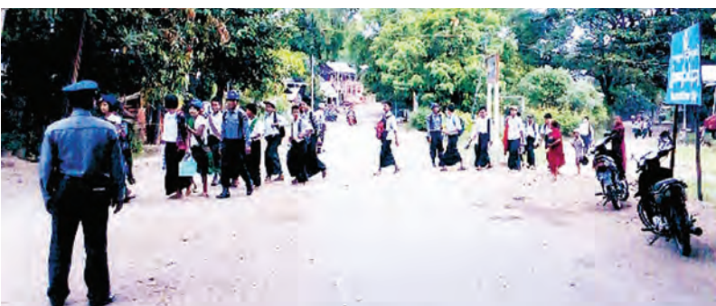
ဇွန် ၁၆ ရက်က မင်းဘူးခရိုင် ငပဲမြို့နယ်မှ ရဲတပ်ဖွဲ့ဝင်များ အခြေခံပညာအထက်တန်းကျောင်းနှင့် မူလတန်းကျောင်းများ၌ နေ့စဉ်ကျောင်းဆင်းချိန်နှင့် ကျောင်းတက်ချိန်များတွင် ကျောင်းသားကျောင်းသူများ ယာဉ်အန္တရာယ်ကင်းရှင်းရေးအတွက် ကြပ်မတ်ဆောင်ရွက်ပေးစဉ်။ သန်းနိုင်ဦး(ငပဲ)