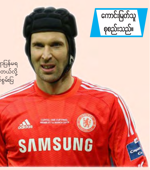
ကောင်းမြတ်သူ စုစည်းသည်။

ချယ်လ်ဆီးဂိုးသမားကြီး ပီတာဆက်အနေဖြင့် နံပါတ်တစ် ပွဲထွက်ဂိုးသမားနေရာပြန်မရ နိုင်တော့တဲ့အတွက် ချယ်လ်ဆီးမှ အာဆင်နယ်သို့ ပြောင်းရွှေ့ကစားဖို့ လိုလားနေတယ်လို့ သတင်းများက ဆိုပါတယ်။ ချယ်လ်ဆီးအသင်းမှာ တီယာဘောက်ကော်တိုက်စ် လက်စွမ်းပြ နေတဲ့အတွက် ပီတာဆက်အနေနဲ့ ပုံမှန်ပွဲထွက်ကစားခွင့်နေရာ ဆုံးရှုံးခဲ့ရပါတယ်။ အသက် ၃၃ နှစ်အရွယ်ရှိပြီဖြစ်တဲ့ ဂိုးသမားကြီး ပီတာဆက်ကို အာဆင်နယ်က အာဆင်နယ်အသင်း အလွတ်ပြောင်းရွှေ့မှုနဲ့ ခေါ်ယူနိုင်လိမ့်မယ်လို့ ယုံကြည်ထား ပါတယ်။ ပီတာဆက်ဟာ အာဆင်နယ်နဲ့အတူ အနည်းဆုံးလေးနှစ်လောက် အထိ ကစားနိုင်ပါသေးတယ်လို့ ဝင်းဂါးက ပြောဆိုခဲ့တယ်လို့ ဆိုပါတယ်။ ပီတာဆက်ဟာ ချယ်လ်ဆီးအသင်းနဲ့အတူ နှစ်ပေါင်းများစွာ ကစားလာခဲ့ သော်လည်း နည်းပြ မော်ရင်ဟိုလက်ထက်မှာ ပုံမှန်ကစားခွင့်များ ဆုံးရှုံး ခဲ့ရတဲ့အတွက် အသင်းမှ ထွက်ခွာဖို့ ကြိုးစားလျက်ရှိပါတယ်။ ချယ်လ်ဆီးနဲ့ အာဆင်နယ်တို့ရဲ့ ညှိနှိုင်းမှုရခဲ့မယ်ဆိုရင် ပီတာဆက်အနေနဲ့ အာဆင်နယ် ကိုရောက်ဖို့များပါတယ်။