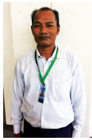
ကိုဇော်ဦး

မြန်မာနိုင်ငံက ၂၀၁၄ ခုနှစ်က အာဆီယံဥက္ကဋ္ဌတာဝန်ထမ်းဆောင်ခဲ့ပါတယ်။ ၁၉၉၇ ခုနှစ်မှာ အာဆီယံအဖွဲ့ဝင်ဖြစ်ပြီးနောက်ပိုင်း ပထမဆုံးအကြိမ်အဖြစ် အောင်အောင်မြင်မြင်နဲ့ ဥက္ကဋ္ဌတာဝန်ကို ထမ်းဆောင်နိုင်ခဲ့ခြင်းဖြစ်ပါတယ်။ အဲဒီအတွေ့အကြုံကို အခြေခံပြီး အခုလာမယ့် ထိပ်သီး