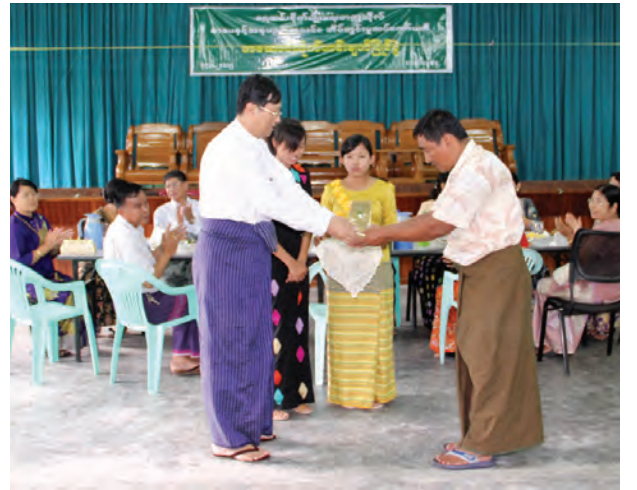
ရေဆင်းစိုက်ပျိုးရေးတာဝန်ရှိသူ ၈၀၀ နှင့် အနုပညာအသင်း အိမ်တွင်းမှ ဆပ်ကော်မတီမှ ကြီးမှူးကျင်းပသည့် အဆောင်အလှိုက် ဟင်းချက်ပြိုင်ပွဲကို ဇွန် ၁၄ ရက်က ပတ္တမြားရတနာမင်း မှု ကျင်းပရာ ပါမောက္ခချုပ် ဒေါက်တာမျိုးကြွယ်က ပြိုင်ပွဲတွင်ဆုရအသင်းများအား ဆုချီးမြှင့်စဉ်။ မေမိုးသဲ