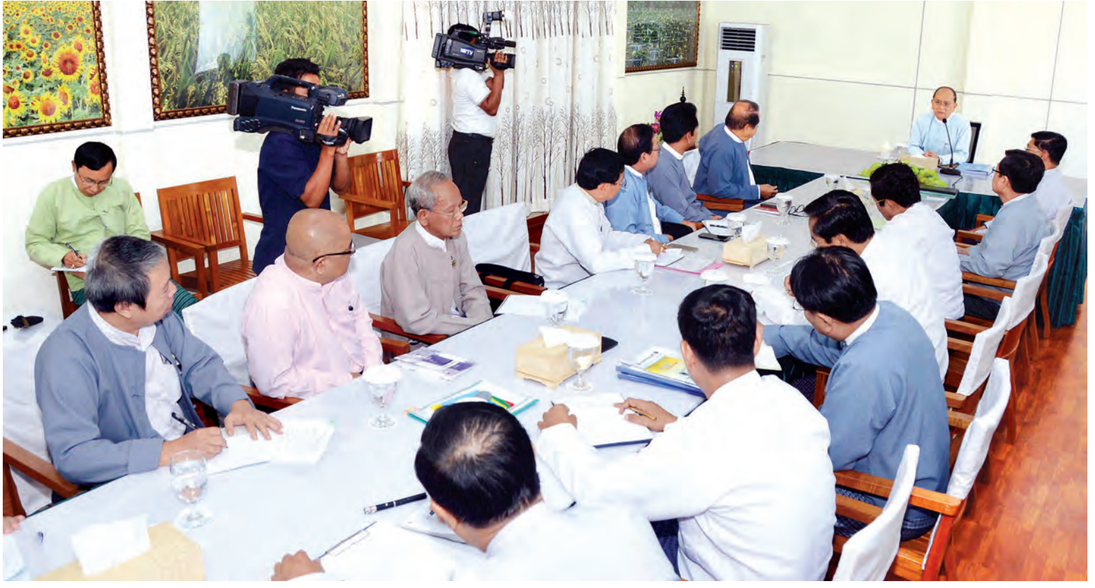
နိုင်ငံတော်သမ္မတ ဦးသိန်းစိန် မြန်မာနိုင်ငံ ရုပ်ရှင်၊ သဘင်နှင့် ဂီတအစည်းအရုံး၊ မြန်မာနိုင်ငံ ပန်းချီ၊ ပန်းပု အစည်းအရုံးဗဟိုတို့မှ တာဝန်ရှိသူများနှင့် တွေ့ဆုံစဉ်။ (သတင်းစဉ်)

နိုင်ငံတော် ဖွံ့ဖြိုးတိုးတက်ရေးတွင် အလုပ်သမား၊ လယ်သမား၊ အသိပညာရှင်၊ အတတ်ပညာရှင်များ အရေးကြီးသကဲ့သို့ အနုပညာရှင်များလည်း အရေးကြီးပါကြောင်း၊ ထို့ကြောင့် ရုပ်ရှင်၊ ဂီတ၊ သဘင်၊ ပန်းချီ၊ ပန်းပု ပြပွဲများကို တစ်နှစ်ပတ်လုံး တင်ဆက်နိုင်မည့် အနုပညာဗဟိုဌာနတစ်ခုကို ရန်ကုန်နှင့် မန္တလေးမြို့များ၌ တည်ဆောက်ပေးမည်ဖြစ်ကြောင်း၊ ထိုဗဟိုဌာနများ၏ စီမံခန့်ခွဲမှု အနုပညာရှင်များပါဝင်သည့် သီးခြားလွတ်လပ်သည့် အဖွဲ့အစည်းက တာဝန်ခံဆောင်ရွက်ရန် ဖြစ်ပါကြောင်းဖြင့် ပြောကြားသည်။