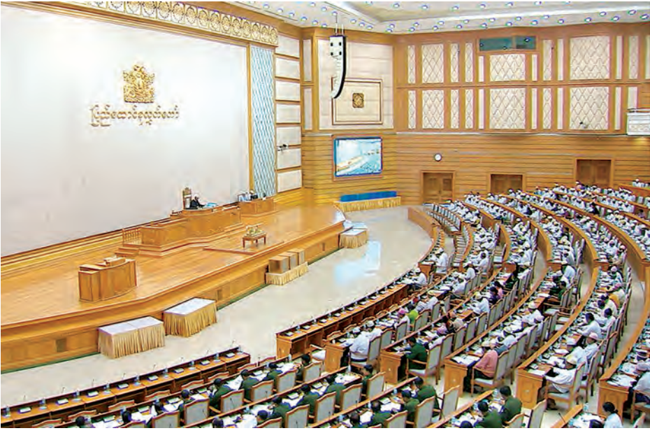
ပြည်ထောင်စုလွှတ်တော် (၁၂)ကြိမ်မြောက် ပုံမှန်အစည်းအဝေး ကျင်းပစဉ်။ (သတင်းစဉ်)