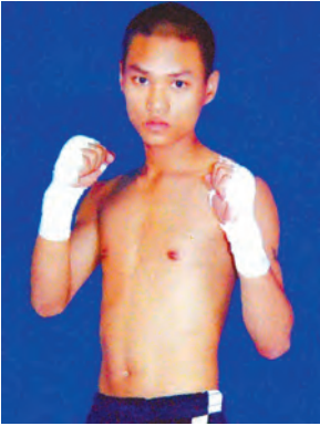
ခိုးလေး(အဖြူရောင်သွေးသစ်)နှင့် ယှဉ်ပြိုင်ထိုးသတ်မည့်ဇင်ကို (မန္တလေး ယူနိုက်တက်)

ရန်ကုန် ဇွန် ၁၇ အိုလံပစ်နေ့ အထိမ်းအမှတ် မြန်မာ့ဗိသိယာဂရု(ပီ)က စီစဉ်မည့် ပထမအကြိမ် ကလပ်ခုနစ်ခုမှ မျိုးဆက်သစ်လက်ဝှေ့သမား ၁၄ ဦး မြန်မာ့ရိုးရာ လက်ဝှေ့စိန်ခေါ်ပွဲများ ကို ဇွန် ၂၁ ရက် မွန်းလွဲ ၂ နာရီတွင် ရန်ကုန်မြို့ မင်္ဂလာတောင်ညွန့် မြို့နယ် သိမ်ဖြူအားကစားခန်းမ၌ ကျင်းပမည်ဖြစ်ကြောင်း သိရသည်။