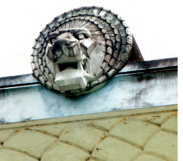
မြန်မာ့လယ်ယာဖွံ့ဖြိုးရေးဘဏ်အဆောက်အအုံ၌ တပ်ဆင်ထားသည့် ရှေးဟောင်းဗိသုကာလက်ရာ ခြင်္သေ့ဦးခေါင်းပုံကို တွေ့ရစဉ်။

ပြီး ဖြစ်သည်။ ယင်းအစီအစဉ်ကို အကောင်အထည်ဖော်ရန် အတွက် Royal Philips Corporation မှ အမေရိကန်ဒေါ်လာ ၇၅၀၀၀ ကို ထောက်ပံ့ပေးထားခြင်းဖြစ်သည်။ ရန်ကုန်မြို့ပြအမွေအနှစ် ထိန်းသိမ်းစောင့်ရှောက်ရေးအဖွဲ့ကို ၂၀၁၂ ခုနှစ်တွင် စတင်ထူထောင်ခဲ့ပြီး ရန်ကုန်မြို့၏ မြို့ပြအမွေအနှစ်များအား ခြုံငုံကာ စီမံခန့်ခွဲနိုင်သည့် စနစ်ကျသော ထိန်းသိမ်းစောင့်ရှောက်ရေးလုပ်ငန်းများကို လုပ်ကိုင်အားပေးရန်ဖြစ်ကြောင်း၊ ထိန်းသိမ်းစောင့်ရှောက်ရေးနှင့် ဖွံ့ဖြိုးတိုးတက်ရေးကို ဟန်ချက်ညီစွာ ပေါင်းစည်းနိုင်ပါက