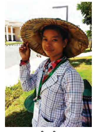
မသင်းသင်းဝေ

ကျွန်တော်တို့ ဌာနမှူးတွေက အခု ဇွန်လ ၂၂၊ ၂၃ ရက်နေ့မှာ အစည်းအဝေးရှိတယ်လို့ ပြောပါတယ်။ ကိုယ့်ဘက်ကကြိုတင်ပြင်ဆင်