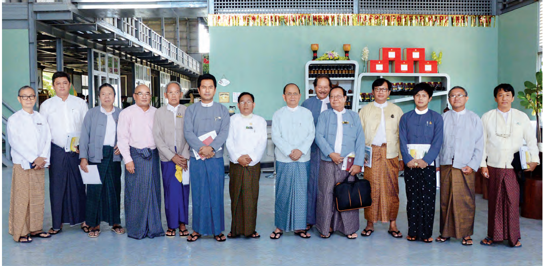
နိုင်ငံတော်သမ္မတဦးသိန်းစိန် မြန်မာနိုင်ငံ ရုပ်ရှင်၊ သဘင်နှင့် ဂီတအစည်းအရုံး၊ ပန်းချီ၊ ပန်းပု အစည်းအရုံးဗဟိုတို့မှ တာဝန်ရှိသူများနှင့်အတူ မှတ်တမ်းဓာတ်ပုံရိုက်စဉ်။

မဲဆန္ဒရှင်တွေကို ကျေးဇူးတုံ့ပြန်သောအားဖြင့် လူထု၏ မူလအခွင့်အရေးများကို ပိတ်ပင်တော့မှလား ဆောင်းပါး စာမျက်နှာ >> ၆ ပြည်သူ့လွှတ်တော်ရွေးကောက်ပွဲ ဥပဒေကို ဒုတိယအကြိမ် ပြင်ဆင်သည့်ဥပဒေ ပြဋ္ဌာန်း စာမျက်နှာ >> ၉