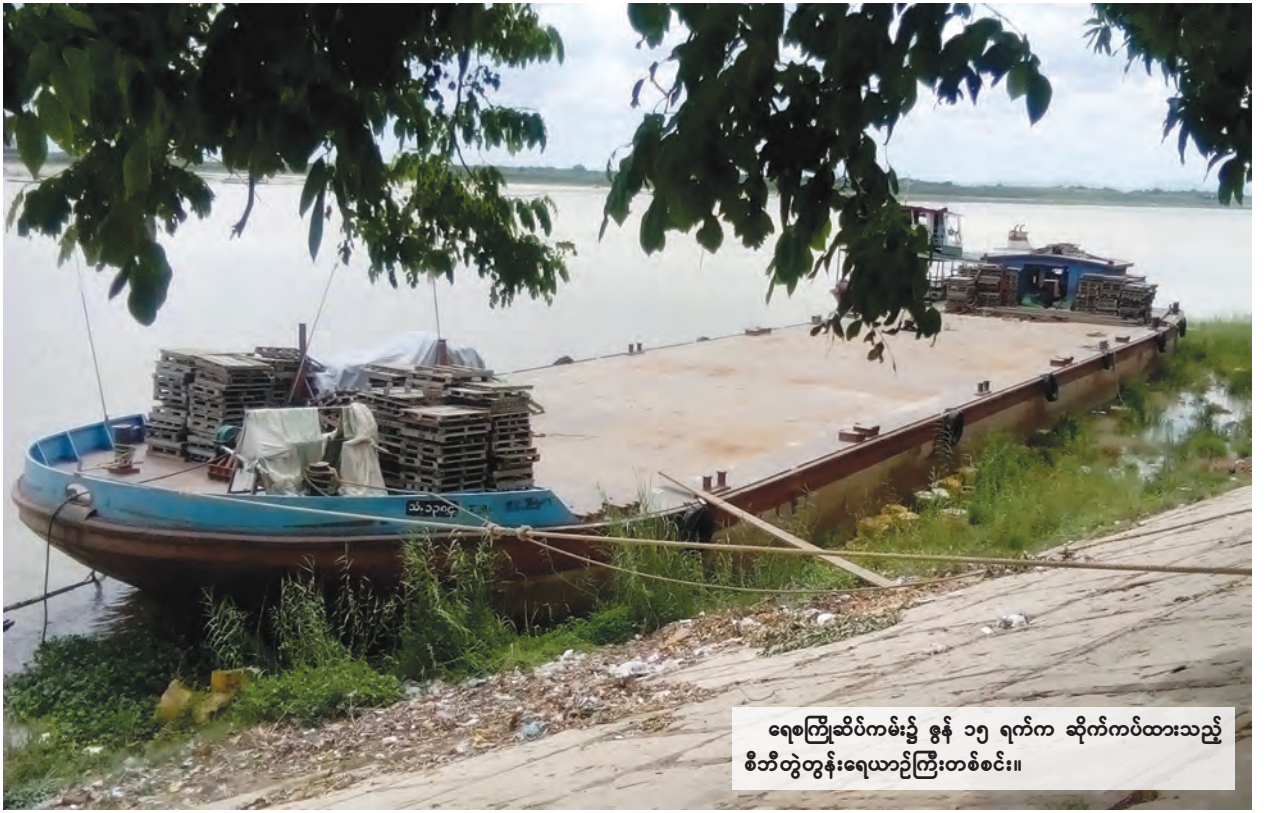
ရေစိုက်ဆိပ်ကမ်း၌ ဇွန် ၁၅ ရက်က ဆိုက်ကပ်ထားသည့် စီဘီတွဲတွန်းရေယာဉ်ကြီးတစ်စင်း။

“ကျွန်တော်တို့ရွာမှာ သောက်သုံးဖို့နဲ့ မီးဘေးအန္တရာယ်ကြိုတင်ကာကွယ်ဖို့အတွက် အချိန်ပြည့် ရေလိုအပ်နေပါတယ်။ ရေတွင်းရေကန်တူးဖော်ဖို့ဆိုတာက လူတိုင်းမတတ်နိုင်ပါဘူး။ တူးဖော်ပြီးရင်လည်း ရေတွင်းတွေက မအောင်မြင်ဘူး။ ရေဝါရေဆီတွေ အထွက်များတယ်။ သောက်သုံးဖို့ အဆင်မပြေတဲ့အတွက် ရေကောင်းရေသန့်ရရှိဖို့ အခုလို ကိုယ်အားကိုးကိုင်ဆောင်ရွက်နေတာပါ”ဟု အရှေ့ကုန်းရွာ ရပ်မိရပ်ဖွဲ့လှဖေက ပြောသည်။ (၁၄၉)