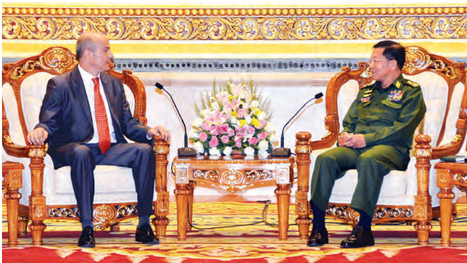
Burgener အား ယနေ့နံနက် ၉ နာရီခွဲတွင် ဇေယျာသီရိဗိမာန် ဧည့်ခန်းမဆောင်၌ လက်ခံတွေ့ဆုံစဉ်(အပေါ်ပုံ) ထည့်သွင်းပြောကြားသည်။

မိမိနိုင်ငံတွင် ကိုလိုနီဖြစ်ခဲ့ရသည့် အကျိုးဆက်တစ်ခုဖြစ်သော တိုင်းရင်းသားလက်နက်ကိုင် ပြဿနာများမှာ ယခုထိ မချုပ်ငြိမ်းသေးပါကြောင်း၊ ထိုအခြေအနေများကို တည်ငြိမ်အေးချမ်းအောင် ကြိုးစားလျက်ရှိပါကြောင်း၊ အရေးအကြီးဆုံးမှာ အမျိုးသားရေးတာဝန်ဖြစ်သည့် ဒို့တာဝန်အရေးသုံးပါးကို ထိခိုက်၍ မရပါကြောင်း၊ ဆွစ်ဇာလန်နိုင်ငံ၏ အတွေ့အကြုံများနှင့် ပူးပေါင်းဆောင်ရွက်မှုများသည် မိမိတို့နိုင်ငံအတွက် များစွာအထောက်အကူရမည် ဖြစ်ပါကြောင်းဖြင့် တပ်မတော်ကာကွယ်ရေးဦးစီးချုပ် ဗိုလ်ချုပ်မှူးကြီး မင်းအောင်လှိုင်က တာဝန်ပေးဆွဲ၍ ပြန်လည်ထွက်ခွာတော့မည့် မြန်မာနိုင်ငံဆိုင်ရာ ဆွစ်ဇာလန်နိုင်ငံသံအမတ်ကြီး H.E.Mr. Christoph