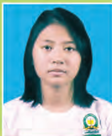
မဆုရတနာဦး