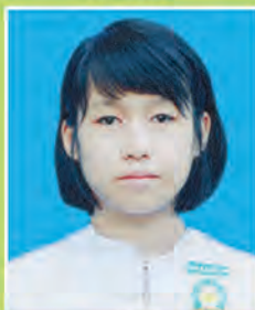
မသဒ္ဓါဖြူ