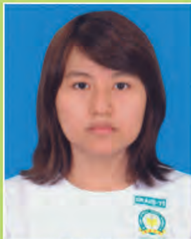
မယုမြတ်သီရိအောင်