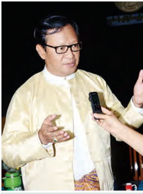
မန္တလေးသိန်းဇော်

အကောင်အထည်ဖော် ဆောင်ရွက်လျက်ရှိပါသည်။ “ဖောင်ဒေးရှင်းက အခုမှ အခြေတည်တာဖြစ်သလို အားလုံးတက်ကြွစွာ ပါဝင်ဆောင်ရွက်တာ တွေ့ရပါတယ်။ သဘင်ပညာသည်များရဲ့ ဘဝက ပင်ပင်ပန်းပန်း ရပ်တည်နေရတာဖြစ်တာကြောင့် အားလုံးပိုင်းဝန်းလက်တွဲ အထောက်အကူပြုပေးစေချင်ပါတယ်။ စေတနာရှင်အလှူရှင်များရဲ့ ပံ့ပိုးမှုများစွာပါဝင်လာရင် ဖောင်ဒေးရှင်းရဲ့လုပ်ငန်းတွေက ပိုမိုကျယ်ပြန့်လာမှာပါ။ ဖောင်ဒေးရှင်းအနေနဲ့ သြဂုတ်လအတွင်း ဂျပန်ရုပ်သေးအဖွဲ့နဲ့ မြန်မာရုပ်သေးအဖွဲ့ ပူးပေါင်းပြီး ယဉ်ကျေးမှုလှုပ်ရှားမှုအစီအစဉ်ရှိသလို သင်တန်းတွေကိုလည်း အပြန်အလှန်ဖလှယ်ဖို့ အစီအစဉ်ရှိပါတယ်။ သဘင်ပညာ