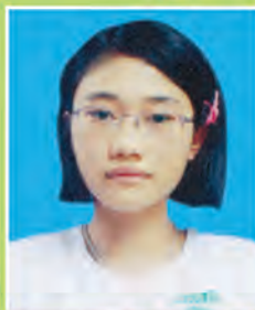
မရတနာမိုးဦးကျော်