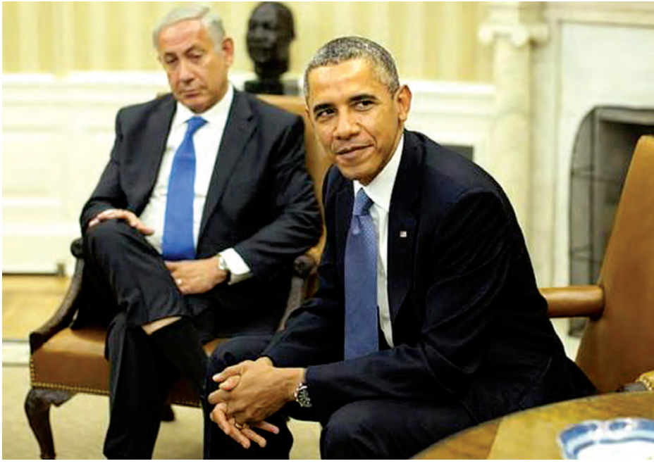
ဧပြီလ ၁၆ ရက်နေ့တွင် အီရန်နိုင်ငံ အီရန်နိုင်ငံ အစွဲရော့ဝန်ကြီးချုပ် အာလီ အာကာဗ် ဇာလီဟီနှင့် အိုဘားမားသည် အီရန်နိုင်ငံ အစွဲရော့ဝန်ကြီးချုပ် အာကာဗ် ဇာလီဟီနှင့် အစည်းအဝေးအချိန်ကာလသို့ ရောက်ရှိခဲ့ပြီးနောက် လာမည့်လတွင် ဝါရှင်တန်မြို့တွင် တွေ့ဆုံဆွေးနွေးရန် အစွဲရော့ဝန်ကြီးချုပ် ဘင်ဂျမင်နေတန်ယာဟု ဆိုလျက်ရှိသည်။ (ရိုက်တာ)

အား ဖိတ်ကြားခဲ့သည်ဟု နိုင်ငံခြားရေးဝန်ကြီးဌာနမှ သတင်းများကို ကိုးကားလျက် အစွဲရော့သတင်းစာတစ်စောင်၌ အင်္ဂါနေ့က ဖော်ပြသည်။ ဝန်ကြီးချုပ်၏ ရုံးအဖွဲ့မှ အမည်မဖော်လိုသူ အရာရှိများကမူ ထိုသို့ ဖိတ်ကြားမှုမျိုး မရရှိခဲ့ကြောင်း သတင်းထောက်များသို့ ပြောခဲ့သည်။ ရီဒီယိုအာရှန်နီ နေ့စဉ်သတင်းကမူ အိုဘားမားသည် အီရန်နှင့် အင်အားကြီး နိုင်ငံများအကြား နျူကလီးယားစာချုပ်နှင့် ပတ်သက်သည့်နောက်ဆုံးသတ်မှတ်ရက် ဇွန် ၃ ရက် ပြီးနောက် ဧပြီလလယ်တွင် တွေ့ဆုံဆွေးနွေးရန် နေတန်ယာဟုအား ဖိတ်ခေါ်ထားသည်ဟု ဖော်ပြသည်။ အဆိုပါ နျူကလီးယားသဘောတူစာချုပ်သည် ဒေသတွင်း အီရန်၏ မဟာမိတ်များအား ငွေကြေးထောက်ပံ့နေခြင်းအပေါ် အရေးယူပိတ်ဆို့မှုများကို လျော့ပါးစေသည့်အပြင် အီရန်၏ အကျိုးကျေးဇူးကို ခွင့်ပြုစေမည်ဖြစ်ရာ စာချုပ်အား အစွဲရော့ဝန်ကြီးချုပ်က အပြစ်ဆိုလျက်ရှိသည်။ အီရန်ကမူ ၎င်း၏နျူကလီးယားအစီအစဉ်မှာ ငြိမ်းချမ်းရေးအတွက်သာရည်ရွယ်သည်ဟု ပြောဆိုလျက်ရှိသည်။ (ရိုက်တာ)