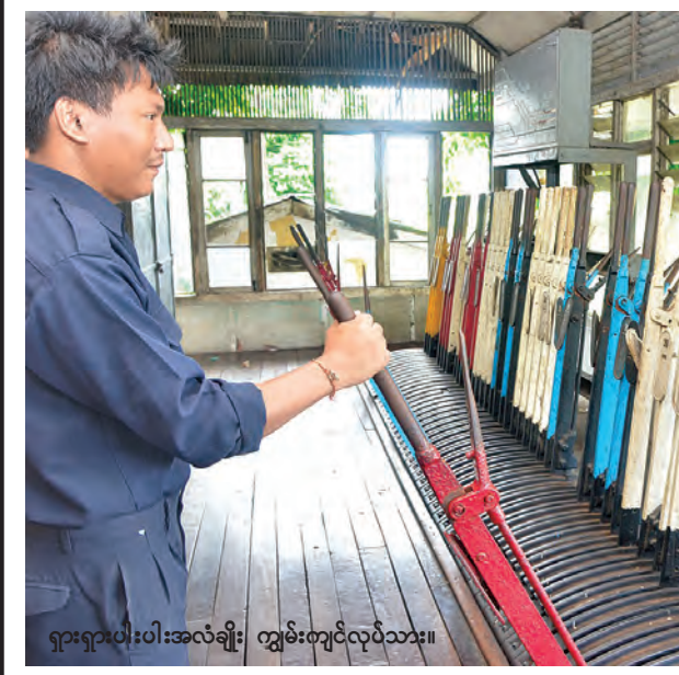
ရှားရှားပါးပါးအလံချိုး ကျွမ်းကျင်လုပ်သား။

မြန်မာ့သမိုင်းမှာ ပထမဆုံးဖောက်လုပ်တဲ့ ရထားလမ်းဖြစ်တဲ့ ရန်ကုန်-ပြည်ရထားလမ်းကို ရန်ကုန်နှင့်ဧရာဝတီမြစ်ဝှမ်း အစိုးရရထား လုပ်ငန်းကပိုင်ဆိုင်ခဲ့ပြီး ဗြိတိန်နိုင်ငံလုပ် ရေးနွေးငွေစက်ခေါင်းနဲ့ ခုတ်မောင်းပြေးဆွဲခဲ့ရာမှာ ကြည့်မြင်တိုင်ဘူတာဟာလည်း အထင်ကရ အဖြစ်ပါဝင်ခဲ့တာပါ။ ယနေ့မြင်တွေ့နေရတဲ့ ဘူတာအဆောက်အအုံကို ၁၉၂၈ခုနှစ်က တည်ဆောက်ခဲ့တယ်လို့သိရှိရတာမို့ သက်တမ်းအားဖြင့်