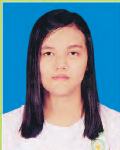
မမြတ်ပန်းချစ်