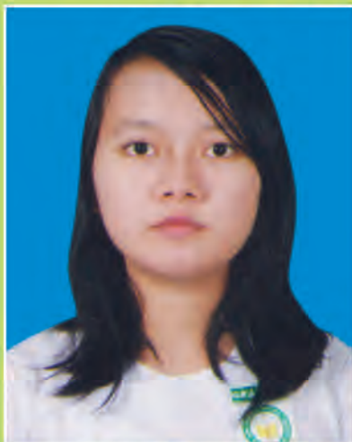
မပိုင်းအိန္ဒြာမင်းလွင်