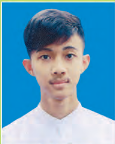
မောင်စိုင်းမိုးတော