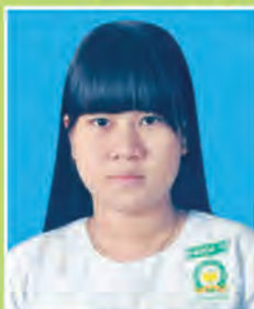
မဇွန်ပွင့်လှိုင်