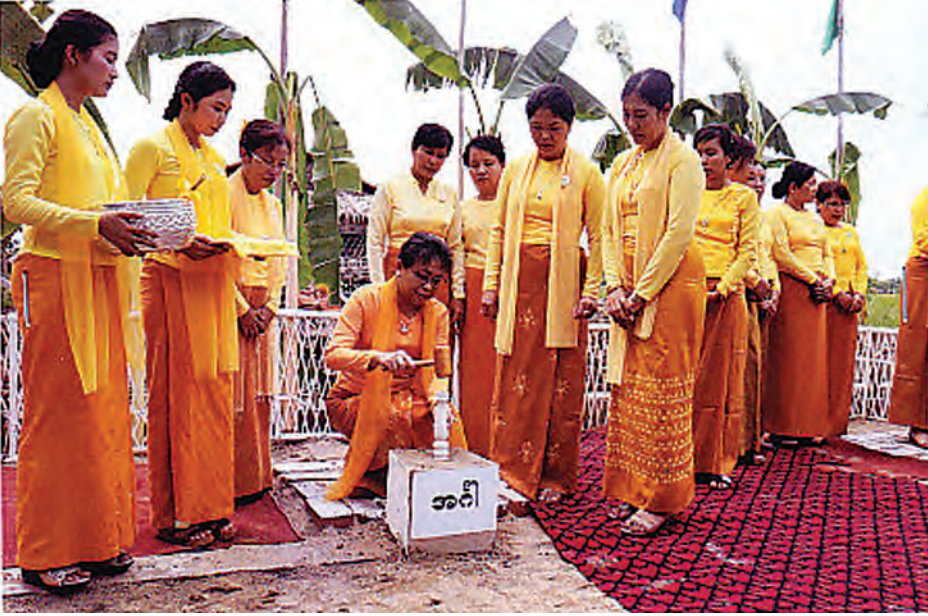
ရန်ကုန်အရှေ့ပိုင်းခရိုင် တောင်ဒဂုံမြို့နယ် စိုက်ပျိုးရေးနှင့်မွေးမြူရေးရပ်ကွက်ရှိ မိခင်နှင့်ကလေး မူကြိုကျောင်းအသစ် ပြန်လည်တည်ဆောက်ရန်အတွက် ပန္နက်တင်အခမ်းအနားကို ဇွန်ဒုတိယပတ်က ကျင်းပရာ ရန်ကုန်တိုင်းဒေသကြီး မိခင်နှင့်ကလေးစောင့်ရှောက်မှု ကြီးကြပ်ရေးအဖွဲ့ဥက္ကဋ္ဌ ဒေါ်ဆွေဆွေလက်နှင့်အဖွဲ့က ပန္နက်တင်ပေးစဉ်။

မုဒုံ ဇွန် ၁၆ မုဒုံပြည်နယ်အစိုးရအဖွဲ့၏ ၂၀၁၅ ခုနှစ် မိုးရာသီသစ်ပင်စိုက်ပျိုးပွဲ အခမ်းအနားကို ဇွန် ၁၃ ရက်က မုဒုံမြို့ရွှေဟင်္သာဂေါက်ကွင်းအနီး မြို့မ(၄)ရပ်ကွက် မြေဧရိယာ ၁ ဒသမ ၉ ဧကပေါ်၌ ကျင်းပသည်။ အခမ်းအနားတွင် ပြည်နယ်ဝန်ကြီးချုပ်ဦးအုန်းမြင့်နှင့် ပြည်နယ် လွှတ်တော်ဥက္ကဋ္ဌ ဦးကျင်ဖေတို့က သတ်မှတ်နေရာများ၌ တစို့ပင်များကို အမှတ်တရစိုက်ပျိုးပေးကြပြီး ပြည်နယ်ဌာနဆိုင်ရာ တာဝန်ရှိသူများနှင့် ကျောင်းသားကျောင်းသူများက မဟော်ဂီနီ၊ ပျဉ်းမ၊ ခရေပင်များကို စိုက်ပျိုးပေးကြသည်။ မုဒုံပြည်နယ်အနေဖြင့် စိမ်းလန်းစိုပြည်ရေး၊ သဘာဝပတ်ဝန်းကျင်ထိန်းသိမ်းစောင့်ရှောက်ရေး၊ ကျောင်းသားကျောင်းသူများ သစ်ပင်ကို ထိန်းသိမ်းစောင့်ရှောက်မှု တိုးပွားလာအောင် ရတနာတန်းဝင် ကျွန်းပင် ၉၉၅၆၉ ပင်၊ ယူကလစ်ပင် ၁၆၄၇၁၀ နှင့် ထင်းစိုက်ခင်းအပင် ၆၀၃၀၀တို့ကို ယခုနှစ်မိုးရာသီတွင် တိုးချဲ့ စိုက်ပျိုးသွားမည်ဖြစ်ကြောင်း မုဒုံပြည်နယ်သစ်တောဦးစီးဌာန ညွှန်ကြားရေးမှူးထံမှ သိရသည်။ မောင်မောင်(မုဒုံ)