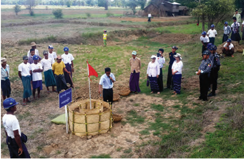
ခဲကာ မြစ်ရေကြီးစဉ်အချိန်များတွင် ဆောင်ရန်၊ ရှောင်ရန်အချက်များကို အသေးစိတ် ရှင်းလင်း ဆွေးနွေးခဲ့သည်။ သရုပ်ပြပွဲသို့ ဌာနဆိုင်ရာတာဝန်ရှိသူများ၊ လူမှုရေးအသင်းအဖွဲ့များ၊ ရွှေကျင်တိုက်နယ်နှင့် သပြေကုန်းတိုက်နယ်အတွင်းရှိ ဧရာဝတီမြစ်ကမ်းဘေးကျေးရွာအုပ်စုများမှ ဒေသခံပြည်သူများ လေ့လာကြည့်ရှုခဲ့ကြသည်။ (မြို့နယ် ပြန်/ဆက်)

ဧရာဝတီတိုင်းဒေသကြီး မြန်အောင်မြို့နယ်၌ မိုးရာသီတွင် ရေကြီးရေလျှံမှုများ ကြုံတွေ့ရပါက ကြိုတင်ကာကွယ်နိုင်ရန်အတွက် မိုးရာသီ ရေဘေးကာကွယ်ရေးပညာပေးသရုပ်ပြပွဲကို မြို့နယ်အဆင့် မြောင်းဦးစီးဌာနကဦးစီး၍ မြန်အောင်မြို့နယ် ကျွဲခေါင်းကြီးတော၌ ဇွန် ၁၄ ရက်တွင် ပြုလုပ်ခဲ့သည်။ သရုပ်ပြပွဲတွင် တိုင်းဒေသကြီးလွှတ်တော် ကိုယ်စားလှယ် ဦးအောင်ဝင်းဆွေက မိုးရာသီကာလအတွင်း ဧရာဝတီမြစ်ကမ်းဘေးမှ ကျေးရွာများတွင်နေထိုင်သော ပြည်သူများ ရေဘေးအန္တရာယ် ကာကွယ်ရေးနည်းလမ်းများနှင့် သတိပြုရမည့်အချက်များကို သိရှိနားလည်ရန် လိုအပ်ကြောင်းနှင့် မြို့နယ်အဆင့်မြောင်းဦးစီးဌာန ဦးစီးအရာရှိ AE ဦးမျိုးဇော်ဇော်က ရေဘေးကြိုတင်ကာကွယ်ရေး လုပ်ငန်းစဉ်များဖြစ်သည့် တာထိပ်ပေါ်ရေကျော်ခြင်း၊ ရေပေါက်(ထူးပေါက်)ပေါက်ခြင်း၊ တာအိခြင်း၊ သံဗွက်ထခြင်း၊ လှိုင်းပုတ်ခြင်း၊ ကမ်းပြိုခြင်း၊ ရေစိမ့်ခြင်းစသည်တို့ ဖြစ်ပေါ်ရသည့် အကြောင်းရင်းများ၊ ကာကွယ်ရန် နည်းလမ်းများနှင့်သတိပြုရမည့်အချက်များကို လက်တွေ့သရုပ်ပြ