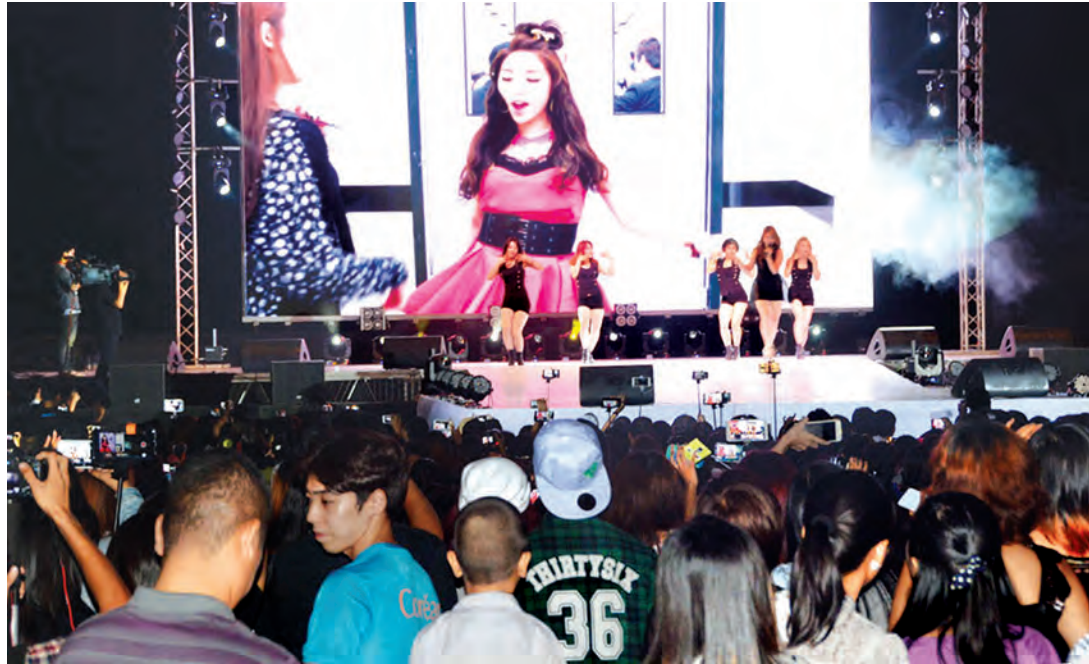
ကိုရီးယားတေးဂီတ K-POP အဖွဲ့မှ Ailee နှင့်အဖွဲ့ သီဆိုဖျော်ဖြေနေစဉ်။

မြန်မာနိုင်ငံ ကိုရီးယားလူမျိုးများအဖွဲ့အစည်းက ကြီးပွားကျင်းပသည့် မြန်မာ-ကိုရီးယား ချစ်ကြည်ရေး သံတမန်နှစ် ၄၀ ပြည့်အထိမ်းအမှတ်အဖြစ် နာမည်ကြီး လူကြိုက်များသည့် BTS အဖွဲ့ပါဝင်သည့် ကိုရီးယား K-POP တေးဂီတအဖွဲ့ ရန်ကုန်မြို့ စမ်းချောင်းမြို့နယ် ရှင်စောပုလမ်းရှိ Myanmar Event Park ၌ ယနေ့ ညနေ ၆ နာရီတွင် ဖျော်ဖြေတင်ဆက်ခဲ့သည်။