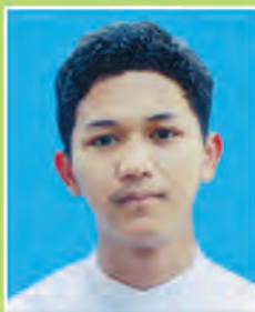
မောင်မြတ်သော်ကောင်း