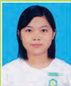
မရွှန်းလဲ့ဝေ