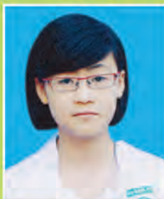
မထက်ထက်မြတ်ခိုး