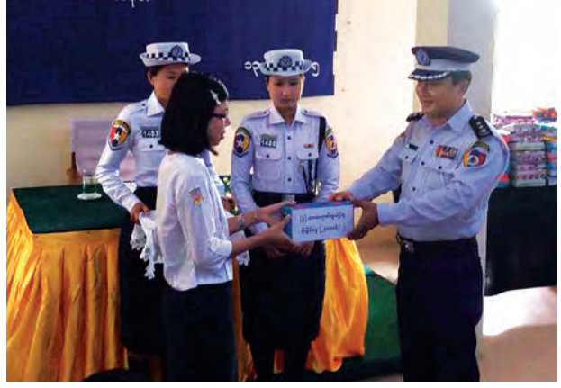
စာရေးကိရိယာများ ပေးအပ်ခြင်းနှင့် တက္ကသိုလ်ဝင်စာမေးပွဲအောင်မြင်သူများ ဂုဏ်ပြုပွဲအခမ်းအနားကို ဇွန် ၁၃ ရက် နံနက် ၉ နာရီက ယာဉ်ထိန်းရဲတပ်ဖွဲ့မှ နေပြည်တော်၌ ကျင်းပသည်။

နေပြည်တော် ဇွန် ၁၃ မြန်မာနိုင်ငံရဲတပ်ဖွဲ့ ယာဉ်ထိန်းရဲတပ်ဖွဲ့ တပ်ဖွဲ့ဝင်မိသားစုဝင်၊ ကျောင်းသား ကျောင်းသူများကို