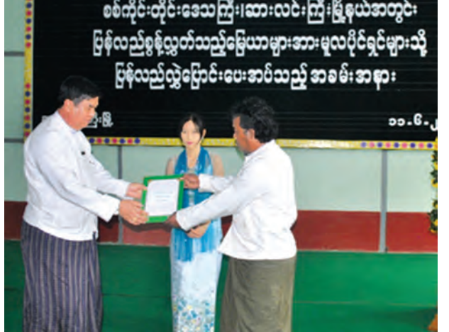
ပြန်လည်စွန့်လွှတ်မြေယာများကို မူလပိုင်ရှင်ထံ လွှဲပြောင်းပေးအပ်

သင်တန်းတွင် ကလေးမြို့နယ် စိုက်ပျိုးရေးဦးစီးဌာန ဒုတိယဦးစီးမှူးက ဘိန်းအစားထိုးသီးနှံစိုက်ပျိုးရေး လုပ်ငန်းဆောင်ရွက်မှုအခြေအနေများနှင့် ပညာပေးသင်တန်းပို့ချခြင်း၏ ရည်ရွယ်ချက်များကို ရှင်းလင်းပြောကြားပြီး စိုက်ပျိုးရေးပညာရှင်ဝန်ထမ်းများက စပါးသိပ္ပံနည်းကျ စိုက်ပျိုးနည်းစနစ် ၁၄ ချက်၊ အစေ့ထုတ်ပြောင်း သိပ္ပံနည်းကျ စိုက်ပျိုးနည်းစနစ် GAP ၁၁ ချက်၊ ဘက်စုံသီးနှံ ကာကွယ်ရေးစနစ်၊ အပင်အတွက် အဓိကလိုအပ်သော အာဟာရများစသည့် စိုက်ပျိုးရေးနှင့် ပတ်သက်၍ တောင်သူများသိရှိသင့်သည့် အချက်များကို ပို့ချခဲ့ကာ လက်ကမ်း စာစောင်များလည်း ဖြန့်ဝေပေးခဲ့ကြောင်း သိရသည်။ (မြို့နယ် ဖြန့်/ဆက်)