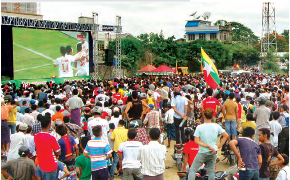
ဇွန် ၁၃ ရက်က မြန်မာအသင်းနှင့်ဗီယက်နမ်အသင်းတို့ အကြိုဗိုလ်လုပွဲ ယှဉ်ပြိုင်ကစားမှုကို ရန်ကုန်မြို့၊ မဟာပန္နလမ်းခြံအတွင်း ဘောလုံးချစ်ပရိသတ်များ ပျော်ရွှင်စွာ အားပေးနေမှုကို တွေ့ရစဉ်။