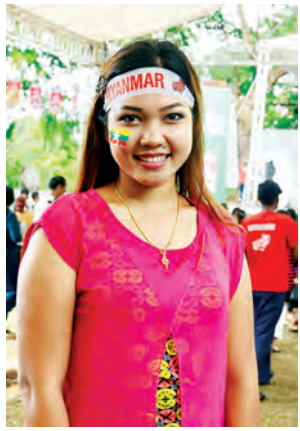
မသီရိလှိုင် (ကမာရွတ်မြို့နယ်)

တာကို မြင်ရတာစိတ်ချမ်းသာတယ်။ မဟာဗန္ဓုလပန်းခြံ အတွင်းအပြင်နဲ့ မဟာဗန္ဓုလ လမ်းမကြီးတစ်လျှောက် မှာ ရှိသမျှအမှိုက်တွေ ဘာမှမကျန် တော့ဘူး။ လူငယ်တွေ တက်တက် ကြွကြွနဲ့ တာဝန်ယူတတ်တဲ့ အသိ စိတ်တွေမြင့်မားလာပြီး စင်ကာပူ မှာလည်း ပွဲစဉ်တစ်လျှောက်မှာ မြန်မာပရိသတ်တွေက အမှိုက်တစ်စ မကျန် ပွဲပြီးတာနဲ့ကောက်ကြတယ်။ အားပေးတဲ့စိတ်ဓာတ်တွေက မှန်ကန် လာတယ်။ ဆဲဆိုကြိမ်းမောင်းတာ တွေ လျော့နည်းလာပြီး တစ်ဖက် အသင်းအပေါ်မှာလည်း မှန်ကန်တဲ့ အမြင်တွေရလာတယ်”ဟု အားကစား ဝါသနာရှင်တစ်ဦးက ပြောသည်။