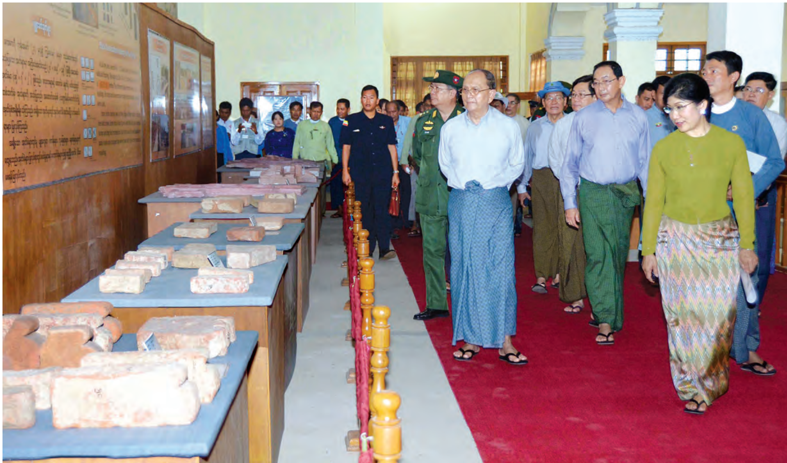
နေပြည်တော် ဇွန် ၁၃

ပြည်ထောင်စုသမ္မတမြန်မာနိုင်ငံတော် နိုင်ငံတော်သမ္မတ ဦးသိန်းစိန်သည် ပြည်ထောင်စုဝန်ကြီး ဒုတိယ ဗိုလ်ချုပ်ကြီး ကိုကို၊ ဦးစိုးသိန်း၊ ဦးတင်နိုင်သိန်း၊ ဦးရဲထွဋ်၊ ကာကွယ်ရေးဦးစီးချုပ်ရုံး(ကြည်း)မှ ဒုတိယဗိုလ်ချုပ်ကြီးမြထွန်းဦး၊ ဒုတိယဝန်ကြီးများ၊ ဌာနဆိုင်ရာတာဝန်ရှိသူများနှင့်အတူ ယနေ့နံနက်ပိုင်းတွင် မကွေးတိုင်းဒေသကြီး တောင်တွင်းကြီးမြို့နယ် ကုက္ကိုရွာကျေးရွာအုပ်စုအနီးရှိ ကမ္ဘာ့အမွေအနှစ်စာရင်းဝင် ဗိဿနိုးရှေးဟောင်းယဉ်ကျေးမှုအမွေအနှစ်ဇုန်သို့ ရောက်ရှိရာ ပြည်ထောင်စုဝန်ကြီး ဦးအုန်းမြင့်၊ မကွေးတိုင်းဒေသကြီးဝန်ကြီးချုပ် ဦးဘုန်းမော်ရွှေ၊ အလယ်ပိုင်းတိုင်းစစ်ဌာနချုပ်တိုင်းမှူး ဗိုလ်ချုပ်စိုးထွဋ်၊ ပျူမြို့ဟောင်းများ ထိန်းသိမ်းစောင့်ရှောက်ရေးအဖွဲ့ဥက္ကဋ္ဌ၊ အဖွဲ့ဝင်များနှင့် ဒေသခံပြည်သူများက ကြိုဆိုနှုတ်ဆက်ကြသည်။