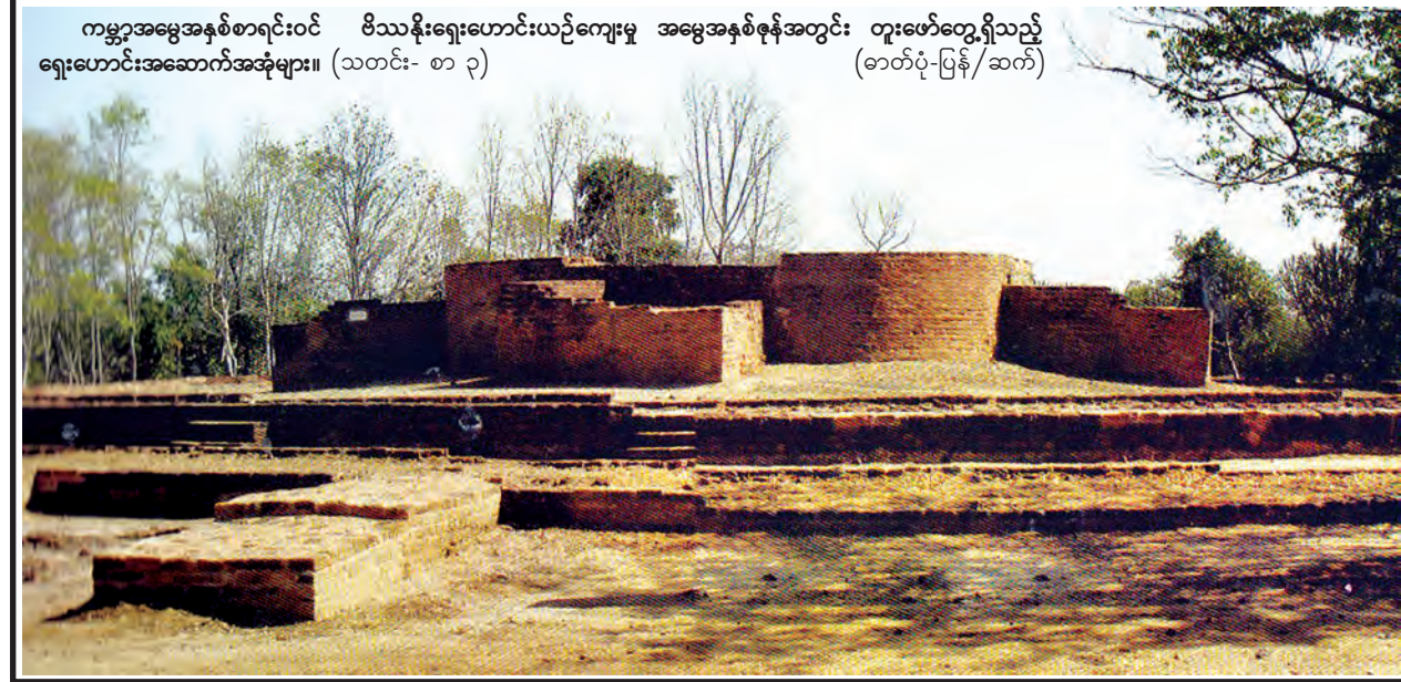
ကမ္ဘာ့အမွေအနှစ်စာရင်းဝင် ဗိဿနိုးရှေးဟောင်းယဉ်ကျေးမှု အမွေအနှစ်စုနစ်အတွင်း တူးဖော်တွေ့ရှိသည့် ရှေးဟောင်းအဆောက်အအုံများ။ (သတင်း- စာ ၃)

ချီးမြှင့်ခဲ့သည်။ ဆက်လက်၍ အောင်ချက်အကောင်းဆုံးပထမဆုရ ကြိုခမ်းမြို့နယ်နှင့် အောင်ချက်အကောင်းဆုံးပထမဆုရကြိုခမ်းမြို့နယ် မျောက်ချောကုန်းအခြေခံပညာ အထက်တန်းကျောင်းမှ ကျောင်းအုပ်ဆရာမကြီးနှင့် ဆရာကျောင်းသား ကျောင်းသူများကိုယ်စား ကျောင်းသူတစ်ဦးက ကျေးဇူးတင်စကားပြောကြားခဲ့သည်။ (မြန်မာ့အလင်း)