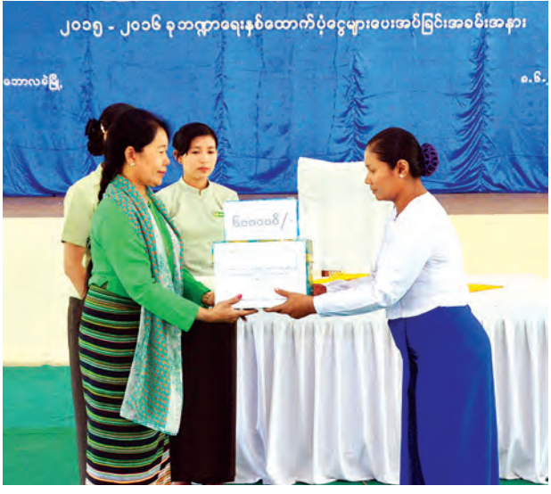
သင့်ပြည်သူများအတွက် ထောက်ပံ့ငွေ အပါအဝင် စုစုပေါင်း ကျပ်သိန်း ၆၀၅ ဒသမ ၄၇ သိန်းနှင့် လွိုင်ကော် မြို့နယ်၊ ဒီးမော့ဆိုမြို့နယ်၊ ဖရူဆို မြို့နယ်နှင့် ရှားတောမြို့နယ် ပြည်သူများအတွက် အဝတ်အထည်များကို သက်ဆိုင်သူများထံ ထောက်ပံ့ပေးသည်။

နေပြည်တော် ဇွန် ၁၃ လူမှုဝန်ထမ်း၊ ကယ်ဆယ်ရေးနှင့် ပြန်လည်နေရာချထားရေး ဝန်ကြီးဌာန လူမှုကာကွယ်စောင့်ရှောက်ရေးဆိုင်ရာလုပ်ငန်းကော်မတီ ဥက္ကဋ္ဌ ပြည်ထောင်စုဝန်ကြီး ဒေါက်တာ ဒေါ်မြတ်မြတ်အုန်းခင်သည် တာဝန်ရှိသူများနှင့်အတူ ဇွန် ပထမပတ်က ကယားပြည်နယ် လွိုင်ကော်မြို့ မြို့တော်ခန်းမ၌ ကျင်းပသော လွိုင်ကော် ခရိုင်အတွင်းရှိ စေတနာ့ဝန်ထမ်း အဖွဲ့အစည်းများအား ၂၀၁၅-၂၀၁၆ ဘဏ္ဍာရေးနှစ်၊ ထောက်ပံ့ငွေပေးအပ်ပွဲ၊ လူမှုစောင့်ရှောက်ရေးနှင့် သဘာဝဘေးလျော့ပါးရေး စေတနာ့ဝန်ထမ်း လူငယ်များ မွမ်းမံသင်တန်း (၉/၂၀၁၅)ဖွင့်ပွဲ အခမ်းအနားသို့ တက်ရောက် အမှာစကားပြောကြားသည်။ အခမ်းအနားတွင် လွိုင်ကော် ခရိုင်အတွင်းရှိ ဘိုးဘွားရိပ်သာနှစ်ခု၊ လူငယ်ဖွံ့ဖြိုးရေး ပရဟိတဂေဟာ ကိုးခုနှင့်ကိုယ်အားကိုးကိုး မူလတန်း ကြိုကျောင်း ၃၃ကျောင်း၊ လွိုင်ကော် မြို့နယ် နွားလပိုးကျေးရွာ လေဘေး