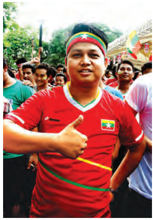
မောင်တူးတူးနိုင် (မင်္ဂလာဒုံမြို့နယ်)