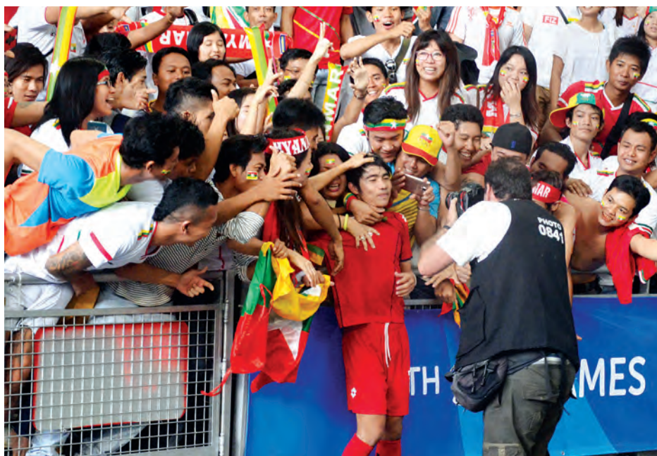
မြန်မာ ယူ-၂၃ ကစားသမားနှင့် ပရိသတ်တို့ ပျော်ရွှင်စွာ အောင်ပွဲခံနေမှုကို တွေ့ရစဉ်။

ဆီးဂိမ်းအမျိုးသား ဘောလုံး ပြိုင်ပွဲ ဆီးမီးပွဲစဉ်များကို ယနေ့ နေ့လယ်ပိုင်းမှစ၍ စင်ကာပူနိုင်ငံရှိ အမျိုးသား အားကစားကွင်း၌ ကျင်းပရာ မြန်မာအသင်းက ဝိယက်နမ်အသင်းကို နှစ်ဂိုး-တစ်ဂိုးဖြင့် အနိုင်ရရှိပြီး ဗိုလ်လုပွဲသို့ တက်ရောက်သွားသည်။