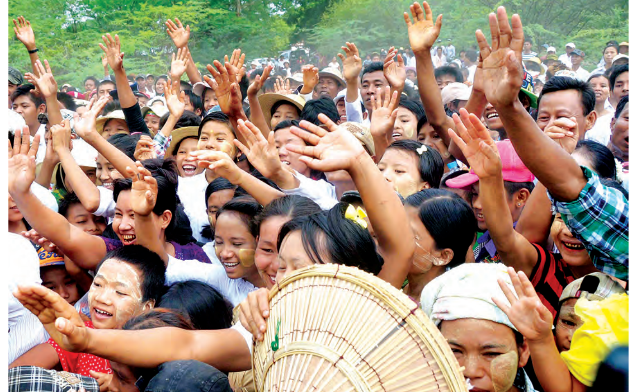
နိုင်ငံတော်သမ္မတ ဦးသိန်းစိန်အား ဝမ်းမြောက်ဝမ်းသာကြိုဆိုနှုတ်ဆက်နေကြသည့် ဗိဿနိုးရှေးဟောင်းယဉ်ကျေးမှုအမွေအနှစ်ဇုန် ပတ်ဝန်းကျင်ကျေးရွာများမှ ဒေသခံပြည်သူများကို တွေ့ရစဉ်။

အနှစ်ကော်မတီညီလာခံက ကမ္ဘာ့အမွေအနှစ်စာရင်းဝင် ဒေသများအဖြစ် သတ်မှတ်ခဲ့သည်။ ယဉ်ကျေးမှုအမွေအနှစ်ဒေသအတွင်း လိုက်နာရမည့် စည်းကမ်းချက်များ (ကောက်နုတ်ချက်)တွင် ထိခိုက်စေမှုမျိုးဖြစ်သော သမိုင်းနှင့် ယဉ်ကျေးမှုဆိုင်ရာ သဘာဝရှုခင်း၊ တိရစ္ဆာန်၊ အပင်ဖွဲ့တည်မှု၊ ရေအရင်းအမြစ်စသည်တို့ကို ထိခိုက်စေသည့် ဆောင်ရွက်ခြင်းများ၊ ရွှေ့ကွင်းခြင်း၊ မြေတူးခြင်း၊ ရေကန်တူးခြင်း၊ ကျောက်ထုတ်ခြင်း၊ တောင်ပူစာနှင့် တောင်ကုန်းများ ဖြိုဖျက်ခြင်း၊ ကန်၊ မြောင်း၊ လျှို၊ ချိုင့်၊ လွင်ပြင်များ၊ မြေဖို့ခြင်းနှင့် သဘာဝရှုခင်း၊ ရွာကွက်ကို ပျက်စီးစေနိုင်သော ဆောင်ရွက်မှုမျိုး၊ အဆောက်အအုံများ၊ (ဥပမာ- သံဃာတော်များ၊ သာသနာပိုင်များ၊ အဖွဲ့အစည်းအမျိုးမျိုး၊ လူထုအဖွဲ့အစည်းများ၊ စသည်)တို့ကို ပြင်ဆင်၊ မွမ်းမံ၊ ထိန်းသိမ်း၊ ပြုပြင်ခြင်း၊ ရှေးဟောင်းအဆောက်အအုံများ ပြင်ဆင်မွမ်းမံထိန်းသိမ်းခြင်း၊ စက်ယန္တရားများနှင့် ထွန်ယက်စိုက်ပျိုးခြင်း၊ အခြားတူးဆွခြင်း၊ ခြောက်ပေထက်ပို၍ မြင့်မားသော စီးပွားဖြစ် နှစ်ရှည်ပင်များ စိုက်ပျိုးခြင်းတို့ကို ခွင့်မပြုကြောင်း သတ်မှတ်ထားသည်။ ထိုသို့ ပျူမြို့ဟောင်းများအား ကမ္ဘာ့အမွေအနှစ် စာရင်းဝင်အဖြစ် သတ်မှတ်ခံခဲ့ရသည့်အတွက် ဒေသခံပြည်သူများ၏ စီးပွားရေးအခွင့်အလမ်းများ ဖွံ့ဖြိုးတိုးတက်မှုများရရှိလာခြင်း၊ အမွေအနှစ်ဒေသများ စနစ်တကျ ဘက်စုံဖွံ့ဖြိုးတိုးတက်လာခြင်း၊ ဘုရားဖူးပြည်သူများ၊ သုတေသနပြု လေ့လာလိုသူများ တိုးပွားလာခြင်း၊ နိုင်ငံတကာ၏ စိတ်ဝင်စားမှုပိုမိုရရှိလာခြင်း