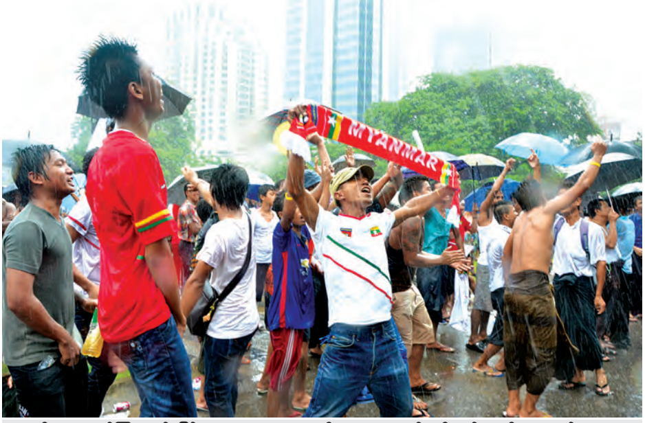
မိုးရွာနေသည့်ကြားမှပင် မြန်မာဘောလုံးသမားများကိုအားပေးနေသည့် ပရိသတ်များကို တွေ့ရစဉ်။

စင်ကာပူနိုင်ငံဆိုင်ရာ မြန်မာသံရုံး မှ သိရှိရသည်။ “ဒီနေ့ အပြန်ခရီးမှာ မြန်မာ တွေ စင်ကာပူက လမ်းတွေပေါ်မှာ မော်ကြားနေကြတယ်။ရထားပေါ်မှာ အားလုံးက ဝိုင်းကြည့်နေကြတယ်။ နဖူးစည်းကို တစ်လှည့်၊ ပါးပေါ်က စတစ်ကာကို တစ်လှည့်ကြည့်ရင်း “မြန်မာ”လို့ ရေရွတ်ကြတဲ့အခါ ကျွန် တော်တို့ မြန်မာအလုပ်သမားတွေ ခြေထောက်နဲ့ မြေကြီး မထိချင်တော့ ဘူး”ဟု စင်ကာပူရောက် မြန်မာ လူငယ်တစ်ဦးက ပြောသည်။ ရန်ကုန်မြို့ရှိ အထင်ကရနေရာ ကြီးများတွင် ဘောလုံးပွဲကို လာ