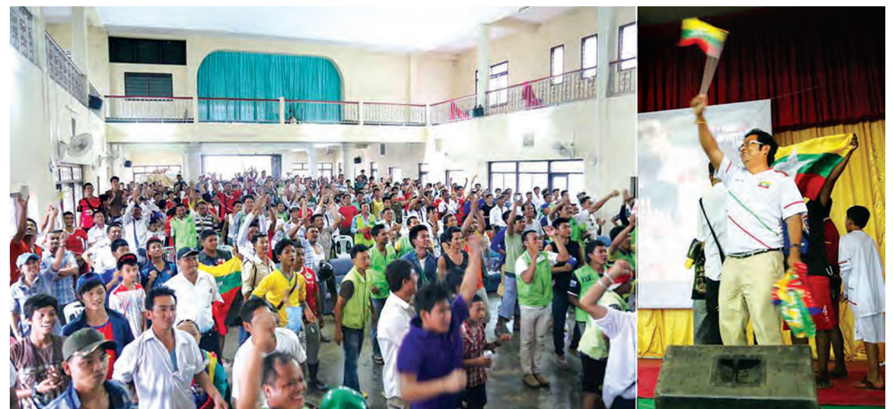
ဇွန် ၁၃ ရက်က ဆီးဂိမ်းဘောလုံးပြိုင်ပွဲ အကြိုဗိုလ်လုပွဲအဖြစ် မြန်မာနှင့်ဗီယက်နမ်အသင်းတို့ အကြိုအနယ်ယှဉ်ပြိုင်ပြီးနောက် မြန်မာအသင်းက ဗီယက်နမ်အသင်းကို နှစ်ဂိုး-တစ်ဂိုးဖြင့် အနိုင်ရရှိခဲ့ရာ တာချီလိတ်မြို့သူ မြို့သားများ အောင်မြတ်ခန်းမအတွင်း အောင်ပွဲခံနေစဉ်။ မောင်ယဉ်ကျေး

ဇွန် ၁၃ ရက်က မြန်မာအသင်းနှင့်ဗီယက်နမ်အသင်းတို့ အကြိုဗိုလ်လုပွဲ ယှဉ်ပြိုင်ကစားမှုကို မန္တလေးမြို့၊ ချမ်းအေးသာစံမြို့နယ် မန္တလေးမြို့တော် စည်ပင်သာယာရေးကော်မတီရုံးထောင့် ၂၆ လမ်းနှင့် ၇၂ လမ်းထောင့်၌ အယ်လ်အီးဒီဘုတ်တွင် တိုက်ရိုက်ထုတ်လွှင့်ပြသရာ မြို့ခံဘောလုံးပရိသတ်များ တစ်ခဲနက်အားပေးကြည့်ရှုနေစဉ်။ တင်မောင်(မန္တလေး)