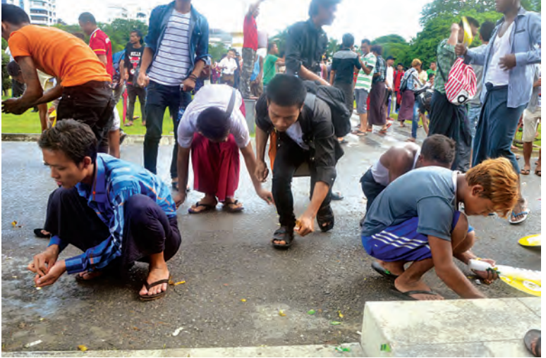
ရန်ကုန်မြို့ မဟာဗန္ဓုလပန်းခြံရှိ အယ်လ်အီးဒီဘုတ်တွင် မြန်မာဘောလုံးအသင်းအား မိုးထဲရေထဲမှ အားပေးနေသော မြန်မာပရိသတ်များ၏ ပုံရိပ်အချို့။