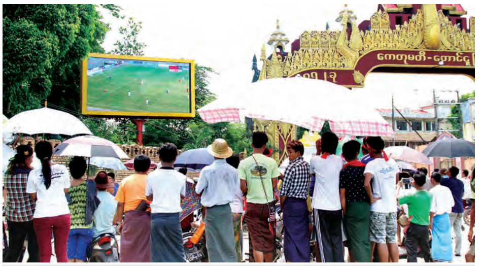
ဇွန် ၁၃ ရက်က တောင်ငူမြို့၊ ဗိုလ်မှူးဖိုးကွန်းလမ်းရှိ မြို့ကျက်သရေဆောင် ကေတုမတီမုခ်ဦးရှေ့ အယ်လ်အီးဒီဘုတ်တွင် မြန်မာအသင်းနှင့် ဗီယက်နမ်အသင်းတို့ အကြိုဗိုလ်လုပွဲယှဉ်ပြိုင်ကစားမှုကို မြို့ခံပရိသတ်များ စိတ်ဝင်တစား အားပေးစဉ်။ သူရ(တောင်ငူ)