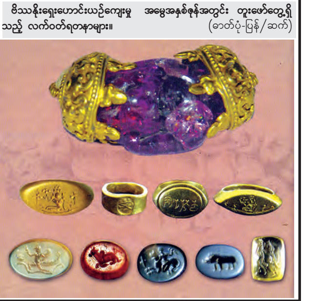
ဗိဿနိုးရှေးဟောင်းယဉ်ကျေးမှု အမွေအနှစ်စုနစ်အတွင်း တူးဖော်တွေ့ရှိသည့် လက်ဝတ်ရတနာများ။