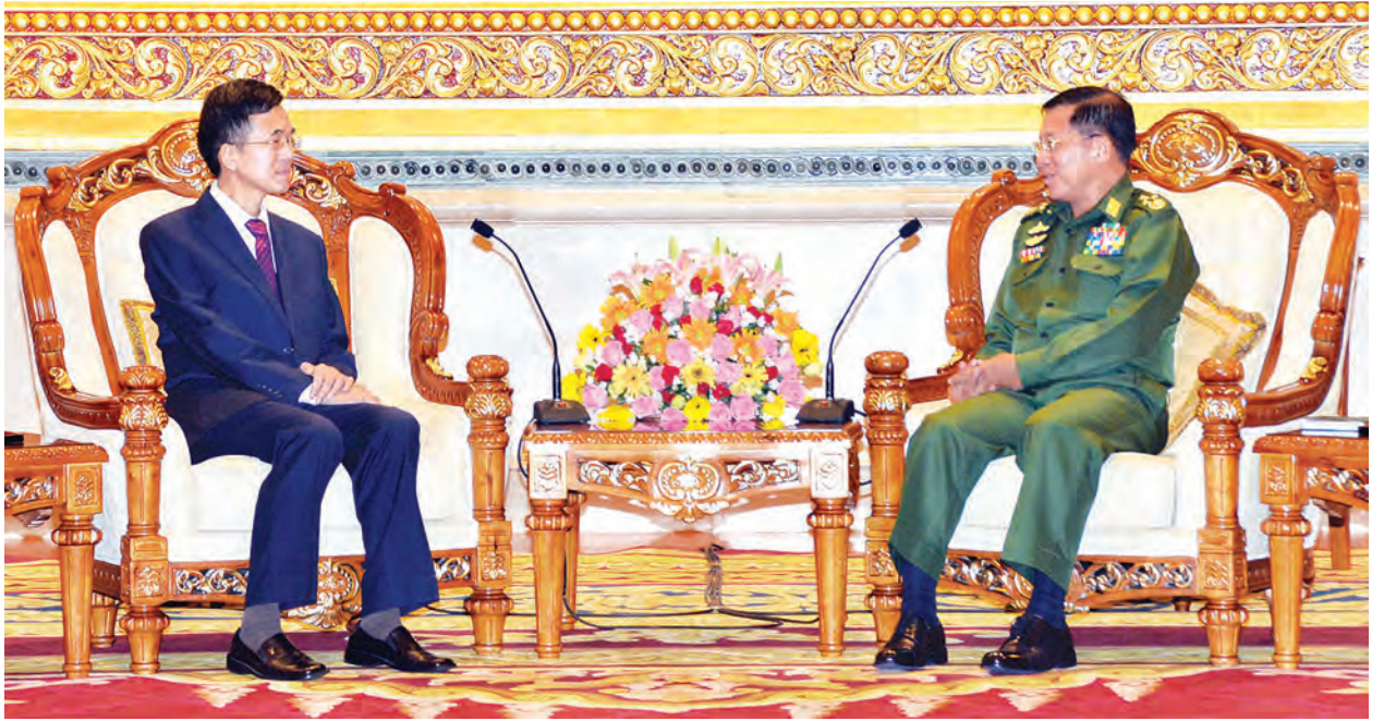
နိုင်ငံခွဲပါကြောင်း၊ ဖုန်ကြားရှင်ကို ပြဿနာကို နိုင်ငံရေးနည်းဖြင့် ဖြေ ဆက်သွယ်၍ ကိုးကန့်ဒေသတွင် ရှင်းပေးရန် တောင်းဆိုခဲ့ပါကြောင်း၊ လက်နက်ကိုင်ပဋိပက္ခများသည် နှစ် နိုင်ငံစလုံးအတွက် အနှောင့်အယှက် ဖြစ်စေ၍ မြန်မာနိုင်ငံ ပြည်တွင်းငြိမ်း ချမ်းရေးကိစ္စရပ်များအား အခိုင် အမာ ထောက်ခံအားပေးပါကြောင်း ဖြင့် ဆွေးနွေးပြောကြားခဲ့ကြောင်း သတင်းရရှိသည်။ (မြဝတီ)

တရုတ်နိုင်ငံ သံအမတ်ကြီး မစ္စတာ ရန်ဟိုလန်က နိုင်ငံတကာ အခြေအနေ၊ ပြည်တွင်းအခြေအနေ များ ဘယ်လိုပြောင်းပြောင်း၊ နှစ် နိုင်ငံချစ်ကြည်ရင်းနှီးမှု အခြေအနေ ပြောင်းလဲရန်မရှိပါကြောင်း၊ ချစ် ကြည်ရင်းနှီးသည့် အိမ်နီးချင်း ကောင်းနိုင်များ ဖြစ်သည်နှင့်အညီ အခက်အခဲများကို အချိန်မီဖြေရှင်း