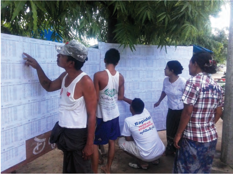
မဲဆန္ဒရှင်စာရင်းကို ကြည့်ရှုနေသော ပြည်သူများ။