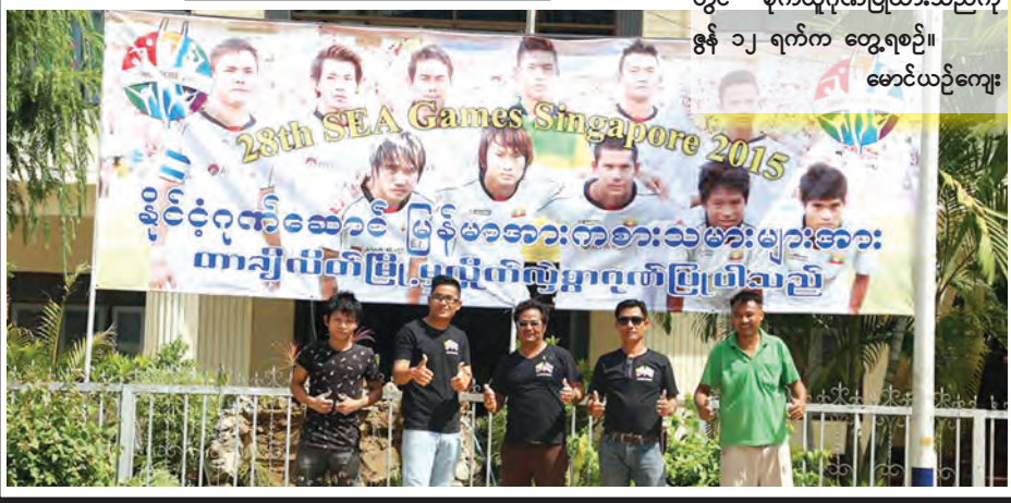
နိုင်ငံတော်ဆောင်ရွက်မှုအဖွဲ့ဝင်များနှင့် အားကစားသမားများအား တာချီလိတ်မြို့၊ မောင်မြတ်ခန်းမရှေ့တွင် စိုက်ထူထုတ်ပြထားသည်ကို ဇွန် ၁၂ ရက်က တွေ့ရစဉ်။ မောင်ယဉ်ကျေး

ဇွန် ၁၂ ရက် ည ၁၀ နာရီတွင်ရရှိသည့် ဆုရစာရင်းဖြစ်သည်။