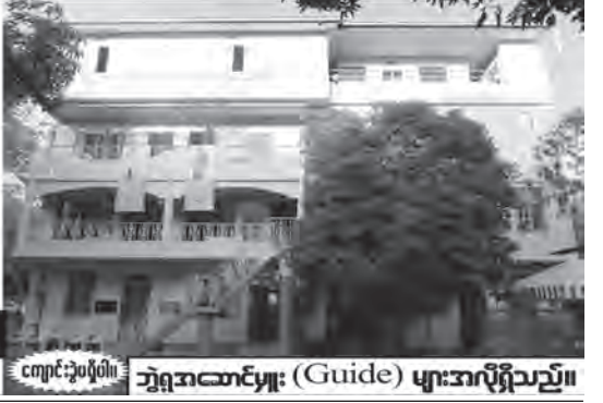
ကျောင်းပုံစံပုံစံ၊ ဘွဲ့ရအောင်ကျောင်း (Guide) များအလိုရှိသည်။

ဆရာဝန်များဦးစီးသည် စံပြုဘက်ဒါ နှင့် ကိုယ်ပိုင်အထက်တန်းကျောင်း ၂၀၁၅ (၁၀)တန်း အောင်ချက် - ၈၉% (သိပ္ပံ) ၊ (ဘေဂါဒါ+နေ့တက်) - ၇၅% (သိပ္ပံ၊ ဝိပဿနာ) အောင်မြင်သူအားလုံး၏ ၄၀%သည် ဂုဏ်ထူးဖြင့် အောင်မြင်သည်။ ဆိတ်ငြိမ်ခြံဝန်းကျယ်၊ အားကစားကွင်း၊ အိမ်ထောင်ရေးအဖွဲ့အစည်း၊ အိမ်ထောင်များ . . . ။ မိမိတို့ဆရာဝန်ဖြစ်ရန် လေ့ကျင့်ခဲ့သည့် ပုံစံအတိုင်း လေ့ကျင့်ပေးသည်။ (သင့်တော်သည့်အခါ အသိပေးကြား) (၃)တန်း အထူးအစီအစဉ် စာတော်လျှင် (၀)နှစ်ဝက် (၃)တန်းအပြီး သင်ပေးပြီး (၃)နှစ်ဝက် (၀)တန်းစာတစ်ခေါက် ကြိုသင်ပေးသည်။ အမှတ် (၇၇) ငုဝါလမ်း၊ ပုလဲမြို့နယ်၊ မင်္ဂလာဒုံ၊ ဖုန်း - ၀၉ ၅၅၀၅၈၅၀၁၊ ၀၁ ၆၃၈၀၅၀၊ ၀၉ ၃၁၂၉၉၇၂၆