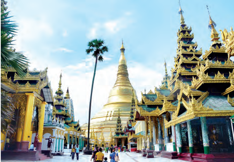
ယခု ရွှေတိဂုံကုန်းတော်ပေါ်ရှိ ရွှေတိဂုံစေတီတော်နှင့် တန်ဆောင်းများကို ဤသို့ သပွယ်စွာ ဖူးမြော်တွေ့ရစဉ်။

၁၉၈၅ ခုနှစ် ရွှေသင်္ကန်းတော်ကပ်လျှင်လုပ်ငန်းတွင် သပိတ်မှောက်ပန်းဆွဲများမှ ခေါင်းလောင်းများအထိ အင်္ဂါတေများ ခွာချော၍ ကြေးပေါင်ကြေးပြားများကပ်လျှင်ခဲ့သည်။ ၁၉၈၅ ခုနှစ်တွင် ရွှေသင်္ကန်းတော်