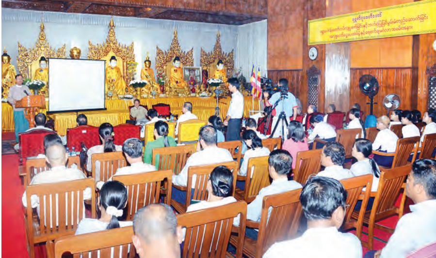
ဂေါပကအဖွဲ့၏ ဆန္ဒသဘောထား ရှင်းလင်းတင်ပြသည့် စာနယ်ဇင်းရှင်းလင်းပွဲ ကျင်းပစဉ်။