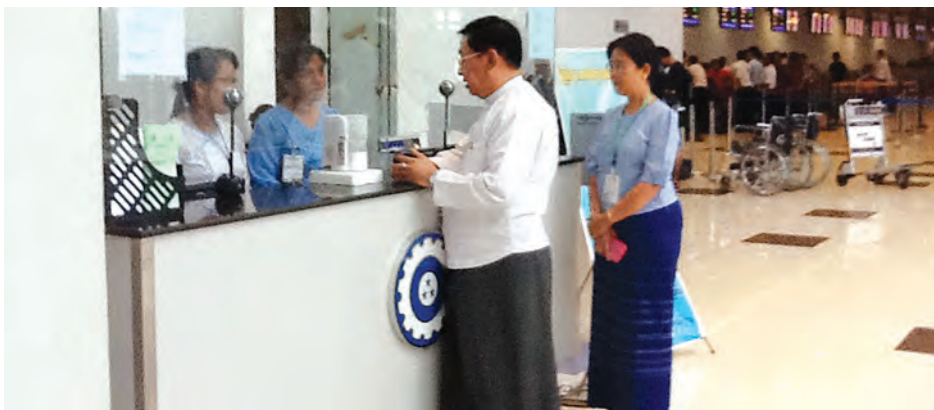
သည့် အထောက်အထားများကို မှာကြား၍ ဝန်ထမ်းများအတွက် ဆောင်ရွက်ပေးခဲ့ကြောင်း သိရအများသိစေရေး ဖော်ပြထားပေးရန် လိုအပ်သည်များကို ဖြည့်ဆည်း သည်။ (မြန်မာ့အလင်း)

အချက်အလက် အထောက်အထား စာရွက်စာတမ်းများ ပြည့်စုံမှန်ကန်မှု ရှိ မရှိ အလေးဂရုပြု စိစစ်ဆောင်ရွက်ကြရန်၊ အထူးသဖြင့် အိမ်တွင်း အထောက်အကူ လုပ်သားအသစ်များ စေလွှတ်ခြင်းကို ခွင့်ပြုထားခြင်းမရှိသေး၍ အထူးသတိပြုစိစစ်ဆောင်ရွက်ရန်၊ သို့သော်လည်း နိုင်ငံခြားတွင် တရားဝင် အလုပ်လုပ်ခွင့်ရထားပြီး အလည်အပတ်ခွင့်ဖြင့် ပြန်လာသူများ အတွက် ပြည်ပသို့ ပြန်လည်ထွက်ခွာမှုတွင် ညွှန်ကြားထားသည့်အထောက်အထား စာရွက်စာတမ်းများပြည့်စုံစွာ ခွင့်ပြုပေးရန်၊ အဆိုပါ လိုအပ်