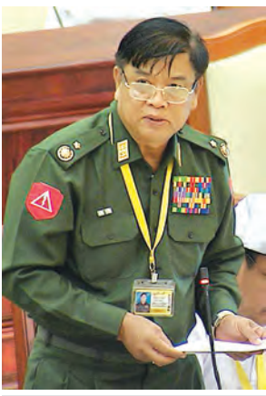
ဒုတိယဝန်ကြီး ကျော်ညွန့် ဖြေကြားစဉ်။ (သတင်းစဉ်)

ပေါက်မဲဆန္ဒနယ်မှ ဦးခင်မောင် ညို၏ ပေါက်မြို့နယ် များပိုင်ကျေးရွာ အုပ်စုအတွင်း ကာကွယ်ရေးပစ္စည်း စက်ရုံ (ကပစ-၂၄) တည်ဆောက် ခဲ့သည့်အတွက် သိမ်းဆည်းခဲ့သည့် စိုက်ပျိုးမြေများအား ထိုက်သင့်သည့် လျော်ကြေးပေးရန်နှင့် မြေစာရင်း ပုံစံ (၇)ရရှိပြီး၍ တောင်သူများလက်ရှိ စိုက်ပျိုးမြေအတွင်း စက်ရုံနယ် နိမိတ်အဖြစ် သတ်မှတ်စိုက်ထူခဲ့သော အုတ်တိုင်များကို ဥပဒေနည်းအညီ ပြန်လည်ပြင်ဆင်ရွှေ့ပြောင်းပေးရန် အစီအစဉ် ရှိ၊ မရှိ မေးခွန်းနှင့် စပ်လျဉ်း၍ အမှတ်(၂၄) ကာကွယ်ရေး ပစ္စည်းစက်ရုံ၏ တပ်ပိုင်မြေသိမ်းဆည်းခြင်းတွင် ဦးပိုင်ပေါက်လယ်မြေ ၁၃၀ ကျော်၊ ယာမြေ ၃၀၆၀ ကျော် နှင့် ကိုင်းမြေ ၂၀၀ ကျော်သိမ်းဆည်း ခဲ့ပြီး မြေလျော်ကြေး ငွေကျပ် ၁၇၄၀၀၀၀၀ ကျော်အား ၂၀၁၁