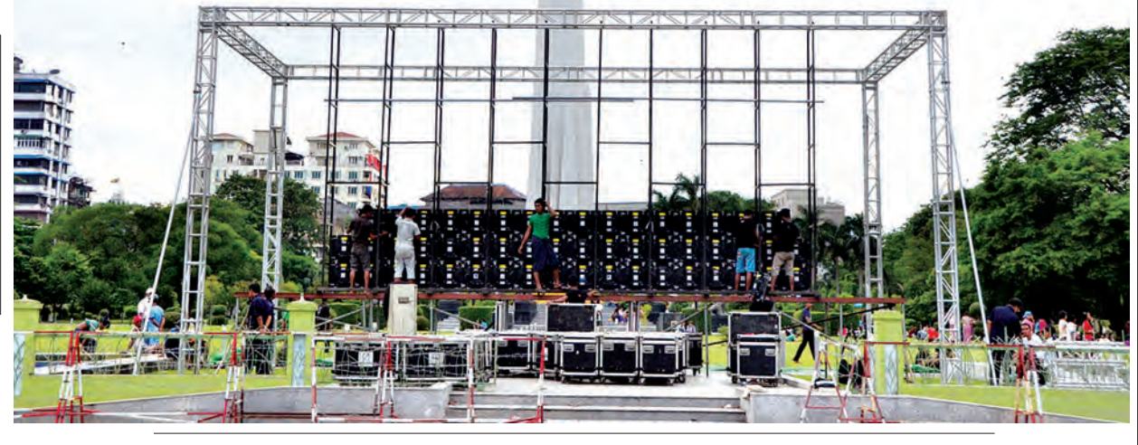
တင်စိုး(မြန်မာ့အလင်း)

ရန်ကုန် ၅နံ ၁၂ ရန်ကုန်မြို့တော် စည်ပင်သာယာရေးကော်မတီ၏ အဓိကပံ့ပိုးကူညီမှုဖြင့် Entertainment Technical Group နှင့် ပူးပေါင်း၍ (၂၈)ကြိမ်မြောက် အရှေ့တောင်အာရှအားကစားပြိုင်ပွဲ အမျိုးသားဘောလုံးပြိုင်ပွဲ အကြိုဗိုလ်လူပွဲစဉ်အဖြစ် ယနေ့ည ၁ နာရီတွင် ယှဉ်ပြိုင်ကစားမည့် မြန်မာအသင်းနှင့် ဗီယက်နမ်အသင်းယှဉ်ပြိုင် ကစားပွဲများကို ရန်ကုန်မြို့၊ မြို့တော်ခန်းမရှေ့ မဟာဗန္ဓုလပန်းခြံမျက်နှာစာတွင်လည်းကောင်း၊ ပြည်သူ့ရင်ပြင်တွင် အော်ရီဗူးမြန်မာကလည်းကောင်း၊ ကန်တော်ကြီးကီရိုက်ဥယျာဉ်တွင် လည်းကောင်း LED Screen Board ဖြင့် ပြည်သူများ ဘောလုံးဝါသနာရှင်များ ကြည့်ရှုအားပေးနိုင်ရန် တိုက်ရိုက်ထုတ်လွှင့်ပြသမည်ဖြစ်ကြောင်း သိရသည်။