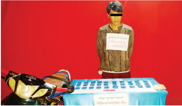
ဇွန် ၁၀ ရက်နေ့တွင် မူးယစ်ဆေးဝါးအလွဲသုံးမှုနှင့် တရားမဝင် ရောင်းဝယ်မှု တိုက်ဖျက်ရေးဌာန အထူးအလေးထားလျက် မေ ၂၆ ရက်မှ ဇွန် ၂၆ ရက်အထိ ပြည်သူ့ဗဟိုပြု လူထုလှုပ်ရှားမှုအသွင်ဖြင့် မူးယစ်ဆေးဝါးတိုက်ဖျက်ရေးလုပ်ငန်းများ ဆောင်ရွက်ရာတွင် ပြည်သူများပူးပေါင်း ပါဝင်နိုင်ရေးအတွက် ပြည်ထဲရေးဝန်ကြီးဌာန မူးယစ်ဆေးဝါးနှင့် စိတ်ကိုပြောင်းလဲစေသော ဆေးဝါးများအန္တရာယ် တားဆီးကာကွယ်ရေးဗဟိုအဖွဲ့က အကောင်အထည်ဖော် ဆောင်ရွက်လျက်ရှိသည်။