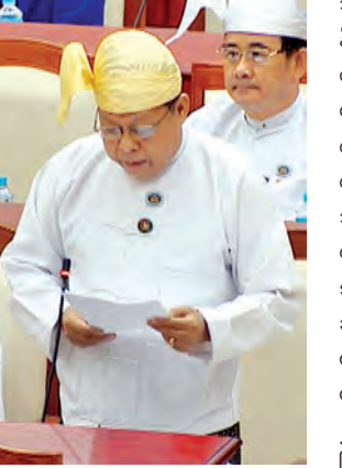
အောင်မြေသာစံမြို့နယ် မဲဆန္ဒနယ်မှ ဦးကိုကြီး မေးမြန်းစဉ်။

ပလက်ဝဲလမ်းပေါ်ရှိ ကုလားတန်မြစ် ကူးတံတား (ပလက်ဝဲ)အား ဆောက်လုပ်ရန်အတွက် ပဏာမလေ့လာမှုများ ပြုလုပ်ချက်အရ