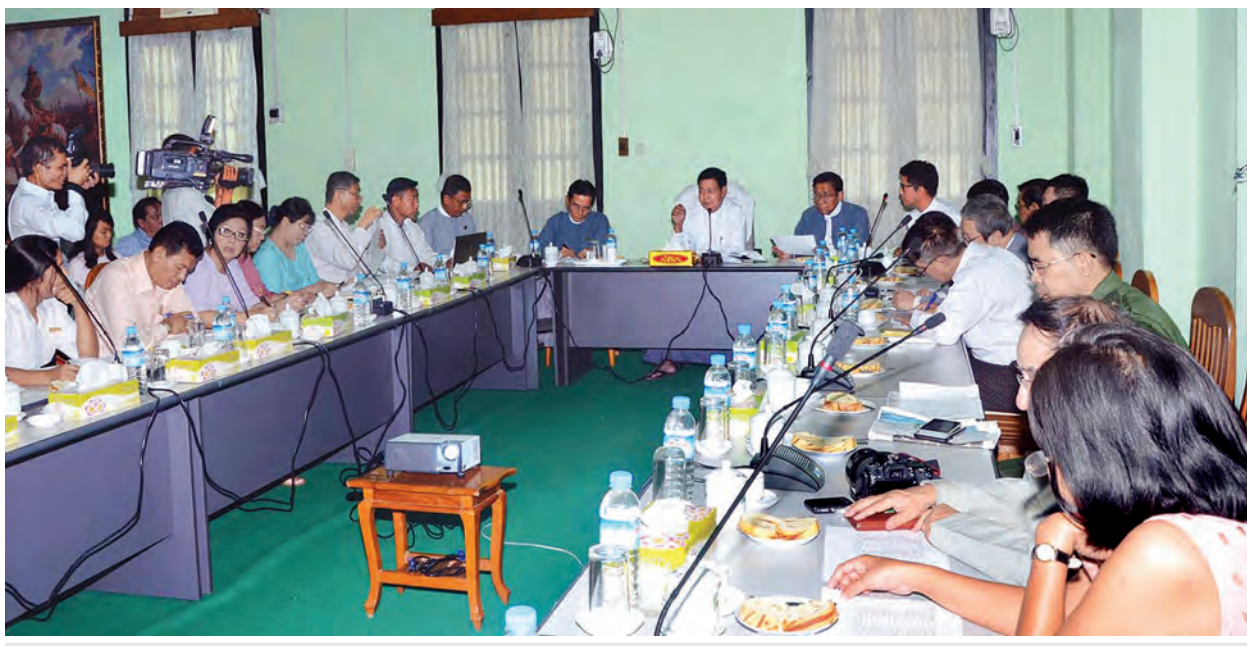
ပြည်ထောင်စုဝန်ကြီး ဦးရဲထွဋ်နှင့် မြန်မာနိုင်ငံရုပ်ရှင်အစည်းအရုံးမှ တာဝန်ရှိသူများ၊ ရုပ်ရှင်ထုတ်လုပ်သူများ၊ ရုံပိုင်ရှင်များ တွေ့ဆုံဆွေးနွေးစဉ်။

ပြန်ကြားရေး ဝန်ကြီးဌာန ပြည်ထောင်စုဝန်ကြီး ဦးရဲထွဋ်နှင့် မြန်မာနိုင်ငံရုပ်ရှင် အစည်းအရုံးမှ တာဝန်ရှိသူများ၊ ရုပ်ရှင်ထုတ်လုပ်သူများ၊ ရုံပိုင်ရှင်များ ယနေ့ မွန်းလွဲပိုင်းတွင် ရန်ကုန်မြို့ သိမ်ဖြူလမ်းရှိ ပုံနှိပ်ရေးနှင့် စာအုပ်ထုတ်ဝေရေး လုပ်ငန်း အစည်းအဝေးခန်းမ၌ တွေ့ဆုံပြီး မြန်မာရုပ်ရှင်ဇာတ်ကားများ ရုံတင်ပြသမှုစနစ် ပြောင်းလဲနိုင်ရေးနှင့် စပ်လျဉ်း၍ ဒုတိယအကြိမ် ဆွေးနွေးပွဲတွင် အထက်ပါအတိုင်း အတည်ပြုနိုင်ခဲ့ခြင်းဖြစ်သည်။