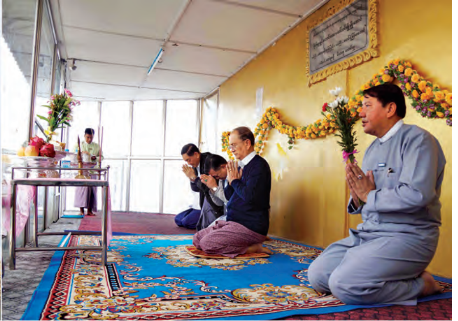
နေပြည်တော် ဇွန် ၁၀

ရှမ်းပြည်နယ် (တောင်ပိုင်း) တောင်ကြီးမြို့တွင် ရောက်ရှိနေသော နိုင်ငံတော်သမ္မတ ဦးသိန်းစိန်နှင့် အဖွဲ့ဝင်များသည် ယနေ့နံနက်ပိုင်းက တောင်ကြီးမြို့ရှိ တန်ခိုးကြီးဘုရားများအား ဖူးမြော်ကြည်ညိုသည်။