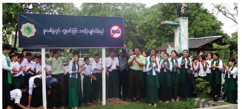
မူးယစ်ဆေးဝါးတရားမဝင်ရောင်းဝယ်မှုတိုက်ဖျက်ရေးနေ့အထိမ်းအမှတ်အဖြစ် မူးယစ်ဆေးဝါးအန္တရာယ်ကာကွယ်တားဆီးရေးပညာပေးဆိုင်ဘုတ်ကို ဗန်းမော်မြို့ အထက(၁)ကျောင်းရှေ့၌ ဇွန် ၈ ရက်က စိုက်ထူနေစဉ်။