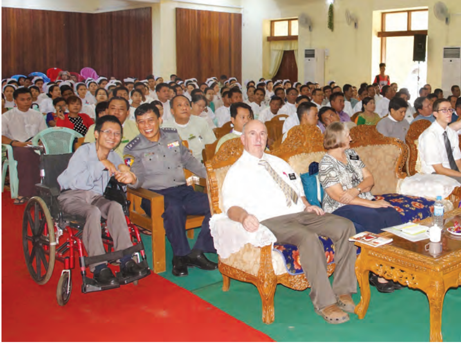
ရွှေမင်းသားဖောင်ဒေးရှင်း ဥက္ကဋ္ဌနှင့် မြန်မာနိုင်ငံရဲတပ်ဖွဲ့မှ တာဝန်ရှိသူတစ်ဦးကို အခမ်းအနားတွင် တွေ့ရစဉ်။

ရွှေမင်းသားဖောင်ဒေးရှင်း (မြန်မာ) နှင့် Latter-Day Saint Charities (LDSC) တို့ပူးပေါင်း၍ ရောဂါတိုင်းဒေသကြီးအတွင်းရှိ မသန်စွမ်းသူများအတွက် ခြေတုများပေးအပ်ပွဲနှင့် Handicap International တို့ပူးပေါင်း၍ တိုင်းဒေသကြီးအတွင်းမှ မသန်စွမ်းသူများအတွက် အကောင်အထည်ဖော်မည့် စီမံချက်မိတ်ဆက်ပွဲကို ပုသိမ်မြို့တော်ခန်းမ၌ ဇွန် ၈ ရက်တွင် ကျင်းပသည်။ အခမ်းအနားသို့ ရောဂါတိုင်းဒေသကြီး ဝန်ကြီးချုပ် ဦးသိန်းအောင်နှင့်ဝန်ကြီးများ တိုင်း၊ ခရိုင်နှင့် မြို့နယ်အဆင့်ဌာနဆိုင်ရာတာဝန်ရှိသူများ၊ ရွှေမင်းသားဖောင်ဒေးရှင်း(မြန်မာ) နှင့် အဖွဲ့အစည်းအသီးသီးမှ ပရောဂျက် မန်နေဂျာနှင့် တာဝန်ရှိသူများ၊ မြို့မိမြို့ဖများနှင့် မသန်စွမ်းသူများ တက်ရောက်ကြသည်။ တိုင်းဒေသကြီး ဝန်ကြီးချုပ်က မသန်စွမ်းသူများ ပြန်လည်ထူထောင်ရေးကိစ္စများတွင် ရွှေမင်းသားဖောင်ဒေးရှင်း(မြန်မာ)၏ ဆောင်ရွက်ချက်များကို ဂုဏ်ယူဝမ်းမြောက်ကြောင်း အမှာစကားပြောကြားပြီး Latter - Day Saint Charities (LDSC)မှ စီမံကိန်းမန်နေဂျာ Mr.