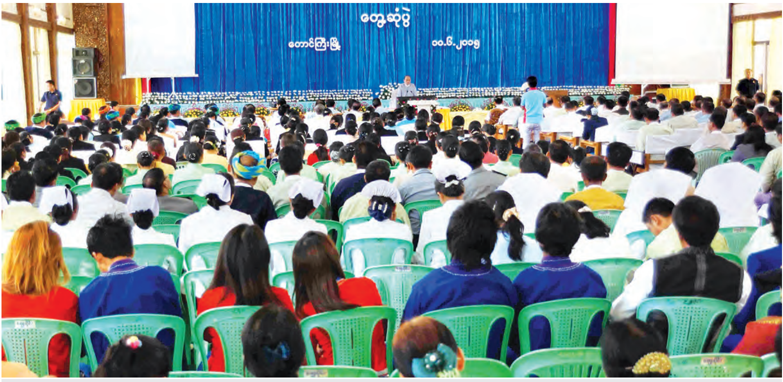
နိုင်ငံတော်သမ္မတဦးသိန်းစိန် တောင်ကြီးခရိုင်၊ လျှင်လင်ခရိုင်၊ လင်းခေးခရိုင်တို့မှ စီမံခန့်ခွဲမှုကော်မတီဝင်များ၊ ဖွံ့ဖြိုးတိုးတက်ရေးအထောက်အကူပြုကော်မတီဝင်များ၊ စည်ပင်သာယာရေးကော်မတီဝင်များကို တောင်ကြီးမြို့ မြို့တော်ခန်းမ၌ တွေ့ဆုံစဉ်။

ပွားစေရေးလုပ်ငန်းများ လိုအပ်ပါကြောင်း၊ အဆိုပါတရားဥပဒေများကို ပြည်သူများ သိရှိလိုက်နာနိုင်ရန်အတွက် သက်ဆိုင်ရာဌာနများက ပညာပေးလုပ်ငန်းများဆောင်ရွက်ပေးရမည်ဖြစ်ပါကြောင်း၊ အရေးကြီးဆုံးအချက်မှာ ၂၀၁၅ နိုဝင်ဘာလတွင် ကျင်းပမည့် အထွေထွေရွေးကောက်ပွဲကို လွတ်လပ်ပြီး တရားမျှတသည့် ရွေးကောက်ပွဲဖြစ်ရန် ပြည်ထောင်စုရွေးကောက်ပွဲ ကော်မရှင်က ကြိုးစားဆောင်ရွက်လျက်ရှိနေပါကြောင်း။