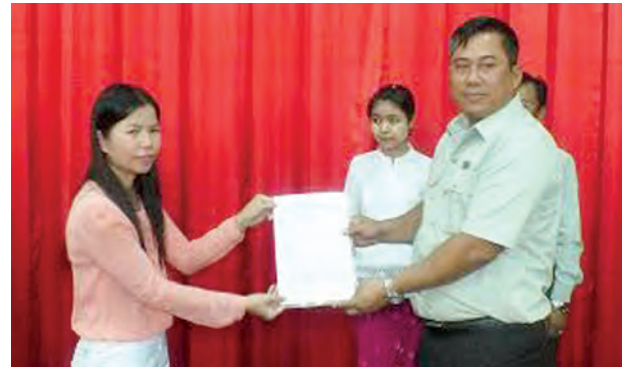
တာချီလိတ်မြို့ရှိ ပြန်လည်စွန့်လွှတ် မြေများအား မူလလုပ်ကိုင်သူ ဒေသခံတောင်သူများထံသို့ လယ်ယာမြေလုပ်ပိုင်ခွင့် ယာယီပုံစံ ( ၃ ) လွှဲပြောင်းပေးအပ်ပွဲကို ဇွန် ၅ ရက်က ခရိုင် ထွေ/အုပ်စိုးကျွန်းပရ စွန့်လွှတ်မြေ ၁၁၁ ဒသမ ၀၁ ဧကအား တောင်သူ ၃၆ ဦးထံ ခရိုင်အုပ်ချုပ်ရေးမှူးက ပြန်လည်လွှဲပြောင်းပေးအပ်စဉ်။ မောင်ယဉ်ကျေး

လှိုင်းဘွဲ့မြို့နယ်တွင် အပြည်ပြည်ဆိုင်ရာ မူးယစ်ဆေးဝါး အလှည့်မူးနှင့် တရားမဝင်ရောင်းဝယ်မှု တိုက်ဖျက်ရေးအထိမ်းအမှတ် ဓာတ်ပုံပြပွဲ၊ နံရံကပ်စာစောင်နှင့် ဟောပြောပွဲများကို ဇွန် ၈ ရက်က မဲသိမ်ကျေးရွာတွင် ကွမ်ဘီကျေးရွာတို့တွင် ကျင်းပခဲ့သည်။ အဆိုပါ ဟောပြောပွဲတွင် မြို့နယ် ပြန်/ဆက် ဦးစီးမှူးက မူးယစ်ဆေးဝါးနှင့်စိတ်ကိုပြောင်းလဲစေသော ဆေးဝါးများ အန္တရာယ်အကြောင်းတို့ကို ရှင်းလင်းဟောပြောခဲ့သည်။ (မြို့နယ် ပြန်/ဆက်)