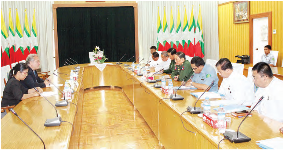
ရန်ကုန်တိုင်းဒေသကြီးတို့တွင် ဆောင်ရွက်လျက်ရှိသည့် စားနပ်ရိက္ခာထောက်ပံ့ဖြန့်ဝေရေး စီမံကိန်းဆိုင်ရာကိစ္စရပ်များနှင့် ရှေ့ဆက်လက် ဆောင်ရွက်သွားမည့် အစီအမံများအား ရင်းနှီးပွင့်လင်းစွာ အမြင်ချင်းဖလှယ်ဆွေးနွေးခဲ့ကြကြောင်း သတင်းရရှိသည်။ (သတင်းစဉ်)

နယ်စပ်ရေးရာဝန်ကြီးဌာန ပြည်ထောင်စုဝန်ကြီး ဒုတိယဗိုလ်ချုပ်ကြီး သက်နိုင်ဝင်းသည် ယနေ့မွန်းလွဲ ၂ နာရီတွင် ကုလသမဂ္ဂကမ္ဘာ့စားနပ်ရိက္ခာအစီအစဉ် (WFP) မှ Country Director and Representative, Mr. Domenico Scalpelli အား ပြည်ထောင်စုဝန်ကြီး၏ အစည်းအဝေးခန်းမ၌ လက်ခံတွေ့ဆုံခဲ့သည်။ (လာပုံ)