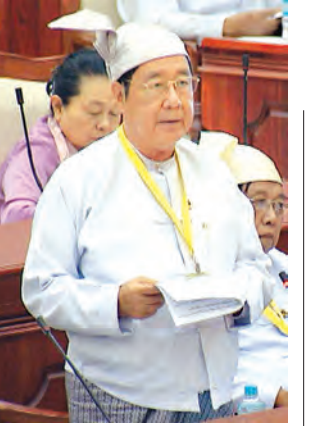
ဒုတိယဝန်ကြီး ဦးသန်းဆွေ မြေကြားစဉ်။

ပလက်ဝဲမဲဆန္ဒနယ်မှ ဦးပိုင်လင်း၏ ကျောက်တော်-ပလက်ဝဲလမ်းနှင့် မတူပီ-ပလက်ဝဲ လမ်းပေါ်ဆက်စပ်မည့် ကုလားတန်မြစ်ကူးတံတား(ပလက်ဝဲ) ရေလမ်းအရှည်ပေ ၁၁၀၀နှင့် ချဉ်းကပ်လမ်းပေ ၈၀၀ စုစုပေါင်း ၁၉၀၀ ပေ ရှိမည့် သံမဏိကုန်ကရစ် သံပေါင်ကြိုးတံတား တည်ဆောက်ပေးစေလိုပါသဖြင့် လာမည့်ဘတ်ဂျက်နှစ် သို့မဟုတ် မည်သည့်ခုနှစ်တွင် တည်ဆောက်ပေးမည်ကို သိလိုခြင်း မေးခွန်းနှင့်စပ်လျဉ်း၍ ဆောက်လုပ်ရေးဝန်ကြီးဌာန ဒုတိယဝန်ကြီး ဦးစိုးတင်က ကုလားတန်မြစ်ကူးတံတားတစ်စင်း ဆောက်လုပ်ရန် လိုအပ်ပါကြောင်း၊ ကျောက်တော်-