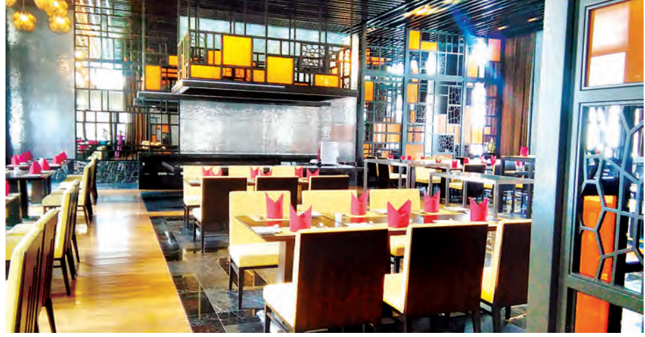
ဧည့်သည်တော်များအတွက် အစားအသောက်ခန်းမ ပြင်ဆင်ထားမှုကို တွေ့ရစဉ်။