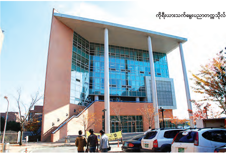
ကိုရီးယားသက်မွေးပညာကဏ္ဍသို့လ်

နည်းပညာနှင့် သက်မွေးပညာရေးဥပဒေကို နိုင်ငံတော်ဖွံ့ဖြိုးတိုးတက်ရေးနှင့် ပြည်သူ့တို့၏ လူမှုစီးပွားရေးဖွံ့ဖြိုးတိုးတက်ရန်လိုအပ်သည်။ သက်မွေးပညာရပ်ဆိုင်ရာ လုပ်ငန်းနယ်ပယ်အသီးသီးအတွက် လက်တွေ့နည်းပညာနှင့် အတတ်ပညာကျွမ်းကျင်သူများ၊ အသိပညာရှင်များ၊ စက်မှုလက်မှုအတတ်ပညာရှင်များဖြစ်စေရန် စနစ်တကျလေ့ကျင့်သင်ကြားပေးနိုင်ရန်၊ သက်မွေးပညာဖြင့် လူမှုစီးပွားဖွံ့ဖြိုးတိုးတက်မှုအတွက် လိုအပ်သည့် လူ့စွမ်းအားအရင်းအမြစ်များ လေ့ကျင့်ပြုစုပေးထောင်ပေးရန်၊ နိုင်ငံတကာအဆင့်မီ ပညာရပ်ဆိုင်ရာ ပတ်ဝန်းကျင်ကောင်းမွန်ဖန်တီးပေးရန်နှင့် သတင်းအချက်အလက်နှင့် ဆက်သွယ်ရေး နည်းပညာများကို ထိရောက်စွာအသုံးပြုခြင်းဖြင့် သင်ကြားရေး၊ သင်ယူရေး၊ သုတေသနနှင့် စီမံခန့်ခွဲရေးဆိုင်ရာ လုပ်ငန်းများ၏ အရည်အသွေးမြင့်မားလာစေရန်၊ တိုင်းဒေသကြီးများ၊ ပြည်နယ်များနှင့် ကိုယ်ပိုင်အုပ်ချုပ်ခွင့်ရဒေသများ ဖွံ့ဖြိုးတိုးတက်စေရေးအတွက် လိုအပ်သည့်နည်းပညာများနှင့် သက်မွေးပညာ သင်တန်းများကို လိုအပ်သလို တိုးချဲ့သင်ကြားပေးရန်၊ နိုင်ငံသားများ အလုပ်အကိုင်ရရှိမှု၊ တစ်ဦးချင်းဝင်ငွေ တိုးတက်မှုအတွက် နည်းပညာနှင့် သက်မွေးပညာကဏ္ဍကို မြှင့်တင်ဆောင်ရွက်ရန်၊ နိုင်ငံတော်ကို ချစ်မြတ်နိုးသည့် အသိစိတ်ဓာတ်နှင့် ခံယူချက်များပြည့်ဝသည့် အတတ်ပညာနှင့် ကျွမ်းကျင်သူများကို လေ့ကျင့်သင်