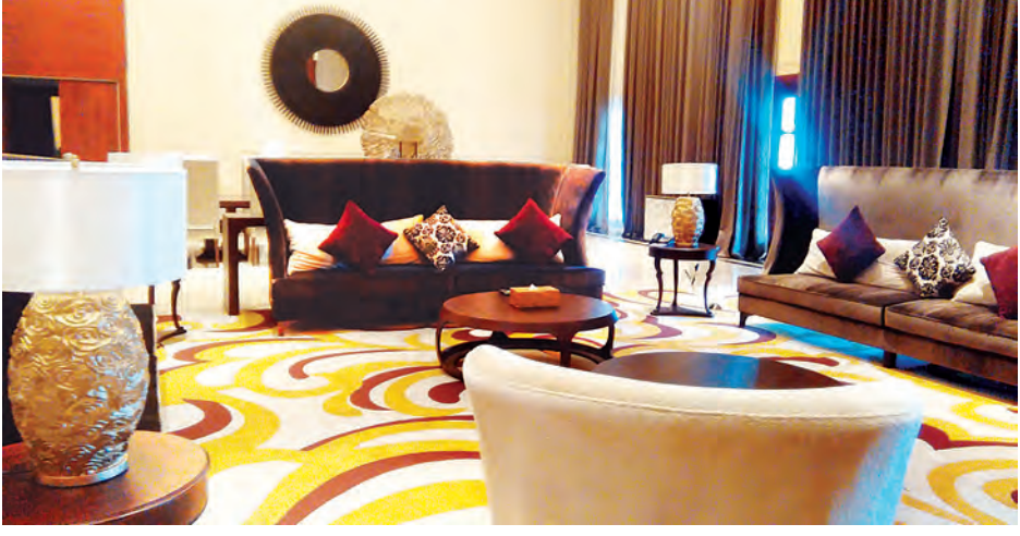
ဧည့်သည်တော်များအတွက် ဧည့်ဆောင်တစ်ခု ပြင်ဆင်ထားမှုကို တွေ့ရစဉ်။

သတင်း- ဂြူးစန္ဒီနွေး၊ သိန်သိန်မိုး ( မြန်မာ့အလင်း )