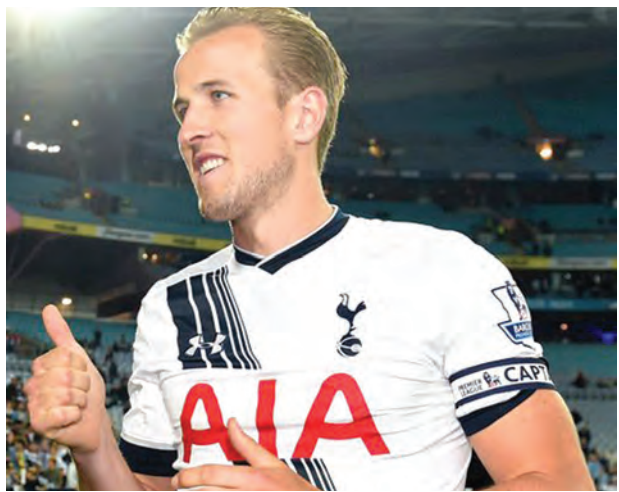
ကောင်းတစ်ဦး အလိုရှိနေပါတယ်။ လာမယ့်ရာသီအတွက် နည်းပြဗန်ဟားလ်အနေနဲ့ မန်ယူရဲ့ တိုက်စစ်ကို ပြန်လည်တည်ဆောက်ရာမှာ ဟယ်ရီကိန်းလည်း ပါဝင်လာဖွယ်ရှိပါတယ်။

မန်ယူမှာ ပြီးခဲ့တဲ့ရာသီက နာမည်ကြီး ကစားသမားတွေရှိခဲ့ပေမယ့် ဂိုးသွင်းနိုင်မှုအားနည်းခဲ့ပါတယ်။ ဒီအတွက် ဂိုးသွင်းအားကောင်းတဲ့ တိုက်စစ်မှူး