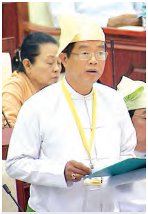
ဒုတိယဝန်ကြီး ဦးကျော်ကျော်ဝင်း ဖြေကြားစဉ်။ (သတင်းစဉ်)

မူလတန်းလွန်ကျောင်းအား အလယ်တန်းကျောင်းခွဲအဖြစ် လည်းကောင်း ၂၀၁၅-၂၀၁၆ ဘဏ္ဍာရေးနှစ်အတွင်း အဆင့်တိုးမြှင့်ပေးရန် အစီအစဉ်ရှိ/မရှိ မေးခွန်းနှင့်စပ်လျဉ်း၍ ပညာရေးဝန်ကြီးဌာန ဒုတိယဝန်ကြီး ဦးသန်းရှင်းက ဂန့်ဂေါမြို့နယ် ဟံသာဝတီ အခြေခံပညာအထက်တန်းကျောင်း (ခွဲ)၊ လာဘို အခြေခံပညာအလယ်တန်းကျောင်း(ခွဲ)၊ မောက်လင်း အခြေခံပညာ အလယ်တန်းကျောင်း (ခွဲ)၊ ဘော်ပြင်း အခြေခံပညာမူလတန်း လွန်ကျောင်းတို့အား သတ်မှတ်မူဘောင်နှင့် မကိုက်ညီပါသဖြင့် ယခု ပညာသင်နှစ်တွင် အဆင့်တိုးမြှင့်ပေးနိုင်ခြင်းမရှိပါကြောင်း၊ နှမ်းခါး အခြေခံပညာ အလယ်တန်းကျောင်း (ခွဲ)၊ တောင်ခင်ရမ်း အခြေခံပညာ အထက်တန်းကျောင်း (ခွဲ)တို့ကို အဆင့်တိုးမြှင့်ပေးပြီး ဖြစ်ပါကြောင်း ဖြင့် ရှင်းလင်းဖြေကြားသည်။