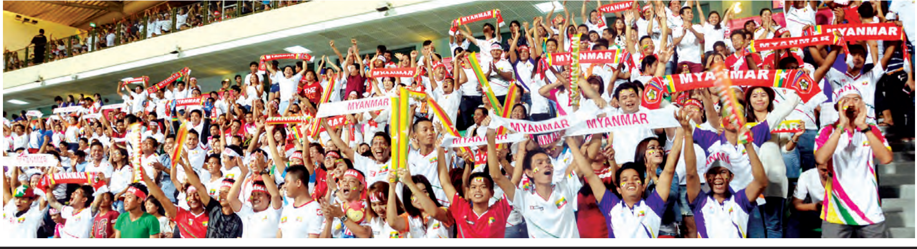
စင်ကာပူဆီးဂိမ်းပြိုင်ပွဲအတွက် မြန်မာအားကစားသမားများ စင်ကာပူသို့ထွက်ခွာနေစဉ်။

စင်ကာပူ ၈ မလေးရှားလျှင်ကြောင့် သေဆုံးသွားသည့် ကလေးငယ်များအတွက် စင်ကာပူနိုင်ငံနှင့် မလေးရှားနိုင်ငံ ဆားဘားပြည်နယ်များ၌ ဇွန် ၈ ရက်တွင် အရှေ့တောင်အာရှ အားကစားအဖွဲ့ချုပ်နှင့် စင်ကာပူဆီးဂိမ်းကျင်းပရေး ကော်မတီတို့က အောက်မေ့ဖွယ်နေ့အဖြစ် သတ်မှတ်ကြေညာခဲ့ပြီး ပြိုင်ပွဲအားလုံးကို တစ်မိနစ်ခန့် ငြိမ်သက်ရပ်နားခဲ့သည်။ မလေးရှားနိုင်ငံ ဆားဘားပြည်နယ် ဘော်နိုယိုကျွန်း၌ ဇွန် ၅ ရက်က ပြင်းအား ရစ်ချ်တာစကေး ၆ ရှိ လျှင်လှုပ်ခတ်ခဲ့ပြီး ကီနာဘာလူ တောင်ပြိုကျမှုကြောင့် စင်ကာပူနိုင်ငံမှ လေ့လာရေးခရီးသွား မူလတန်းကျောင်းသား ကလေးငယ် ၅ ဦးနှင့် မလေးရှားနိုင်ငံ ဆားဘားပြည်နယ် ဘော်နိုယိုကျွန်း၌ ဇွန် ၅ ရက်က ပြင်းအား ရစ်ချ်တာစကေး ၆ ရှိ လျှင်လှုပ်ခတ်ခဲ့ပြီး ကီနာဘာလူ တောင်ပြိုကျမှုကြောင့် စင်ကာပူနိုင်ငံမှ လေ့လာရေးခရီးသွား မူလတန်းကျောင်းသား ကလေးငယ် ၅ ဦး သေဆုံးခဲ့ရသည်။ မြောက်ဦးအပါအဝင် ဆရာတစ်ဦးနှင့် ဧည့်လမ်းညွှန်တစ်ဦးတို့ သေဆုံးခဲ့ရသည်။ အဆိုပါဖြစ်ရပ်ကို ဝမ်းနည်းခြင်း အထိမ်းအမှတ်အဖြစ် ဇွန် ၈ ရက်တွင် စင်ကာပူနိုင်ငံအလံကို ဆီးဂိမ်းပြိုင်ပွဲကျင်းပရာ နေရာနှင့် အစိုးရရုံး အဆောက်အအုံများ၌ တိုင်တစ်ဝက်လွှင့်ထူခြင်းများ ပြုလုပ်ခဲ့ကြောင်း သိရသည်။ (ဇင်ဦး)