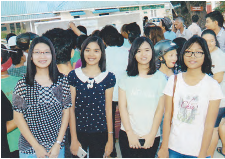
မန္တလေးတိုင်းဒေသကြီး ချမ်းအေးသာစံမြို့နယ် အထက(၁၆) စာဖြေဌာနတွင် ဝင်ရောက်ဖြေဆိုခဲ့သည့် ဘာသာစုံ ဂုဏ်ထူးရ ကျောင်းသူလေးဦးကို အောင်စာရင်းကြည့်ပြီးချိန် တွေ့ရစဉ်။

ခရိုင်များအနက် မန္တလေးခရိုင်သည် အောင်ချက် အကောင်းဆုံးနှင့် ဂုဏ်ထူးရသူအများဆုံးဖြစ်ကာ ဂုဏ် ထူးရသူဦးရေ၏ တစ်ဝက်နီးပါးမှာ မန္တလေးခရိုင်အတွင်း