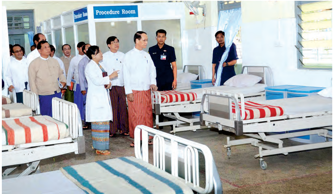
ဒုတိယသမ္မတ ဒေါက်တာစိုင်းမောက်ခမ်း တက္ကသိုလ်များဆေးရုံ(ရန်ကုန်)တွင် ကြည့်ရှုစစ်ဆေးစဉ်။ (သတင်းစဉ်)

လက်ရှိကာလတွင် ကျောင်းသားကျောင်းသူများ၊ ဆရာ ဆရာမများ၊ ဝန်ထမ်းများနှင့် မိသားစုများအတွက် ၂၄ နာရီ ကျန်းမာရေးစောင့်ရှောက်မှုပေးခြင်း၊ ရန်ကုန်မြို့ရှိ အခြားတက္ကသိုလ်များတွင် ဆေးခန်းဖွင့်လှစ်ပေးခြင်းနှင့် ဆေးခွင့်များကိုစစ်ဆေးထောက်ခံပေးခြင်း၊ အလုပ်ခန့်မည့် ဝန်ထမ်းများနှင့် နိုင်ငံခြားပညာတော်သင် သွားရောက်ကြမည့်သူများကို ကျန်းမာရေး စစ်ဆေးပေးခြင်း၊ ကျောင်းကျန်းမာရေးဆိုင်ရာသင်တန်းများပေးခြင်း၊ နာမကျန်းသူများအတွက် စာစစ်ဌာန ဖွင့်လှစ်ပေးခြင်းများကို ဆောင်ရွက်ပေးလျက်ရှိသည်။