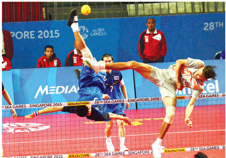
အသင်းလိုက်ပိုက်ကျော်ခြင်းပြိုင်ပွဲတွင် ထိုင်းနှင့် စင်ကာပူတို့ ယှဉ်ပြိုင်နေစဉ်။

ရန်ကုန် ၈ ဇွန် ၅ ရက်မှ ၁၆ ရက်အထိ စင်ကာပူနိုင်ငံ၌ အိမ်ရှင်အဖြစ် လက်ခံကျင်းပနေသည့် (၂၈)ကြိမ်မြောက် အရှေ့တောင်အာရှ အားကစားပြိုင်ပွဲသို့ ဝင်ရောက်ယှဉ်ပြိုင်မည့် မြန်မာ့လက်ရွေးစင် ဘော်လီဘော အားကစားသမား ၂၉ ဦး၊ မြားပစ်အားကစားသမား ၁၅ ဦး၊ ဘိုလင်း အားကစားသမား တစ်ဦးနှင့် အားကစားအောင်နိုင်ရေးအထောက်အကူပြုအဖွဲ့ ၁၃ ဦးသည် ယနေ့ နံနက် ၈ နာရီက ရန်ကုန် အပြည်ပြည်ဆိုင်ရာလေဆိပ်မှ စင်ကာပူနိုင်ငံသို့ ထွက်ခွာရာ အားကစားနှင့် ကာယပညာဦးစီးဌာနမှ တာဝန်ရှိပုဂ္ဂိုလ်များ ပို့ဆောင်နှုတ်ဆက်ကြသည်။ (မြန်မာ့အလင်း)