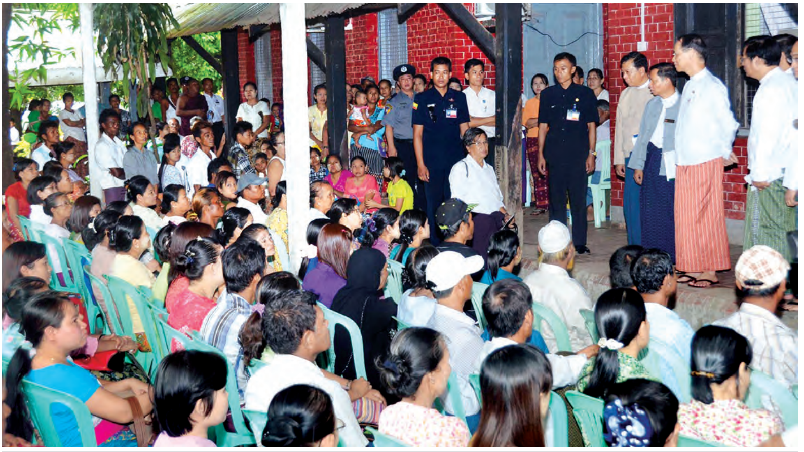
ဒုတိယသမ္မတ ဒေါက်တာစိုင်းမောက်ခမ်း ရန်ကုန်မြို့ရှိ အရိုးရောဂါအထူးကုဆေးရုံကြီး၌ လူနာစိသားစုများအား နှုတ်ဆက်အားပေးစဉ်။ (သတင်းစဉ်)

တင်ပြချက်များနှင့် စပ်လျဉ်း၍ ဒုတိယသမ္မတက ရန်ကုန်အရိုးရောဂါအထူးကုဆေးရုံကြီးသို့ လာရောက်ရသည့် ရည်ရွယ်ချက်မှာ ဆေးရုံ၏ လိုအပ်ချက်များကို သိရှိနိုင်ရန်နှင့် ဤအရိုးရောဂါအထူးကုဆေးရုံကြီးမှ အရိုးဘက်ဆိုင်ရာ ရောဂါများကို နိုင်ငံခြားက ကုသမှုပေးနိုင်ခြင်းအားဖြင့် ရန်ကုန် ပြည်သူ့ဆေးရုံကြီးအပေါ် ပိုမိုကျရောက်လာမည့် တာဝန်များကို မျှဝေထမ်းဆောင်သွားနိုင်စေရန် ဖြစ်ပါကြောင်း၊ ဝန်ထမ်းအင်အား၊ စက်