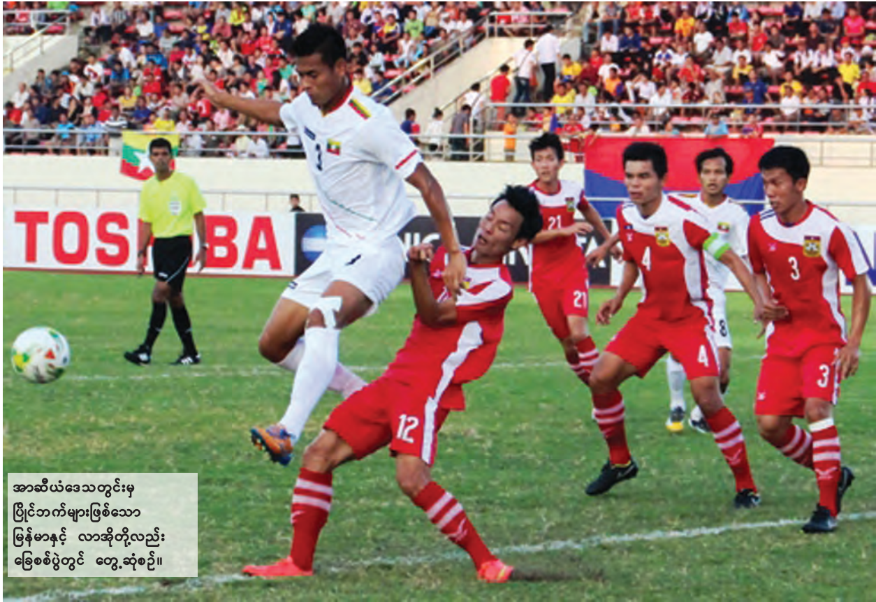
အာဆီယံဒေသတွင်းမှ ပြိုင်ဘက်များဖြစ်သော မြန်မာနှင့် လာအိုတို့လည်း ခြေစစ်ပွဲတွင် တွေ့ဆုံစဉ်။

ထိုင်းအသင်းကို သုံးဂိုး-နှစ်ဂိုးနဲ့ အနိုင်ယူခဲ့ပေမယ့် အိုမန်ကို ခြောက်ဂိုးပြတ်ရှုံးထားတဲ့ မလေးရှားရဲ့ ခြေစစ်ကလည်း စိတ်ပူပင်စရာတော့ ကောင်းနေပါတယ်။ ပါဝါသုံးကစားနိုင်ပေမယ့် အဆုံးသတ်ပိုင်းနဲ့ တစ်ဦးချင်း ကျွမ်းကျင်မှုပိုင်းအားနည်းတဲ့ တီမောကို မလေးရှားတို့ အနိုင်ရအောင်ကြိုးစားပါလိမ့်မယ်။ လက်ရှိမလေးရှားရဲ့ ခြေစစ်က တီမောကို အသာစီးရယူနိုင်တဲ့ အနေအထားရှိနေတာအမှန်ပါပဲ။