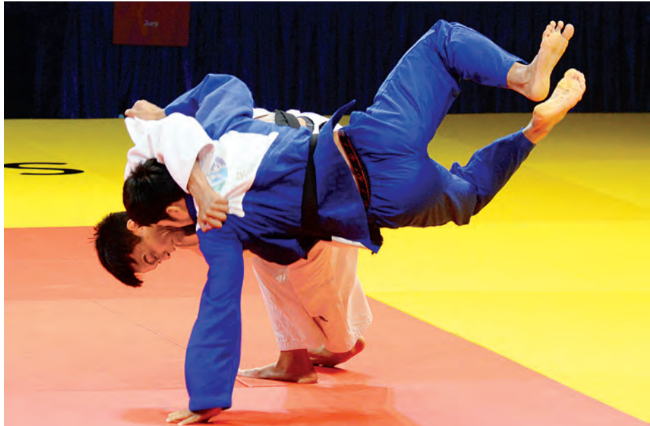
(၂၈)ကြိမ်မြောက် အရှေ့တောင်အာရှ အားကစားပြိုင်ပွဲ ဂျူဒိုပြိုင်ပွဲတွင် မြန်မာအားကစားသမားများ ယှဉ်ပြိုင်နေစဉ်။

(၂၈)ကြိမ်မြောက် အရှေ့တောင်အာရှ အားကစားပြိုင်ပွဲ နိုင်ငံအလိုက်ဆုရရှိမှုပေးစာရင်း ၈-၆-၂၀၁၅