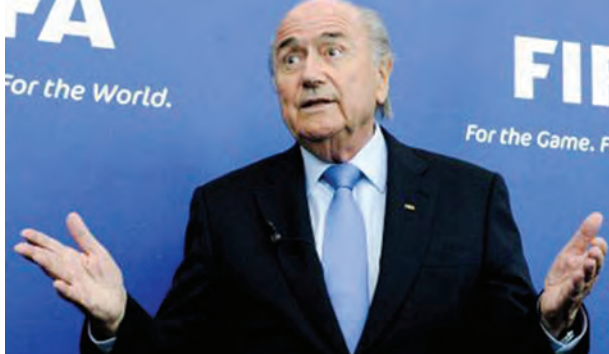
နုတ်ထွက်သွားသော ဥက္ကဋ္ဌဟောင်း ဆပ်ဘလတ္တာ။

ဖီဖာဥက္ကဋ္ဌ ဆပ်ဘလတ္တာဟာ ၁၇ နှစ်ကြာ တာဝန်ထမ်းဆောင်ခဲ့ပြီးတဲ့နောက် ပြန်လည်အရွေးခံရပေမယ့် လာဘ်စားမှုစွပ်စွဲချက်များကြောင့် ရာထူးမှ နုတ်ထွက်သွားခဲ့ပါပြီ။ အသက် ၇၉ နှစ်အရွယ်ရှိ ဆပ်ဘလတ္တာဟာ အင်္ဂါနေ့က ရာထူးမှ နုတ်ထွက်သွားခဲ့ပါတယ်။ သို့ပေမယ့် သူဟာ နောက်ရွေးချယ်တဲ့ ဥက္ကဋ္ဌမလာမီ တာဝန်တွေကိုပြီးဆုံးတဲ့အထိ ဆက်လက်တာဝန်ထမ်းဆောင်သွားမယ်လို့ ဆိုပါတယ်။ ဖီဖာဥက္ကဋ္ဌနေရာအတွက် ရေပန်းစားနေသူတွေကတော့ ယူအီးအက်ဖ်အေဥက္ကဋ္ဌ ပလာတီနီ၊ ဂျော်ဒန်အိမ်ရှေ့မင်းသား အလီဘင်အယ်လ်ဟူစိန်နဲ့ ဖီဖာဒုတိယဥက္ကဋ္ဌဟောင်း တောင်ကိုရီးယားနိုင်ငံသား ဂျူဇွဲဂျွဲနဲ့တို့ပဲဖြစ်ပါတယ်။ အသက် ၅၉ နှစ်အရွယ်ရှိတဲ့ ပလာတီနီကတော့ ဖီဖာဥက္ကဋ္ဌဖြစ်ဖို့ ရေပန်းစားဆုံးဖြစ်နေပါတယ်။ သူဟာ အတွေ့အကြုံအားဖြင့်လည်း အတော်ဆုံးတဲ့သူဖြစ်ပါတယ်။ သူဟာ အကောင်းဆုံးဘောလုံးသမားဆုသုံးဆူလည်း ဆွတ်ခူးနိုင်ခဲ့သူဖြစ်ပါတယ်။ ဂျော်ဒန်အိမ်ရှေ့မင်းသားကတော့ ဆပ်ဘလတ္တာနဲ့ ယှဉ်ပြိုင်အရွေးခံရာမှာ ရှုံးနိုင်သွားခဲ့သူဖြစ်ပါတယ်။ ဟွန်ဒိုင်းအကြီးစား စက်မှုလုပ်ငန်းပိုင်ရှင် အသက် ၆၁ နှစ်အရွယ်ရှိ ဂျူဇွဲဂျွဲနဲ့ကလည်း ဖီဖာဥက္ကဋ္ဌဖြစ်ဖို့စိတ်ဝင်စားနေတယ်လို့ ဆိုပါတယ်။