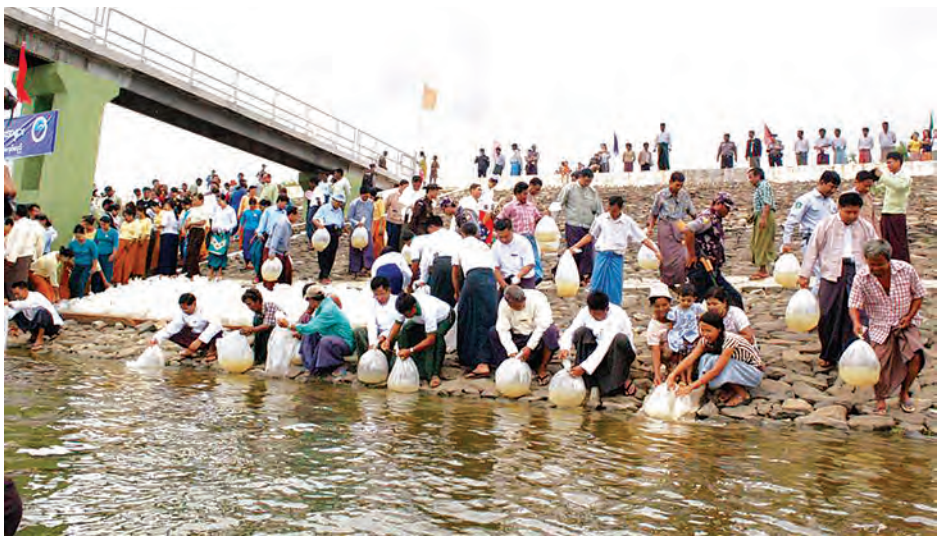
ရွှေဝါငါးကြင်း၊ ငါးမြစ်ချင်း၊ တီလား ဝီးယား၊ ငါးခုံးမနှင့် အခြားငါးမျိုး များဖြစ်ပြီး ကောင်ရေ ၄၂ ဒသမ ၂ သိန်းကို ငါးလုပ်ငန်းဦးစီးဌာန

မြို့နယ် နမ့်တလုံးဆည်အတွင်းသို့ ငါးကောင်ရေ ၅၀၀၀၀၊ ပုလဲမြို့နယ် မြောက်ယမားရေကူတံမံအတွင်းသို့ ငါးကောင်ရေ ၁ ဒသမ ၅သိန်း၊ ဆားလင်းကြီးမြို့နယ် ငွေသာဆည် အတွင်းသို့ ငါးကောင်ရေနှစ်သိန်း၊ ရွှေဘို၊ ခင်ဦး၊ ဝက်လက်၊ ရေဦး၊ ဒီပဲယင်း၊ တန့်ဆည်၊ ကောလင်း၊ ထီးချိုင့်၊ ကလေး၊ တမူးမြို့နယ်များ ရှိ လယ်ကေ ၆၉၀ အတွင်းသို့ ငါးကောင်ရေ ၃၄၅၀၀ စိုက်ထည့် ပေးသွားမည်ဖြစ်ကြောင်း တိုင်း ဒေသကြီး ငါးလုပ်ငန်းဦးစီးဌာနမှ တာဝန်ရှိသူတစ်ဦးက ပြောသည်။ အဆိုပါ သဘာဝမြစ်ချောင်း၊ ဆည်တံမံနှင့် လယ်များအတွင်းသို့ စိုက်ထည့်မည့် ငါးမျိုးများမှာ