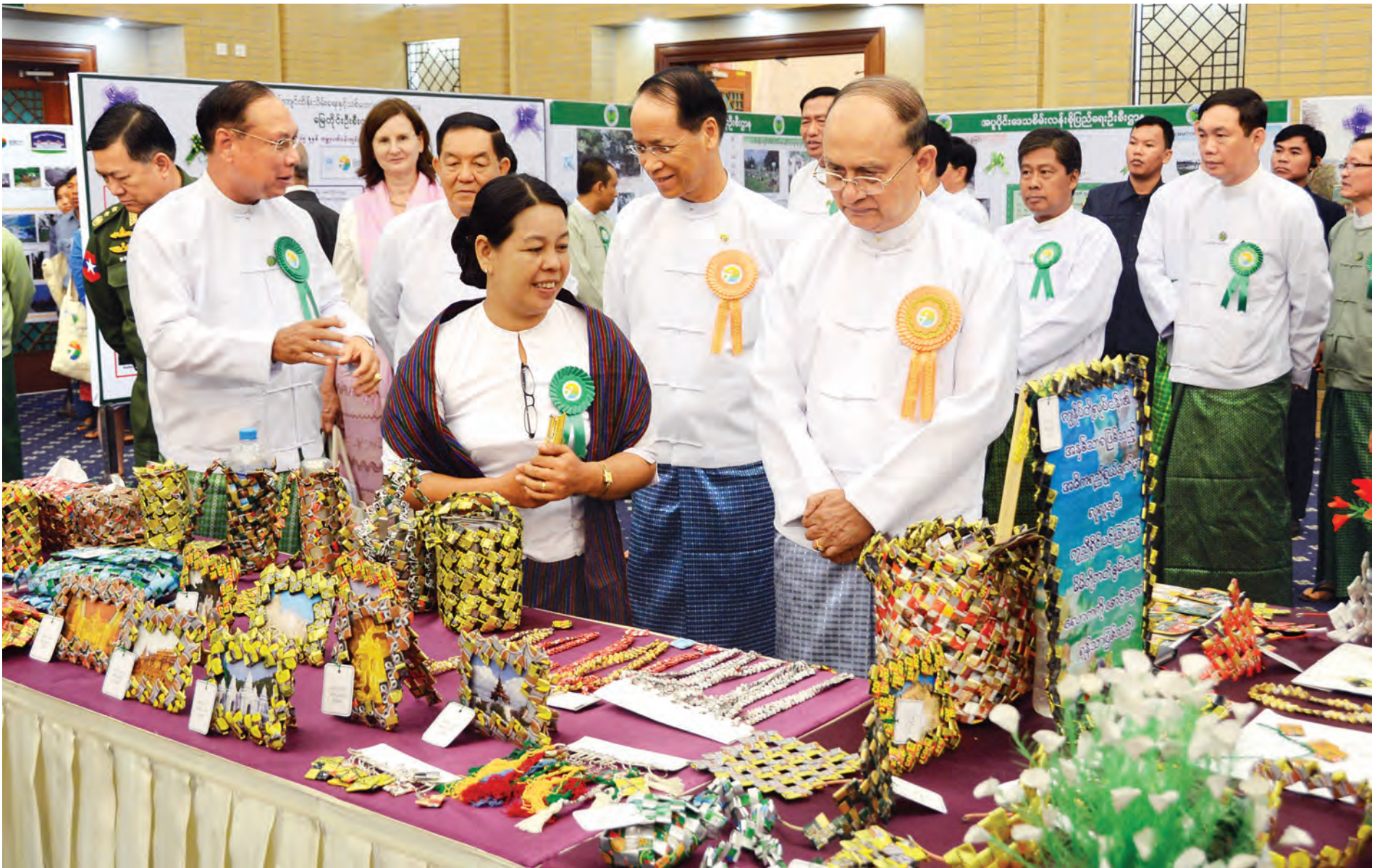
နိုင်ငံတော်သမ္မတဦးသိန်းစိန် ပတ်ဝန်းကျင်ထိန်းသိမ်းရေးနေ့အထိမ်းအမှတ်အဖြစ် ခင်းကျင်းပြသထားသည့်ပြခန်းကို လှည့်လည်ကြည့်ရှုအားပေးစဉ်။ (သတင်း စာမျက်နှာ-၈) (သတင်းစဉ်)