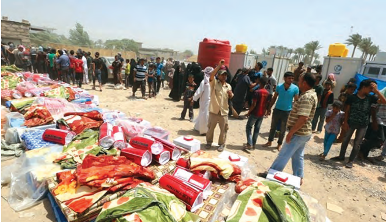
အတွင်း လူသားချင်းစာနာထောက်ထားမှု အထောက်အပံ့အခြေအနေ ဆိုးရွားလာနိုင်ကြောင်း ပြောကြားသည်။ အကယ်၍ ရန်ပုံငွေထောက်ပံ့မှုမရှိတော့လျှင် ဇွန်လကုန်လောက်တွင်

ပြီးခဲ့သည့်နှစ်အစပိုင်းကတည်းက အီရတ်နိုင်ငံတွင် ပြည်သူ သုံးသန်းမှာ အိုးအိမ်စွန့် ထွက်ပြေးခဲ့ရသည်။ ပြီးခဲ့သည့်လများအတွင်းက အီရတ်အနောက် ပိုင်းတွင် ထောင်နှင့်ချီသော ပြည်သူများ ထွက်ပြေးတိမ်းရှောင်ခဲ့ရသေး သည်။ ငွေကြေးသည် အဓိကအကြီးမားဆုံးပြဿနာဖြစ်နေပြီး လာမည့်လများ