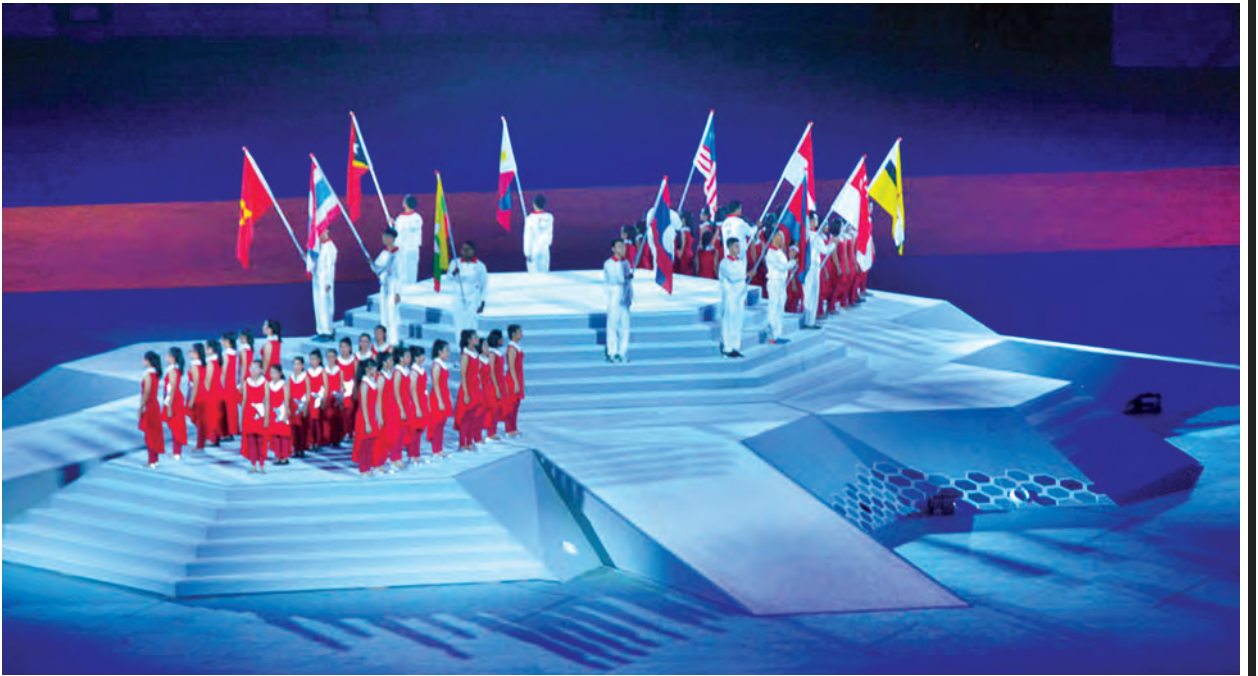
(၂၈)ကြိမ်မြောက် အရှေ့တောင်အာရှအားကစားပြိုင်ပွဲ ဖွင့်ပွဲအခမ်းအနားကို တွေ့ရစဉ်။