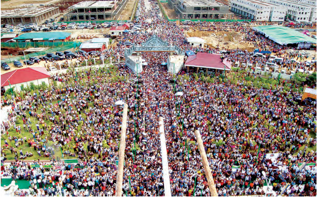
ရတနာပန်းမော်ကျောင်းတိုက် ဆရာတော် ဒေါက်တာဘဒ္ဒန္တကုမာရာဘိဝံသထံမှ အနုမောဒနာတရားနာကြားပြီး လှူဒါန်းမှုအစုစုတို့ အတွက် ရေစက်သွန်းချအမျှပေးဝေကြသည်။ ဆက်လက်ပြီး တိုင်းဒေသကြီး ဝန်ကြီးချုပ်နှင့် အဖွဲ့ဝင်များ၊ တာဝန်ရှိသူများ၊ ဘုရား ဒါယကာ၊ ဒါယိကာမိသားစုနှင့်အလှူရှင်များက ကျောက်စိမ်းစိန်ဖူးတော်၊ ငှက်မြတ်နားတော်၊ ရွှေထီးတော် ဘုံအဆင့်ဆင့်တို့ကို

ထို့နောက် နိုင်ငံတော် သံယနာယကအဖွဲ့ဥက္ကဋ္ဌ အဘိဓမမလာ