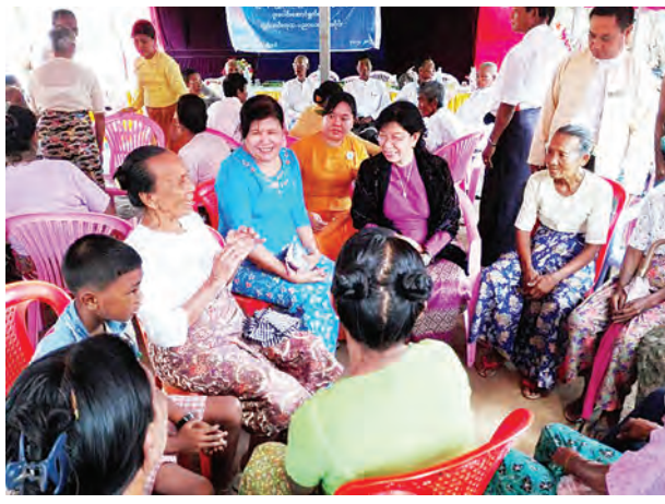
ကုသပေးခြင်းနှင့် ခွဲစိတ်ကုသခြင်းဆိုင်ရာ ရောဂါများကိုစမ်းသပ်ကုသပေးပြီး ဆက်လက်ကုသရန် လိုအပ်သောလူနာများအား ဆေးရုံသို့ ညွှန်ပို့ခြင်းများ ဆောင်ရွက်ပေးခဲ့ကြောင်းသိရသည်။

ပညာပေးစကားပိုင်း၌ ကျန်းမာရေးဝန်ကြီးဌာနမှ တာဝန်ရှိသူများက ကျန်းမာရေးနှင့်ပတ်သက်သည့်အကြောင်းအရာများကို ဟောပြောဆွေးနွေးခဲ့ပြီး ကွင်းဆင်းကုသရေးအဖွဲ့ကလည်း အထွေထွေရောဂါလူနာများကို စမ်းသပ်