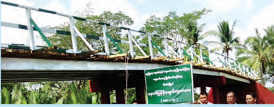
အဆိုပါ နောက်ပြန်ဒိုးချောင်း ကူး တံတားမှာ အရှည်ပေ ၁၀၀၊ အကျယ် ၁၄ ပေ၊ အမြင့် ၂၃ ပေ သစ်သားကြမ်းခင်းတံတားဖြစ် ကြောင်း သိရသည်။ (မြန်မာ့အလင်း)

ရောဝတီတိုင်းဒေသကြီး မြောင်းမြခရိုင် ဝါးခယ်မမြို့နယ် ပဒေသာကုန်း ကျေးရွာအုပ်စု နောက်ပြန်ဒိုးကျေးရွာ နောက်ပြန် ဒိုးချောင်းကူးတံတားကို ၂၀၁၄-၂၀၁၅ ဘဏ္ဍာရေးနှစ် ကျေး လက်ဒေသ ဖွံ့ဖြိုးတိုးတက်ရေး ဦးစီးဌာန ရန်ပုံငွေဖြင့် ရွှေလ ဝိုင်းကုမ္ပဏီမှ တာဝန်ယူ ဆောက်လုပ်၍ ရာနှုန်းပြည့်ပြီးစီး ခဲ့ကြောင်း သိရသည်။