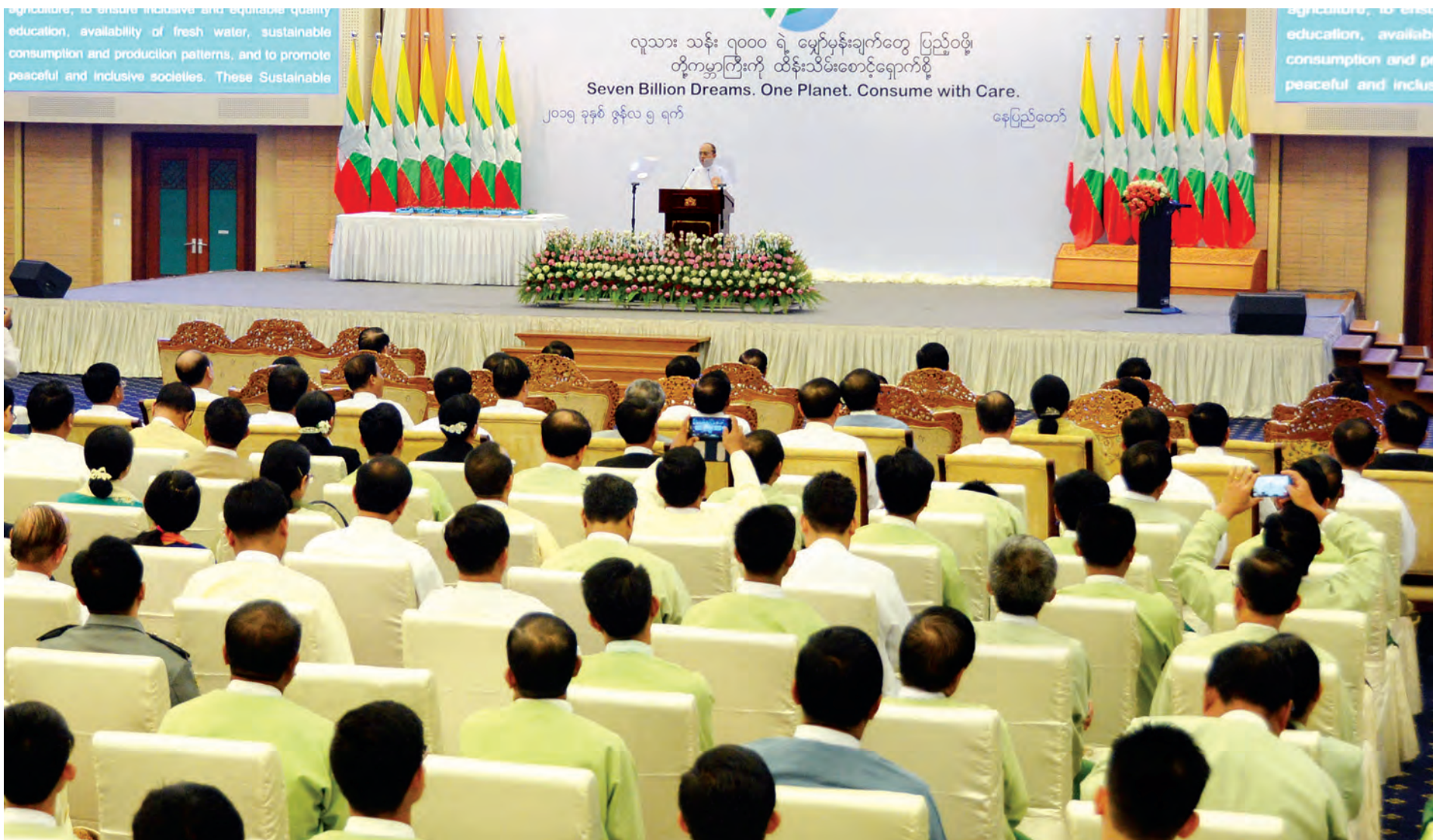
နိုင်ငံတော်သမ္မတ ဦးသိန်းစိန် ၂၀၁၅ ခုနှစ် ကမ္ဘာ့ပတ်ဝန်းကျင်ထိန်းသိမ်းရေးနေ့ အခမ်းအနားတွင် အမှာစကားပြောကြားစဉ်။ (သတင်း-စာ ၈)