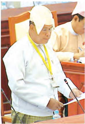
ဒုတိယဝန်ကြီး ဦးအေးမြင့်မောင် ဖြေကြားစဉ်။ (သတင်းစဉ်)

ပြည်သူ့လွှတ်တော် (၁၂)ကြိမ်မြောက် ပုံမှန်အစည်းအဝေး ၅၁ ရက်မြောက်နေ့ကို ယနေ့နံနက် ၁၀ နာရီတွင်ကျင်းပရာ ရမည်းသင်းမဲဆန္ဒနယ်မှ ဦးဘိုနီ၏နိုင်ငံတော်အတွင်း ခေတ်အဆက်ဆက်တည်ထောင်ထားခဲ့သော ဆည်များ နှစ်ရှည်လများ တည်တံ့ခိုင်မြဲရေးအတွက် ရေဝေရေလဲသစ်တောများပြုန်းတီးမှု ကာကွယ်ပေးရန်နှင့် အစဉ်ထာဝရ ကောင်းမွန်နေစေရန် မည်သည့်အစီအမံများဖြင့် စီမံဆောင်ရွက်ထားသည် မေးခွန်းနှင့်စပ်လျဉ်း၍ ပတ်ဝန်းကျင်ထိန်းသိမ်းရေးနှင့် သစ်တောရေးရာဝန်ကြီးဌာန ဒုတိယဝန်ကြီး ဦးအေးမြင့်မောင်က ဆည်နှင့်ချောင်းများ၏ ရေဝေရေလဲဒေသများကို စနစ်တကျ စီမံအုပ်ချုပ်လုပ်ကိုင်ရန်အတွက် နှစ်(၃၀)စီမံကိန်းဖြင့် ဆောင်ရွက်လျက်ရှိရာ ယခုအချိန်ထိ တတိယလုံးနှစ်ကို အကောင်အထည်ဖော် ဆောင်ရွက်လျက်ရှိပါကြောင်း၊ ရမည်းသင်းခရိုင်အတွင်းရှိ သစ်ဆုံဆည်၏ ရေဝေရေလဲဒေသသည် ပဲခူးရိုးမ စိမ်းလန်းစိုပြည်ရေး စီမံကိန်းဧရိယာတွင် ပါဝင်ပြီး ဧက ၇၆၈၀၀ ကျယ်ဝန်းပါကြောင်း၊ ရမည်းသင်းခရိုင်အတွင်း