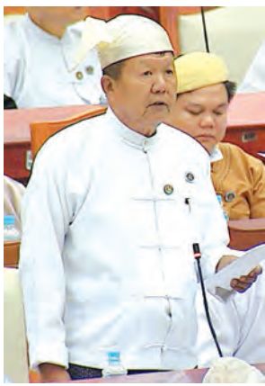
ရမည်းသင်းမဲဆန္ဒနယ်မှ ဦးဘိုနီ မေးမြန်းစဉ်။ (သတင်းစဉ်)

ယင်းမာပင်မဲဆန္ဒနယ်မှ ဦးသောင်းဟန်၏ ယင်းမာပင်မြို့နယ် လက်ဝဲမြောင်းမကြီး ဖောက်လုပ်ရာတွင် ပါဝင်ခဲ့သော လယ်ယာမြေများအတွက် သက်ဆိုင်ရာတောင်သူများအား ထိုက်သင့်သောနစ်နာကြေးများ ထုတ်ပေးရန်နှင့် မြောင်းမကြီးတွင် လက်ဝဲသွယ်နှင့် ရေယူမြောင်းများကို ၂၀၁၅-၂၀၁၆ ဘဏ္ဍာနှစ်တွင် ဆောင်ရွက်ပေးရန်နှင့် စပ်လျဉ်း၍ မေးမြန်းရာ လယ်ယာစိုက်ပျိုးရေးနှင့် ဆည်မြောင်းဝန်ကြီးဌာန ဒုတိယဝန်ကြီး ဦးခင်ဇော်က ယင်းမာပင်မြို့နယ်နှင့် ပုလဲမြို့နယ်အတွင်းရှိ လယ်ယာမြေများ စိုက်ပျိုးရေးရရှိရေးအတွက် မြောက်ယမားလက်ဝဲ