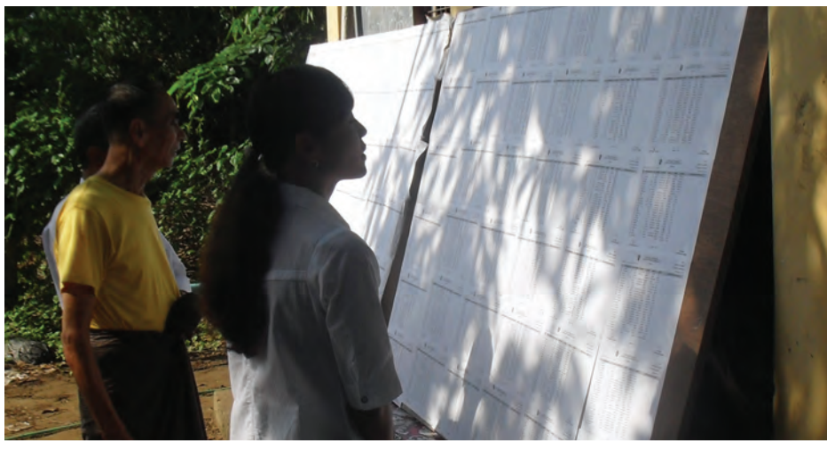
သန်လျင်မြို့နယ် အမှုထမ်းရပ်ကွက်မှ မဲဆန္ဒရှင်စာရင်းကြေညာမှုကို ကြည့်ရှုနေသူတစ်ဦး။ နေထိုင်သည့် အိမ်ထောင်စုစာရင်း လဝကပုံစံ (၆၆/၆) ဖြစ်ကြောင်း သိရသည်။ ရှိသော မြို့နယ်များမှ မဲဆန္ဒရှင်စာရင်းတွင်သာ ပါဝင်မည် သတင်း-မြင့်မောင်စိုး

အဖွဲ့ခွဲရုံးများတွင် ထုတ်ပြန်ထားခြင်းဖြစ်ကြောင်း သိရသည်။ အဆိုပါမြို့နယ်များရှိ ရပ်ကွက်နှင့် ကျေးရွာအသီးသီးတွင် နေထိုင်ကြသူများအနေဖြင့် ရွေးကောက်ပွဲတွင် မဲပေးခွင့်မဆုံးရှုံးစေရန်အတွက် ယခု ထုတ်ပြန်ကြေညာထားသော မဲဆန္ဒရှင်စာရင်းကို မိမိတို့အမည် ပါမပါ သွားရောက်ကြည့်ရှုရမည်ဖြစ်သည်။ မဲဆန္ဒရှင်စာရင်းတွင် မိမိ၏အမည်မပါလျှင် ပုံစံ(၃)ဖြင့် လျှောက်ထားရမည်ဖြစ်ပြီး အမည်ပါသော်လည်း အချက်အလက်များမှားယွင်းနေပါက ပုံစံ(၄-၀)ဖြင့် လျှောက်ထားရမည်ဖြစ်သည်။ မဲဆန္ဒရှင်စာရင်းတွင် မပါဝင်သင့်သူများ၊ ကွယ်လွန်ပြီးသူများ၊ ထောင်ကျနေသူများ စသည်ဖြင့် ပါဝင်နေပါက ပုံစံ(၄)ဖြင့် ကန့်ကွက်လွှာ လျှောက်ထားရမည်ဖြစ်ကြောင်း သိရသည်။ အဆိုပါလျှောက်လွှာများကို မိမိတို့နေထိုင်သည့် ရပ်ကွက်၊ ကျေးရွာ ရွေးကောက်ပွဲကော်မရှင် အဖွဲ့ခွဲများထံတွင် လျှောက်ထားရမည်ဖြစ်ကြောင်း၊ ယခု မဲဆန္ဒရှင်စာရင်းထုတ်ပြန်သည့် မြို့နယ် ၁၄ ခုတွင် ခေတ္တလာရောက်နေထိုင်သူများ၏ အမည်စာရင်းများမှာမူ မိမိတို့