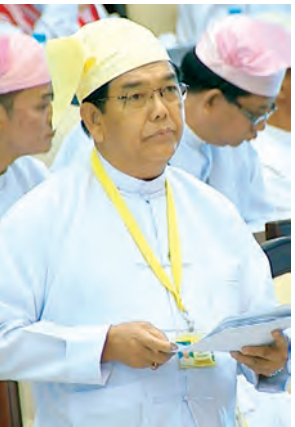
ဒုတိယဝန်ကြီး ဦးအန်းသန်း ဖြေကြားစဉ်။ (သတင်းစဉ်)

လက်ရှိအခြေအနေတွင် လားရှိုးမြို့နယ်၊ မူဆယ်မြို့နယ်နှင့် မြစ်ကြီးနားမြို့နယ်များတွင် ဧက ၁၅၀၀ စာ EL SHADDAI Co.,Ltd ကုမ္ပဏီမှ မျိုးစေ့တင်သွင်းဖြန့်ဖြူး စမ်းသပ်စိုက်ပျိုးလျက်ရှိပါကြောင်း၊ ပဲခူးတိုင်းဒေသကြီး အေးသုခကျေးရွာ၌လည်းကောင်း၊ ရန်ကုန်တိုင်းဒေသကြီး၊ မှော်ဘီမြို့နယ် မြောက်ချောကုန်းကျေးရွာ၌လည်းကောင်း စမ်းသပ်စိုက်ပျိုးရန် ပျိုးထောင်ထားပါကြောင်း၊ အဆိုပါဒေသများတွင် စမ်းသပ်စိုက်ပျိုးမှုအောင်မြင်ပါက ဘိန်းအစားထိုးဒေသများရှိ တောင်သူများ စိုက်