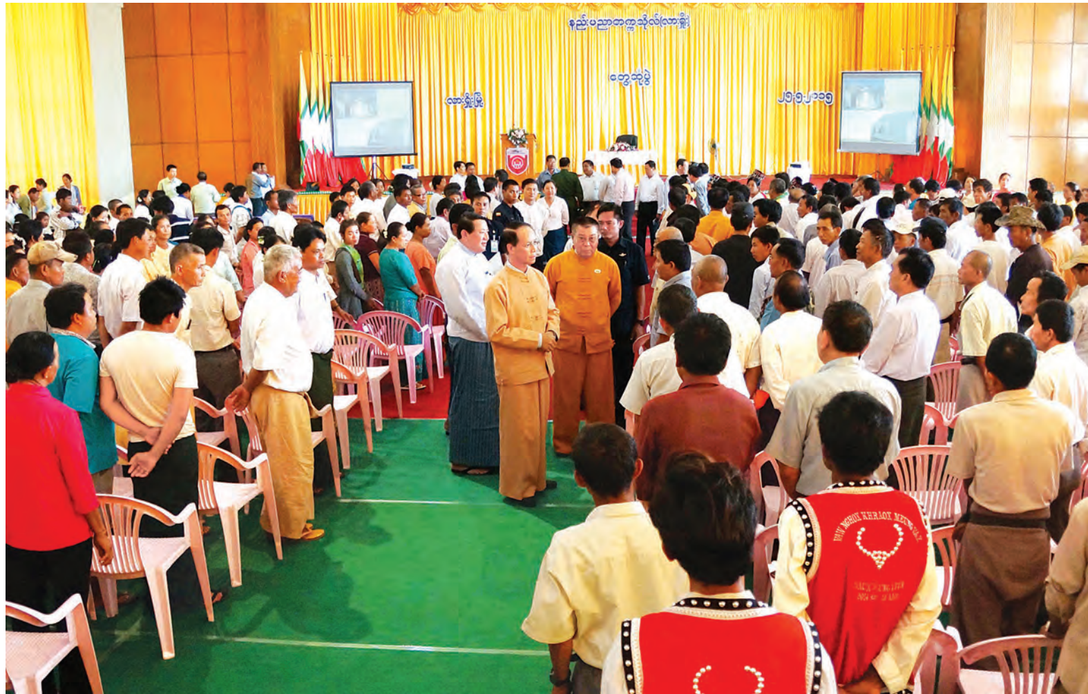
ဒုတိယသမ္မတ ဒေါက်တာစိုင်းမောက်ခမ်း နည်းပညာတက္ကသိုလ်(လားရှိုး) သိပ္ပံရတနာခန်းမ၌ ကျင်းပသည့် တွေ့ဆုံပွဲအခမ်းအနားသို့ တက်ရောက်လာကြသူများအား ရင်းရင်းနှီးနှီးနှုတ်ဆက် စဉ်။ (သတင်း၊ စာမျက်နှာ-၃)