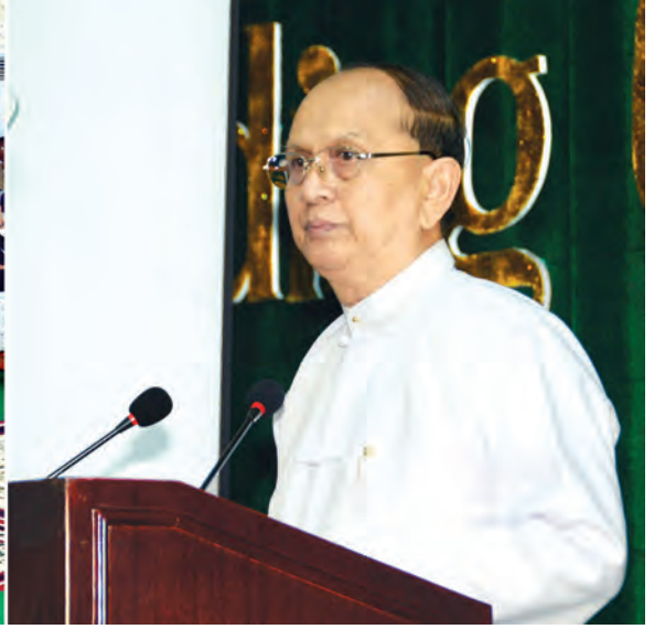
နိုင်ငံတော်သမ္မတ ဦးသိန်းစိန် အပြည်ပြည်ဆိုင်ရာ ဆန်စပါးသုတေသနဌာနမှ ရွှေစပါးနံဂုဏ်ပြုဆုချီးမြှင့်ခြင်းအခမ်းအနားနှင့် မြန်မာ့ဆန်စပါးကဏ္ဍ ဖွံ့ဖြိုးတိုးတက်ရေးမဟာဗျူဟာအစီအမံစတင်ဖွင့်လှစ်ခြင်း အခမ်းအနားတွင် အမှာစကားပြောကြားစဉ်။ (သတင်း: စာမျက်နှာ-၈) (သတင်းစဉ်)