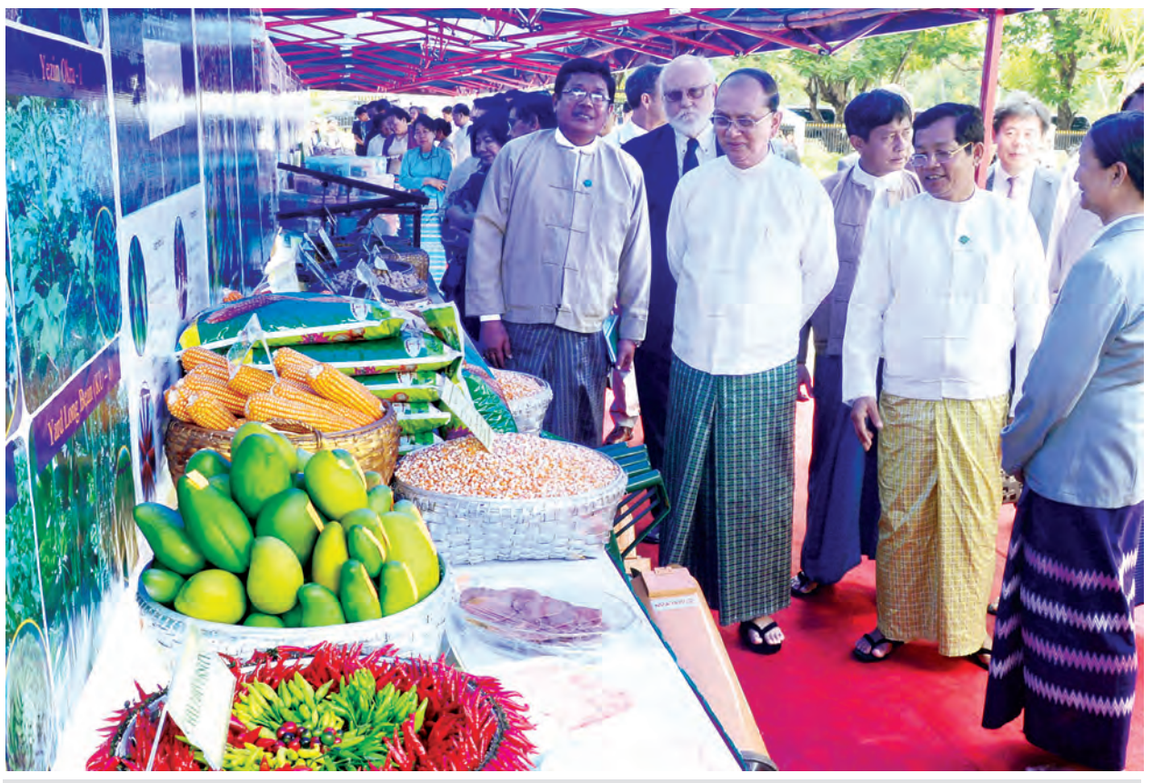
နိုင်ငံတော်သမ္မတ ဦးသိန်းစိန်နှင့်အဖွဲ့ဝင်များ၊ ဧည့်သည်တော်များ စိုက်ပျိုးရေးသုတေသနဦးစီးဌာနမှ ခင်းကျင်းပြသထားသည့်များကို ကြည့်ရှုကြစဉ်။ (သတင်းစဉ်)

မိမိအနေဖြင့်လည်း အပြည်ပြည် ဆိုင်ရာ ဆန်စပါးသုတေသနဌာနမှ ညွှန်ကြားရေးမှူးချုပ် ဒေါက်တာ