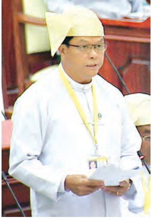
ဒုတိယဝန်ကြီး ဦးအောင်သန်းဦး ဖြေကြားစဉ်။ (သတင်းစဉ်)

ပထမအကြိမ် ပြည်သူ့လွှတ်တော် (၁၂)ကြိမ်မြောက် ပုံမှန်အစည်းအဝေး (၄၉)ရက်မြောက်နေ့ကို ယနေ့နံနက် ၁၀ နာရီတွင် ဆက်လက်ကျင်းပရာ ကန်ပက်လက်မဲဆန္ဒနယ်မှ ပြည်သူ့ လွှတ်တော်ကိုယ်စားလှယ် သူရ ဦးအောင်ကို၏ “အလုပ်လက်မဲ့ မြန်မာသင်္ဘောသား အလုပ်သမား များအတွက် အလုပ်အကိုင်အခွင့်အလမ်းတိုးတက်စေရန် မြန်မာ ပင်လယ်ကူးသင်္ဘောသား အလုပ် သမားအဖွဲ့ချုပ် (MSF)အနေဖြင့် ထိုင်ဝမ် အလုပ်သမားအဖွဲ့ချုပ်နှင့် တရားဝင် ဆက်သွယ်စာချုပ်ချုပ်ဆို ဆောင်ရွက်ခွင့် ရှိ/ မရှိ” မေးခွန်း နှင့်စပ်လျဉ်း၍ ဒုတိယဝန်ကြီး ဦးထင်အောင်က အလုပ်အကိုင်အခွင့် အလမ်းများ ပိုမိုတိုးတက်ရရှိရေး အတွက် သွားလာရန်ခက်ခဲပြီး ရုံးဖွင့် လှစ်နိုင်ခြင်းမရှိသည့် ဒေသများသို့ Mobile Team ဖြင့် ကွင်းဆင်း ဆောင်ရွက်ပေးခြင်း၊ အလုပ်အကိုင် အခွင့်အလမ်း ရရှိရေးအတွက် အလုပ်အကိုင်အခွင့်အလမ်း ပြပွဲ Job Fair များ ပြုလုပ်ဆောင်ရွက် ပေးခြင်းနှင့် ပြည်တွင်းပြည်ပ အလုပ်အကိုင် ရှာဖွေရေးလုပ်ငန်း ဆောင်ရွက်လိုသည့် ကုမ္ပဏီများအား ပြည်တွင်း ပြည်ပ အလုပ်အကိုင် ရှာဖွေရေး အကျိုးဆောင်လိုင်စင်