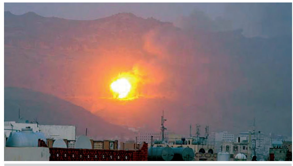
မေ ၁၉ ရက်က ယီမင်မြို့တော် ဆာနားကို လေကြောင်းမှ တိုက်ခိုက်ခြင်းခံရပြီး မီးလောင်နေသည်ကို နိုကွမ်တောင်ပေါ်မှ မြင်ရစဉ်။

သည်ဟု ပြင်သစ်သမ္မတက ပြောသည်။ ဒုက္ခသည်များကို ကူညီကယ်ဆယ်ရန် တူညီသော ဆန္ဒရှိကြောင်း ၎င်းက ပြောသည်။ (ဆင်ဟွာ)