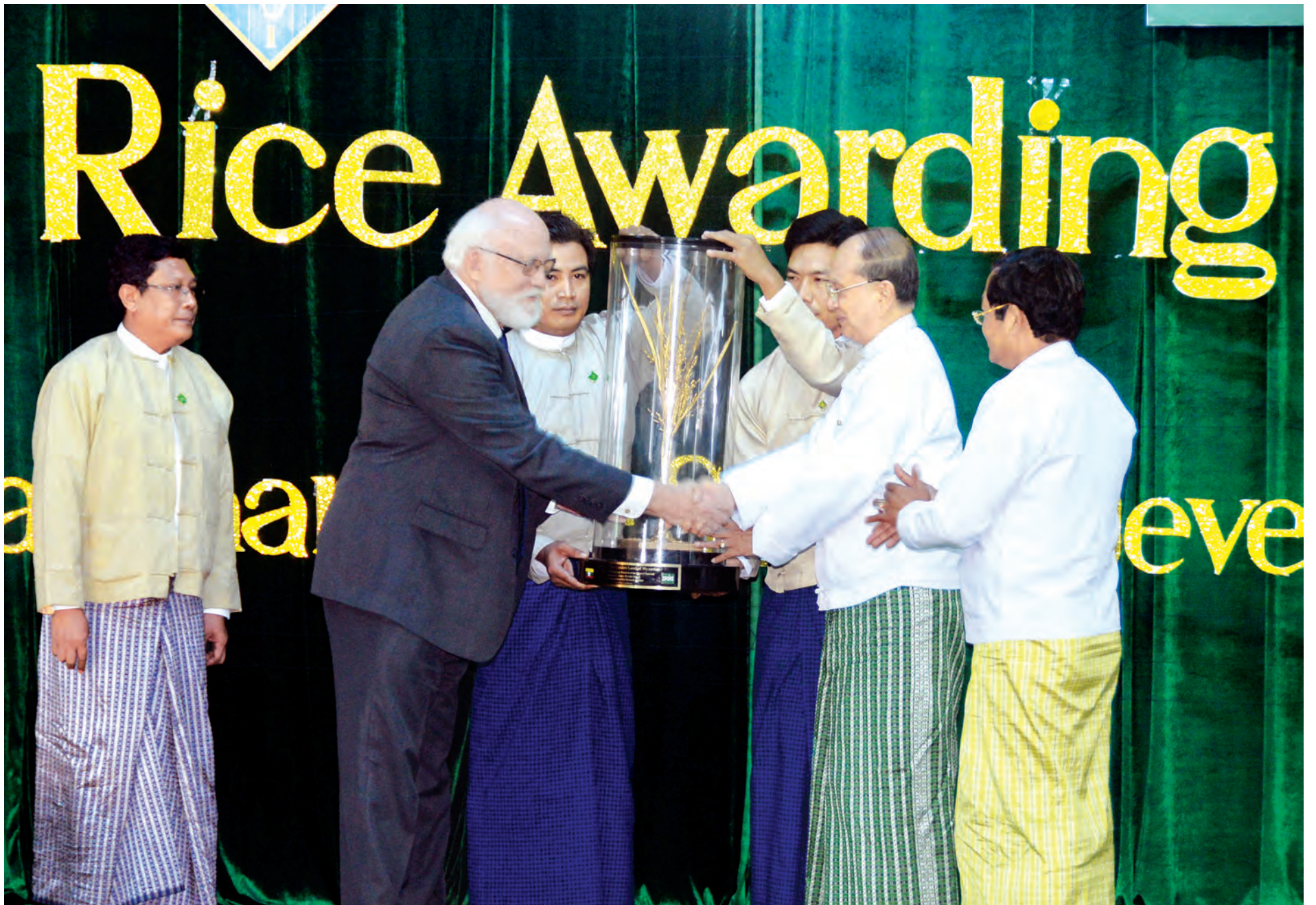
နိုင်ငံတော်သမ္မတ ဦးသိန်းစိန်အား အပြည်ပြည်ဆိုင်ရာဆန်စပါးသုတေသနဌာန ညွှန်ကြားရေးမှူးချုပ် ဒေါက်တာရောဘတ်စီဂလာက ရွှေစပါးနံဂုဏ်ပြုဆုပေးအပ်စဉ်။ (သတင်း၊ စာမျက်နှာ-၈) (သတင်းစဉ်)

ကျန်းမာရေးနှင့် အာဟာရအတွက် ဖြည့်ဆည်းပေးနိုင်သည့် စပါးမျိုးများ ထုတ်လုပ်ပေးနိုင်ခြင်းသည် လူသားအားလုံးအတွက် မွန်မြတ်လှသည့် ကြိုးပမ်းချက်ဖြစ်