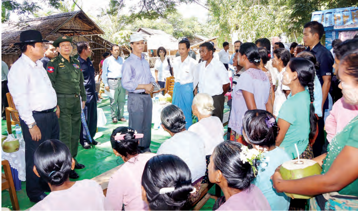
ဒုတိယသမ္မတ ဒေါက်တာစိုင်းမောက်ခမ်း စစ်တွေမြို့နယ် ရေချမ်းပြင်ကျေးရွာအုပ်စု အနီးရည်ပေါ်ကျေးရွာရှိ ဒေသခံတိုင်းရင်းသားများနှင့် တွေ့ဆုံ စဉ်။

ပြည်သူများ၏ တင်ပြချက်များနှင့် စပ်လျဉ်း၍ ပြည်နယ်အစိုးရအဖွဲ့နှင့် ညှိနှိုင်းဖြည့်ဆည်းပေးပြီး ကျောင်း ဆောင်အသစ် တိုးချဲ့ဆောင်လုပ်နေမှု ကို လှည့်လည်ကြည့်ရှုစစ်ဆေးသည်။ ထို့နောက် ဒုတိယသမ္မတသည် စစ်တွေမြို့ရှိ သက္ကတပြင်ကယ်ဆယ်ရေး စခန်း၊ သဲချောင်းကယ်ဆယ်ရေး စခန်းနှင့် မြို့ပြဖွံ့ဖြိုးတိုးတက်မှုများ ကို မော်တော်ယာဉ်များဖြင့် လှည့်လည် ကြည့်ရှုစစ်ဆေးသည်။