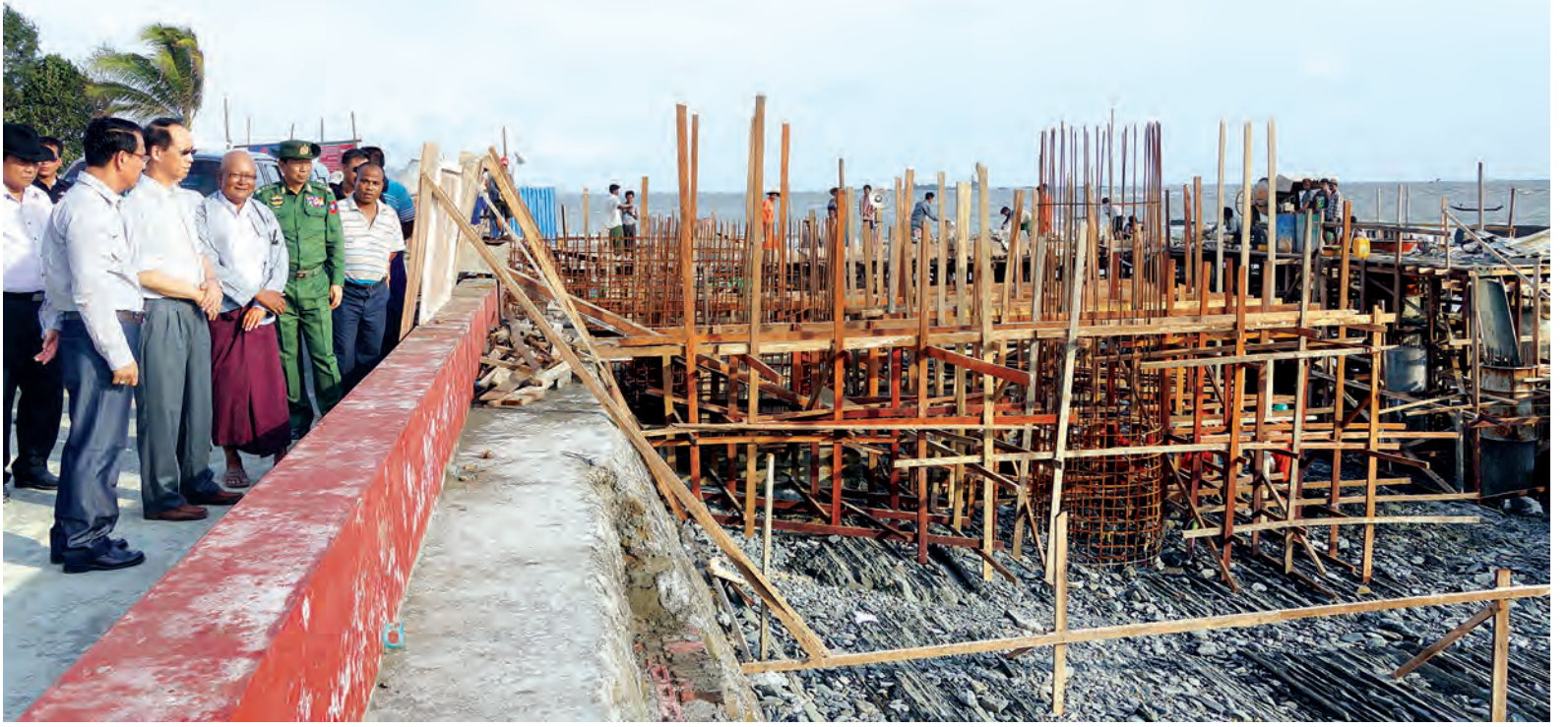
ဒုတိယသမ္မတ ဒေါက်တာစိုင်းမောက်ခမ်း ပွိုင့်အပန်းဖြေစခန်း အကောင်အထည်ဖော်ဆောင်ရွက်နေမှုကို ကြည့်ရှုစစ်ဆေးစဉ်။

ရှေးဦးစွာ ဒုတိယသမ္မတနှင့် အဖွဲ့ဝင်များသည် စစ်တွေမြို့နယ် ရေချမ်းပြင်ကျေးရွာအနီး၌ ရခိုင် ပြည်နယ်အစိုးရ ဒေသခံပြည်သူများ နှင့် ကုလသမဂ္ဂဖွံ့ဖြိုးမှုအစီအစဉ် တို့ ပူးပေါင်းတည်ဆောက်နေသည့် အကျယ် ၁၄ ပေ၊ တံတားအရှည်ပေ ၁၆၀ ရှိ သံကူကွန်ကရစ်အမျိုးအစား ရေချမ်းပြင်တံတား တည်ဆောက်ပြီးစီး မှုကိုကြည့်ရှုစစ်ဆေးရာ တာဝန်ရှိသူ များက လိုက်လံရှင်းလင်းပြသကြ သည်။