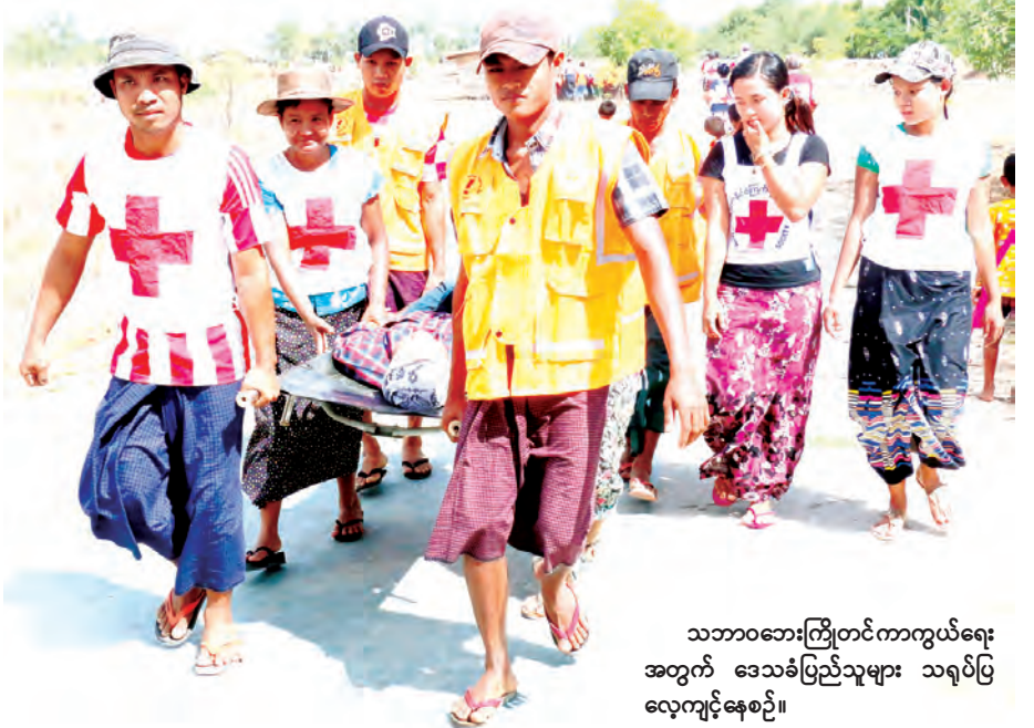
သဘာဝဘေးကြိုတင်ကာကွယ်ရေးအတွက် ဒေသခံပြည်သူများ သရုပ်ပြလေ့ကျင့်နေစဉ်။