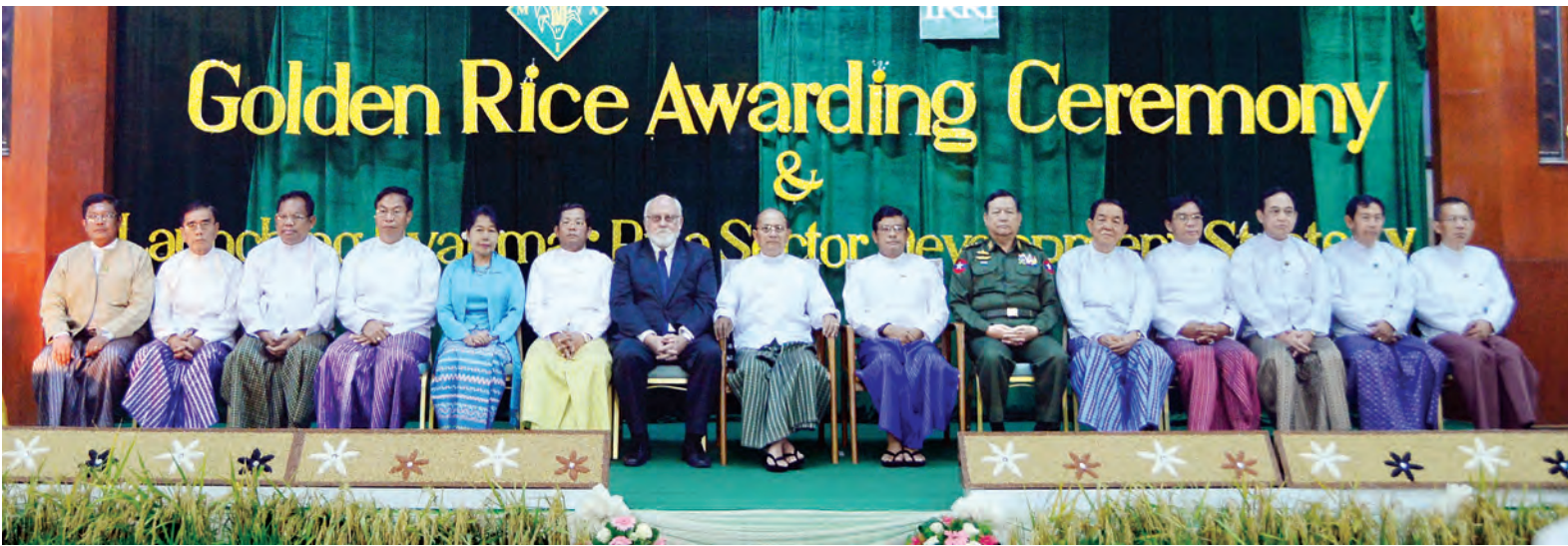
နိုင်ငံတော်သမ္မတ ဦးသိန်းစိန်၊ ဒုတိယသမ္မတ ဦးညွှန်ထွန်း၊ ပြည်ထောင်စု ဝန်ကြီးများနှင့် အပြည်ပြည်ဆိုင်ရာ ဆန်စပါး သုတေသနဌာနမှ ညွှန်ကြားရေးမှူးချုပ်တို့ စုပေါင်းမှတ်တမ်းတင်ဓာတ်ပုံရိုက်ကြစဉ်။ (သတင်းစဉ်)