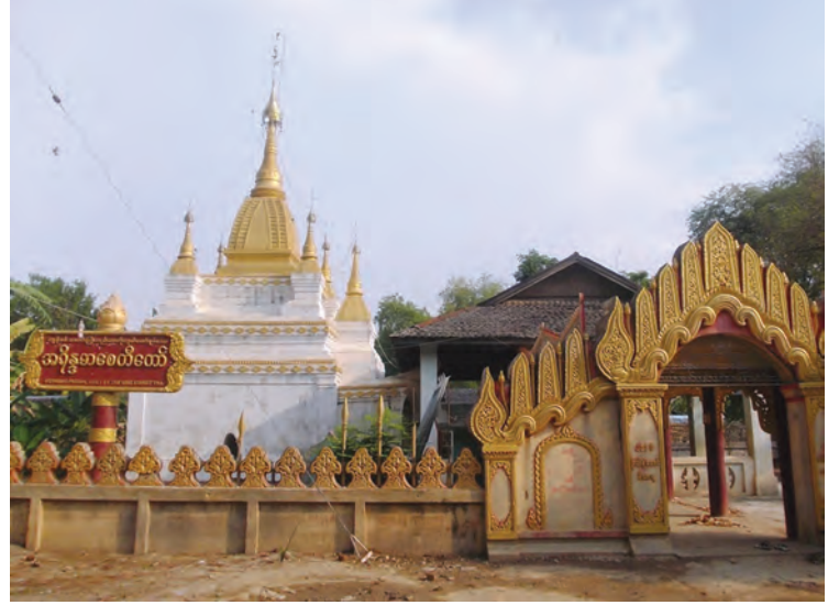
သျှင်နေမင်း

ဉာဏ်တော်အမြင့် ၁၂၃ ပေ၊ စေတီရံစုစုပေါင်း ၄၉ ဆူ ရှိကာ ရန်သူအပေါင်းကို အောင်မြင် တော်မူပြီး၍မြေအပြင်၌ရှိသော သတ္တဝါ အပေါင်းတို့အားရည်စူးကာ “အောင်မြေ” ဟု သစ္စာပြု၍ ချင်းတွင်းမြစ်ကမ်းနဖူးနေရာတွင် တည်ထား ကိုးကွယ်တော်မူခဲ့သော စေတီဖြစ် ကြောင်း သိရသည်။ ပရိမ္မတ္တလှိုင်ရှင် ဘုရားကြီးတွင် ဉာဏ် တော်အမြင့် ၃၁ ပေ ၆ လက်မရှိသည့် ဟင်းခါးဂူစေတီတော်၊ ရုပ်ပွားတော်လေးဆူ၊ ထီးလှိုင်ရှင် လာဘမုနိရုပ်ပွားတော်မြတ်၊ ချင်းတွင်းမြစ်ကမ်းနဖူးတွင် တစ်ကောင်တည်း သော ခြင်္သေ့ရုပ်ကြီးနှင့် လိုရာဆုကိုတောင်း နိုင်သော ကျန်စစ်သားမင်းကြီး၏ အောင် မြေတို့ကြောင့် ဘုရားဖူးများဖြင့် စည်ကားနေ ကြောင်း သိရသည်။