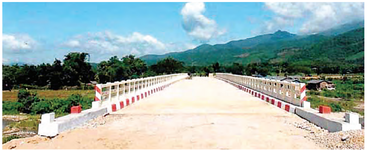
တာလေ မေ ၁၇

ဆောက်လုပ်ရေးဝန်ကြီးဌာနရှိ တံတားဦးစီးဌာနသည် နိုင်ငံတစ်ဝန်း လမ်းပန်း ဆက်သွယ်ရေး အဆင်ပြေချောမွေ့စေရန်အတွက် လမ်းတံတားကြီးများကို တိုးချဲ့တည်ဆောက်ပေးမှုများ ဆောင်ရွက်လျက်ရှိရာ ၂၀၁၀-၂၀၁၂ မှ ၂၀၁၄-၂၀၁၅ အထိ လေးနှစ်တာကာလအတွင်း အဓိကမြစ်ကူးတံတားကြီး ၈၇ စင်း အပါ