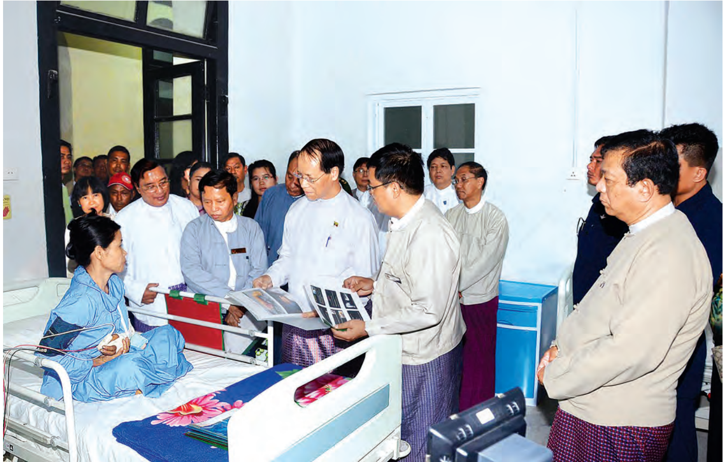
ဒုတိယသမ္မတ ဒေါက်တာစိုင်းမောက်ခမ်း ရန်ကုန်ပြည်သူ့ဆေးရုံကြီး၌ ဘယ်ဘက်လက်မောင်းပြတ်တောက်သွားသဖြင့် လက်ပိုင်းဆိုင်ရာ ခွဲစိတ်ကုပညာဌာနက အောင်မြင်စွာ ပြန်လည်ဆက်ပေးနိုင်ခဲ့သည့် လူနာကို ကြည့်ရှုအေးပေးစဉ်။ (သတင်းစဉ်)

ထို့နောက် ဒုတိယသမ္မတနှင့်အဖွဲ့ဝင်များသည် တိုင်းဒေသကြီးဝန်ကြီးချုပ်၊ ဒုတိယဝန်ကြီးများ၊ တိုင်းဒေသကြီး စာမျက်နှာ ၈ ကော်လံ ၁