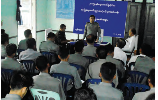
ရွေးကောက်ပွဲလုံခြုံရေးဆိုင်ရာ အသိပညာပေး ဆင့်ပွားသင်တန်းဖွင့်

ရေသယ်ယာဉ်များဖြင့် မေ ၁၄ ရက်က သွားရောက်လှူဒါန်းခဲ့ကြောင်း သိရသည်။ တောင်သာမြို့နယ်သည် ပူပြင်းခြောက်သွေ့သော မြန်မာနိုင်ငံအလယ်ပိုင်းဒေသတွင် တည်ရှိကာ ယခင်နှစ်က တစ်နှစ်လုံးမိုးရွာသွန်းမှု ၁၆ ဒေသ ၉၀ လက်မသာရွာသွန်းခဲ့ပြီး အပူချိန်မှာလည်း ယခင်နှစ်က ၄၂ ဒီဂရီရှိခဲ့ရာမှ ယခုနှစ်တွင် ၄၆ ဒီဂရီအထိ မြင့်တက်လာကာ ရေတွင်း၊ ရေကန်များတွင် ရေများခန်းခြောက်လျက်ရှိသည်။ ထို့ကြောင့် တောင်သာမြို့နယ်အတွင်းရှိ ကျေးလက်နေပြည်သူများအနေဖြင့် သောက်ရေအတွက် အခက်အခဲများဖြစ်ပေါ်လျက်ရှိရာ မြင်းခြံခရိုင်နှင့် မြို့နယ်အုပ်ချုပ်ရေးမှူးများနှင့် ဝန်ထမ်းများ၊ ခရိုင်နှင့် မြို့နယ်စည်ပင်သာယာရေးကော်မတီဝင်များ၊ ခရိုင်နှင့် မြို့နယ်မီးသတ်တပ်ဖွဲ့ဝင်များ၊ တိုင်းဒေသကြီး လွှတ်တော်ကိုယ်စားလှယ်များ၊ မြို့နယ်စီမံခန့်ခွဲမှုကော်မတီအဖွဲ့ဝင်များ၊ ကျေးလက်ဒေသဖွံ့ဖြိုးတိုးတက်ရေးဦးစီးဌာန မြို့နယ်ဦးစီးမှူးနှင့်ဝန်ထမ်းများက ကျေးရွာများအရောက်တွင်း ဆင်း၍ သောက်သုံးရေများ ဖြန့်ဝေပေးခဲ့ခြင်းဖြစ်ကြောင်း သိရသည်။