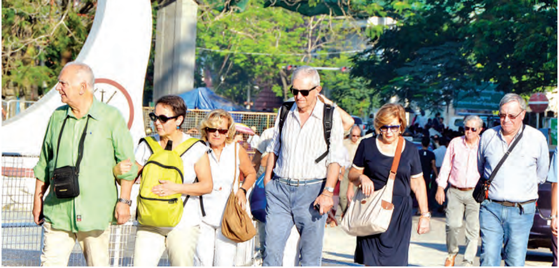
နိုင်ငံခြားသားခရီးသွားများ မြန်မာနိုင်ငံသို့ လာရောက်လည်ပတ်စဉ်။