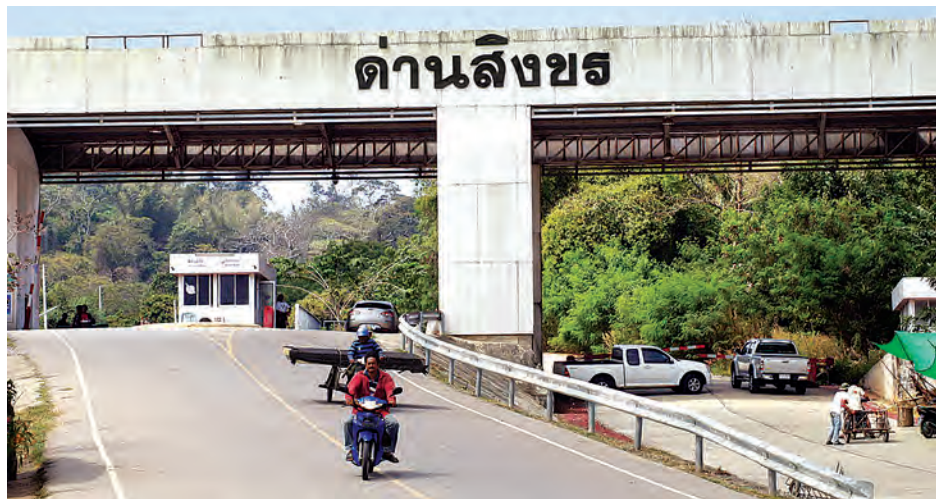
မောတောင်နယ်စပ်ကုန်သွယ်ရေးဂိတ်ကို ထိုင်းဘက်မှတွေ့ရစဉ်။