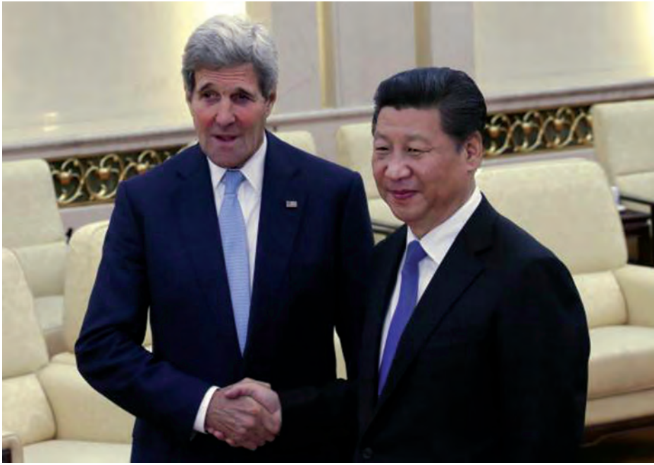
အနေဖြင့် ဆက်ဆံရေးပုံစံအသစ် အဖြစ် ဆက်လက်လုပ်ဆောင်သွားရန် သမ္မတရိုက်က ထပ်တလဲလဲ တောင်းဆိုခဲ့သည်။ သို့သော်လည်း အဆိုပါဆက်ဆံရေးသည်နိုင်ငံအချင်းချင်း၏ အချုပ်အခြာအာဏာ၊ နယ်မြေပိုင်ဆိုင်မှု၊ နိုင်ငံရေးသဘောထားနှင့်စီးပွားရေး ဆိုင်ရာကိစ္စရပ်များတွင်မူ အပြန်အလှန် အလေးထား ဆက်ဆံရမည် ဖြစ်သည်။

ပေကျင်း မေ ၁၇ တောင်တရုတ်ပင်လယ်အရေးအခင်းနှင့်ပတ်သက်၍ တရုတ်နှင့် အမေရိကန် တင်းမာမှုများရှိနေသော်လည်း ကန်-တရုတ်အပြန်အလှန် ဆက်ဆံရေးမှာ ခိုင်မာနေသည်ဟု တရုတ်နိုင်ငံအစိုးရက ပြောခဲ့သည်။ နှစ်နိုင်ငံ ဆက်ဆံရေးပုံစံအသစ် အဖြစ် အမေရိကန်သမ္မတအိုဘားမားနှင့်ရေရှည် ဆက်ဆံရေးတိုးမြှင့်သွားရန် မျှော်လင့်ကြောင်း ဂျွန်ကယ်ရီ၏တရုတ်နိုင်ငံသို့ နှစ်ရက်တာခရီးစဉ်တွင် ရိုက်ပြောကြားခဲ့သည်။ တောင်တရုတ်ပင်လယ်တွင် တရုတ်၏ရေပိုင်နက်ပြဿနာများနှင့် ပတ်သက်၍ လုံခြုံရေးဆိုင်ရာကိစ္စရပ်များကိုဆွေးနွေးရန် ဂျွန်ကယ်ရီက လာရောက်ခြင်းဖြစ်သည်။ တောင်တရုတ်ပင်လယ်တွင် ရေပိုင်နက်ဆိုင်ရာ အငြင်းပွားတင်းမာမှုများကို လျော့ချရန် အမေရိကန်က တရုတ်သို့ တိုက်တွန်းခဲ့သည်။ တစ်ကမ္ဘာလုံးဆိုင်ရာ ကိစ္စရပ်များတွင် အင်အားကြီးနိုင်ငံနှစ်နိုင်ငံ