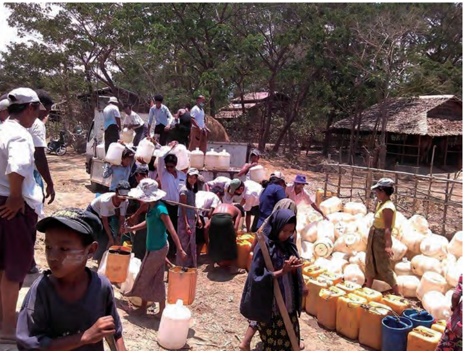
အပူချိန်မြင့်မားမှုကြောင့် သောက်သုံးရေကန်များခန်းခြောက်ကာ ရေအခက်အခဲနှင့် ကြုံတွေ့နေရသော ရန်ကုန်တိုင်းဒေသကြီး သုံးစွဲမြို့နယ်အတွင်းရှိ အောင်သာဒါန်းကျေးရွာသို့ သောက်သုံးရေ ၂၀ လီတာဝင်ဘူးကြီး ၉၅၀ ကို ဒဂုံမြို့သစ်တောင်ပိုင်းမြို့နယ်မှ ပရဟိတလူငယ်များနှင့် စုပေါင်းရေလှူအသင်းတို့က မေ ၁၃ ရက်တွင် သွားရောက်လှူဒါန်းစဉ်။ (အောင်သာဒါန်းကျေးရွာအပြင် ရေခဲလှူ၊ ကဝ၊ မြို့ကုန်းသာ၊ ဘိုလေး၊ သမိတ္တနှင့် ထွန်းစိန်ကျေးရွာများသို့ စုစုပေါင်း ရေဘူး ၂၇၀၀ ကို လှူဒါန်းခဲ့ကြောင်း သိရသည်။) ကိုကျော်(သုံးစွ)

သဘာဝပတ်ဝန်းကျင် ထိန်းသိမ်းရေးနှင့် သစ်တောရေးရာဝန်ကြီးဌာနမှ တာဝန်ရှိသူများနှင့်လည်း အင်းတော်ကြီးအင်း သာယာလှပရေး၊ ရေရှည်တည်တံ့နိုင်ရေး၊ သဘာဝပတ်ဝန်းကျင် စီမံအုပ်ချုပ်မှုနှင့် ဇီဝမျိုးစုံ၊ မျိုးကွဲများ ထိန်းသိမ်းခြင်းလုပ်ငန်းစီမံကိန်းများစသည့် အင်းနှင့်ပတ်ဝန်းကျင်ဒေသ၏ သဘာဝပတ်ဝန်းကျင်ထိန်းသိမ်းရေးဆိုင်ရာအချက်များကို ဆွေးနွေးခဲ့ကြောင်း သိရသည်။ နိုတိုး(မော်လူး)