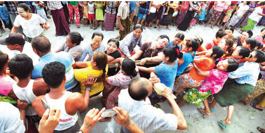
ပုသိမ်ကြီး မေ ၁၇ ရက်ညနေ ၅နာရီက မြို့မရပ်ကွက် မြို့မရပ်ကွက် (၁၂) လမ်းဆုံ၌ကျင်းပရာ အထူးစည်ကားခဲ့သည်။ မိုးခေါ်လွန်ဆွဲပွဲအထူးစည်ကားခဲ့သည်။ မိုးခေါ်လွန်ဆွဲပွဲအထူးစည်ကားခဲ့သည်။ မိုးခေါ်လွန်ဆွဲပွဲအထူးစည်ကားခဲ့သည်။