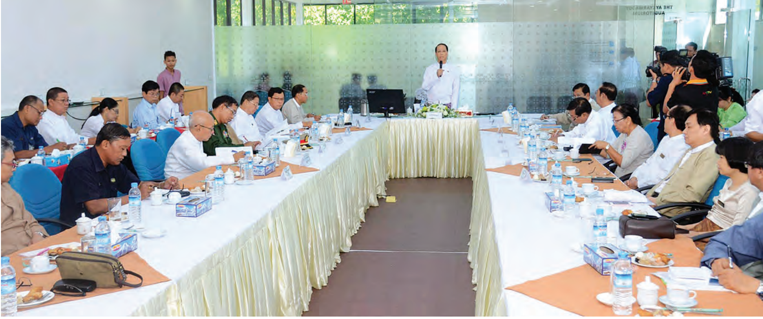
ဒုတိယသမ္မတ ဒေါက်တာစိုင်းမောက်ခမ်း ရန်ကုန်ပြည်သူ့ဆေးရုံကြီး တိုးချဲ့ပြုပြင်မွမ်းမံတည်ဆောက်မှု လုပ်ငန်းများနှင့်စပ်လျဉ်း၍ အမှာစကားပြောကြားစဉ်။

အစိုးရအဖွဲ့ဝန်ကြီးများ၊ ဆေးရုံအုပ်ကြီးနှင့် ဌာနဆိုင်ရာအကြီးအကဲများနှင့်အတူ ရန်ကုန်ပြည်သူ့ဆေးရုံကြီး နှလုံးခွဲစိတ်နှင့်ဆေးကုသဆောင်နှင့် နှလုံးဆေးကုသဆောင် တိုးချဲ့တည်ဆောက်မှု မြေနေရာအခြေအနေ၊ တိုးချဲ့ငါးထပ်ဆောင် တည်ဆောက်ပြီးစီးမှုနှင့် ခေတ်မီခွဲစိတ်ခန်း (Modular Operating Theatre) တွင် စက်ကိရိယာများ တပ်ဆင်ပြီးစီးမှု အထူးကြပ်မတ်ကုသဌာနများကို ကြည့်ရှုစစ်ဆေးကာ ဧပြီ ၂၇ ရက်က ဘယ်ဘယ်လက်မောင်း အလယ်ခန့်မှ ပြတ်တောက်စားဒဏ်ရာရရှိခဲ့သဖြင့် တိုက်ကြီးဆေးရုံမှ ရန်ကုန်ဆေးရုံကြီးသို့ လွှဲပြောင်းပေးပို့ခဲ့သည့် လူနာကို လက်ပိုင်းဆိုင်ရာ ခွဲစိတ်ကုပညာဌာနဌာနမှူး ဒေါက်တာခင်မောင်မြင့် ဦးဆောင်သည့် အဖွဲ့က ည ၇နာရီ ၄၅မိနစ်မှ စတင်ခွဲစိတ်ကာ စုစုပေါင်း ခွဲစိတ်ချိန် ၆ နာရီခန့်အတွင်း ပြတ်တောက်လက်မောင်းအား အောင်မြင်စွာ ပြန်လည်ဆက်ပေးနိုင်ခဲ့သည့် လူနာကို သွားရောက်ကြည့်ရှုအားပေးသည်။ ထို့နောက် ပင်မအဆောက်အအုံရှိ မြေပြင်ခွဲစိတ်ခန်း နေရာများတွင်