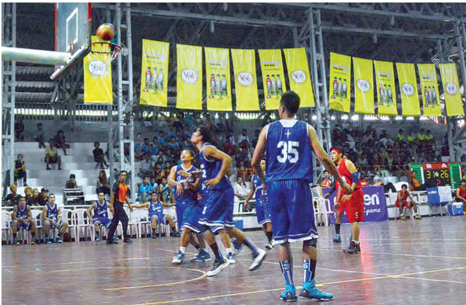
အမျိုးသမီးခြောက်သင်းနှင့် ၁၉ နှစ် ဝင်ရောက်ယှဉ်ပြိုင် ကစားကြမည့် အောက် အမျိုးသမီးခြောက်သင်းတို့ ဖြစ်သည်။ ပြိုင်ပွဲကို အောင်ဆန်း အားကစားပြိုင်ပွဲရုံမိုးလုံလေလုံအားကစားခန်းမ၌ မေ ၁၇ ရက်မှ ၂၅

အားကစားဝန်ကြီးဌာန မြန်မာနိုင်ငံဘတ်စကက်ဘောအဖွဲ့ချုပ်က ကြီးမားကျယ်ပြန့်သည့် တိုင်းဒေသကြီးနှင့် ပြည်နယ်ဘတ်စကက်ဘောပြိုင်ပွဲကြီး၌ ထိုင်းနိုင်ငံမှ နာမည်ကြီး ဘတ်စကက်ဘောအသင်းဖြစ်သည့် YANHEE INTERNATIONAL HOSPITAL(ထိုင်း)အသင်းကအဖွင့်ပွဲစဉ်တွင် Myanmar Media-7 အသင်းနှင့် ချစ်ကြည်ရေးအဖြစ် ရန်ကုန်မြို့အောင်ဆန်းကွင်းရှိ မိုးလုံလေလုံအားကစားပြိုင်ပွဲရုံ၌ ယနေ့ညနေ ၃နာရီက လာရောက်ယှဉ်ပြိုင်ကစားခဲ့သည်။