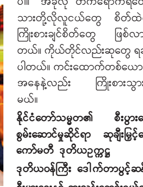
ဒုတိယဝန်ကြီး ဒေါက်တာပွင့်ဆန်း

မောင်နေသွင်ထွန်း ကင်းထောက်လူငယ် သားက ဒီနှစ်မှ တက်ရောက်ဖူးတာပါ။ ကင်းထောက်လူငယ် တစ်ယောက်အနေနဲ့ အာဆီယံပွဲတွေ တက်ရောက်ဖူးပါတယ်။ ပြီးတော့ လေ့လာရေးခရီးတွေ ကလည်း အတွေ့အကြုံတွေ အများကြီးရပါတယ်။ နိုင်ငံ့စွမ်းဆောင်ရည် ဆုချီးမြှင့်ပွဲကတော့ ပထမအကြိမ်ပါ။ အခုလို တက်ရောက်ရတော့ သားတို့လိုလူငယ်တွေ စိတ်ထဲမှာ ကြိုးစားချင်စိတ်တွေ ဖြစ်လာပါတယ်။ ကိုယ်တိုင်လည်းဆုတွေ ရချင်ပါတယ်။ ကင်းထောက်တစ်ယောက်အနေနဲ့လည်း ကြိုးစားသွားပါမယ်။