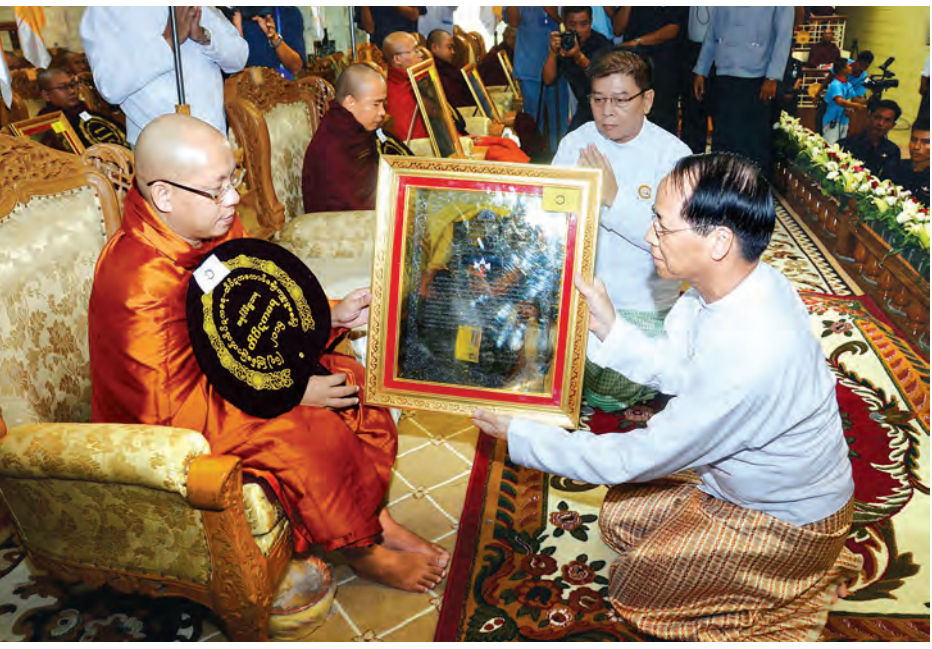
ဒုတိယသမ္မတ ဒေါက်တာ စိုင်းမောက်ခမ်း တိပိဋကဓရ ရွေးချယ်ရေး စာမေးပွဲအောင် သာသနာ့အာဇာနည် အရှင်မြတ်တို့အား ဘွဲ့တံဆိပ်တော်များနှင့် အောင်လက်မှတ်များ ဆက်ကပ်စဉ်။ (သတင်းစဉ်)

စိုင်းမောက်ခမ်းနှင့်ဇနီးတို့ အမှူးပြု သော ပရိသတ်များက တိပိဋကဓရ ရွေးချယ်ရေး စာမေးပွဲဥပဒေ၊ စာမေးပွဲဥပဒေ၊ လှိုင်သာယာမြို့နယ် သာသနာ့ဂုဏ်ရည် ကျောင်းတိုက် ပဓာန နာယကဆရာတော်အဂ္ဂမဟာ ပဏ္ဍိတဘဒ္ဒန္တပည့်သာရာဘိဝံသထံမှ ငါးပါးသီလ ခံယူဆောင်တည်ကြ သည်။ ထို့နောက် နိုင်ငံတော် သံယ မဟာနာယကအဖွဲ့၏ သာရဏီယ ဩဝါဒကထာကို နိုင်ငံတော်သံယ မဟာနာယကအဖွဲ့ဥက္ကဋ္ဌ မန္တလေးမြို့၊ ဗန်းမော်ကျောင်းတိုက်ဆရာတော် အဘိဓမ္မာဂုဏ်မဟာ ရတုရ အဘိဓမ္မာ အဂ္ဂမဟာသဒ္ဓမ္မဇောတိက ဒေါက်တာ ဘဒ္ဒန္တ ကုမာရာဘိဝံသက ဖတ်ကြား ချီးမြှင့်တော်မူသည်။ ယင်းနောက် သာသနာရေး ဝန်ကြီးဌာန ပြည်ထောင်စုဝန်ကြီး ဦးစိုးဝင်းက သာသနာရေးဆိုင်ရာ