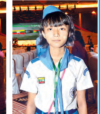
မငြိမ်းစန္ဒီမေ

ကျွန်တော်တို့ ရွေးချယ်ပြီး ဆုချီးမြှင့် နိုင်ခဲ့ပါတယ်။ ဆုတစ်ဆုတိုင်းမှာ သူ့သတ်မှတ်ချက်တွေနဲ့သူ ရှိပါတယ်။ လုပ်ငန်းအောင်မြင်ရုံသာမက ချမှတ်ထားတဲ့ စည်းမျဉ်း၊ စည်းကမ်း တွေကို လိုက်နာမှု ရှိမရှိ၊ ရရှိလာတဲ့ အကျိုးအမြတ်တွေကို နိုင်ငံအတွက် အခွန်တွေကို ထမ်းဆောင်မှု ရှိ မရှိ၊ လူမှုစီးပွားကဏ္ဍတွေမှာ ပြန်ပြီး အကျိုးပြုမှု ရှိ မရှိ၊ သူ့ရဲ့လုပ်ငန်း အလိုက် ရေရှည်တိုးတက်အောင် တီထွင်နိုင်ခြင်း ရှိ၊ မရှိ၊ ရင်းနှီးမြှုပ်နှံ မှုတွေ တိုးတက်အောင် ဆောင်ရွက် နိုင်ခြင်း ရှိ၊ မရှိ စတာတွေအထိပါ ကြည့်ပြီး အမှတ်ပေးစည်းမျဉ်းတွေ အသေးစိတ်ချမှတ် ရေးဆွဲခဲ့တာ ဖြစ်ပါတယ်။ ဒီနှစ်မှာ ဆုအသစ် အနေနဲ့ အသေးစားနဲ့ အလတ်စား ဝန်ဆောင်မှုဆိုင်ရာဆုကို ထည့်သွင်း ရွေးချယ်နိုင်ခဲ့ပါတယ်။ ဗိုလ်မှူးချုပ် ကျော်စံမြင့် ဒုတိယဝန်ကြီး၊ ပြည်ထဲရေးဝန်ကြီးဌာန ဒီနှစ်မှာထူးခြားတဲ့အနေနဲ့ စွမ်း ဆောင်မှုအကောင်းဆုံး အထောက်