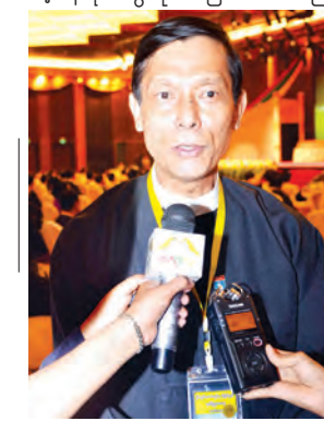
ဒုတိယဝန်ကြီး ဒေါက်တာလင်းအောင်

တယ်။ ဒါကြောင့် ဖွံ့ဖြိုးတိုးတက်မှု အကောင်းဆုံး မြို့နယ်ဆုရတော့ ဝမ်းသာတယ်။ ဒေါ်ဝင်း တောဘိုကုန်းကျေးရွာ၊ မင်းဘူး(စကုမြို့နယ်) (စိုက်ပျိုးထုတ်လုပ်မှု ထူးချွန် တောင်သူလယ်သမားဆု)