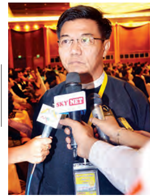
ဒုတိယဝန်ကြီး ဗိုလ်မှူးချုပ် ကျော်စံမြင့်

မိုင်အားဖြင့် ၄၀ ကျော်ရှိပါတယ်။ မြို့သန့်ရှင်းရေးနဲ့ ပတ်သက်ပြီးတော့လည်း တစ်မြို့လုံးအတိုင်းအတာနဲ့ ဆောင်ရွက်နိုင်ခဲ့ပါတယ်။ လမ်းမီးတွေ၊ မြို့သာယာလှပရေးတွေ၊ အများပြည်သူ ကိုယ်ကာယလေ့ကျင့်ခန်းပြုလုပ်နိုင်တဲ့ အားကစားကွင်းတွေကို ဖော်ထုတ်နိုင်ခဲ့ပါတယ်။ ရှေ့ဆက်ပြီးတော့လည်း မြို့နယ်ပိုပြီးတော့ ဖွံ့ဖြိုးတိုးတက်အောင်