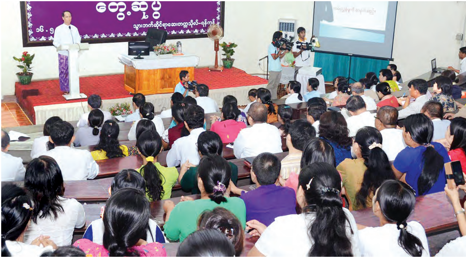
ဒုတိယသမ္မတဒေါက်တာစိုင်းမောက်ခမ်း သွားဘက်ဆိုင်ရာဆေးတက္ကသိုလ်(ရန်ကုန်) ပါမောက္ခချုပ်၊ ဆရာ/ ဆရာမများ၊ ဝန်ထမ်းများနှင့် တွေ့ဆုံအမှာစကားပြောကြားစဉ်။ (သတင်းစဉ်)