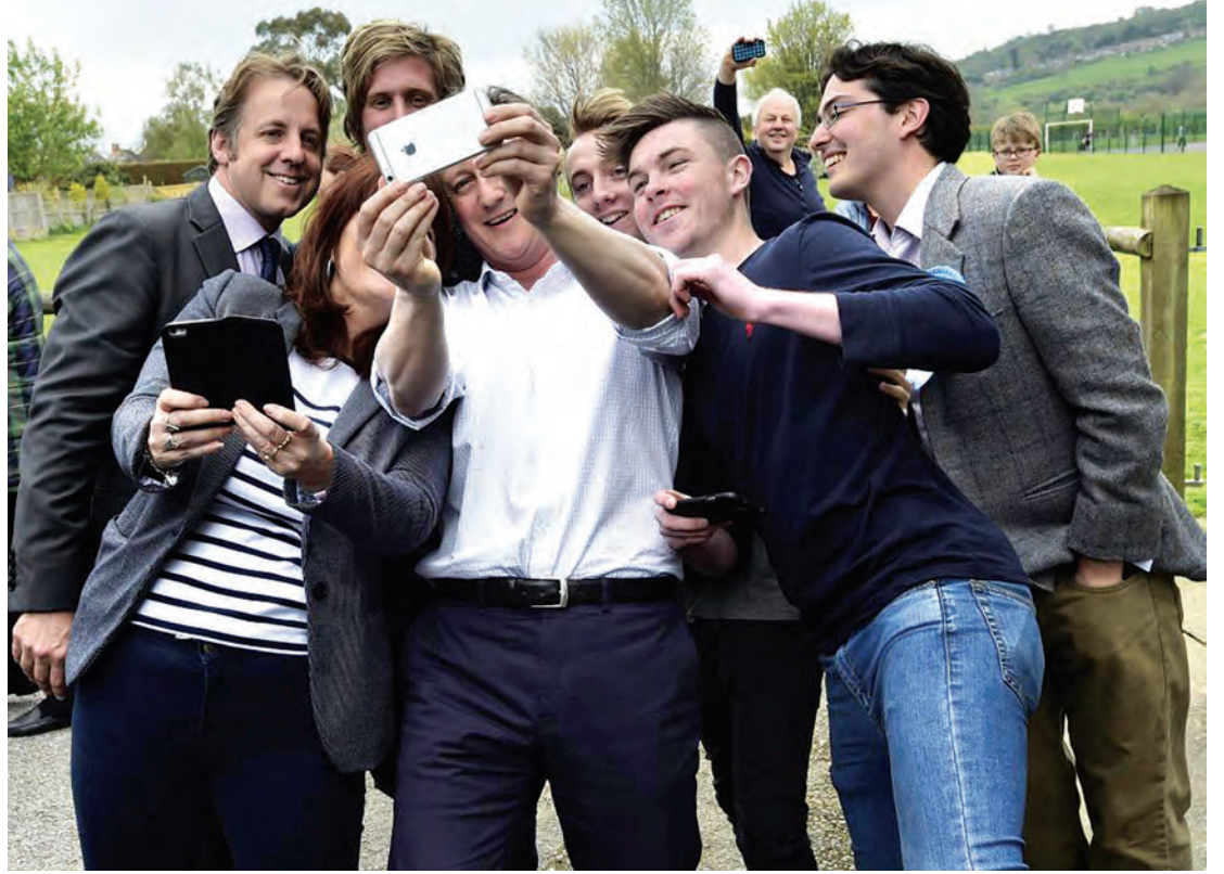
ဝန်ကြီးချုပ်ဒေးဗစ်ကင်မရွန်းအား ရွေးကောက်ပွဲအကြိုကာလတွင် ၎င်းအားထောက်ခံသူများနှင့်အတူ အင်္ဂလန်အနောက်တောင်ပိုင်း တစ်နေရာ၌ တွေ့ရစဉ်။

အမေရိကန်စက်မှုလုပ်ငန်းရှင် တစ်ဦးဖြစ်သူ ဟင်နရီဖို့ (HENRY FORD) (1863-1947) ပြောဖူးသည့် စကားတစ်ခွန်းရှိသည်။ An idealist is a person who helps other people to be prosperous ဟု၍ဖြစ်သည်။ မြန်မာလိုအနီးစပ်ဆုံးပြောရလျှင် “စံပြပုဂ္ဂိုလ်ဆိုသည်မှာ အခြားလူများအား ကြီးပွားချမ်းသာအောင် အကူအညီပေးသူဖြစ်သည်” ဟူ၍ဖြစ်နိုင်သည်။ ဖြူစင်ကြည်လင်သော စိတ်နှလုံးရှိသူစံပြပုဂ္ဂိုလ်များ ကမ္ဘာပေါ်တွင် အတော်များများရှိသည်။ နိုင်ငံရေး၊ စာပေ၊ အနုပညာနယ်ပယ်တစ်ခုခုတွင် ရှိနေနိုင်သည်။ ဤသို့သော စံပြပုဂ္ဂိုလ်တစ်ဦး United Kingdom တွင် ရှိသည်။ သူက နိုင်ငံရေးသမားဖြစ်သည်။ သူက ဒေးဗစ်ကင်မရွန်း (David Cameron) ဖြစ်သည်။ သူ့ကို အဘယ်ကြောင့် “စံပြပုဂ္ဂိုလ်” (idealist) ဟုခေါ်ရသနည်းဟူမူ သူကတိုင်းသူပြည်သားတို့၏ လိုအပ်ချက်ကို ဖြည့်ဆည်းရန်၊ ချမ်းသာကြွယ်ဝစေရန် အကူအညီပေးလိုစိတ်ရှိသောကြောင့်ဖြစ်သည်။ ယူနိုက်တက်ကင်းဒမ်းခေါ် ဗြိတိန်သည် လောလောဆယ်အချိန်၌ ဥရောပ သမဂ္ဂ(EU) အဖွဲ့ဝင်အဖြစ် ဆက်လက်ရှိနေရေး၊ စကော့တလန်က ယူကေမှ ခွဲထွက်ကာ တောင်းဆိုနေသည့် လွတ်လပ်ရေးစသည့် အရေးများဖြင့်လည်း ရှုပ်ထွေးနေသည့်ကာလ ဖြစ်သည်။ စကော့တလန်က ဗြိတိန်မှခွဲထွက်မည်ဟု ဆိုကာ ၂၀၁၄ စက်တင်ဘာလတွင် စကော့တလန်၌ ပြည်လုံးကျွတ်ဆန္ဒခံ ယူပွဲကျင်းပခဲ့သည်။ သို့ရာတွင် စကော့တလန်ပြည်သူများကိုယ်တိုင်က ခွဲထွက်ရေးကို ဆန့်ကျင်၍ မဲပေးခဲ့သည်။ ဤကဲ့သို့သောအခြေအနေမျိုးတွင် ယခုနှစ် မေ ၇ ရက်နေ့၌ ဗြိတိန်နိုင်ငံ၏ အထွေထွေရွေးကောက်ပွဲကို ပြုလုပ်ခဲ့သည်။