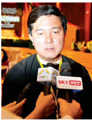
ဒုတိယဝန်ကြီး ဒေါက်တာပွင့်ဆန်း

ထားပါတယ်။ ဦးကျော်စောထွေး လောက်ကိုင်မြို့နယ် ကြက်ခြေနီတပ်ဖွဲ့ဦးစီးမှူး (ဒုတိယတန်း) (အများပြည်သူ ဘေးအန္တရာယ် ကျရောက်မှုအား သက်စွန့်ကြိုးပမ်း ကယ်တင်စွမ်းဆောင်သူ (ပုဂ္ဂိုလ်ရေးဆိုင်ရာဆု)