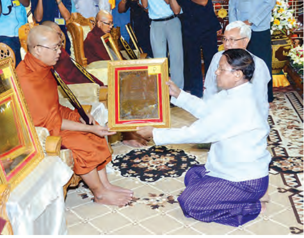
သာသနာရေးဝန်ကြီးဌာန ပြည်ထောင်စုဝန်ကြီး ဦးစိုးဝင်း ဆရာတော်ထံ ဘွဲ့တံဆိပ်တော်နှင့် အောင်လက်မှတ် ဆက်ကပ်စဉ်။ (သတင်းစဉ်)

များနှင့် ဌာနဆိုင်ရာ တာဝန်ရှိသူများ က အဘိဓမ္မာ ပထမပိုင်း အာဂုံအောင် မူလအဘိဓမ္မိကအောင် သာသနာ့ အာဇာနည်နှစ်ပါး၊ ဒီဃနိကာယ ကောဝိဒအောင်သာသနာ့အာဇာနည် တစ်ပါး၊ ဒီဃဘာဏကအောင် သာသနာ့အာဇာနည်ငါးပါး၊ ဝိနယ ကောဝိဒအောင်သာသနာ့အာဇာနည် ငါးပါး၊ ဝိနယဓရအောင်သာသနာ့ အာဇာနည် ၁၆ပါး၊ ဝိနည်းပထမပိုင်း ရေးဖြေအောင် ဥဘတောဝိဘင်္ဂ ကောဝိဒအောင် သာသနာ့အာဇာနည် ငါးပါး၊ ဝိနည်းပထမပိုင်း အာဂုံအောင်