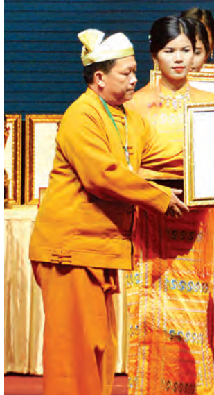
ဒုတိယသမ္မတဦးညွှန်ထွန်း စိုက်ပျိုးထုတ်လုပ်မှုထူးချွန် တောင်သူလယ် သမားဆု ရရှိသူတစ်ဦးအား ဆုပေးအပ်ချီးမြှင့်စဉ်။ (သတင်းစဉ်)

အပြည်ပြည်ဆိုင်ရာ ငွေကြေး အဖွဲ့အစည်းများနှင့်လည်း နီးနီးကပ် ကပ် ပူးပေါင်းဆောင်ရွက်လျက်ရှိနေ ကြောင်း၊ နိုင်ငံခြားရင်းနှီးမြှုပ်နှံမှု များ တိုးမြှင့်ဝင်ရောက်လာမှုကြောင့် ၂၀၁၄ ခုနှစ်မှစ၍ ရက်သတ္တတစ်ပတ် လျှင် အထည်ချုပ်စက်ရုံတစ်ရုံနှင့် အထက် တိုးတက်ဖွင့်လှစ်လျက်ရှိ ကြောင်း၊ ဝန်ဆောင်မှုကဏ္ဍ၏ ဖွံ့ဖြိုး တိုးတက်မှုသည် ခရီးသွားကဏ္ဍ အလျင်အမြန် ဖွံ့ဖြိုးတိုးတက်မှုအလား အလာကောင်းများကြောင့် အထောက် အကူဖြစ်စေမည်ဖြစ်ကြောင်း၊ မြန်မာ နိုင်ငံဖွံ့ဖြိုးတိုးတက်မှုအတွက် ကြွယ်ဝ သည့် သဘာဝသယံဇာတအရင်း အမြစ်နှင့်မဟာဗျူဟာကျမှုကို ထိထိ ရောက်ရောက်အသုံးပြုပြီး ခရီးသွား လုပ်ငန်းနှင့် ဝန်ဆောင်မှုကဏ္ဍကို တိုးမြှင့်ဆောင်ရွက်ရန် လိုကြောင်း သုံးသပ်ဖော်ပြထားသည်ကို တွေ့ရ မည်ဖြစ်ပါကြောင်း။