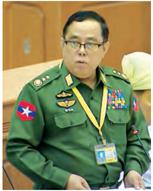
ပြည်ထောင်စုဝန်ကြီး ဒုတိယ ဗိုလ်ချုပ်ကြီးဝေလွင် ရှင်းလင်းတင် ပြစဉ်။ (သတင်းစဉ်)

အလားတူ ကျောက်ပန်းတောင်း မဲဆန္ဒနယ်မှ ဒေါက်တာဇော်မြင့်