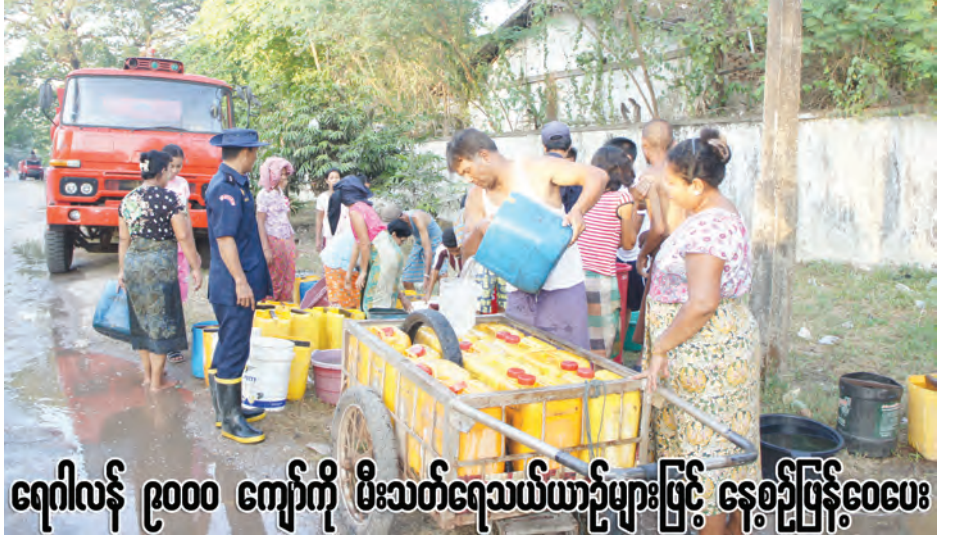
ရေဂါလန် ၉၀၀၀ ကျော်ကို မီးသတ်ရေသယ်ယာဉ်များဖြင့် နေ့စဉ်ဖြန့်ဝေပေး