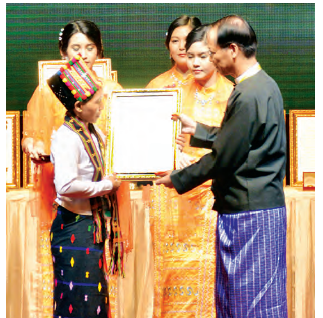
ဒုတိယသမ္မတ ဒေါက်တာစိုင်းမောက်ခမ်း အများပြည်သူဘေးအန္တရာယ် ကျရောက်မှုအား သက်စွန့်ကြိုးပမ်းကယ်တင်စွမ်းဆောင်သူ(ပုဂ္ဂိုလ်ရေးဆိုင်ရာ) ဆုရရှိသူတစ်ဦးအား ဆုပေးအပ်ချီးမြှင့်စဉ်။

မိမိတို့နိုင်ငံနှင့် မရေးမနောင် ကာလများတွင် ဒီမိုကရေစီနိုင်ငံသစ် အဖြစ် ပြောင်းလဲခဲ့ကြသည့် နိုင်ငံ များထဲတွင် အောင်မြင်သော နိုင်ငံ