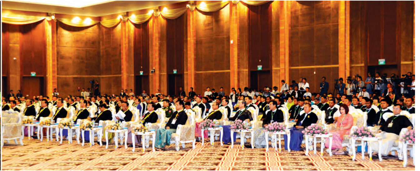
နိုင်ငံတော်သမ္မတ ဦးသိန်းစိန် ၂၀၁၅ ခုနှစ် နိုင်ငံတော်သမ္မတ၏ နိုင်ငံ့စွမ်းဆောင်ရည်ဆု ချီးမြှင့်ပွဲတွင် အမှာစကားပြောကြားစဉ်။

✽ ရှေ့ဖိုးမှ ဒုတိယသမ္မတ ဒေါက်တာစိုင်းမောက် ခမ်းနှင့် ဦးညွှန်ထွန်း၊ ပြည်ထောင်စု လွှတ်တော်နာယက ပြည်သူ့လွှတ် တော်ဥက္ကဋ္ဌ သူရဦးရွှေမန်း၊ အမျိုးသား လွှတ်တော်ဥက္ကဋ္ဌ ဦးခင်အောင်မြင့်၊ ပြည်ထောင်စု တရားသူကြီးချုပ် ဦးထွန်းထွန်းဦး၊ တပ်မတော်ကာကွယ် ရေးဦးစီးချုပ် ဗိုလ်ချုပ်မှူးကြီး မင်းအောင်လှိုင်၊ နိုင်ငံတော်ဖွဲ့စည်းပုံ