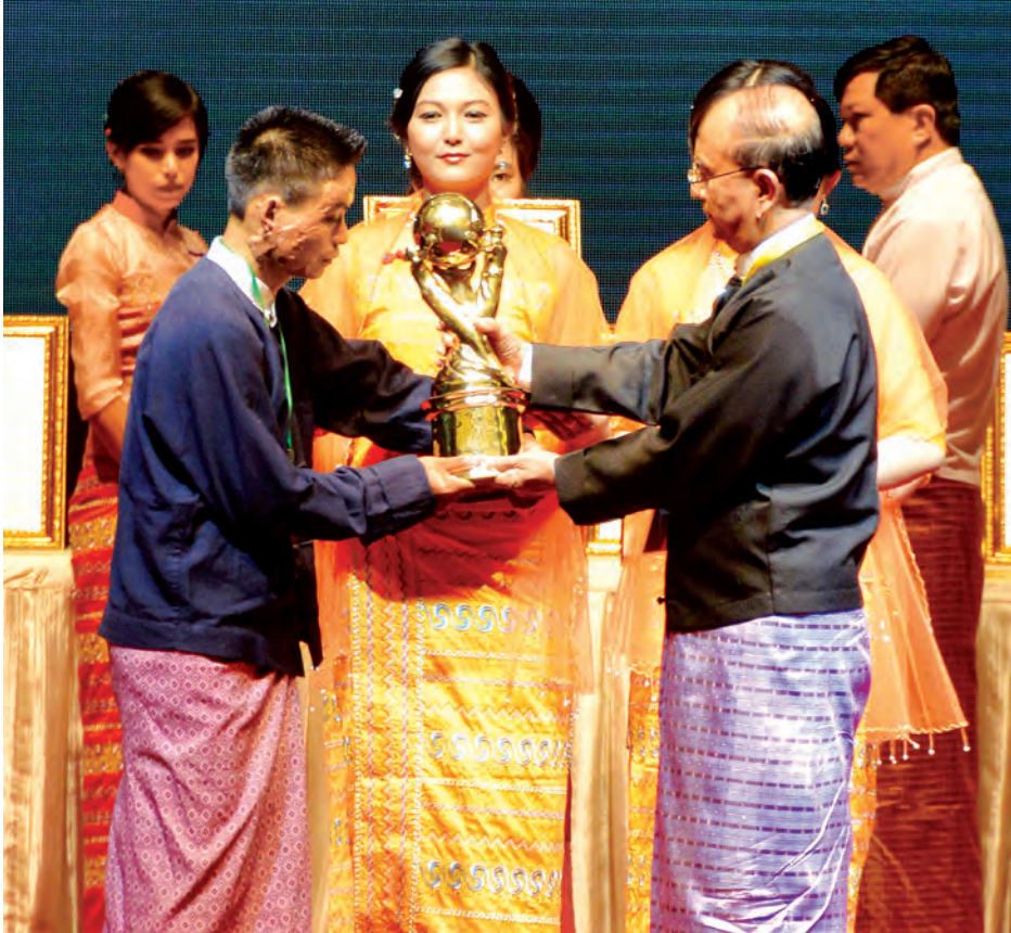
နိုင်ငံတော်သမ္မတ ဦးသိန်းစိန် အများပြည်သူ ဘေးအန္တရာယ်ကျရောက်မှုအား သက်စွန့်ကြိုးပမ်း ကယ်တင် စွမ်းဆောင်သူ (ပုဂ္ဂိုလ်ရေးဆိုင်ရာ) ဆုရရှိသူတစ်ဦးအား ဆုပေးအပ်ချီးမြှင့်စဉ်။

ရခိုင်အပေါ် မိမိတို့ တိုင်းရင်းသား ပြည်သူတစ်ရပ်လုံး၏ ညီညွတ်စွာ ကြိုးပမ်းဆောင်ရွက်မှုအဖြစ် ဂုဏ်ယူ ရမည်ဖြစ်ပါကြောင်း။ နိုင်ငံရေးစနစ် အလှည့်အပြောင်း တစ်ရပ်ကို ညင်သာချောမွေ့စွာ ထိန်းကျောင်း ပြောင်းလဲနိုင်ခဲ့သော် လည်း တိုင်းရင်းသားစည်းလုံးညီညွတ် ရေးနှင့် ပြည်တွင်းငြိမ်းချမ်းရေး လုပ်ငန်းစဉ်များကို စေ့စပ်ဆွေးနွေး ညှိနှိုင်းမှုများနှင့် အောင်မြင်အောင် ဆက်လက် ကြိုးပမ်းတည်ဆောက် ရမည်ဖြစ်ပါကြောင်း၊ အမြင်သဘော ထားများ မတူကွဲပြားသည့်ကြားက တူညီသည့် သဘောထားအမြင်များ ကို ဦးစားပေး အပြုသဘောဆောင်၍ တစ်နိုင်လုံး အပစ်အခတ်ရပ်စဲရေး အဆင့်နှင့် ငြိမ်းချမ်းရေးဆွေးနွေးပွဲ အဆင့်တို့ကို တစ်ဆင့်ပြီးတစ်ဆင့် ဆက်လက်တက်လှမ်း ဆောင်ရွက် ကြရမည်မှာ မိမိတို့ တိုင်းရင်းသား