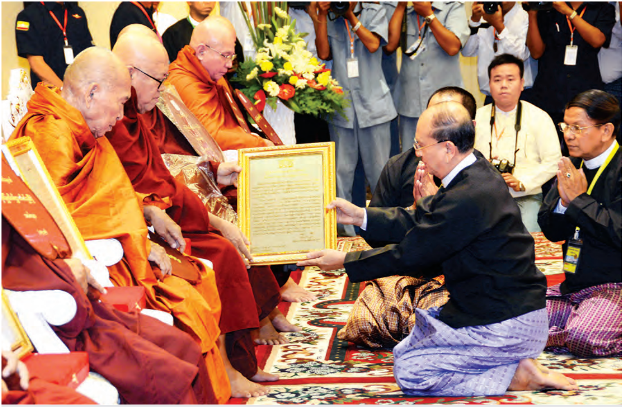
မြန်မာနိုင်ငံလုံးဆိုင်ရာ လယ်တီကမ္ဘာ့စာရင်းအဖွဲ့ဥက္ကဋ္ဌ မြန်မာနိုင်ငံလုံးဆိုင်ရာ လယ်တီဒီပီထွန်းကားပြန်ပွားရေးအဖွဲ့ ဒုတိယဥက္ကဋ္ဌ ရန်ကုန်တိုင်းဒေသကြီး မရမ်းကုန်းမြို့နယ် နာဂလိုဏ်ဂူ ကလေးဝတောရကျောင်းတိုက်ဆရာတော် အဂ္ဂမဟာပဏ္ဍိတ ဘဒ္ဒန္တ ဇာဂရာဘိဝံသ(ဒွိဝိဋကကောဝိဒ)ထံ နိုင်ငံတော်သမ္မတ ဦးသိန်းစိန် ဂုဏ်ပြုပေးတံဆိပ်လွှာကို ဆက်ကပ်လှူဒါန်းစဉ်။ (သတင်းစဉ်)

ယနေ့အခမ်းအနားတွင် မိမိတို့ အစိုးရအနေဖြင့် လွှတ်တော်၊ တပ်မ တော်၊ ပြည်သူတို့နှင့်အတူ လက်တွဲ ကာ နိုင်ငံအတွက် ထူးခြားသည့် စွမ်းဆောင်မှုနှစ်ရပ်ကို ကြိုးပမ်း ဆောင်ရွက်နိုင်ခဲ့သည်ကို ပြောကြား လိုပါကြောင်း၊ စွမ်းဆောင်မှုနှစ်ရပ်မှာ လွတ်လပ်ရေးရပြီး နှစ်(၄၀)ကျော် အတွင်း မကျင်းပနိုင်ခဲ့သည့် အရှေ့ တောင်အာရှ အားကစားပြိုင်ပွဲကို အိမ်ရှင်နိုင်ငံအဖြစ် အောင်မြင်စွာ