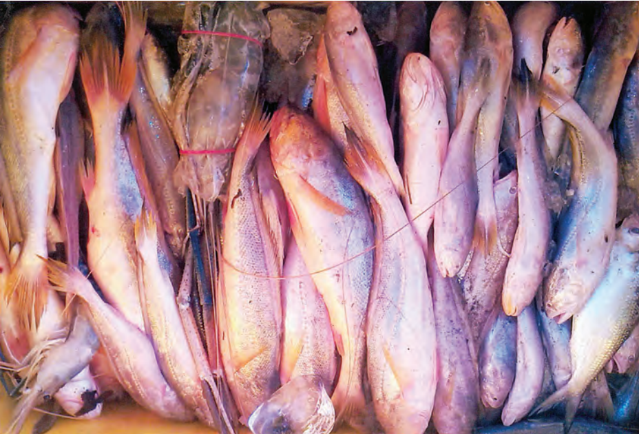
မြန်မာ့ပင်လယ်ပြင်တွင် ရှားပါးနေပြီဖြစ်သည့် ငါးပုတ်သင်ငါး။

မြန်မာနိုင်ငံ၏ ငါးဖမ်းရေပိုင်နက်သည် စတုရန်းကီလိုမီတာ ၄၈၆၀၀၀ ရှိပြီး အဆိုပါရေပိုင်နက်အတွင်း တရွတ်ဆွဲငါးဖမ်းရေယာဉ် ၁၁၈၅ စင်း၊ ဝိုင်းချုပ်ပိုင်သင်္ဘော ၂၆၈ စင်း၊ ကျားပိုင် ၁၁၈ စင်း၊ မျှောပိုင် ၁၇၀ စင်း၊ မြူးချ ၁၀၉ စင်း၊ ကင်းမွန် ၂၉၆ စင်း၊ ဘုံကျောင်းကျားပိုင် ၇၆ စင်း၊ အင်္ဂလန်ကျား ၂၂၄ စင်း၊ စိန်ပိုင် ၆၉ စင်းနှင့် ငါးမျှားတန်းရှစ်စင်း စုစုပေါင်း ၂၅၉၄ စင်းဖမ်းဆီးလျက်ရှိကြောင်း ငါးလုပ်ငန်းအဖွဲ့ချုပ်၏ မှတ်တမ်းအရ သိရသည်။