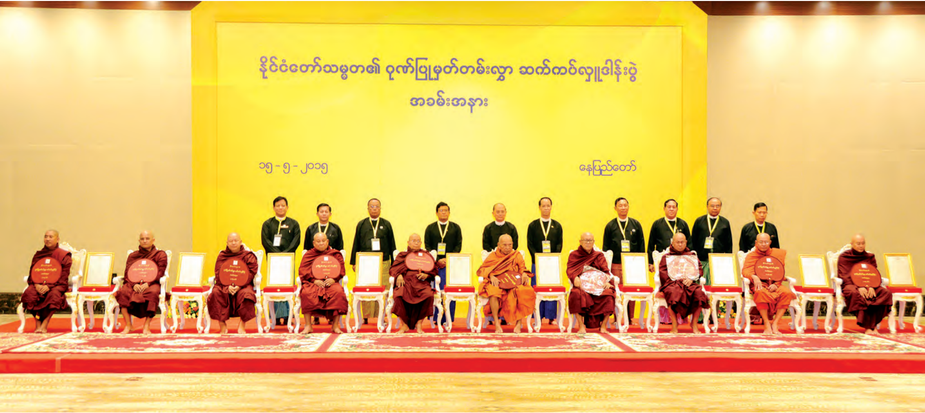
ဆရာတော်ကြီးများနှင့်အတူ နိုင်ငံတော်သမ္မတ ဦးသိန်းစိန်နှင့် အဖွဲ့ဝင်များ မှတ်တမ်းတင်ဓာတ်ပုံရိုက်စဉ်။ (သတင်းစဉ်)

နေပြည်တော် မေ ၁၅ ၂၀၁၅ ခုနှစ် နိုင်ငံတော်သမ္မတ၏ ဂုဏ်ပြုမှတ်တမ်းလွှာ ဆက်ကပ်လှူဒါန်းပွဲအခမ်းအနားနှင့် နိုင်ငံတော်သမ္မတ၏ နိုင်ငံ့စွမ်းဆောင်ရည်ဆုချီးမြှင့်ပွဲအခမ်းအနားကို ယနေ့ ညနေပိုင်းတွင် မြန်မာအပြည်ပြည်ဆိုင်ရာ ကွန်ဗင်းရှင်းဗဟိုဌာန-၁ ၌ ကျင်းပသည်။