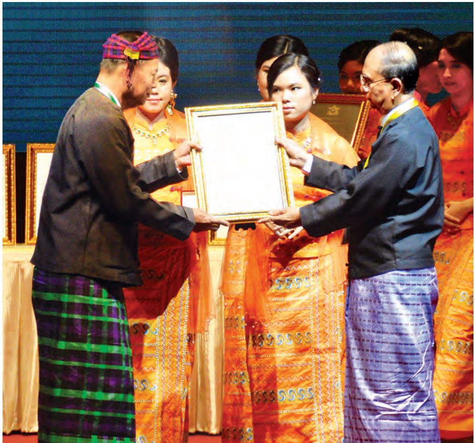
နိုင်ငံတော်သမ္မတ ဦးသိန်းစိန် ထုတ်လုပ်ရောင်းချမှုထူးချွန် အသေးစားစီးပွားရေးလုပ်ငန်းရှင်ဆု ရရှိသူတစ်ဦး အား ဆုပေးအပ်ချီးမြှင့်စဉ်။ (သတင်းစဉ်)

၂၀၁၃ ခုနှစ်တွင် မြန်မာနိုင်ငံ အပေါ်သုံးသပ်ထားသည့် McKinsey Global Institute ၏ လေ့လာ သုံးသပ်ချက်ပါ အဓိကကျသည့် အချက်များအနက် တိုင်းပြည်၏ ကုန်ထုတ်လုပ်မှုနှုန်းဆတိုးတက်ရေး၊ အထောက်အကူပြုမည်ဖြစ်သကဲ့သို့