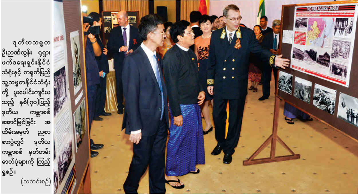
ဒုတိယသမ္မတ ဦးညွှန်ထွန်း ရုရှား ဖက်ဒရေးရှင်းနိုင်ငံ သံရုံးနှင့် တရုတ်ပြည် သူ့သမ္မတနိုင်ငံသံရုံး တို့ ပူးပေါင်းကျင်းပ သည့် နှစ်(၇၀)ပြည့် ဒုတိယ ကမ္ဘာစစ် အောင်မြင်ခြင်း အ ထိမ်းအမှတ် ညစာ စားပွဲတွင် ဒုတိယ ကမ္ဘာစစ် မှတ်တမ်း ဓာတ်ပုံများကို ကြည့် ရှုစဉ်။ (သတင်းစဉ်)