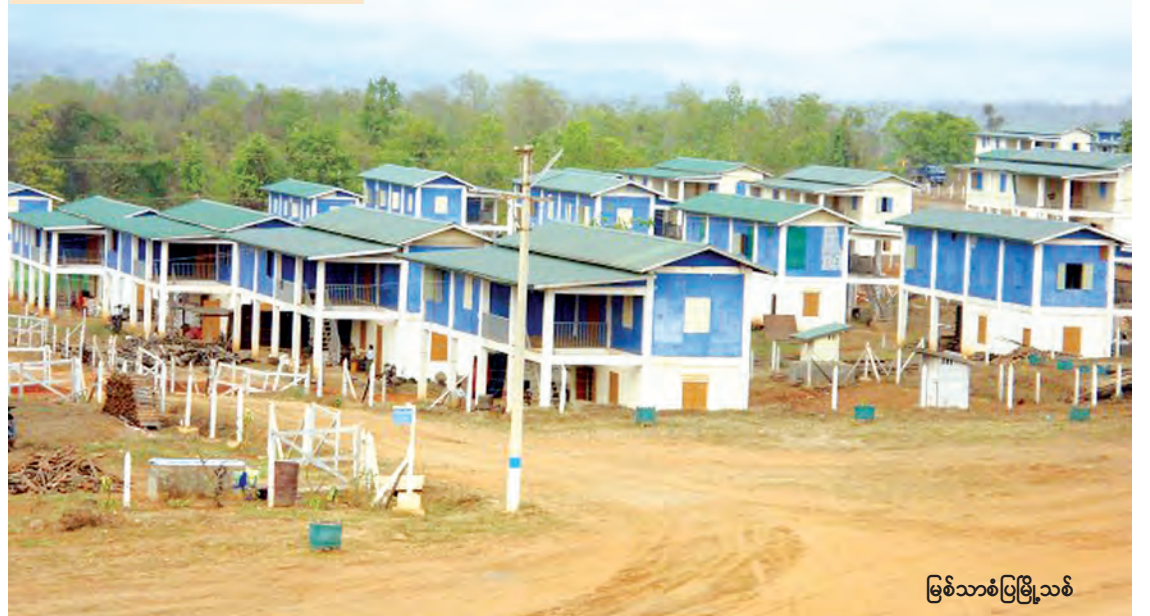
မြစ်သာစံပြမြို့သစ်

ရှိပြီး လတ်တလောတွင် ဒီဇယ်အင်ဂျင်ဖြင့် လျှပ်စစ်ဓာတ်အား ဖြန့်ဖြူးလျက်ရှိသည်။ အခွန်လွတ်ဈေးများလည်း တည်ဆောက် ပေးထားသည်။