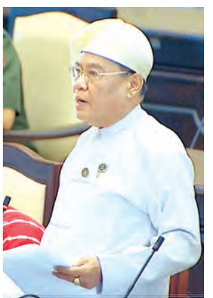
ရန်ကုန်တိုင်းဒေသကြီး မဲဆန္ဒနယ် အမှတ်(၁၅) ဦးဆောင်အောင် မေးမြန်းစဉ်။ (သတင်းစဉ်)

အရ Smart Card ပြောင်းလဲသုံးစွဲခြင်းသည် ယာဉ်ပိုင်ဆိုင်သည့်ပြည်သူများထက် Smart Card ပြုလုပ်သည့်ကွန်ပျူတာနှင့် ဆက်စပ်ပစ္စည်းများ တင်သွင်းရောင်းချသူတို့သာ ပို၍အကျိုးဖြစ်နိုင်ကြောင်း သုံးသပ်ရရှိသဖြင့် လတ်တလောအခြေအနေများအရ ပြောင်းလဲဆောင်ရွက်ရန် အစီအစဉ် မရှိသေးပါကြောင်း၊ စီးပွားရေးမြို့တော် ရန်ကုန်တွင် ယာဉ်ကြောပိတ်ဆို့မှု ဖြေရှင်းရန်အတွက် ရန်ကုန်တိုင်းဒေသကြီးအစိုးရအဖွဲ့အနေဖြင့် ခုံးကျော်တံတားကြီးများ တည်ဆောက်ခြင်း၊ ယာဉ်မရပ်ရလမ်းများ သတ်မှတ်ပြီး အရေးယူဆောင်ရွက်ခြင်း၊ ဘတ်စ်ကားကြီးများအား လမ်းကြောင်းသတ်မှတ်ပြီး ပြေးဆွဲစေခြင်း၊ မီးပွိုင့်