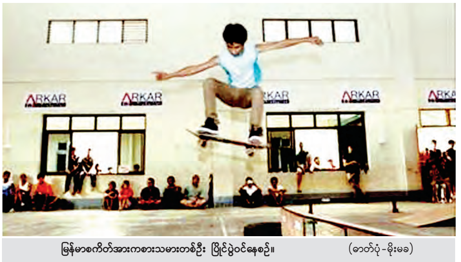
မြန်မာစက်တီအားကစားသမားတစ်ဦး ပြိုင်ပွဲဝင်နေစဉ်။

အဖြစ် စတင်ကျင်းပခဲ့ပြီး ဒုတိယ အကြိမ်ကို လသာ အထက(၁)၌ ကျင်းပခဲ့သည်။ ပြီးခဲ့သည့် ၂၀၁၄ ခုနှစ် ဒီဇင်ဘာလကလည်း မန္တလေးမြို့တွင် တစ်နိုင်ငံလုံး ဖိတ်ခေါ်စက်တီစီး ပြိုင်ပွဲကို ကျင်းပခဲ့ရာ ပြိုင်ပွဲဝင် ၁၀၀ ကျော် လာရောက်ယှဉ်ပြိုင်ခဲ့သည်။ ယခု ထောက်ကြံ့မြို့တွင် ကျင်းပမည့် တတိယအကြိမ် နိုင်ငံတစ်ဝန်း စက်တီ စီးပွဲပြိုင်ပွဲတွင် လက်ရှိပြိုင်ပွဲဝင် ၁၅၀ ကျော် လာရောက်စာရင်းပေးထားပြီး စုစုပေါင်း ပြိုင်ပွဲဝင် ၃၀၀ ကျော် လာရောက်ယှဉ်ပြိုင်မည်ဟု ခန့်မှန်းထားကြောင်း သိရသည်။ (မြန်မာ့အလင်း)