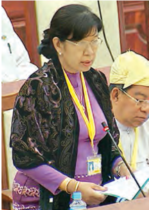
ဒုတိယဝန်ကြီး ဒေါက်တာ ဒေါ်သိန်းသိန်းဌေး ဖြေကြားစဉ်။ (သတင်းစဉ်)

အစီအစဉ် ရှိ၊ မရှိ မေးခွန်းနှင့် စပ်လျဉ်း၍ ကာကွယ်ရေးဝန်ကြီးဌာန ဒုတိယဝန်ကြီး ဗိုလ်ချုပ်ကျော်ညွန့်က