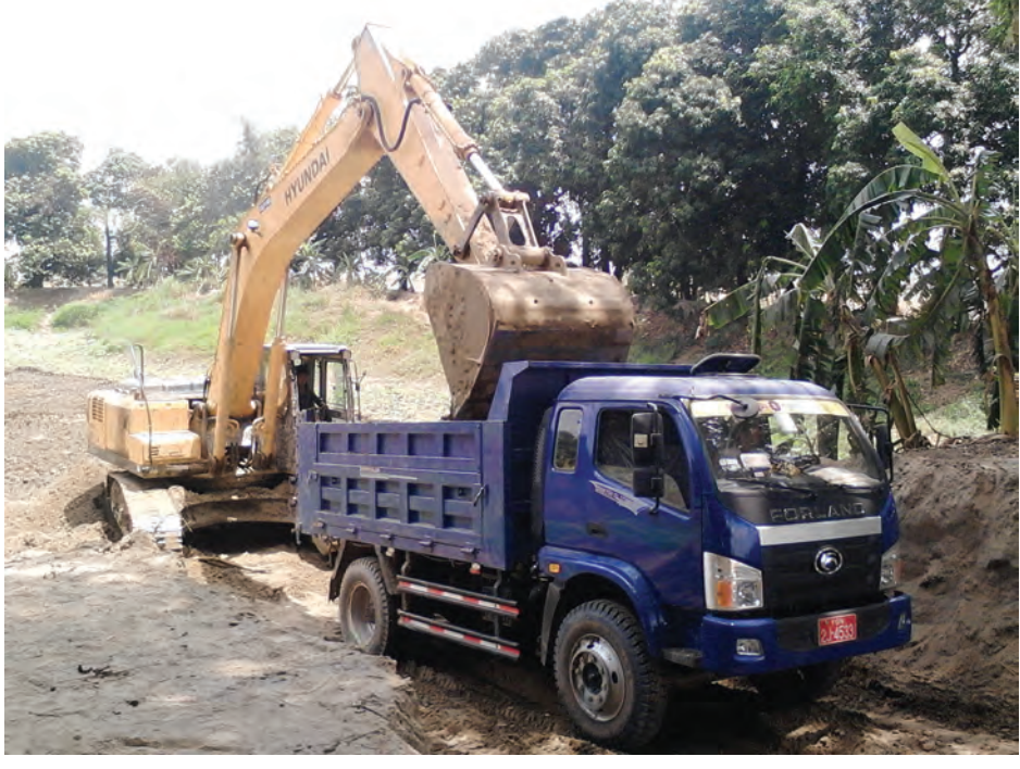
(မြို့နယ် ပြန်/ဆက်)

ပဲခူးတိုင်းဒေသကြီး သနပ်ပင်မြို့နယ် တောဘုတ်စုကျေးရွာ၌ ယခုနှစ်သာမက လာမည့်နွေရာသီအတွက်ပါ ရေခမ်းခြောက်မှု၊ ရေပြတ်လပ်မှု မရှိစေရန်အတွက် ရွာဘုန်းကြီးကျောင်းဝင်းအတွင်းရှိ ငါးကေအကျယ်ရေကန်ကြီးကို ပြည်သူများ စုပေါင်းထည့်ဝင်ငွေ ကျပ်သိန်း ၂၀ ဖြင့် မတည်တူးဖော်လျက်ရှိကြောင်း သိရသည်။ အဆိုပါရေကန်ကို ရန်ကုန်မြို့၊ SSC ဆေးရုံက ငွေကျပ်သိန်း ၄၀ မတည်၍ ၂၀၁၁ ခုနှစ်တွင် စတင်တူးဖော်ပေးခဲ့ကာ ရေကန်တိမ်ကောမှုမရှိစေရန် ပြည်သူများထည့်ဝင်ငွေဖြင့် နှစ်စဉ် ဆက်လက်တူးဖော်ခဲ့ကြောင်း သိရသည်။ ရေကန်ကို နှစ်စဉ်တူးဖော်ထားခြင်းကြောင့် တောဘုတ်စုကျေးရွာရှိ အိမ်ခြေ ၂၅၀ ကျော်မှ လူဦးရေ ၁၂၀၀ ကျော်အတွက်သာမက ပတ်ဝန်းကျင် ကျေးရွာလေးခုမှ ပြည်သူများအတွက်ပါ သောက်သုံးရေလုံလောက်စွာ ရရှိကြောင်း သိရသည်။ ရာသီဥတုပြောင်း ရွာကန်သွေမှုကြောင့် မြန်မာနိုင်ငံအလယ်ပိုင်းဒေသများ အပါအဝင် မြို့နယ်အများအပြားမှ ကျေးလက်ဒေသများ၌ သောက်သုံးရေမလုံလောက်မှုများဖြစ်ပေါ်လျက်ရှိရာ ကျေးရွာများ သောက်သုံးရေလုံလောက်စွာ ရရှိရေးအတွက် ကျေးရွာအလိုက် ရေကန်များတူးဖော်ခြင်းကို ကိုယ့်အားကိုယ်ကိုး ဆောင်ရွက်နေသကဲ့သို့ နိုင်ငံတော်အစိုးရ ရန်ပုံငွေများဖြင့်လည်း ရေတွင်းရေကန်များ၊ အပိစိတွင်းများ တူးဖော်ခြင်း၊ ဆိုလာစနစ်ဖြင့် ရေတင်ခြင်း၊ ရေလှောင်ကန်များ တည်ဆောက်ပေးခြင်း၊ တောင်ကျရေသွယ်ယူခြင်းနှင့် လျှပ်စစ်မြစ်ရေတင်လုပ်ငန်းများ စသည့် ရေရရှိရေးလုပ်ငန်းများကို ကျေးလက်ဒေသများတွင် ဆောင်ရွက်ပေးလျက်ရှိသည်။