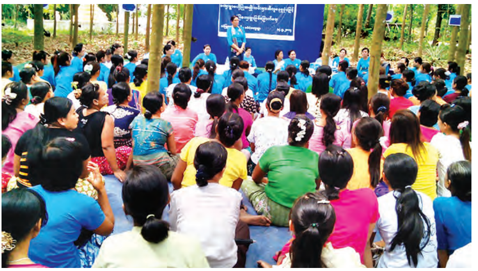
အတွင်း၌ ပဒဲလေးကျွန်းသတ်နှစ်ကိုင်းကျေးရွာတို့မှ သက်ကြီးဘိုးဘွားများအား ပူးဇော်ကန်တော့၍ အာဟာရပစ္စည်းနှင့်ဆေးဝါးများ ထောက်ပံ့ပေးခဲ့သည်။ ဆက်လက်၍ ကျေးရွာမှသင်တန်းသူများ၊ အမျိုးသမီးရေးရာအဖွဲ့ဝင်များနှင့် တွေ့ဆုံကာ မြန်မာအမျိုးသမီးရေးရာအဖွဲ့ဥက္ကဋ္ဌ ပါမောက္ခ

ကျေးလက်ဒေသနေ အမျိုးသမီးများ၏ လူမှုဘဝဖွံ့ဖြိုးတိုးတက်ရေးနှင့်အသိပညာပဟိုပြုအမျိုးသမီးများ၏ လူနေမှုပုံစံဖြင့် စံပြုကျေးရွာဖြစ်မြောက်ရေး သင်တန်းသူများအား လုပ်ငန်းစွမ်းဆောင်နိုင်မှု ဆန်းစစ်ခြင်းအတွက် မြန်မာနိုင်ငံ အမျိုးသမီးရေးရာအဖွဲ့ချုပ် နာယက ဒေါ်နီနီဝင်း၊ ဥက္ကဋ္ဌ ပါမောက္ခ ဒေါက်တာ ခင်မာထွန်းနှင့် ဗဟိုအလုပ်အမှုဆောင်အဖွဲ့သည် မေ ၁၄ ရက် နံနက် ၉ နာရီက သံဖြူဇရပ်မြို့နယ် ပဒဲလေးကျေးရွာ ဘုန်းတော်ကြီးကျောင်းဝင်း