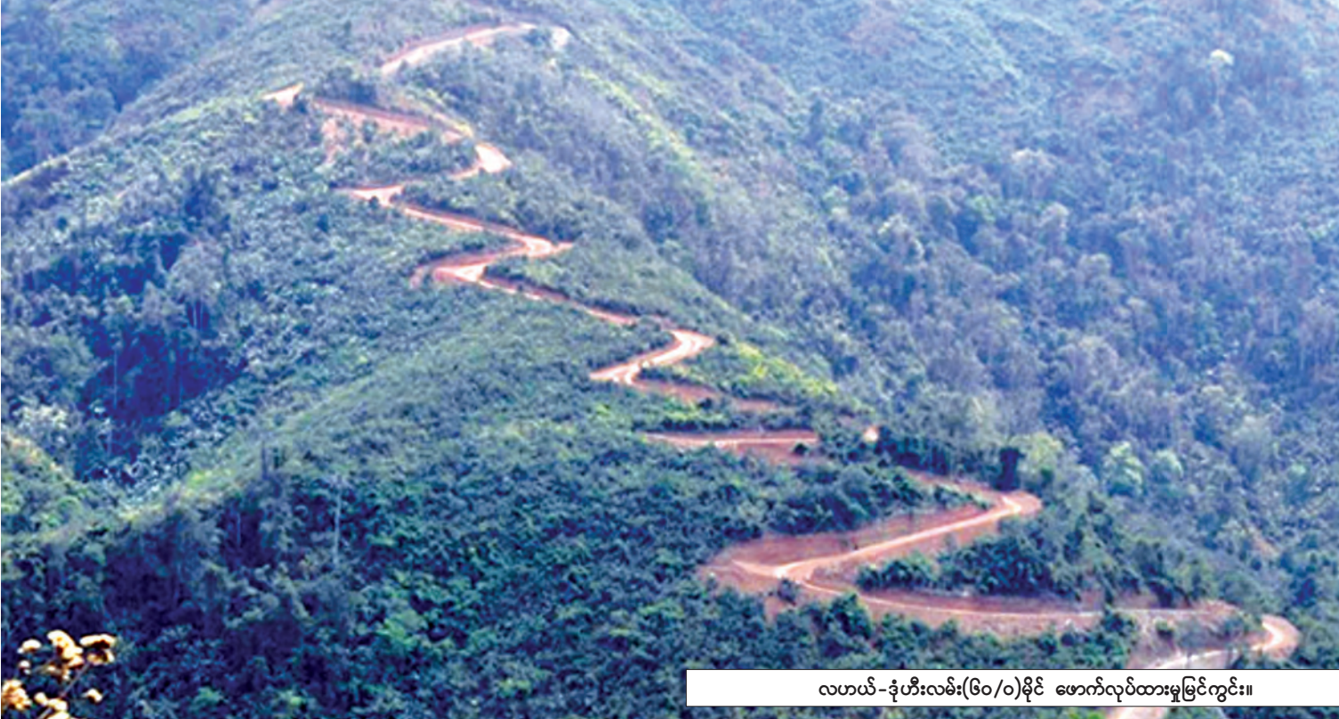
လဟယ်-ဒုံဟီးလမ်း(၆၀/၀)မိုင် ဖောက်လုပ်ထားမှုမြင်ကွင်း။