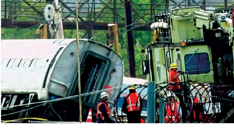
ဟု ၎င်းတို့က ဗုဒ္ဓဟူးနေ့တွင် သတင်းထောက်များကို ပြောခဲ့သည်။ အဆိုပါစနစ်ကို စက်ရုံများ၌ နှစ်အကုန်တွင် တပ်ဆင်ရမည်ဟု ဥပဒေပြဋ္ဌာန်းလိုက်ပြီးနောက်ပိုင်း အရှေ့ဘက်ကမ်းရိုးတန်းဒေသအချို့တွင် တော်တော် များများ တွေ့မြင်လာရပြီဖြစ်သည်။ သို့သော် ကုန်ကျ စရိတ်ကြီးမြင့်မှုကြောင့် အချို့ကုမ္ပဏီများတွင် တပ်ဆင် ရန်ကြန့်ကြာနေဆဲဖြစ်ကြောင်း အမေရိကန်မီဒီယာများက ဖော်ပြသည်။ ရထားသည် ကွေ့ရန်ကြီးပမ်းစဉ် တစ်နာရီလျှင် ၁၇၀ ကီလိုမီတာ အရှိန်နှုန်းဖြင့် ခုတ်မောင်းလျက်ရှိ သည်ဟု သယ်ယူပို့ဆောင်ရေးအာဏာပိုင်များက ဆို သည်။ နယူးယောက်မှ ဝါရှင်တန်သို့ ခုတ်မောင်းသော အဆိုပါရထားပေါ်တွင် ခရီးသည် ၂၄၀ ပါဝင်သည်။ (အင်န်အိတ်ချ်ကေ)

ဖီလာဒဲဖီးယား မေ ၁၄ ဖီလာဒဲဖီးယား၌ လူသေဆုံးခဲ့သည့် အန်းထရက် ရထားလမ်းချော်မှုဖြစ်ပွားခဲ့ရာတွင် အမြန်နှုန်းထိန်း လုံခြုံရေးစနစ်တပ်ဆင်ထားခဲ့လျှင် လမ်းချော်တိုင်းမှောက် မှု မဖြစ်ပွားနိုင်ဟု အမေရိကန်သယ်ယူပို့ဆောင်ရေး အာဏာပိုင်များက ပြောသည်။ ရထားသည် အင်္ဂါနေ့ညက သတ်မှတ်အမြန်နှုန်း တစ်နာရီ ၈၀ ကီလိုမီတာ ထက်နှစ်ဆကျော်လွန်လျက် ခုတ်မောင်းလာခဲ့ပြီး လမ်းကြောင်းပေါ်မှ ချော်ထွက်လာ ခဲ့သည်ဟု အမေရိကန်အမျိုးသားသယ်ယူ ပို့ဆောင် ရေးလုံခြုံမှု အဖွဲ့အစည်းရှိ စုံစမ်းစစ်ဆေးသူများက ဆို သည်။ ရထားလမ်းချော်မှု ဖြစ်ပွားခဲ့သည့်နေရာ၌ သတ်မှတ် အမြန်နှုန်းထက်ပို၍ မောင်းနှင်လာခဲ့လျှင် အလိုအလျောက် အရှိန်နှုန်းလျော့ကျစေမည့် စနစ်ကို တပ်ဆင်သွားမည်