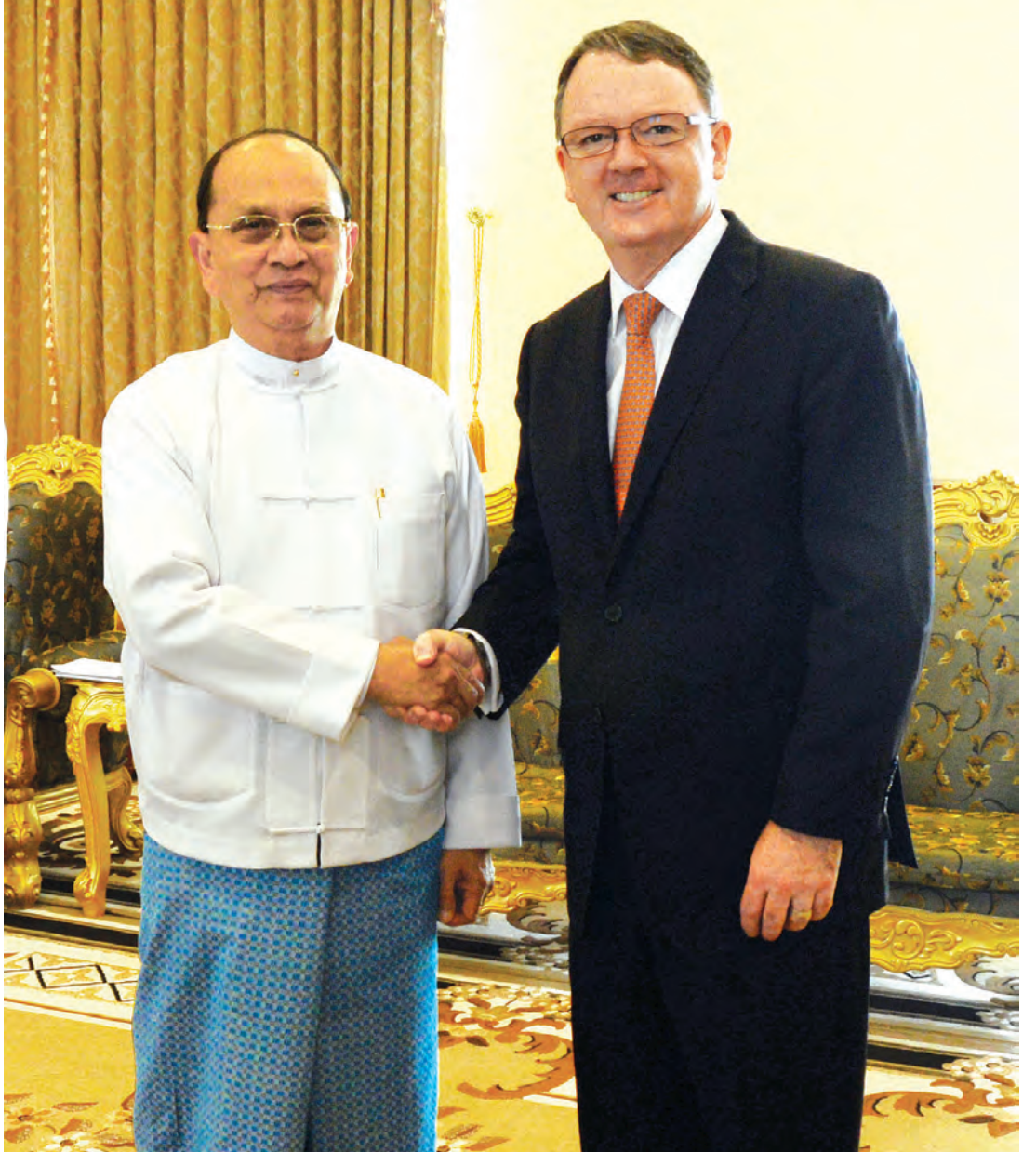
နိုင်ငံတော်သမ္မတ ဦးသိန်းစိန် ဩစတြေးလျနိုင်ငံအခြေစိုက် ဝန်ထုပ်ကုမ္ပဏီမှ အမှုဆောင်အရာရှိချုပ်နှင့် ဦးဆောင်ညွှန်ကြားရေးမှူး၊ မစ္စတာ ပီတာကိုးလ်မန်းအား ရင်းရင်းနှီးနှီးနှုတ်ဆက်စဉ်။ (သတင်းစဉ်)

တွေ့ဆုံစဉ် ရေနံနှင့် သဘာဝဓာတ်ငွေ့တူးဖော်ထုတ်လုပ်ရေးလုပ်ငန်းများ တိုးမြှင့်ဆောင်ရွက်နေမှုများနှင့် ဒေသခံပြည်သူများအတွက် လူမှုအထောက်အကူပြုလုပ်ငန်းများ ဆောင်ရွက်ပေးနေမှုများ၊ အခြေခံအဆောက်အအုံများ တည်ဆောက်ရေးနှင့် ရေနံနှင့်သဘာဝဓာတ်ငွေ့ ရှာဖွေတူးဖော်ရေးလုပ်ငန်းများတွင် လူ့စွမ်းအားအရင်းအမြစ်များ ရရှိနိုင်ရေးအတွက် ထူးချွန်လူငယ်များကို ပြည်ပပညာတော်သင် စေလွှတ်သင်ကြားနိုင်ရေး၊ ပြည်တွင်း၌ လေ့ကျင့်ရေးသင်တန်းများ ဖွင့်လှစ်သင်ကြားနိုင်ရေး ကိစ္စရပ်များကို ဆွေးနွေးခဲ့ကြသည်။ (သတင်းစဉ်)