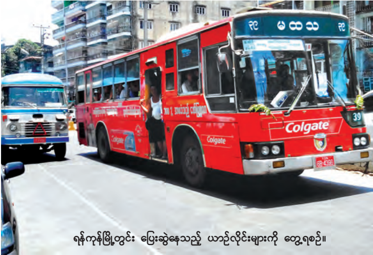
ရန်ကုန်မြို့တွင်း ပြေးဆွဲနေသည့် ယာဉ်လှိုင်းများကို တွေ့ရစဉ်။

ရန်ကုန်မြို့ အများပိုင်သွားလာမှု အဆင်ပြေချောမွေ့စေရေးနှင့် ပြည်သူ့ယုံကြည် အားထားရသည့် ဘတ်စ်ကားစနစ်ပေါ်ပေါက် လာစေရန် ရည်ရွယ်၍ ရန်ကုန်ဘတ်စ်ကား အများပိုင်ကုမ္ပဏီထူထောင်သွားရန် စီစဉ် လျက်ရှိရာ အဆိုပါအများပိုင်ဘတ်စ်ကား များကို အောက်တိုဘာလထုတ်ပေး စတင် ပြေးဆွဲသွားမည်ဖြစ်ကြောင်း အများပိုင် ဘတ်စ်ကားတည်ထောင်ရေးအဖွဲ့မှ တာဝန် ရှိသူတစ်ဦးက ပြောသည်။ “ဒီအများပိုင် ဘတ်စ်ကားကုမ္ပဏီကို နိုင်ငံတော်က ကျပ် ၁၀ ဘီလီယံနဲ့ ပုဂ္ဂလိက လုပ်ငန်းရှင်တို့က ကျပ် ၁၅ ဘီလီယံထည့် ဝင်မှုနဲ့ ဆောင်ရွက်သွားမှာ ဖြစ်ပါတယ်။ ပထမအဆင့်အနေဖြင့် ပြည်လမ်းနံ့ကမ္ဘာအေး ဘုရားလမ်းတွေမှာ အမြန်ဘတ်စ်ကားစနစ်