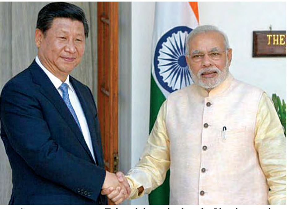
နယူးဒေလီ မေ ၁၄ အိန္ဒိယဝန်ကြီးချုပ် နရိန္ဒြာ မိုဒီသည် နှစ်နိုင်ငံအပြန်အလှန် ယုံကြည်မှု နည်းပါးနေသော်လည်း တရုတ်နိုင်ငံသို့ စီးပွားရေးပူးပေါင်း ဆောင်ရွက်မှုဖြင့်တင်ရန် သုံးရက်ကြာ ခရီးအဖြစ် ထွက်ခွာသွားသည်။ နှစ်နိုင်ငံဆက်ဆံရေးသည် နှစ် ကာလကြာရှည်စွာ နယ်စပ်ပြဿနာ

ကြောင့် လိပ်ခဲတည်းလည်းဖြစ်နေကြ သည်ဟု ဆိုသည်။ မစ္စတာမိုဒီသည် သမ္မတရှီကျင့်ဖျင်နှင့် မြို့တော် ပေကျင်းရှိနေအိမ်သို့ သွားရောက် တွေ့ဆုံမည်ဖြစ်ကြောင်း၊ ယင်းမှ ပေကျင်းမြို့နှင့် ရန်ဟိုင်းမြို့များသို့ လှည့်လည်မည်ဖြစ်ကြောင်း သိရ သည်။ မစ္စတာမိုဒီက ၎င်းသွားရောက် လည်ပတ်မူမည် အာရှ၏အလား အလာကို တိုးပွားစေမည်ဖြစ် ကြောင်း ပြောကြားလိုက်သည်။ မိမိ၏ သွားရောက်လည်ပတ်မူမည် တရုတ်နှင့် စီးပွားရေးပူးပေါင်း ဆောင်ရွက်မှုအုတ်မြစ်ကို ချမှတ်နိုင် လိမ့်မည်ဖြစ်ကြောင်းလည်း ပြော ကြားသည်။ တရုတ်နိုင်ငံသည် အိန္ဒိယနိုင်ငံ၏ အကြီးဆုံး ကုန်သွယ်ဖက်ဖြစ်ပြီး ၂၀၁၄ ခုနှစ်တွင် နှစ်နိုင်ငံအကြား ကုန်သွယ်မှုသည် အမေရိကန်ဒေါ်လာ ၇၀ ဘီလီယံကျော်ရှိကြောင်း သိရ သည်။ (ဆင်ဟွာ)