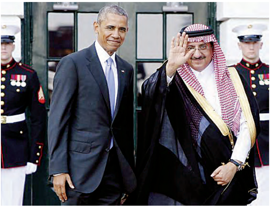
အီရန်၊ ဆီးရီးယားနှင့် အာရပ် များတွင် ဆွေးနွေးခြင်းဖြစ်သည်။ က အရေးယူပိတ်ဆို့မှုများ ဖယ်ရှား နိုင်ငံများအပေါ် ထားသော အမေ နှုတ်ကလီးယားအရေးနှင့်ပတ်သက် ပေးမည်ကို အာရပ်ခေါင်းဆောင်များ က စိုးရိမ်နေကြသည်။

ဝါရှင်တန် မေ ၁၄ အိမ်ဖြူတော်၌ မေ ၁၄ ရက်နေ့က ကျင်းပခဲ့သော ပင်လယ်ကွေ့နိုင်ငံများ ပူးပေါင်းဆောင်ရွက်ရေးကောင်စီ အစည်းအဝေး တက်ရောက်သည့် ဆော်ဒီမင်းသား မိုဟာမက်ဘင်နာ ရိဖ်နှင့် အမေရိကန်သမ္မတ ဘားရတ် အိုဘားမားတို့ တွေ့ဆုံကြသည်။ အီရန်နယ်လီယားအရေးဖြင့် ပတ်သက်၍ အမေရိကန်အနေနှင့် အာရပ်ခေါင်းဆောင်များအကြား ၎င်းတို့၏ လုံခြုံရေးဆိုင်ရာကိစ္စများကို ကျွေးလွန်မိသလို ဖြစ်ခဲ့သောကြောင့် ဆော်ဒီအာရေဗျအပါအဝင် ပင်လယ်ကွေ့ မဟာမိတ်နိုင်ငံများနှင့် ယုံကြည်မှုတည်ဆောက်ရန် အိုဘားမားအနေနှင့် ကြိုးစားလျက်ရှိသည်။ မေရီလင်း၌ ကျင်းပမည့် အဆင့်မြင့်အစည်းအဝေးတွင် လုံခြုံရေး ပူးပေါင်းဆောင်ရွက်မှုများကို ဆွေးနွေးရန် အိုဘားမားနှင့် ပင်လယ်ကွေ့ ပူးပေါင်းရေး အဖွဲ့ဝင်များဖြစ်သော ဆော်ဒီ၊ ကူဝိတ်၊ ကာတာ၊ ဘာရိန်း စသောနိုင်ငံများမှ ကိုယ်စားလှယ်များ တွေ့ဆုံမည်ဖြစ်သည်။