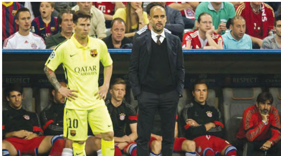
ကောင်းမြတ်သူ-စုစည်းသည်

လည်း ဖြစ်လာခဲ့ပါတယ်။ မာရေး မတိုင်မီက ဟော်ရာစီယို ဇီဘောလော့၊ ရော်ဂျာဖက်ဒဲရာနဲ့ ဂျီကိုဗစ်တို့လည်း အနိုင်ရခဲ့ဖူးပါတယ်။ မာရေးက သူ့အနေနဲ့ အီတလီအိုးပင်းမှာ ပါဝင်ကစားတာဟာ မြေကြီးကွင်း သုံးထပ်ကွင်းဖြစ်ဖို့ မျှော်မှန်းထားတယ်လို့ ဆိုပါတယ်။ ရာဖေးလ်နာဒယ်ဟာ မြေကြီးကွင်းမှာ အခြားပြိုင်ဘက်တွေ မယှဉ်နိုင်အောင် ကစားနိုင်တဲ့ တင်းနစ်အကျော်အမော်ဖြစ်ပါတယ်။ သို့ပေမယ့် ပြီးခဲ့တဲ့ မက်ဒရစ် အိုးပင်းဖလားပြိုင်ပွဲမှာတော့ မာရေးကိုရှုံးပြီး ဖလားလက်လွတ်ဖြစ်ခဲ့ရပါတယ်။