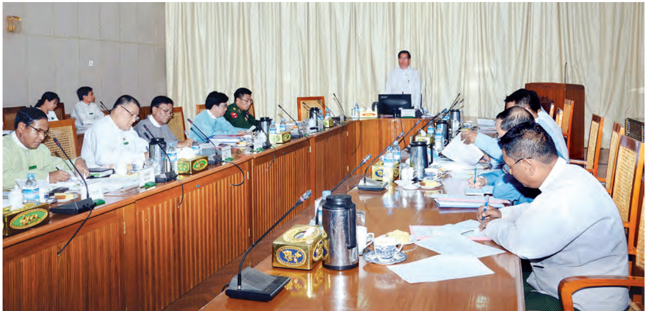
ပြည်ထောင်စုဝန်ကြီးဌာန ဒုတိယဝန်ကြီး ဦးလှထွန်း (အလယ်) က အစည်းအဝေးကို အမှာစကားပြောနေသည်။

တော်တွင် ပြုလုပ်သွားမည်ဖြစ်ရာ အလုပ်ရုံဆွေးနွေးပွဲတွင် နိုင်ငံ့ဝန်ထမ်းများ စွမ်းဆောင်ရည်မြှင့်တင်ရေး၊ ပြည်သူ့ဝန်ဆောင်မှုလုပ်ငန်းများ တိုးတက်ကောင်းမွန်ရေး၊ ဗဟိုဦးစီးစနစ်လျှော့ချခြင်း၊ ပွင့်လင်းမြင်သာမှုနှင့် တာဝန်ခံမှုရှိခြင်းခေါင်းစဉ်များဖြင့် အဓိကထားဆွေးနွေးသွားကြမည်ဖြစ်ပါကြောင်း။