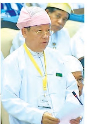
ဒုတိယဝန်ကြီး ဦးအောင်သိမ်း ဖြေကြားစဉ်။ (သတင်းစဉ်)

များအား နှစ်လဲသက်တမ်းတိုးခြင်းကို တစ်နှစ်လျှင် တစ်ကြိမ်သို့ ပြောင်းလဲဆောင်ရွက်သွားမည် ဖြစ်ပါကြောင်း၊ ယာဉ်အန္တရာယ်ကင်းရှင်းရေးအတွက် အငှားယာဉ်များ၊ ခရီးသည်တင်ယာဉ်များ၊ ယာဉ်ကြီးများ၊ စက်မှုဇုန်ထုတ်ယာဉ်များ၊ “၆၀” အကွရာအောက်၊ ယာဉ်ငယ်များအား လက်ရှိအတိုင်း တစ်နှစ်လျှင် တစ်ကြိမ်ဖြင့် ဆက်လက်ဆောင်ရွက်ပေးသွားမည်ဖြစ်ကြောင်း။