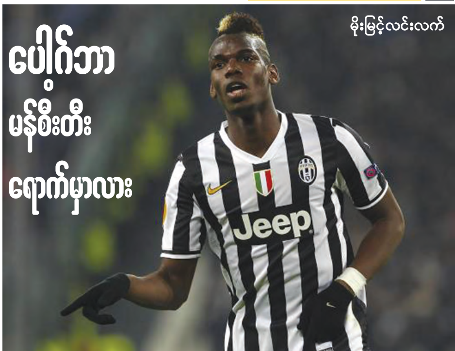
မြင့်မားသူ တစ်ဦးလည်း ဖြစ်တာမို့ မန်စီးတီးကတော့ ပြောင်းရွှေ့ကြေးပေးချေဖို့ အသင့်ရှိနေပြီဖြစ်ပါတယ်။ မိခင် ပြင်သစ်အသင်းအတွက် ၂၂ ပွဲကစားပေးထားပြီး ငါးဝိုးသွင်းယူထားနိုင်တဲ့ ပေါက်ဘာကို မန်စီးတီးက လာမယ့် နေရာသီအပြောင်းအရွှေ့ကာလမှာ ရအောင် ခေါ်ယူဖို့ စောင့်ကြည့်ရမှာဖြစ်ပါတယ်။ ။

ပေါက်ဘာဟာ ဂျူဗင်တပ်ကို ၂၀၁၂ ခုနှစ်က စတင် ရောက်ရှိခဲ့ပြီး အခုအချိန်အထိ ပွဲပေါင်း ၈၆ ပွဲ ကစားပြီး ချိန်မှာ ဝိုးပေါင်း ၂၀ သွင်းယူထားနိုင်တာမို့ အခြား ထိပ်တန်း အသင်းတွေက စိတ်ဝင်စားလာတာဖြစ်ပါတယ်။ လျှင်မြန်မှု၊ အဝင်အထွက်ရမှုများအပြင် ဝိုးသွင်းစွမ်းရည်