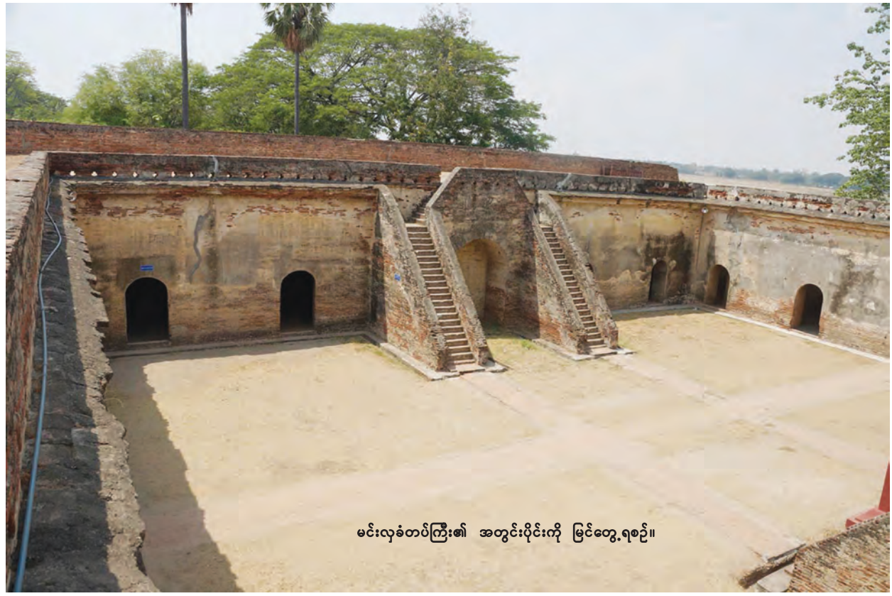
မင်းလှခံတပ်ကြီး၏ အတွင်းပိုင်းကို မြင်တွေ့ရစဉ်။

မင်းလှခံတပ်ကြီး ကာကွယ်ထိန်းသိမ်းရေးလုပ်ငန်းများ ဆောင်ရွက်ထားမှုကို တိုင်းဒေသကြီးဝန်ကြီးချုပ်ဦးဘုန်းမော်ရွှေနှင့် ဝန်ကြီးများ၊ တိုင်းဒေသကြီး အဆင့် ဌာနဆိုင်ရာတာဝန်ရှိသူများက မေ ၅ ရက်က မင်းလှခံတပ်သို့ လာ ရောက်ကြည့်ရှုခဲ့သည်။ တိုင်းဒေသကြီး ဝန်ကြီးချုပ်နှင့်အဖွဲ့အား ရေအရင်း အမြစ်နှင့် မြစ်ချောင်းများဖွံ့ဖြိုးတိုးတက်ရေးဦးစီးဌာန တိုင်းဒေသကြီးဦးစီးမှူး ဦးဇော်လွင်က ကာကွယ်ထိန်းသိမ်းရေးလုပ်ငန်းဆောင်ရွက်ထားရှိမှုများနှင့် ပတ်သက်၍ ရှင်းလင်းတင်ပြခဲ့သည်။ ထိုသို့ တိုင်းဒေသကြီးအစိုးရအဖွဲ့ အစီအစဉ်ဖြင့် မင်းလှခံတပ်ကြီး ရေရှည်တည်တံ့စေရေးလုပ်ငန်းများကို ဆောင် ရွက်နေမှုကြောင့် သမိုင်းဝင် မင်းလှခံတပ်ကြီးသည် မြန်မာတို့၏ ရှေးဟောင်း အမွေအနှစ်တစ်ခုအဖြစ် ရှေးမှုမပျက် ရေရှည်တည်တံ့ကာ ခိုင်မြဲနေမည် ဖြစ်ပါသည်။ ။