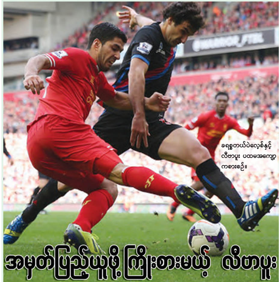
ခရစ္စတယ်ပလေစ်နှင့် လီဗာပူး ပထမအကျော့ ကစားစဉ်။