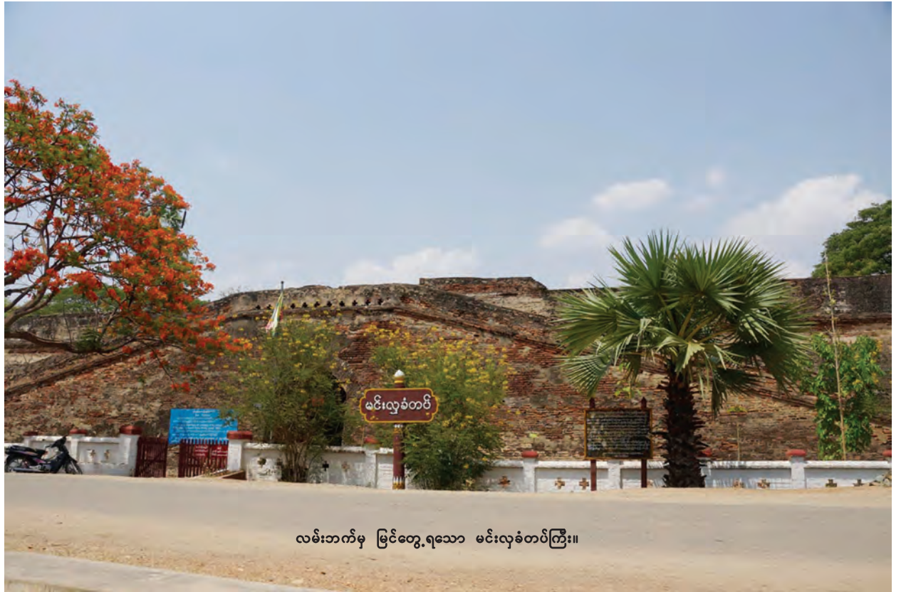
လမ်းဘက်မှ မြင်တွေ့ရသော မင်းလှခံတပ်ကြီး။

အုတ်များဖြင့် စနစ်တကျတည်ဆောက်ခြင်း၊ ပေါင်းကူး(Arch)များကို စနစ်တကျ အုတ်စီထားခြင်း၊ လုပ်ငန်းလိုအပ်ချက်အလိုက် လှေကားများကို စနစ်တကျစီစဉ်ထည့်သွင်းတည်ဆောက်ထားခြင်းစသည်ဖြင့် ရန်သူကို ခုခံ တိုက်ခိုက်ရာတွင် လိုအပ်သောအချက်များပါဝင်အောင် စီစဉ်တည်ဆောက် ထားခဲ့ကြောင်း လေ့လာတွေ့ရှိရသည်။ မင်းလှခံတပ်သည် မြန်မာတို့၏ ဇာတိ