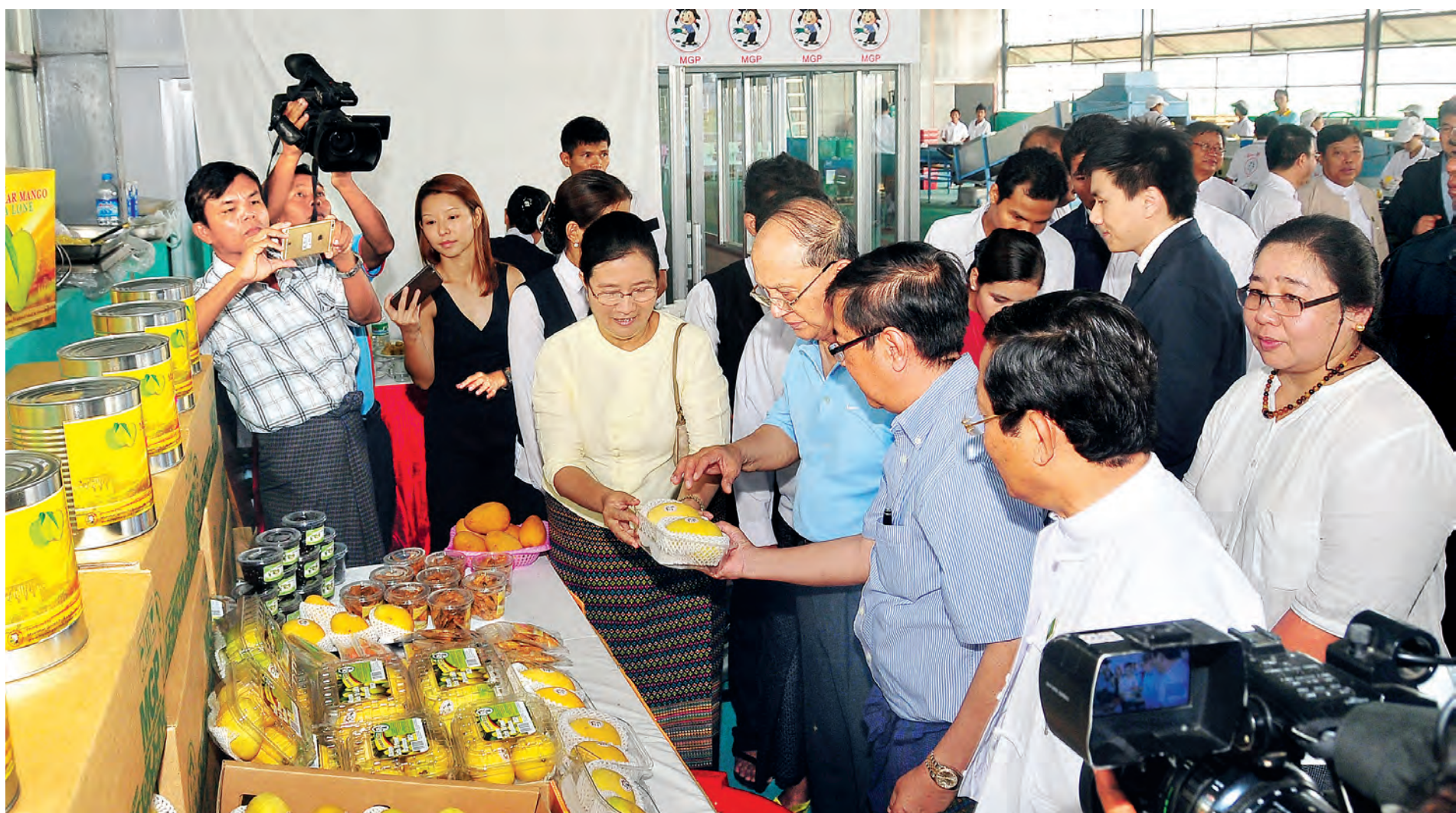
နိုင်ငံတော်သမ္မတ ဦးသိန်းစိန် မြန်မာရွှေသစ်သီးဝလံကုမ္ပဏီမှ ထုတ်လုပ်သော ပြည်ပတို့ကုန် စိန်တလုံးသရက်သီးများကို ကြည့်ရှုစစ်ဆေးစဉ်။ (သတင်း၊ စာမျက်နှာ-၃)(သတင်းစဉ်)

ယနေ့ မာ တိ ကာ လူဦးရေထူထပ်သိပ်သည်းလာမည့် နောင်အနာဂတ် ကမ္ဘာမြို့ကြီးများ၏ အဓိကစိန်ခေါ်မှုများ စာမျက်နှာ-၅ ကိုးကန့်သောင်းကျန်းသူများ၏ ခုခံတိုက်ခိုက်မှုများကို တပ်မတော်စစ်ကြောင်းများက ပစ်ကျင်းပျားတူး၍ ရဲဝံ့စွာစားစွာ တိုက်ခိုက်ချေမှုန်း စာမျက်နှာ-၁၄