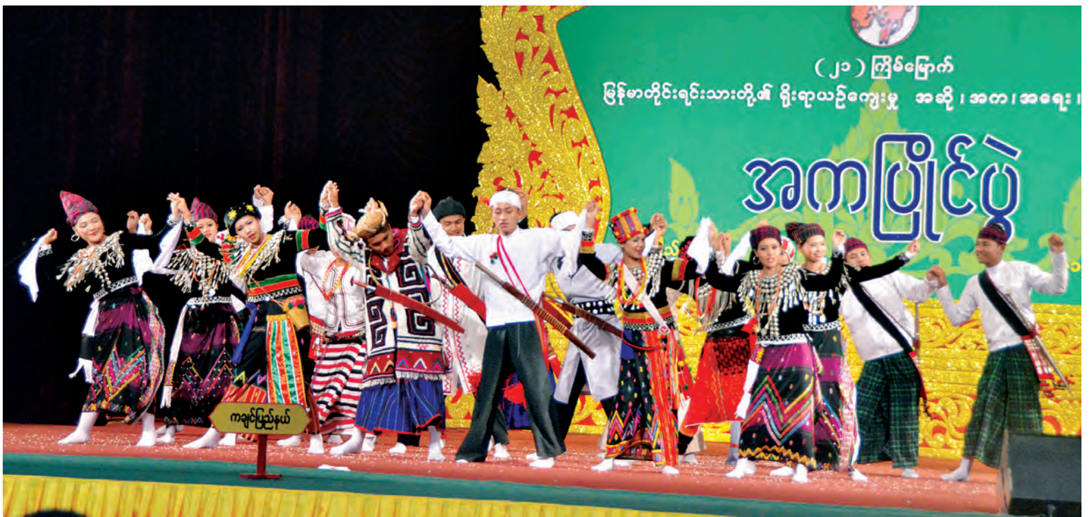
တိုင်းရင်းသားရိုးရာ/ကျေးလက်ရိုးရာ အကပြိုင်ပွဲ(အလွတ်တန်း)တွင် ကချင်ပြည်နယ်မှ ဂျမ်းဖောရိုးရာစေ့ တေးသရုပ်ဖော်အကဖြင့် ယှဉ်ပြိုင်စဉ်။

နေပြည်တော် မေ ၁၂ အကပြိုင်ပွဲခန်းမ စင်မြင့်။ တိုင်းရင်းသားရိုးရာဝတ်စုံများ တူညီစွာ ဝတ်ဆင်ထားသည့် မြိုင်ပွဲဝင်များ၊ မြူးကြွသည့် ရိုးရာတေးသီချင်းသံစဉ်နှင့်အတူ အဖွဲ့လိုက်ညီညာစွာ ကပြပြိုင်ပွဲဝင်နေသည့် တိုင်းရင်းသားရိုးရာအကအဖွဲ့များ၊ မြူးမြူးကြွကြွ လှုပ်ရှားယိမ်းထိုးကပြ ပြိုင်ပွဲဝင်နေသည့် မြိုင်ပွဲဝင်က ချစ်စရာကောင်းသည့် မြန်မာတိုင်းရင်းသားတို့၏ ရိုးရာ အကစစ်စစ်များပင်။ ကချင်၊ ကယား၊ ကရင်၊ ချင်း၊ မွန်၊ မြန်မာ၊ ရခိုင်၊ ရှမ်း စသည့်တိုင်းရင်းသားတို့၏ ရိုးရာယဉ်ကျေးမှုအကများကို ဖော်ထုတ်ယှဉ်ပြိုင်စေသည့် ပြိုင်ပွဲမြိုင်ပွဲဝင်က ကြက်သီးမွေးညင်းထလောက် အောင်မြင်မြိုင်ဆိုင်ဆိုင် ရှိလှသည်။ (၂၁)ကြိမ်မြောက် မြန်မာတိုင်းရင်းသားတို့၏ ရိုးရာယဉ်ကျေးမှု အဆို၊ အက၊ အရေး၊ အတီး ပြိုင်ပွဲက မေ ၁၂ ရက် နံနက်ပိုင်းတွင် နောက်ဆုံး ပြိုင်ပွဲများ ပြီးဆုံးခဲ့ပြီဖြစ်သည်။