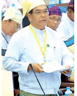
ဒုတိယဝန်ကြီး ဦးအုန်းသန်း ဖြေကြားစဉ်။ (သတင်းစဉ်)

ခြင်းဖြင့် ကူညီပံ့ပိုးပေးရန် အစီအစဉ် ရှိ၊ မရှိ မေးခွန်းနှင့်စပ်လျဉ်း၍ မြန်မာ့လယ်ယာဖွံ့ဖြိုးရေးဘဏ် နည်းဥပဒေအရ သာသနာ့အဖွဲ့အစည်းများနှင့် သီးနှံပျက်စီးချိန်တွင် အချိန်နှင့်တစ်ပြေးညီတင်ပြပါက မြို့နယ်ဘဏ်ခွဲမှ ကွင်းဆင်းစစ်ဆေး၍ သတ်မှတ်သည့် အတိုင်းအတာအထိ ပျက်စီးသည်ဆိုလျှင် ဒေသအာဏာပိုင်များ၏ ထောက်ခံချက်ဖြင့် ချေးငွေပေးဆပ်ကာလကို ဘဏ်ကရွှေ့ဆိုင်းပေးနိုင်ပါကြောင်း၊ ဘဏ်၏စည်းကမ်းချက်အတိုင်း ကြွေးပေးပေးမကျေပါက ကြွေးသစ် မရနိုင်ပါကြောင်း၊ အမှန်တကယ် သီးနှံပျက်စီးမှုအပေါ် ရပ်တွက်၊ ကျေးရွာအုပ်စု၊ မြို့နယ်၊ တိုင်းဒေသကြီးနှင့် ပြည်နယ်အစိုးရတို့မှ စစ်ဆေးထောက်ခံတင်ပြပါက ချေးငွေပေးဆပ်ကာလကို ဘဏ်ကရွှေ့