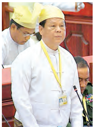
ဒုတိယဝန်ကြီး ဦးခင်မောင်အေး ဖြေကြားစဉ်။ (သတင်းစဉ်)

ပထမအကြိမ် ပြည်သူ့လွှတ်တော် (၁၂)ကြိမ်မြောက် ပုံမှန်အစည်းအဝေး ၄၄ ရက်မြောက်နေ့ကို ယနေ့နံနက် ၁၀ နာရီတွင် ကျင်းပခဲ့ပြီး ပြည်သူ့လွှတ်တော်ဥပဒေရေးရာနှင့် အထူးကိစ္စရပ်များ လေ့လာဆန်းစစ်သုံးသပ်ရေးကော်မရှင်၌ ဦးကိုကိုနိုင် ဗိုလ်ချုပ်(ငြိမ်း)အား ကော်မရှင်အဖွဲ့ဝင်အဖြစ် ထည့်သွင်းဖွဲ့စည်းလိုက်ကြောင်း လွှတ်တော်သို့ အသိပေးကြေညာသည်။