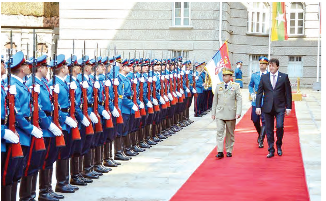
တပ်မတော်ကာကွယ်ရေးဦးစီးချုပ် ဗိုလ်ချုပ်မှူးကြီးမင်းအောင်လှိုင်နှင့် ဆားဗီးယားကာကွယ်ရေးဝန်ကြီးတို့ ဂုဏ်ပြုတံဖွဲ့ကိုစစ်ဆေးစဉ်။

နေပြည်တော် မေ ၁၂ ဆားဗီးယားနိုင်ငံ၌ ချစ်ကြည်ရေးခရီးရောက်ရှိနေသော တပ်မတော်ကာကွယ်ရေးဦးစီးချုပ် ဗိုလ်ချုပ်မှူးကြီး မင်းအောင်လှိုင်အား ဆားဗီးယားနိုင်ငံ ကာကွယ်ရေးဝန်ကြီး H.E. Mr. Bratislav Gasic က ဂုဏ်ပြုကြိုဆိုသည့် အခမ်းအနားကို မေ ၁၁ ရက် ဒေသစံတော်ချိန် နံနက် ၈ နာရီ ၄၅ မိနစ်တွင် ကာကွယ်ရေးဝန်ကြီးဌာန စစ်ရေးပြကွင်း၌ ကျင်းပသည်။ အခမ်းအနားတွင် တပ်မတော်ကာကွယ်ရေးဦးစီးချုပ်နှင့် ဆားဗီးယားကာကွယ်ရေးဝန်ကြီးတို့သည် ဂုဏ်ပြုတံဖွဲ့၏ အလေးပြုခြင်းကို ခံယူကြသည်။ ယင်းနောက် တပ်မတော်ကာကွယ်ရေးဦးစီးချုပ်နှင့် ဆားဗီးယားနိုင်ငံ ကာကွယ်ရေးဝန်ကြီးတို့သည် ဝန်ကြီး၏ဧည့်ခန်းမ၌ သီးသန့်တွေ့ဆုံဆွေးနွေးကြသည်။ (အောက်ပုံ) ထို့နောက် မြန်မာ-ဆားဗီးယား နှစ်နိုင်ငံတွေ့ဆုံဆွေးနွေးပွဲကို ကျင်းပကြသည်။ တွေ့ဆုံစဉ် နှစ်နိုင်ငံတပ်မတော်တို့အကြား အကောင်အထည်ဖော်ဆောင်ရွက်နိုင်မည့် ကိစ္စရပ်များကို ဆွေးနွေးခဲ့ကြသည်။ ယင်းနောက် မြန်မာ့တပ်မတော်နှင့် ဆားဗီးယားနိုင်ငံ တပ်မတော်နှစ်ရပ်အကြား ကာကွယ်ရေးဆိုင်ရာ ပူးပေါင်းဆောင်ရွက်မှု သဘောတူညီချက်ကို ကာကွယ်ရေးဝန်ကြီးဌာန ဒုတိယဝန်ကြီး ဗိုလ်မှူးချုပ်အောင်သော်နှင့် ဆားဗီးယားနိုင်ငံ State Secretary / ဒုတိယကာကွယ်ရေးဝန်ကြီး Mr. Zoran Djordjievic တို့က လက်မှတ်ရေးထိုးကြပြီး အပြန်အလှန်လဲလှယ်ကြသည်။ ဒေသစံတော်ချိန် နံနက် ၁၁ နာရီ မိနစ် ၂၀ တွင် တပ်မတော်ကာကွယ်ရေးဦးစီးချုပ်နှင့်အဖွဲ့သည်Avala Tower သို့ သွားရောက်လေ့လာကြသည်။ ထို့နောက် ဆားဗီးယားနိုင်ငံ၏ သူရဲကောင်းစစ်သည်ဗိမာန် (Mount