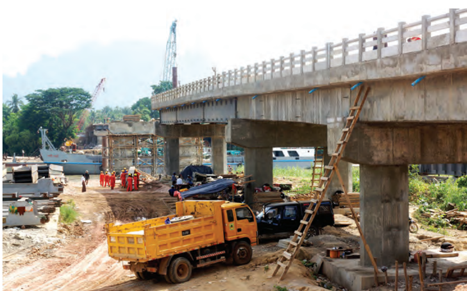
မော်လမြိုင် မေ ၁၂

မွန်ပြည်နယ်ဝန်ကြီးချုပ် ဦးအုန်း မြင့်သည် မေ ၈ ရက်က မော်လ မြိုင်မြို့ အားကစားနှင့် ကာယ ပညာသိပ္ပံကျောင်းသို့ ရောက်ရှိပြီး သင်တန်းသား သင်တန်းသူ များ၏ အိပ်ဆောင်များနှင့် ကျောင်းဝင်း အတွင်း သန့်ရှင်းသာယာလှပရေး လုပ်ငန်းများ ဆောင်ရွက်ထားရှိမှု များကို ကြည့်ရှုစစ်ဆေးသည်။ ဆက်လက်၍ ကျောင်းဝင်း အတွင်း စီမံခန့်ခွဲမှုများအရ အရိပ်ရ