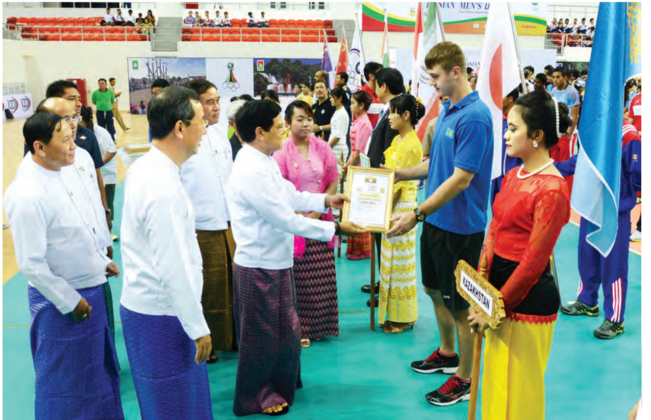
ဒုတိယသမ္မတ ဦးညွှန်ထွန်း ပထမအကြိမ် အာရှအသက်(၂၃)နှစ်အောက် အမျိုးသားဘော်လီဘော ပြိုင်ပွဲဝင်အသင်းများအား ဂုဏ်ပြုမှတ်တမ်းလွှာများ ပေးအပ်စဉ်။ (သတင်းစဉ်)