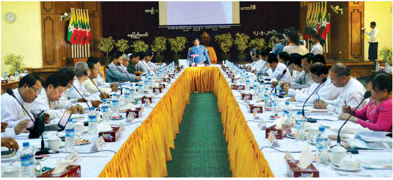
ဒုတိယသမ္မတ ဦးဉာဏ်ထွန်း အမျိုးသား ယာဉ်အန္တရာယ်၊ လမ်းအန္တရာယ်ကင်းရှင်းရေးကောင်စီ၏ ပထမအကြိမ် ညှိနှိုင်းအစည်းအဝေးတွင် အမှာစကားပြောကြားစဉ်။

နေပြည်တော် မေ ၁၂ အမျိုးသားယာဉ်အန္တရာယ်၊ လမ်းအန္တရာယ် ကင်းရှင်းရေး ကောင်စီ၏ ပထမအကြိမ် ညှိနှိုင်း အစည်းအဝေးကို ယနေ့ မွန်းလွဲ ၂ နာရီတွင် နေပြည်တော်ရှိ ရထားပို့ဆောင်ရေးဝန်ကြီးဌာန အစည်းအဝေးခန်းမ၌ ကျင်းပရာ အမျိုးသား ယာဉ်အန္တရာယ်၊ လမ်းအန္တရာယ် ကင်းရှင်းရေးကောင်စီ ဥက္ကဋ္ဌ ဒုတိယသမ္မတ ဦးဉာဏ်ထွန်း တက်ရောက်အမှာစကားပြောကြားသည်။ အစည်းအဝေးသို့ ပြည်ထောင်စုဝန်ကြီး ဒုတိယပိုလ်ချုပ်ကြီး ကိုကို၊ ဦးရဲထွန်း၊ ဦးကျော်လွင်၊ ဦးသန်းဌေး၊ ဒုတိယဝန်ကြီးများ၊ တိုင်းဒေသကြီးနှင့် ပြည်နယ်အစိုးရအဖွဲ့ဝင် လမ်းပန်းဆက်သွယ်ရေးဝန်ကြီးများနှင့် တာဝန်ရှိသူများတက်ရောက်ကြသည်။