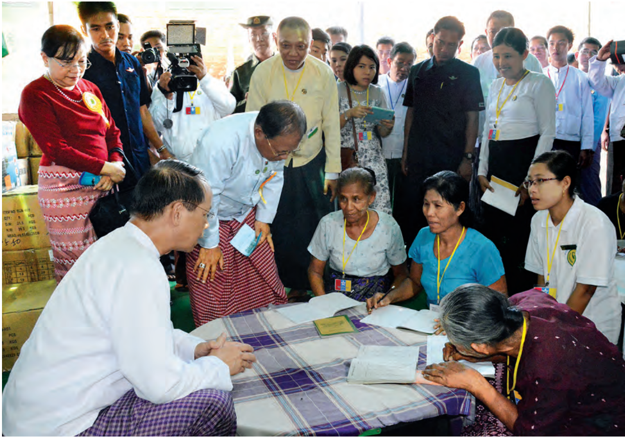
ဒုတိယသမ္မတ ဒေါက်တာစိုင်းမောက်ခမ်း အခြေခံစာတတ်မြောက်ရေးလုပ်ငန်းအဖွဲ့ဝင်များနှင့် ပညာပေးပြခန်းများနှင့် စာဖတ်ပိုင်းများအား ကြည့်ရှုအားပေးစဉ်။ (သတင်းစဉ်)

အခြေခံစာတတ်မြောက်ရေးဆိုသည်မှာ အခြေခံဖြစ်သည့်အရေး၊ အဖတ်၊ အတွက် သို့မဟုတ် အများသိထားကြသည့် “အ” သုံးလုံးကြောစာသင်ကြားရေးလုပ်ငန်းကို ဆိုလိုခြင်းဖြစ်ပါကြောင်း၊ စာတတ်သူများစာများများဖတ်ပါက ဗဟုသုတများတိုးပွားပြီး ရှေ့ရေးကို ပို၍မြင်နိုင်ကြောင်းနှင့်အတူ မိမိတစ်ဦးချင်း အတွက်ရော၊ မိသားစုအတွက်ပါ၊ မိမိဒေသအတွက်ရော စီးပွားရေး၊ လူမှုရေး၊ အုပ်ချုပ်ရေးစသည့် ဖွံ့ဖြိုးရေးကိစ္စရပ်များစွာကို အထောက်အကူ ရစေနိုင်မည်ဖြစ်ပါကြောင်း။ ထို့ပြင် တိုင်းပြည်နှင့်ယှဉ်ကြည့်