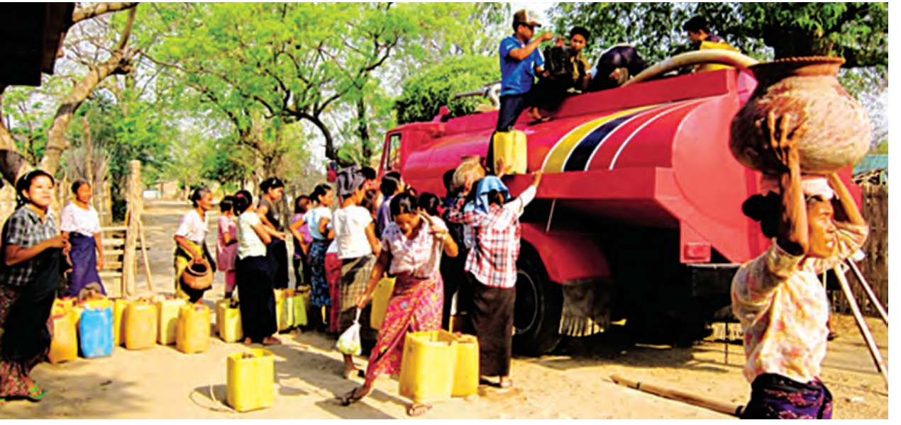
ငယ်နီး၍ သောက်ရေအခက်အခဲ ရွာ၊ မြေဖြူကျင်း၊ သောက်ကတ စသည့် ကျေးရွာများသို့ ရေသွားရောက် လှူဒါန်းကြလျက်ရှိပြီး ဝေးလံသော သူမှာ နည်းပါးကြောင်း သိရသည်။ ကျေးရွာများသို့ သွားရောက်လှူဒါန်း အိမ်နီးချင်း(ရေကြီး)

ပင်ကန်၊ ကွမ်းသီးကန်၊ ငွေးပင်ယာရွာ၊ သောက်ကတ၊ မြေဖြူကျင်း၊ ရွာသာအေး၊ ထန်းပင်ချောင်းစသည့် ကျေးရွာများသည် နွေရာသီတွင် နှစ်စဉ် နှစ်တိုင်း သောက်သုံးရေ ရှားပါးသည့် ကျေးရွာများဖြစ်ကြသဖြင့် ရေကြီးမြို့နယ်မှ ရေအလှူရှင်များက နှစ်စဉ် နှစ်တိုင်း အဆိုပါ ကျေးရွာများနေပြည်သူများအတွက် သောက်သုံးရေ သွားရောက် လှူဒါန်းကြလေ့ရှိသည်။ ယခုနှစ်တွင် ထိုကဲ့သို့ သောက်သုံးရေ သွားရောက်လှူဒါန်းလိုသူများ အဆင်ပြေလွယ်ကူစေရန်နှင့် ရေရှားပါးသော ကျေးရွာနေပြည်သူများ သောက်ရေရရှိနိုင်ကြရန် ရေကြီးမြို့နယ် မီးသတ်ဦးစီးဌာနမှ ရေဂါလန် ၁၆၀၀ ဆုံ ဟီးနီးမီးသတ်ရေယာဉ်ကို အခမဲ့ ကူညီပေးလျက်ရှိသည်ဟု သိရသည်။ ယခုနှစ်နှေရာသီတွင် ရေအလှူရှင်များသည် ရေကြီးမြို့နှင့် အနည်း