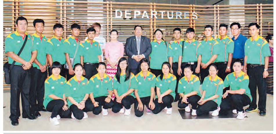
မြန်မာပြားပစ်အဖွဲ့ ကိုရီးယားသမ္မတနိုင်ငံသို့ မထွက်ခွာမီရန်ကုန်အပြည်ပြည်ဆိုင်ရာလေဆိပ်၌ တွေ့ရစဉ်။