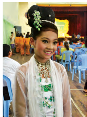
မမေသက်ခိုင် အက (ကယားပြည်နယ်)

အသက်ရှိ လှုပ်ရှားကပြနေသူများအဖြစ် ထင်မြင်လာအောင် ဇော်ဂျီရုပ်နှင့် မင်းသားရုပ်များကို ကြိုးဆွဲကပြနိုင်ကြသည်။ ကြိုးမရှုပ်အောင်၊ ကြိုးမကျအောင်နှင့် အရုပ်ကြိုးမပြတ်အောင် ပိုင်ပိုင်နိုင်နိုင်ကြိုးဆွဲပြသနိုင်သူများဖြစ်သည်။ “ ရုပ်သေးကြိုးဆွဲရတာ ဝါသနာ