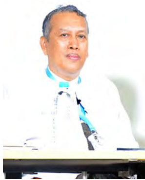
ဦးလှမောင်ရွှေ

ငြိမ်းချမ်းရေးနှင့် အမျိုးသား ပြန်လည်သင့်မြတ်ရေးဆိုင်ရာ ဆွေးနွေးပွဲ တွင် မတူညီသည့်ကဏ္ဍများမှ တက်ရောက်လာကြသည့် တိုင်းရင်းသား လက်နက်ကိုင်အဖွဲ့အစည်းများ၊ နိုင်ငံရေးပါတီများ၊ တိုင်းရင်းသားရေးရာ ဝန်ကြီးများ၏ အမြင်သဘောထားကို မြန်မာ့သတင်းစဉ်(ပြည်တွင်း)က တွေ့ဆုံမေးမြန်းခဲ့သည်များကို ရေးသားတင်ပြလိုက်ရပါသည်။