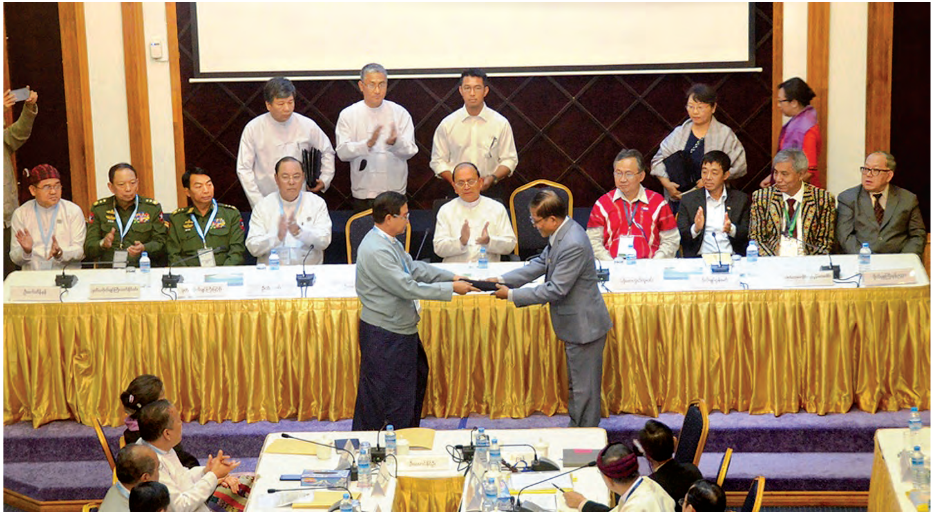
ယခုနှစ် မတ် ၃၁ ရက်က UPWC နှင့် NCCT တို့ NCA မူကြမ်း လက်မှတ်ရေးထိုးပြီး လဲလှယ်စဉ်။

ရန်ကုန် မေ ၁၀ တစ်နိုင်ငံလုံး အပစ်အခတ်ရပ်စဲရေးဆိုင်ရာ ညှိနှိုင်းရေးအဖွဲ့ (NCCT) အဖွဲ့ဝင် လက်နက်ကိုင်အဖွဲ့များ၏ ခေါင်းဆောင်များနှင့် အဖွဲ့ဝင်မဟုတ်သည့် လက်နက်ကိုင် အဖွဲ့အစည်းများပါ ပါဝင်သည့် တိုင်းရင်းသားညီလာခံအား