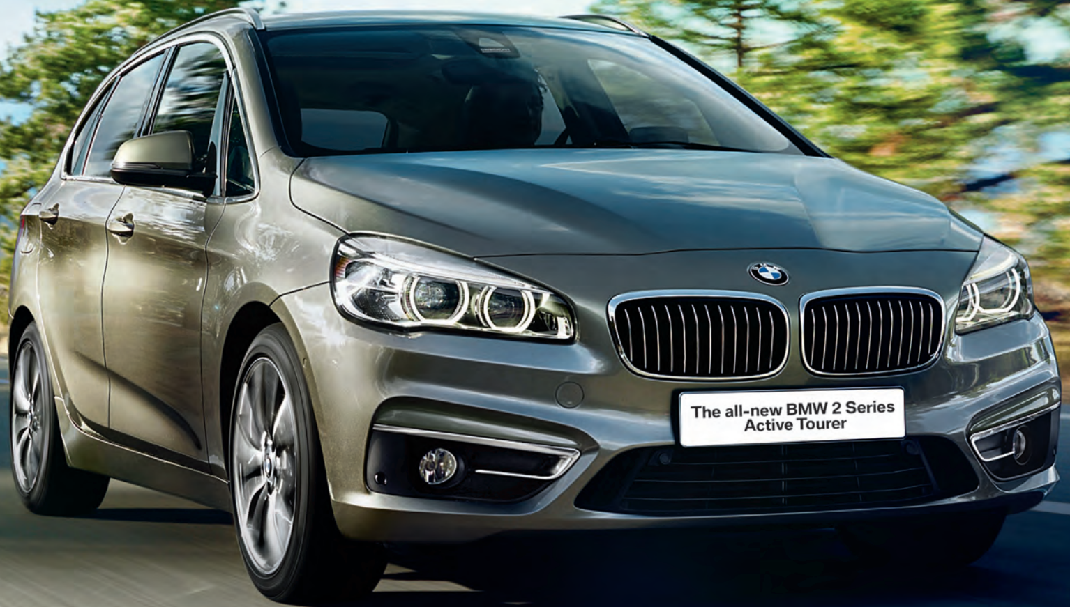
The all-new BMW 2 Series Active Tourer

BMW EfficientDynamics Less consumption. More driving pleasure.