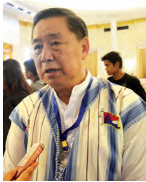
ဦးစောထွန်းအောင်မြင့်