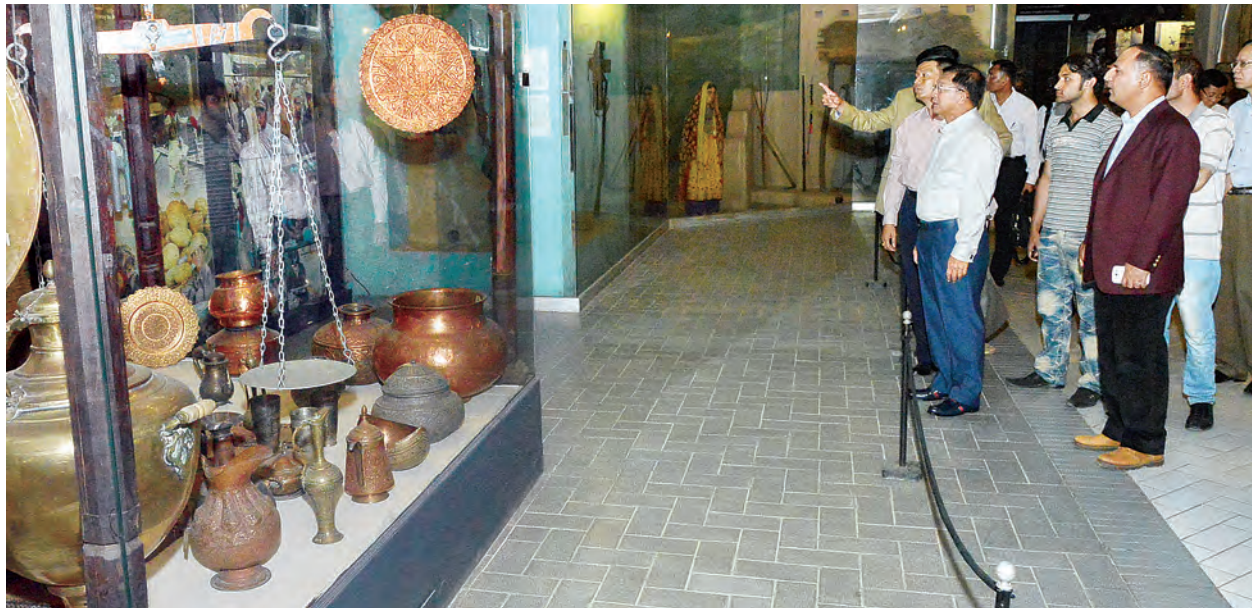
နေပြည်တော် မေ ၁၀

ပါကစ္စတန်နိုင်ငံတွင် ချစ်ကြည်ရေးခရီးရောက်ရှိနေသော တပ်မတော် ကာကွယ်ရေးဦးစီးချုပ် ပိုလ်ချုပ်မှူးကြီးမင်းအောင်လှိုင်နှင့်အဖွဲ့သည် မေ ၉ ရက် ဒေသစံတော်ချိန် ညနေ ၄ နာရီခွဲတွင် အစ္စလာမာဘတ်မြို့ရှိ Lok Virsa National Heritage Museum သို့ရောက်ရှိကြပြီး ပြတိုက်အတွင်း လှည့်လည်ကြည့်ရှုလေ့လာကြသည်။