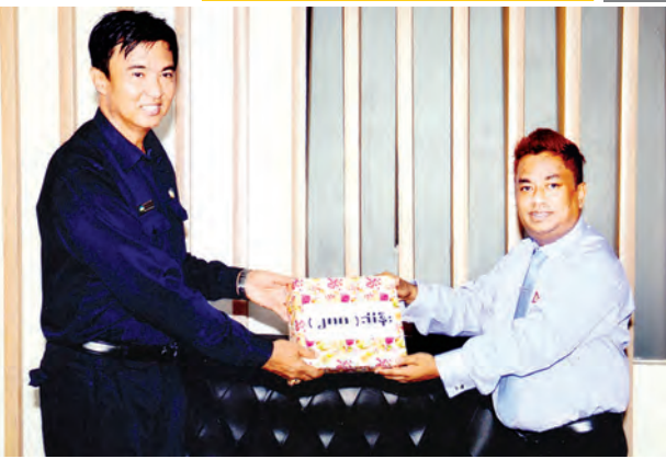
မြန်မာ့လက်ရွေးစင် အမျိုးသားဟော်ကီအသင်း အောင်မြင်မှုရရှိရေးအလှူငွေပေးအပ်

နိုင်ရေးအတွက် မြန်မာနိုင်ငံပြားပစ်အဖွဲ့သည် နိုင်ငံဂုဏ်ဆောင် အားကစားသမားများနှင့်အတူ အလားအလာကောင်းသော လူငယ်မျိုးဆက်သစ် မြားပစ်အားကစားသမားများကိုလည်း ကိုရီးယားပြားပစ် အားကစားအဖွဲ့နှင့် ပူးတွဲလေ့ကျင့်ရန် ခေါ်ဆောင်သွားမည် ဖြစ်သည်။ အဆိုပါ မြန်မာအားကစားအဖွဲ့သည် မေ ၈ ရက်မှ ဇွန် ၃ ရက်အထိကိုရီးယားသမ္မတနိုင်ငံ ဂါဝန်ဒိုပြည်နယ်တွင် အတူပူးတွဲ လေ့ကျင့်မှုများ ပြုလုပ်သွားမည်ဖြစ်သည်။