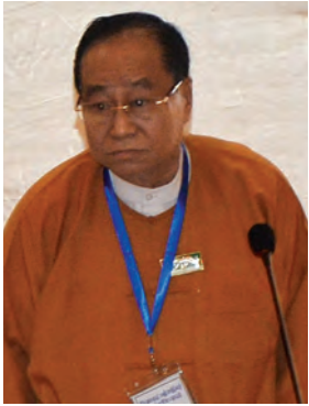
ဦးစိုင်းအိုက်ပေါင်း

နိုင်ငံတော်သမ္မတဦးသိန်းစိန်သည် ၂၀၁၅ခုနှစ် ဖေဖော်ဝါရီ ၁၂ ရက်တွင် ငြိမ်းချမ်းရေးနှင့် အမျိုးသားပြန်လည်သင့်မြတ်ရေးအတွက် ကတိပြုလက်မှတ် ရေးထိုးခဲ့သည်။ အဆိုပါ ငြိမ်းချမ်းရေးနှင့် အမျိုးသားပြန်လည်သင့်မြတ်ရေး ကတိကဝတ် (Deed of Commitment) တွင်ပါရှိသည့် အချက်များကို အမြန်ဆုံးအကောင်အထည်ဖော်ဆောင်ရွက်နိုင်ရေးအတွက် လိုအပ်သည့် ကြိုတင်ပြင်ဆင်မှုများကို လုပ်ဆောင်နိုင်ရန် အဖွဲ့အစည်းစုံစပ်ပါဝင်သော “ငြိမ်းချမ်းရေးနှင့် အမျိုးသားပြန်လည်သင့်မြတ်ရေးဆိုင်ရာ ညှိနှိုင်းအဖွဲ့” (Coordination Team for Peace and National Reconciliation) ကို ဖွဲ့စည်းရန် မေ ၉ ရက်က ရန်ကုန်မြို့ အင်းယားလိတ်ဟိုတယ်၌ ပြုလုပ်သည့် ဆွေးနွေးပွဲတွင် မူအားဖြင့် သဘောတူညီမှုရရှိခဲ့သည်။