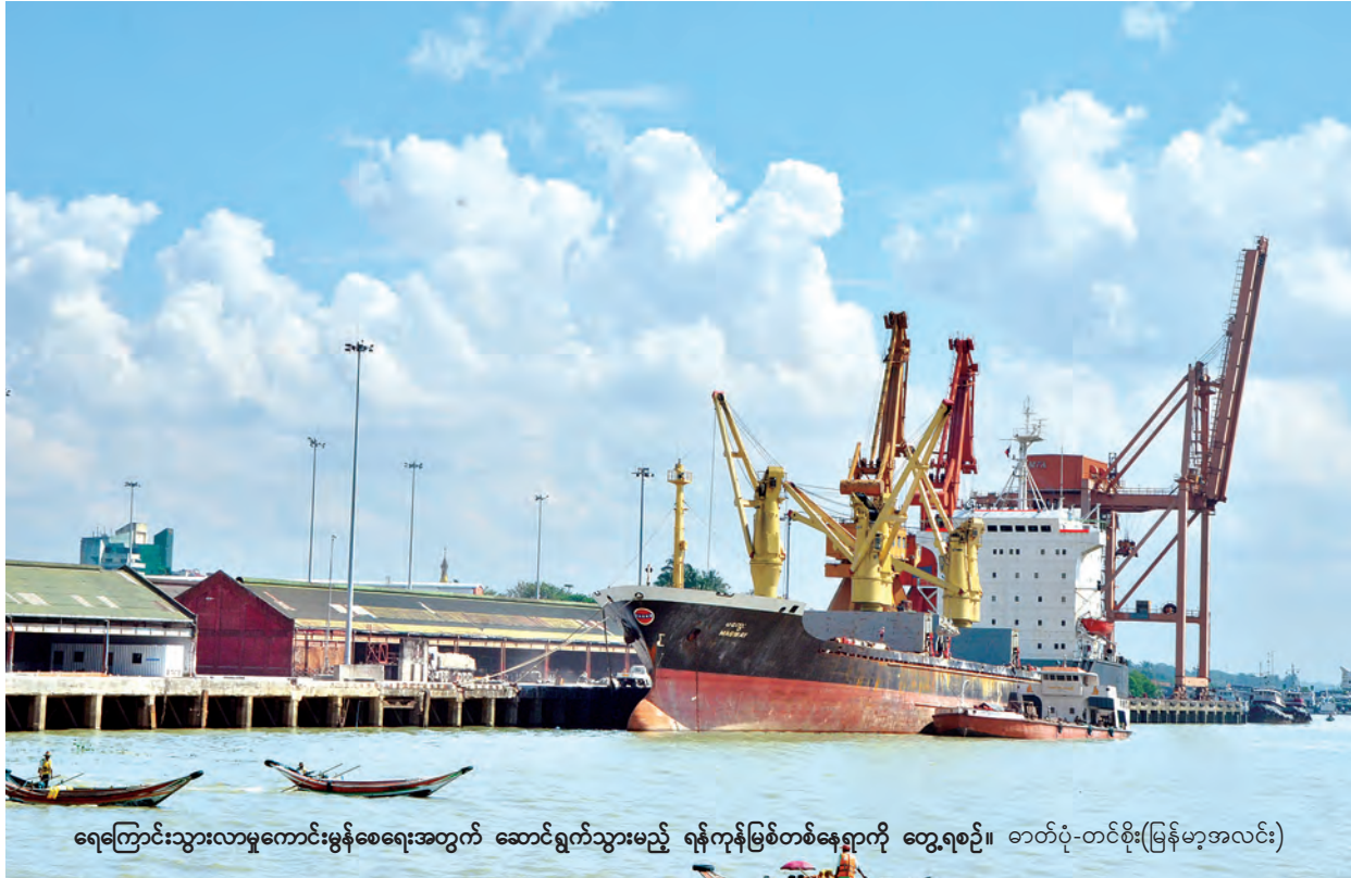
ရေကြောင်းသွားလာမှုကောင်းမွန်ရေးအတွက် ဆောင်ရွက်သွားမည့် ရန်ကုန်မြစ်တစ်နေရာကို တွေ့ရစဉ်။