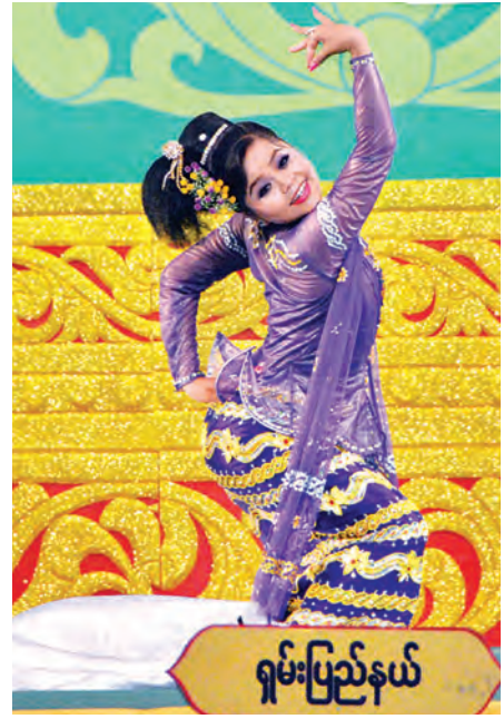
အခြေခံပညာ (၁၅-၂၀) အမျိုးသမီး အကပြိုင်ပွဲတွင် ရှမ်းပြည်နယ်မှ မလွင်ထက်ထက်အောင် ယှဉ်ပြိုင်စဉ်။

ရှမ်းပြည်နယ်၊ စစ်ကိုင်းတိုင်းဒေသကြီး၊ မကွေးတိုင်းဒေသကြီး၊ ရန်ကုန်တိုင်းဒေသကြီးနှင့် ဧရာဝတီတိုင်းဒေသကြီးတို့မှ ပြိုင်ပွဲဝင်များ ပါဝင်ဆင်နွှဲကြသည်။ ပြိုင်ပွဲဝင်တိုင်း အသံအနိမ့်အမြင့်၊ စည်းဝါးအဝင် အထွက်၊ မှန်ကန်ကောင်းမွန်ကြသည်ကို နားဆင်ကြရသည်။ ဆက်လက်ပြီး မဟာဂီတအခြေခံပညာ(၁၀-၁၅) (ကျား) အဆိုပြိုင်ပွဲတွင် ကချင်၊ ကရင်၊ ချင်း၊ မွန်၊ ရခိုင်၊ ရှမ်း၊ စစ်ကိုင်း၊