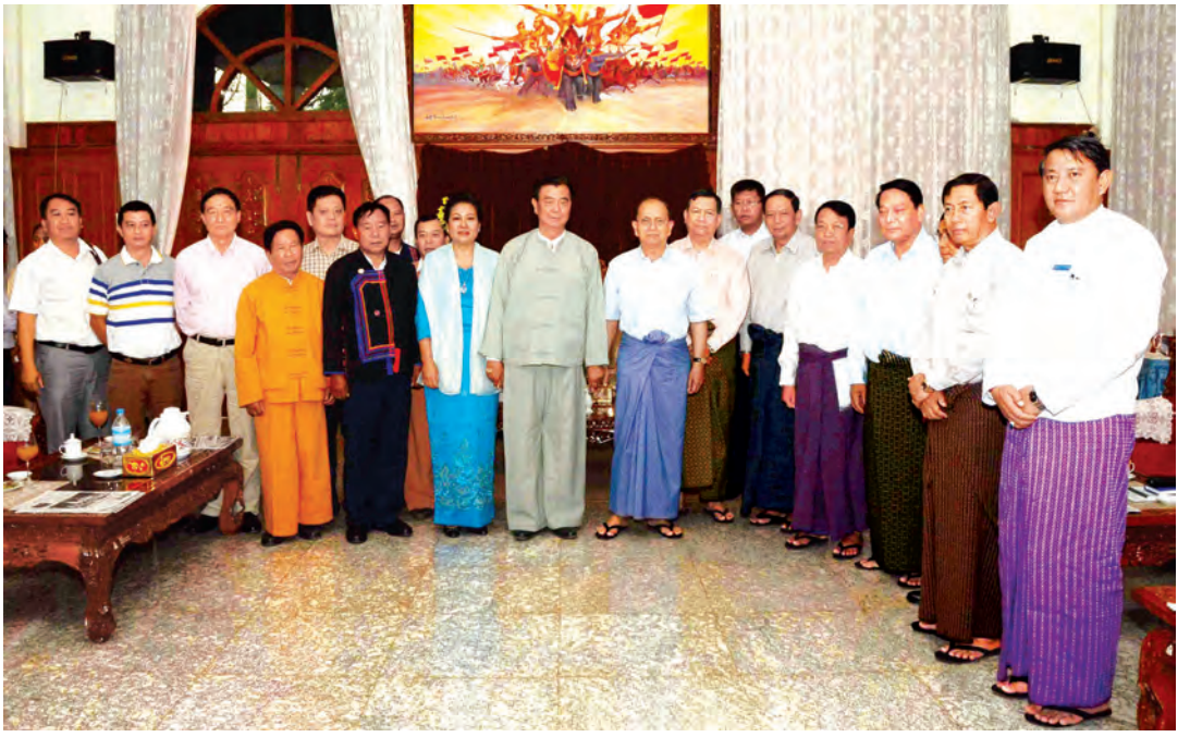
နိုင်ငံတော်သမ္မတ ဦးသိန်းစိန် မိုင်းလားအထူးဒေသ(၄)ဥက္ကဋ္ဌ ဦးစိုင်းလင်းအား ရင်းရင်းနှီးနှီး နှုတ်ဆက်စဉ်။