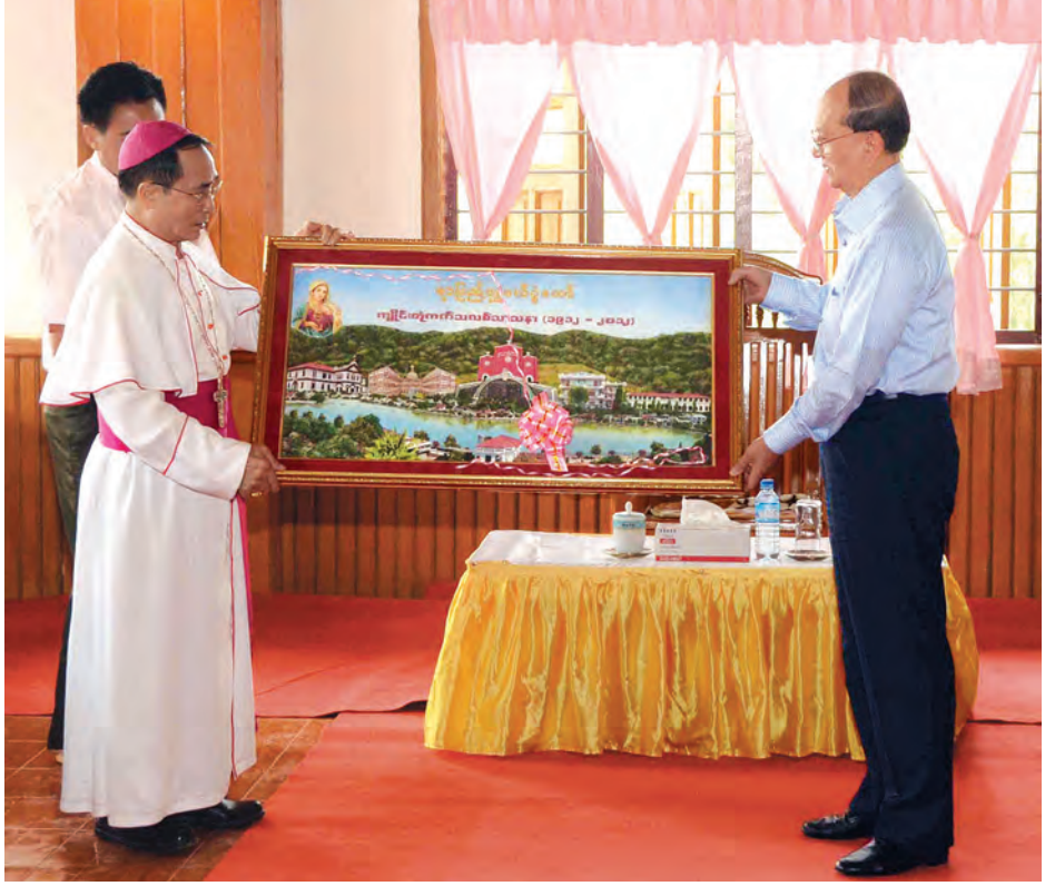
နိုင်ငံတော်သမ္မတ ဦးသိန်းစိန်အား ကျိုင်းတုံကက်သလစ်သာသနာ့ ဝိုင်းအုပ်ဆရာတော်က အမှတ်တရ လက်ဆောင်ပေးအပ်စဉ်။

ကြောင်း၊ ထိုသို့ဆောင်ရွက်နိုင်သည့် အတွက် မိမိတို့နှင့်တစ်ချိန်တည်းနီးပါး ဒီမိုကရေစီအသွင် ကူးပြောင်းရေးကို ဆောင်ရွက်ခဲ့သည့် အရှေ့အလယ် ပိုင်းနိုင်ငံများ၌ စစ်ပွဲများ၊ ပဋိပက္ခများ နှင့် ကြုံတွေ့နေရပြီး နိုင်ငံများပြိုကွဲ လုနီးပါး ဖြစ်နေချိန်တွင် မြန်မာနိုင်ငံ ၌ အသွင်ကူးပြောင်းရေးလုပ်ငန်းစဉ် များကို ညင်သာချောမွေ့စွာ ဆောင် ရွက်နိုင်ခဲ့ပါကြောင်း။ မိမိတို့အစိုးရ တာဝန်ယူပြီး နောက်ပိုင်း နိုင်ငံရေး၊ စီးပွားရေး၊ အုပ်ချုပ်ရေးနှင့် ပုဂ္ဂလိကကဏ္ဍ မြှင့် တင်ရေးတို့ကို ပြုပြင်ပြောင်းလဲမှုများ ဆောင်ရွက်ခဲ့ပါကြောင်း၊ နိုင်ငံရေး ပြုပြင်ပြောင်းလဲမှုတွင် နိုင်ငံရေးအဖွဲ့၊ အစည်းများ တည်ငြိမ်အေးချမ်းမှ ဖွံ့ဖြိုးရေးလုပ်ငန်းများကို ဆောင်ရွက် နိုင်မည်ဖြစ်သည်အတွက် နိုင်ငံသား တိုင်း ပါဝင်ခွင့်ရရှိရေးအတွက် ဆောင်ရွက်ပေးခဲ့ပါကြောင်း၊ ထို့