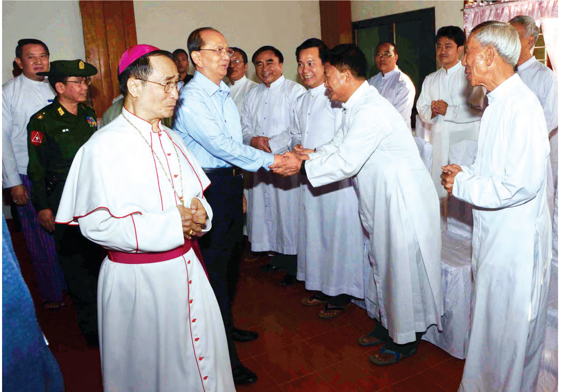
နိုင်ငံတော်သမ္မတ ဦးသိန်းစိန် ကျိုင်းတုံ ကက်သလစ်သာသနာ့ ဝိထိမ်းအုပ်စုတော် ဘီးရှောပီတာလွှဲစံကျာရူနှင့် သင်းအုပ်စုတော်များအား ရင်းရင်းနှီးနှီးနှုတ်ဆက်စဉ်။ သတင်း၊ စာမျက်နှာ-၃ (ဓာတ်ပုံ-ပြန်/ဆက်)

ပြည်သူလူထုအား ရွေးကောက်ပွဲဆိုင်ရာအသိပညာပေးရာတွင် ကော်မရှင်သာမက နိုင်ငံရေးပါတီများလည်း ပူးပေါင်းဆောင်ရွက်ပေးရန်လို စာမျက်နှာ-၅