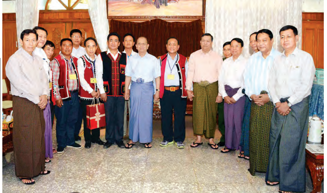
နိုင်ငံတော်သမ္မတ ဦးသိန်းစိန် 'ဝ'အထူးဒေသ(၂)မှ ဦးပေါက်ယူရီအား ရင်းရင်းနှီးနှီး နှုတ်ဆက်စဉ်။(အပေါ်ပုံ)နှင့် နိုင်ငံတော်သမ္မတ ဦးသိန်းစိန်နှင့် အဖွဲ့ဝင်များ 'ဝ'အထူးဒေသ(၂) မှ ဦးပေါက်ယူရီ ဦးဆောင်သည့် အဖွဲ့နှင့် စုပေါင်းမှတ်တမ်းတင် ဓာတ်ပုံရိုက်ကူးစဉ်။ (ယာပုံ)