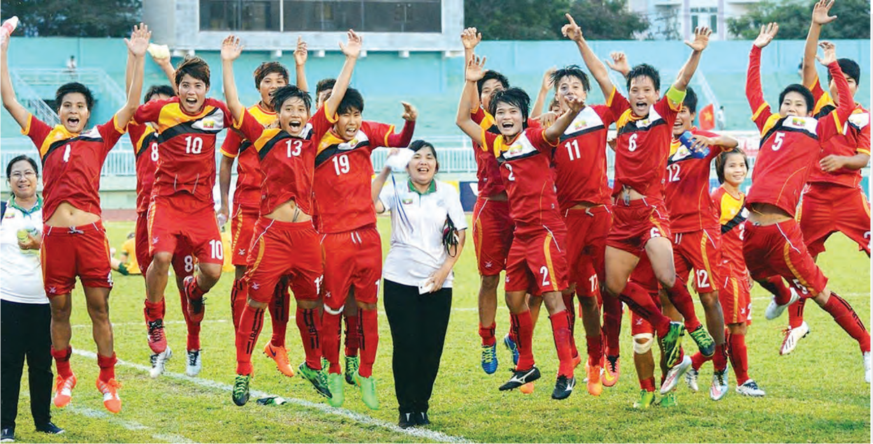
မြန်မာ အမျိုးသမီး ဘောလုံးအသင်း၊ ဩစတြေးလျ အသင်းကိုနိုင်ခဲ့ပြီး အောင်ပွဲခံနေစဉ်။