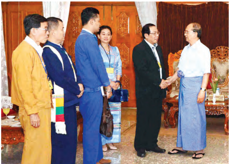
နိုင်ငံတော်သမ္မတ ဦးသိန်းစိန်နှင့် အဖွဲ့ဝင်များ ရှမ်းပြည်ဖြန့်လည်ထူထောင်ရေးကောင်စီ/ ရှမ်းပြည်တပ်မတော် (RCSS/SSA) ဥက္ကဋ္ဌ ဦးရွှက်ဆစ် ဦးဆောင်သောအဖွဲ့နှင့် စုပေါင်းမှတ်တမ်းတင် ဓာတ်ပုံရိုက်ကူးစဉ်။