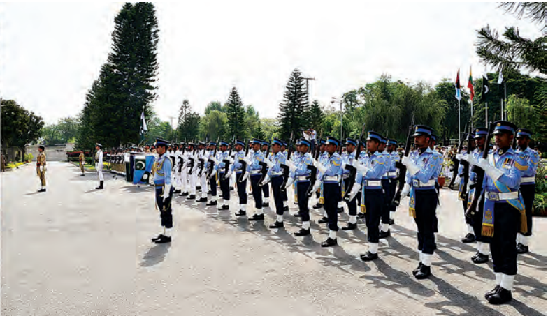
တပ်မတော်ကာကွယ်ရေးဦးစီးချုပ် ပိုလ်ချုပ်မှူးကြီး မင်းအောင်လှိုင်နှင့် ပါကစ္စတန်တပ်မတော် ပူးတွဲစစ်ဦးစီး ချုပ်များ ကော်မတီဥက္ကဋ္ဌတို့ ဂုဏ်ပြုတပ်ဖွဲ့၏ အလေးပြုခြင်းကို ခံယူကြစဉ်။