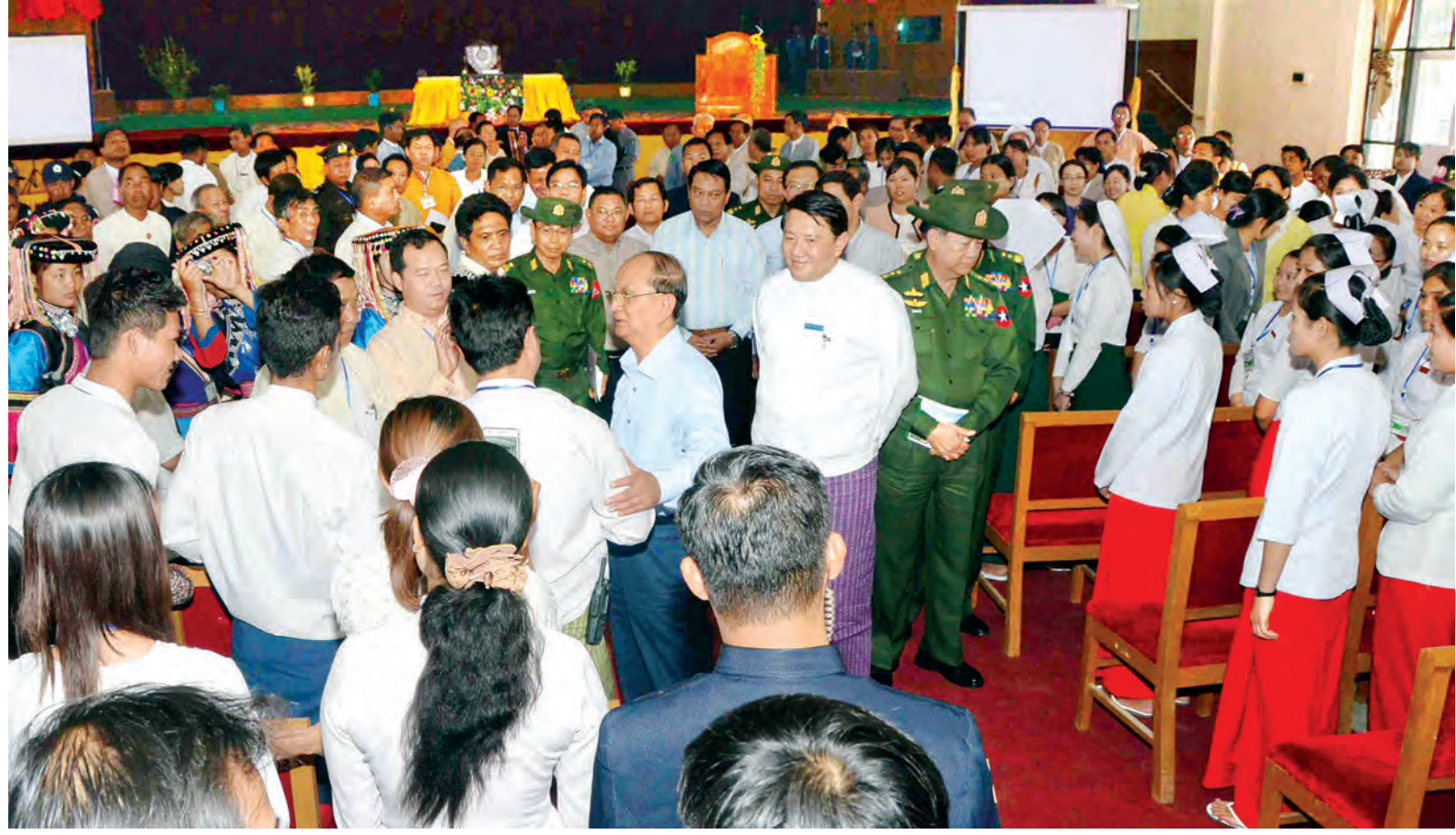
နိုင်ငံတော်သမ္မတ ဦးသိန်းစိန် ကျိုင်းတုံမြို့တော်ခန်းမ၌ ရှမ်းပြည်နယ်အစိုးရအဖွဲ့ဝင်ဝန်ကြီးများ၊ လွှတ်တော်ကိုယ်စားလှယ်များ၊ ဌာနဆိုင်ရာတာဝန်ရှိသူများ၊ ဝန်ထမ်းများ၊ မြို့မိမြို့ဖများ၊ ရုပ်မိရုပ်ဖများ၊ ဒေသခံပြည်သူများနှင့် ရင်းရင်းနှီးနှီးနှုတ်ဆက်စဉ်။

တပ်နယ် ခရစ်ယာန်အသင်းတော်များ အတွက် ဆန်အိတ် ၅၀၀၊ ဆီပိသာ ၅၀ နှင့် လက်ဆောင်ပစ္စည်းများကို ပေးအပ်ပြီးနောက် နိုင်ငံတော်သမ္မတ အား ကျိုင်းတုံကက်သလစ်သာသနာ့ ဝိုင်းအုပ်ဆရာတော်က အမှတ်တရ လက်ဆောင်ပေးအပ်ပြီး စုပေါင်း မှတ်တမ်းတင်ဓာတ်ပုံရိုက်ကြသည်။