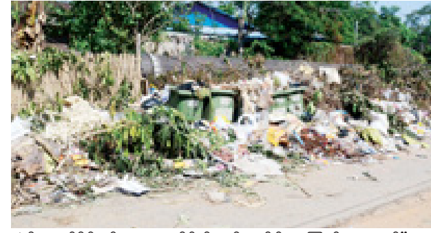
အဲဒီနောက်ပိုင်းနှင့် ယခုအချိန်ထိ အဲဒီအတိုင်း ကြည့်နေရတယ်” ဟု တော့ အမှိုက်ကားမလာလို့ ကျွန်တော် တို့လည်း မီးရှို့လို့လည်း မဖြစ်တော့ သည်။ မျိုးသန့် (အင်းစိန်)