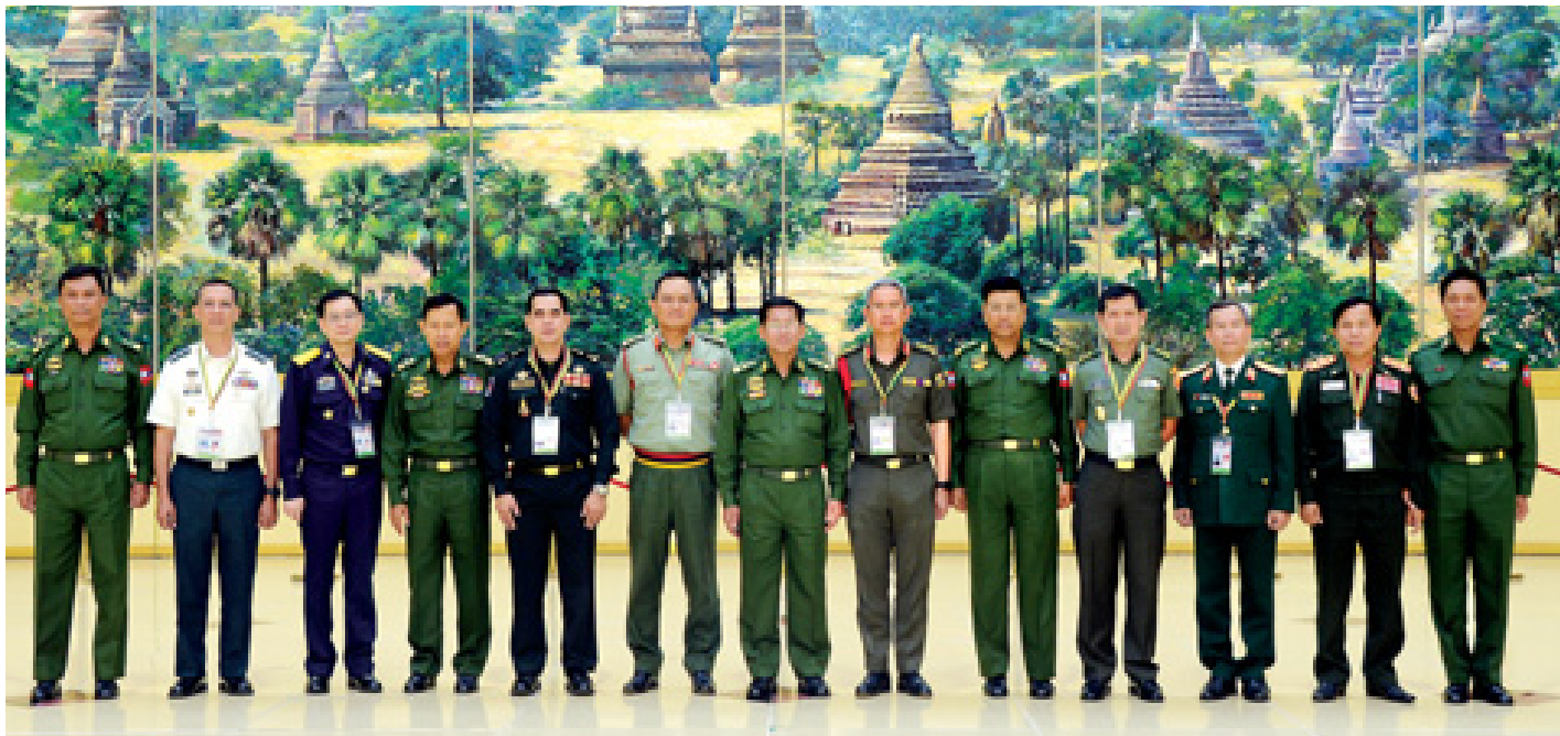
တပ်မတော်ကာကွယ်ရေးဦးစီးချုပ် ဗိုလ်ချုပ်မှူးကြီး မင်းအောင်လှိုင်နှင့်အဖွဲ့ အာဆီယံအဖွဲ့ဝင်နိုင်ငံများမှ ဆေးတပ်ဖွဲ့အကြီးအကဲများနှင့်အတူ စုပေါင်းမှတ်တမ်းတင်ဓာတ်ပုံရိုက်ကြစဉ်။

ထိုသို့တွေ့ဆုံရာတွင် တပ်မတော်ကာကွယ်ရေးဦးစီးချုပ်က အာဆီယံသည် ဒေသတွင်းစည်းလုံးညီညွတ်ပြီး တောင်တင်းခိုင်မာသည့် အသင်းကြီးဖြစ်ပါကြောင်း၊ လူဦးရေသန်း ၆၀၀ ကျော်ရှိပြီး စီးပွားရေးလည်း တောင်တင်းခိုင်မာကြောင်း၊ ထို့ကြောင့်လည်း နိုင်ငံတကာမှ အာဆီယံ၏ စည်းလုံးမှုစွမ်းအားကို အလေးထားပါကြောင်း၊