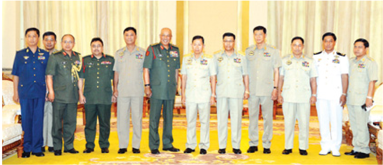
ဒုတိယတပ်မတော် ကာကွယ်ရေးဦးစီးချုပ် ကာကွယ်ရေး ဦးစီးချုပ်(ကြည်း)ဒုတိယ ဗိုလ်ချုပ်မှူးကြီး စိုးဝင်း၊ မလေးရှားတပ်မတော် ကြည်းတပ်ဦးစီးချုပ်တို့ နှစ်နိုင်ငံတပ်မတော်အရာရှိကြီးများနှင့်အတူ စုပေါင်းမှတ်တမ်းတင်ဓာတ်ပုံရိုက်စဉ်။ (မြဝတီ)

ကြည်းတပ်ဦးစီးချုပ်နှင့်အတူ မလေးရှားတပ်မတော်မှ အရာရှိကြီးများနှင့် မြန်မာနိုင်ငံဆိုင်ရာ မလေးရှားစစ်သံမှူး Colonel Mohd Yasin Bin Usop တို့ တက်ရောက်ကြသည်။ တွေ့ဆုံပွဲတွင် ယခုကဲ့သို့ တပ်မတော်အရာရှိကြီးများ အပြန်အလှန်ချစ်ကြည်ရေး လည်ပတ်ခြင်းကြောင့် နှစ်နိုင်ငံတပ်မတော်နှစ်ရပ်အကြား ရှိရင်းစွဲ ချစ်ကြည်ရင်းနှီးမှုကို ပိုမိုတိုးမြှင့် ဆောင်ရွက်နိုင်မှုအခြေအနေများ၊ မြန်မာနိုင်ငံ တပ်မတော်ဆေးတက္ကသိုလ်နှင့် မလေးရှားနိုင်ငံနိုင်ငံတော်ကာကွယ်ရေးတက္ကသိုလ်တို့ သုတေသနလုပ်ငန်းများ ပူးပေါင်းဆောင်ရွက်ရေးနှင့် အလုပ်ရုံဆွေးနွေးပွဲများ ပြုလုပ်ရေး၊ အခြားသော တပ်မတော်ဆိုင်ရာအလုပ်ရုံဆွေးနွေးပွဲများ အပြန်အလှန်ဆောင်ရွက်ရေးကိစ္စရပ်များ၊ အကြမ်းဖက်မှု ကာကွယ်တားဆီးနှိမ်နင်းနိုင်ရန် သတင်းအချက်အလက်များ၊ ပူးပေါင်းဖလှယ်ရေးဆိုင်ရာ ကိစ္စရပ်များနှင့် တပ်မတော်နှစ်ရပ်အကြား ရင်းနှီးမှုပိုမိုတိုးတက်ရန်အတွက် နယ်ပယ်အသီးသီးတွင် ထိတွေ့ ဆက်ဆံမှုတိုးမြှင့်ဆောင်ရွက်ရေးကိစ္စရပ်များအား ရင်းနှီးပွင့်လင်းစွာ ဆွေးနွေးကြသည်။ (မြဝတီ)