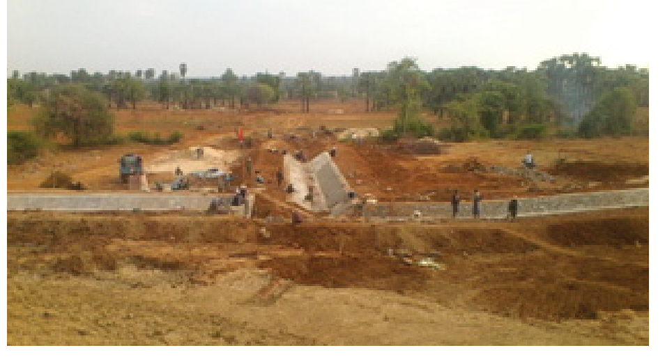
(မြန်မာ့အလင်း)