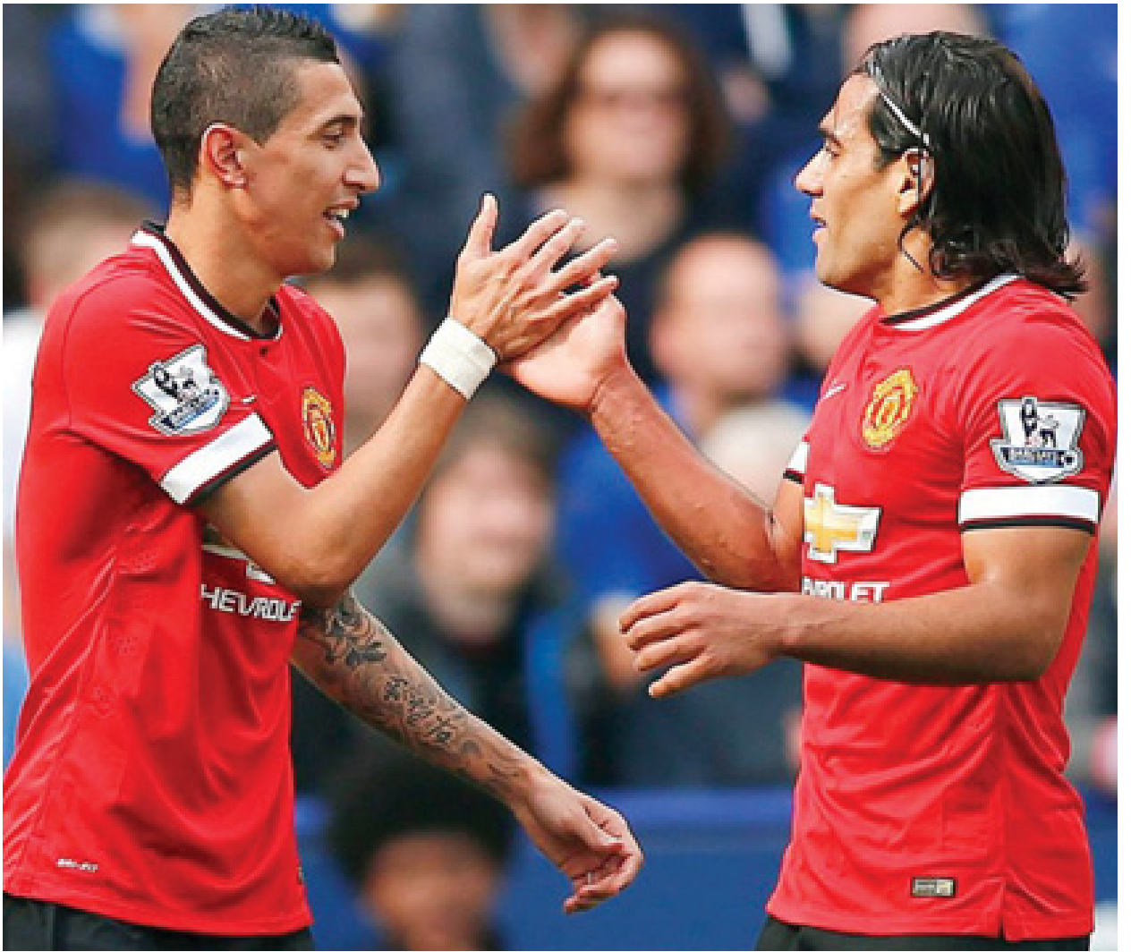
မှတ်ရရင်ပဲ ကျေနပ်ရမှာဖြစ်ပြီး ရလဒ်ကောင်းလို့ ယူဆရမယ့်ပွဲဖြစ်ပါတယ်။

ပထမအကျော့မှာ ရှစ်ဂိုးပြတ် သွင်းယူပြီး ဆန်းဒါးလန်ကို ချေမှုန်းထားတဲ့ ဆောက်သမ်တန်တို့ အခုပွဲမှာလည်း ဖိအားပေးကစားနိုင်ဖို့ ကြိုးစားဦးမှာ ဖြစ်ပါတယ်။ ခြေစွမ်း ကျဆင်းနေတဲ့ ဆန်းဒါးလန်တို့အတွက် အခုပွဲမှာ တစ်