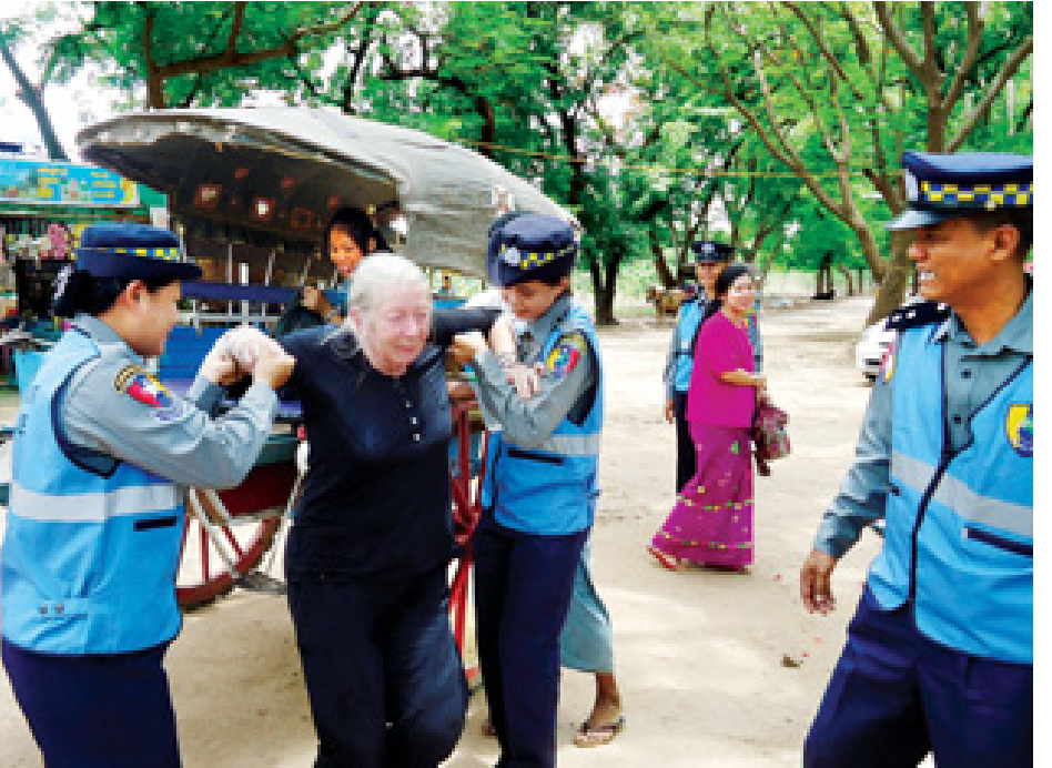
သတင်းဆောင်းပါး-ဇူလိုင်မိုး(မြန်မာ့အလင်း)၊ ဓာတ်ပုံ-အိန်ထက်မျိုး

ဖြင့် နိုင်ငံခြားဧည့်သည်များ ပိုက်ဆံအိတ်များပျောက်ခြင်း၊ ပစ္စည်းများပျောက်ခြင်းကိုလည်း စုံစမ်းဖော်ထုတ်၍ ပြန်လည်အပ်နှံခြင်းများ ဆောင်ရွက်ပေးနိုင်ခဲ့သည်။ ထို့နောက် သက်ဆိုင်ရာသုံးရုံးများနှင့် ဆက်သွယ်ပြီး လူမှုရေး၊ ကျန်းမာရေးကိစ္စများကိုလည်း ဆောင်ရွက်ပေးလျက်ရှိသည်။ ထို့အပြင် အခက်အခဲရှိလို့ လိုအပ်လာသည်ဆိုပါက ကမ္ဘာလှည့်ခရီးသွားလုပ်ငန်းလုံခြုံရေးရဲတပ်ဖွဲ့၊ များရုံးနှင့် အခြားဒေသတပ်ဖွဲ့စုများ၏ ဖုန်းနံပါတ်များကို ဧည့်လမ်းညွှန်နှင့် ဟိုတယ်များတွင်ပေးထားပြီး နိုင်ငံခြားဧည့်သည်များလိုအပ်သည်များကို ကူညီဆောင်ရွက်မှုများ