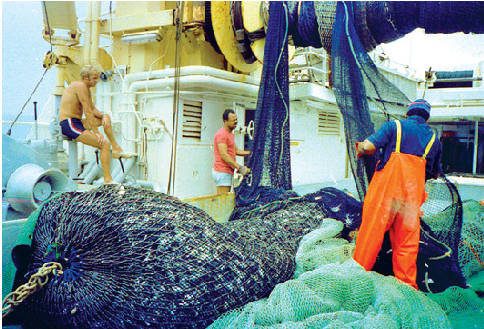
မြန်မာနိုင်ငံသို့ ၂၀၁၃ခုနှစ်က Dr.Fridtjof Nansen ငါးဖမ်းသင်္ဘောရောက်ရှိ သုတေသနပြုလုပ်ခဲ့စဉ်။

သတင်း မောင်စိန်လွင်(မြန်မာ့အလင်း) ရန်ကုန် ဧပြီ ၂၉ မြန်မာ့ပင်လယ်ပြင်တွင် ငါးသယံဇာတများ တည်ရှိမှုကို သုတေသနပြုလုပ်ရန် ဧပြီ ၂၇ ရက်က ရောက်ရှိနေသော နော်ဝေနိုင်ငံမှ ငါးသုတေသနသင်္ဘော Dr.Fridtjof Nansen ၏ သုတေသနရလဒ်များသည် မြန်မာနိုင်ငံ၏ ငါးသယံဇာတထိန်းသိမ်းမှုကို အထောက်အကူ ဖြစ်လာလိမ့်မည်ဖြစ်ကြောင်း မြန်မာနိုင်ငံ ငါးလုပ်ငန်းအဖွဲ့ချုပ်၏ အလုပ်အမှုဆောင်ချုပ် ဦးဟန်ထွန်းက ပြောကြားသည်။ အဆိုပါ နော်ဝေငါးသုတေသနသင်္ဘောသည် ၁၉၇၉ ခုနှစ် နိုဝင်ဘာလနှင့်ဒီဇင်ဘာလ (မိုးလွန်ကာလ) တွင် မြန်မာနိုင်ငံသို့ ပထမဦးဆုံး ရောက်ရှိ သုတေသနပြုလုပ်ခဲ့ပြီး နောက် ၁၉၈၀ပြည့်နှစ် မတ်လနှင့် ဧပြီ (မိုးကြိုကာလ)တို့တွင် ပြန်လည် ရောက်ရှိကာ မြန်မာနိုင်ငံ၏ ငါးသယံဇာတ သုတေသနလုပ်ငန်းများကို မိုးကြိုမိုးနှောင်းကာလနှစ်ခု ပေါင်းစပ်ကာ တစ်ကြိမ်ပြုလုပ်ခဲ့ပြီး ဖြစ်သည်။ ယင်းပြုလုပ်ခဲ့စဉ်က ရေပေါ်ငါးသယံဇာတ တန်ချိန် တစ်သန်းရှိခဲ့ပြီး ရေအောက်ငါးသယံဇာတ တန်ချိန် ၇၅၀၀၀ စုစုပေါင်း စာမျက်နှာ ၇ ကော်လံ ၅ *