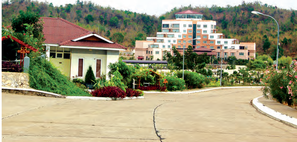
ဟန်ချက်ညီညီ ပူးပေါင်းဆောင်ရွက်မှ နေပြည်တော်ဟိုတယ်ငွေများ စည်ကားလာမည်။

နေပြည်တော်ဟိုတယ်ငွေများ သက်ဝင်စည်ကားစေရန် ဟိုတယ်လုပ်ငန်းရှင်များသာမက ခရီးသွား၊ ဘဏ်လုပ်ငန်း၊ လူဝင်မှုကြီးကြပ်ရေး၊ ပို့ဆောင်ဆက်သွယ်ရေး အစရှိသည့် သက်ဆိုင်ရာ ဝန်ကြီးဌာနများအနေဖြင့် ဟန်ချက်ညီညီ ပူးပေါင်းဆောင်ရွက်ခြင်းဖြင့် နေပြည်တော်ဟိုတယ်ငွေများသာမက မြန်မာ့ခရီးသွားလုပ်ငန်းပါ တိုးတက်လာမည်ဖြစ်သည်ဟု ယူဆမိကြောင်း ဟိုတယ် လုပ်ငန်းရှင်တစ်ဦးက အကြံပြုပြောကြားသည်။ (မြန်မာ့အလင်း)