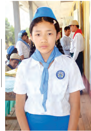
နန်းမွန်းဆိုင်

ဒီနေ့ ကင်းထောက်သင်တန်းမှာ ကျွန်မ တာဝန်ယူခဲ့ရတာကတော့ ကင်းထောက်ရဲ့ ဖွဲ့စည်းပုံရည်ရွယ် ချက်၊ ကတိသုံးပါး၊ ကျင့်ဝတ် ၁၀ ပါး