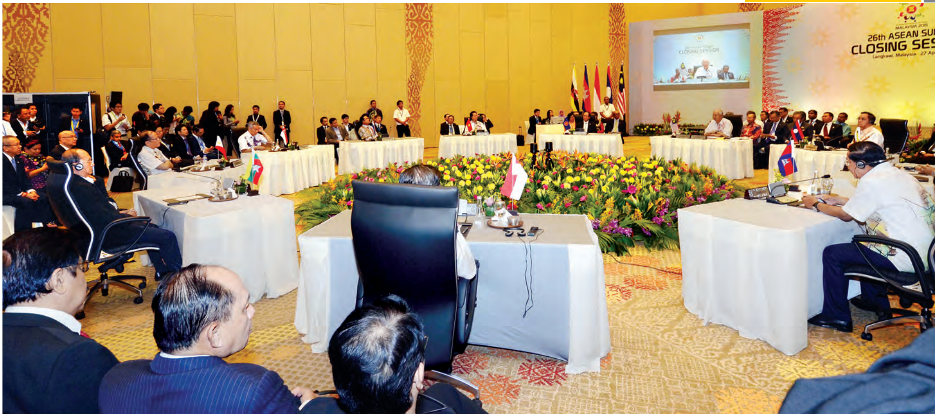
(၂၆) ကြိမ်မြောက် အာဆီယံထိပ်သီးအစည်းအဝေးပိတ်ပွဲအခမ်းအနား ကျင်းပစဉ်။