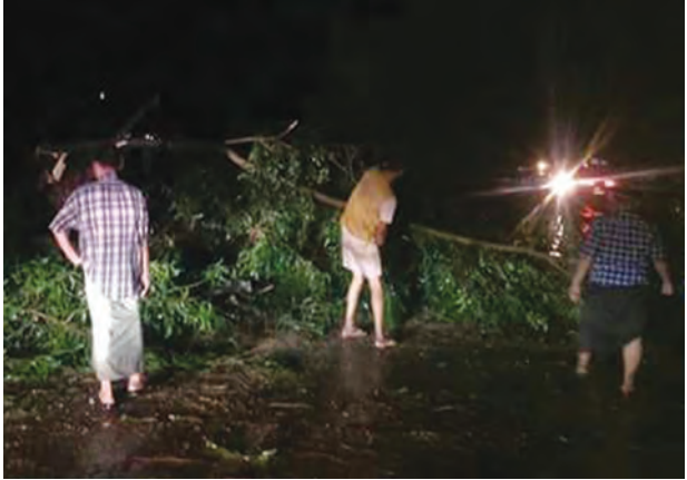
လဲပြိုနေသော သစ်ပင်များအား ညတွင်းချင်းရှင်းလင်းနေစဉ်။