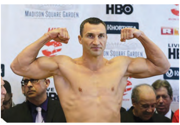
မှာ ဟဲဗီးဝိတ်ချန်ပီယံဘွဲ့ကို (၂၇) ကြိမ်တိုင်တိုင် ဆွတ်ခူးနိုင်ခဲ့တဲ့ ဂန္ထဝင်ဟဲဗီးဝိတ်ချန်ပီယံ လက်ဝှေ့

ယူကရိန်း ဟဲဗီးဝိတ်လက်ဝှေ့ ချန်ပီယံ ကလစ်ချ်ကိုဟာ ချန်ပီယံဘွဲ့ တွေကို ဆက်လက်ကာကွယ်ထားနိုင်ပါတယ်။ သူ့နဲ့ အမေရိကန်လက်ဝှေ့ သမား ဘရိုင်ယံဂျင်းနင်းတို့ဟာ စနေနေ့က အမေရိကန်နိုင်ငံ မစ်ဒီဆင်စကွဲဂါးဒင်းမှာ ထိုးသတ်ခဲ့ကြပါတယ်။ ဒီပွဲမှာ ကလစ်ချ်ကိုက အမှတ်နဲ့နိုင်ပြီး (၁၈)ကြိမ်မြောက် ဟဲဗီးဝိတ်ချန်ပီယံ ခါးပတ်ကို ကာကွယ်နိုင်ခဲ့ပါတယ်။ အသက် ၃၉ နှစ်အရွယ်ရှိပြီဖြစ်တဲ့ ကလစ်ချ်ကိုဟာ အသက်အရွယ် ရလာပေမယ့် ထိုးအားကျမသွားသေးပါဘူး။ အကောင်းဆုံးထိုးသတ်နိုင်တဲ့ ဟဲဗီးဝိတ်ချန်ပီယံအဖြစ်ရှိနေဆဲ ဖြစ်ပါတယ်။ သူဟာ လက်ဝှေ့သမား