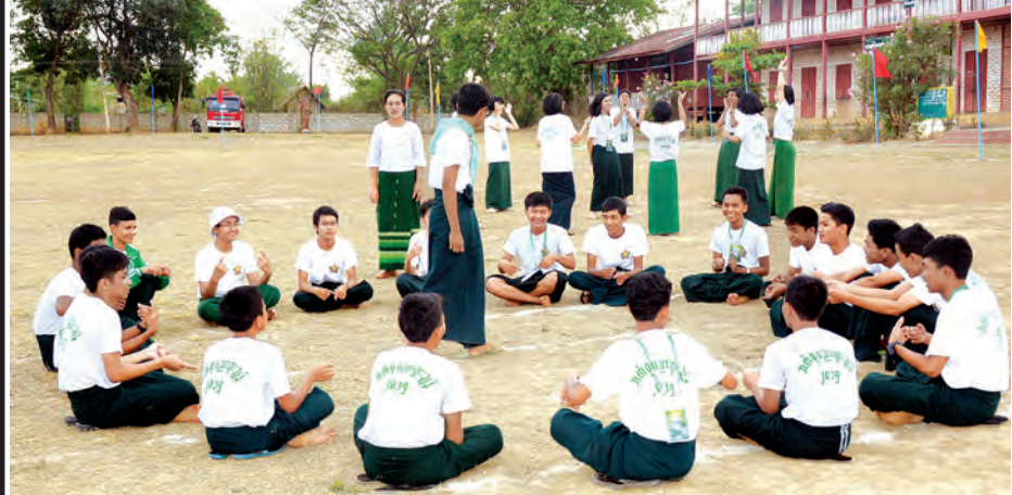
ဘက်စုံပညာထူးချွန်လူငယ်များ ကင်းထောက်သင်တန်း လက်ဖြင့်အချက်ပြနည်း လက်တွေ့သင်ယူနေစဉ်။

ကျောပေးပြီးနေမယ်။ ပြီးတော့ အတွင်းထဲမှာ အဖွဲ့ကရွေးထားတဲ့ ခေါင်းဆောင်က လှုပ်ရှားမှုတစ်ခုကို စလုပ်တာနဲ့ ကျန်တဲ့အဖွဲ့သားတွေ အားလုံးက လိုက်လုပ်မယ်။ အဲဒီလို စလုပ်တာနဲ့ ခေါင်းဆောင်ရွေးမယ့် သူက ဝင်ရှာလို့ရပြီ။ ဘယ်သူကစပြီး တော့ အမူအရာပြောင်းလဲသွားလဲ၊ အဲဒီ စပြောင်းသွားတဲ့သူက ခေါင်းဆောင်ပဲဆိုတာကို မျက်လုံးတွေ ကြည့်ပြီး အကဲခတ်ရမှာဖြစ်ပါတယ်။ အဲဒီလိုအကဲခတ်ပြီးတော့မှ အဲဒီလူ မျက်စိရဲ့ ဦးတည်ရာက ဘယ်သူလဲ၊ ဒါဆို ဒီလူဖြစ်နိုင်ခြေ ရှိ မရှိ၊