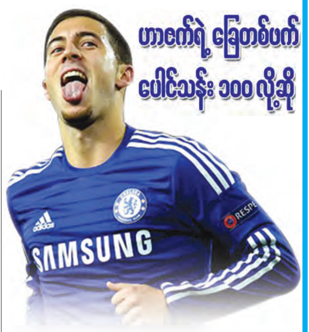
ဟာဇက်ရဲ့ ခြေတစ်ပက် ပေါင်သန်း ၁၀၀ လို့ဆို

ဒီနှစ် ပရီမီယာလိဂ်မှာတော့ ချယ်လီဆီးကစားသမား အိဒင်ဟာဇက်ကတော့ အတော်လေး ခြေစွမ်းပြကစားနေတဲ့ ကစားသမားဖြစ်ပါတယ်။ ဒီလို ခြေစွမ်းပြကစားနိုင်ခဲ့တဲ့အတွက် လာလီဂါထိပ်တန်းကလပ်တွေကလည်း မျက်စိကျလာပါတယ်။ ဘယ်လိုဂျီယံသား ဟာဇက်ကို လာလီဂါထိပ်သီးကလပ်တွေဖြစ်တဲ့ ဇီးရ်မက်ဒရစ်နဲ့ ဘာစီလိုနာတို့လို အသင်းကြီးတွေက ခေါ်ယူဖို့ ကမ်းလှမ်းလာတယ်လို့ ဆိုပါတယ်။ သို့ပေမယ့် ချယ်လီဆီးနည်းပြ မော်ရင်ညိုကတော့ သူ့ကို စတမ်းဖို့ဒ်ဘရစ်က ထွက်ခွာခွင့်ပေးမှာ မဟုတ်ပါဘူးလို့ ဆိုပါတယ်။ ဟာဇက်ကိုခေါ်ချင်ရင် ခြေတစ်ပက် ပေါင်သန်း ၁၀၀ ပေးမှရမယ်လို့ မပေးနိုင်တဲ့ဈေးကို မော်ရင်ဟိုက် ပြောဆိုလိုက်ပါတယ်။ ဟာဇက်ဟာ ပရီမီယာလိဂ် အကောင်းဆုံးဘောလုံးသမား ဆန်ခါတင်ရွေးချယ်ခံထားရတဲ့ ကစားသမားလည်း ဖြစ်ပါတယ်။ သူဟာ ဒီနှစ်ရာသီမှာ ချယ်လီဆီးအသင်းရဲ့ အဆုံးအဖြတ်ပေး အမှားစုကို သွင်းယူပေးနိုင်ခဲ့တဲ့ ကစားသမားဖြစ်ပါတယ်။ ချယ်လီဆီးအသင်းကို ဇယားထိပ်ရောက်အောင်လည်း အဓိက စွမ်းဆောင်ပေးခဲ့တဲ့ ကစားသမား ဖြစ်ပါတယ်။ ပြိုင်ပွဲအများဆုံးမှာ ဂိုးရအောင် သွင်းယူနိုင်တဲ့ စွမ်းရည်က သူ့ရဲ့ ထက်မြက်တဲ့စွမ်းရည်တစ်ခု ဖြစ်ပါတယ်။ ဒီအတွက်ကြောင့်လည်း သူ့ကို ဇီးရ်မက်ဒရစ်က ခေါ်ယူဖို့ကြိုးစားနေတာ ဖြစ်ပါတယ်။