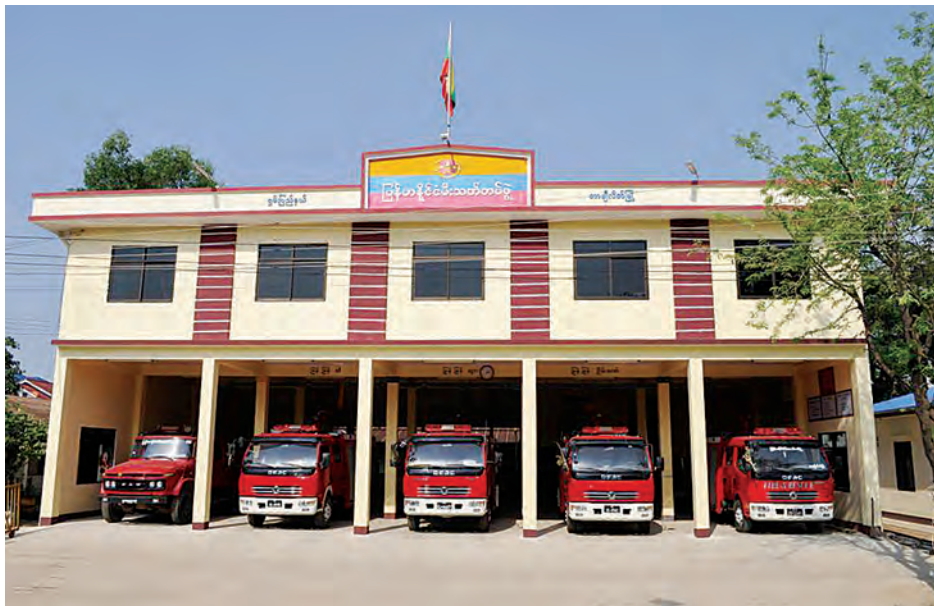
၁၉၉၆ ခုနှစ်တွင် ရဲသူရဘွဲ့ရတစ်ဦး၊ ရဲဗလသုံးဦး၊ ရဲကျော်စွာ နှစ်ဦး ချီးမြှောက်ခဲ့သည်။ စေတနာ့ဝန်ထမ်း မီးသတ်တပ်ဖွဲ့မှသည် သန္ဓေတပ်ဖွဲ့စခန်းဆီသို့ စေတနာအရင်းခံကာ အဆင့်ဆင့် တည်ထောင်ခဲ့သည့် တာချီလိတ်မြို့နယ် မီးသတ်တပ်ဖွဲ့စခန်း၏ ခန့်ညားထည်ဝါလှသော ငါးယူနစ်မီးသတ်စခန်းသစ်ကြီးကို မကြာမီ ကျရောက်တော့မည့် (၆၉) နှစ်မြောက် မီးသတ်တပ်ဖွဲ့နေ့တွင် စတင်ဖွင့်လှစ်တော့မည်ဖြစ်ကြောင်း သိရသည်။

တာချီလိတ် ဧပြီ ၂၇ တာချီလိတ်မြို့နယ် မီးသတ်တပ်ဖွဲ့စခန်းကို ၁၉၈၂ ခုနှစ်တွင် အရန်မီးသတ်တပ်ဖွဲ့အဖြစ် စတင်ဖွဲ့စည်းခဲ့သည်။ ယခုအခါ နိုင်ငံတော်အစိုးရ၏ အစီအမံဖြင့် ခေတ်မီ ငါး ယူနစ်မီးသတ်စခန်း အဆင့်သို့ တိုးမြှင့်လိုက်ပြီဖြစ်ကြောင်း သိရသည်။ ၂၀၁၄-၂၀၁၅ ဘဏ္ဍာနှစ်တွင် နိုင်ငံတော်အစိုးရ၏ ခွင့်ပြုချက်ဖြင့် ရှမ်းပြည်နယ်အစိုးရအဖွဲ့မှ ခွင့်ပြုရန်ပုံငွေဖြင့် (၆၅x၅x၂၆)ပေ ရှိ နှစ်ထပ် မီးသတ်အဆောက်အအုံကိုလည်းကောင်း၊ (၆၀x ၃၀x၁၂) ပေရှိ တစ်ထပ် (လူပျိုဆောင်) တို့ကို တည်ဆောက်ပေးခဲ့ကာ တပ်ဖွဲ့ဝင်အင်အား ၁၉ ဦး၊ မီးသတ်ယာဉ်ငါးစီးဖြင့် ငါးယူနစ်မီးသတ်တပ်ဖွဲ့စခန်းအဆင့်သို့ တိုးမြှင့်ပေးခဲ့ကြောင်း သိရသည်။ တာချီလိတ်မြို့နယ် မီးသတ်တပ်ဖွဲ့ဝင်များ၏ စွမ်းစွမ်းတမံဆောင်ရွက်ခဲ့မှုများကြောင့် နိုင်ငံတော်မှ