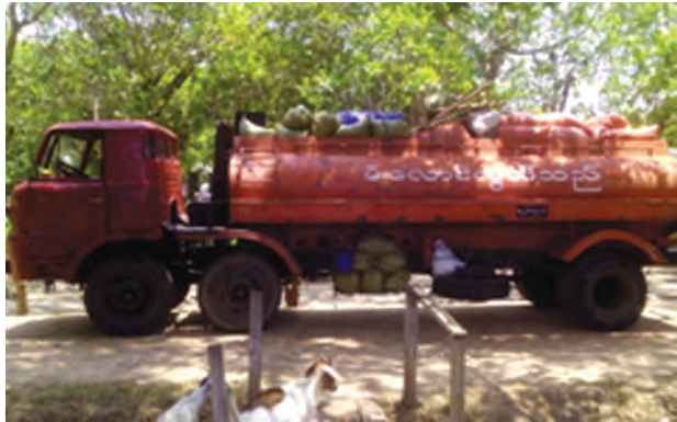
ယာဉ်တိုက်မှုဖြစ်ခဲ့သော ဆီဘောက်ဆာယာဉ်

ရေမှသွားနေသည့် စက်ဘီးကို ဆိုင်ကယ်နှင့်တိုက်မိ၍တိမ်းမှောက်သွားစဉ် ဆီသယ်ဘောက်ဆာယာဉ်က ထပ်မံတိုက်မိသော ယာဉ်တိုက်မှုတစ်ခု ဧပြီ ၂၅ ရက်က ဆွာမြို့၌ ဖြစ်ပွားခဲ့သည်။