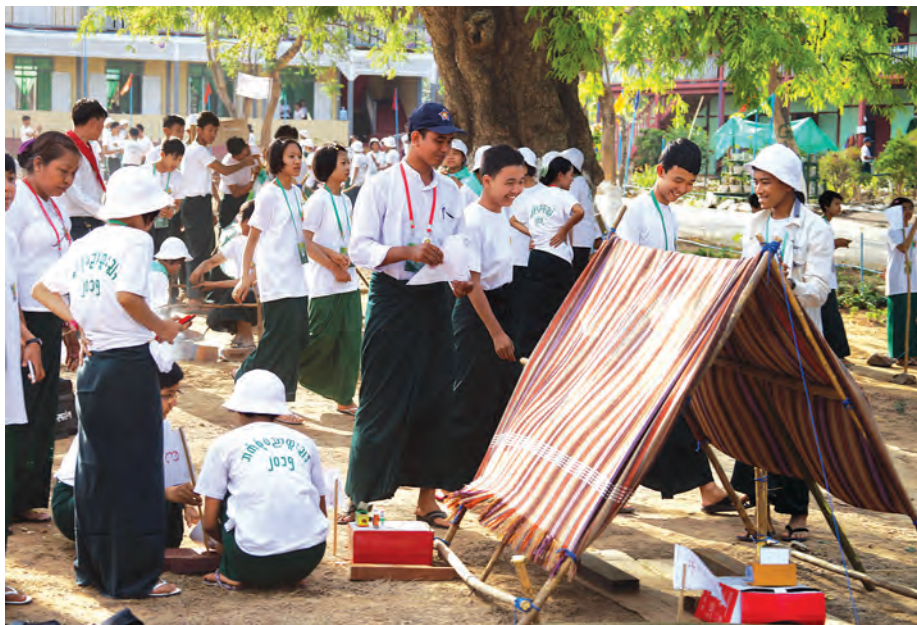
ဘက်စုံပညာထူးချွန်လူငယ်များ ကင်းထောက်သင်တန်း တဲထိုးနည်း လက်တွေ့လေ့ကျင့်နေမှုကို တွေ့ရစဉ်။

ခေါင်းဆောင်လားဆိုတာကို သွားမေးလိုက်မယ်။ မဟုတ်ဘူးဆိုရင် ဆက်ရွေးချယ်ရမယ်။ ဟုတ်တယ်ဆိုရင် ဒီခေါင်းဆောင်လုပ်တဲ့ သူက သူ့ကို ပြန်ပြီးတော့ အမှားမိသလို မိသွားတဲ့အတွက်ကြောင့် သူက ခေါင်းဆောင်ရွေးတဲ့သူ ပြန်ဖြစ်သွားပါမယ်”ဟု ကင်းထောက်ခေါင်းဆောင် ရွေးချယ်မှုကစားနည်းနှင့် ပတ်သက်ပြီး ကင်းထောက်သင်တန်းနည်းပြ တစ်ဦးဖြစ်သူ ဆရာအောင်ဇော်မင်းက ပြောသည်။ “အခုလို ကင်းထောက်ဆိုင်ရာ