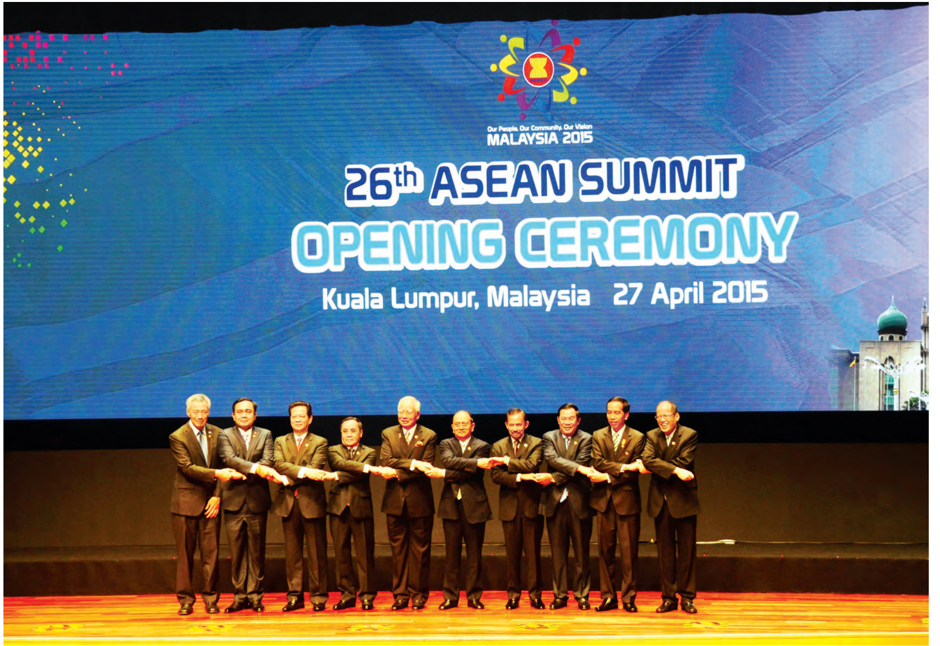
နိုင်ငံတော်သမ္မတ ဦးသိန်းစိန်နှင့်အတူ အာဆီယံနိုင်ငံများမှ နိုင်ငံ့ခေါင်းဆောင်များ (၂၆)ကြိမ်မြောက် အာဆီယံထိပ်သီးအစည်းအဝေး မကျင်းပမီ စုပေါင်းမှတ်တမ်းတင်ဓာတ်ပုံရိုက်စဉ်။ (သတင်း စာမျက်နှာ-၈)

ကမ္ဘာကြီးကို နျူကလီးယားအန္တရာယ် ကင်းဝေးစေရန် နယူးယောက်မြို့တွင် ဆန္ဒပြတောင်းဆို စာ-၄