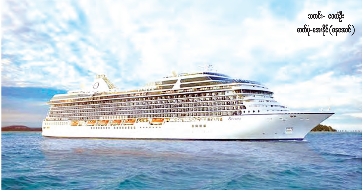
သတင်း- ဝေဖန်

နိုင်ငံ့တာဝန် ကျေပွန်အောင် ကျသင့်အခွန် ပုန်ပုန်ဆောင်