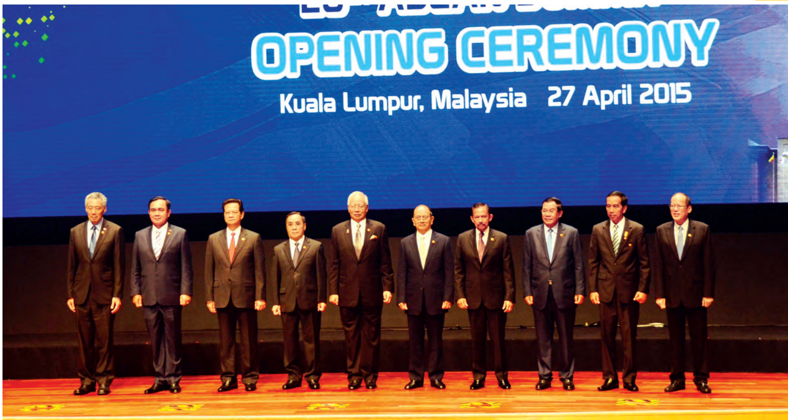
နိုင်ငံတော်သမ္မတ ဦးသိန်းစိန်နှင့် အာဆီယံ နိုင်ငံများမှ အကြီးအကဲများ (၂၆)ကြိမ်မြောက် အာဆီယံ ထိပ်သီးအစည်းအဝေး ဖွင့်ပွဲအခမ်းအနားတွင် စုပေါင်းမှတ်တမ်းတင်ဓာတ်ပုံရိုက်စဉ်။ (သတင်း-စာ-၈) (ဓာတ်ပုံ-ပြန်/ဆက်)