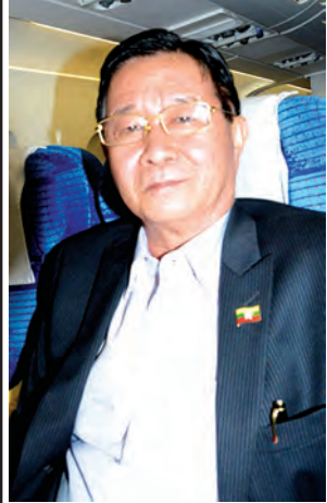
ဦးအောင်မင်း (ပြည်ထောင်စုဝန်ကြီး)

အမေး- အရေး- ဖောင်စီနီလွင်(မြန်မာ့အလင်း) စာတို- မင်းထက်၊ နေလင်း(ပြန်/အက်)