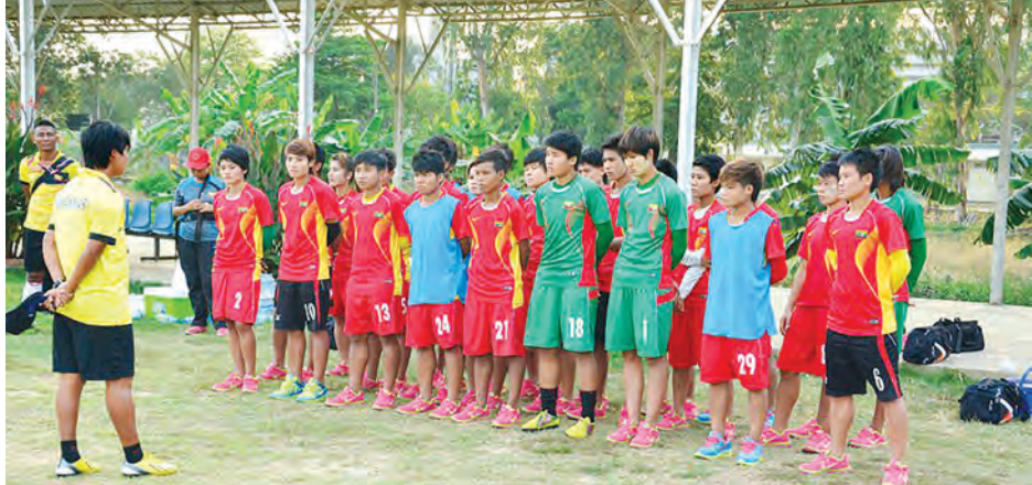
အကြိတ်အနယ် ယှဉ်ပြိုင်ကစားသွားကြမည်ဖြစ်ပြီးနောက်ဆုံးဗိုလ်လုပွဲစဉ်အထိ တက်လှမ်းနိုင်ရန်အတွက် မျှော်မှန်းထား ကြောင်း မြန်မာနိုင်ငံဘောလုံးအဖွဲ့ချုပ်မှ သိရသည်။

ဆက်လက်၍ မေ ၁ ရက်မှ ၁၀ ရက်အထိ ဗီယက်နမ်နိုင်ငံ ဟိုချီမင်းမြို့တွင် ကျင်းပမည့် AFF Women's Championship 2015 ပြိုင်ပွဲကို မေ ၂ ရက်၊ ၄ ရက်၊ ၆ ရက်တို့တွင် ဝင်ရောက်ယှဉ်ပြိုင်ကစားသွားကြမည်ဖြစ်ကာ အုပ်စု ပတ်လည်အဓိကပြိုင်ဘက်အသင်းများအဖြစ် ဗီယက်နမ်၊ မလေးရှား၊ ဖိလစ်ပိုင်၊ ဩစတြေးလျစသည့်အသင်းများနှင့်