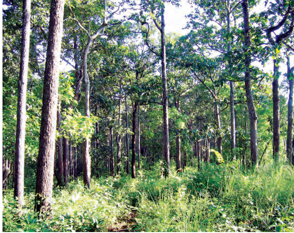
တည်ထောင်စိုက်ပျိုးထားသည့် အစုအဖွဲ့ပိုင် သစ်တောတစ်ခုကို တွေ့ရစဉ်။

၂၀၁၅ ခုနှစ် မတ်လအထိ တည်ထောင်ခဲ့သော အစုအဖွဲ့ပိုင် သစ်တော ၂၀၄၇၀၀ ဒေသ ၄၁ ဧကရှိပြီး ၂၀၁၄- ၂၀၁၅ ဘဏ္ဍာနှစ်အတွင်းတွင် ကြီးပိုင်း ကြီးပြင်ကာကွယ်တောများအတွင်းရှိ ယာမြေများကို သီးနှံသစ်တော ရောနှော စိုက်ပျိုးထားသောစနစ်ဖြင့် ဒေသခံပြည်သူအစုအဖွဲ့ပိုင် သစ်တော ၂၂၉၁၂ ဒေသ ၉၄ ဧကကို တည်ထောင် နိုင်ခဲ့ကြောင်းသိရသည်။ ယာမြေများအား သစ်တောပြန်လည်တည်ထောင်ခြင်းနှင့် အစုအဖွဲ့ပိုင်သစ်တောများ တည် ထောင်၍ ယာမြေများကို ဆက်လက်ခွင့်ပြုသွားမည်ဖြစ်သည်။