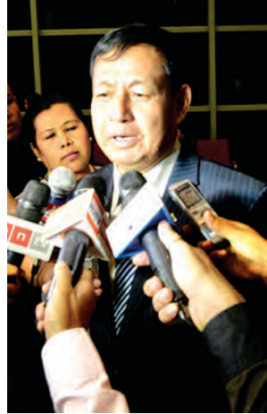
ဦးရဲထွဋ် (ပြည်ထောင်စုဝန်ကြီး)

ဦးအောင်မင်း (ပြည်ထောင်စုဝန်ကြီး) ဒီဘန်ဒေါင်းခရီးစဉ်မှာ နိုင်ငံတော်သမ္မတကြီးနဲ့အတူ အစည်းအဝေးနှစ်ခု တက်ရောက်ခဲ့သလို တက်ရောက် လာတဲ့ နိုင်ငံခေါင်းဆောင်အချို့နဲ့လည်း တွေ့ဆုံဆွေး နွေးမှုတွေ လုပ်ခဲ့ပါတယ်။ ဘာကြောင့်လဲဆိုတော့ နီပေါ နိုင်ငံရဲ့ငြိမ်းချမ်းရေးဖြစ်စဉ်နဲ့ ကျွန်တော်တို့နိုင်ငံရဲ့ ငြိမ်းချမ်းရေးဖြစ်စဉ်က တော်တော်တူတူတယ်။ သူတို့လည်း နှစ်ပေါင်းရှည်ကြာစွာ တိုင်းရင်းသားလက်နက်ကိုင် ပြဿနာရှိခဲ့တယ်။ သူတို့ဆီမှာတော့ မော်ဝါဒီ တိုင်းရင်းသားလက်နက်ကိုင်အဖွဲ့အစည်းတစ်ဖွဲ့တည်း ရှိတာ။ မော်ဝါဒီတိုင်းရင်းသားလက်နက်ကိုင်အဖွဲ့ အစည်းနဲ့ သူတို့က ၂၀၀၆ ခုနှစ်က ငြိမ်းချမ်းရေး လက်မှတ်ထိုးခဲ့တယ်။