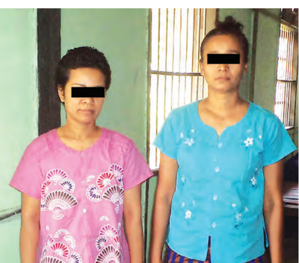
လိုက်ကြောင်း၊ နာရီဝက်ခန့်အကြာတွင် သေဆုံးသွားခဲ့သည်။ ထို့နောက် အလောင်းအား ၎င်းတို့နှစ်ဦးက မိုးကာဖျင်ဖြင့်ထုပ်၍ အဝတ်ထည့်သည့် ပလပ်စတစ်ပုံးအစိမ်းရောင်တွင်ထည့်ကာ စောင်နှင့် အုပ်လျက် အဖုံးပိတ်ပြီး တိပ်အဝါရောင်ဖြင့်ကပ်လျက် နိုင်လွန်ကြိုးဖြင့် ချည်နှောင်ခဲ့ကြောင်း၊ အဆိုပါပုံးကို သေဆုံးသူ၏ လိုက်ထရပ်အဖြူရောင် ကား 8B/---ဖြင့်တင်၍ နတ်တလင်းမြို့နယ် တောင်ညိုမြို့သစ်သို့