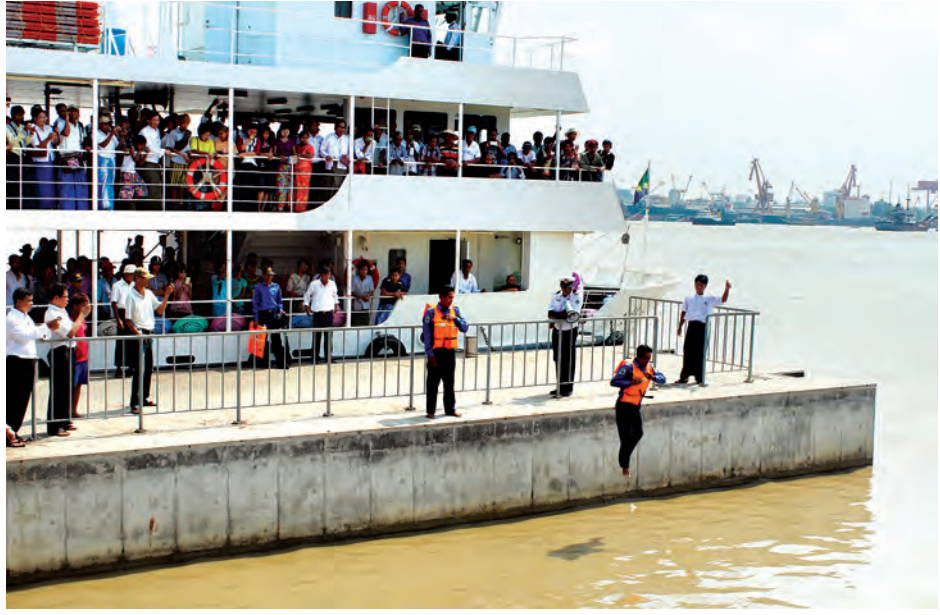
ရန်ကုန် ဧပြီ ၂၅

ပြည်တွင်း ရေကြောင်းပို့ဆောင်ရေး မြစ်ဝကျွန်းပေါ်ဌာနမှ နန်းဆိုးတန်း-ဒလ ကူးတို့ခရီးလမ်းတွင် ပြေးဆွဲလျက်ရှိသော ချယ်ရီကူးတို့ ရေယာဉ်များပေါ်တွင် ရေယာဉ်ဘေးအန္တရာယ် ကင်းရှင်းရေးနှင့် ရေယာဉ်ပေါ်လိုက်ပါစီးနင်းကြသည့် ခရီးသည်များ ဘေးအန္တရာယ်ကင်းရှင်းရေးအတွက် ချယ်ရီကူးတို့ရေယာဉ်ပေါ်၌ ရေယာဉ်ဝန်ထမ်းများက