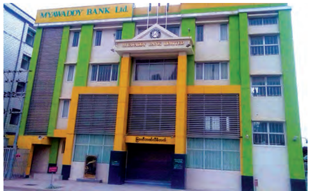
ပူးပေါင်း၍ အရေးကြီးနေရာများနှင့် ရွာဖွေလျက်ရှိကြောင်း သတင်း မြို့ဝင်၊ မြို့ထွက်ဂိတ်များတွင် ပိတ်ဆို့ရရှိသည်။ (မြဝတီ)

နေပြည်တော် ဧပြီ ၂၅ ရှမ်းပြည်နယ် (မြောက်ပိုင်း) မူဆယ်မြို့ စွမ်စော်ရပ်ကွက် ပင်လုံ(၅) လမ်းရှိ မြဝတီဘဏ်ခွဲအား ယနေ့ နံနက် ၃ နာရီခွဲခန့်တွင် အရပ်ဝတ် ဝတ်ဆင်ထားသည့် လက်နက်ကိုင် နှစ်ဦးက လက်နက်ငယ်များဖြင့် လာရောက်ပစ်ခတ်မှု ဖြစ်ပွားခဲ့သည်။ ထိုသို့ပစ်ခတ်မှုကြောင့် မြေညီထပ်၊ ပထမထပ်နှင့် ဒုတိယထပ်ရှိ ဘဏ် ရွှေမျက်နှာစာမှန်များတွင် လက်နက်ငယ်ကျည်များ ထိမှန်ပြီး