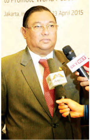
ဦးဝဏ္ဏမောင်လွင် (ပြည်ထောင်စုဝန်ကြီး)