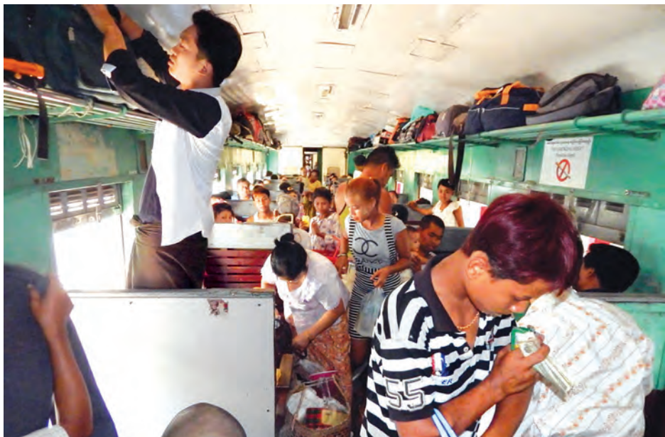
ဧပြီ ၂၀ ရက် ညနေ ၃ နာရီကပြေးဆွဲသည့် ရန်ကုန်-မန္တလေး အမြန်ရထားစီး ခရီးသည်များအား တွေ့ရ စဉ်။