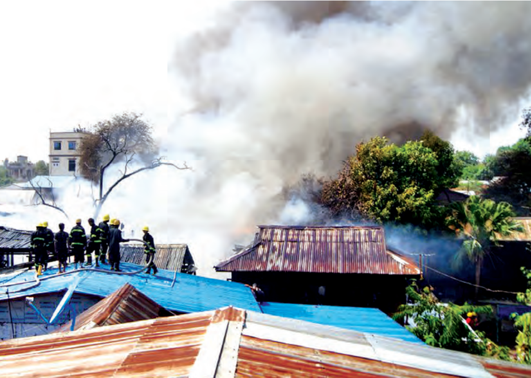
မန္တလေးမြို့ ချမ်းအေးသာစံမြို့နယ် ပြည်ကြီးပျော်ဘွယ်အနောက်ရပ်ကွက် အကွက်(၂၆၈) ၃၃ လမ်း ၈၈ လမ်းနှင့် ၈၇ လမ်းကြားရှိ ဥယျာဉ်အုပ်ဝင်း သွပ်မိုးထရုံကာ နှစ်ထပ်နေအိမ်တွင် ယနေ့မုန်းလွဲ ၁ နာရီ မိနစ် ၅၀ ခန့်က မီးလောင်မှုတစ်ရပ်ဖြစ်ပွားခဲ့ရာ နေအိမ် ၂၂ လုံးမီးလောင်ကျွမ်းသွားပြီး အိမ်ထောင်စု ၃၆ စုမှ အမျိုးသား ၁၁၅ဦး၊ အမျိုးသမီး ၁၄၄ ဦး စုစုပေါင်း ၂၅၉ ဦး မီးဘေးသင့်ခဲ့ကြောင်း သိရသည်။

မန္တလေးမြို့ ချမ်းအေးသာစံမြို့နယ် ပြည်ကြီးပျော်ဘွယ်အနောက်ရပ်ကွက် အကွက်(၂၆၈) ၃၃ လမ်း ၈၈ လမ်းနှင့် ၈၇ လမ်းကြားရှိ ဥယျာဉ်အုပ်ဝင်း သွပ်မိုးထရုံကာ နှစ်ထပ်နေအိမ်တွင် ယနေ့မုန်းလွဲ ၁ နာရီ မိနစ် ၅၀ ခန့်က မီးလောင်မှုတစ်ရပ်ဖြစ်ပွားခဲ့ရာ နေအိမ် ၂၂ လုံးမီးလောင်ကျွမ်းသွားပြီး အိမ်ထောင်စု ၃၆ စုမှ အမျိုးသား ၁၁၅ဦး၊ အမျိုးသမီး ၁၄၄ ဦး စုစုပေါင်း ၂၅၉ ဦး မီးဘေးသင့်ခဲ့ကြောင်း သိရသည်။ မန္တလေးမြို့ ချမ်းအေးသာစံမြို့နယ် ပြည်ကြီးပျော်ဘွယ်အနောက်ရပ်ကွက် အကွက်(၂၆၈) ၃၃ လမ်း ၈၈ လမ်းနှင့် ၈၇ လမ်းကြားရှိ ဥယျာဉ်အုပ်ဝင်း သွပ်မိုးထရုံကာ နှစ်ထပ်နေအိမ်တွင် ယနေ့မုန်းလွဲ ၁ နာရီ မိနစ် ၅၀ ခန့်က မီးလောင်မှုတစ်ရပ်ဖြစ်ပွားခဲ့ရာ နေအိမ် ၂၂ လုံးမီးလောင်ကျွမ်းသွားပြီး အိမ်ထောင်စု ၃၆ စုမှ အမျိုးသား ၁၁၅ဦး၊ အမျိုးသမီး ၁၄၄ ဦး စုစုပေါင်း ၂၅၉ ဦး မီးဘေးသင့်ခဲ့ကြောင်း သိရသည်။