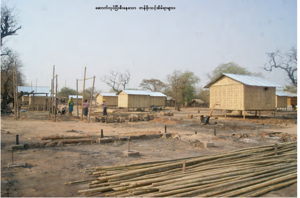
ဆောက်လုပ်ပြီးစီးနေသော တန်ဖိုးသင့်ဆိပ်ရာများ။

ဖြစ်စဉ်နှင့်ပတ်သက်၍ ပိုင်ရှင်မဲ့ကျွန်းသစ်များကို ဆတ်သွားနယ်မြေ ရဲစခန်း၌ ခေတ္တသိမ်းဆည်းထားပြီး မြို့နယ်သစ်တောဦးစီးဌာနက သစ်တော ဥပဒေဖြင့် အရေးယူရန် ဆက်လက်စီစဉ်လျက်ရှိကြောင်းသိရသည်။ နိုင်ငံစိုး