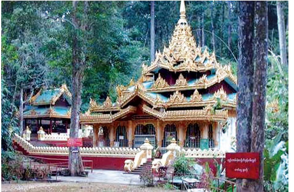
ပြည်တွင်း ပြည်ပခရီးသွားများ လာရောက်ဖူးမြော်ကြရာ အလောင်းတော်ကဿပ။

ကားများ၏ စတီးလ်လက်ရန်းများ၊ ဂူပေါက်ဝမှအမိုးများကို သိမ်းဆည်းထားပြီးဖြစ်ရာ ဘုရားဖူးခရီးသွားများအနေဖြင့် အတက်၊ အဆင်းအသွားအလာများကို ဂရုပြုသွားလာကြရန် လိုအပ်နေပြီဖြစ်ကြောင်း သိရသည်။ သင်္ကြန်နှစ်သစ်ကာလ နှုံးပိတ်ရက်သည် ဧပြီ ၂၀ ရက်အထိ ဖြစ်ရာ ဝန်ထမ်းများ၊ ကျောင်းသား ကျောင်းသူများအနေဖြင့် ရန်ကုန်မြို့မှ ခရီးသွားလုပ်ငန်းကားကြီးများ၊ ကိုယ်ပိုင်ကားများဖြင့် မုံရွာမြို့သို့