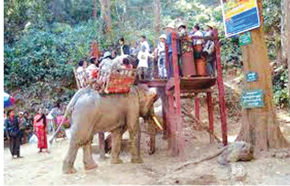
အလောင်းတော်ကဿပဘုရားဖူးများအား ဆင်ဖြင့်ပို့ဆောင်ပေးနိုင်ရန် ပြင်ဆင်နေမှုကို တွေ့ရစဉ်။

အရောက်လာကာ ညအိပ်ရပ်နား၍ အလောင်းတော်ကဿပသို့ ပြေးဆွဲသောကားလိုင်းမှ မှန်လုံယာဉ်များဖြင့် နေ့ချင်းပြန် ဘုရားဖူးသွားကြခြင်းဖြစ်ရာ ယခုရက်ပိုင်းရက်တရက်မိုးလေဆင်လာမှုအပေါ် ကြည့်ရှုအကဲခတ်သွားလာနေကြကြောင်း သိရသည်။ “အလောင်းတော် ကဿပ ဂေါပကအဖွဲ့အနေနဲ့ ဒီလကုန်ပိုင်းမှာ အားလုံးသိမ်းဆည်းပြီး မြေပြန့် ကိုပြန်ဆင်းလာကြတော့မှာပါ။ ဘုရား