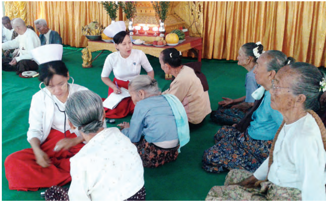
မကွေးတိုင်းဒေသကြီး အစိုးရအဖွဲ့က ကြီးမှူးကျင်းပသည့် သက်ကြီးပူဇော်ပွဲကို ဧပြီ ၁၇ ရက်က မကွေးမြို့ ဖန်ခါးမြေ ဘိုးဘွားရိပ်သာ၌ ကျင်းပရာ ကျန်းမာရေးဝန်ထမ်းများက ဘိုးဘွားများအား ကျန်းမာရေးစောင့်ရှောက်မှုပေးစဉ်။