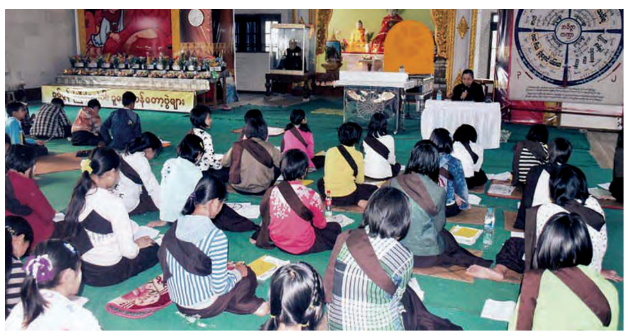
ရှမ်းပြည်နယ်(မြောက်ပိုင်း) သီပေါမြို့နယ်၌ မြန်မာ့ရိုးရာအတတ်ပညာအတွင်း ဒုလ္လဘာရဟန်းဝတ်သူ၊ တရားစခန်းဝင်သူများ ယမန်နှစ်ထက် ပိုမိုများပြားလာပြီး မဟာစည်သာသနာရိပ်သာ၊ ကန်သာတရားစခန်းနှင့် ရွှေကျောင်းပရိယတ္တိတရားစခန်းတို့တွင် လူငယ်၊ လူရွယ်များပါ တရားစခန်း ဝင်ရောက်ကြသည်ကို တွေ့ရစဉ်။

သတိပေး နိုးဆော်ချက် နေပြည်တော်တွင် မော်တော်ဆိုင်ကယ်စီးနင်းသူများသည် ဆိုင်ကယ်စီး ဦးထုပ်ကိုမေးသိုင်းကြီးတပ်၍ စီးနင်းကြရန်နှင့် နှစ်ဦးထက် ပိုမိုစီးနင်း ခြင်းမပြုကြရန်၊ ထို့အပြင် လိုင်စင်မဲ့ဆိုင်ကယ်များ စီးနင်းခြင်းမပြုကြရန် နိုးဆော်အပ်ပါသည်။ လိုက်နာခြင်းမရှိပါက တည်ဆဲပဒေအရ ထိရောက် စွာ အရေးယူဆောင်ရွက်သွားမည်ဖြစ်ကြောင်း သတိပေးနိုးဆော်အပ်ပါသည်။ နေပြည်တော်ယာဉ်စည်းကမ်းထိန်းသိမ်းရေး ကြီးကြပ်မှုကော်မတီ