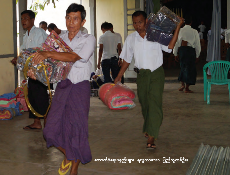
ထောက်ပံ့ပစ္စည်းများ ရယူလာသော ပြည်သူတစ်ဦး။