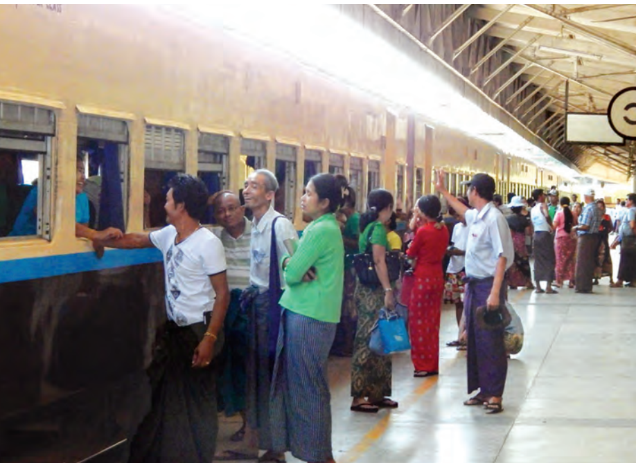
ဧပြီ ၂၀ ရက် ညနေ ၃ နာရီက ပြေးဆွဲသည့် ရန်ကုန်-မန္တလေး အမြန်ရထားတွဲဆိုင်တွင် ခရီးသည်များ၊ ပို့ဆောင်သူများဖြင့် စည်ကားနေသည်ကို တွေ့ရစဉ်။