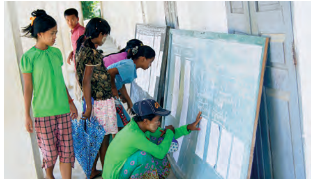
တနင်္သာရီတိုင်းဒေသကြီး ကော့သောင်းခရိုင် ခမောက်ကြီးမြို့ အထကတွင် ၂၀၁၄-၂၀၁၅ ပညာသင်နှစ်အတွင်း ဖြေဆိုခဲ့ကြသည့် စာမေးပွဲအောင်စာရင်းများကို ဧပြီ ၁၈ ရက်က ထုတ်ပြန်ရာ ကျောင်းသားကျောင်းသူများကြည့်ရှုနေစဉ်။ (ခရိုင် ပြန်/ဆက်)

မဲခေါင်မြစ်ဝှမ်း ဒေသတွင် လူကုန်ကူးမှု ပူးပေါင်းတိုက်ဖျက်ရေး ဝန်ကြီးအဆင့် အစည်းအဝေးများကို သုံးနှစ် တစ်ကြိမ် မဲခေါင်ဒေသတွင်း နိုင်ငံများ အလှည့်ကျပြုလုပ်ကျင်းပခြင်းဖြစ်ပြီး ပထမအကြိမ် အစည်းအဝေးကို ၂၀၀၄ ခုနှစ် အောက်တိုဘာလတွင် ရန်ကုန်မြို့၌ လည်းကောင်း၊ ဒုတိယအကြိမ် အစည်းအဝေးကို ၂၀၀၇ ခုနှစ် ဒီဇင်ဘာလတွင် တရုတ်နိုင်ငံ ပေကျင်းမြို့၌ လည်းကောင်း၊ တတိယအကြိမ် အစည်းအဝေးကို ၂၀၁၂ ခုနှစ် ဖေဖော်ဝါရီလတွင် ဗီယက်နမ်နိုင်ငံ ဟနွိုင်းမြို့၌ လည်းကောင်း ကျင်းပခဲ့ကြောင်း သိရသည်။