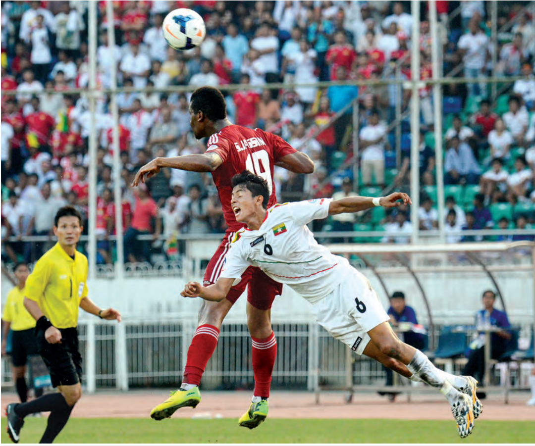
အာရှ ယူ-၁၉ ပြိုင်ပွဲတွင် မြန်မာအသင်းနှင့် ယူအေအီးအသင်းတို့ ယှဉ်ပြိုင်နေစဉ်။ သတင်း-ညီမြတ်သော်တာ၊ ဓာတ်ပုံ-ဖိုးသော်ဇင်

မြန်မာ ယူ-၂၀ အသင်းသည် ကမ္ဘာ့ဖလားပြိုင်ပွဲအတွက် အထိရောက်ဆုံးပြင်ဆင်မှုအဖြစ် ဥရောပ ငါးနိုင်ငံတွင် သွားရောက်လေ့ကျင့်လျက်ရှိပြီး လက်ရှိတွင် ဆလိုဗေးနီးယားနိုင်ငံသို့ ရောက်ရှိနေပြီဖြစ်သည်။ မြန်မာယူ-၂၀ အသင်းသည် ဆားဘီးယား၊ မက်ဆီဒိုးနီးယားနှင့် ဂျာမနီနိုင်ငံတို့တွင် လေ့ကျင့်မှုများပြုလုပ်ပြီးနောက် စတုတ္ထမြောက်နိုင်ငံအဖြစ် ဆလိုဗေးနီးယားသို့ ရောက်ရှိနေခြင်းဖြစ်၍ ဧပြီ ၁၉ ရက်မှ စတင်ကာ လေ့ကျင့်မှုများ ပြုလုပ်လျက်ရှိသည်။ မြန်မာယူ-၂၀ အသင်းသည် ယခု ဥရောပခရီးစဉ်တွင် ဆားဘီးယားယူ-၂၀ အသင်းနှင့် ခြေစမ်းပွဲနှစ်ပွဲအပါအဝင် စာမျက်နှာ ၇ ကော်လံ ၅ ၀