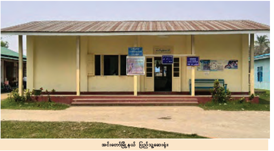
အင်းတော်မြို့နယ် ပြည်သူ့ဆေးရုံ။