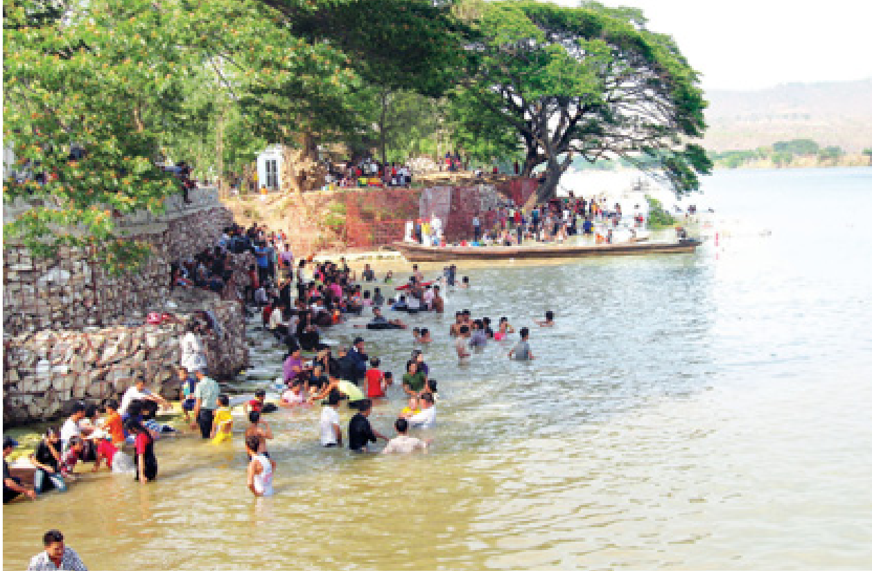
ပေါင်းလောင်းမြစ်ကမ်းဘေး၌ လာရောက်လည်ပတ်သူများ ပျော်ရွှင်စွာအပန်းဖြေရေကစားနေသည်ကို တွေ့ရစဉ်။