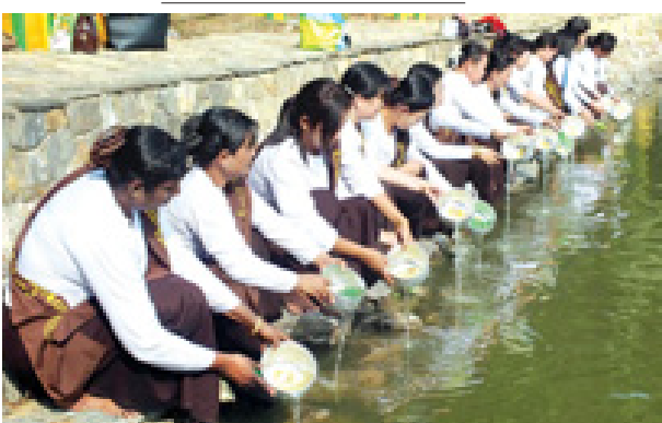
ရွှေတိဂုံဓေတီတော် ရှင်ဥပဂုတ္တ မင်္ဂလာကန်တော်၌ ဇီဝိတဒါန ဘေးမဲ့သက်လွတ်ပွဲတွင် ငါးများလွှတ်ပေးစဉ်။ (သတင်းစဉ်)