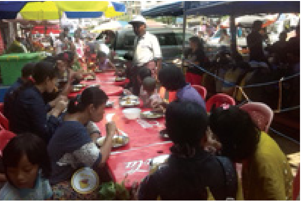
သင်္ကြန်ရက်အတွင်း ရန်ကုန်တိုင်းဒေသကြီးရှိ မြို့နယ်များတွင် ရွှေရင်အေး၊ သာဂျ၊ ကျောက်ကျော စသည့်ရိုးရာအစားအစာများ၊ ပေးပို့လှူဒါန်းခြင်းအပြင် လမ်းအချို့တွင် အများပြည်သူအား သင်္ကြန်လေးရက်အတွင်း နေ့စဉ်ထမင်းဟင်းမျိုးစုံဖြင့် ကျွေးမွေးလှူဒါန်းစဉ်။