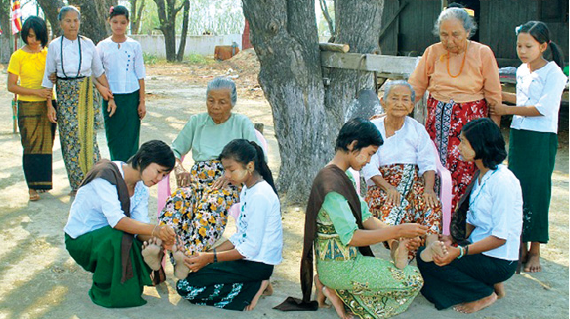
မြန်မာနှစ်ဆန်း ၁ ရက်နေ့တွင် ရမည်းသင်းမြို့နယ် ထိန်ကန်ကျေးရွာအုပ်စု ညောင်ပင်ကိုင်းကျေးရွာ၌ ယဉ်ကျေးလိမ္မာသင်တန်းကျောင်းမှ ကျောင်းသူများက သက်ကြီးအဘွားများအား မြန်မာ့ရိုးရာအစဉ်အလာနှင့်အညီ ခြေသင်းညှပ်ပေးခြင်းဖြင့် ကုသိုလ်ပူဇော်ခဲ့။