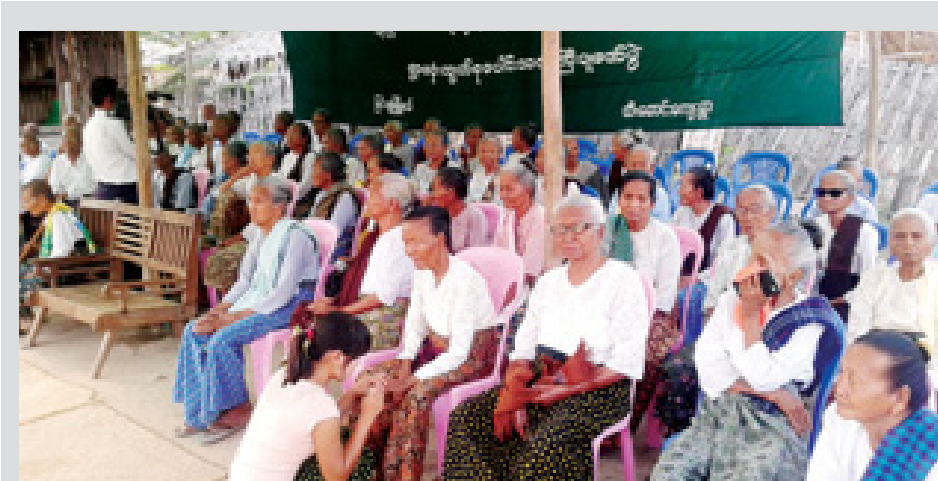
သင်္ကြန်အတတ်နေ့က မြင်းမူ မြို့နယ် ထီးဆောင်းကျေးရွာ လမ်းဆုံတွင် အဋ္ဌမအကြိမ်မြောက် သက်ကြီးပူဇော်ပွဲ ကျင်းပရာ (၇၅) နှစ် အထက် အဘိုး ၃၆ ဦးနှင့် အဘွား ၆၇ ဦး စုစုပေါင်း ၁၀၃ ဦးကို ဆရာ ဆရာမများနှင့် ကျောင်းသား ကျောင်းသူလေးများ က ကန်တော့ကြပြီး ခေါင်းဖြီး၊ ဆီလိမ်းပေးခြင်း၊ လက်သည်းခြေသည်းညှပ်ပေးခြင်းများ ပြုလုပ်ပေးနေသည်ကို တွေ့ရစဉ်။ (၀၇၉)