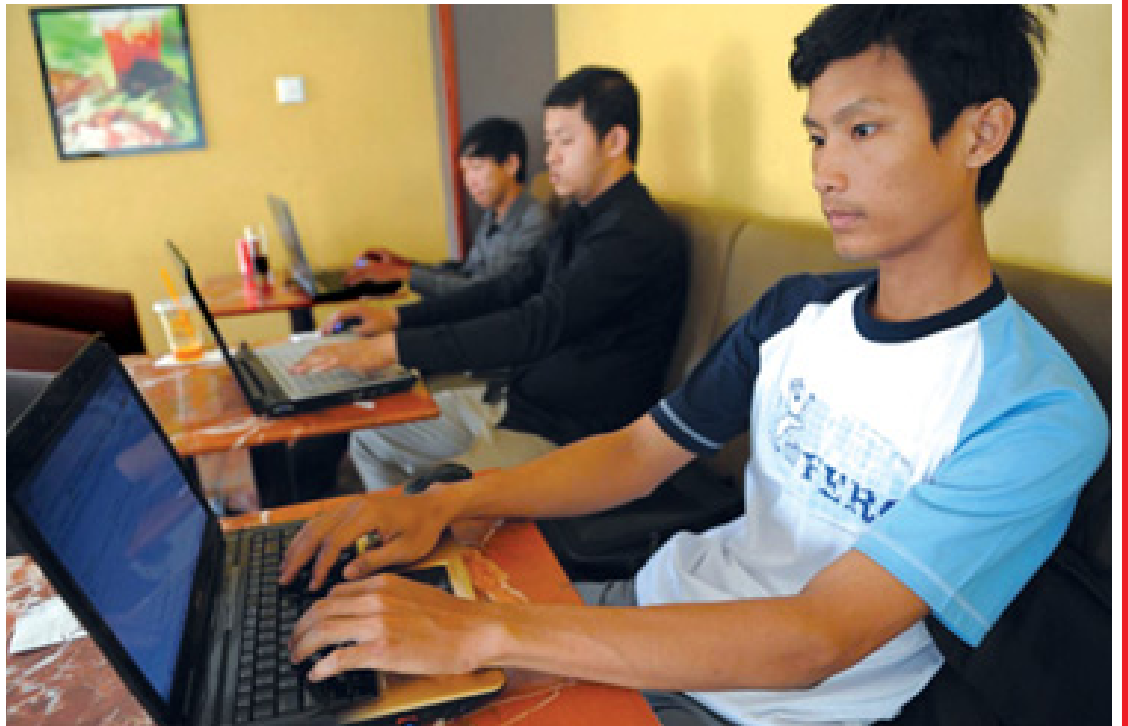
နိုင်ငံတကာအဖွဲ့အစည်းများနှင့် ပူးပေါင်းဆောင်ရွက်ခြင်းဖြင့် ဝန်ကြီးဌာနမှ လုပ်ဆောင်ဆဲ ဥပဒေ၊ နည်းဥပဒေများနှင့် ပေါ်လစီရေးရာများအတွက် အကြံဉာဏ်ကောင်းများ

ယင်းအဖွဲ့အစည်း၏ အဓိကရည်မှန်းချက်မှာ လူတိုင်း၏ လစဉ်ဝင်ငွေ ငါးရာခိုင်နှုန်း သို့မဟုတ် ငါးရာခိုင်နှုန်းထက် နည်းပါးသည့် နှုန်းထားဖြင့် အင်တာနက်သုံးစွဲခွင့်ရရှိရေးဖြစ်သည်။