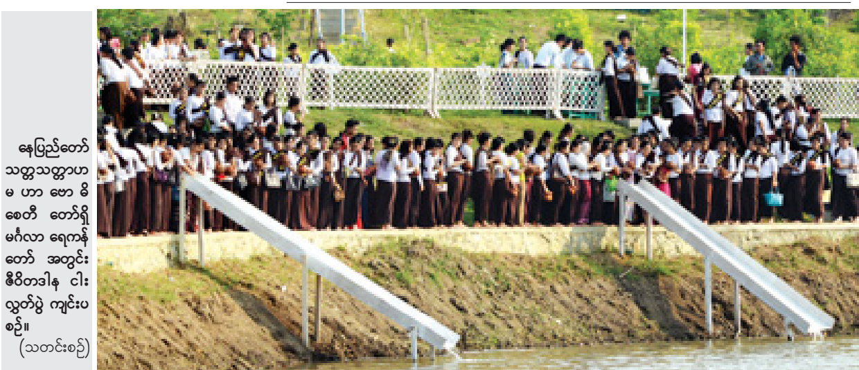
နေပြည်တော် သတ္တသတ္တာဟ မဟာဗောဓိဓေတီတော်ရှိ မင်္ဂလာကန်တော် အတွင်း ဇီဝိတဒါန ငါးလွှတ်ပွဲ ကျင်းပစဉ်။ (သတင်းစဉ်)