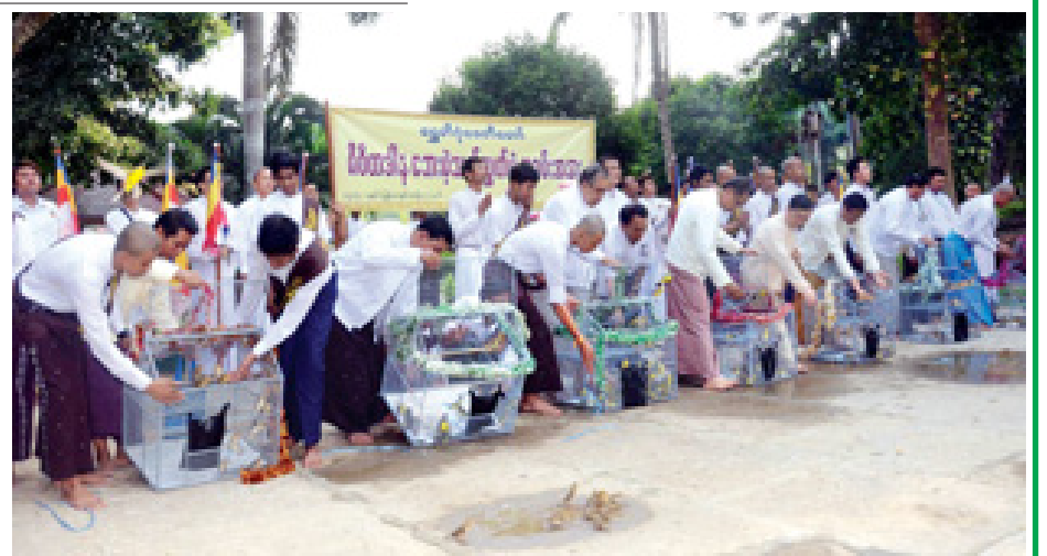
ရွှေတိဂုံဓေတီတော် (၂၃)ကြိမ်မြောက် ဒါနဥပပါရမီ စုပေါင်းသွေးလှူဒါန်းပွဲ ကျင်းပစဉ်။ (သတင်းစဉ်)