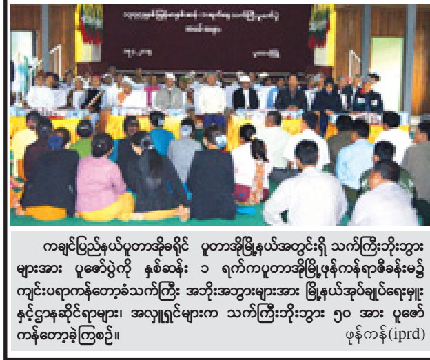
ကချင်ပြည်နယ်ပုတာအိုခရိုင် ပုတာအိုမြို့နယ်အတွင်းရှိ သက်ကြီးဘိုးဘွားများအား ပူဇော်ပွဲကို နှစ်ဆန်း ၁ ရက်ကပုတာအိုမြို့နယ်ကန်ရာစီခန်းမ၌ ကျင်းပရာကန်တော့သက်ကြီး အဘိုးအဘွားများအား မြို့နယ်အုပ်ချုပ်ရေးမှူးနှင့်ဌာနဆိုင်ရာများ၊ အလှူရှင်များက သက်ကြီးဘိုးဘွား ၅၀ အား ပူဇော်ကန်တော့ခဲ့ကြစဉ်။

ဟိုပိုး ရှမ်းပြည်နယ်(တောင်ပိုင်း)ပုအိုဝင်းကိုယ်ပိုင်အုပ်ချုပ်ခွင့်ရဒေသ ဟိုပိုးမြို့နယ် အထွေထွေအုပ်ချုပ်ရေးဦးစီးဌာနက ကြီးကြားကျင်းပသော သက်ကြီးပူဇော်ပွဲကို ဧပြီ ၁၇ ရက် မွန်းလွဲ ၁၂ နာရီခွဲက ဟိုပိုးမြို့၊ သီရိမင်္ဂလာရွှေချမ်းသာ မေ့တော်ဘုရားကြီး၌ကျင်းပရာ သက်ကြီးဘိုးဘွားများအား ဩကာသကန်တော့ကျိုးဖြင့် ကန်တော့ကြကြောင်း သိရသည်။ ဆက်လက်၍ မြို့နယ်အုပ်ချုပ်ရေးမှူး ဦးမောင်မောင်နှင့်ဌာနဆိုင်ရာတာဝန်ရှိသူများက ဘိုးဘွားများအား ပူဇော်ကန်တော့ငွေများနှင့် အထည်များလှူဒါန်းကြပြီး မတက်ရောက်နိုင်သည့် ဘိုးဘွားများအား အိမ်တိုင်ရာရောက်ပူဇော်ကန်တော့သွားမည်ဖြစ်ကြောင်း သိရသည်။ နန်းဦးခမ်း(ဟိုပိုး)