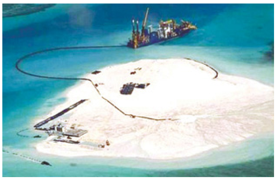
တရုတ်နှင့်ဖိလစ်ပိုင် အငြင်းပွားနေသော စပရင်လေကျွန်းကိုတွေ့ရစဉ်။

ပေကျင်း ဧပြီ ၁၇ တရုတ်နိုင်ငံက တောင်တရုတ်ပင်လယ်ရှိ အငြင်းပွားလျက်ရှိရာ ကျွန်းပေါ်တွင် လေယာဉ်ပြေးလမ်းတစ်ခု တည်ဆောက်နေပုံကို ဂြိုဟ်တုဓာတ်ပုံများက ပြသထားကြောင်း သတင်းတစ်ရပ်တွင် ဖော်ပြသည်။ တရုတ်၏ လေယာဉ်ပြေးလမ်းတည်ဆောက်ရေး လုပ်ငန်းကို စပရင်လေကျွန်းရှိ သန္တာကျောက်တန်းပေါ်တွင် လုပ်ဆောင်ထားခြင်းဖြစ်သည်ဟု ဂြိုဟ်တုဓာတ်ပုံများက ဖော်ပြသည်။ ပြေးလမ်း မီတာ ၃၀၀၀ ထိ ရှည်လျားသော တရုတ်နိုင်ငံ၏ လေယာဉ်ကွင်း တည်ဆောက်မှုလုပ်ငန်းနှင့်ပတ်သက်ပြီး အာရှ-ပစိဖိတ်ဒေသတွင် စိုးရိမ်ပူပန်မှုများ မြင့်တက်စေခဲ့သည်။ တရုတ်နိုင်ငံသည် ဗီယက်နမ်နှင့် ဖိလစ်ပိုင်အပါအဝင် အာရှနိုင်ငံအတော်များများက မိမိတို့၏ ပိုင်နက်ဖြစ်သည်ဟု တစ်ထပ်တည်းပြောဆိုနေသည့် တောင်တရုတ်ပင်လယ်တစ်ခုလုံးနီးပါးကို မိမိ၏ ပိုင်နက်အဖြစ် ပြောဆိုခဲ့သည်။ တရုတ်နိုင်ငံအနေဖြင့် တောင်တရုတ်ပင်လယ်တွင် စစ်ခန်းအဖြစ် အသုံးပြုဖွယ်ရှိသည့် လူလုပ်ကျွန်းတစ်ခုကို ဖန်တီးရန် စီစဉ်နေသည်ဟု အခြားအာရှနိုင်ငံများက တရုတ်နိုင်ငံကို စွပ်စွဲလျက်ရှိသည်။ တရုတ်က ၎င်း၏လေယာဉ်ကွင်း တည်ဆောက်ရေးလုပ်ငန်းသည် တရားဝင်ကြောင်း၊ မိမိတို့၏ အချုပ်အခြာအာဏာကို ကာကွယ်စောင့်ရှောက်ရန် လိုအပ်ကြောင်းဖြင့် ပြောသည်။ (ဘီဘီစီ)