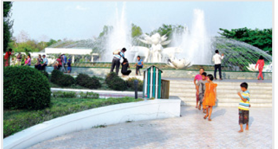
မြန်မာနှစ်ဆန်း ၁ ရက်နေ့က နေပြည်တော် တိရစ္ဆာန်ဥယျာဉ်၌ အနယ်နယ်အရပ်ရပ်မှ လာရောက်လည်ပတ်သူ များ အေးချမ်းစွာ အပန်းဖြေအနားယူနေသည်ကို တွေ့ရစဉ်။

နေပြည်တော် ဧပြီ ၁၇ သာသနာရေးဝန်ကြီးဌာန အမျိုးသမီးရေးရာအဖွဲ့ဝင်များ၏ သက်ကြီးပူဇော်ပွဲအခမ်းအနားကို နေပြည်တော် ရုံးအမှတ်(၃၁) သာသနာရေးဝန်ကြီးဌာန စုပေါင်းခန်းမ၌ မြန်မာနှစ်ဆန်း ၁ ရက် (၁၇-၄-၂၀၁၅)ရက်နေ့ မွန်းလွဲ ၁ နာရီက ကျင်းပသည်။ အခမ်းအနားတွင် ပြည်ထောင်စုဝန်ကြီး၏ ဇနီး ဦးဆောင်သော သာသနာရေးဝန်ကြီးဌာန အမျိုးသမီးရေးရာအဖွဲ့ဝင်များသည် နေပြည်တော်ကောင်စီနယ်မြေ ပျဉ်းမနားမြို့နယ်၊ လယ်ဝေးမြို့နယ်နှင့် ဇေယျဝတီမြို့နယ်များမှ အဘိုး အဘွား ၄၃ ဦးအား ဦးခေါင်းသန့်စင်ခြင်း၊ ခြေလက်သန့်စင်ခြင်း၊ ခြေလှမ်းလက်သည်းညှပ်ခြင်း စသည့် သက်ကြီးပူဇော်ပွဲအခမ်းအနားကို ကျင်းပခဲ့သည်။ (မြန်မာ့အလင်း)