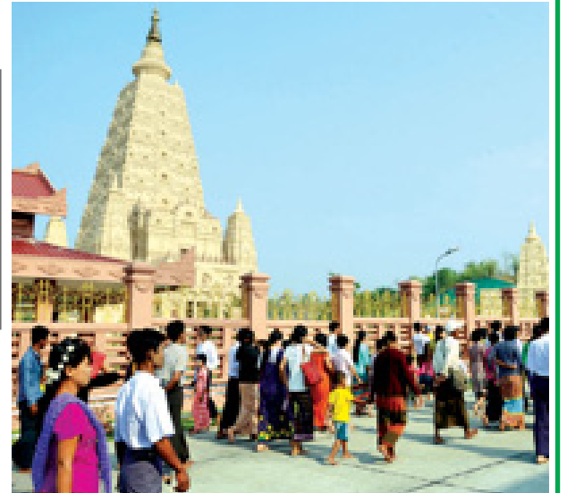
နေပြည်တော် သတ္တသတ္တာဟ မဟာဗောဓိဓေတီတော်၌ ဘုရားဖူးပြည်သူများ တောင်းမှုကုသိုလ်ပြုကြစဉ်။ (သတင်းစဉ်)