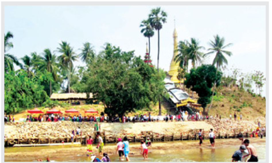
မြန်မာနှစ်ဆန်း ၁ ရက်နေ့က ပဲခူးတိုင်းဒေသကြီး ရွှေကျင်မြို့ရှိ သမိုင်းဝင် ဘုရားကြီးစေတီတော်သို့ ဘုရားဖူး ပြည်သူများ လာရောက်ဖူးမြော်ပြီး ရွှေကျင်ချောင်းအတွင်း အပန်းဖြေအနားယူရေကစားနေသည်ကို တွေ့ရစဉ်။

ဆက်လက်၍ အန္တရာယ်ကင်း ပရိတ်တရားတော် ရွတ်ဖတ်ပူဇော်ပွဲ အခမ်းအနားကို ညနေ ၄ နာရီက ထားဝယ်မြို့ သာသနာ့ဗိမာန်တော် ကြီး၌ ကျင်းပရာ တိုင်းဒေသကြီး ဝန်ကြီးချုပ်နှင့် တက်ရောက်လာကြ သူများက ဆရာတော်၊ သံဃာတော် အရှင်သူမြတ်များထံမှ အန္တရာယ်ကင်း ပရိတ်တရားတော်များ နာယူသည်။ ထို့နောက် ဆရာတော်၊ သံဃာတော် အရှင်သူမြတ်များအား လှူဖွယ်ဝတ္ထု ပစ္စည်းများ ဆက်ကပ်လှူဒါန်းမှုအစုစု တို့အတွက် ဇေယျဝတီစာသင်တိုက်မှ ဘဒ္ဒန္တသူရိယ အဂ္ဂမဟာပဏ္ဍိတ ဆရာတော်ကြီးက ရေစက်သွန်းချ အမျှပေးဝေကြောင်း သိရသည်။ (တိုင်းဒေသကြီး ပြန်/ဆက်)