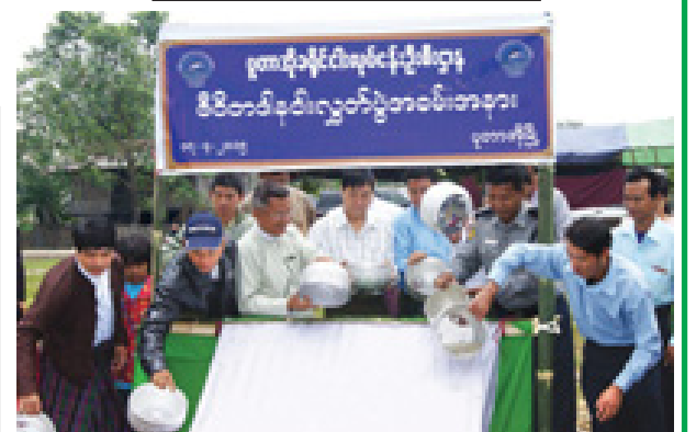
ကချင်ပြည်နယ် ပူတာအိုခရိုင် ငါးလုပ်ငန်းဦးစီးဌာနကကြီးမှူး၏ ပူတာအိုမြို့ ဟိုဒိုရပ်ကွက်ရှိ နမ့်ခမ်တီတံတား နမ့်ထွမ်ချောင်းတွင် နှစ်ဆန်း ၁ ရက်နေ့က ဇီဝိတဒါနငါးလွှတ်ပွဲကျင်းပစဉ်။