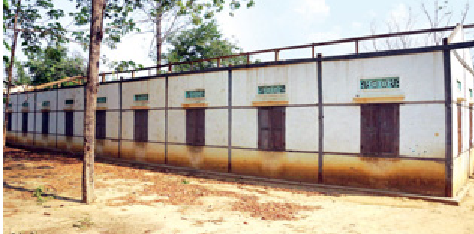
လေပြင်းတိုက်ခတ်မှုကြောင့် အမိုးများလန်၍ ပျက်စီးသွားသော စာသင်ကျောင်းကို တွေ့ရစဉ်။