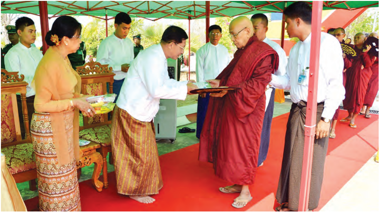
ဗိုလ်ချုပ်မှူးကြီး စိုးဝင်းနှင့်ဇနီးနှင့် တပ်မတော်အရာရှိကြီးများက ဆရာတော်၊ သံဃာတော်များထံ လှူဖွယ်ပစ္စည်းများ ဆက်ကပ်လှူဒါန်းကြသည်။ ယင်းနောက် မင်္ဂလာဇေယျံပါဠိ တက္ကသိုလ်ကျောင်းတိုက်ဆရာတော်ထံ

ထို့နောက် တပ်မတော်ကာကွယ်ရေးဦးစီးချုပ်နှင့်ဇနီး ဒေါ်ကြူကြူလှ (အပေါ်ယာပုံ) ဒုတိယ တပ်မတော်ကာကွယ်ရေးဦးစီးချုပ်(ကြည်း)ဒုတိယ