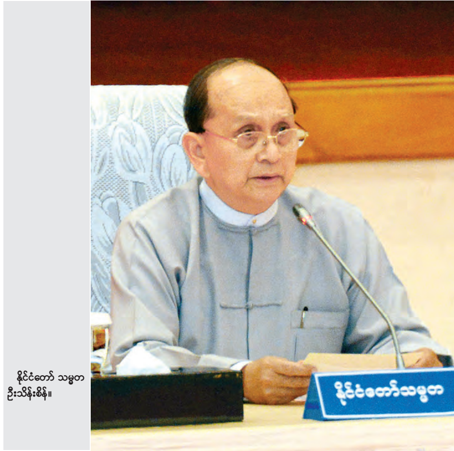
နိုင်ငံတော် သမ္မတ ဦးသိန်းစိန်။

နေပြည်တော်ရှိ နိုင်ငံတော်သမ္မတအိမ်တော် ငှေ့ပါခန်းမ၌ ယနေ့မနက် ၂ နာရီတွင် နိုင်ငံတော်သမ္မတဦးသိန်းစိန်၊ ပြည်သူ့လွှတ်တော်ဥက္ကဋ္ဌ သူရဦးရွှေမန်း၊ အမျိုးသားလွှတ်တော်ဥက္ကဋ္ဌ ဦးခင်အောင်မြင့်၊ တပ်မတော်ကာကွယ်ရေးဦးစီးချုပ် ဗိုလ်ချုပ်မှူးကြီး မင်းအောင်လှိုင်၊ အမျိုးသားဒီမိုကရေစီအဖွဲ့ချုပ်ဥက္ကဋ္ဌ ဒေါ်အောင်ဆန်းစုကြည်နှင့် အမျိုးသားလွှတ်တော် ကိုယ်စားလှယ် ဒေါက်တာအေးမောင်တို့ တက်ရောက်သည့် တွေ့ဆုံဆွေးနွေးပွဲကိုကျင်းပသည်။