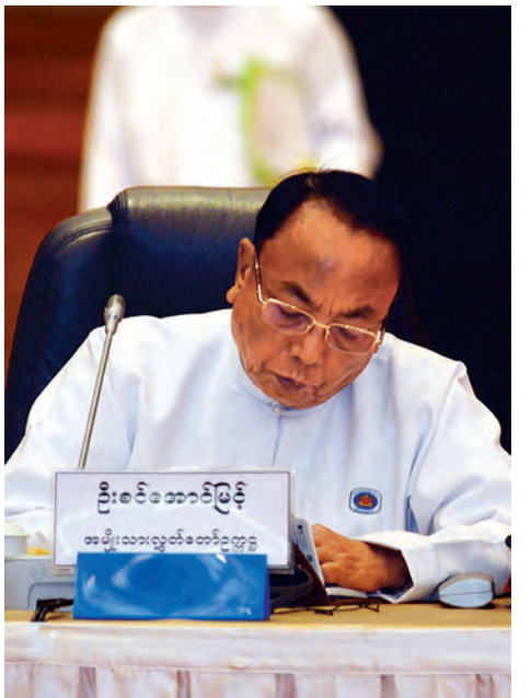
အမျိုးသားလွှတ်တော်ဥက္ကဋ္ဌ ဦးခင်အောင်မြင့်။