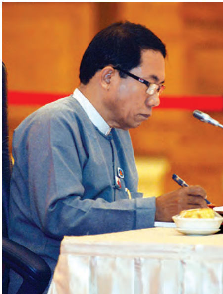
အမျိုးသားလွှတ်တော် ကိုယ်စားလှယ် ဒေါက်တာအေးမောင်။

ယင်းသို့ ပြုလုပ်ရခြင်း၏အကြောင်းရင်းမှာယခုကဲ့သို့ ဒီမိုကရေစီနိုင်ငံသစ်ကို အစပျိုး ထူထောင်ရာတွင် ဒီမိုကရေစီအတွေ့အကြုံ၊ ဒီမိုကရေစီအလေ့အကျင့်များ