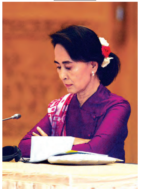
အမျိုးသားဒီမိုကရေစီအဖွဲ့ချုပ်ဥက္ကဋ္ဌ ဒေါ်အောင်ဆန်းစုကြည်။

ဆွေးနွေးပွဲအပြီးတွင် နိုင်ငံတော်သမ္မတ၏ ပြောရေးဆိုခွင့်ရှိသူ ပြန်ကြားရေးဝန်ကြီးဌာန ပြည်ထောင်စုဝန်ကြီးဦးရဲထွဋ်က ဆွေးနွေးပွဲတွင် နောင်ဆွေးနွေးပွဲများ