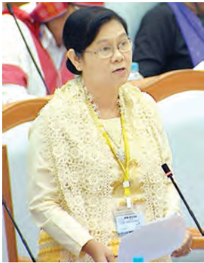
ဒုတိယဝန်ကြီး ဒေါ်လှလှသိန်း ရှင်းလင်းတင်ပြစဉ်။ (သတင်းစဉ်)

ခြင်းနှင့် အသစ်ထပ်မံ ခန့်အပ်တာဝန် ပေးခြင်းကို လွှတ်တော်က မှတ်တမ်း တင်သည်။ ထို့နောက် နိုင်ငံတော်သမ္မတမှ ပေးပို့သော ကမ္ဘာ့ဘဏ်မှ အမေရိကန်