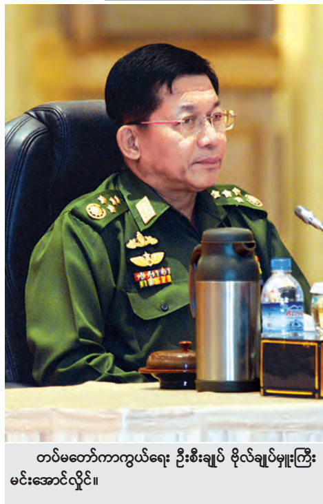
တပ်မတော်ကာကွယ်ရေး ဦးစီးချုပ် ဗိုလ်ချုပ်မှူးကြီး မင်းအောင်လှိုင်။

မိမိအနေဖြင့် လွှတ်တော်၊ တပ်မတော်၊ နိုင်ငံရေးပါတီများနှင့် အဖွဲ့အစည်းအသီးသီးတို့မှ ကိုယ်စားလှယ်များနှင့် ယခုကဲ့သို့ တွေ့ဆုံဆွေးနွေးပွဲများကို ပုံစံအမျိုးမျိုးဖြင့် ပြုလုပ်ခဲ့ပါကြောင်း။