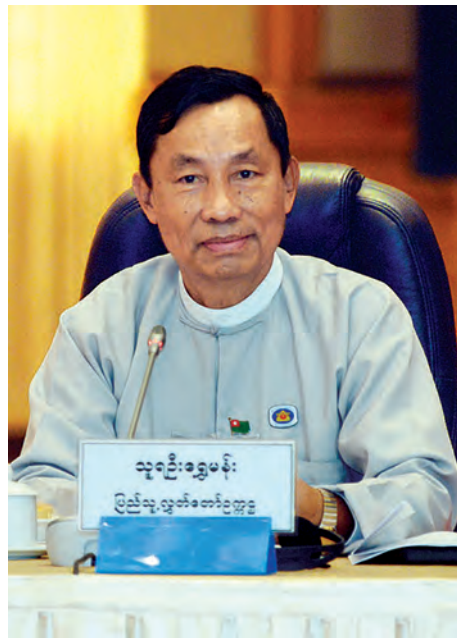
ပြည်သူ့လွှတ်တော်ဥက္ကဋ္ဌ သူရဦးရွှေမန်း။

၌ ဆောင်ရွက်ရမည့် ဆွေးနွေးမှု မူဘောင်၊ ဆွေးနွေးပွဲပုံစံ၊ ဆွေးနွေးပွဲများ ပြန်လည်ကျင်းပမည့်အချိန်များနှင့် ပတ်သက်ပြီးသဘောတူညီမှု ရရှိခဲ့ကြောင်း၊ ဆွေးနွေးပွဲတွင် ပါဝင်တက်ရောက်သူအားလုံးက ညီအစ်ကိုမောင်နှမစိတ်ဓာတ်ဖြင့် လွတ်လပ်ပွင့်လင်းစွာဆွေးနွေးသဘောတူ