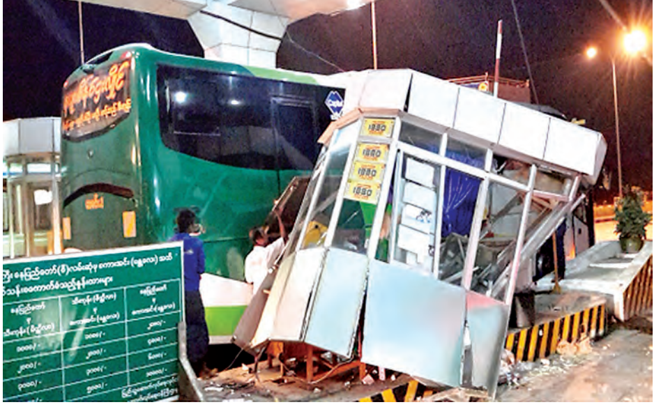
ဧပြီ ၈ ရက် နံနက် ၄ နာရီခွဲက နေပြည်တော် ဒက္ခိဏသီရိမြို့နယ် ရန်ကုန်-မန္တလေး အမြန်လမ်း မိုင်တိုင်အမှတ်(၂၀၁/၆)နေပြည်တော် တိုးဂိတ်တွင် ယာဉ်တိုက်မှုဖြစ်ပွား ကြောင်း သတင်းအရ ပလွေးအမြန် လမ်းမကြီးရဲစခန်းမှ တပ်ဖွဲ့ဝင်များနှင့် အမြန်လမ်းမီးသတ်တပ်ဖွဲ့မှ တပ်ဖွဲ့ ဝင်များက သက်သေများနှင့်အတူ သွားရောက်စစ်ဆေးခဲ့သည်။