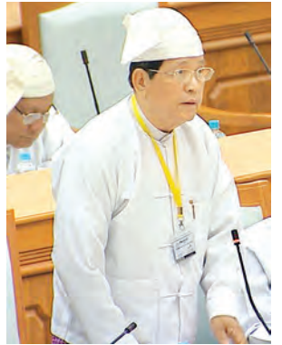
ဒုတိယဝန်ကြီး ဦးတင်ဌေ ရှင်းလင်းတင်ပြစဉ်။ (သတင်းစဉ်)

ယင်းနောက် မွန်ပြည်နယ် လမ်းပန်းဆက်သွယ်ရေးဝန်ကြီးအဖြစ် ပူးတွဲတာဝန်ပေးအပ်ခြင်းကို ပယ်ဖျက်