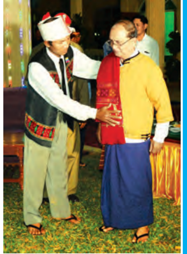
နိုင်ငံတော်သမ္မတ ဦးသိန်းစိန်အား ဒေသခံတိုင်းရင်းသားရိုးရာ ယဉ်ကျေးမှုအဖွဲ့က တိုင်းရင်းသားရိုးရာဝတ်စုံကို ဂါရဝပြုဝတ်ဆင်ပေးစဉ်။