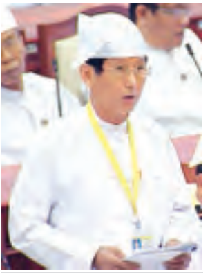
ဒုတိယဝန်ကြီး ဦးသန်းထွန်း အောင် ဖြေကြားစဉ်။ (သတင်းစဉ်)

ရှု၊ မရှိ” မေးခွန်းနှင့်စပ်လျဉ်း၍ လျှပ်စစ်စွမ်းအားဝန်ကြီးဌာန ဒုတိယ ဝန်ကြီး ဦးအောင်သန်းဦးက ရခိုင် ပြည်နယ်အတွင်းရှိ ပြည်သူ့လူထု အတွက် နိုင်ငံတော်ဓာတ်အားစနစ်မှ ဓာတ်အားကို ၂၀၁၄ ခုနှစ် ဒီဇင်ဘာ လအတွင်း ပို့လွှတ်ဖြန့်ဖြူးထားပြီး ဖြစ်ပါကြောင်း၊ ကျောက်တော်ဒေသ သို့ လျှပ်စစ်ဓာတ်အားဖြန့်ဖြူးရန် ပုဏ္ဏားကျွန်း-ကျောက်တော် ၆၆ ကေပီဓာတ်အားလိုင်းနှင့် ဓာတ်အား ခွဲရုံစီမံကိန်းအား ၂၀၁၄ ခုနှစ် နိုဝင် ဘာ ၃၀ ရက်နေ့တွင် ဓာတ်အားပို့ လွှတ်ပြီးဖြစ်ပါကြောင်း၊ ကျောက် တော်မှတစ်ဆင့် ပလက်ဝဒေသသို့ ဓာတ်အားစနစ်မှ ဓာတ်အားဖြန့်ဖြူး ပေးနိုင်ရန် ကျောက်တော်-ပလက်ဝ ၆၆ ကေပီ ဓာတ်အားလိုင်းနှင့် ဓာတ်အားခွဲရုံစီမံကိန်းအား နိုင်ငံ တော်၏ဘဏ္ဍာငွေ ခွဲဝေပေးနိုင်မှု အခြေအနေရ ၂၀၁၅-၂၀၁၆ ဘဏ္ဍာ ရေးနှစ်တွင် ပါဝင်ရန်ကြိုးစားခဲ့ သော်လည်း မပါရှိပါသဖြင့် နောင် လာမည့် ဘဏ္ဍာရေးနှစ်များတွင်