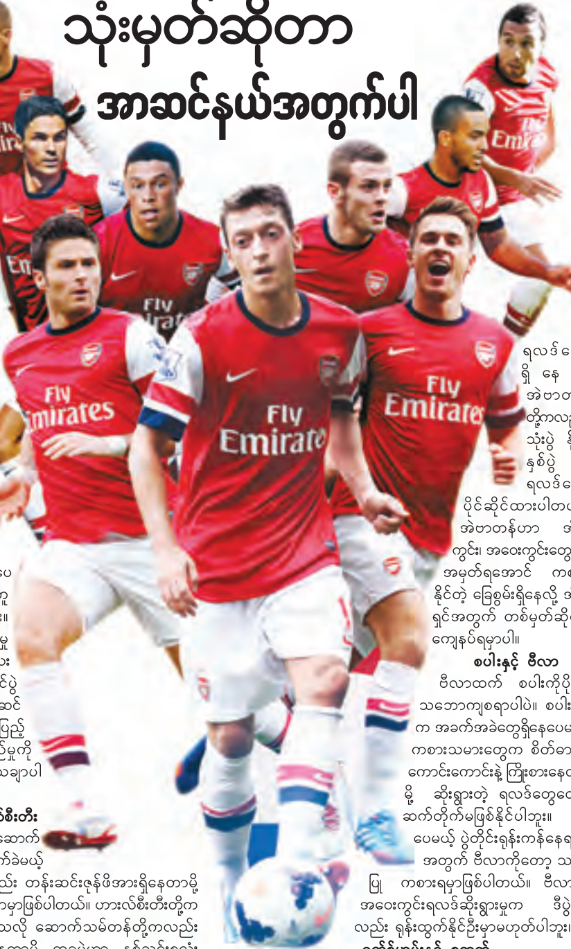
ရလဒ်တွေရှိနေပြီး အဲဗာတန်တို့ကလည်း သုံးပွဲနိုင်၊ နှစ်ပွဲရှုံးရလဒ်တွေပိုင်ဆိုင်ထားပါတယ်။ အဲဗာတန်ဟာ အိမ်ကွင်း၊ အဝေးကွင်းတွေမှာ အမှတ်ရအောင် ကစားနိုင်တဲ့ ခြေစွမ်းရှိနေလို့ အိမ်ရှင်အတွက် တစ်မှတ်ဆိုရင် ကျေနပ်ရမှာပါ။

ဆွမ်ဆီးနှင့် အဲဗာတန် နှစ်သင်းစလုံးရလဒ်ကောင်းအောင် ကစားနိုင်နေတဲ့ အသင်းတွေဖြစ်ပြီး ဒီပွဲမှာ အမှတ်ပြည့်ရယူရေး အပြိုင်ကြိုးစားကြပါလိမ့်မယ်။ ဆွမ်ဆီးရဲ့ နောက်ဆုံးငါးပွဲရလဒ်ကိုကြည့်ရင် သုံးပွဲနိုင်၊ နှစ်ပွဲရှုံး