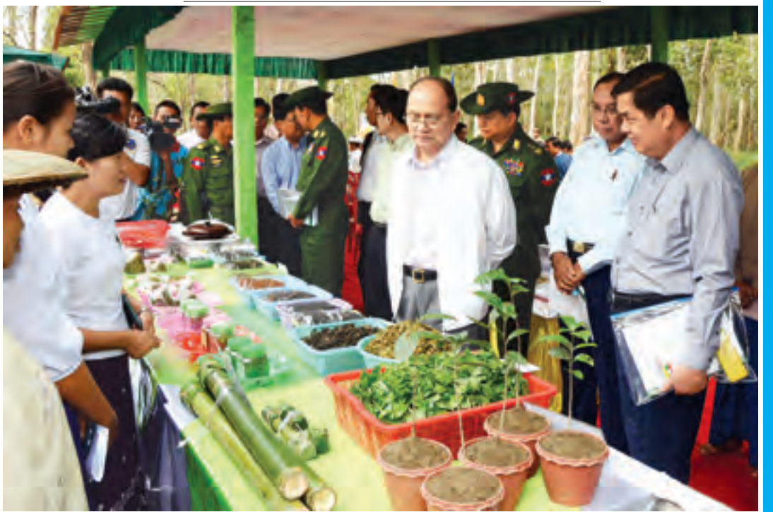
နိုင်ငံတော်သမ္မတ ဦးသိန်းစိန် ဟုမ္မလင်း-ခန္တီးလမ်းရှိ ဒေါ်သိန်းကြွယ်လက်ဖက်ခြံရှိ လက်ဖက်အခြေခံထုတ်ကုန်ပစ္စည်းများ ကြည့်ရှုစစ်ဆေးစဉ်။(ဓာတ်ပုံ-ပြန်/ဆက်)