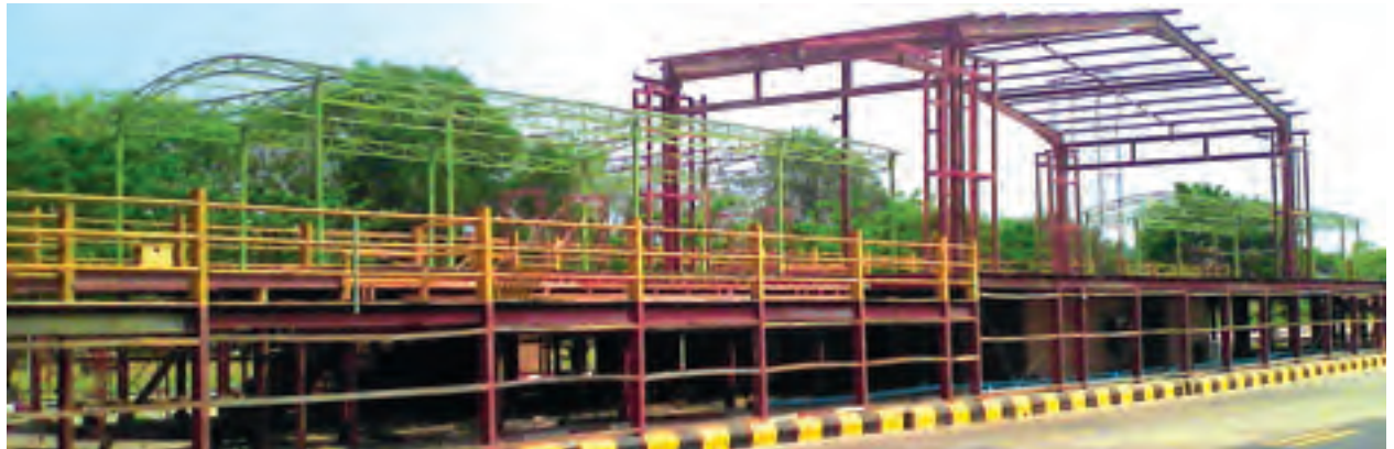
သင်္ကြန်ကာလတွင် သင်္ကြန်ချစ်သူများအတွက် ဖျော်ဖြေမည့် နေပြည်တော်ဟိုတယ်ဖုန်းနံပါတ် ရွှေဇည့်သည်ဟိုတယ်၏ ရွှေသံလွင်မဏ္ဍပ်ဆောက်လုပ်နေမှုကို ဧပြီ ၇ ရက်က တွေ့ရစဉ်။

ရှိခဲ့ရင် ဘလုတ်ညွှန်မီးဘေးက ဒီလောက်အထိ အလောင်ခံရမှာ မဟုတ်ဘူး။ မီးသတ်ကားတွေ အမြန်ဆုံး ရောက်သွားနိုင်ပြီး အချိန်တိုအတွင်းမှာ ငြိမ်းသတ်ပေးနိုင်ခဲ့မှာပါ” ဟု သုံးသပ်ပြောကြားခဲ့သည်။