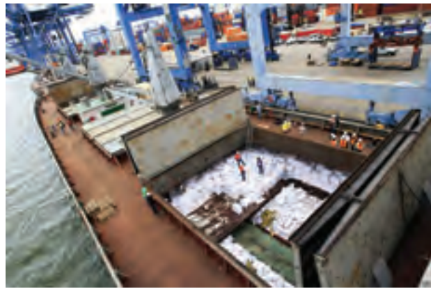
ပန်းမား၌ ဖမ်းဆီးခဲ့သည်။

မြောက်ကိုရီးယား ပင်လယ်ရေ ကြောင်း စီမံခန့်ခွဲမှုအဖွဲ့ပိုင် အဆိုပါ သင်္ဘောသည် ကုလသမဂ္ဂ၏ အမည် ပျက်စာရင်းတွင် ပါဝင်ကြောင်း ကုလ သမဂ္ဂကျွမ်းကျင်သူတစ်ဦးက ပြောခဲ့ သည်။ အဆိုပါရေကြောင်း စီမံခန့်ခွဲ အဖွဲ့ပိုင်သင်္ဘောများအနက် သင်္ဘော တစ်စင်းပေါ်တွင် ဆိုဗီယက်ခေတ် လက်နက်များနှင့် တိုက်ခိုက်ရေး ဂျက်လေယာဉ်များ တရားမဝင် သယ်ဆောင်လာခြင်းကို တွေ့ရှိပြီး နောက် ၂၀၁၃ ခုနှစ် ဇူလိုင်လတွင်