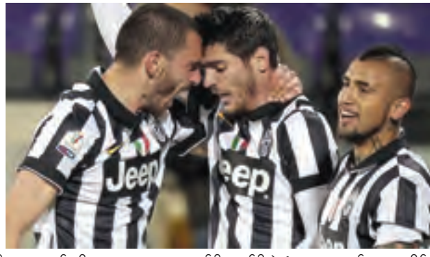
ဂျူဗင်တပ်စ်က ဖီအိုရင်တီးနားအသင်းကို ပထမအကျော့မှာ နှစ်ဂိုး-တစ်ဂိုးနဲ့ ရှုံးထားပေမယ့် အခုအနိုင်ရလဒ်ကြောင့် နောက်ဆုံးပိုလ်လုပွဲသို့ တက်ရောက်ခဲ့ခြင်းဖြစ်ပါတယ်။ ဂျူဗင်တပ်စ်ဟာ ဝိုင်းလှည့်မှာ နာပိုလီသို့မဟုတ် လာဇီယိုနဲ့ ကစားရမှာဖြစ်ပါတယ်။ ဂျူဗင်တပ်စ်တို့ ဒီနှစ်ရာသီမှာ အနည်းဆုံး ဖလား နှစ်လုံးရယူနိုင်မယ့် အနေအထားရှိပါတယ်။ လောလောဆယ် စီးရီးအေမှာလည်း ၁၄ မှတ်အသာ ရထားပါတယ်။ ချန်ပီယံလိဂ်မှာလည်း ကွာတားတက်လာပြီး မိုနာကိုနဲ့ ကစားရမှာဖြစ်လို့ ဖလား ဆွတ်ခူးဖို့ အလားအလာကောင်းတွေ ရရှိထားပါတယ်။ အင်္ဂါနေ့က အနိုင်ရတဲ့ပွဲမှာ ကားလို့တီဗက်စ် ပါလို့ ပေါ့ဘာနဲ့ လက်ချင်စတိန်းနားတို့ ဒဏ်ရာကြောင့် မပါဝင်ခဲ့ပေမယ့် အနိုင်ရအောင် ကစားနိုင်ခဲ့ပါတယ်။ ဂျူဗင်တပ်စ်တို့ ဒီပွဲ ဝိုင်းပြတ်အနိုင်ရလိုက်တဲ့အတွက် ၁၉၉၅ ခုနှစ်နောက်ပိုင်း ကိုပါအီတာလီယာပလားကို ပထမဆုံးအကြိမ်ဆွတ်ခူးနိုင်ဖို့ မျှော်လင့်ထားပါတယ်။

စီးရီးအေ ချန်ပီယံ ဂျူဗင်တပ်စ် အသင်းဟာ ဖီအိုရင်တီးနားကို သုံးဂိုးပြတ်နဲ့ အနိုင်ရသွားပြီး ဖြစ်တဲ့ အတွက် ကိုပါအီတာလီယာပလား ဝိုင်းလှည့် တက်ရောက်သွားပြီဖြစ်ပါတယ်။ ဂျူဗင်တပ်စ်က ဖီအိုရင်တီးနားအသင်းကို ပထမအကျော့မှာ နှစ်ဂိုး-တစ်ဂိုးနဲ့ ရှုံးထားပေမယ့် အခုအနိုင်ရလဒ်ကြောင့် နောက်ဆုံးပိုလ်လုပွဲသို့ တက်ရောက်ခဲ့ခြင်းဖြစ်ပါတယ်။ ဂျူဗင်တပ်စ်ဟာ ဝိုင်းလှည့်မှာ နာပိုလီသို့မဟုတ် လာဇီယိုနဲ့ ကစားရမှာဖြစ်ပါတယ်။ ဂျူဗင်တပ်စ်တို့ ဒီနှစ်ရာသီမှာ အနည်းဆုံး ဖလား နှစ်လုံးရယူနိုင်မယ့် အနေအထားရှိပါတယ်။ လောလောဆယ် စီးရီးအေမှာလည်း ၁၄ မှတ်အသာ ရထားပါတယ်။ ချန်ပီယံလိဂ်မှာလည်း ကွာတားတက်လာပြီး မိုနာကိုနဲ့ ကစားရမှာဖြစ်လို့ ဖလား ဆွတ်ခူးဖို့ အလားအလာကောင်းတွေ ရရှိထားပါတယ်။ အင်္ဂါနေ့က အနိုင်ရတဲ့ပွဲမှာ ကားလို့တီဗက်စ် ပါလို့ ပေါ့ဘာနဲ့ လက်ချင်စတိန်းနားတို့ ဒဏ်ရာကြောင့် မပါဝင်ခဲ့ပေမယ့် အနိုင်ရအောင် ကစားနိုင်ခဲ့ပါတယ်။ ဂျူဗင်တပ်စ်တို့ ဒီပွဲ ဝိုင်းပြတ်အနိုင်ရလိုက်တဲ့အတွက် ၁၉၉၅ ခုနှစ်နောက်ပိုင်း ကိုပါအီတာလီယာပလားကို ပထမဆုံးအကြိမ်ဆွတ်ခူးနိုင်ဖို့ မျှော်လင့်ထားပါတယ်။