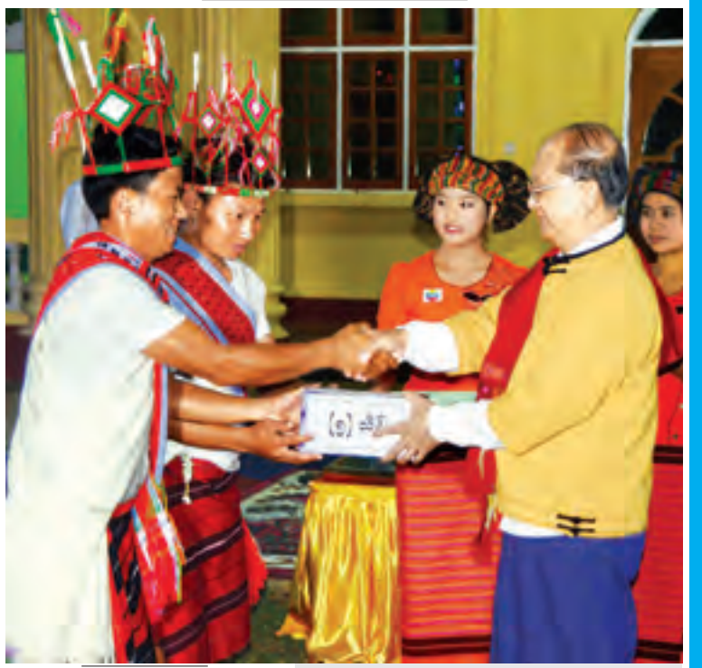
နိုင်ငံတော်သမ္မတ ဦးသိန်းစိန် နှင့် အဖွဲ့ဝင်များ ခန္တီးလေဆိပ်မှ ပြန်လည်ထွက်ခွာစဉ်။