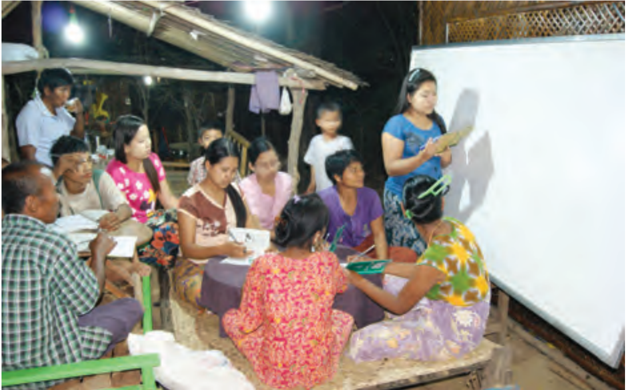
၂၀၁၅ ခုနှစ် အခြေခံစာတတ်မြောက်ရေး လှုပ်ရှားမှုကို မြန်မာနိုင်ငံတစ်ဝန်းလုံးတွင် ဆောင်ရွက်လျက်ရှိရာ မြင်းမူမြို့နယ်အပြင် အခြားမြို့နယ်များ၌လည်း တက္ကသိုလ်ကျောင်းသား ကျောင်းသူများ၊ အခြေခံပညာကျောင်းများမှ လုပ်အားပေး ဆရာ ဆရာမများစုပေါင်း၍ ရပ်ကွက်ကျေးရွာများသို့ ကွင်းဆင်းပြီး စာသင်ပိုင်းများဖြင့် စာမတတ်သူများ စာရေးစာဖတ်နိုင်စေရန် သင်ကြားပေးလျက်ရှိသည်။ ဆောင်နိုးစေ (iprd)

မြင်းမူမြို့နယ်တွင် ၂၀၁၅ ခုနှစ် အခြေခံစာတတ်မြောက်ရေးလှုပ်ရှားမှုအဖြစ် စာသင်ကြားမှုများကို ဧပြီ ၁ ရက်မှ မေ ၁၅ ရက်အထိ ၄၅ ရက်ကြာ ဆောင်ရွက်သွားမည်ဖြစ်သည်။