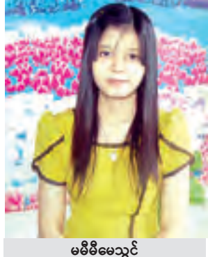
မိမိမိမေဇွင်

လယ်များနှင့် လေ့လာသူများအား ချိတ်ပိတ်ထားတဲ့ အခြေအနေအတိုင်း ကိုပြသပြီးမှ မဲပုံးကိုဖွင့်ဖောက်မှာဖြစ်ပါတယ်။ မဲစာရင်းရေတွက်တဲ့အခါမှာလည်း ကြိုတင်ဆန္ဒမဲပုံးမှ မဲများကို ဦးစွာဖွင့်ဖောက်ရေတွက်လည်း ရွေးကော်မရှင်အဖွဲ့ဝင်များအားလုံးကို ကြည့်ရှုခွင့်ပြုမှာဖြစ်ပါတယ်။ မဲရေတွက်ရာမှာ ဆန္ဒမဲလက်မှတ်တစ်စောင်ချင်းစီကို မဲရုံအဖွဲ့ဝင်များ သက်သေများ၊ မဲရုံကိုယ်စားလှယ်များကို ပြသရေတွက်သွားမှာပါ။ ပယ်မဲအဖြစ် သတ်မှတ်ခံရတဲ့ဆန္ဒမဲလက်မှတ်များကို လွှတ်တော်ကိုယ်စားလှယ်နဲ့အကူကိုယ်စားလှယ်များကို ကြည့်ရှုခွင့်ပြုသွားမှာဖြစ်ပါတယ်။ အဓိကပြောလေးလေးတာကတော့(အမှန်) အမှတ်အသားပါသောဆိပ်တုံးနဲ့ပေးပြီးဆန္ဒပြုရန် စီစဉ်ထားတဲ့အပြင် မဲပေးပြီးသူတိုင်း နောက်တစ်ကြိမ်မဲထပ်မံမဲပေးနိုင်ရန် လက်မှာ မင်တို့သင်္ကေတပြုစုစနစ်ကို ကျင့်သုံးသွားခြင်းပဲဖြစ်ပါတယ်။