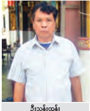
ဦးသန်းထွန်း

ပြည်သူများအနေနဲ့ မဲစာရင်းကြေညာတဲ့အချိန်မှာ မပြစ်မနေလာရောက်ကြည့်ရှုဖို့ လိုအပ်ပါတယ်။ ဒါမှသာ မိမိရဲ့မဲပေးခွင့် အခွင့်အရေးမဆုံးရှုံးမှာဖြစ်ပါတယ်။ မဲစာရင်းကြေညာမယ့်ရက် အတိအကျသိပြီဆိုရင်လည်း မိဒီယာတွေကို ဖိတ်ခေါ်ပြီး အများပြည်သူသိအောင် ရှင်းလင်းပြောကြားသွားမှာပါ။ နိုင်ငံရေးပါတီအားလုံးကိုလည်း မဲစာရင်းကြေညာမယ့်ကိစ္စနဲ့ပတ်သက်ပြီး ရှင်းလင်းပြောကြားကာ မိမိတို့စည်းရုံးရေးနယ်မြေရှိ ပြည်သူတွေ မဲစာရင်းလာရောက်ကြည့်ရှုစေဖို့အတွက် စည်းရုံးပညာပေးလှုံ့ဆော်ရန် အသိပေးထားပြီးဖြစ်ပါတယ်။ ၂၀၁၅ ခုနှစ် ရွေးကောက်ပွဲမှာပွင့်လင်းမြင်သာ အောင်စီစဉ်ထားတဲ့ ထူးခြားချက်တွေကတော့ ကြိုတင်ဆန္ဒမဲပေးသူများရဲ့ အမည်စာရင်းကို မဲရုံတွေမှာကပ်ပြီး ကြေညာထားမယ်။ ကြိုတင်ဆန္ဒမဲပေးခြင်းကို သက်ဆိုင်ရာ လွှတ်တော်ကိုယ်စားလှယ်၊ ၎င်း၏ ရွေးကောက်ပွဲကိုယ်စားလှယ်၊ မဲရုံကိုယ်စားလှယ်နှင့် အကူကိုယ်စားလှယ်တို့ကို လိုက်ပါကြည့်ရှုခွင့်ပေးမှာဖြစ်ပါတယ်။ မဲရုံပိတ်ချိန်ညနေ ၄ နာရီနောက်ပိုင်းရောက်ရှိလာတဲ့ ကြိုတင်ဆန္ဒမဲများကို လက်ခံမှာမဟုတ်ပါဘူး။ မဲရေတွက်ရန်အတွက် ကြိုတင်ဆန္ဒမဲပေးဖွင့်မိမိရုံကိုယ်စား