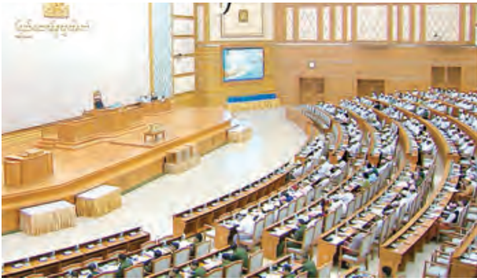
ပြည်ထောင်စုလွှတ်တော်အစည်းအဝေးကျင်းပစဉ်။ (သတင်းစဉ်)

နေပြည်တော် ဧပြီ ၉ ယနေ့မနက်လွဲပိုင်းတွင် ကျင်းပသည့် ပြည်ထောင်စုလွှတ်တော်(၁၂) ကြိမ်မြောက်ပုံမှန်အစည်းအဝေး ၄၁ ရက်မြောက်နေ့တွင် အမြဲတမ်းအတွင်းဝန်/တာဝန်ခံ ညွှန်ကြားရေးမှူးချုပ် ရာထူးများ ခန့်အပ်ခြင်းနှင့် လစဉ် ချီးမြှင့်ငွေပေးအပ်ခြင်းဆိုင်ရာ အဆိုနှင့် လွှတ်တော်အိမ်ရာဆောက်လုပ်နိုင်ရေးဆိုင်ရာအဆိုတို့ကို တင်သွင်း ဆွေးနွေးပြီး လွှတ်တော်၏ အဆုံးအဖြတ်ရယူခဲ့ကြသည်။