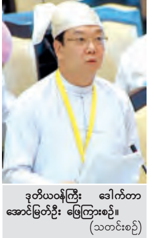
ဒုတိယဝန်ကြီး ဒေါက်တာအောင်မြတ်ဦး ဖြေကြားစဉ်။ (သတင်းစဉ်)

နေပြည်တော် ဧပြီ ၉ အမျိုးသားလွှတ်တော် (၁၂)ကြိမ်မြောက် ပုံမှန်အစည်းအဝေး ၄၄ ရက်မြောက်နေ့ကို ယနေ့နံနက်ပိုင်းက နေပြည်တော်၊ အမျိုးသားလွှတ်တော်အဆောက်အအုံအစည်းအဝေးခန်းမတွင် ဆက်လက်ကျင်းပသည်။ အစည်းအဝေးတွင် မန္တလေးတိုင်းဒေသကြီး မဲဆန္ဒနယ်အမှတ် (၁၀) မှ ဦးစိုးအောင်၏ “မိတ္ထီလာမြို့နယ်အတွင်း အမြန်လမ်းမကြီးနှင့် ရေဝေ-သဖန်းချောင်း ဆက်သွယ်သည့် လမ်းအရှည် ၈ မိုင်အား အမာခံလမ်းအဖြစ်ဖောက်လုပ်ပေးရန် အစီအစဉ်