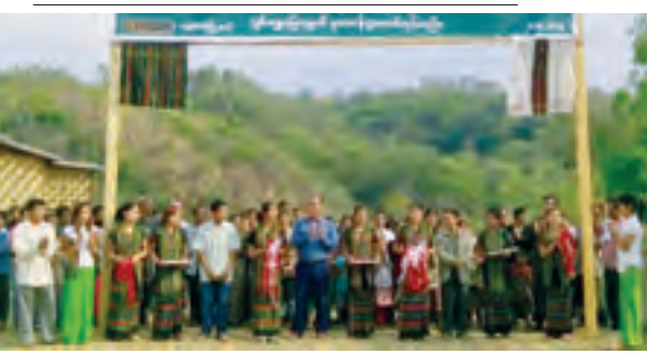
တွန်းဇံမြို့နယ် ကျေးလက်ဒေသဖွံ့ဖြိုးတိုးတက်ရေးဦးစီးဌာနက ဆောင်ရွက်သော မာအိုဝမ်-မိုင်ဗက် လမ်းသစ် ငါးမိုင်ဖောက်လုပ်ပြီးစီးမှု ဖွင့်ပွဲကို မတ်လနောက်ဆုံးပတ်က တာဝန်ရှိသူများ ဖဲကြီးဖြတ်ဖွင့်လှစ်ပေးစဉ်။ နေစု(ချင်းရိုးမ)

ကော်မရှင်လုပ်ငန်းရပ်များနှင့် အထွေထွေရွေးကောက်ပွဲအတွက် မဲရုံများလျာထားသတ်မှတ်နိုင်ရေး လုပ်ငန်းညှိနှိုင်းအစည်းအဝေးကို ဧပြီ ၅ ရက်က ရှမ်းပြည်နယ် (မြောက်ပိုင်း) သီပေါမြို့နယ် ရွေးကောက်ပွဲကော်မရှင်အဖွဲ့ခွဲ နှင့် ကျွမ်းကျင်ပညာရှင် စာသင်ကျောင်းများ၊ ဌာနဆိုင်ရာအဆောက်အအုံများ မရှိသော အရပ်ဒေသများ၌ သီးခြားမဲရုံများ ဆောက်လုပ်နိုင်ရေး ကြိုတင်ဆောင်ရွက်ထားရန်တို့ကို တာဝန်ရှိသူများက ဆွေးနွေးကြသည်။ ထို့နောက် မြို့နယ်အတွင်းရှိ ကျေးရွာအုပ်စု ၆၇ အုပ်စုနှင့် ရပ်ကွက် ၁၁ ရပ်ကွက်တို့တွင် အထွေထွေရွေးကောက်ပွဲအတွက် မဲရုံများ ဆောက်လုပ်မည့်နေရာများကို လျာထားသတ်မှတ်ညှိနှိုင်းကြကြောင်း သိရသည်။