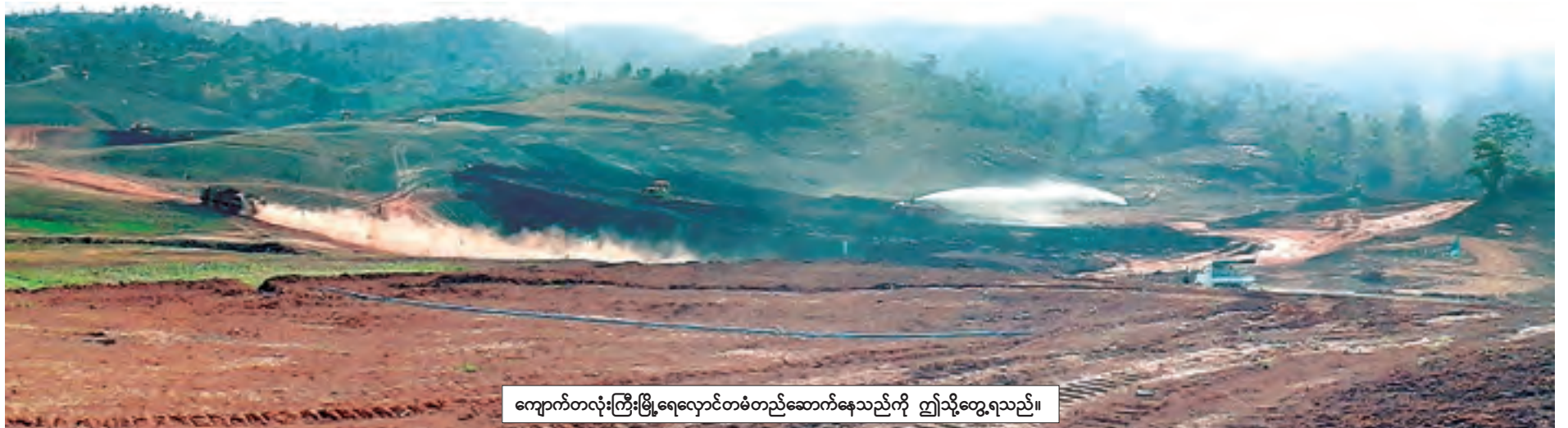
ကျောက်တလုံးကြီးမြို့ရေလှောင်တံတည်ဆောက်နေသည်ကို ဤသို့တွေ့ရသည်။

တစ်ဖန် ကျောက်တလုံးကြီးမြို့ရေရရှိရေးအတွက် မြောက်ဘက်မြို့အဝင်အနီးတွင် ကျောက်တလုံးကြီးမြို့ရေလှောင်တံတည်ဆောက်နေသည်ကို တွေ့ရသည်။ အဆိုပါ ရေလှောင်တံသည် မြေသားတံအမျိုးအစားဖြစ်ပြီး အမြင့် ပေ ၄၀၊ အလျား ၁၄၇၃ ပေ၊ အနံ ပေ ၂၀၀၊ တံအတွင်း ကန်ရေပြည့်ရေလှောင်ပမာဏမှာ ၂၈၆ ဒသမ ၅ ဧကပေဖြစ်ပြီး ခွင့်ပြုငွေကျပ် ၄၃၇ ဒသမ ၄ သန်းဖြင့် ၁၉-၁-၂၀၁၅ ရက်က စတင်ဆောင်ရွက်လျက်ရှိရာ ၅၅ ရာခိုင်နှုန်းခန့် ပြီးစီးနေပြီဖြစ်ကြောင်းသိရသည်။