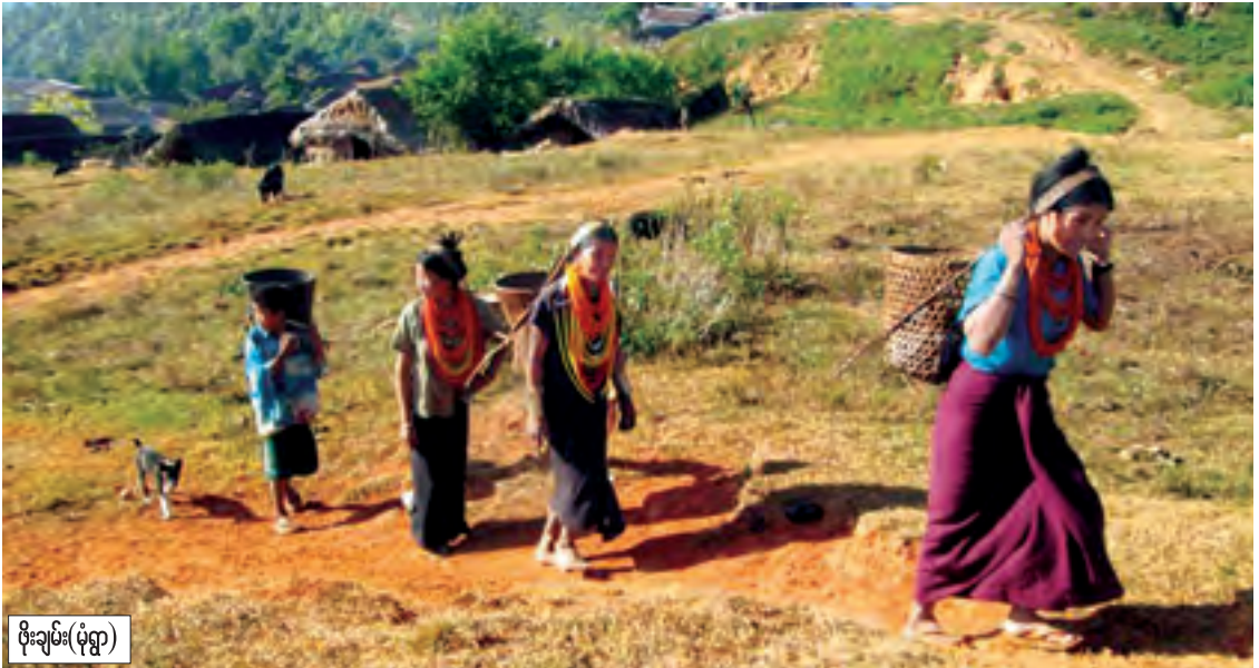
ဖိုးချမ်း(မုံရွာ)

နာဂဒေသသည် တောင်တန်းများပေါ်တွင် မြို့တည်ထားသဖြင့် ရာသီဥတုအနေအထားမှာ အလွန်နေအေးစဖွယ်ကောင်းလှပြီး တောင်တန်းပေါ်မှ အဝေးသို့ ရှုမျှော်လိုက်လျှင် တွေ့မြင်ရသည့် တောင်ယာတလေးများနှင့် တောင်တန်းများကို ခါးပတ်ထားသည့် ဘော်ငွေရောင်အဆင်းရှိ မြူများ ဆိုင်းနေသည့် မြင်ကွင်းသည် စိတ်မခိုင်သူများအတွက် အလွန်တရာ လှမ်းဆွေးဖွယ်ကောင်းလှပြီး နာဂတောင်တန်းဒေသသို့ တစ်ခါတစ်ခေါက် ရောက်ခဲ့လျှင်လည်း ရောက်ဖူးသူများကို မပြန်ချင်အောင် အေးချမ်းသာယာလှပမှုများစွာနှင့် ဆွဲဆောင်နိုင်စွမ်းရှိသည့်ဒေသဖြစ်ကာ ယခင်ကာလများနှင့်မတူ တစ်မူထူးခြားစွာ ဖွံ့ဖြိုးသာယာလှပနေသည့် နာဂကိုယ်ပိုင်အုပ်ချုပ်ခွင့်ရဒေသသို့ အလည်တစ်ခေါက်လာရောက်လေ့လာဖို့ စိတ်ဝင်လိုက်ရပါကြောင်း ရေးသားတင်ပြလိုက်ပါသည်။