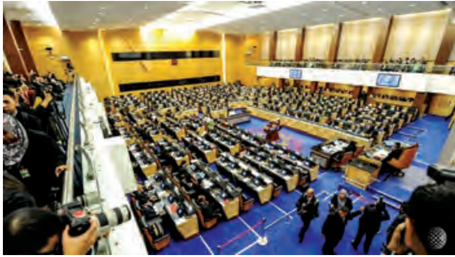
မလေးရှားလွှတ်တော်ကို တွေ့ရစဉ်။