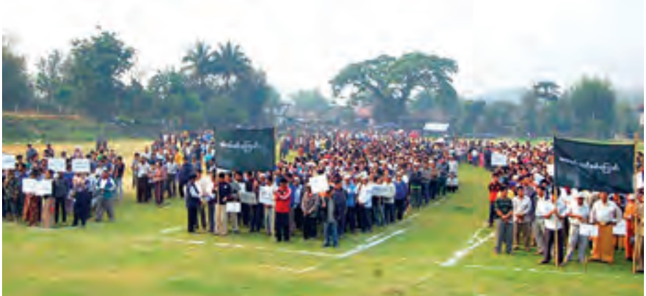
တစ်နိုင်ငံလုံး အပစ်အခတ်ရပ်စဲရေးအတွက် စီတန်းလှည့်လည် ဆန္ဒဖော်ထုတ်ခဲ့ကြသည်။ ဧပြီ ၄ ရက် နံနက်ပိုင်းကလည်း

ဆန္ဒဖော်ထုတ်ခဲ့ကြသည်။ ထို့အတူ မိုင်းယောင်းမြို့၌ အင်အား ၅၀၀ ခန့်သည် စုရပ်အသီးသီးမှ ဗလမင်းထင်လမ်းမကြီးနှင့် နန်းဆီလမ်းအတိုင်း မြို့မအားကစားကွင်းသို့ ငြိမ်းချမ်းစွာ စုပေါင်းလှည့်လည် ဆန္ဒဖော်ထုတ်ခဲ့ကြသည်။ (ဟာပုံ) ထို့ပြင် နမ်းခမ်းမြို့၌ ဒေသခံပြည်သူ ၃၀၀ ကျော်တို့သည် နမ်းခမ်းပြည်ထောင်စုလမ်းမကြီးအတိုင်း နောင်စန်ရပ်ကွက်မှ စတင်၍