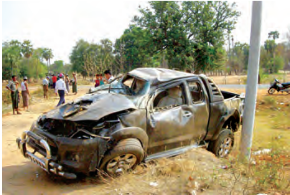
ကျော်ဇေယျ

နေရာ၌ သေဆုံးသွားခဲ့ကြောင်း၊ ထိုသေဆုံးသူကို ရဲဆေးစာဖြင့် မကွေးတိုင်းဒေသကြီး ပြည်သူ့ဆေးရုံသို့ ပေးပို့ထားရှိခဲ့ကြောင်း သက်ဆိုင်ရာ အမှုစစ်ရဲအရာရှိတစ်ဦးက ပြောကြားသည်။