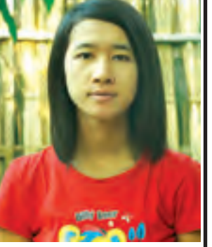
မအေးသီတာစိုး

ကို မဲပေးခဲ့တယ်။ ဒါပေမယ့် ကိုယ်မဲ ပေးခဲ့တဲ့ လူတချို့ကပဲ တကယ် မြို့နဲ့ ဒေသခံတွေအတွက် လွတ်တော် အတွင်းမှာ ကြိုးစားဆောင်ရွက်ပေး