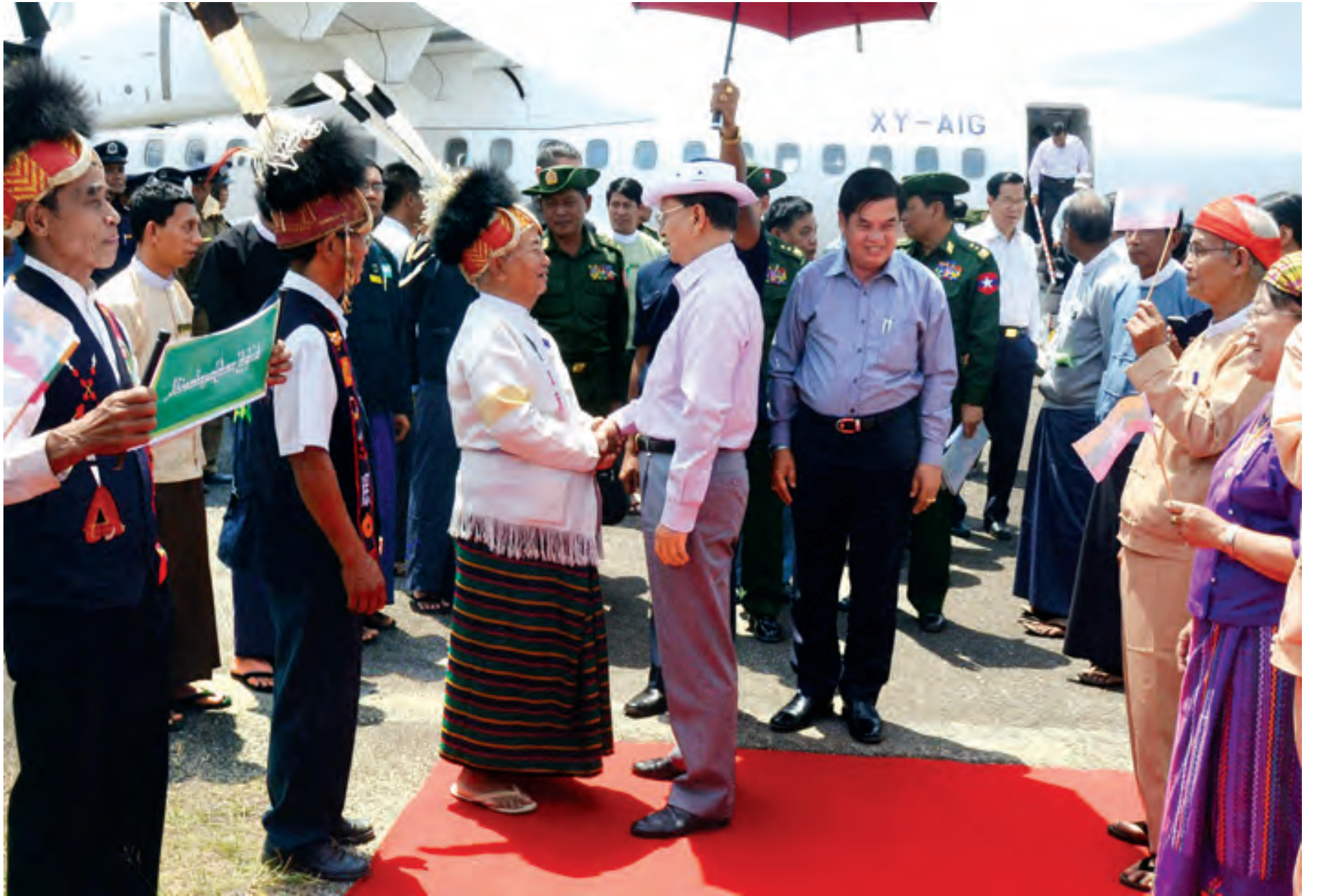
နိုင်ငံတော်သမ္မတ ဦးသိန်းစိန် ခန္တီးမြို့သို့ရောက်ရှိရာ ဒေသခံများက ကြိုဆိုကြစဉ်။