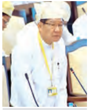
ဒုတိယဝန်ကြီး ဦးခင်ဇော် ဖြေကြားစဉ်။ (သတင်းစဉ်)

နန်းတပ်ချောင်းဘေး ဝဲ/ယာ တစ်လျှောက်ရှိ လယ်မြေဧရိယာ ၅၅၀ ဧကခန့်သည် နန်းတပ်ချောင်းရေဖြင့် စပါးစိုက်ပျိုးလျက်ရှိပါကြောင်း၊ နန်းတပ်ချောင်းကိုတစ်ပိတ်၍ ရေပေးဝေမည်ဆိုပါက လက်ရှိဧကအပြင် လယ်မြေ ၁၅၀ ဧကခန့်အားတိုးချဲ့ စိုက်ပျိုးနိုင်မည်ဖြစ်ပါကြောင်း၊ သို့ရာတွင် လုပ်ငန်းများဆောင်ရွက်နိုင်ရန်အတွက် ၂၀၁၅-၂၀၁၆ခု၊ ဘဏ္ဍာရေးနှစ် တိုင်းဒေသကြီးအစိုးရအဖွဲ့ရန်ပုံငွေတွင် တင်ပြတောင်းခံခြင်း မရှိပါသဖြင့် လတ်တလောတွင် ဆောင်ရွက်ပေးနိုင်ခြင်း မရှိသေးပါကြောင်းဖြင့် ဖြေကြားသည်။