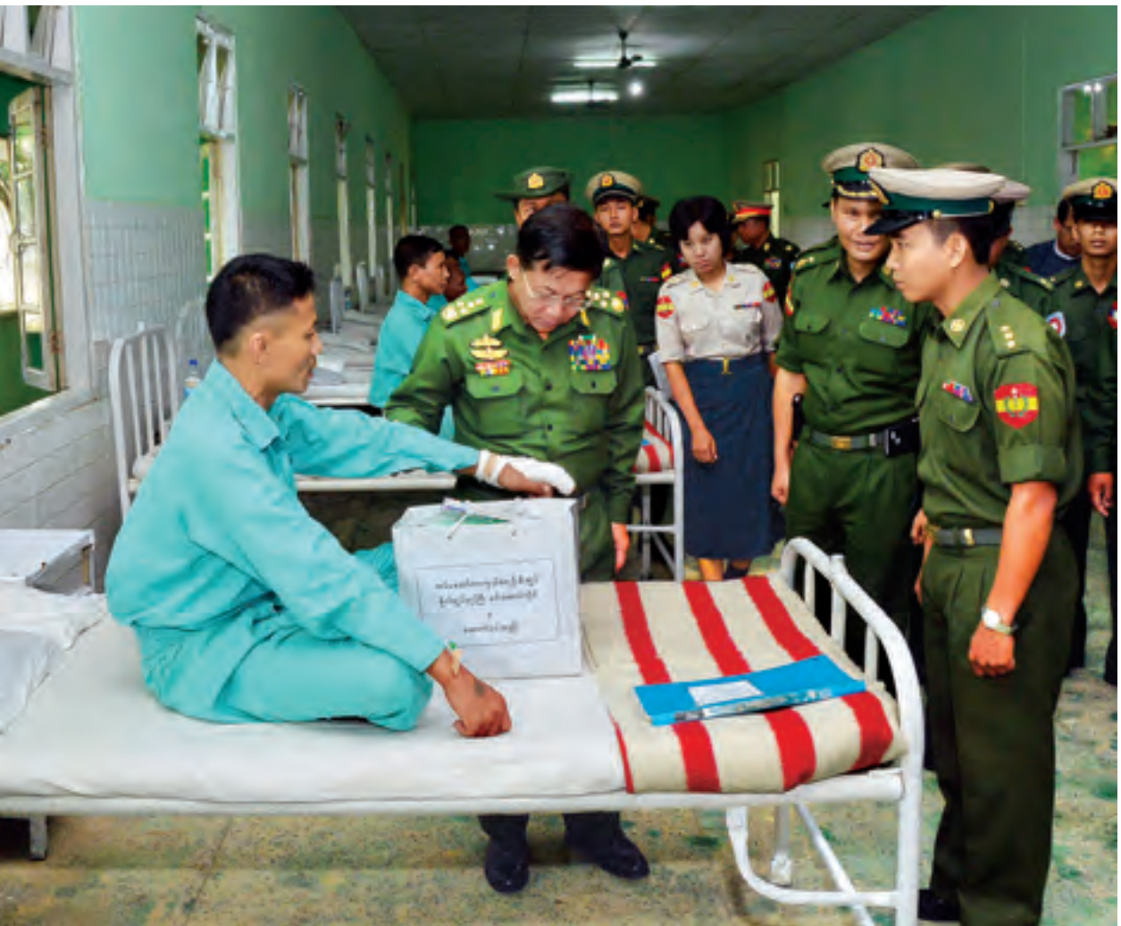
တပ်မတော်ကာကွယ်ရေးဦးစီးချုပ် ဗိုလ်ချုပ်မှူးကြီး မင်းအောင်လှိုင် စစ်တွေတပ်နယ်တပ်မတော်ဆေးရုံ၌ ဆေးကုသမှုခံယူနေသော တပ်မတော်သားများအား ကြည့်ရှုအေးပေးစဉ်။ (မြဝတီ)

အဆိုပါ အခမ်းအနားသို့ တပ်မတော်ကာကွယ်ရေး ဦးစီးချုပ် နှင့်အတူဇနီး ဒေါ်ကြူကြူလှ၊ ရခိုင်ပြည်နယ် ဝန်ကြီးချုပ် ဦးမောင်မောင်အုန်း၊ ကာကွယ်ရေးဦးစီးချုပ် ရုံးမှ တပ်မတော်အရာရှိကြီးများ၊ အနောက်ပိုင်းတိုင်းစစ်ဌာနချုပ်တိုင်းမှူး၊ ပြည်နယ်အစိုးရအဖွဲ့ဝင်ဝန်ကြီးများ၊ လွှတ်တော် ကိုယ်စားလှယ်များ၊ NGO အဖွဲ့ အစည်းများ၊ ပြည်နယ်၊ ခရိုင်၊ မြို့နယ်ဌာနဆိုင်ရာများ၊ မြို့မိ မြို့ဖများ၊ ဒေသခံပြည်သူများနှင့် စေတနာရှင်အလှူရှင်များ တက်ရောက်ကြသည်။