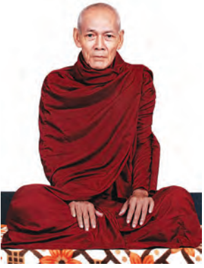
သာသနာရေးဦးစီးဌာနမှ သတင်း ရရှိသည်။ (သတင်းစဉ်)