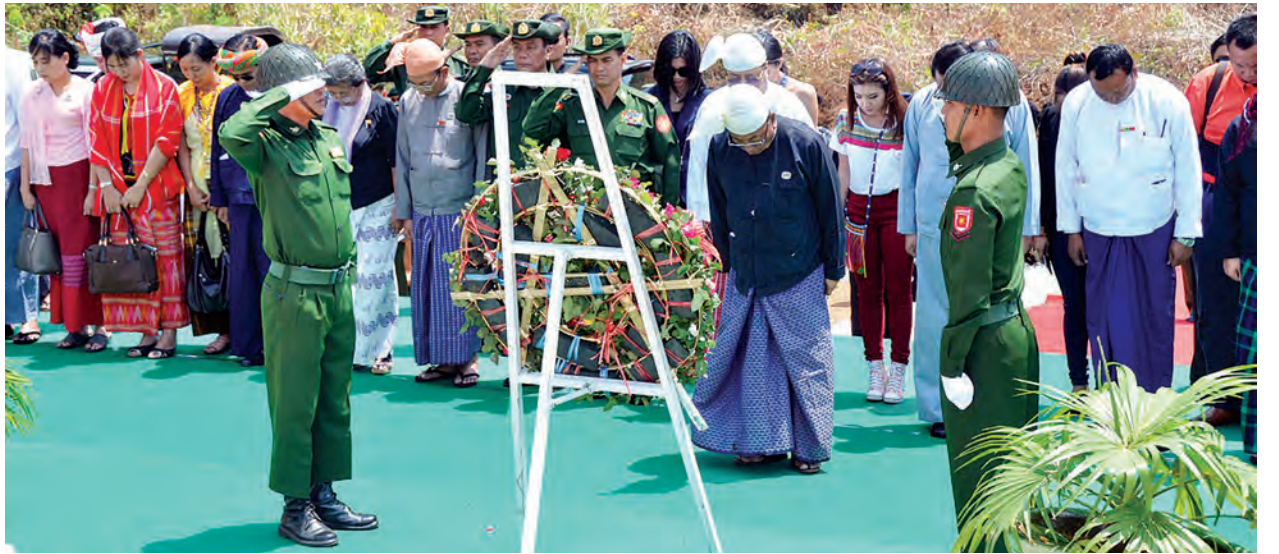
အမျိုးသားလွှတ်တော်ဥက္ကဋ္ဌ ဦးခင်အောင်မြင့်နှင့် အမျိုးသားလွှတ်တော်ကိုယ်စားလှယ်များ လားရှိုးမြို့ အညတရစစ်သည်ဗိမာန်၌ နိုင်ငံတော်အတွက် အသက်ပေးဆက်သူများကို ဂုဏ်ပြုအလေးပြုစဉ်။ (သတင်းစဉ်)

တရုတ်ဖြူလက်ထဲတွင် ဘိန်းကုန်ကူးခဲ့သော ဖုန်ကြားရှင်သည် ကွန်မြူနစ်ဘဝ၌လည်း ဘိန်းလုပ်ငန်းကို အကြီးအကျယ်လုပ်ပြီး အဆမတန်ချမ်းသာလာပါကြောင်း၊ ထို့ကြောင့် ဗမာနိုင်ငံရေးမှူး ယမ်ကွမ်း(ခ)တင်ရီနှင့် မသင့်မြတ်ဖြစ်လာပါကြောင်း၊ အကူအညီမရတော့၍ အင်အားချည့်နဲ့ လာသော ဗမာတပ် ၁၉၈၉ ခုနှစ် တွင် လမ်းခွဲပြီး ဥပဒေဘောင်အတွင်း