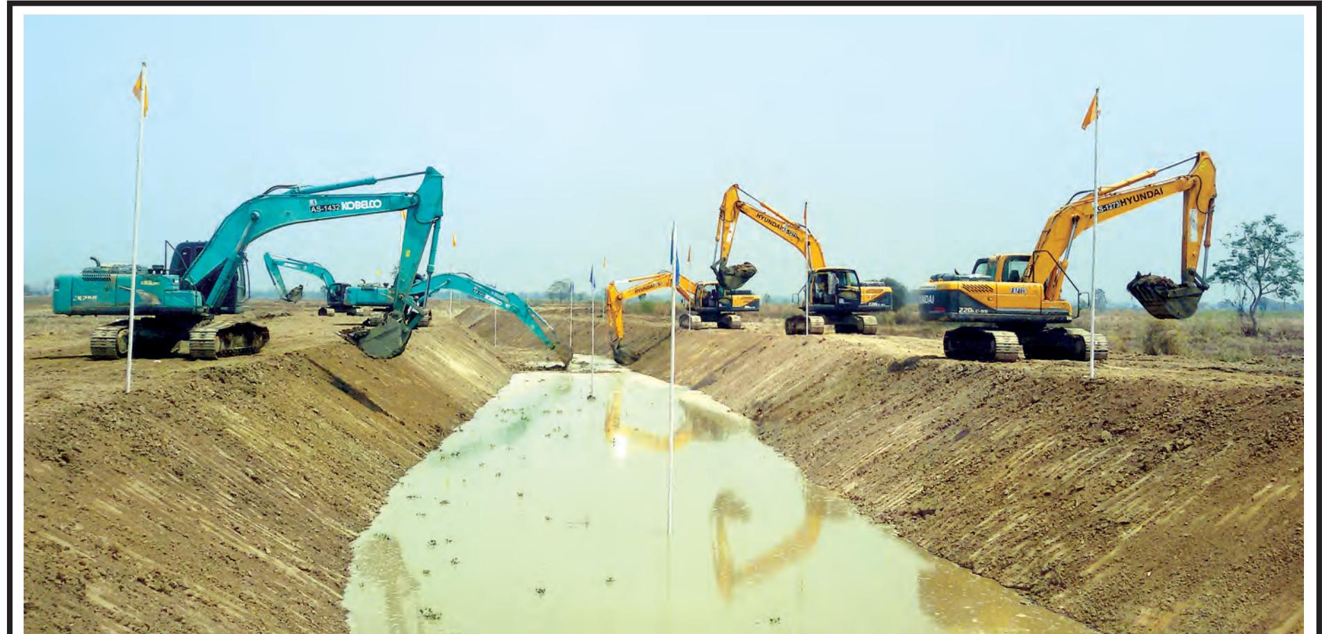
ဖြူမြို့နယ်အတွင်းရှိ လယ်မြေဧက တစ်သောင်းကျော် နှစ်စဉ် ရေကြီးနှစ်မြုပ်မှုမှ ကာကွယ်နိုင်ရန် ဆည်မြောင်းဦးစီးဌာနမှ ယခုနှစ်ဆန်းပိုင်းမှစတင်၍ ချောင်းကော၊ မြောင်းကော၊ အင်းကောများ ပြန်လည် တူးဖော်ပြုပြင်ပေးလျက်ရှိသည်ကို ဤသို့ တွေ့ရသည်။