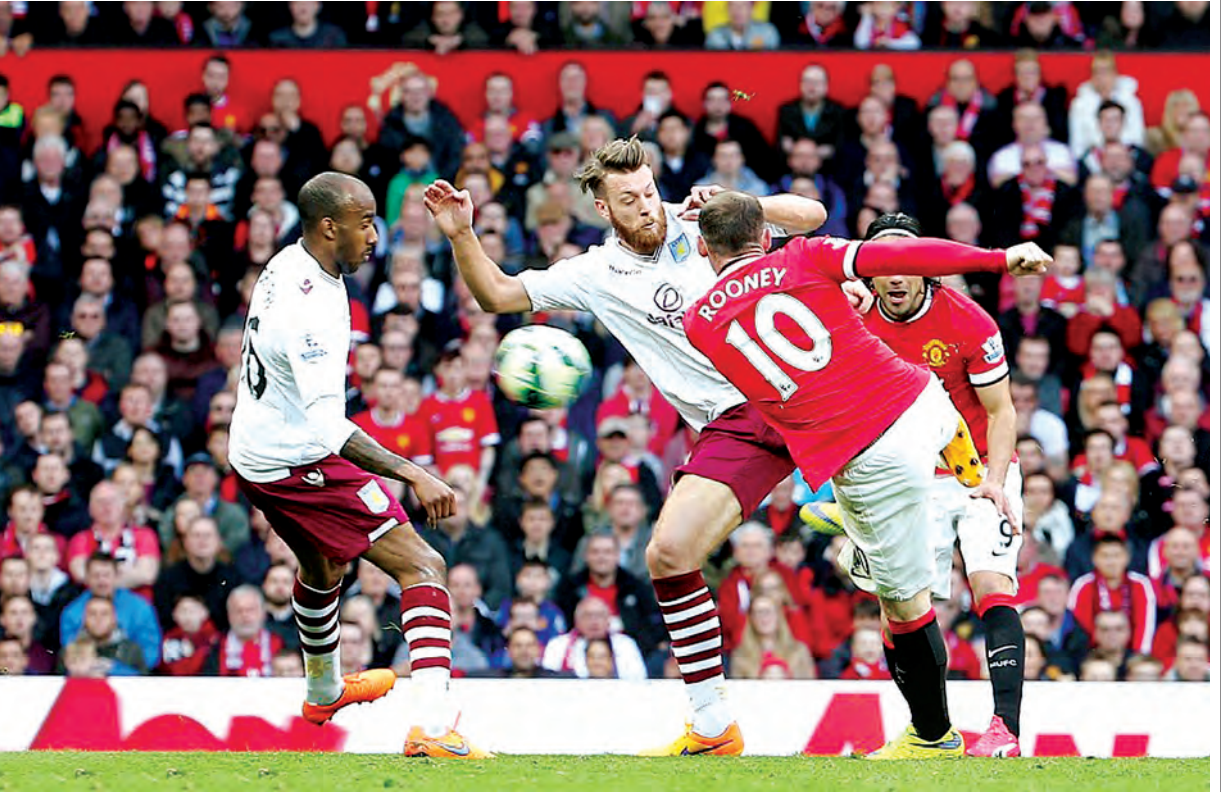
မန်ယူတိုက်စစ်မှူး ရွန်းနီ အက်စ်တွန်ဗီလာဘက်သို့ ဒုတိယဂိုးကို လှလှပပဂိုးကန်သွင်းစဉ်။