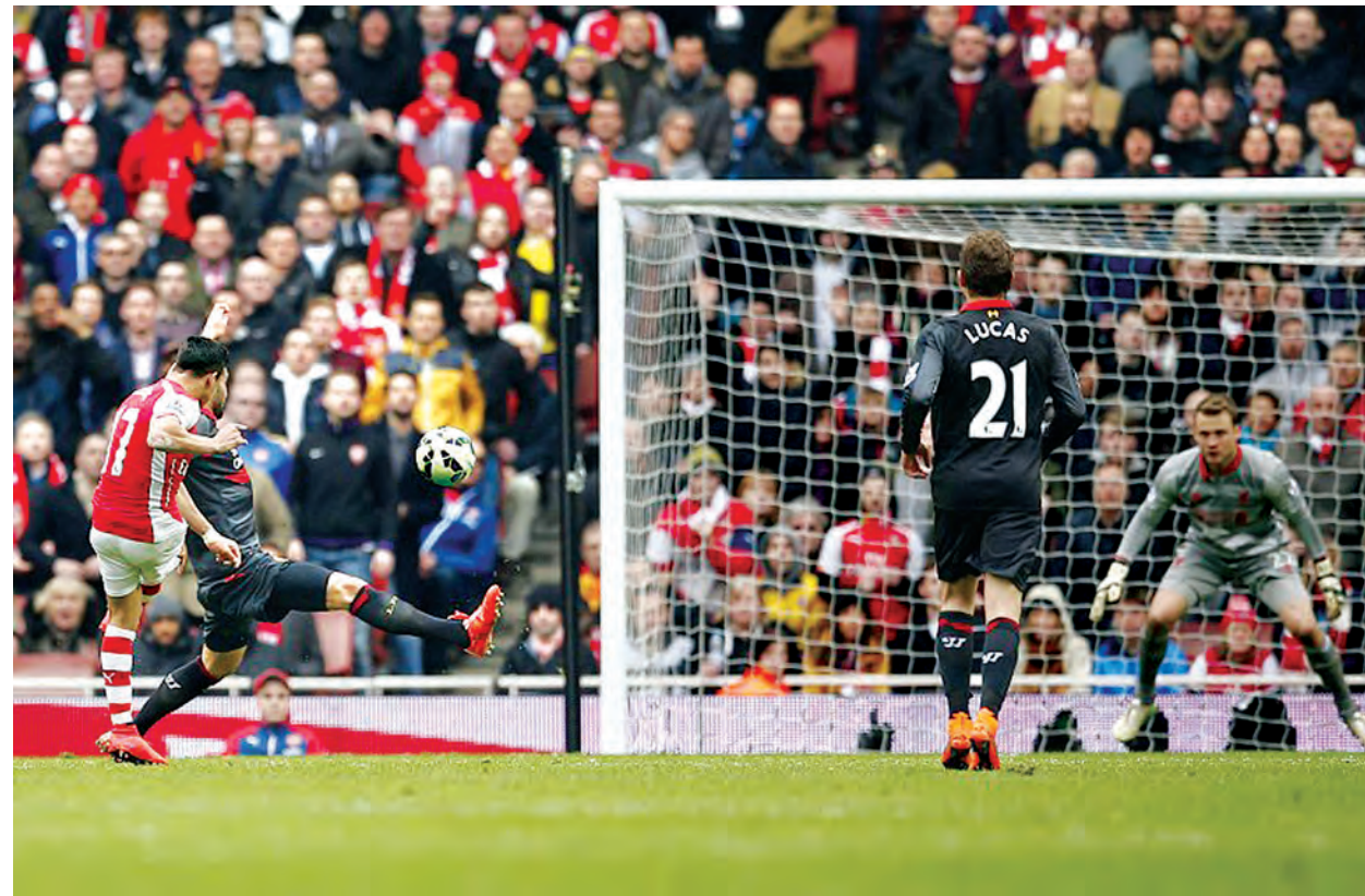
အာဆင်နယ်တိုက်စစ်မှူး ဆန်းချက်ဇ် လီဗာပူးအသင်းဘက်သို့ ဂိုးသွင်းယူစဉ်။