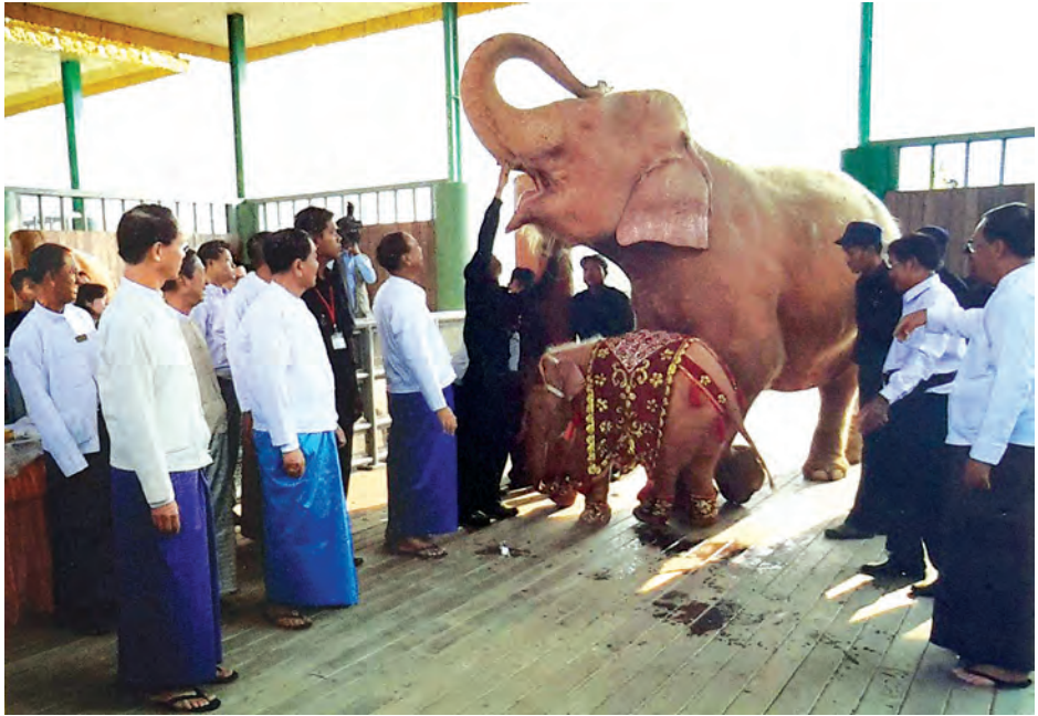
ဆင်ဖြူတော်ရတနာမလေးအား ရုပ်ရွှေဒဿနမင်္ဂလာဖြစ်သော နေ/လပြနေစဉ်။

ဗုဒ္ဓမြတ်စွာသည် ဘုရားဖြစ်တော်မူမီ နောက်ဆုံး ဘဝ၌ သီရိတိုင်းစေတုတ္တရာပြည်ကို အစိုးရသော သိဒ္ဓဉ္စိ မင်းကြီးနှင့်ဖုသတီမိဖုရားတို့မှ မြတ်စွာဘုရားအလောင်းတော် ဝေဿန္တရာဟူသော သတို့သားအဖြစ် ဖွားမြင်တော်မူခဲ့ပါသည်။ အလောင်းတော်ဝေဿန္တရာမင်း၏ တန်ခိုးတော်ကြောင့် ဖွားမြင်သောနေ့၌ပင် ကောင်းကင်သို့ သွားတတ်သော ဥပေါသထ ဆင်မသည် ဆင်ဖြူပေါက်ငယ်တစ်စီးကို ယူဆောင်၍ နန်းတော်ရှိ ဆင်တင်းကုပ်သို့ ပို့ဆောင်ထားရှိခဲ့ပါသည်။ ထိုဆင်ဖြူပေါက်ငယ်သည် ဆင်တို့၏ ကြန့်အင်လက္ခဏာမရှိလာအောင် အကောင်းဟူသမျှ စုံလင်စွာပြည့်စုံပြီး ငွေစင်ပြားဖြင့် ဖုံးဖိထားသကဲ့သို့ ကိုယ်လုံးဖြူဖွေးသော ဆင်ဖြူရတနာဖြစ်ပါသည်။ ဘုရားအလောင်း၏ ကောင်းမြတ်သော အထောက်အပံ့ကို ဖြစ်စေသောကြောင့် ထိုဆင်ဖြူပေါက်ငယ်အား ပစ္စယဟု အမည်ပေးတော်မူခဲ့ပါသည်။