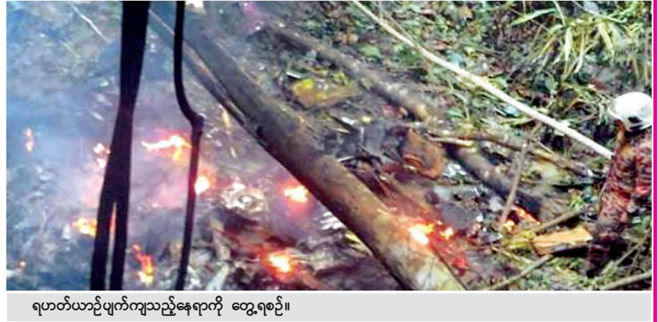
ရဟတ်ယာဉ်ပျက်ကျသည့်နေရာကို တွေ့ရစဉ်။

ကျေတီ ရေးသည့် ကြားရေးမှူးချုပ် အာဇာရုဒ်ဒင် အဗ္ဗလ် ရာမန်၏ ပြောကြားချက်အရ သိရသည်။ (ဆင်ဟွာ)