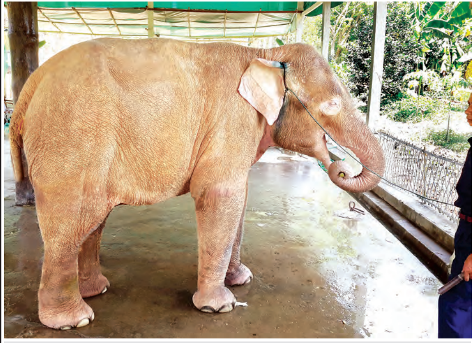
နဝမမြောက် ဆင်ဖြူတော်ရတနာကို ဆင်စခန်းတွင် လေ့ကျင့်ပေးနေစဉ်။

တို့သည် ဘေးရန်ကင်းစေရန်နှင့် အမှုပြဿနာများ စီရင်ရာတွင် ဆင်ဖြူတော်ကို တိုင်တည်၍ ပူဇော်ခဲ့ကြောင်း၊ ပုဂံခေတ် အနော်ရထာမင်း (အေဒီ ၁၀၄၄-၁၀၇၇) လက်ထက်တွင် ဆင်ဖြူတော်(၃၂) စီးဖြင့် ပိဋကတ်တော်များကို မနုဟာမင်းထံမှ ပုဂံသို့ ပင့်ဆောင်ခဲ့ကြောင်း၊ ဆင်ဖြူတော်ဖြင့် စွယ်တော်ပင့်ဆောင်ကာ ကိန်းဝပ်ရာနေရာများတွင် ရွှေစည်းခုံ၊ လောကနန္ဒာ၊ တုရင်းတောင်၊ တန်ကြည်တောင်စေတီတော်များ တည်ထားခဲ့ကြောင်း လေ့လာတွေ့ရှိရပါသည်။ ထို့အတူ ပင်းယခေတ်မှစ၍ ကုန်းဘောင်ခေတ်တိုင်အောင် ခေတ်အဆက်ဆက်တွင်လည်း မြန်မာမင်းတို့သည် ဆင်ဖြူတော်များကို ရရှိပိုင်ဆိုင်တော်မူခဲ့ရာ ပင်းယခေတ်တွင် တစ်စီးရှင် သီဟသူနှင့် ငါးစီးရှင် မင်းကြီးကျော်စွာ၊ စစ်ကိုင်းခေတ်တွင် ဆင်ဖြူရှင်တရဖျား၊ အင်းဝခေတ်တွင် ဆင်ဖြူရှင် သီဟသူ၊ ဟံသာဝတီခေတ်တွင်ရာဇဓိရာဇ် တောင်ငူခေတ်တွင် ဘုရင့်နောင်၊ ညောင်းရမ်းခေတ်တွင် တနင်္ဂနွေမင်း၊ ကုန်းဘောင်ခေတ်တွင် အလောင်းဘုရား၊ မြေဒူးမင်း၊ စဉ့်ကူးမင်း၊ တိုးတော်မင်းတရား၊ ဘကြီးတော် (စစ်ကိုင်းမင်း)၊ မင်းတုန်းမင်းနှင့် သီပေါမင်းတို့သည် ဆင်ဖြူတော် ရရှိပိုင်ဆိုင်ရာတွင် ထင်ရှားသောမင်းများ ဖြစ်ကြပါသည်။ မြန်မာ့သစ်တောများသည် ဆင်ဖြူတော်ရတနာများ ပေါ်ထွန်းတတ်သော ရေမြေသဘာဝရှိသော်လည်း၊ သမိုင်းအစဉ်အလာအရ ဆင်ဖြူတော်တို့သည် အခါမလပ်ပေါ်ထွန်းနေသည်မဟုတ်။ နိုင်ငံသာယာစည်ပင်မည့်အချိန်အခါမျိုး၊ ဆန်ရေစပါးပေါများ၍ တိုင်းပြည်အေးချမ်းသာယာမည့် အချိန်အခါမျိုးတို့တွင်သာ ခါတော်မီပန်း ပွင့်လန်းသည့်နည်း ပေါ်ထွန်းလာတတ်ခြင်းဖြစ်သည်။ ထိုအခြေအနေကို ရှေးမြန်မာမင်းတို့ လက်ထက်တွင် ဖြစ်ပေါ်ခဲ့သော သမိုင်းခြေရာများက