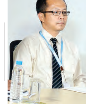
ဒေါက်တာအလှိုင်ဌာနကျုံးလျန်

ခြင်းတွေထဲက ဆွဲထုတ်လိုက်ပြီး လုပ်ဆောင်ဖို့ လိုပါတယ်။ ဒုတိယခံစားချက်က ပီတိဖြစ်တယ်။ ငြိမ်းချမ်းရေးဆိုတာ ပြောတိုင်းမလွယ်ဘူး။ တကယ်ခက်ခဲ