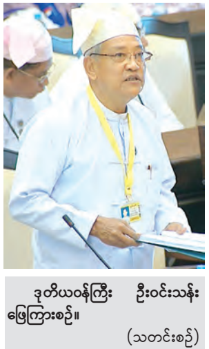
ဒုတိယဝန်ကြီး ဦးဝင်းသန်း ဖြေကြားစဉ်။ (သတင်းစဉ်)

ဦးသန်းထွန်းအောင်က ကလေးဝမြို့နယ် ကလေးဝကျောက်မီးသွေးသတ္တုတွင်းနှင့် သစ်ချောက်ဒေသတွင် ကျောက်မီးသွေး အကြီးစားထုတ်လုပ်သည့် လုပ်ငန်းလုပ်ကိုင်နေသည့် ထူးအပြည်ပြည်ဆိုင်ရာ စက်မှုလုပ်ငန်းစု ကုမ္ပဏီလီမိတက်မှ ဆေးရုံ၊ ဆေးခန်းမြေနေရာ ၁ ဒသမ ၂၈ ဧကနှင့် အဆောက်အအုံများကို သတ္တုတွင်းဝန်ကြီးဌာနမှတစ်ဆင့် လွှဲပြောင်းပေးအပ်ခဲ့ရာ ပြည်ထောင်စုအစိုးရအဖွဲ့၏ ခွင့်ပြုချက်အရ စစ်ကိုင်းတိုင်းဒေသကြီး အစိုးရအဖွဲ့မှတစ်ဆင့် သက်ဆိုင်ရာခရိုင်နှင့် မြို့နယ်စီမံခန့်ခွဲမှုကော်မတီ တိုင်းဒေသကြီး ကျန်းမာ