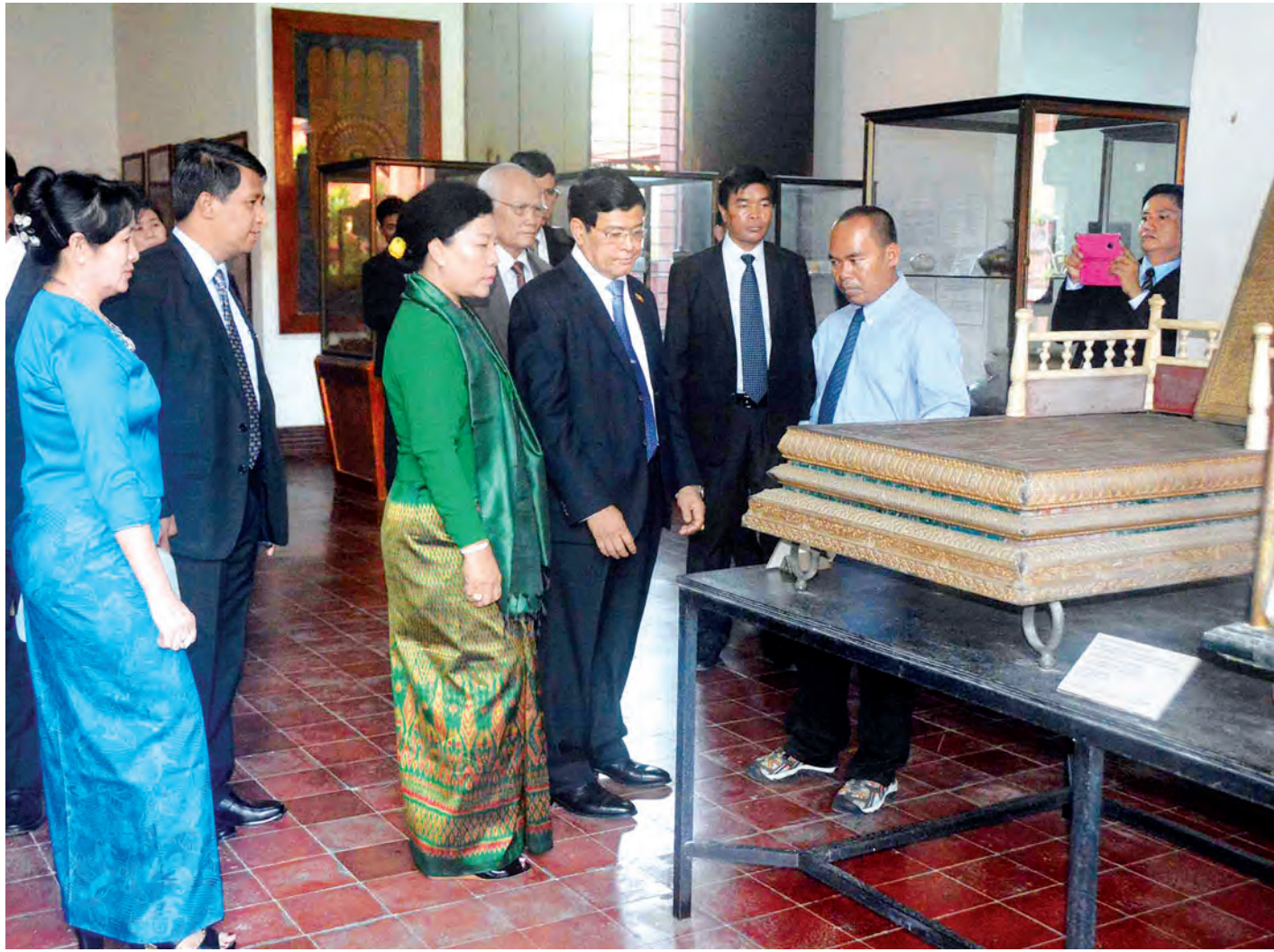
ဒုတိယသမ္မတ ဦးညွှန်ထွန်းနှင့်ဇနီး ကမ္ဘောဒီးယားနိုင်ငံ အမျိုးသားပြတိုက်၌ ကြည့်ရှုလေ့လာစဉ်။