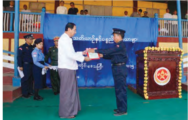
ဒေသကြီးအားကစားကွင်း၌ မတ် ၃၀ ရက်က လွှဲပြောင်းပေးအပ်သည်။ မကွေးတိုင်းဒေသကြီးအတွင်းရှိ မြို့နယ်များတွင် အသုံးပြုရန်အတွက် မီးသတ်ယာဉ် ၄၃ စီး၊ HNE မီးသတ်ယာဉ် ၄၀ စီး၊ လူနာတင်ယာဉ်

မကွေးတိုင်းဒေသကြီးအတွင်းရှိ မကွေးခရိုင်၊ ပခုက္ကူခရိုင်၊ ဂန့်ဂေါခရိုင်၊ သရက်ခရိုင်နှင့် မင်းဘူးခရိုင်များရှိ မြို့နယ်များတွင် အသုံးပြုရန်အတွက် မီးသတ်ယာဉ်များနှင့် လူနာတင်ယာဉ်များကို တိုင်းဒေသကြီးအစိုးရအဖွဲ့မှ တိုင်း