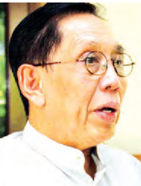
ပါမောက္ခ ဒေါက်တာအောင်ထွန်းသက် စီးပွားရေးပညာရှင်

တစ်နိုင်ငံလုံး ပစ်ခတ်တိုက်ခိုက်မှု ရပ်စဲရေးသဘောတူစာချုပ် (NCA) မူကြမ်း အတည်ပြုချက်ကို မတ် ၃၀ ရက်က နိုင်ငံတော်သမ္မတကြီး၏ ရှေ့မှောက်တွင် နှစ်ဖက်အဖွဲ့အစည်း များဖြစ်သည့် ပြည်ထောင်စုငြိမ်းချမ်းရေး ဖော်ဆောင်ရေးလုပ်ငန်းကော်မတီ (UPWC) နှင့် တစ်နိုင်ငံလုံးဆိုင်ရာ အပစ်အခတ်ရပ်စဲရေး ညှိနှိုင်းရေး အဖွဲ့ (NCCT)တို့ လက်မှတ်ရေးထိုး နိုင်ခဲ့သည်။ ယင်းသို့ NCA သဘောတူစာချုပ် မူကြမ်းအား လက်မှတ်ရေးထိုးနိုင်ခြင်းအပေါ် မြန်မာနိုင်ငံဆိုင်ရာ