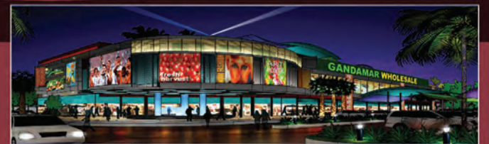
Corner of Gandamar Road & Waizayantar Road, Mayangone Township, Yangon. Tel : 01 657 834

* အလျား ၂၀၀ ပေ x အနံ ၁၅၅ ပေ x အမြင့် ၂၀ ပေ ( ၃၁,၀၀၀ Sqft ) ရှိ ခန်းမကြီးထဲတွင် မင်္ဂလာ ဧည့်ခံပွဲများအတွက် လူဦးရေ ၁၂၀၀ ဦး နှင့် Conference, Meeting, Seminar, Workshop, Product Launch များအတွက် လူဦးရေ ၁၄၀၀ ဦး အထိ လက်ခံကျင်းပ ပေးနိုင်ပါသည်။