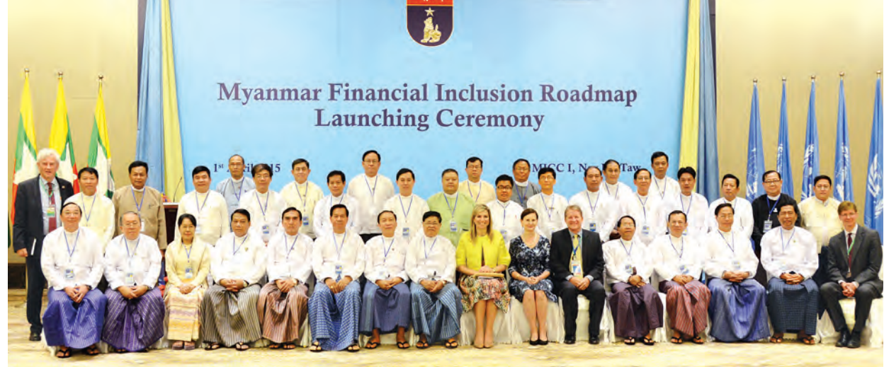
ပြည်ထောင်စုဝန်ကြီး ဦးစိုးသိန်းနှင့်ဝန်ကြီးများ မြန်မာနိုင်ငံတွင်အားလုံးပါဝင်နိုင်သော ငွေကြေးကဏ္ဍတည်ဆောက်ရေး လမ်းပြမြေပုံ စတင်ခြင်း အခမ်းအနားသို့ တက်ရောက်ကြသူများနှင့် မှတ်တမ်းတင်ဓာတ်ပုံရိုက်စဉ်။ (သတင်းစဉ်)

မြန်မာနိုင်ငံတွင် အားလုံးပါဝင်နိုင်သော ငွေကြေးကဏ္ဍတည်ဆောက်ရေးအတွက် တာဝန်ယူမှုရှိပြီး နိုင်ငံတကာစံနှုန်းများနှင့် ကိုက်ညီသော၊ အရည်အသွေး ပြည့်ဝသော ငွေကြေးဝန်ဆောင်မှုကို ၂၀၁၄ ခုနှစ်တွင် နိုင်ငံအတွင်း အရွယ်ရောက်ပြီးသူဦးရေ၏ ၃၀ ရာခိုင်နှုန်း သုံးစွဲရာမှ ၂၀၂၀ ပြည့်နှစ်တွင် ၄၀ ရာခိုင်နှုန်းအထိတိုးတက်သုံးစွဲရေး၊ ငွေကြေးဝန်ဆောင်မှုတစ်ခုထက် ပိုမိုသုံးစွဲသူဦးရေ၏ ၆ ရာခိုင်နှုန်းမှ ၁၅ ရာခိုင်နှုန်းအထိ တိုးတက်ရရှိရေးစသည့် ရည်ရွယ်ချက်များဖြင့် မြန်မာနိုင်ငံတွင် အားလုံးပါဝင်နိုင်သော ငွေကြေးကဏ္ဍတည်ဆောက်ရေး လမ်းပြမြေပုံ စတင်ခြင်းအခမ်းအနားကို ယနေ့မနန်းလွှဲပိုင်းတွင် နေပြည်တော်ရှိ မြန်မာအပြည်ပြည်ဆိုင်ရာကုန်ပစ္စည်းဗဟိုဌာန-၁(MICC-I) ၌ ကျင်းပခဲ့သည်။