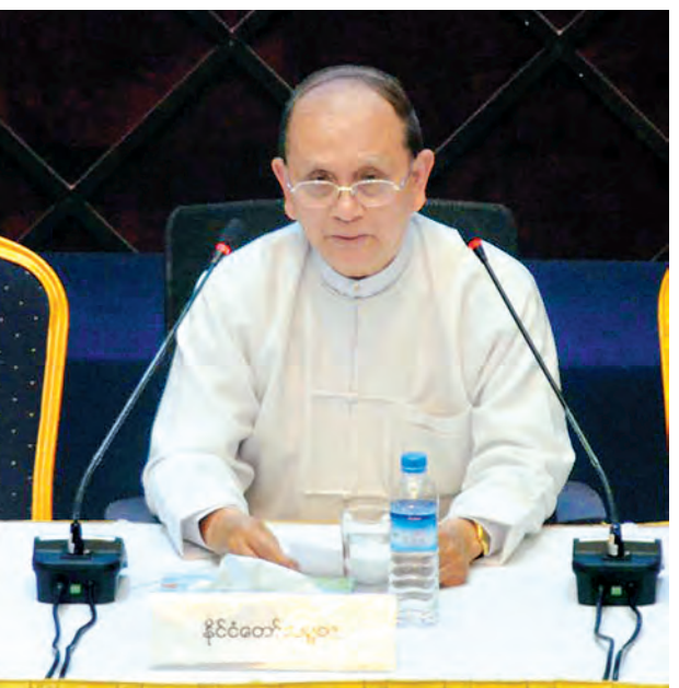
နိုင်ငံတော်သမ္မတ ဦးသိန်းစိန် တစ်နိုင်ငံလုံး ပစ်ခတ်တိုက်ခိုက်မှုရပ်စဲရေးသဘောတူစာချုပ်မူကြမ်းအား နှစ်ဖက်သဘောတူ ညှိနှိုင်းပြုစုရေးဆွဲပြီးစီးကြောင်း အတည်ပြုချက် လက်မှတ်ရေးထိုးပွဲသို့ တက်ရောက်ပြောကြားစဉ်။ (သတင်းစဉ်)

အားလုံးသည် မြန်မာပြည်ချမ်းရေး၏ သမိုင်းကို ဖန်တီးဖော်ဆောင်ပေးသူ များဖြစ်သည့်အပြင် တည်ဆောက်ပေး သူများအဖြစ်လည်း မြန်မာ့သမိုင်းတွင် မှတ်တမ်းတင် ကျန်ရှိခဲ့မည့် သူများ ဖြစ်ပါကြောင်း၊ ယခု ဆောင်ရွက်ချက်