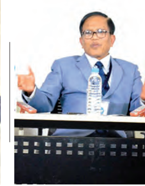
ဦးနိုင်ဟံသာ