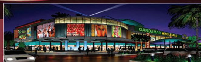
Corner of Gandamar Road & Waizayantar Road, Mayangone Township, Yangon. Tel : 01 657 834

* အလျား ၂၀၀ ပေ x အနံ ၁၅၅ ပေ x အမြင့် ၂၀ ပေ (၃၁,၀၀၀ Sqft )ရှိ ခန်းမကြီးထဲတွင် မင်္ဂလာ ဧည့်ခံပွဲများအတွက် လူဦးရေ ၁၂၀၀ ဦး နှင့် Conference, Meeting, Seminar, Workshop, Product Launch များအတွက် လူဦးရေ ၁၄၀၀ ဦး အထိ လက်ခံကျင်းပ ပေးနိုင်ပါသည်။