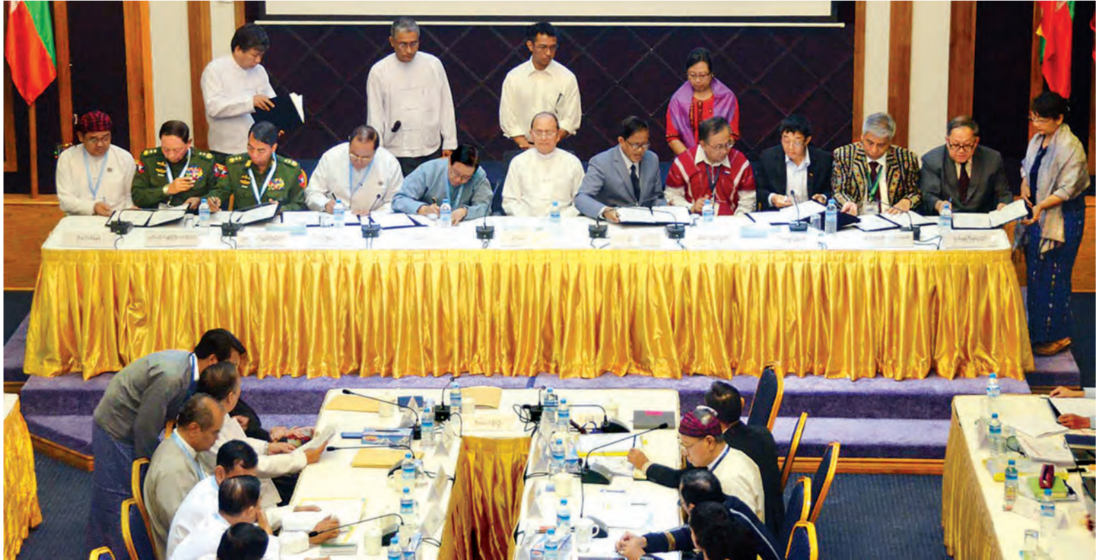
နိုင်ငံတော်သမ္မတ ဦးသိန်းစိန် ရှေ့မှောက်၌ တစ်နိုင်ငံလုံး ပစ်ခတ်တိုက်ခိုက်မှုရပ်စဲရေး သဘောတူစာချုပ်မူကြမ်းအား နှစ်ဖက်သဘောတူ ညှိနှိုင်းပြုစုရေးဆွဲပြီးစီးကြောင်း အတည်ပြုချက်အား ပြည်ထောင်စု ငြိမ်းချမ်းရေး ဖော်ဆောင်ရေး လုပ်ငန်းကော်မတီ (UPWC)နှင့် တစ်နိုင်ငံလုံးဆိုင်ရာ အပစ်အခတ်ရပ်စဲရေး ညှိနှိုင်းရေးအဖွဲ့ (NCCT) တို့မှ တက်ရောက်ကြသူများ လက်မှတ်ရေးထိုးကြ စဉ်။ (သတင်းစဉ်)

ရပ်နားလိုက်သည်။ အခမ်းအနား အပြီးတွင် နိုင်ငံတော်သမ္မတသည် တက်ရောက် လာကြသူများနှင့်အတူ စုပေါင်း၍ မှတ်တမ်းတင် ဓာတ်ပုံရိုက်သည်။ ယင်းနောက် နိုင်ငံတော်သမ္မတသည် ပြည်ထောင်စုငြိမ်းချမ်းရေး ဖော်ဆောင်ရေး ဗဟိုကော်မတီ၊ ပြည်ထောင်စုငြိမ်းချမ်းရေး ဖော်ဆောင်ရေး လုပ်ငန်းကော်မတီ (UPWC)နှင့် တစ်နိုင်ငံလုံးဆိုင်ရာ အပစ်အခတ်ရပ်စဲရေး ညှိနှိုင်းရေး အဖွဲ့ (NCCT)တို့မှ အဖွဲ့ဝင်များ နှင့်အတူ မြန်မာနိုင်ငံငြိမ်းချမ်းရေး ပြန်လည်ထူထောင်ရေး လုပ်ငန်း ဗဟိုဌာန (MPC)၌ ခင်မင်ရင်းနှီးစွာ နေ့လယ်စာအတူတကွ သုံးဆောင် ခဲ့သည်။ ထို့နောက် နိုင်ငံတော်သမ္မတသည် အထူးလေယာဉ်ဖြင့် ရန်ကုန် မြို့မှထွက်ခွာလာရာ မွန်းလွဲပိုင်းတွင် နေပြည်တော်သို့ ပြန်လည်ရောက်ရှိ သည်။ (သတင်းစဉ်)