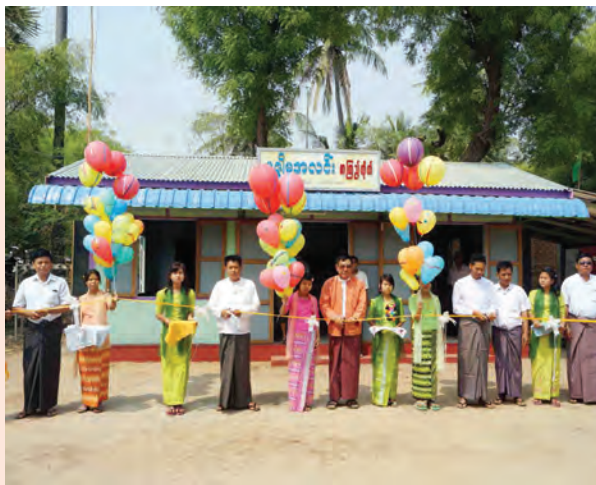
မကွေးတိုင်းဒေသကြီး ပခုက္ကူမြို့နယ် ကုက္ကလုံကျေးရွာအုပ်စု ဆယ်ရွာ ကျေးရွာ၌ ပြည်ထောင်စုလွှတ်တော် ဖွဲ့စည်းရေးရန်ပုံငွေနှင့် ကျေးရွာနေ ပြည်သူများ၏ မတည်လှူဒါန်းငွေများဖြင့် စုပေါင်းတည်ဆောက်ခဲ့သည့် မန္တလေးအလင်းစာကြည့်တိုက်ကို မတ် ၂၉ ရက်က ဖွင့်လှစ်စဉ်။