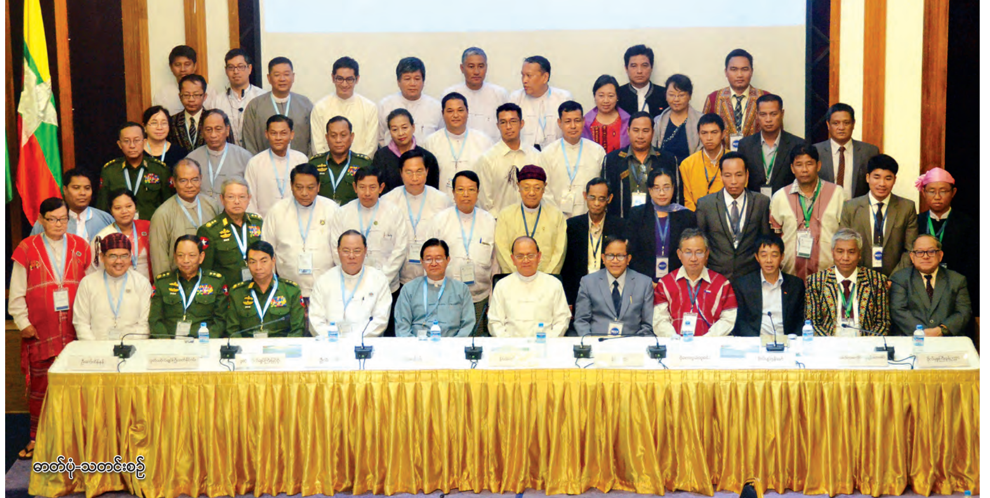
ခေတ်ပုံ-သတင်းစဉ်

တစ်နိုင်ငံလုံးပစ်ခတ်တိုက်ခိုက်မှု ရပ်စဲရေး သဘောတူစာချုပ်မူကြမ်း အတည်ပြုချက် လက်မှတ်ရေးထိုး