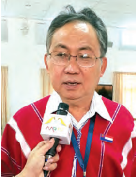
ဦးစောကွယ်ထူးဝင်း

ကျွန်တော်တို့ ဆွေးနွေးလာကြတာ အချိန်ကာလအားဖြင့် တစ်နှစ်နဲ့ ငါးလ၊ အကြိမ်ပေါင်းအားဖြင့် တရားဝင် (၇)ကြိမ်နဲ့ အလွတ်သဘော အကြိမ်(၂၀)ကျော် ဆွေးနွေးခဲ့ကြတာ ဖြစ်ပါတယ်။ ဒီလို အချိန်ကာလကြာမြင့်စွာနဲ့ အကြိမ်ပေါင်းများစွာ ဆွေးနွေးပြီးတဲ့အခါမှာ NCCT နဲ့ UPWC အကြား အကြံအစဉ် သဘောတူညီမှုရခဲ့တာဖြစ်ပါတယ်။ ကျွန်တော်တို့ NCCT ကို ၂၀၁၃ လိုင်ဇာမှာ တိုင်းရင်းသားလက်နက်ကိုင်ညီလာခံက ဖွဲ့စည်းတာဝန်ပေးခဲ့တာဖြစ်ပါတယ်။ တိုင်းရင်းသားလက်နက်ကိုင် တော်လှန်ရေးအဖွဲ့(၁၆)ဖွဲ့မှ တစ်ဖွဲ့ကို ကိုယ်စားလှယ်တစ်ဦးကျနဲ့ ဖွဲ့စည်းထားတဲ့ NCCT ဟာ တစ်နိုင်လုံး အပစ်အခတ်ရပ်စဲရေး သဘောတူညီချက် ရရှိရေးအတွက် အစိုးရနဲ့ ညှိနှိုင်းဆွေးနွေးတဲ့ အလုပ်အဖွဲ့သာဖြစ်ပါတယ်။ NCCT ဟာ တိုင်းရင်းသားလက်နက်ကိုင် ညီလာခံက ချမှတ်ထားတဲ့ အခြေခံ မူဝါဒအပေါ်မှာ ရပ်တည်ပြီး ညှိနှိုင်းဆွေးနွေးနေတာ ဖြစ်ပါတယ်။ အခု NCCT အနေနဲ့ ညှိနှိုင်းရရှိထားတဲ့ တစ်နိုင်လုံးအပစ်အခတ်အတားအဆီး အပစ်အခတ်ရပ်စဲရေး သဘောတူစာချုပ်ဟာ ပဏာမအဆင့် သဘောတူညီချက်ပဲဖြစ်ပါတယ်။ NCCT က ကိုယ်စားလှယ်အဖွဲ့သာဖြစ်ပြီး တစ်နိုင်လုံး အပစ်အခတ်ရပ်စဲခြင်း အခြေခံလုပ်ပိုင်ခွင့် မူဘောင်အောက်မှာ လုပ်ဆောင်နေခြင်းဖြစ်ပါတယ်။ ဒီရရှိထားတဲ့ သဘောတူညီချက်တွေကို တိုင်းရင်းသားလက်နက်ကိုင်တော်လှန်ရေးအဖွဲ့အစည်းတွေရဲ့ ထိပ်သီးခေါင်းဆောင်များအစည်းအဝေးမှာ တင်ပြပြီးတော့ အဲဒီအစည်းအဝေးကနေ သဘောတူ