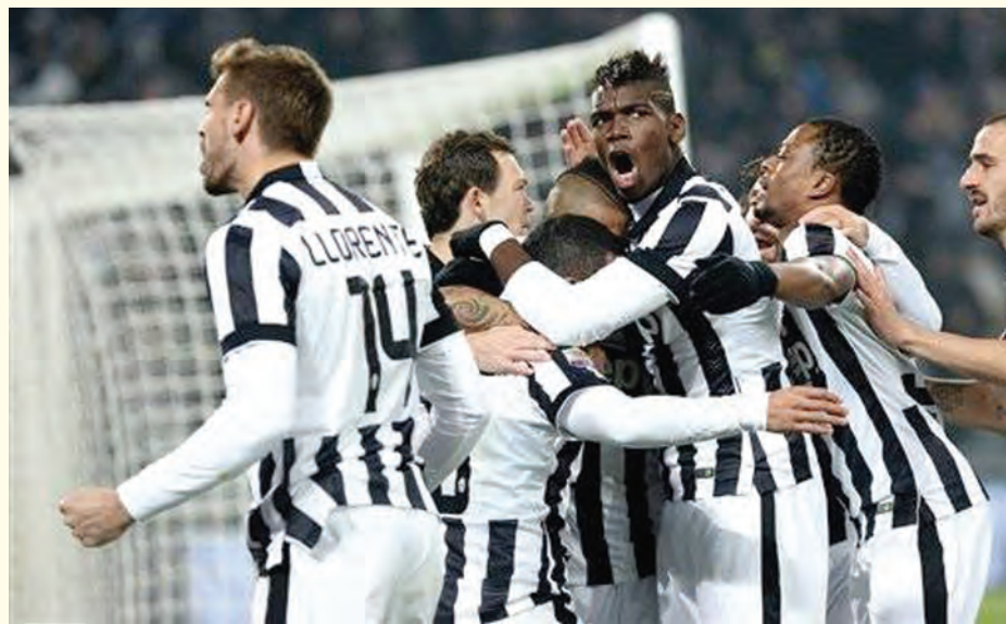
လည်း ခြေတက်နေတာမို့ ဒီပွဲဟာ သရေပွဲလည်းဖြစ်သွားနိုင်ပါတယ်။

ဖီအိုရင်တီးနားတို့က ဆန်ဒိုးရီးယားနဲ့ဆုံတိုင်း နိုင်ပွဲရအောင်ဖော်ထုတ်နိုင်တဲ့ အသင်းဖြစ်ပါတယ်။ ဖီအိုရင်တီးနားတို့က အခုတလောရလဒ်တွေ ကောင်းအောင် ကစားနိုင်နေပြီး အေစီမီလန်၊ ရိုးမား၊ အူဒီးနစ်တို့ကို ရှုံးပွဲမရှိအောင် ကစားထားနိုင်ပါတယ်။ ဆန်ဒိုးရီးယားတို့က