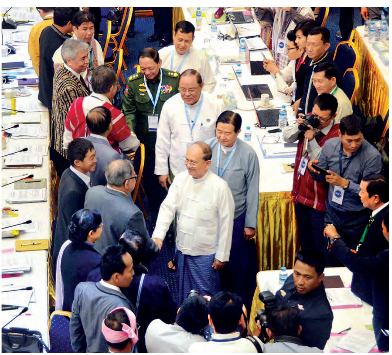
နိုင်ငံတော်သမ္မတ ဦးသိန်းစိန် တစ်နိုင်ငံလုံး ပစ်ခတ်တိုက်ခိုက်မှုရပ်စဲရေးသဘောတူစာချုပ်မူကြမ်းအား နှစ်ဖက်သဘောတူညှိနှိုင်းပြုစုရေးဆွဲပြီးစီးကြောင်း အတည်ပြုချက် လက်မှတ်ရေးထိုးပွဲသို့ တက်ရောက်လာကြသူများအား ရင်းရင်းနှီးနှီး နှုတ်ဆက်စဉ်။ (သတင်းစဉ်)

ပါကြောင်း၊ ပို၍ဝမ်းသာဖွယ်ရာ ကောင်းသည်မှာ ယမန်နေ့ည MRTV သတင်းတွင် ပြောကြားခဲ့သည့် တိုင်းရင်းသားခေါင်းဆောင်များ၏ဝမ်းသာဖွယ်ရာ ရင်တွင်းစကားများကို ကြားရသည့်အတွက်ဖြစ်ပါကြောင်း၊ ငြိမ်းချမ်းရေးသည် ပြည်သူများ၏ လိုလားချက်၊ ဆန္ဒနှင့် မျှော်လင့်ချက်ပင်ဖြစ်ပါကြောင်း၊ မျှော်လင့်ချက်များနှင့်စောင့်စားနေကြသည့် ပြည်သူများအတွက် ငြိမ်းချမ်းရေးရရှိနိုင်ရန် ဆောင်ကြဉ်းပေးနိုင်သူများသည် ကျွန်တော်တို့အားလုံးပင် ဖြစ်ပါကြောင်း။ NCA စာချုပ်မူကြမ်းအား အကြိမ်ကြိမ်အခါခါ ဆွေးနွေးခဲ့ရပြီး ယမန်နေ့က သဘောတူညီချက်ရရှိပြီး ဖြစ်ကြောင်းနှင့် ယခုလက်မှတ်ထိုးနိုင်ကြပြီဖြစ်ပါကြောင်း၊ ယခုသဘောတူညီချက်သည် NCA လက်မှတ်ရေးထိုးနိုင်ရေးအတွက် တွန်းအားတစ်ရပ် ဖြစ်ပါကြောင်း၊ ထို့ကြောင့် ယခု ဧပြီလအတွင်း NCA လက်မှတ်ရေးထိုးနိုင်ရေး ကျွန်တော်တို့ သေချာစွာ ဆောင်ရွက်နိုင်တော့မည်ဖြစ်ပါကြောင်း။ NCA လက်မှတ်ရေးထိုးပြီးသည်