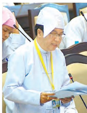
ဒုတိယဝန်ကြီး ဒေါက်တာ ဇော်မင်းအောင် ဖြေကြားစဉ်။ (သတင်းစဉ်)

အမျိုးသားလွှတ်တော် (၁၂) ကြိမ်မြောက် ပုံမှန်အစည်းအဝေး ၃၇ ရက်မြောက်နေ့ကို ယနေ့ ဖွန်းလွှဲ ၁ နာရီတွင်ကျင်းပရာ ပညာရေး၊ ကျန်းမာရေးနှင့် ကျေးလက်ဒေသ ဖွံ့ဖြိုးရေးဆိုင်ရာမေးခွန်းများ မေးမြန်းခြင်းနှင့် အဆိုတင်သွင်းခြင်းတို့ကို ဆောင်ရွက်ခဲ့သည်။ ဧရာဝတီတိုင်းဒေသကြီး မဲဆန္ဒနယ်အမှတ်(၆)မှ ဦးခင်မောင်ရီ၏ ကြိုခင်းမြို့နယ် အလုံကျေးရွာနှင့် ထိန်ပင်မြောင်ကျေးရွာရှိ အခြေခံပညာ အလယ်တန်း ကျောင်း(ခွဲ)များအား အခြေခံပညာ အလယ်တန်းကျောင်း များအဖြစ် အဆင့်တိုးမြှင့်ပေးရန် အစီအစဉ် ရှိ/မရှိ မေးခွန်းနှင့် စပ်လျဉ်း၍ ပညာရေးဝန်ကြီးဌာန ဒုတိယဝန်ကြီး ဒေါက်တာဇော်မင်းအောင်က ဝန်ကြီးဌာနအနေဖြင့် ကျောင်းအဆင့် တိုးမြှင့်ပေးရန် ကျောင်းသားဦးရေ ပြည့်မီခြင်း ရှိ/မရှိ၊ ကျောင်း အဆောက်အအုံ ပရိဘောဂပြည့်စုံမှု ရှိ/မရှိ၊ ကျောင်းအဆောက်အအုံ