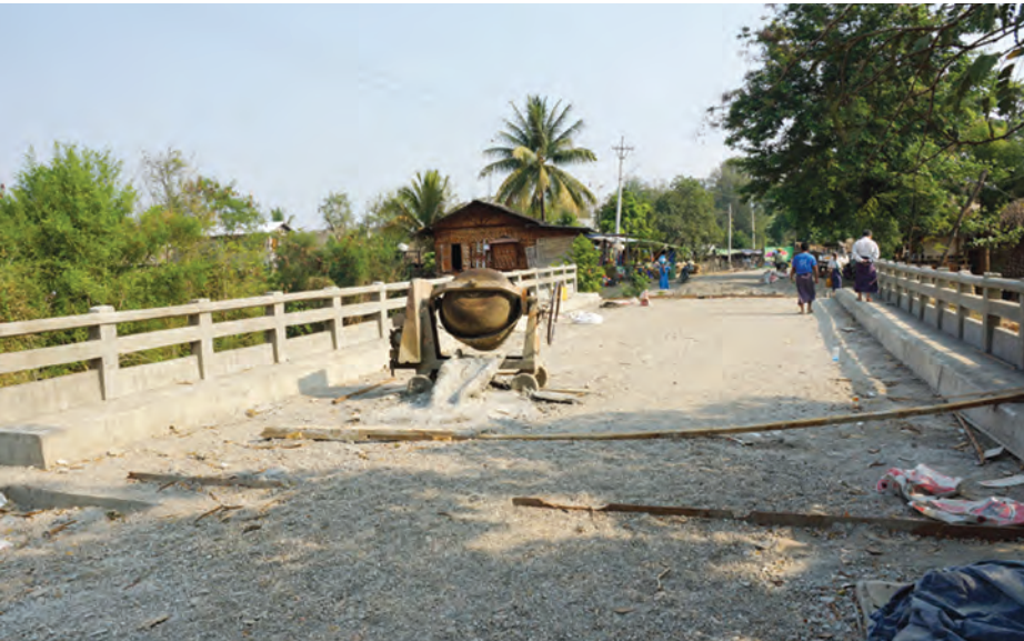
တည်ဆောက်မှုများ ပြီးစီးနေပြီဖြစ်သော ပဒါန်းတံတားကို မတ် ၂၉ ရက်က တွေ့ရစဉ်။

ခွင့်ပြုတန် ၆၀ အထိ ခံနိုင်သည့် ဘိုးပိုင်သံကူကွန်ကရစ်တံတားအဖြစ် တံတားအရှည် ပေ ၈၀၊ အကျယ် ၃၀ ပေအထိ အဆင့်မြှင့်တင် တည်ဆောက်ခဲ့ခြင်းဖြစ်သည်။ မင်းဘူး-အမ်းလမ်းပေါ်မှ အဆိုပါ တံတားသည် မကွေးတိုင်းဒေသကြီးနှင့် ရခိုင်ပြည်နယ်ဆက်သွယ်သည့် အဓိကလမ်း၊ တံတားဖြစ်သည့်အပြင် ငမဲမြို့နယ် ပဒါန်းကျေးရွာအနီးတွင် တည်ရှိပြီး ပဒါန်းကျေးရွာနှင့် အနီးဝန်းကျင် ကျေးရွာများမှ ပြည်သူများ အနေဖြင့်လည်း ယင်းတံတားကို အမှီပြု၍ လူမှုရေး၊ စီးပွားရေး၊ ကျန်းမာရေးနှင့် ကုန်စည်စီးဆင်းမှုကဏ္ဍများတွင် ပိုမိုအဆင်ပြေလာတော့မည် ဖြစ်ကြောင်း သိရသည်။ နယ်စပ်ဒေသအပါအဝင် ကျေးလက်ဒေသနှင့် မြို့ပြနေပြည်သူများ လူမှုစီးပွားဘဝ ဖွံ့ဖြိုးတိုးတက်စေရန်အတွက် လမ်း၊ တံတား အဆင့်မြှင့်တင်ခြင်း လုပ်ငန်းများကို နိုင်ငံတော်က ငွေစာရင်းခေါင်းစဉ်အလိုက် နှစ်စဉ်ရန်ပုံငွေများ ခွဲဝေချထားဆောင်ရွက်ပေးလျက်ရှိသည်။