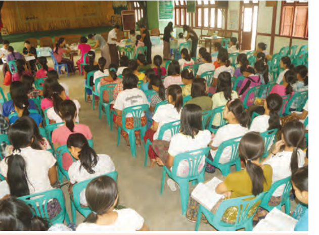
စစ်ကိုင်းပညာရေးကောလိပ်၌ ဘီပိုးနှင့်စီပိုး အခမဲ့စစ်ဆေးပေးပွဲ။