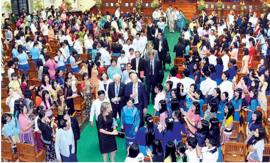
နယ်သာလန်နိုင်ငံ ဘုရင့်မိဖုရား မက်ဆီမာ ရန်ကုန်တက္ကသိုလ် ဘွဲ့နှင်းသဘင်ခန်းမ၌ ကျောင်းသား ကျောင်းသူ များအား ရင်းရင်းနှီးနှီးနှုတ်ဆက်စဉ်။ (သတင်းစဉ်)