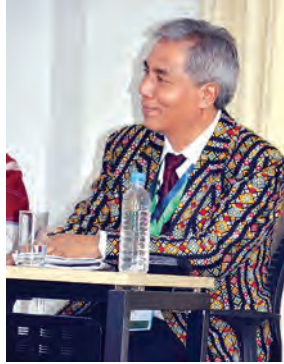
ဒေါက်တာဆလိုင်းလျန်မူန်းဆာခေါင်း