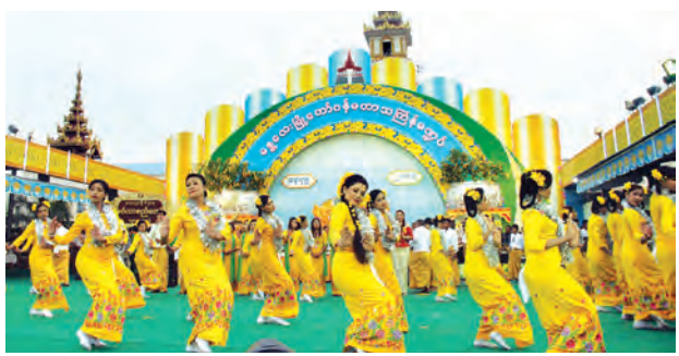
ယမန်နှစ်က မန္တလေးမြို့တော်ဝန်မဏ္ဍပ်၌ မဟာသင်္ကြန်ပွဲ ကျင်းပစဉ်။

ယခုနှစ် မန္တလေးမြို့ မြို့တော်ဝန် မဏ္ဍပ်တွင် သင်္ကြန်ပွဲတော်အတွက် အခြေခံပညာကျောင်းပေါင်း ၄၉ ကျောင်းမှ ကျောင်းသူ ၃၀၀၀ ပါဝင်ဆင်နွှဲမည်ဖြစ်ပြီး နိုင်ငံကျော် အဆိုတော်များလည်း ပါဝင်ဖော်ဖြေ တင်ဆက်သွားမည် ဖြစ်ကြောင်း မန္တလေးမြို့တော် စည်ပင်သာယာရေး တော်မော်သတင်းနှင့် ပြန်ကြားရေး ဌာနမှ သိရသည်။ မန္တလေးမြို့တော်ဝန် မဏ္ဍပ်ဖွင့်ပွဲ တွင် အခြေခံပညာကျောင်းများမှ ကျောင်းသူများပါဝင် ကပြဖော်ဖြေ မည့်အပြင် မန်းစည်ပင် ခေတ်ပေါ် တေးဂီတနှင့် မြန်မာဆိုင်းဝိုင်းများ၊ ယဉ်ကျေးမှုဦးစီးဌာနမှ မင်္ဂလာ စည်တော်အဖွဲ့များက နံနက်ပိုင်းနှင့် ညနေပိုင်းတွင် ပါဝင်တင်ဆက်ကြ