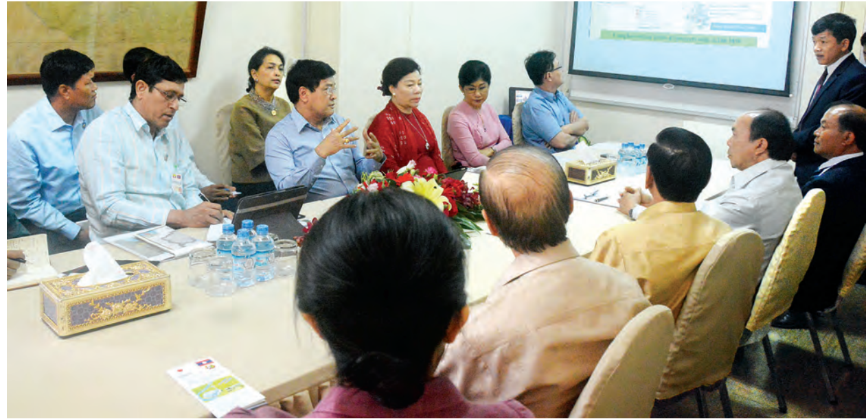
ဒုတိယသမ္မတ ဦးညွှန်ထွန်း လာအိုနိုင်ငံ နမ့်ငွမ်း(၁)ရေအားလျှပ်စစ်စက်ရုံမှ တာဝန်ရှိသူများနှင့် လာအိုနိုင်ငံ လျှပ်စစ်ဓာတ်အားရရှိရေး ဆောင်ရွက်ချက် များနှင့် ပတ်သက်၍ မေးမြန်းမှုများ ပြုလုပ်စဉ်။ (သတင်းစဉ်)

ရောင်းချမှုမှ ရရှိနေကြောင်းနှင့် ၂၀၂၀ ခုနှစ်တွင် ပြည်တွင်း အသား တင်ထုတ်လုပ်မှု၌ လျှပ်စစ်ကဏ္ဍ၏ ပါဝင်မှုကို ၁၆ ရာခိုင်နှုန်းအထိ တိုးတက်ရရှိအောင် ဆောင်ရွက်သွား