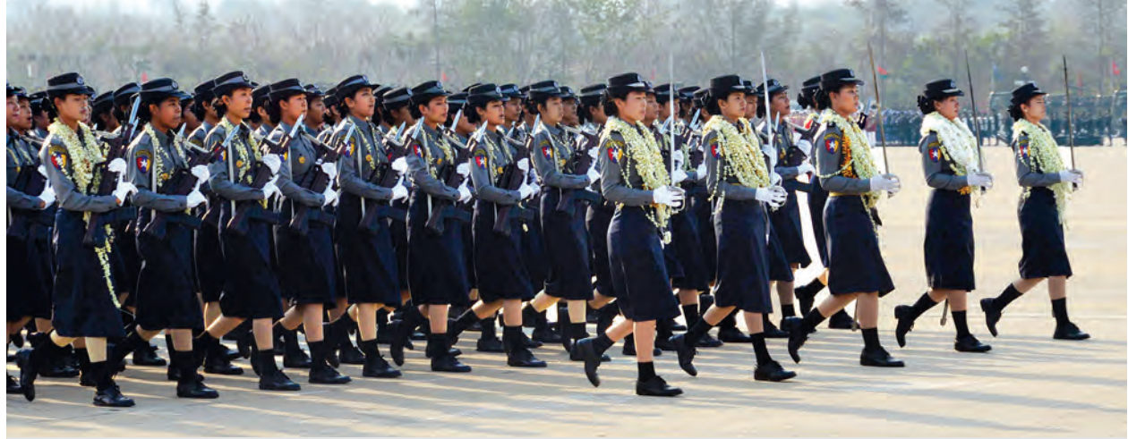
တပ်မတော်နေ့ စစ်ရေးပြအခမ်းအနားတွင် မြန်မာနိုင်ငံရဲတပ်ဖွဲ့ (အမျိုးသမီး) ကိုယ်စားပြု စစ်ရေးပြတပ်ဖွဲ့ ပါဝင်ချီတက်စဉ်။