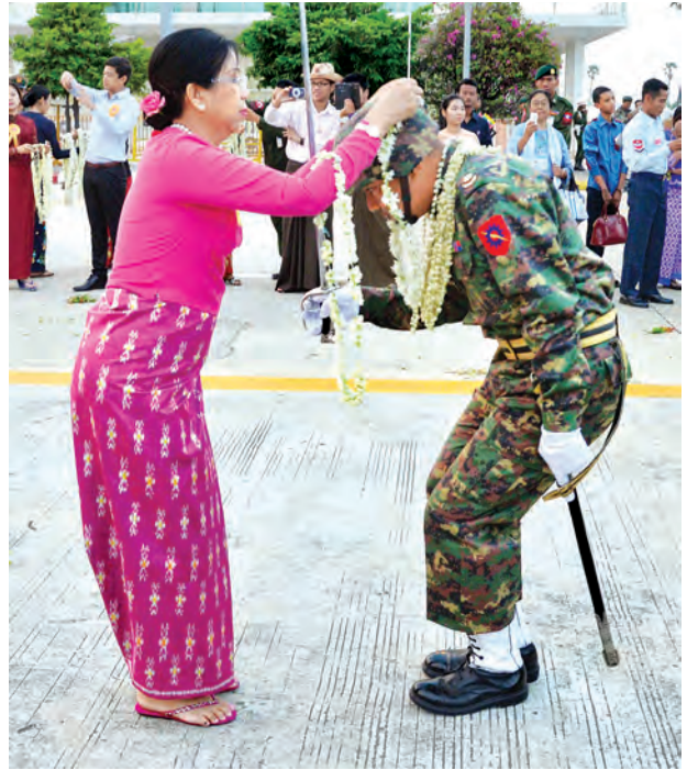
တပ်မတော်နေ့ စစ်ရေးပြအခမ်းအနားတွင် တပ်မတော်ကာကွယ်ရေးဦးစီးချုပ် ဗိုလ်ချုပ်မှူးကြီး မင်းအောင်လှိုင်၏ဇနီး ဒေါ်ကြူကြူလှ ဂုဏ်ပြုပန်းကုံးစွပ်၍ ကြိုဆိုစဉ်။

စစ်ကြောင်းကြီးများအလိုက် သစ်တပ်စစ်ရေးပြတွင်း၌ စတင်စုရုံးရောက်ရှိ နေရာယူကြပြီး စစ်ရေးပြအစီအစဉ်အတိုင်း ဆောင်ရွက်ကြသည်။ စစ်ရေးပြမျိုးကြီး ဗိုလ်မှူးချုပ် ဖုန်းမြတ် ဦးဆောင်၍ နှစ်(၇၀)ပြည့်