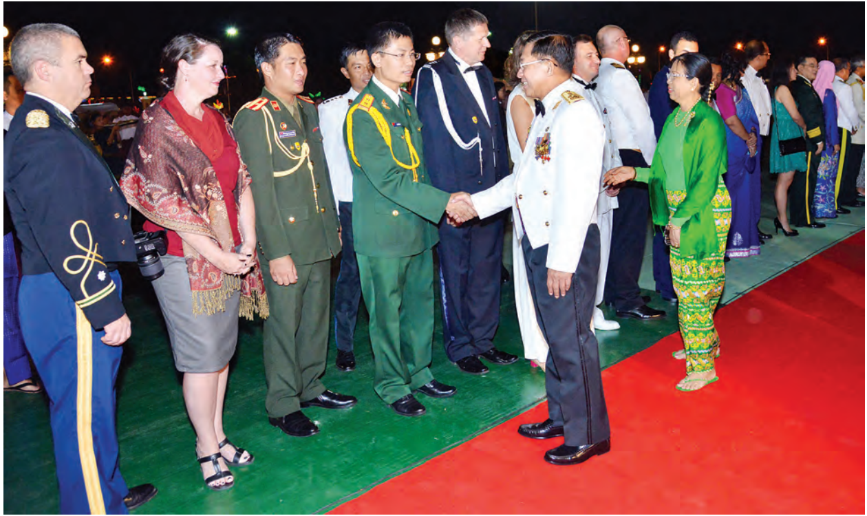
တပ်မတော်ကာကွယ်ရေးဦးစီးချုပ် ပိုလ်ချုပ်မှူးကြီး မင်းအောင်လှိုင်နှင့်ဇနီး ဒေါ်ကြူကြူလှတို့က နှစ်(၇၀)ပြည့် တပ်မတော်နေ့အထိမ်းအမှတ် ဧည့်ခံပွဲနှင့် ဂုဏ်ပြုညစာစားပွဲသို့ တက်ရောက်လာသည့် ဧည့်သည်တော်များအား ရင်းရင်းနှီးနှီးနှုတ်ဆက်စဉ်။ (မြဝတီ)

(ကြည်း)မှ တပ်မတော်အရာရှိကြီးများနှင့် ဇနီးများ၊ တပ်မတော်အငြိမ်းစားအရာရှိကြီးများနှင့် ဇနီးများ၊ လွှတ်တော်ရေးရာကော်မတီ ဥက္ကဋ္ဌများ၊ ဒုတိယဝန်ကြီးများ၊ မြန်မာနိုင်ငံဆိုင်ရာ နိုင်ငံခြားစစ်သံမှူးများ၊ တပ်မတော် အမျိုးသမီးအရာရှိကြီးများ၊ မြန်မာနိုင်ငံရဲတပ်ဖွဲ့မှ အရာရှိကြီးများ၊ မြန်မာနိုင်ငံစစ်မှုထမ်းဟောင်းအဖွဲ့ဝင်များ၊ လုပ်ငန်းရှင်များ၊ တက္ကသိုလ် လေ့ကျင့်ရေးတပ်များမှ တပ်ဖွဲ့ဝင် ကျောင်းဆရာများနှင့် ကျောင်းသားများ၊ နယ်ခြားစောင့်တပ်များ၊ ဗဟိုအကြံပေးနှင့် ကွပ်ကဲရေးအဖွဲ့များ၊ အနုပညာရှင်များ၊ စစ်ချီတေး၊ စစ်သီတေး၊ ကဗျာ၊ ဝတ္ထုပြိုင်ပွဲများတွင် ဆုရရှိသူများ၊ မြန်မာနိုင်ငံ စာနယ်ဇင်းကောင်စီ(ယာယီ) အဖွဲ့ဝင်များနှင့် ဖိတ်ကြားထားသူများအား ရင်းရင်းနှီးနှီး လိုက်လံနှုတ်ဆက်ကြသည်။ ထို့နောက် တပ်မတော်ကာကွယ်ရေးဦးစီးချုပ်နှင့်ဇနီးတို့က တက်ရောက်လာကြသည့် ဧည့်သည်တော်များအား ဂုဏ်ပြုညစာဖြင့် တည်ခင်း