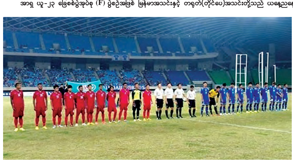
မြန်မာအသင်းအား တရုတ်(တိုင်ပေ)နှင့် မကစားမီ တွေ့ရစဉ်။