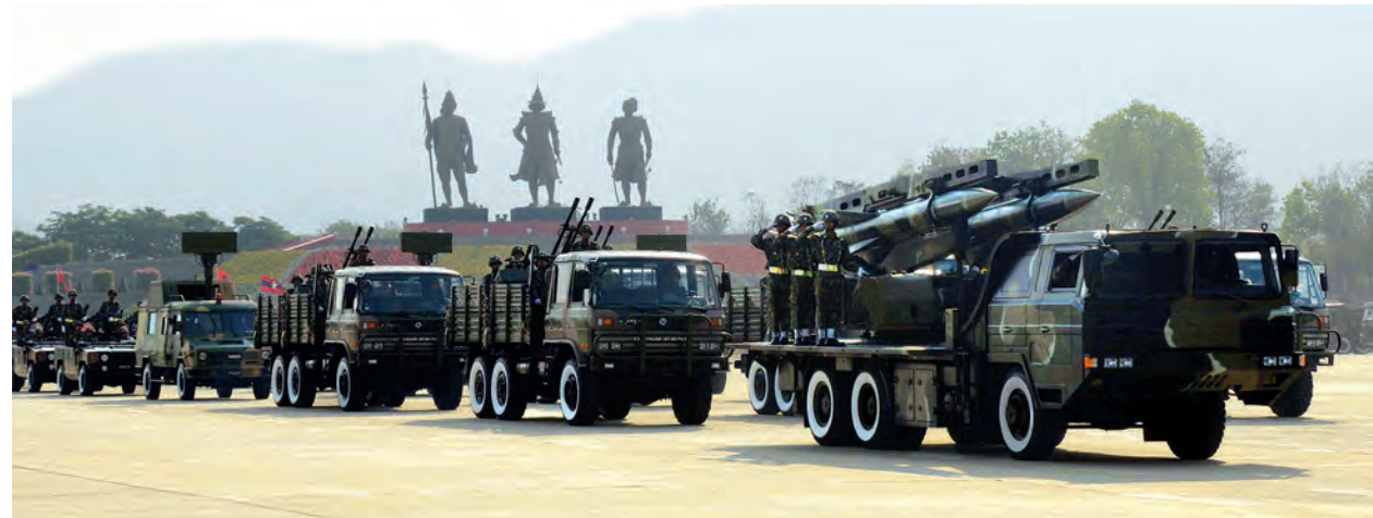
နေပြည်တော် မတ် ၂၇ ၂၀၁၅ ခုနှစ် နှစ် (၇၀)ပြည့် တပ်မတော်နေ့ စစ်ရေးပြအခမ်းအနားကို ယနေ့နံနက်ပိုင်းတွင် နေပြည်တော် စစ်ရေးပြစစ်ကြောင်းကြီး၌ ကျင်းပရာ တပ်မတော် ကာကွယ်ရေးဦးစီးချုပ် ဗိုလ်ချုပ်မှူးကြီး သရေစည်သူမင်းအောင်လှိုင် တက်ရောက်၍ မိန့်ခွန်းပြောကြားသည်။ အဆိုပါ စစ်ရေးပြအခမ်းအနားသို့ နိုင်ငံတော်ဖွဲ့စည်းပုံအခြေခံဥပဒေ ဆိုင်ရာခုံရုံးဥက္ကဋ္ဌ ဦးမြသိန်း၊ ပြည်ထောင်စုရွေးကောက်ပွဲကော်မရှင်ဥက္ကဋ္ဌ ဦးတင်အေး၊ ပြည်သူ့လွှတ်တော် ဒုတိယဥက္ကဋ္ဌ ဦးနန္ဒကျော်စွာ၊ ပြည်ထောင်စုဝန်ကြီးများ၊ ညှိနှိုင်းကွပ်ကဲရေးမှူး (ကြည်း၊ ရေ၊ လေ) ဗိုလ်ချုပ်ကြီး သရေစည်သူလှဌေးဝင်း၊ ကာကွယ်ရေးဦးစီးချုပ် (ရေ) ဗိုလ်ချုပ်ကြီး ဇေယျကျော်ထင် သူရသက်ဆွေ၊ စာမျက်နှာ ၇ ကော်လံ ၁ ✦