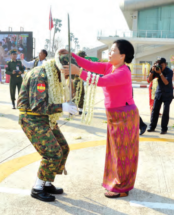
တပ်မတော်နေ့ စစ်ရေးပြအခမ်းအနားတွင် ဒုတိယသမ္မတ ဦးညွှန်ထွန်း၏ဇနီး ဒေါ်ခင်အေးမြင့် ဂုဏ်ပြုပန်းကုံးစွပ်၍ ကြိုဆိုစဉ်။

တပ်မတော်သည် နိုင်ငံတော်တည်ငြိမ်အေးချမ်းရေး၊ တိုင်းရင်းသားစည်းလုံးညီညွတ်ရေးနှင့် လူမှုဘဝ