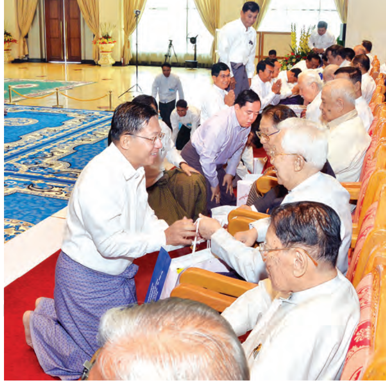
ဒုတိယပိုလ်ချုပ်ကြီး မင်းသိန်း၊ ဒုတိယ ပိုလ်ချုပ်ကြီး ဝင်းမြင့်၊ ဒုတိယ ပိုလ်ချုပ်ကြီး တင်အေး၊ ဒုတိယ ပိုလ်ချုပ်ကြီး တင်ဌေး၊ ဒုတိယပိုလ်ချုပ်ကြီး ကျော်သန်း၊ ဒုတိယပိုလ်ချုပ်ကြီး အောင်ထွေး၊ ဒုတိယပိုလ်ချုပ်ကြီး ကျော်ဝင်း၊ ဒုတိယပိုလ်ချုပ်ကြီး ရဲမြင့်၊ ဒုတိယပိုလ်ချုပ်ကြီး ခင်မောင်သန်း၊ ဒုတိယ ပိုလ်ချုပ်ကြီး စိန်ထွေး၊ ပိုလ်ချုပ် တင်ဌေး၊ ပိုလ်ချုပ် မြင့်အောင်၊ ဒုတိယပိုလ်ချုပ်ကြီး ကြည်မင်း၊ ပိုလ်ချုပ် မြင့်ဆွေ၊ ပိုလ်ချုပ် မောင်ညို၊ ပိုလ်ချုပ် တင်ဌေး၊ ပိုလ်ချုပ် ဝင်းမြင့်၊ ပိုလ်ချုပ် သိန်းထွန်း၊ ပိုလ်ချုပ် အောင်ကြည်၊ ပိုလ်ချုပ်

နှစ်(၇၀)ပြည့် တပ်မတော်နေ့အခမ်းအနားသို့ တက်ရောက်ခဲ့ကြသော တပ်မတော်တွင် တာဝန်ထမ်းဆောင်ခဲ့သည့် အငြိမ်းစားအရာရှိကြီးများအား ဂါရဝပြုကန်တော့သည့် အခမ်းအနားကို ယနေ့ မွန်းလွဲပိုင်းတွင် နေပြည်တော်ရှိ ဇေယျာသီရိဗိမာန်၌ ကျင်းပရာ တပ်မတော်ကာကွယ်ရေးဦးစီးချုပ် ပိုလ်ချုပ်မှူးကြီး မင်းအောင်လှိုင် ဦးဆောင်သော တပ်မတော်(ကြည်း)ရေလေ) မိသားစုများ တက်ရောက်ဂါရဝပြုကန်တော့ကြသည်။ အဆိုပါ ဂါရဝပြုအခမ်းအနားသို့ တပ်မတော် အငြိမ်းစားအရာရှိကြီးများဖြစ်ကြသော ပိုလ်ချုပ် သူရစောဖြူ၊ ပိုလ်မှူးချုပ် တင့်ဆွေ၊ ပိုလ်မှူးချုပ် လှထွန်း၊ ပိုလ်မှူးချုပ် သန်းတင်၊ ပိုလ်ချုပ်အောင်ခင်၊ ပိုလ်မှူးချုပ် အေးစန်၊ ပိုလ်မှူးချုပ် မျိုးအောင်၊ ဒုတိယ ပိုလ်ချုပ်ကြီး မောင်မောင်ခင်၊ ဒုတိယပိုလ်ချုပ်ကြီး အောင်ရဲကျော်၊ ဒုတိယပိုလ်ချုပ်ကြီး မျိုးညွန့်၊ ဒုတိယပိုလ်ချုပ်ကြီး ထွန်းကြည်၊ ဒုတိယပိုလ်ချုပ်ကြီး ကျော်ဘ၊ ဒုတိယပိုလ်ချုပ်ကြီး သန်းညွန့်၊ ဒုတိယပိုလ်ချုပ်ကြီး သိန်းဝင်း၊ ပိုလ်မှူးချုပ် မောင်မောင်