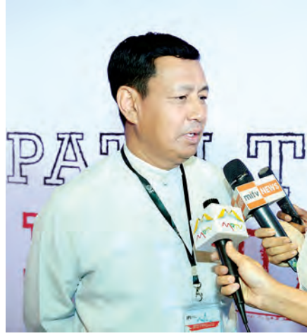
ပြည်ထောင်စုဝန်ကြီး ဦးရဲထွဋ်

အင်အားသုံးခြင်းနဲ့ အလွန်အကျွံ အင်အားသုံးခြင်းကြားမှာ ကျော်လွန်မှုတွေရှိနိုင်တယ်။ ဒါကိုပြန်ပြီး သုံးသပ်ရမယ်။ သုံးသပ်ပြီးရင် လိုအပ်တဲ့လေ့ကျင့်မှု