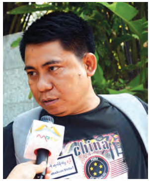
ဦးကျော်ဇောထွန်း

အဆိုပါညီလာခံသို့ နိုင်ငံတကာမီဒီယာအဖွဲ့အစည်း အသီးသီးမှ ရှေ့ဆောင်မီဒီယာများ၊ အမှောင်အယ်ဒီတာ နှင့် သတင်းအယ်ဒီတာများ၊ ထုတ်ဝေသူများ၊ သတင်းစာဆရာများ၊ မြန်မာနိုင်ငံနယ်ပယ်အသီးသီးရှိ သတင်းမီဒီယာလုပ်ငန်း လုပ်ကိုင်နေသူများ တက်ရောက်ကြပြီး မီဒီယာလွတ်လပ်ခွင့်နှင့် မီဒီယာဖွံ့ဖြိုးတိုးတက်ရေးဆိုင်ရာများကို ဆွေးနွေးကြမည်ဖြစ်သည်။ အဆိုပါ ညီလာခံမကျင်းပမီ မီဒီယာလွတ်လပ်ခွင့်အတွက် ဆွေးနွေးပွဲကျင်းပရာသို့ လာရောက်လှုပ်ရှားမှုပြုလုပ်ခဲ့သော သတင်းမီဒီယာများ၏ ဆန္ဒသဘောထားများနှင့် ယင်းသို့ ဆန္ဒပြခြင်းအပေါ် မြန်ကြားရေးဝန်ကြီးဌာန ပြည်ထောင်စုဝန်ကြီး၏ သဘောထားအမြင်များကို မြန်မာ့သတင်းစဉ်သတင်းအဖွဲ့မှ စုစည်းဖော်ပြလိုက်ပါသည်။