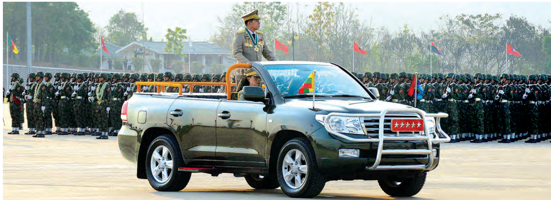
တပ်မတော်ကာကွယ်ရေးဦးစီးချုပ် ဗိုလ်ချုပ်မှူးကြီး သရေစည်သူ မင်းအောင်လှိုင် စစ်ရေးပြစစ်ကြောင်းကြီးများအား စစ်ဆေးစဉ်။ (သတင်းစဉ်)