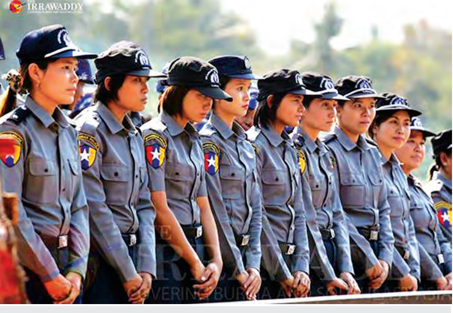
သပိတ်စစ်ကြောင်းကို တားဆီးသည့် အမျိုးသမီးရဲတပ်ဖွဲ့ဝင်များကိုတွေ့ရစဉ်။