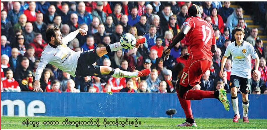
မန်ယူမှ မာတာ လီဗာပူးဘက်သို့ ဂိုးတန်သွင်းစဉ်။

မန်ယူက နှစ်ဂိုး-တစ်ဂိုးဖြင့် အနိုင်ရရှိခဲ့သည်။