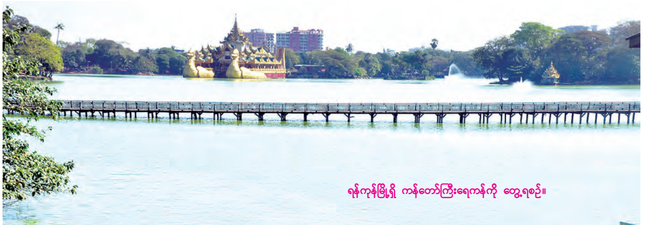
ရန်ကုန်မြို့ရှိ ကန်တော်ကြီးရေကန်ကို တွေ့ရစဉ်။

များရုံးများသို့ အချိန်မီ သတင်းပို့နိုင်ပြီး ဌာန (ရေနှင့်သန့်ရှင်းမှု)ဌာန ဖုန်း- ၀၁-၂၄၉၆၅၅၊ ၀၁-၃၈၂၉၈၉ တို့ကို ဆက်သွယ်အကူအညီတောင်းခံနိုင် ကြောင်း သိရသည်။ (မြန်မာ့အလင်း)