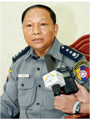
ရဲမှူးကြီးဝင်းစိန်