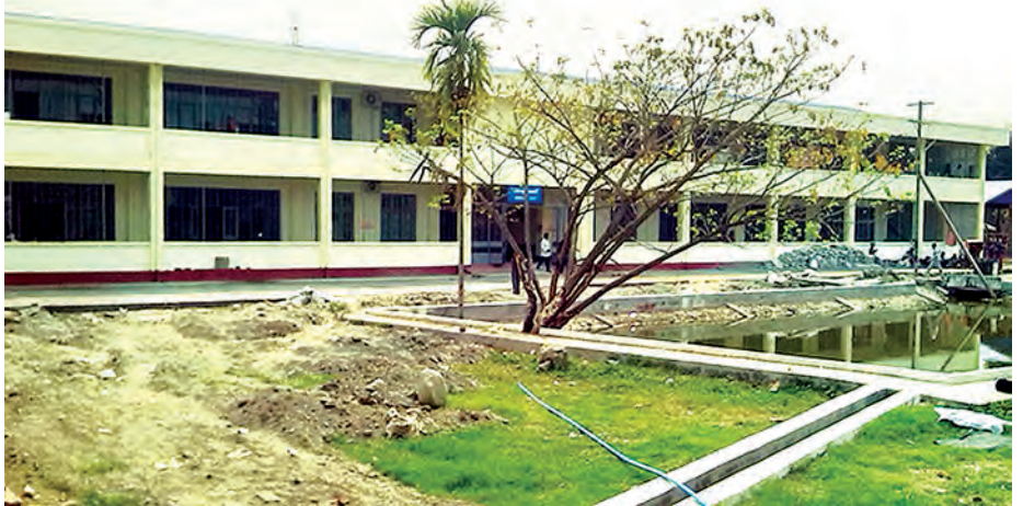
ကလေးမြို့ ပြည်သူ့ဆေးရုံလူနာဆောင် နှစ်ထပ်တိုးချဲ့ဆောင်သစ်ကိုတွေ့ရစဉ်။

ဆောက်လုပ်ကာ ယခုအချိန်တွင် ပြီးစီးပြီးဖြစ်၍ ဆေးကုသဆောင် MEDICAL UNIT အတွက် အသုံးပြုနေပြီဖြစ်ကြောင်း သိရသည်။ ကလေးမြို့ ခုတင် (၂၀၀)ဆုံ ပြည်သူ့ဆေးရုံကြီးသည် ကလေးမြို့နယ်ရှိ ပြည်သူများ၊ စစ်ကိုင်းတိုင်းဒေသကြီးအထက်ပိုင်းနှင့် ချင်းပြည်နယ်တို့မှ ပြည်သူများ၏ အားကိုးအားထားရာ ဆေးရုံကြီးဖြစ်သည်နှင့်အညီ လူနာပေါင်းစုံ၊ ရောဂါမျိုးစုံကို အထူးကု ဆရာဝန်များစုံလင်စွာဖြင့် ဆေးကုသပေးလျက်ရှိရာ နှစ်ထပ်