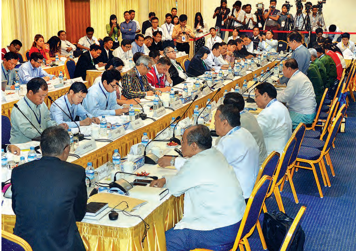
ဆွေးနွေးပွဲသည် ဆဌမနေ့တွင် အခန်း (၇) ခန်းလုံးကို ဆွေးနွေးပြီး ပြန်လည်သုံးသပ်မှုပြုလုပ်နိုင်ခဲ့သည်။ (၇) ကြိမ်မြောက် UPWC နှင့် NCCT တို့၏ တွေ့ဆုံဆွေးနွေးမှုတွင်

ကို ဆွေးနွေးခဲ့သည်။ ဒုတိယနေ့တွင် နှစ်ဖက်တပ်များ လိုက်နာရမည့် စည်းမျဉ်း စည်းကမ်းများ (Military CoC) နှင့် ယင်းစည်းမျဉ်း စည်းကမ်းများကို ပူးတွဲစောင့်ကြည့်ရေး ကော်မတီ (Joint Monitoring Committee) ဖွဲ့စည်းရေး အစရှိသည့် တပ်ပိုင်းဆိုင်ရာ ကိစ္စရပ်အား အဓိကထား ဆွေးနွေးခဲ့သည်။ တတိယနေ့တွင် အခန်း (၅) အား ဆွေးနွေးခဲ့ပြီး ပဋိပက္ခလျော့ချရေး နှင့် တစ်နိုင်ငံလုံးပစ်ခတ်တိုက်ခိုက်မှုရပ်စဲရေးစာချုပ် (NCA) ပါ တပ်ပိုင်းဆိုင်ရာကိစ္စရပ်များအား ဆွေးနွေးသဘောတူညီမှုရရှိခဲ့သည်။ စတုတ္ထနေ့တွင် တစ်နိုင်ငံလုံးအပစ်အခတ်ရပ်စဲရေးစာချုပ် (မူကြမ်း) တွင် ပါဝင်သည့် ကျန်ရှိနေသည့် အခန်းများ၊ တစ်နိုင်ငံလုံးအပစ်အခတ်ရပ်စဲရေးစာချုပ် ချုပ်ဆိုပြီးပါက စာချုပ်အား ပူးတွဲအကောင်အထည်ဖော်ရန်အတွက် ဆက်လက်လုပ်ဆောင်ရမည့်ကိစ္စရပ်များ Structure (ဖွဲ့စည်းမှုပုံသဏ္ဍာန်) နှင့် လမ်းပြမြေပုံ (Road Map) ကိစ္စရပ်များကို မတ် ၂၀ ရက်တွင် ပြုလုပ်သည့် စတုတ္ထနေ့တွင် ဆက်လက်ဆွေးနွေးခဲ့သည်။ ပဉ္စမနေ့တွင် ယခင်နေ့ဆွေးနွေးပွဲ၌ မပြီးပြတ်ခဲ့သည့် Road Map (လမ်းပြမြေပုံ) နှင့် အခန်း (၅) တွင် ကျန်ရှိသည့် အချက်ငယ်နှစ်ချက်၊ အခန်း (၆) အခန်း (၇) တို့ကို ဆက်လက်