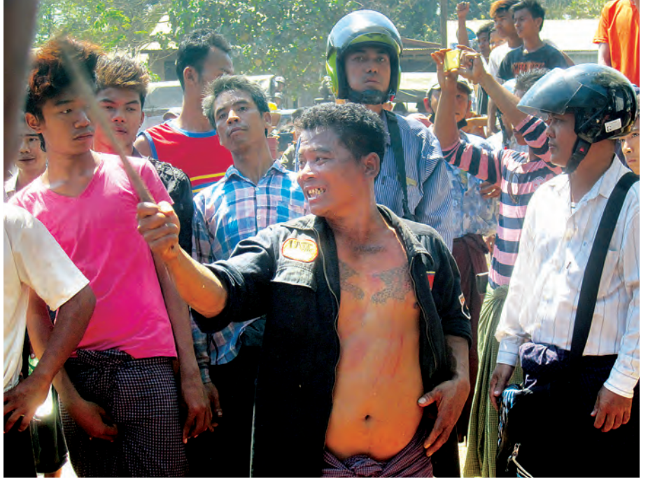
လုံခြုံရေးတပ်ဖွဲ့ဝင်များအား သပိတ်စစ်ကြောင်းမှ ဆူပူအကြမ်းဖက်လိုသူများက တုတ်များဖြင့် ရန်ပြုစဉ်။

ခတိုးမြှင့်ပေးရေးအတွက် သူတို့ရဲ့စက်ရုံရှေ့မှာ ပိတ်ဆို့ဆန္ဒပြမှုတွေ ပြုလုပ်တယ်။ ဥပဒေမဲ့ချီတက်ဆန္ဒဖော်ထုတ်ခြင်းတွေ ပြုလုပ်ခဲ့ကြပါတယ်။ သူတို့ကို သက်ဆိုင်ရာမြို့နယ်အလုပ်ရှင်/အလုပ်သမား ညှိနှိုင်းဖျန်ဖြေရေးအဖွဲ့ကနေ အလုပ်ရှင်နဲ့အလုပ်သမားကြား ညှိနှိုင်းဆောင်ရွက်ပေးပေးမယ့်လည်း ပြေလည်မှုမရရှိတဲ့အတွက် ဖေဖော်ဝါရီလ ၁၇ ရက်နေ့မှာ ရန်ကုန်တိုင်းဒေသကြီး အလုပ်သမားရေးရာ ညှိနှိုင်းဆွေးနွေးရေးအဖွဲ့ကနေ အလုပ်ရှင်နဲ့ အလုပ်သမားတွေကို အင်းစိန်မြို့နယ် အထွေထွေအုပ်ချုပ်ရေးမှူးရုံးမှာ စတင်ညှိနှိုင်း ဆောင်ရွက်ပေးခဲ့ပါတယ်။ အဲဒီလို ဖေဖော်ဝါရီလ ၁၇ ရက်နေ့ သတင်းတွေမှာ ရန်ကုန်တိုင်းဒေသကြီးအစိုးရအဖွဲ့ရဲ့ သတင်းထုတ်ပြန်ချက် (၁/ ၂၀၁၅)နဲ့ ရပ်ရွာအေးချမ်းသာယာရေးနဲ့ တရားဥပဒေစိုးမိုးရေးထိခိုက်ပျက်ပြားစေရန် ပြုလုပ်သူတွေကို အလုပ်ရှင် အလုပ်သမားမခွဲခြားဘဲ တည်ဆဲဥပဒေတွေနဲ့ အညီ အရေးယူဆောင်ရွက်မယ်ဆိုပြီး သတင်းထုတ်ပြန်ခဲ့ပါတယ်။