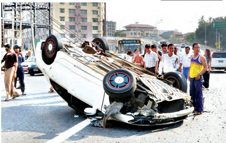
(၂၉ နှစ်) ၏ AA/----- (Corolla) ခွဲရာ အဆိုပါအငှားယာဉ်မှာ ရှေ့ပိုင်းကောင်းထက်ကျော် (၂၀ နှစ်) ၏ 3F/----- Honda Civic (အဖြူရောင်) ယာဉ်ပေါ်တွင် ယာဉ်တိုက်မှုတွင် ယာဉ်မောင်းများက အရှိန်ပြင်းစွာဖြင့် ဝင်တိုက်ခဲ့ရာ အဆိုပါအငှားယာဉ်မှာ ရှေ့ပိုင်းဝဲဘက် ထိခိုက်မှုဖြစ်ခဲ့သည်။ အဆိုပါယာဉ်တိုက်မှုတွင် ယာဉ်မောင်းကောင်းထက်ကျော် (၂၀ နှစ်) ၏ 3F/----- Honda Civic (အဖြူရောင်) ယာဉ်ပေါ်တွင် ယာဉ်မောင်း (မြန်မာ့အလင်း)

ရန်ကုန် မတ် ၂၂ ရန်ကုန်မြို့ ကမ္ဘာ့အေးဘုရားလမ်းပေါ်ရှိ ရွှေဂုံတိုင်ခုံးကျော်တံတားအဆင်းပွင့်သစ်စမ်းစားဖွယ်စုံ လက်ဖက်ရည်ဆိုင်ရှေ့၌ ယနေ့ညနေ ၃ နာရီက ယာဉ်တိုက်မှုတစ်ခုဖြစ်ပွားခဲ့သည်။