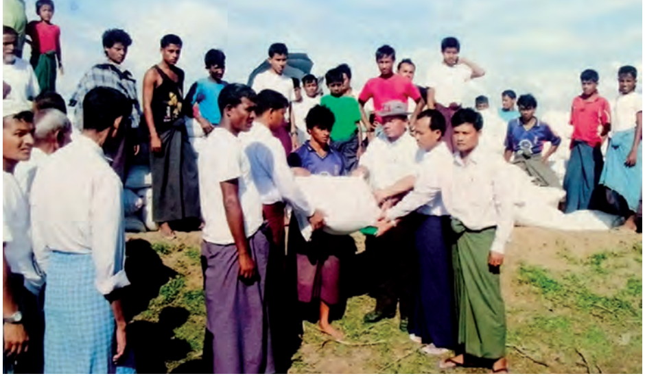
ပေါက်တောမြို့နယ်၌ မျိုးစပါးဖြန့်ဖြူးနေစဉ်။

ရန်ကုန် မတ် ၂၂ ကျေးလက်ဒေသနေပြည်သူများ လူမှုဘဝ ဖွံ့ဖြိုးတိုးတက်ရေးအတွက် အရေးကြီးသည်။ စိုက်ပျိုးရေးကို အခြေခံသော ကျေးလက်နေ တောင်သူများအတွက် အခြေခံလို