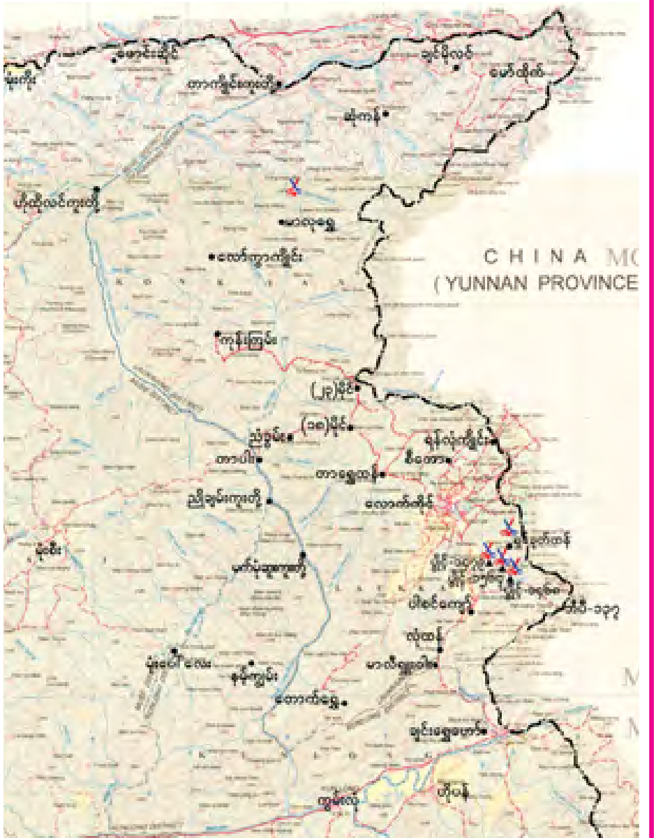
လောက်ကိုင်ဒေသ တိုက်ပွဲဖြစ်ပွားသည့် နေရာပြပုံ

အဆိုပါတိုက်ပွဲဖြစ်စဉ်များတွင် တပ်မတော်မှ စစ်သည်တစ်ဦး၊ တိုင်းပြည်အတွက် အသက်ပေးလျှာခဲ့ပြီး အရာရှိ၊ စစ်သည် ၃၁ ဦး ထိခိုက်ဒဏ်ရာရရှိခဲ့ကြောင်း သိရှိရပါသည်။ (မြဝတီ)