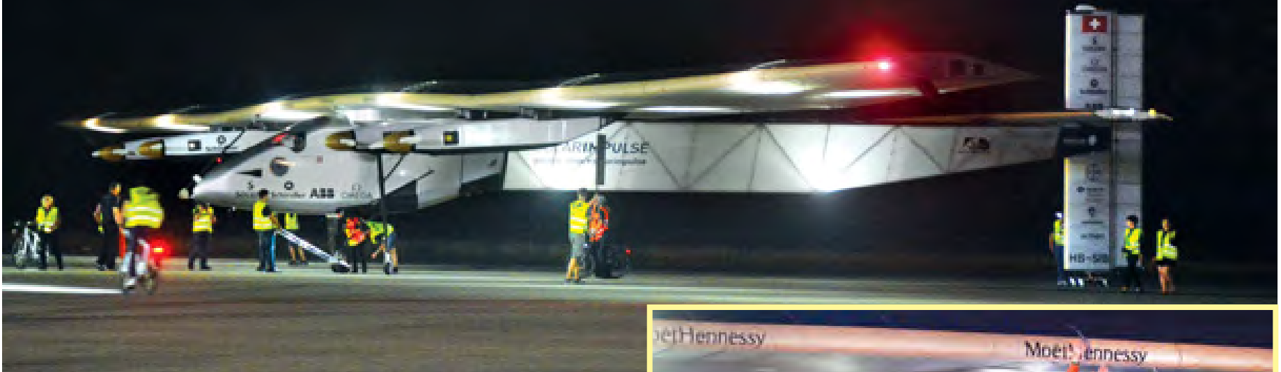
မန္တလေး မတ် ၁၉

အိန္ဒိယနိုင်ငံ ဗာရာဏသီမြို့မှ နာရီပေါင်း ၁၅ နာရီကျော် မောင်းနှင်လာသည့် နေရောင်ခြည်စွမ်းအင်သုံးလေယာဉ် Solar Impulse-2 သည် မြန်မာနိုင်ငံ ရှေးဟောင်းယဉ်ကျေးမှုမြို့တော် မန္တလေးမြို့၌ ခရီးတစ်ထောင်စိုးရားရန် မတ် ၁၉ ရက် ည ၇ နာရီ ၄၅ မိနစ်တွင် စတင်ရောက်ရှိပြီး မန္တလေးအပြည်ပြည်ဆိုင်ရာလေဆိပ်သို့ ည ၈ နာရီခွဲတွင် ရောက်ရှိရပ်နားသည်။ (အပေါ်ပုံ)