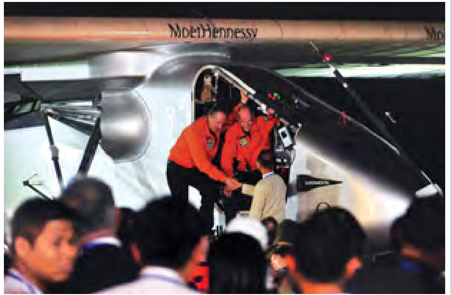
ပြည်ထောင်စုဝန်ကြီး ဦးစိုးသိန်း Solar Impulse-2 လေယာဉ်မှူးများအား နှုတ်ဆက်စဉ်။ (သတင်းစဉ်)