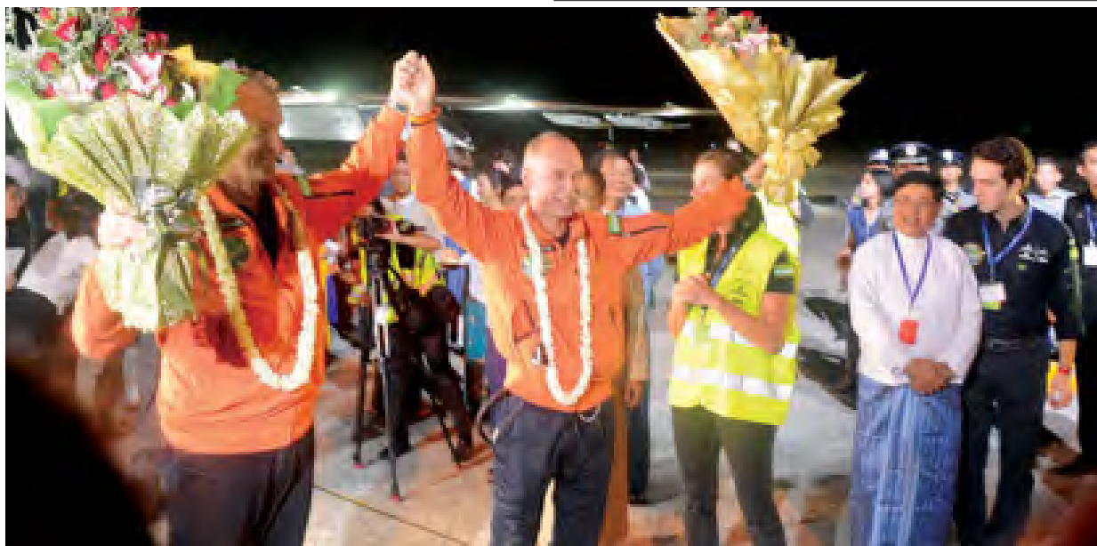
မန္တလေးတိုင်းဒေသကြီးဝန်ကြီးချုပ် ဦးရဲမြင့် Solar Impulse-2 လေယာဉ်မှူးများအား နှုတ်ဆက်စဉ်။ (သတင်းစဉ်)