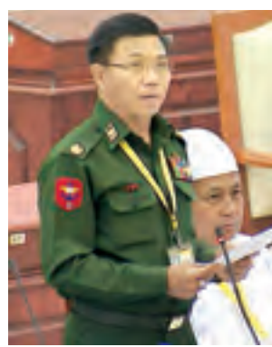
ဒုတိယဝန်ကြီး ဗိုလ်မှူးချုပ် ကျော်ဇံမြင့် ဖြေကြားစဉ်။ (သတင်းစဉ်)

မေးခွန်းနှင့် စပ်လျဉ်း၍ ပြည်ထဲရေး ဝန်ကြီးဌာန ဒုတိယဝန်ကြီး ဗိုလ်မှူးချုပ်ကျော်ဇံမြင့်က ပို့ကုန်/သွင်းကုန် ဥပဒေပုဒ်မ ၅ တွင် ကန့်သတ်ထား ဖြစ်ပိတ်ပင်ထားသော ကုန်ပစ္စည်းများကို တင်ပို့ခြင်း၊ တင်သွင်းခြင်းမပြုရ ဟုလည်းကောင်း၊ ယင်းဥပဒေပုဒ်မ ၆ တွင် ခွင့်ပြုချက်ရယူရန် သတ်မှတ်ထားသော ကုန်ပစ္စည်းများကို ခွင့်ပြုချက်ရယူခြင်းမရှိဘဲ တင်ပို့ခြင်း၊ တင်သွင်းခြင်းမပြုရဟုလည်းကောင်း ပြဋ္ဌာန်းထားရှိပြီး ဖောက်ဖျက်ကျူးလွန်ပါက (၃)နှစ်ထက်မပိုသော ထောင်ဒဏ်ဖြစ်စေ၊ ငွေဒဏ် ဖြစ်စေ၊ ဒဏ်နှစ်ရပ်လုံးဖြစ်စေ ချမှတ်ရမည်ဟု