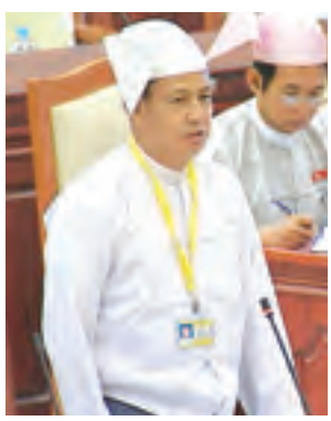
ပြည်ထောင်စုဝန်ကြီး ဦးရဲထွဋ် ရှင်းလင်းတင်ပြစဉ်။ (သတင်းစဉ်)

အစည်းအဝေးတွင် သယံဇာတနှင့် မဲဆန္ဒနယ်မှ ဦးသိန်းညွန့်၏ ပြည်ပမှ ခိုးသွင်းလာသည့် ရုပ်ပေစလောင်း၊ JPM ခေါ် လိမ္မော်ရောင်ပန်း၊ PSI ခေါ် အမည်းရောင်ပန်းစသည်ဖြင့် တရားမဝင်ဖြိုဟ်တုစလောင်းများနှင့် ပတ်သက်၍ မည်ကဲ့သို့အရေးယူ ဆောင်ရွက်သွားမည်ကို သိရှိလိုခြင်း