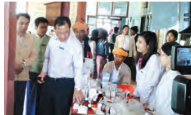
သွားနှင့်ခံတွင်း၊ တိုင်းရင်းဆေး ပြည်သူများကို အခမဲ့ဆေးဝါးကုသ စသည့် သမားတော်နှင့် အထူးကု ပေးခဲ့ကြောင်း သိရသည်။ ဆရာဝန်ကြီးများက တိုင်းရင်းသား (မြို့နယ် ပြန်/ဆက်)

ရှမ်းပြည်နယ် ကျန်းမာရေးဦးစီး ဌာနအနေဖြင့် ပြည်နယ်အတွင်းရှိ ခရိုင်၊ မြို့နယ်၊ ကျေးရွာများသို့ အလှည့်ကျတွင်းဆင်း၍ အခမဲ့ ဆေးဝါးကုသပေးလျက်ရှိရာ ပြည်နယ် အစိုးရ၏ကြီးကြပ်မှုဖြင့် မတ် ၁၄ ရက်က ကျောက်တလုံးကြီးမြို့ ပြည်သူ့ဆေးရုံတွင် စင်စစ်ထွန်း ဆေးရုံကြီးနှင့် အမျိုးသမီးနှင့်ကလေး ဆေးရုံတို့မှ အထူးကုသမားတော်ကြီး များနှင့် ဆရာဝန်ကြီးများ၊ သူနာပြု များပါဝင်သည့်အဖွဲ့သည် မြို့ပေါ် ရပ်ကွက်နှင့် ပတ်ဝန်းကျင်ရွာများမှ တိုင်းရင်းသားပြည်သူများအား အခမဲ့ ဆေးဝါးကုသပေးခဲ့ကြောင်း သိရ သည်။ ဆေးဝါးကုသရာသို့ ရှမ်းပြည်နယ် ဘဏ္ဍာရေးဝန်ကြီး ဦးခွန်သိန်းမောင်၊ ပြည်နယ် လူမှုရေးဝန်ကြီးဒေါက်တာ မျိုးထွန်း၊ ပြည်နယ်ကျန်းမာရေး ဦးစီးမှူး ဒေါက်တာမိုးဆွေ ဦးဆောင်သည့် အုပ်ချုပ်ရေးအဖွဲ့နှင့် ကျောက်တလုံးကြီးမြို့ ဌာနဆိုင်ရာ တာဝန်ရှိသူများအား ဆေးဝါးများနှင့် ထောက်ပံ့ပေးပေးအပ်ခဲ့ကြသည်။ အဆိုပါ ဆေးကုသရာတွင် အထွေထွေရောဂါအထူးကု၊ ခွဲစိတ် အထူးကု၊ သားဖွားမီးယပ်၊ ကလေး အထူးကု၊ အရိုးအကြောအဆစ်၊