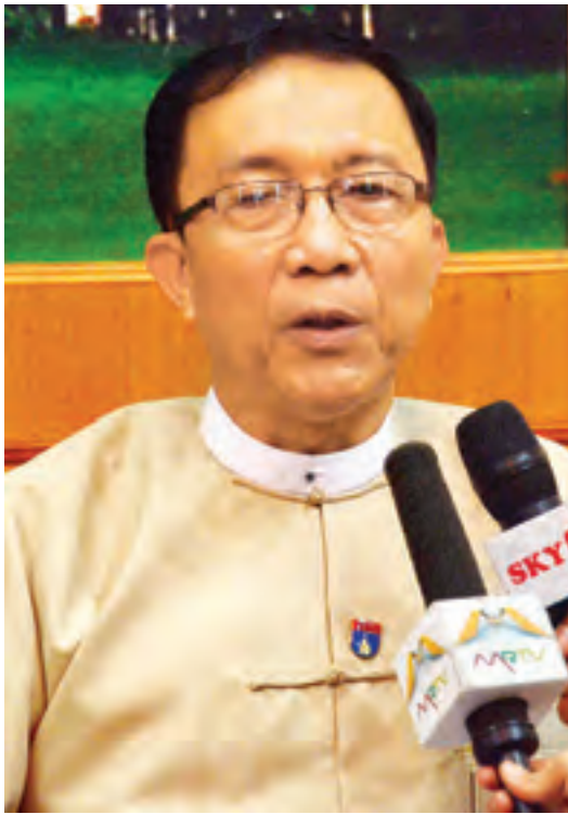
ပြည်ထောင်စုဝန်ကြီး ဦးဝင်းရှိန် မီဒီယာများအား ဖြေကြားစဉ်။

ကြေးမြီအခွန်ပြောင်းသွားတာ ဖြစ်ပါတယ်။ အစိုးရ တာဝန်ယူတဲ့ ၂၀၁၁ ခုနှစ် ကစပြီးတော့ နိုင်ငံတကာ ကို ကျွန်တော်တို့ နိုင်ငံဟာ ဒီမိုကရေစီလမ်းကြောင်းပေါ်ကို ပြုပြင်ပြောင်းလဲပြီး သွားတော့မယ့် အနေအထား၊ နိုင်ငံတကာနဲ့ ဆက်ဆံမှုတွေကို ပြန်လည်ပြုလုပ်ရတော့မယ့်အနေအထား။ ထို့အတူ ကျွန်တော်တို့မှာ တာဝန်ရှိနေတဲ့ အခွန်က ကျွန်တော်တင်ပြခဲ့တဲ့ ပြန်ဆပ်ရမယ့် ကြေးမြီတွေကို ကျွန်တော်တို့ ပြန်ဆပ်ခြင်းအားဖြင့် တာဝန်သိတဲ့နိုင်ငံတစ်ခုဖြစ်အောင် စတင်ကြိုးပမ်းဆောင်ရွက်ခဲ့တာ ဖြစ်ပါတယ်။ ချေးငွေနဲ့ ဖြစ်ပေါ်လာတဲ့ ကြေးမြီတွေအားလုံးဟာ ကျွန်တော်တို့ပြန်ဆပ်ဖို့ကိစ္စကို ၂၀၁၁-၂၀၁၂ ဘဏ္ဍာနှစ်မှာ စတင်ကြိုးပမ်းဆောင် ရွက်ခဲ့ပါတယ်။ ညှိနှိုင်းခဲ့ပါတယ်။ အစိုးရသစ်