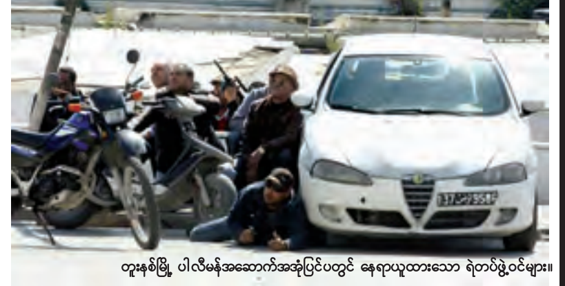
တူးနစ်မြို့ ပါလီမန်အဆောက်အအုံပင်ပင်တွင် နေရာယူထားသော ရဲတပ်ဖွဲ့ဝင်များ။

ရှုတ်ချလိုက်ကြောင်း ထုတ်လွှင့်သွားသည်။ အဆိုပါ တိုက်ခိုက်မှုအတွင်း ၁၉ ဦး သေဆုံးခဲ့ရာ ကမ္ဘာလှည့်ခရီးသည် ၁၇ ဦးပါကြောင်း၊ ယင်းအနက် ရှစ်ဦးမှာပြင်သစ်လူမျိုးများဖြစ်ပြီး အီတလီ၊ ပိုလန်၊ ဂျာမနီနှင့်စပိန်လူမျိုးတို့လည်း သေဆုံးခဲ့ကြောင်း၊ အခြားကမ္ဘာလှည့်ခရီးသည် ၂၂ဦးနှင့် တူနီးရှားလူမျိုးနှစ်ဦးတို့ ဒဏ်ရာရသွားကြောင်း တူနီးရှားဝန်ကြီးချုပ်က ပြောကြားသည်။ အဆိုပါ တိုက်ခိုက်မှုတွင် ပါဝင်ပတ်သက်ဖွယ်ရှိသူ သုံးဦးကို ရဲကရှာဖွေနေကြောင်း အယ်ဂျာဇီးရာက ထုတ်လွှင့်သည်။ (ရိုက်တာ)