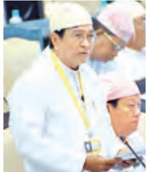
ပြည်ထောင်စု ဝန်ကြီး ဦးကျော်လွင် ဖြေကြားစဉ်။ (သတင်းစဉ်)

တင်ပြထားသည့် မိတ္ထီလာ-မြင်းခြံလမ်းနှင့် ရန်ကုန်-မိတ္ထီလာ-မန္တလေးလမ်းတို့ကို ဆက်သွယ်မည့် မိတ္ထီလာ မြို့ရောင်လမ်းကို ၁၉၉၁ ခုနှစ်တွင် စည်ပင်သာယာရေး ဦးစီးဌာနမှ ဖောက်လုပ်ခဲ့ပြီး လေးမိုင်ခန့် အရှည်ရှိသည့် မြေသားလမ်းဖြစ်ပါကြောင်း၊ အဆိုပါ မိတ္ထီလာ မြို့ရောင်လမ်းကို မိမိတို့ဝန်ကြီးဌာနက ကွင်းဆင်းစစ်ဆေး ဆောင်ရွက်သွားမည်ဖြစ်ပြီး လိုအပ်ပါက မန္တလေးတိုင်းဒေသကြီးအစိုးရအဖွဲ့နှင့် ညှိနှိုင်းဆောင်ရွက်ပေးသွားမည်ဖြစ်ပါကြောင်းဖြင့် ဖြေကြားခဲ့သည်။