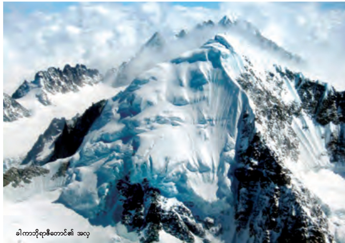
ခါကာဘိုရာဇီတောင်၏ အလှ