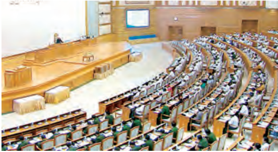
ပထမအကြိမ် ပြည်ထောင်စုလွှတ်တော် (၁၂)ကြိမ်မြောက် ပုံမှန်အစည်းအဝေး ကျင်းပစဉ်။ (သတင်းစဉ်)

ဒုတိယအဆင့်အနေဖြင့် စီမံကိန်းတစ်ခုချင်းအလိုက် ယခုနှစ်အထိ စီမံကိန်းပြီးစီးမှုရာခိုင်နှုန်း မည်မျှလာမည်၊ မည်မျှရာခိုင်နှုန်းပြီးမည်၊ စီမံကိန်းတစ်ခုလုံးကို မည်သည့်နှစ်တွင် ပြီးမည်ဆိုသည်ကို စိစစ်ကြည့်ရှု