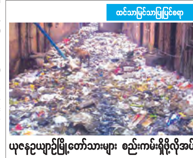
ယနေ့ညယျာဉ်မြို့တော်သားများ စည်းကမ်းရှိဖို့လိုအပ်