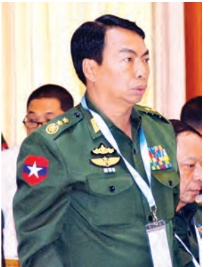
ဒုတိယဗိုလ်ချုပ်ကြီးမြင့်စိုး