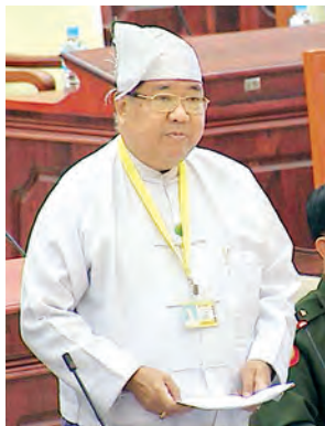
ဒုတိယဝန်ကြီး ဦးမျိုးအောင် ဖြေကြားစဉ်။ (သတင်းစဉ်)

ပြည်သူ့လွှတ်တော် (၁၂)ကြိမ်မြောက် ပုံမှန်အစည်းအဝေး ၂၈ ရက်မြောက်နေ့ကို ယနေ့နံနက် ၁၁ နာရီတွင် ကျင်းပရာ စက်မှုတည်ဆောက်ခြင်းမရှိသည့် မြေကွက်များစီမံမှု၊ အမိန့်ချပြီးသောယာဉ်များ လေလံတင်ရောင်းချမှု၊ အသေးစား၊ အလတ်စားစီးပွားရေးလုပ်ငန်းများ မတည်ငွေရရှိရေး ဆောင်ရွက်မှုဆိုင်ရာ မေးခွန်းများ မေးမြန်းဖြေကြားခဲ့ကြသည်။