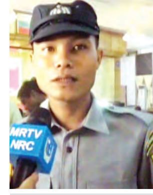
စစ်တွေမြို့နယ် ရဲတပ်ဖွဲ့ဝင်တစ်ဦး

အကြောင်းကြားတဲ့ အချိန်မှာ နံပါတ်တစ်က ဖြစ်တဲ့နေရာက ကျောက်ဖြူနဲ့ မြေပုံနဲ့အလယ်မှာဖြစ်တဲ့ အတွက် မြေပုံရယ် ကျောက်ဖြူရယ် နှစ်ဖက်လုံးက ကြက်ခြေနီတွေ၊ အဲဒီမှာ ဒုတိယရင်းမှူးတွေရှိတယ်။ အဲဒီလူတွေနဲ့ ကျွန်တော်တို့ တစ်ဖက် ဆယ်ဦးလောက်နဲ့ ကယ်ဆယ်ရေး တွေ ထွက်ခိုင်းတယ်။ ပြီးမှ အဲဒီမှာနေ ပြီးတော့ ကယ်တဲ့လူတွေကို ဘယ်လို လုပ်မယ်ဆိုတာကို အထက်အာဏာ ပိုင်တွေနဲ့ သူတို့ပေါင်းပြီး စီမံပြီးတော့ လုပ်တယ်။ ပြီးမှ ဒီတက်ကိုကျတော့ အသက်ရှင်ပြီးတော့ ပြန်လာတဲ့သူတွေ ကို ဒီကိုရောက်ပြီးမှ ဆေးဝါးကုသမှု လိုတဲ့ သူတွေကို ဆေးဝါးကုသမှုယူ ဖို့ လုပ်တယ်။ ပြီးမှ ပုံမှန်ပတ်တို