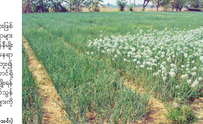
အက်ကလေး(ရမည်းသင်း)

တပ်ကုန်းမြို့နယ်အတွင်း နဝင်းချောင်းအနီးတစ်ဝိုက်ရှိကျေးရွာများဖြစ်သော သပြေချောင်း၊ ရွှေမြို့၊ ဇရပ်ကြီးကုန်း၊ လေးအိမ်စုနှင့် နွယ်ရစ်ကျေးရွာများသည် နှစ်စဉ်ကြက်သွန်နီအများအပြား စိုက်ပျိုးလေ့ရှိပြီး ဒေသကြက်သွန်နီမျိုးများကို အများဆုံးစိုက်ပျိုးကြကြောင်း သိရသည်။ ချောင်းနှင့်နီးသော နေရာများတွင် စိုက်ပျိုးမှုပိုများသလို ချောင်းနှင့်ဝေးသောနေရာ၌လည်း ရေတွင်းတူး၍ စိုက်ပျိုးကြကြောင်း၊ တစ်ဧကလျှင် အလျား မြောက်တောင်၊ အနံ့သုံးတောင်ရှိ ကြက်သွန်နီစိုက်ကျင်း ၅၀၀ ရှိပြီး အဆိုပါကျင်းများတွင် နောက်နှစ်စိုက်ပျိုးရန်အတွက် မျိုးကြက်သွန်နီများကိုပါ ထည့်သွင်းစိုက်ပျိုးကြကြောင်း၊ ကြက်သွန်နီစိုက်ချိန်သည် သုံးလခွဲကြာမြင့်သဖြင့် ယခုစိုက်ပျိုးထားသော ကြက်သွန်နီကို တန်ခူးလအတွင်း စတင်တူးဖော်ကြမည်ဖြစ်ကြောင်း သိရသည်။