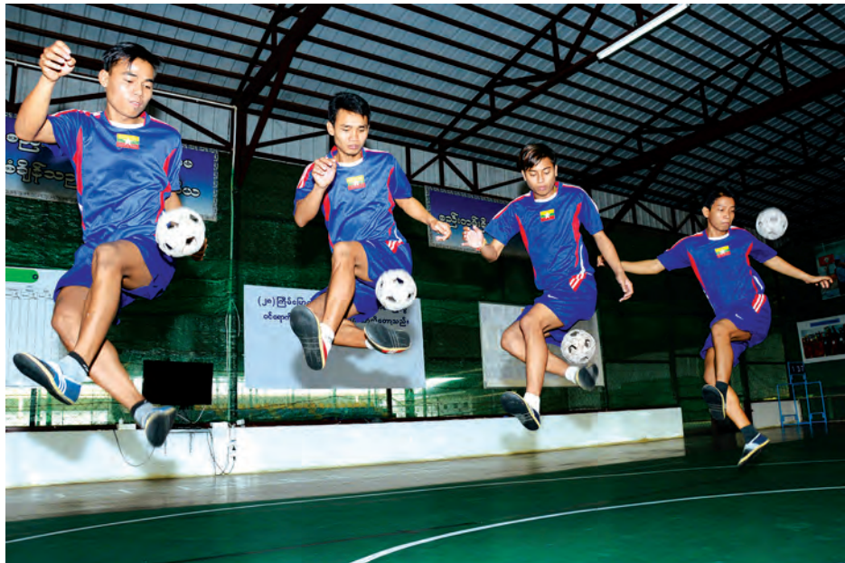
မြန်မာခြင်းလုံးကစားသမားများ လေ့ကျင့်နေစဉ်။