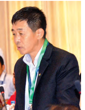
ဗိုလ်ချုပ်ဝဌမော်