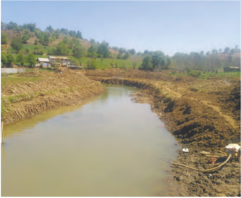
ခွန်အောင် (iprd)

ချောင်းနန်းဆယ်ယူမှုလုပ်ငန်းများကို မတ် ၅ ရက်တွင် စတင်ဆောင်ရွက်ခဲ့ခြင်းဖြစ်ပြီး ယခုအခါ ၉၀ ရာခိုင်နှုန်းခန့် ဆောင်ရွက်ပြီးစီးနေပြီဖြစ်ကြောင်း သိရသည်။