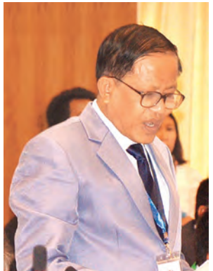
ဦးနိုင်ဟံသာ