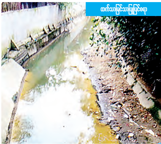
တက်သဖြင့်အပြုပြင်စရာ

စမ်းချောင်းမြို့နယ် အောင်ချမ်း သာရပ်ကွက်ဘေးမှ ဖြတ်သန်းစီးဆင်း လျက်ရှိသော စမ်းချောင်းမြောင်းကြီး မှာ တော်လှန်ရေးပန်းခြံဘေးမှသည် ကြည့်မြင်တိုင်မြို့နယ်နှင့် အလုံမြို့ နယ်နစ်နာအကြားမှ ဖြတ်သန်း၍ လှိုင် မြစ်အတွင်းသို့ စီးဝင်သောမြောင်းကြီး တစ်ခုဖြစ်သည်။ မိုးတွင်းကာလ၌ ရေ စီးအားအလွန်ကောင်းပြီး ရေမျက်နှာ ပြင်အလွန်မြင့်တက်လျက်ရှိလာသည်။ မိုးရွာချိန် နာရီဝက်ခန့်မပြည့်မီ ပင် ထိုရေထွက်ပေါက်များမှ ရပ်ကွက် အတွင်းသို့ ရေဆိုးများပြန်လည်ဝင် ရောက်သည်။ ရပ်ကွက်အတွင်း မြေညီအထပ်တိုင်းသို့ ရေဆိုးများ နှင့်အတူမြောင်းအတွင်းမှ အမှိုက် များပါ အလုံးအရင်းဖြင့်ဝင်လာမှုများ နှစ်စဉ်ကြုံတွေ့နေရကြောင်း သိရ သည်။