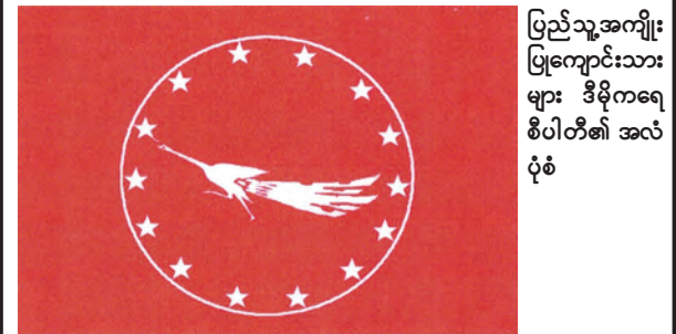
ပြည်သူ့အကျိုး ပြုကျောင်းသား များ ဒီမိုကရေစီပါတီ၏ အလံ ပုံစံ