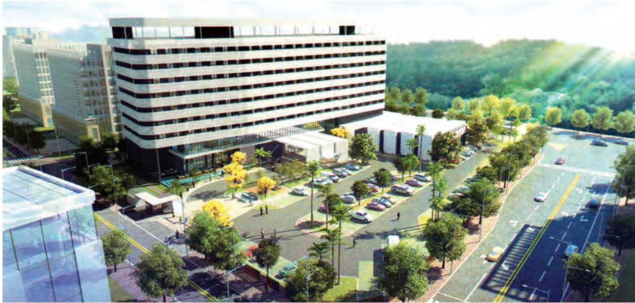
ယဉ်ကျေးမှုစင်တာတစ်ခုနှင့် စားသောက်ဆိုင်တန်းများပါဝင်ကာ နိုင်ငံတကာအဆင့်မီ တည်ဆောက်သွားမည့် ဟိုတယ်ပုံစံကို တွေ့ရစဉ်။

မူဆယ်စီးပွားရေးဇုန်တည်ဆောက်ရန်အတွက် သိမ်းယူထားသော လယ်ယာ၊ ဥယျာဉ်ခြံမြေများ နစ်နာကြေးပေးခဲ့ရာ လယ်မြေတစ်ဧက ငွေကျပ် သိန်း ၂၅၀၊ ကိုင်း၊ ကျွန်း တစ်ဧကငွေကျပ်သိန်း ၁၂၀၊ ဥယျာဉ်ခြံတစ်ဧကငွေကျပ် သိန်း ၁၅၀ နှင့်ယာမြေတစ်ဧကငွေကျပ်သိန်း ၁၂၀ နှုန်းဖြင့် လျော်ကြေးပေးခဲ့ရာ မြန်မာနိုင်ငံတွင် လယ်ယာမြေလျော်ကြေး အများဆုံးပေးခဲ့သော ကုမ္ပဏီဖြစ် သည်။ မူဆယ်စီးပွားရေးဇုန် စီမံကိန်းတည်ဆောက်ရာတွင် မြို့ပြစီမံကိန်းနှင့် ညီညွတ်မှုရရှိစေရန် ပြည်သူတို့၏ လူမှုစီးပွားရေးထိခိုက်မှုမရှိစေရန်၊ မြို့နယ် ဒေသ အလုပ်အကိုင်အခွင့်အလမ်းနှင့် ဒေသစီးပွားရေးဖွံ့ဖြိုးတိုးတက်မှု အတွက် အထောက်အကူပြုစေရန်အတွက် မြို့နယ် အုပ်ချုပ်ရေးမှူးဦးဆောင်၍ ခရိုင်မြေစာရင်း၊ သစ်တောစီမံကိန်းနှင့် မြို့နယ်စည်ပင်သာယာရေးအဖွဲ့မှ