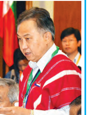
ပဒိုစောကွယ်ထူးဝင်း

ကျင်းပနိုင်ခဲ့သည်။ ယင်းသို့ကျင်းပရာ၌ ပြည်ထောင်စုငြိမ်းချမ်းရေး ဖော်ဆောင်ရေးလုပ်ငန်းကော်မတီ (UPWC) နှင့် တစ်နိုင်ငံလုံးဆိုင်ရာ အပစ်အခတ်ရပ်စဲရေးညှိနှိုင်းရေး အဖွဲ့ (NCCT) တို့မှ နှစ်ဖက်ခေါင်းဆောင်များ၏ သဘောထားအမြင်များကို ဖော်ပြအပ်ပါသည်။