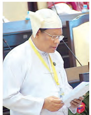
ပြည်ထောင်စုဝန်ကြီး ဦးဝင်းမြင့် ဖြေကြားစဉ်။ (သတင်းစဉ်)

ကုန်သွယ်မှုဗဟိုဌာနနှင့် ပူးပေါင်းပြီး အမျိုးသားပို့ကုန် မဟာဗျူဟာရေးဆွဲဆောင်ရွက်လျက်ရှိရာတွင် ဆန်စပါး၊ ပဲမျိုးစုံ၊ ရေထွက်ပစ္စည်း၊ အထည်ချုပ်ပစ္စည်းနှင့် ရော်ဘာအစရှိသည့် ကုန်ပစ္စည်း(၅)မျိုးအတွက် (၅)နှစ်စီမံကိန်းချမှတ်ဆောင်ရွက်လျက်ရှိပါကြောင်း၊ ဆန်စပါးကဏ္ဍ တိုးတက်စေရန် ဆောင်ရွက်မည့် အစီအမံများတွင် မိမိနိုင်ငံမှ ထွက်ရှိသည့် ဖျာပုံပေါ်ဆန်းနှင့် ရွှေဘိုပေါ်ဆန်းများကို မိမိနိုင်ငံ၏ မူပိုင်ခွင့်ရရှိစေရန် ဆောင်ရွက်လျက်ရှိပါကြောင်း။