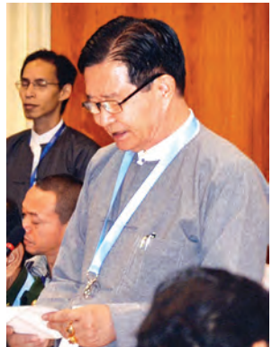
ပြည်ထောင်စုဝန်ကြီး ဦးအောင်မင်း