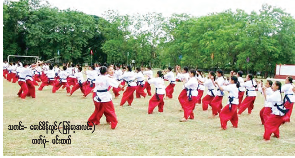
သတင်း- ဖောင်ဒ်လွင် (မြန်မာ့အလင်း)

ထို့နောက် ဝန်ကြီးချုပ်သည် စိုက်ပျိုးရေးဦးစီးဌာနဝင်းအတွင်း အလျားပေ ၁၀၀၊ အနံ ၄၅ ပေ၊ RC တစ်ထပ်အဆောက်အအုံ ဓာတ်ခွဲခန်း တည်ဆောက်မည့် မြေနေရာကို ကြည့်ရှုစစ်ဆေးသည်။ ပဲခူးတိုင်းဒေသကြီးတွင် မိုးစပါးကေ ၂၇ သိန်းငါးသောင်းကျော်နှင့် နွေစပါး ကေ ၂၇၀၀၀ ခန့် စိုက်ပျိုးထုတ်လုပ်ပြီး အထွက်နှုန်းအားဖြင့် ၇၆ ဒသမ ၅၁ တင်းနှုန်းထွက်ရှိကြောင်း သိရသည်။ (သတင်းစဉ်)