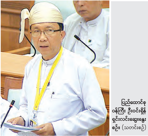
ပြည်ထောင်စုဝန်ကြီး ဦးဝင်းရှိန် ရှင်းလင်းဆွေးနွေးစဉ်။ (သတင်းစဉ်)

ယနေ့ကျင်းပသည့် ပထမအကြိမ် ပြည်ထောင်စုလွှတ်တော် (၁၂)ကြိမ်မြောက် ပုံမှန်အစည်းအဝေး (၂၈) ရက်မြောက်တွင် ၂၀၁၅ ခုနှစ် ပြည်ထောင်စု၏ ဘဏ္ဍာငွေအရအသုံးဆိုင်ရာ ဥပဒေကြမ်းနှင့် စပ်လျဉ်း၍ ဥပဒေကြမ်း ပူးပေါင်းကော်မတီ၏ အစီရင်ခံစာနှင့် လွှတ်တော်ကိုယ်စားလှယ်များ၏ မှုနှင့် အခြေခံသဘောအပါအဝင် ရှေးဆုံးဆွေးနွေးခြင်းအပေါ် ပြည်ထောင်စုဝန်ကြီး ဦးဝင်းရှိန်က ပြန်လည်ရှင်းလင်းဆွေးနွေးခဲ့သည်။