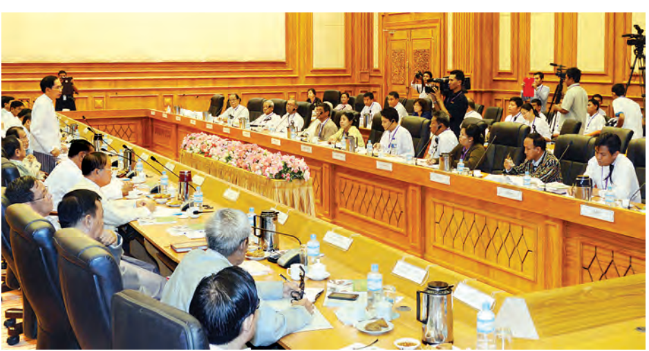
ဟု ယုံကြည်ပါကြောင်းဖြင့် ပြောကြားသည်။

ဆွဲတော့မည်ဆိုလျှင် ဖွဲ့စည်းပုံအခြေခံဥပဒေပါ ပြဋ္ဌာန်းချက်များနှင့် ဆန့်ကျင်ခြင်း ရှိ/မရှိ၊ တည်ဆဲဥပဒေများနှင့် ငြိစွန်းခြင်း ရှိ/မရှိ၊ လက်တွေ့အကောင်အထည်ဖော်နိုင်ခြင်း ရှိ/မရှိ၊ နိုင်ငံတော်နှင့် ပြည်သူ့အတွက် အကျိုးဖြစ်ထွန်းစေမှု ရှိ/မရှိနှင့် နိုင်ငံတကာ ကွန်ဗင်းရှင်းများတွင် ပါဝင်လက်မှတ်ရေးထိုးထားချက်များနှင့် ဆန့်ကျင်ခြင်း ရှိ/ မရှိတို့ဖြင့် စံထားစဉ်းစား၍ ဆောင်ရွက်သည့် အစဉ်အလာကို ကျင့်သုံးလျက်ရှိပါကြောင်း၊ ဤဥပဒေကြမ်းသည် လေးလေးနက်နက် စဉ်းစားဆောင်ရွက်ရမည့် ဥပဒေဖြစ်သည့်အတွက် ပြည့်စုံအောင် ဆောင်ရွက်ရပါကြောင်း၊ တက်ရောက်ဆွေးနွေးလာကြသည့် ပညာရေးဝန်ထမ်း ပြုပြင်ပြောင်းလဲရေးနိုင်ငံလုံးဆိုင်ရာ ကွန်ရက်(NNER) မှ အဖွဲ့ဝင်များ၏ ဆွေးနွေးချက်များ၊ အကြံပြုချက်များသည် ဥပဒေကြမ်းအတွက် တန်ဖိုးရှိသည့် အထောက်အကူဖြစ်စေမည်