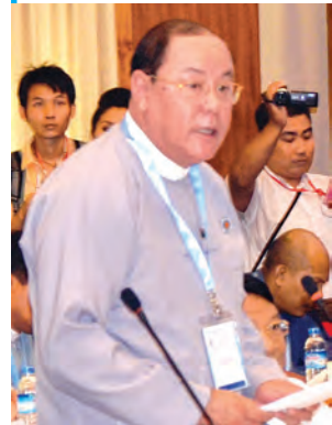
ဦးသိန်းဇော်

အဖွဲ့ဝင် ရှစ်ဦး ပါဝင်ပါတယ်။ နေပြည်တော်မှာ ဒုတိယ သမ္မတကြီးနဲ့ ဦးစွာတွေ့ဆုံပါတယ်။ ပြီးတော့ သမ္မတကြီးနဲ့တွေ့တယ်။ ပြီးတော့ တပ်မတော်ကာကွယ်ရေး ဦးစီးချုပ် ဗိုလ်ချုပ်မှူးကြီး စတဲ့ နိုင်ငံ့ခေါင်းဆောင်တွေနဲ့ တွေ့ဆုံပါတယ်။