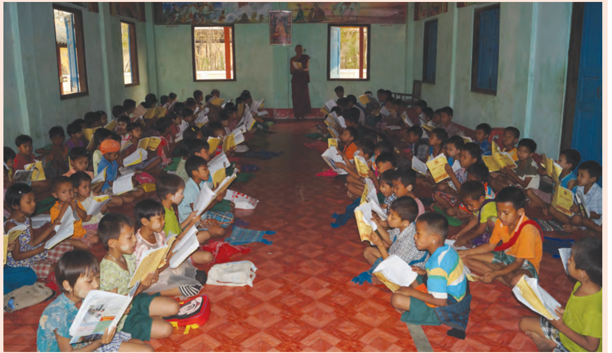
မကွေးတိုင်းဒေသကြီး ဆိပ်ဖြူမြို့နယ် တမ္ပကောက်ကျေးရွာမှ ကလေးငယ်များအတွက် နေရာသီကျောင်းပိတ်ရက်တွင် ကျေးရွာဘုန်းတော်ကြီးကျောင်း၌ ဖွင့်လှစ်သော ယဉ်ကျေးလိမ္မာသင်တန်းမှ ယဉ်ကျေးမှုဆိုင်ရာ သင်ခန်းစာများ ကလေးငယ်များသင်ယူနေသည့်ကို မတ် ၁၅ ရက်က တွေ့ရစဉ်။ (အဆိုပါသင်တန်း၌ သူငယ်တန်းမှ အဋ္ဌမ တန်းအထိ ကျောင်းသား ကျောင်းသူ ၁၇၈ ဦး တက်ရောက်သင်ကြားလျက်ရှိပြီး ယဉ်ကျေးလိမ္မာသင်ခန်းစာများကို အတန်းအလိုက် ခွဲခြားသင်ကြားပေး သွားမည်ဖြစ်ကြောင်း သိရသည်။) ခိုးလင်းနိုင်(iprd)